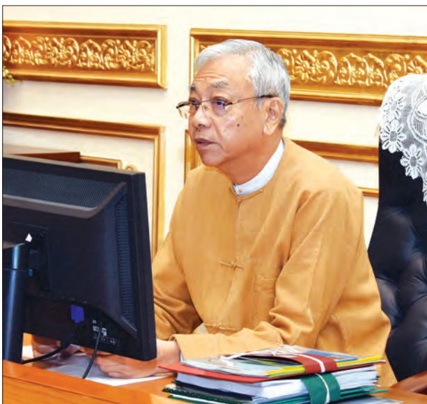
နိုင်ငံတော်သမ္မတ ဦးထင်ကျော်

အထူးစီးပွားရေးဇုန်ကဏ္ဍ၊ ပို့ကုန်သွင်းကုန်ကဏ္ဍနှင့် ပို့ဆောင်ရေးကဏ္ဍများနှင့်စပ်လျဉ်း၍ ဆွေးနွေးကြသည်။ ထို့နောက် အမျိုးသားစီမံကိန်းကော်မရှင်ဒုတိယဥက္ကဋ္ဌ နိုင်ငံတော်၏ အတိုင်ပင်ခံပုဂ္ဂိုလ်က ပြည်ထောင်စုအစိုးရနှင့် တိုင်းဒေသကြီးနှင့် ပြည်နယ်အစိုးရအဖွဲ့များသည် ချိတ်ဆက်မှုများ ခိုင်မာစွာဆောင်ရွက်ကြရမည် ဖြစ်ပါကြောင်း၊ တရားဥပဒေစိုးမိုးရန် အစိုးရအဖွဲ့သမားက ပြည်သူများ ပိုင်းဝန်းပူးပေါင်းပါဝင်နိုင်ရန် ဆောင်ရွက်ကြရမည်ဖြစ်ပါကြောင်း၊ နိုင်ငံ၏စီးပွားရေးတိုးတက်မှုကို ခန့်မှန်းထားသည်ထက် ပိုမိုတိုးတက်ရန် ဆောင်ရွက်ကြရမည်ဖြစ်ပါကြောင်း၊ စီးပွားရေးဈေးကွက်နှင့် ပတ်သက်၍ လက်ရှိဈေးကွက်များအပြင် အခြားဈေးကွက်များကိုလည်း မိမိတို့ တီထွင်ဖန်တီးနိုင်သည့် စွမ်းအားများဖြင့် ဖော်ဆောင်ကြရမည်ဖြစ်ပါကြောင်း၊ စီးပွားရေးဈေးကွက်အခြေအနေ မည်သို့ဖြစ်နေသည်၊ နောင်တွင်မည်သို့ဖြစ်နိုင်သည်တို့ကို ကြိုတင်တွက်ချက် သူတစ်ပါးထက် မြေတစ်လှမ်းသာရန် ဆောင်ရွက်ကြရမည်ဖြစ်ပါကြောင်း၊ ပြည်ထောင်စုအစိုးရနှင့် တိုင်းဒေသကြီးနှင့် ပြည်နယ်အစိုးရများ အချိတ်အဆက်မိမိဆောင်ရွက်ရေးသည် လွန်စွာအရေးကြီးပါကြောင်း၊ ဖက်ဒရယ်ဒီမိုကရေစီ ပြည်