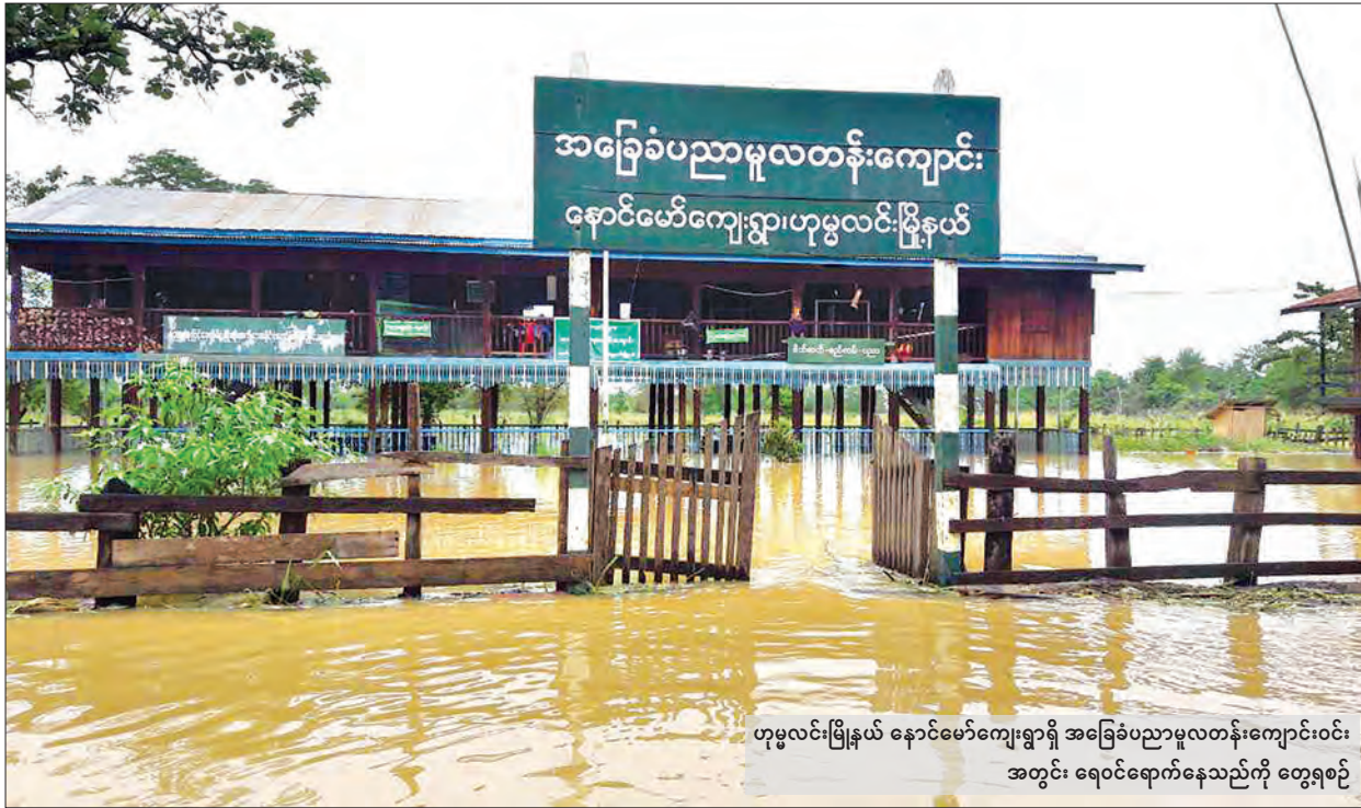
ဟုမ္မလင်းမြို့နယ် နောင်မော်ကျေးရွာရှိ အခြေခံပညာမူလတန်းကျောင်းဝင်း အတွင်း ရေဝင်ရောက်နေသည်ကို တွေ့ရစဉ်