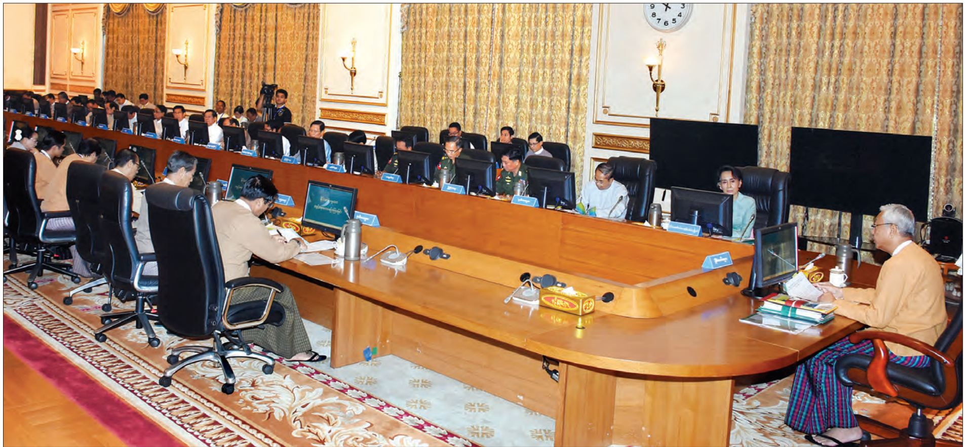
ပြည်ထောင်စုသမ္မတ မြန်မာနိုင်ငံတော် အမျိုးသားစီမံကိန်းကော်မရှင်အစည်းအဝေး ကျင်းပစဉ်