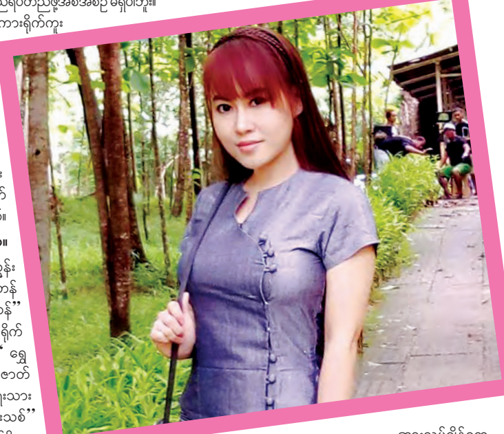
အားလပ်ချိန်တွေ

ကမ္ဘာပါပဲ။ ဘဝမှာအမှတ်အရဆုံး အဖြစ်အပျက်ရှိမှာပေါ့။ ဘဝမှာ အမှတ်အရဆုံး ဖြစ်ရပ်ကတော့ ကိုယ့်ရဲ့ စာမူကို ပုံနှိပ်စာလုံး အဖြစ် ပထမဆုံးမြင်တွေ့ရတဲ့အချိန်ပါ။ အခက်အခဲတွေကြုံလာရင် ဘယ်လိုဖြတ်ကျော်လဲ။ အခက်အခဲတွေ ကြုံလာချိန်မှာတော့ စိတ်တည်ငြိမ်မှုရှိ အောင် ဘုရား၊ တရား ပိုလုပ် ဖြစ်တယ်။ အနာဂတ်ရည်မှန်းချက်က ဘာဖြစ်မလဲ။ အနာဂတ်ရည်မှန်းချက်ကတော့ ကိုယ်ဖန်တီးချင်တဲ့ ဇာတ် လမ်းပေါင်းများစွာကို ပုံဖော်ဖန်တီးဖို့ပါပဲ။ အားလပ်ချိန်ကို ဘယ်လိုအသုံးပြုဖြစ်လဲ။