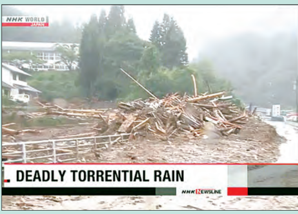
DEADLY TORRENTIAL RAIN ဖုန်းကုမ္ပဏီများက ဆက်သွယ်ရေးပြဿနာများကို သတင်းပေးပို့ခဲ့ကြသည်။ ရာသီဥတုဆိုင်ရာအာဏာပိုင်များက ဒေသခံများအားသတိပေးပေးရန်အတွက် တွန်းထားကြောင်း သိရသည်။ (အင်န်အိတ်ချ်ကေ)

ရထားပို့ဆောင်မှုလမ်းကြောင်းများကိုလည်းရပ်နားထားခဲ့ပြီး အချို့သောမိုတိုင်း