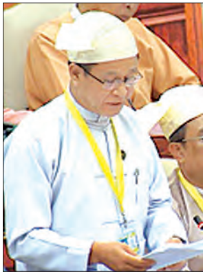
ဒုတိယဝန်ကြီး ဦးအောင်ထူး

အလုပ်အကိုင်ရှာဖွေပေးခြင်းကို ၂၀၁၃ ခုနှစ် ဒီဇင်ဘာမှ ၂၀၁၆ ခုနှစ် နှစ်ကုန်ပိုင်းအထိ အထူးစီးပွားရေးဇုန်အတွင်းရှိ စက်ရုံများတွင်လည်းကောင်း၊ ဆောက်လုပ်ရေးလုပ်ငန်းခွင်များတွင်လည်းကောင်း ဆောင်ရွက်ပေးခဲ့ပါကြောင်း၊ ထို့ပြင် အိမ်ထောင်စုတစ်စုလျှင် ငွေကျပ်သိန်း ၃၀ အား Cash Assistance အဖြစ် ပေးအပ်ခဲ့ပါကြောင်း၊ ရပ်ရွာဖွံ့ဖြိုးရေးရန်ပုံငွေအဖြစ် ငွေကျပ်သိန်း ၄၀၀ ကိုလည်း ထောက်ပံ့ပေးအပ်ပြီးဖြစ်ပါကြောင်း၊ ပြောင်းရွှေ့နေရာချထားခံရသူများ စိုက်ပျိုးရေး ပြုလုပ်နိုင်ရန်အတွက် မြေသုံးဧကကို ရပ်ရွာပိုင်မြေအဖြစ် ပေးအပ်ရန် စီစဉ်ထားပါကြောင်း ဖြေကြားသည်။ ဆက်လက်၍ မေးခွန်းရှင် ဒေါ်အေးမြမြမျိုးက ဆက်စပ်မေးခွန်းအဖြစ် သီလဝါအထူးစီးပွားရေးဇုန်နှင့်ပတ်သက်၍ လက်ရှိဖြစ်ပေါ်နေသည့် အငြင်းပွားမှုနှင့် ပဋိပက္ခများကို လွတ်လပ်သည့် ကော်မရှင်တစ်ခုဖွဲ့စည်းပြီး ပြန်လည်စိစစ်ပေးရန် ရှိ၊ မရှိ သိရှိလိုကြောင်း မေးမြန်းရာ ဒုတိယဝန်ကြီး ဦးအောင်ထူးက သီလဝါအထူးစီးပွားရေးဇုန်၏