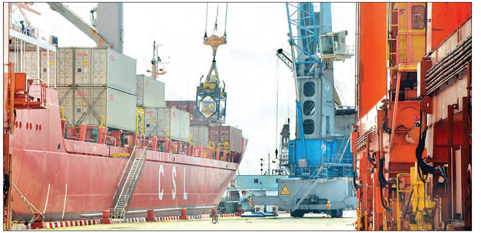
ရန်ကုန် အလုံဆိပ်ကမ်း၌ သင်္ဘောပေါ်မှ ကုန်သွယ်ရေးအတွက် အချုပ်အခြာလုပ်နေစဉ်

သတင်း- ထင်ပေါင်း(ကမာရွတ်)