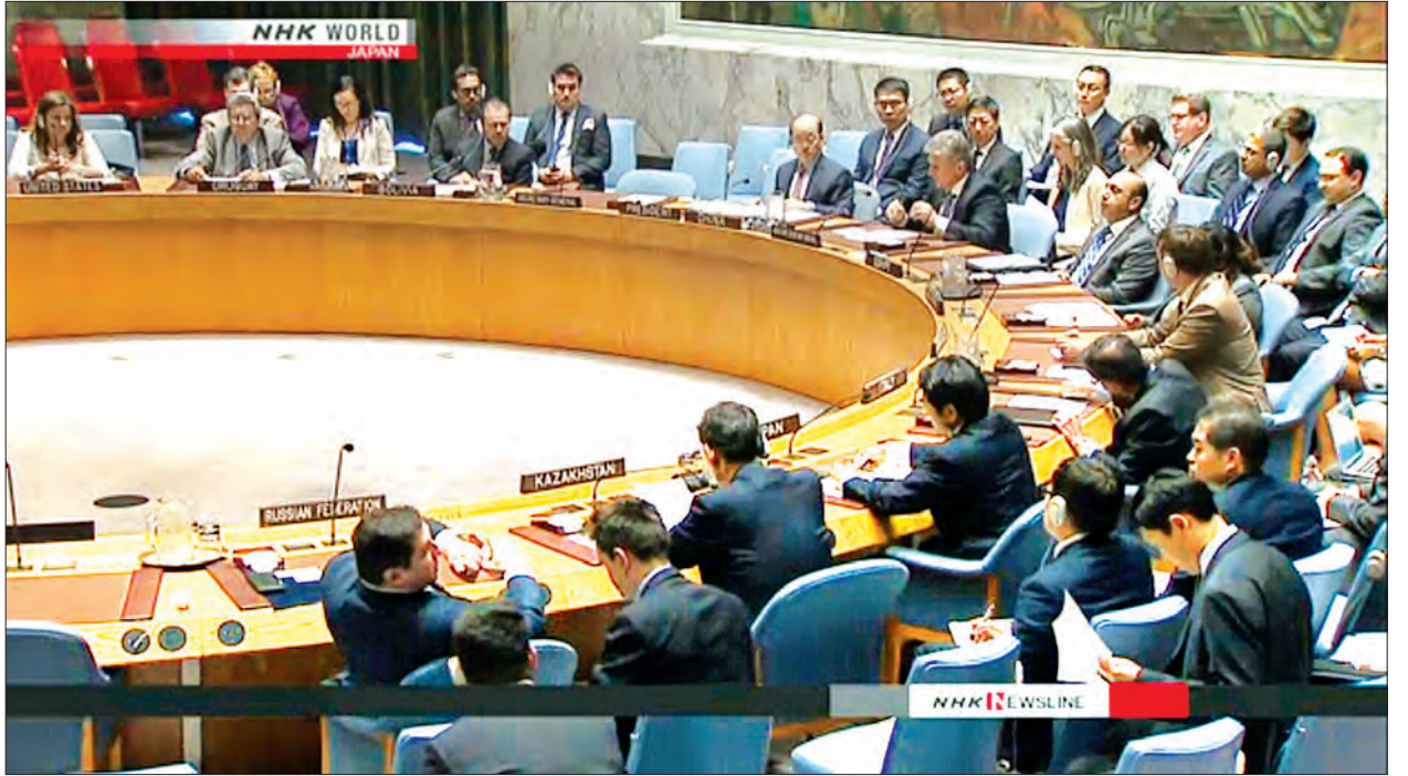
လီယူဂျယ်ရီကမူ မြောက်ကိုရီးယားကျွန်းဆွယ်အရေးတွင် တင်းမာမှုများ