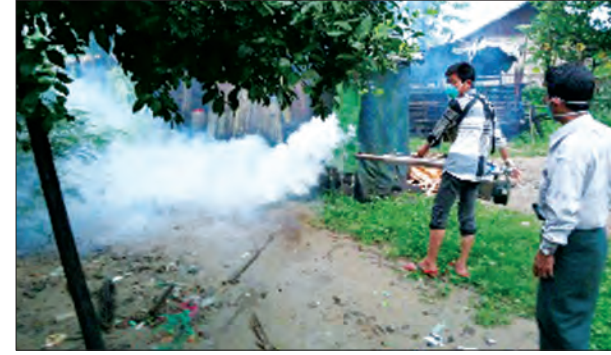
ကျေးရွာအတွင်း ခြင်္သေ့နင်းရေးဆောင်ရွက်စဉ်

ဆောင်ရွက်ပေးရန် ခန္ဓ်ခရိုင် ကျန်းမာရေး ဝန်ထမ်းများက ဇွန် ၂၈ ရက်က စက်လှေဖြင့် ခန္ဓ်မြို့မှ စတင် ထွက်ခွာရာ ယင်းနေ့မှာ တကားကျေးရွာသို့ ရောက်ရှိခဲ့သည်။