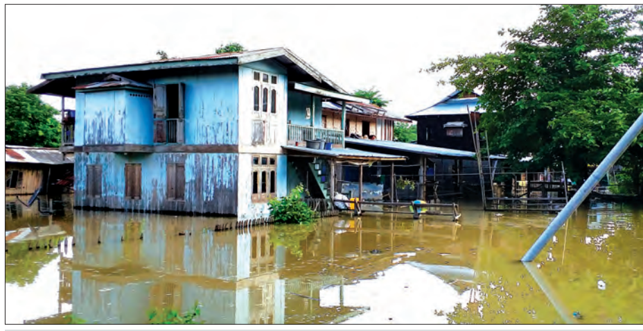
ချင်းတွင်းမြစ်ရေမြင့်တက်မှုကြောင့် မော်လိုက်မြို့၌ နေအိမ်များအတွင်း ရေဝင်ရောက်နေစဉ်