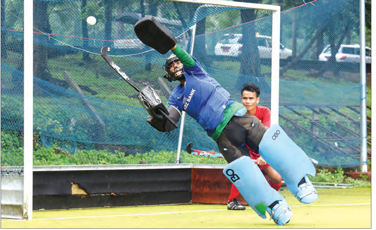
(၂၉)ကြိမ်မြောက် ဆီးဂိမ်းပြိုင်ပွဲယှဉ်ပြိုင်ရန် အမျိုးသားဟော်ကီအသင်း လေ့ကျင့်နေစဉ်