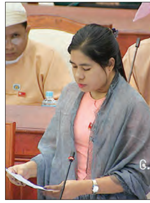
ဒေါ်အေးမြမြမျိုး ကျောက်တန်းမဲဆန္ဒနယ်

လုပ်ငန်း ဆောင်ရွက်ချက်များနှင့် ပတ်သက်၍ တိုင်ကြားမှုများရှိလာသည့် အတွက် မလိုလားအပ်သည့် ပြဿနာများ လျော့ချနိုင်ရန် ကွင်းဆင်းစစ်ဆေးခဲ့ပါကြောင်း၊ ပြန်လည်ထူထောင်ရေးလုပ်ငန်းစဉ်များကို စနစ်တကျ အကောင်အထည်ဖော်မှုမရှိခြင်း၊ ပွင့်လင်းမြင်သာမှုမရှိခြင်း၊ မြေသိမ်းလုပ်ငန်းများ ဆောင်ရွက်ရာတွင် ဥပဒေနှင့်အညီ ဆောင်ရွက်မှုမရှိခြင်းဆိုသည့် တိုင်ကြား