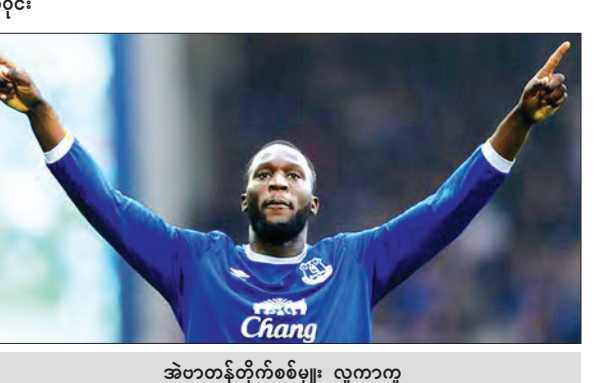
အဲဗာတန်တိုက်စစ်မှူး လူကာကူ

၎င်း၏ အေးဂျင့်သည် ပြီးခဲ့သောရာသီတွင် ပေါလ်ပေါ့ဘာ၊ ဇော့လန်အီဗရာဟီမိုပစ်နှင့် အမ်စီတာရန်တို့သုံးဦးကို မန်ချက်စတာယူနိုက်တက်သို့ ရောက်ရှိအောင် ဆောင်ကြဉ်းပေးခဲ့သော မိန့်ခွင့်အိုလာဖြစ်သည်။