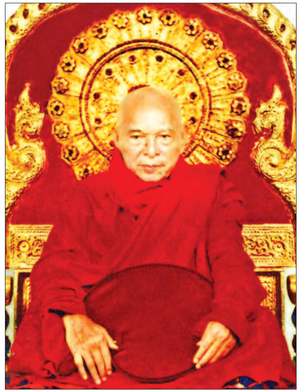
ဒေါက်တာဘဒ္ဒန္တကုမာရာဘိဝံသ

စတုတ္ထမြောက် ဥပေက္ခာဗြဟ္မစိုရ်တရားအနေဖြင့် တစ်ဦးအပေါ်တစ်ဦး ချစ်ခြင်းမုန်းခြင်းမဖက် တည်ကြည်သော သဘောထားသက်သက်ကို ဥပေက္ခာဟု ဆိုပါသည်။ ဤသဘောအရ တစ်ဖက်သားကို လွတ်လပ်စွာ ဆုံးဖြတ်ခွင့်ပေးခြင်း၊ သူတစ်ပါးအပေါ် မိမိပြဋ္ဌာန်းချက်များကို အတင်းအကျပ် ချမှတ်ပေးထားခြင်းဟု အဓိပ္ပာယ်သက်ရောက်နိုင်ပေသည်။ ဥပေက္ခာသည် ဗြဟ္မစိုရ်တရားလေးပါးတွင် ချမ်းသာပါစေဟူသော ချစ်ခြင်းမေတ္တာဖြင့် ကြောင့်ကြစိုက်မှု၊ ဆင်းရဲအပေါင်းမှ လွတ်ကင်းပါစေဟူသော သနားကရုဏာဖြင့် ကြောင့်ကြစိုက်မှု၊ မဆုတ်ယုတ်ဘဲ ချမ်းသာမြဲ ချမ်းသာကြပါစေဟူသော ဝမ်းမြောက်ခြင်းမုဒိတာဖြင့် ကြောင့်ကြစိုက်မှု