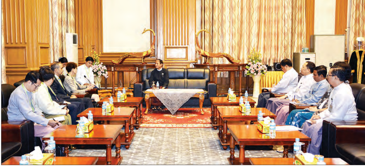
ပြည်သူ့လွှတ်တော်ဥက္ကဋ္ဌ ဦးဝင်းမြင့်နှင့် ကမ္ဘာ့ဘဏ်၏ မြန်မာ၊ လာအိုနှင့် ကမ္ဘောဒီးယားနိုင်ငံဆိုင်ရာ ညွှန်ကြားရေးမှူး Ms. Ellen Goldstein နှင့် အဖွဲ့တို့ တွေ့ဆုံဆွေးနွေးစဉ် (သတင်းစဉ်)

နေပြည်တော် ဇူလိုင် ၆ ပြည်သူ့လွှတ်တော်ဥက္ကဋ္ဌ ဦးဝင်းမြင့်သည် ကမ္ဘာ့ဘဏ်၏ မြန်မာ၊ လာအိုနှင့် ကမ္ဘောဒီးယားနိုင်ငံဆိုင်ရာ ညွှန်ကြားရေးမှူး Ms. Ellen Goldstein နှင့် အဖွဲ့အား ယနေ့ မွန်းလွဲ ၂ နာရီတွင် နေပြည်တော်ရှိ လွှတ်တော်အဆောက်အအုံ ပြည်သူ့လွှတ်တော် ဧည့်ခန်းမဆောင်၌ လက်ခံတွေ့ဆုံသည်။ တွေ့ဆုံစဉ် ကျေးလက်နေပြည်သူများ ဖွံ့ဖြိုးတိုးတက်ရေးအတွက် လမ်းပန်းဆက်သွယ်ရေး၊ လျှပ်စစ်မီးရရှိရေး၊ ပညာရေး၊ ကျန်းမာရေး၊ SME လုပ်ငန်းများဖွံ့ဖြိုးရေးတို့တွင် ကမ္ဘာ့ဘဏ်က အကူအညီများပေးနိုင်ရေးတို့နှင့် စပ်လျဉ်း၍ ကမ္ဘာ့ဘဏ်နှင့် မြန်မာနိုင်ငံတို့အကြား ပူးပေါင်းဆောင်ရွက်မှုပိုမိုမြှင့်တင်နိုင်ရေး ကိစ္စရပ်များအား ဆွေးနွေးခဲ့ကြောင်း သတင်းရရှိသည်။ (သတင်းစဉ်)