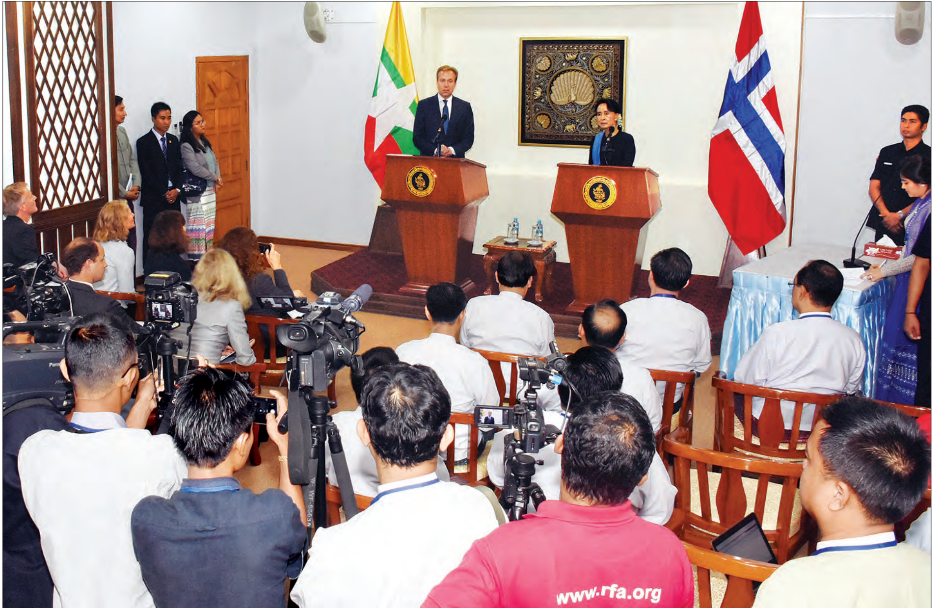
နိုင်ငံတော်၏ အတိုင်ပင်ခံပုဂ္ဂိုလ် ဒေါ်အောင်ဆန်းစုကြည်နှင့် နော်ဝေနိုင်ငံခြားရေးဝန်ကြီး H.E. Mr.Borge Brende တို့ နှစ်နိုင်ငံသတင်းစာရှင်းလင်းပွဲ ကျင်းပစဉ် (သတင်းစဉ်)