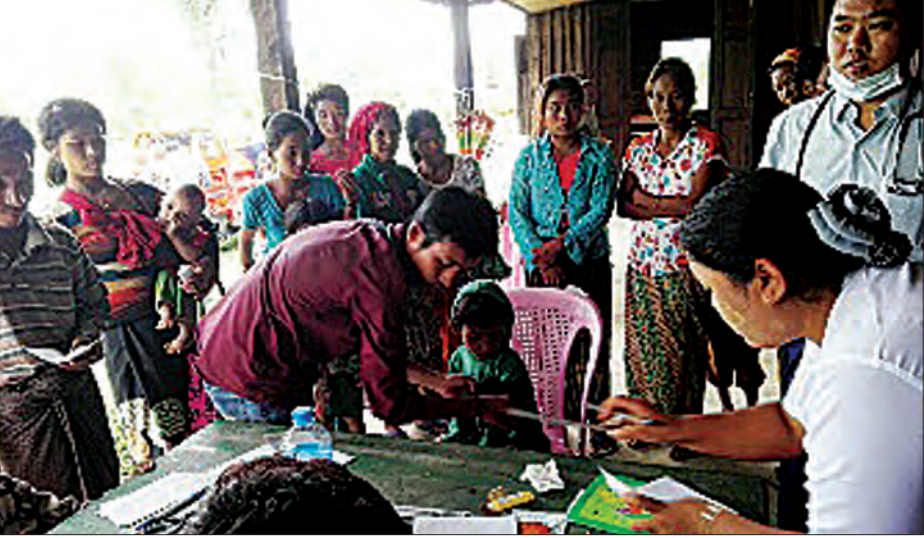
ရောဂါရှာဖွေရေးလုပ်ငန်းများဆောင်ရွက်စဉ်

ခန္ဓ် ဇူလိုင် ၆ များရှိသည်ဟု သတင်းရရှိသောကြောင့် နန်းယွန်းမြို့နယ် တကားကျေးရွာသို့ ကျန်းမာရေးစောင့်ရှောက်မှုများပြုလုပ်