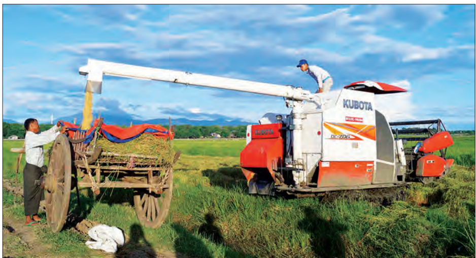
ဆင်သေဆည်ရေသောက်ဖြင့် နေ့စပါးများ အောင်မြင်ဖြစ်ထွန်းလျက်ရှိရာ နေပြည်တော်ဥက္ကဋ္ဌရခရိုင် တပ်ကုန်းမြို့နယ်အတွင်း နေ့စပါး စိုက်တောင်သူများသည် စပါးများကို ဇွန်လအတွင်းမှစတင်၍ အစိုးအကာအောက်ရောက်ရှိရေးနှင့် မိုးစပါးအချိန်မီ ပြန်လည်စိုက်ပျိုးနိုင်ရေးရိတ်သိမ်းခြွေလှေ့စက်များဖြင့် ရိတ်သိမ်းနေစဉ် တင်စိုးလွင်

ရတနာသစ်တော၊ ပြည့်သွေးကြော။ သစ်တောရတနာ၊ ထိန်းသိမ်းပါ။