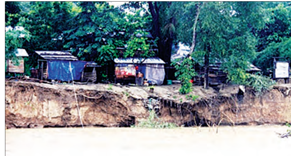
အညီများလည်းလိုအပ်နေကြောင်း ဒေသခံများကဆက်လက်ပြောသည်။ လတ်တလောတိုင်းဒေသကြီး ကိုယ်စား လှယ်ဦးညွန့်ဝေနှင့် မြို့နယ်အဆင့် တာဝန်ရှိသူများက ကွင်းဆင်းကြည့်ရှု လျက်ရှိကြောင်း သိရသည်။ ကိုလွင်(ဆွာ)

ယခင်ကကမ်းပါးနှင့်ပေ ၃၀၀ ခန့်အကွာအဝေးရှိခဲ့သော်လည်း မြစ်ရေ တိုက်စားမှုသည် ဇွန်လနောင်ပိုင်းလောက်မှစတင်၍ ရေစီးကြမ်းလာခြင်း၊ မြစ်ရေတက်ခြင်းများ ဖြစ်ကာ လူနေအိမ်များနှင့် နှစ်ပေခန့်အထိနီးကပ်လာနေပြီဖြစ်ကြောင်းသိရကာ အကူ