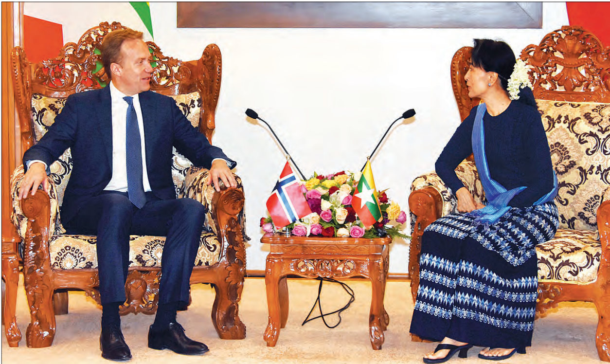
နိုင်ငံတော်၏အတိုင်ပင်ခံပုဂ္ဂိုလ် ဒေါ်အောင်ဆန်းစုကြည်နှင့် နော်ဝေနိုင်ငံခြားရေးဝန်ကြီး H.E. Mr. Borge Brende တို့ တွေ့ဆုံဆွေးနွေးစဉ် (သတင်းစဉ်)

ရှေ့မှ မြန်မာနိုင်ငံနှင့် နော်ဝေနိုင်ငံတို့သည် ဆက်ဆံရေး အလွန်ကောင်းမွန်ပါကြောင်း၊ မြန်မာနိုင်ငံသည် ဒီမိုကရေစီ အသွင်ကူးပြောင်းရေးကို လုပ်ဆောင်နေဆဲဖြစ်ပါကြောင်း၊ မြန်မာနိုင်ငံ၏ ငြိမ်းချမ်းရေးလုပ်ငန်းစဉ်များနှင့် ဖွံ့ဖြိုးတိုးတက်ရေး လုပ်ငန်းများအတွက် နော်ဝေနိုင်ငံ၏ ပံ့ပိုးကူညီမှုများကို ကျေးဇူးတင်ရှိကြောင်း၊ မြန်မာနိုင်ငံ နော်ဝေ နှစ်နိုင်ငံမိတ်ဖက်အခြေအနေကို ထိန်းသိမ်းထားသကဲ့သို့ နှစ်နိုင်ငံပိုမို