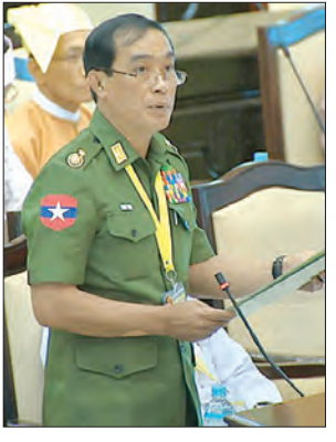
ဒုတိယဝန်ကြီး ဗိုလ်ချုပ်သန်းထွဋ်

နေပြည်တော် ဇူလိုင် ၆ ဒုတိယအကြိမ် အမျိုးသားလွှတ်တော် ပစ္စည်းအစည်းအဝေး ၂၅ ရက်မြောက်နေ့ကို ယနေ့နံနက် ၁၀ နာရီတွင် နေပြည်တော်ရှိ အမျိုးသားလွှတ်တော်အစည်းအဝေးခန်းမ၌ ကျင်းပရာ အမျိုးသားလွှတ်တော် ကော်မတီဝင်၊ ပြန်လည်ဖွဲ့စည်းခြင်းအား အသိပေးခြင်း၊ မေးခွန်းခြောက်ခု မေးမြန်းဖြေကြားခြင်းနှင့် ဥပဒေကြမ်းတစ်ခု အတည်ပြုခြင်းတို့ကို ဆောင်ရွက်ကြသည်။ အစည်းအဝေးတွင် အမျိုးသားလွှတ်တော်တွင် ဖွဲ့စည်းထားသည့် ဥပဒေကြမ်းကော်မတီ၊ ပြည်သူ့ငွေစာရင်းကော်မတီ၊ တောင်သူလယ်သမားရေးရာ ကော်မတီ၊ အမျိုးသမီးနှင့် ကလေးသူငယ်အခွင့်အရေးဆိုင်ရာ ကော်မတီနှင့် ပြည်တွင်း ပြည်ပ အလုပ်သမားဆိုင်ရာ ကော်မတီများ ပြန်လည်ဖွဲ့စည်းခြင်းကို လွှတ်တော်သို့ အသိပေးတင်ပြသည်။ ယင်းနောက် ရခိုင်ပြည်နယ် မဲဆန္ဒနယ်အမှတ်(၈)မှ ဦးကျော်ကျော်ဝင်း၏ မောင်တောခရိုင် မောင်တောမြို့ကျီးကန်းပြင်ဌာနချုပ်မှ ငွေတောင်ကျေးရွာသို့ ဆက်သွယ်သွားလာနိုင်ရေးအတွက် ကားလမ်းအသစ်ဖောက်လုပ်ပေးရန် အစီအစဉ် ရှိ၊ မရှိ မေးခွန်းနှင့်စပ်လျဉ်း၍ နယ်စပ်ရေးရာဝန်ကြီးဌာန ဒုတိယဝန်ကြီး ဗိုလ်ချုပ်သန်းထွဋ်က ကျီးကန်းပြင်ဌာနချုပ်နေရာမှ ငွေတောင်ကျေးရွာသို့ ဆက်သွယ်သွားလာနိုင်ရေးအတွက် ကားလမ်းအသစ်ဖောက်လုပ်ပေးခြင်း လုပ်ငန်းအား ၂၀၁၇ - ၂၀၁၈ ဘဏ္ဍာရေးနှစ် ဖြည့်စွက်ရန်ပုံငွေမှ တောင်းခံဆောင်ရွက်ပေးရန် တင်ပြချက်နှင့်စပ်လျဉ်း၍ ပြည်ထောင်စု၏ ဘဏ္ဍာငွေ အရအသုံးဆိုင်ရာ ဥပဒေအရ