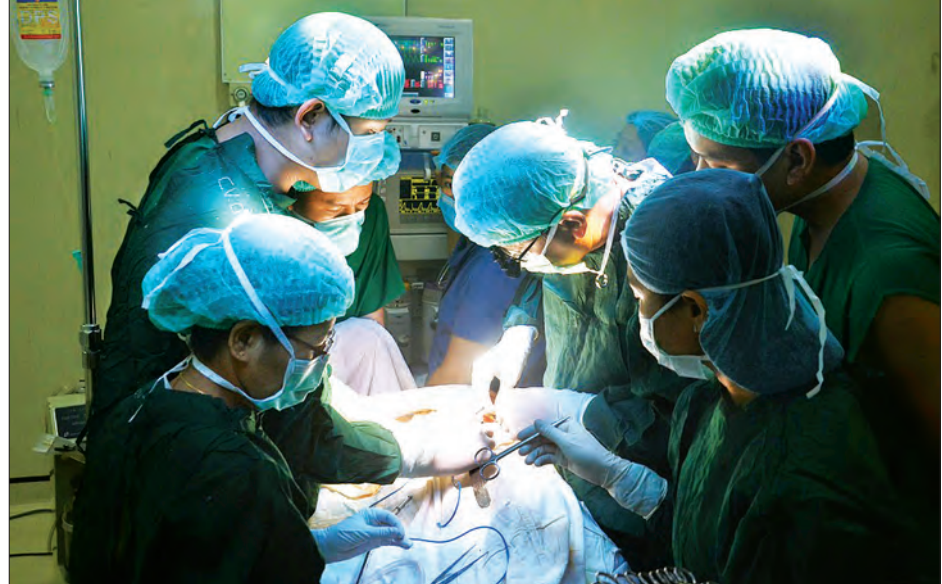
ကျောက်ကပ်အစားထိုး ခွဲစိတ်ကုသမှုကို တွေ့ရစဉ်

ဖြေ။ ဒီလုပ်ငန်းအတွက် ထူးခြားချက်တွေ ကြိုးစားထားမှုတွေရှိပါတယ်။ ပထမ ထူးခြားချက်ကတော့ ဆေးရုံအုပ်ကြီး ဦးဆောင်မှုနဲ့ ကျွန်တော်တို့ ခွဲစိတ်ခန်းမှာ မြန်မာနိုင်ငံမှာ ပထမဆုံး ကျောက်ကပ်အစားထိုးသီးသန့် ခွဲစိတ်ခန်း နှစ်ခန်းကို ထားရှိလုပ်ဆောင်နိုင်ခဲ့တယ်။ ဒီသီးသန့်ခန်းမှာပဲ