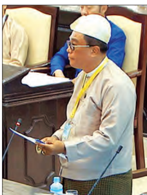
ဦးကျော်လင်း ဒုတိယဝန်ကြီး

ကုမ္ပဏီအနေဖြင့် လမ်းအဆင့်မြှင့်တင်ခြင်းလုပ်ငန်းများကို သုံးနှစ်အတွင်း အပြီးဆောင်ရွက်ရမည်ဖြစ်သော်လည်း ထိထိရောက်ရောက် ဆောင်ရွက်နိုင်ခြင်းမရှိခဲ့ပါကြောင်း၊ ယခုအခါ မိုင်တိုင် (၄၆/၄) နှင့် မိုင်တိုင် (၄၇/၄) အတွင်း လွယ်ဂျယ်မြို့တွင်းအပိုင်း စံပြလမ်း ၁ ဒသမ ၃ ကီလိုမီတာခန့်အား ၁၂ မီတာအကျယ် ကတ္တရာလမ်းခင်းခြင်းဆောင်ရွက်လျက်ရှိပါကြောင်း၊ ထို့အပြင် ၂၀၁၇-၂၀၁၈ ဘဏ္ဍာနှစ်တွင် စံပြလမ်း ၁ ဒသမ ၃ ကီလိုမီတာခန့်အား ကုမ္ပဏီမှ အပြီးဆောင်ရွက်မည်ဖြစ်ပြီး ၂၀၁၈-၂၀၁၉ ဘဏ္ဍာနှစ်တွင် ကတ္တရာလမ်းအဖြစ် အပြီးတည်ဆောက်လျက်ရှိပါကြောင်း၊ ကုမ္ပဏီအနေဖြင့် စာချုပ်ပါ စည်းကမ်းချက်များအတိုင်း လိုက်နာဆောင်ရွက်ခြင်းမရှိပါက လုပ်ထုံးလုပ်နည်းနှင့်အညီ အရေးယူဆောင်ရွက်သွားမည်ဖြစ်ပါကြောင်း ဖြေကြားသည်။