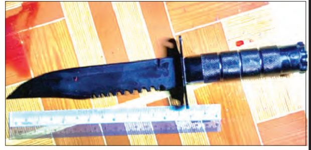
အခင်းဖြစ်ပွားရာတွင် တွေ့ရသော သက်သေခံဓား