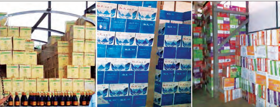
တရားဝင်စာရက်စာတမ်းအထောက်အထား တစ်စုံတစ်ရာထင်မြင်ခြင်းမရှိသော တရုတ်နိုင်ငံထုတ် ဝိုင်ပုလင်းများ၊ ဘီယာများနှင့် ခေါက်ဆွဲခြောက်များ

နေပြည်တော် ဇွန် ၂၉ တရားမဝင်ကုန်စည်များ တားဆီး ထိန်းချုပ်ရေးအတွက် ရေပူနှင့် မရမ်း ချောင် အမြဲတမ်းစစ်ဆေးရေးစခန်း တို့ကို ဌာနဆိုင်ရာ ပူးပေါင်းအဖွဲ့များဖြင့် မတ် ၁ ရက်တွင် စတင်ဖွင့်လှစ်ဆောင် ရွက်ခဲ့ပြီး ဇွန် ၂၈ ရက်က မန္တလေး မူဆယ် ပြည်ထောင်စုလမ်းမကြီး တစ်လျှောက် ကုန်သွယ်မှုယာဉ် ပို့ကုန် ၆၀၇ စီး၊ သွင်းကုန် ၅၂ စီး၊ ရန်ကုန်- မြဝတီလမ်းမကြီးတစ်လျှောက် ကုန်သွယ် မှုယာဉ် ပို့ကုန် ၅၂ စီး၊ သွင်းကုန် ၁၃၉ စီး ကုန်စည်များသယ်ယူပို့ဆောင် လျက်ရှိသည်။