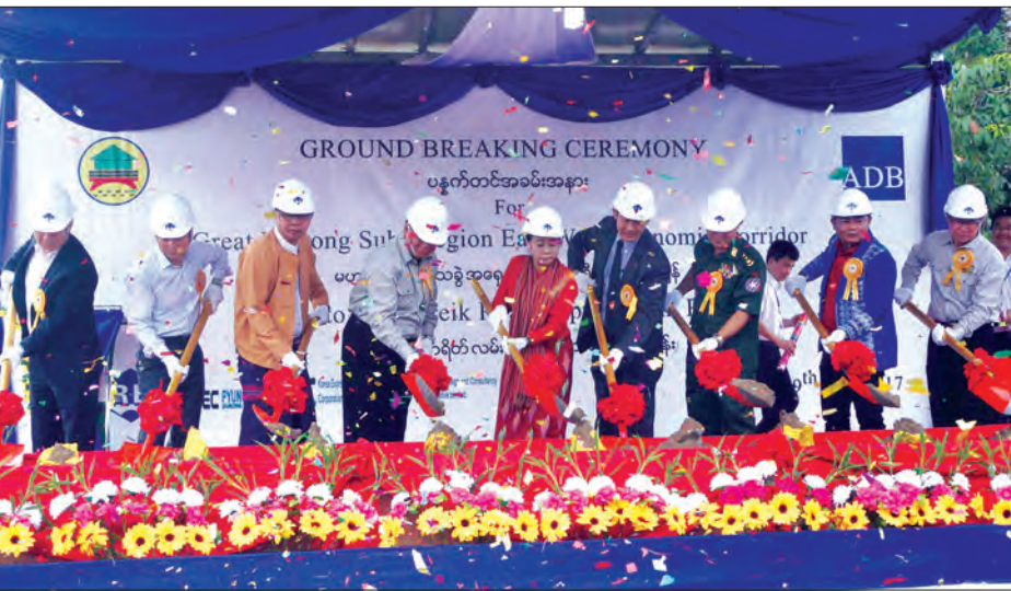
မဟာမဲခေါင်ဒေသခွဲ အရှေ့အနောက်လမ်းမကြီး ပန္နက်တင်ခြင်းအခမ်းအနားတွင် ပြည်နယ်ဝန်ကြီးချုပ် ဒေါ်နန်းခင်ထွေးမြင့်၊ ပြည်နယ်လွှတ်တော်ဥက္ကဋ္ဌနှင့် တာဝန်ရှိသူများက ပန္နက်တင်ပေးစဉ်

စသည် အကျိုးကျေးဇူးများ ရရှိမည်ဖြစ်ကြောင်း သိရသည်။ သတင်း-ခရမ်းစိုးမြင့် စောမျိုးမင်းသိန်း(ပြန်/ဆက်)