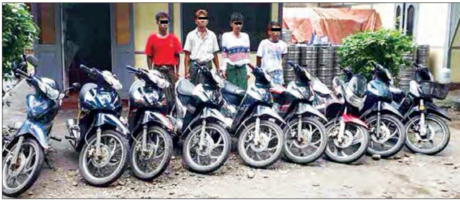
သိမ်းဆည်းရမိသည့် ဆိုင်ကယ်များကို တွေ့ရစဉ်