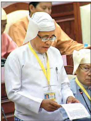
ဦးကျော်တင် ဒုတိယဝန်ကြီး

ဇေယျာသီရိမဲဆန္ဒနယ်မှ ဦးလှဌေးဝင်း၏ ကုလသမဂ္ဂ လူ့အခွင့်အရေးကောင်စီက ရခိုင်ပြည်နယ်အတွင်း