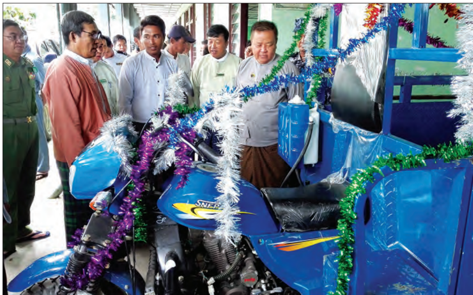
သောဒေသတစ်ခုဖြစ်သော်လည်း ယခု တည်ငြိမ်အေးချမ်းစွာ ပညာသင်ကြား သတင်း-မြင့်မောင်စိုး၊ အောင်ကျော်ဦး အခါ ကျောင်းသား ကျောင်းသူများ လျက်ရှိကြောင်း သိရသည်။

မောင်တောမြို့နယ် ရေမျက်တောင်ကျေးရွာအုပ်စုမှ ငါးခုရ အထက်တန်းကျောင်းသို့ သွားရောက်ပညာသင်ကြားနေသော ကျောင်းသား ကျောင်းသူများ သွားလာမှုအဆင်ပြေစေရေးအတွက် အမျိုးသားသဘာဝဘေးအန္တရာယ်ဆိုင်ရာစီမံခန့်ခွဲမှုကော်မတီက လှူဒါန်းသော သုံးဘီးဆိုင်ကယ်တစ်စီး ပေးအပ်ပွဲကို ယနေ့ နံနက်ပိုင်းက မောင်တောမြို့ အမှတ်(၁)အခြေခံပညာအထက်တန်းကျောင်း၌ ကျင်းပသည်။