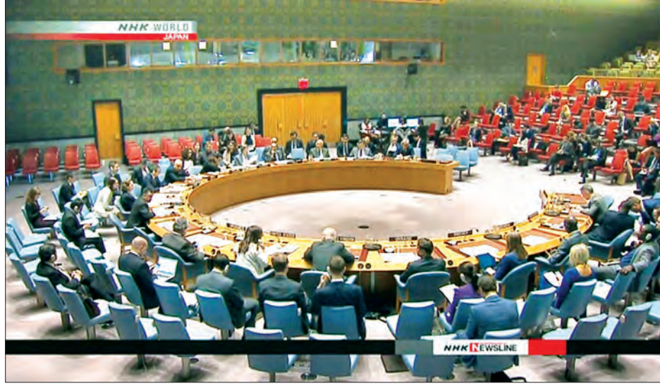
ဂျီနီဗာ ဇွန် ၂၉ အဏုမြူလက်နက်နှင့် အဏုမြူလက်နက်အဖြစ် အသုံးပြုနိုင်သည့် ပစ္စည်းကိရိယာမှန်သမျှတို့အား တင်ပို့မှုထိန်းချုပ်နိုင်ရေးကို ကုလသမဂ္ဂအဖွဲ့ဝင်နိုင်ငံတိုင်းက အရှိန်အဟုန်ဖြင့် ကြိုးစားဆောင်ရွက်ကြရန် ကုလသမဂ္ဂ လက်နက်ဖျက်သိမ်းရေးအဖွဲ့အကြီးအကဲက တိုက်တွန်းပြောကြားခဲ့ကြောင်း သိရသည်။

လက်နက်ဖျက်သိမ်းရေးအဖွဲ့၏ အဆင့်မြင့်ကိုယ်စားလှယ်တစ်ဦးဖြစ်သူ အီဇူမီနာကာမစ်စသည် ဗုဒ္ဓဟူးနေ့တွင် ပြုလုပ်သည့် ကုလသမဂ္ဂလုံခြုံရေးကောင်စီအစည်းအဝေးတွင် ထိုသို့ တိုက်တွန်းတောင်းဆိုမှုပြုလုပ်ခဲ့ခြင်းဖြစ်ကြောင်း အင်န်အိတ်ချ်ကေသတင်းတစ်ရပ်တွင် ဖော်ပြထားသည်။