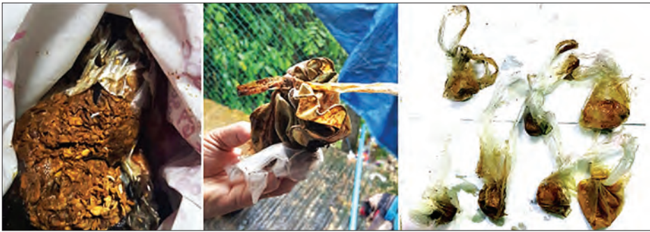
အခင်းဖြစ်ရပ်တွင် တွေ့ရသည့် ယတြာချေထားသော အစီအရင်များကို တွေ့ရစဉ်