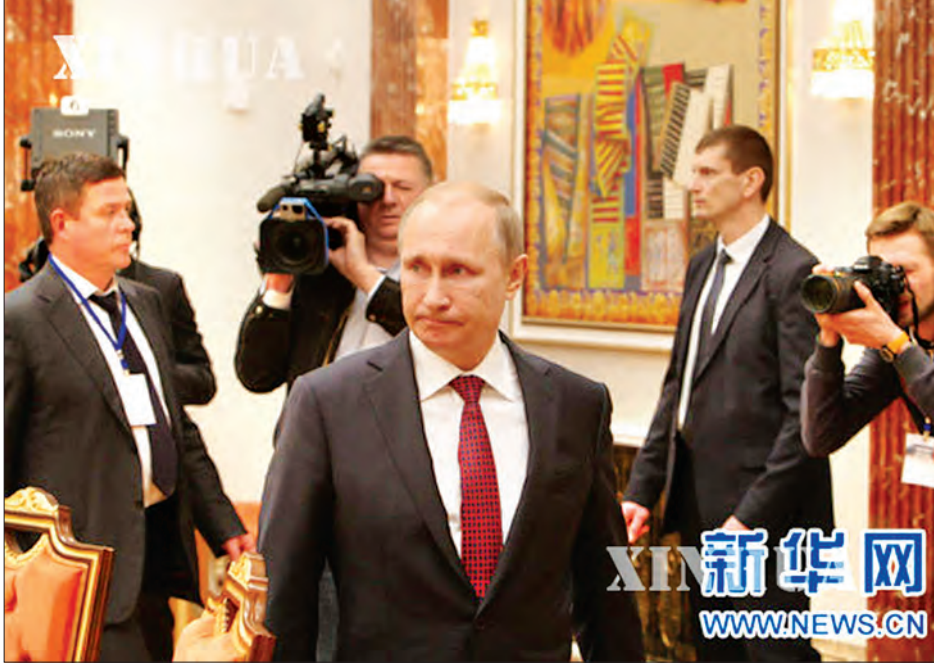
ပါဝင်ကြောင်း သိရသည်။ အီးယူသည် ရုရှားနိုင်ငံအနေဖြင့် မင်းသဘောတူညီချက်အား ကောင်းမွန်စွာ အကောင်အထည်ဖော်နိုင်ခြင်းမရှိဟု သတ်မှတ်ပြီး ပိတ်ဆို့မှုသုံးကြိမ်အထိပြုလုပ်ခဲ့ဖူးကြောင်းသိရပြီး ယခုတစ်ကြိမ် နှင့်ဆိုလျှင် လေးကြိမ်မြောက်ဖြစ်ကြောင်း သိရသည်။ (ဆင်ဟွာ)

ထပ်မံသက်တမ်းတိုးမြှင့်လိုက်သည့် အရေးယူပိတ်ဆို့မှုများတွင် ငွေကြေး၊ စွမ်းအင်၊ ကာကွယ်ရေး၊ စစ်လက်နက်နှင့် စစ်ဘက်ကဏ္ဍဆိုင်ရာ ကုန်ပစ္စည်းများ ပါဝင်ကြောင်း သိရသည်။ ထို့အပြင် ရေနံနှင့်ပတ်သက်သော ရှာဖွေမှုနှင့် တူးဖော်မှုဆိုင်ရာ နည်းပညာနှင့် ဝန်ဆောင်မှုများပေးအပ်ရန် ကန့်သတ်မှုများလည်း