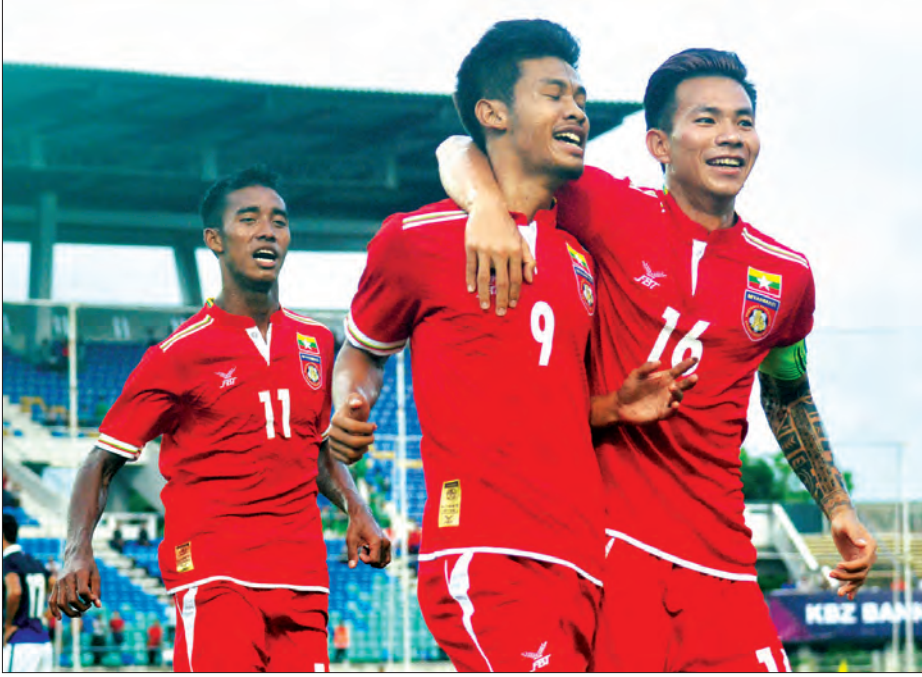
လေးနိုင်ငံဖိတ်ခေါ်ပြိုင်ပွဲ အုပ်စုဒုတိယပွဲများတွင် ပါဝင်ကစားမည့် ယူ-၂၂ မြန်မာအသင်းသားများအား တွေ့ရစဉ်