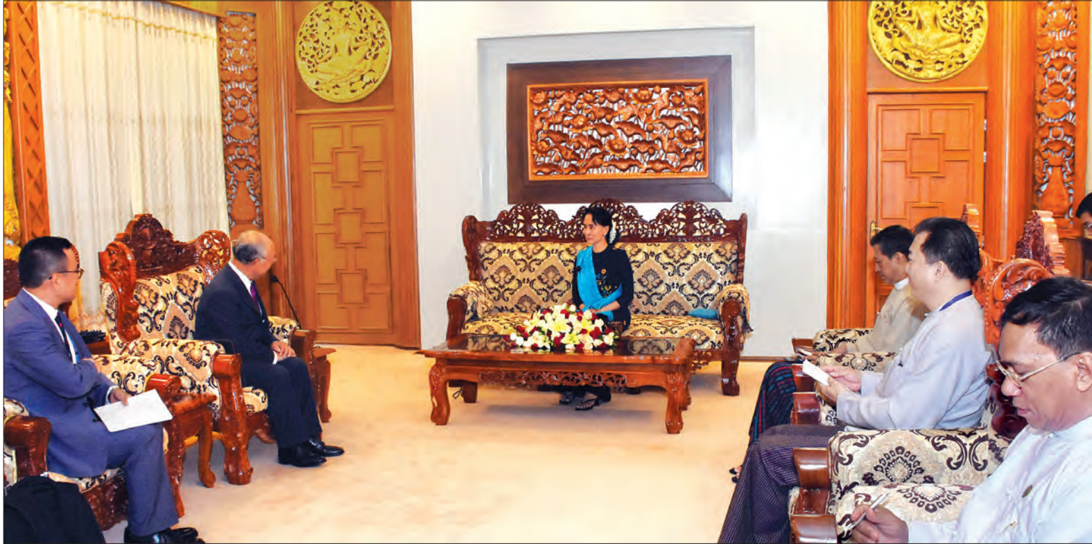
နိုင်ငံတော်၏ အတိုင်ပင်ခံပုဂ္ဂိုလ် ဒေါ်အောင်ဆန်းစုကြည်နှင့် အပြည်ပြည်ဆိုင်ရာ အဏုမြူဓွမ်းအင်အေဂျင်စီ (International Atomic Energy Agency- IAEA) ညွှန်ကြားရေးမှူးချုပ် Mr. Yukiya Amano တို့ တွေ့ဆုံဆွေးနွေးစဉ် (သတင်းစဉ်)

နေပြည်တော် ဇွန် ၂၉ နိုင်ငံတော်၏ အတိုင်ပင်ခံပုဂ္ဂိုလ် နိုင်ငံခြားရေးဝန်ကြီးဌာန ပြည်ထောင်စုဝန်ကြီး ဒေါ်အောင်ဆန်းစုကြည်သည် အပြည်ပြည်ဆိုင်ရာ အဏုမြူဓွမ်းအင်အေဂျင်စီ (International Atomic Energy Agency- IAEA) ညွှန်ကြားရေးမှူးချုပ် Mr. Yukiya Amano အား ယနေ့နံနက် ၁၀နာရီတွင် နေပြည်တော်ရှိ နိုင်ငံခြားရေးဝန်ကြီးဌာန ပြည်ထောင်စုဝန်ကြီး၏ ဧည့်ခန်းမ၌ လက်ခံတွေ့ဆုံသည်။