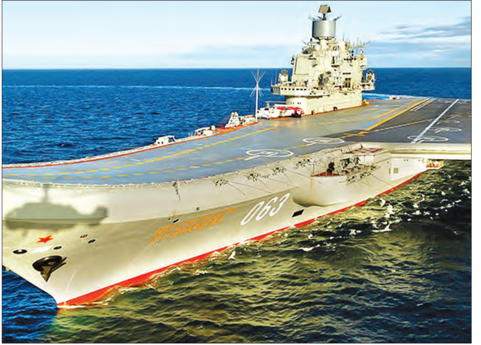
ယခင်က တည်ဆောက်ခဲ့သည့် ရုရှားနိုင်ငံ၏ လေယာဉ်တင်သင်္ဘော အက်မိုင်ရယ် ကုဇနက်ဆော်ပိုကို တွေ့ရမည်