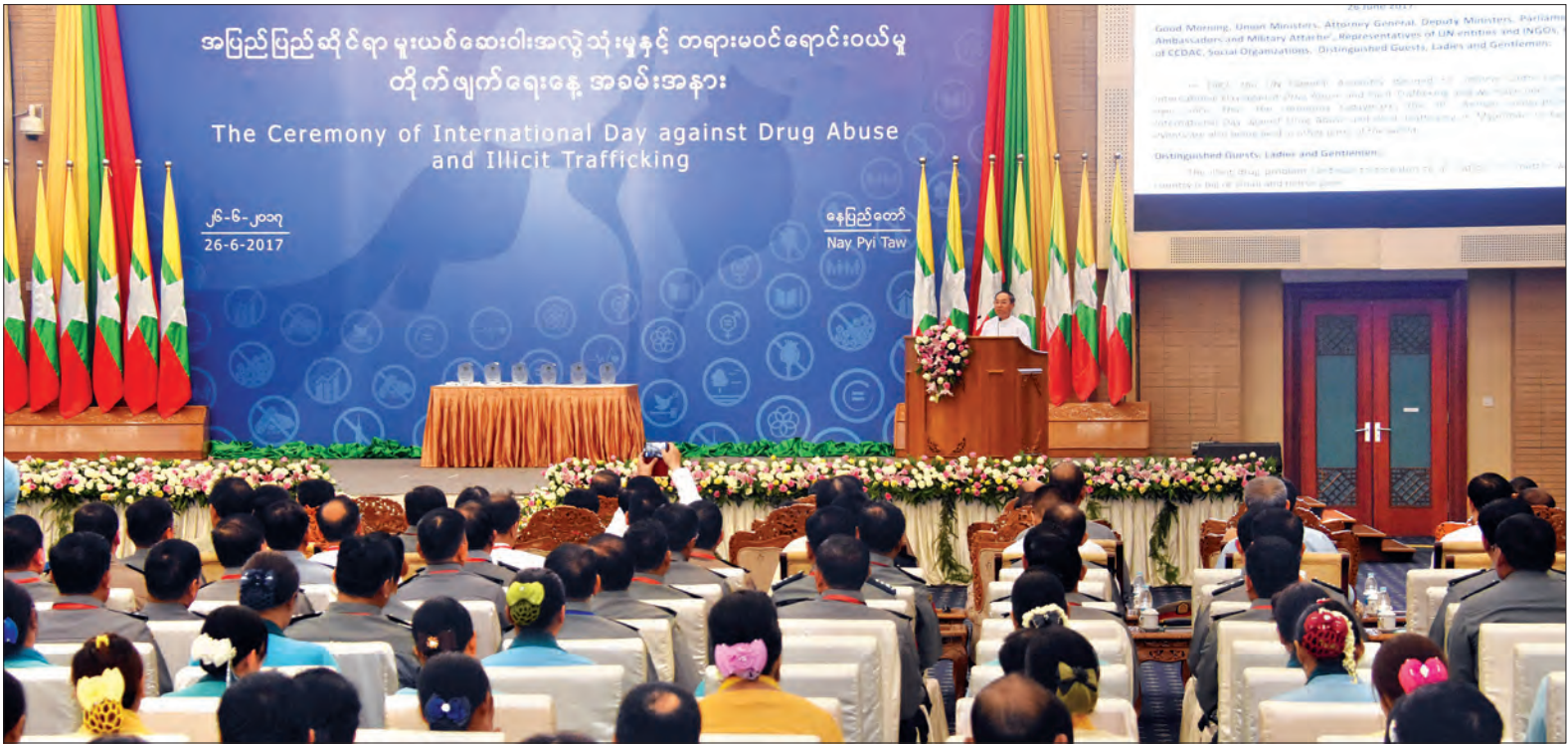
ဒုတိယသမ္မတ ဦးမြင့်ဆွေ အပြည်ပြည်ဆိုင်ရာ မူးယစ်ဆေးဝါးအလွဲသုံးမှုနှင့် တရားမဝင်ရောင်းဝယ်မှု တိုက်ဖျက်ရေးနေ့အခမ်းအနားတွင် အမှာစကားပြောကြားစဉ် (သတင်းစဉ်)

မူးယစ်ဆေးဝါးပပျောက်ရေး မဟာ ဗျူဟာနှစ်ရပ်ကို ချမှတ်ပြီး ၂၀၁၇-၂၀၂၀ ခုနှစ်မှ ၂၀၁၇-၂၀၁၉ ခုနှစ်အထိ ၁၅ နှစ် စီမံကိန်းကို ရှမ်း၊ ကချင်၊ ကယားနှင့် ချင်းပြည်နယ်များရှိ မြို့နယ်ပေါင်း ၅၁ မြို့နယ်၌ အကောင်အထည်ဖော်ဆောင် ရွက်နိုင်ခဲ့ပါကြောင်း၊ ၂၀၁၇-၂၀၁၉ ခုနှစ် မှ ၂၀၁၈-၂၀၁၉ ခုနှစ်အထိ မူးယစ် ဆေးဝါးပပျောက်ရေး စတုတ္ထငါးနှစ်စီမံ