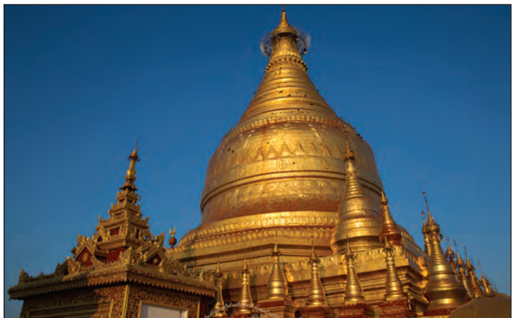
တန့်ကြည်တောင်စေတီ

လက်ရှိ တန့်ကြည်တောင်စေတီသည် ဉာဏ် တော် ပေ ၉၀ ရှိ၍ ဖိနပ်တော် ပေ ၆၀ ရှိသည်။ ထီးတော်အဆင့်ကိုးဆင့်တွင် ပုဇော်ထားသည့် စေတီတော်၏ငှက်မြတ်နားကို ငွေဖြင့် ပြုလုပ် ထားသည်။ စေတီတော်ပုံသဏ္ဍာန်သည် မကွေး မြသလွန်စေတီတော်နှင့် ဆင်သည်။ ရင်ပြင်ပေါ် တွင်ပြသထားသည့် ဘုရားသမိုင်းမှတ်တမ်းတွင် တန့်ကြည်တောင် အမြင့် ၁၀၅၀ ပေ၊ ပထမ