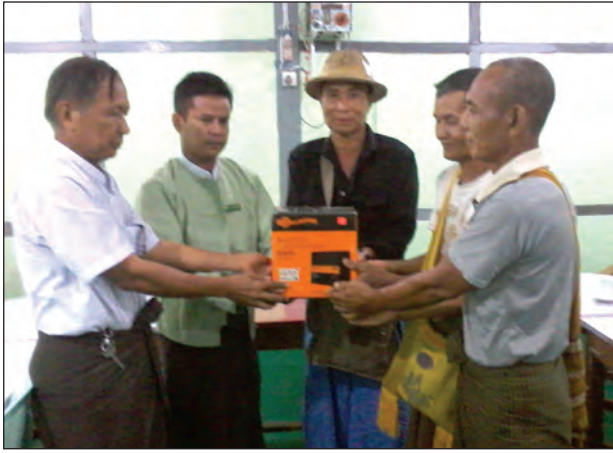
လျှပ်စစ်စွမ်းအင်ပြောင်းစက် (energizer)များကို ကျေးရွာတာဝန်ရှိသူများထံ ပေးအပ်စဉ်

လျှပ်စစ်ခြစ်စည်းရိုးကို ဖလုံကျေးရွာအုပ်စုမှ စပါးစိုက်ခင်း ဧက ၈၀ အတွက် ကာရံမည်ဖြစ်ပြီး ယခင်နှစ်က ဧက ၂၀ လျှပ်စစ် ခြစ်စည်းရိုးတပ်ဆင်ပေးထားခဲ့ရာ တောဆင်ရိုင်းအန္တရာယ်ကို ကာကွယ်နိုင်ခဲ့ကြောင်း သိရသည်။ လျှပ်စစ် ခြစ်စည်းရိုးတပ်ဆင်ခြင်းသည် ဧက ၂၀ အတွက် ကုန်ကျငွေ ကျပ်ခြောက်သိန်းခန့်ရှိပြီး SCBI အနေဖြင့် အခမဲ့ တပ်ဆင်ပေးနေခြင်းဖြစ်သည်။ လျှပ်စစ်ခြစ်စည်းရိုး တပ်ဆင်လိုပါက ဒေသခံများအနေဖြင့် သစ်တောဦးစီးဌာနနှင့် အထွေထွေအုပ်ချုပ်ရေးဦးစီးဌာနတို့သို့ တင်ပြလျှောက်ထား၍ ခွင့်ပြုလျှင် တပ်ပေးမည်ဖြစ်ကြောင်း သိရသည်။