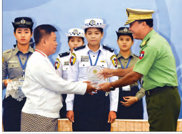
ပြည်ထဲရေးဝန်ကြီးဌာန ပြည်ထောင်စုဝန်ကြီး ဒုတိယဗိုလ်ချုပ်ကြီး ကျော်ဆွေ ပထမဆုရရှိသူတစ်ဦးအား ဆုပေးအပ်စဉ် (သတင်းစဉ်)

ရောင်းဝယ်မှုတိုက်ဖျက်ရေးနေ့ အထိမ်း အမှတ် ဝတ္ထုတို၊ ဆောင်းပါး၊ ကဗျာ၊ တေးသီချင်း၊ ဓာတ်ပုံနှင့် ကွန်ပျူတာ ပုံစံတစ်ပြိုင်ပွဲများတွင် ပထမဆုရရှိသူ မြောက်ဦးကို ဆုများပေးအပ်သည်။ ထို့နောက် မူးယစ်ဆေးဝါးနှင့် စိတ်ကိုပြောင်းလဲစေသောဆေးဝါးများ အန္တရာယ် တားဆီးကာကွယ်ရေးဗဟို အဖွဲ့၏ ဆောင်ရွက်ချက်မှတ်တမ်းဗီဒီယို ကို ပြသသည်။