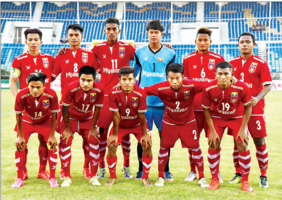
လေးနိုင်ငံစိတ်ဝေါ်ပြိုင်ပွဲ ယှဉ်ပြိုင်မည့် မြန်မာ ယူ-၂၂ အသင်း

သတင်း - ညိုမြတ်သော်တာ