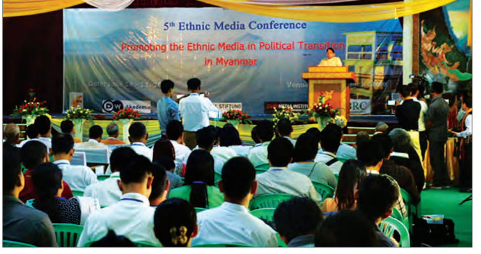
ပဉ္စမအကြိမ် တိုင်းရင်းမီဒီယာညီလာခံ ကျင်းပစဉ်

များ ဖွံ့ဖြိုးတိုးတက်ရေးအတွက် ကူညီပေးသွားမည် ဖြစ်ပါကြောင်း ပြောကြားသည်။ ဆက်လက်ပြီး ပြည်နယ်ဝန်ကြီးချုပ်က ဒီမိုကရေစီကူးပြောင်းရေးကာလတွင် မီဒီယာကဏ္ဍသည် စတုတ္ထမဏ္ဍိုင်ဖြစ်သည်နှင့်အညီ ဥပဒေပြုရေးမဏ္ဍိုင်၊ အုပ်ချုပ်ရေးမဏ္ဍိုင်၊ တရားစီရင်ရေးမဏ္ဍိုင်များနှင့် ဟန်ချက်ညီညီဆောင်ရွက်သွားပါက ဒီမိုကရေစီတိုင်းပြည်ထူထောင်ရေးကို အမြန်ဆုံး ရောက်ရှိမည်ဖြစ်ကြောင်း၊ ကယားပြည်နယ်အတွင်းရှိ မီဒီယာများအပြင် အခြားတိုင်းရင်းမီဒီယာများကပါ ဘက်လိုက်မှုကင်းသော အခြေအနေမှန်၊ သတင်းမှန်များ တင်ပြပေးခြင်းနှင့် ပြည်နယ်ဖွံ့ဖြိုးရေးကို ဆောင်ကြဉ်းပေးနိုင်မည်ဟု မျှော်လင့်ပါကြောင်း ပြောကြားပြီး USAID မှ Office Of