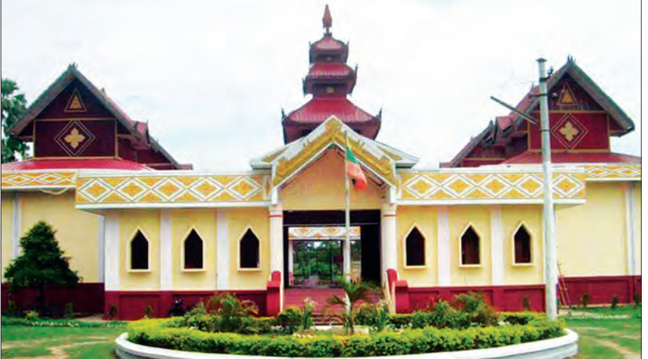
အဆင့်မြှင့်တင်ဆောင်ရွက်မည့် အင်းဝပြတိုက်

နေပြည်တော် ဇွန် ၂၆ ပို့ဆောင်ရေးနှင့် ဆက်သွယ်ရေးဝန်ကြီး ဌာန ပြည်ထောင်စုဝန်ကြီး ဦးသန့်စင် မောင်သည် ရေအရင်းအမြစ်နှင့် မြစ် ချောင်းများ ဖွံ့ဖြိုးတိုးတက်ရေးဦးစီး ဌာနညွှန်ကြားရေးမှူးချုပ်နှင့် တာဝန်ရှိသူ များနှင့်အတူ ဇွန် ၂၅ ရက်က ကျောက် တော်မြို့နယ် အပေါက်ကျေးရွာ၊ ကာဒီကျေးရွာနှင့် သင်္ဃန်းကျေးရွာများရှိ ကမ်းပြိုကာကွယ်ရေး ဘိုးပိုင်အခြေပြု မြေထိန်းနံရံ တည်ဆောက်ထားရှိမှု အခြေအနေ၊ သဲအိတ်စီ သဲမွေရာ အုတ်ရေလွှဲ ရေကာတည်ဆောက်ထားရှိမှု အခြေအနေတို့ကို ကြည့်ရှုစစ်ဆေး သည်။ (အပေါ်ပုံ) ယင်းနောက် ပြည်ထောင်စုဝန်ကြီး က အလုပ်ခွင် ဘေးအန္တရာယ်ကင်းရှင်း ရေး၊ လုပ်ငန်းများဆောင်ရွက်ရာတွင် စံချိန် စံညွှန်းပြည့်မီအောင် စနစ်တကျ ဆောင်ရွက်ရေး၊ ဆောင်ရွက်ထားရှိမှု အပေါ် အစစ်ဆေးခံနိုင်ရေးနှင့်နစ်ရှည် ခိုင်ခံ့သော လုပ်ငန်းများဖြစ်စေရေးတို့ ကို ဂရုပြုဆောင်ရွက်ကြရန် မှာကြားခဲ့ ကြောင်း သတင်းရရှိသည်။ (သတင်းစဉ်)