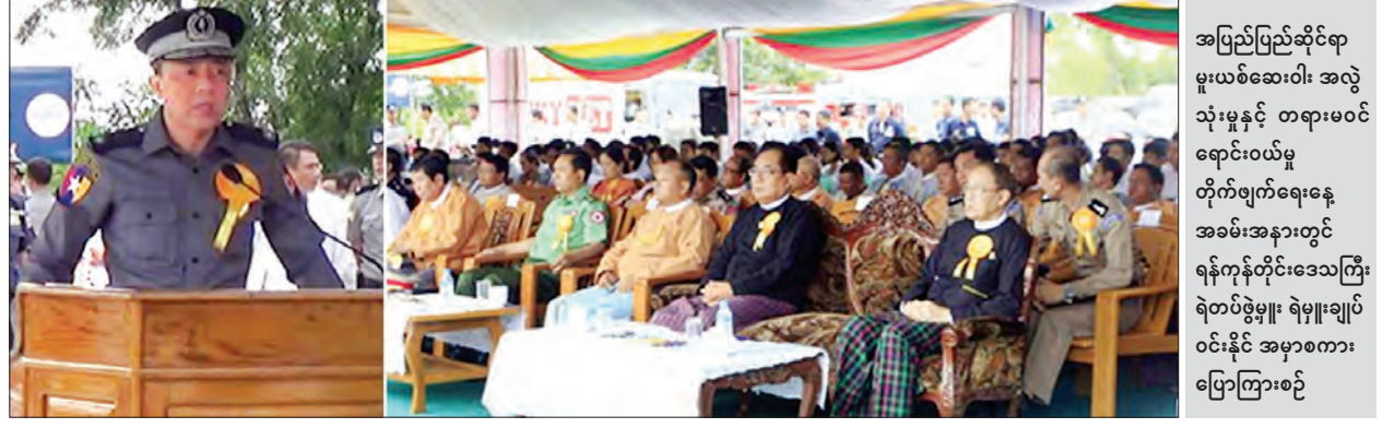
အပြည်ပြည်ဆိုင်ရာ မူးယစ်ဆေးဝါး အလွဲ သုံးမှုနှင့် တရားမဝင် ရောင်းဝယ်မှု တိုက်ဖျက်ရေးနေ့ အခမ်းအနားတွင် ရန်ကုန်တိုင်းဒေသကြီး ရဲတပ်ဖွဲ့မှူး ရဲမှူးချုပ် ဝင်းနိုင် အမှာစကား ပြောကြားစဉ်

အခမ်းအနားတွင် ရန်ကုန်တိုင်းဒေသကြီး မူးယစ်ဆေးဝါးနှင့် စိတ်ကိုပြောင်းလဲ စေသော ဆေးဝါးများအန္တရာယ်တားဆီးကာကွယ်ရေးအဖွဲ့အတွင်းရေးမှူး ရန်ကုန်တိုင်း ဒေသကြီးရဲတပ်ဖွဲ့မှူး ရဲမှူးချုပ် ဝင်းနိုင်က ယနေ့ မီးရှို့ဖျက်ဆီးမည့် မူးယစ်ဆေးဝါးများ မှာ ရန်ကုန်တိုင်းဒေသကြီးအပါအဝင် တနင်္သာရီ၊ ပဲခူး၊ ဧရာဝတီတိုင်းဒေသကြီးနှင့် ရခိုင်၊ မွန်၊ ကရင်ပြည်နယ်၊ အမှတ်(၁)နယ်ခြားစောင့်ရဲကွပ်ကဲမှု အဖွဲ့၊ အမြန်လမ်းမကြီး ရဲတပ်ဖွဲ့တို့မှ ဖမ်းဆီးရမိပြီး တရားရုံးပြီးပြတ်ချက် ရရှိပြီးသည့် မူးယစ်ဆေးဝါးများကို မီးရှို့ဖျက်ဆီးခြင်းဖြစ်ပါကြောင်း၊ မီးရှို့ဖျက်ဆီးမည့် မူးယစ်ဆေးဝါး ၂၅ မျိုး၏ တန်ဖိုးမှာ ကာလပေါက်ချေးအရ မြန်မာငွေကျပ် ၂၉၆ ဒသမ ၄ ဘီလီယံခန့်၊ အမေရိကန်ဒေါ်လာ ၂၇၃ ဒသမ ၉၄၀ သန်းခန့်ရှိပါကြောင်း၊ ယခု မူးယစ်ဆေးဝါးများ မီးရှို့ဖျက်ဆီးခြင်းမှာလည်း မြန်မာနိုင်ငံအနေဖြင့် မူးယစ်ဆေးဝါးတိုက်ဖျက်ရေး လုပ်ငန်းများကို အမျိုးသားရေး တာဝန်တစ်ရပ်အဖြစ်ယူပြီး လူထုလှုပ်ရှားမှု အသွင်ဖြင့် တစ်မျိုးသားလုံးက ပိုင်းဝန်း ကြိုးပမ်းဆောင်ရွက်ခဲ့ခြင်းကို ပြသခြင်းဖြစ်ကြောင်း၊ နိုင်ငံတကာနှင့်လည်း ပူးပေါင်း ဆောင်ရွက်လျက်ရှိကြောင်း၊ မူးယစ်ဆေးဝါးအန္တရာယ်မှာ အနာဂတ်မျိုးဆက်သစ် လူငယ်များကို ခြိမ်းခြောက်နေသော ဘေးအန္တရာယ်ဆိုးကြီးဖြစ်ခြင်းကြောင့် ကျောင်းသား လူငယ်ထုအတွင်း မူးယစ်ဆေးဝါးပုံနှိပ်မှုမရှိစေရေးအတွက် အသိပညာ ပေးလုပ်ငန်းများကိုလည်း ဆောင်ရွက်သွားရမည်ဖြစ်ကြောင်း ပြောကြားခဲ့သည်။