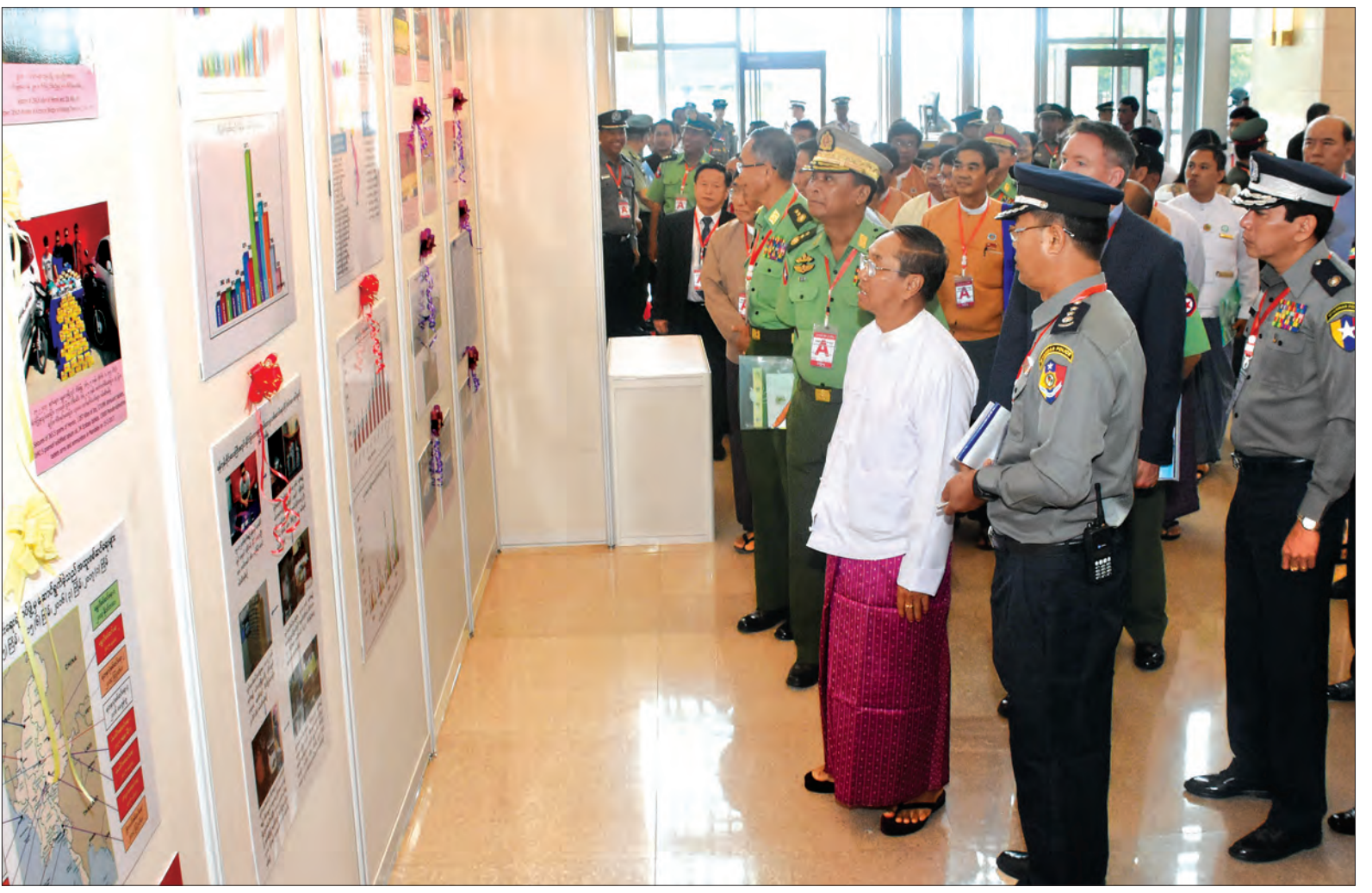
ဒုတိယသမ္မတ ဦးမြင့်ဆွေ အပြည်ပြည်ဆိုင်ရာ မူးယစ်ဆေးဝါးအလွဲသုံးမှုနှင့် တရားမဝင်ရောင်းဝယ်မှုတိုက်ဖျက်ရေးနေ့ အထိမ်းအမှတ်ပြခန်းများကို လှည့်လည်ကြည့်ရှုစဉ် (သတင်းစဉ်)

အခမ်းအနားတွင် ဒုတိယသမ္မတ ဦးမြင့်ဆွေက မူးယစ်ဆေးဝါးပြဿနာ သည် နိုင်ငံကြီးငယ်မရွေး၊ ဆင်းရဲချမ်းသာ မရွေး၊ ကမ္ဘာလူသားထုတစ်ရပ်လုံးနှင့် နိုင်ငံအသီးသီးကို ခြိမ်းခြောက်နေသည့် ပြဿနာတစ်ရပ်ဖြစ်ကြောင်း၊ မြန်မာ စာမျက်နှာ ၃ ကော်လံ ၁ *