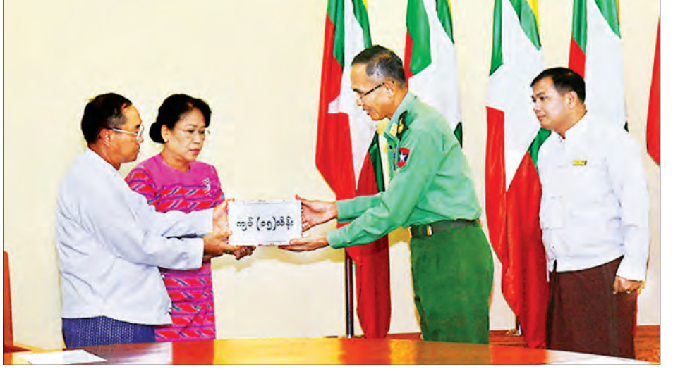
ဒုတိယသမ္မတ ဦးမြင့်ဆွေ-ဒေါ်ခင်သက်ဌေး မိသားစုက Y-8 လေယာဉ်ပျက်ကျရာတွင် ပါဝင်သွားသူများအတွက် ထောက်ပံ့ငွေ ပေးအပ်လှူဒါန်းစဉ် (သတင်းစဉ်)

အလားတူ ပျက်ကျခဲ့သော လေယာဉ်တွင် ပါဝင်သွားခဲ့သည့် အရာရှိ/စစ်သည်၊ မိသားစုများနှင့် လေယာဉ်အမှုထမ်းများအတွက် ထောက်ပံ့ငွေကျပ် သိန်း ၃၀ ကို ပြည်ထောင်စုစာရင်းစစ်ချုပ် ဦးမော်သန်းက လာရောက်ပေးအပ်လှူဒါန်းရာ ပြည်ထောင်စုဝန်ကြီး ဒုတိယဗိုလ်ချုပ်ကြီး စိန်ဝင်းက လက်ခံခဲ့ကြောင်း သတင်းရရှိသည်။ (သတင်းစဉ်)