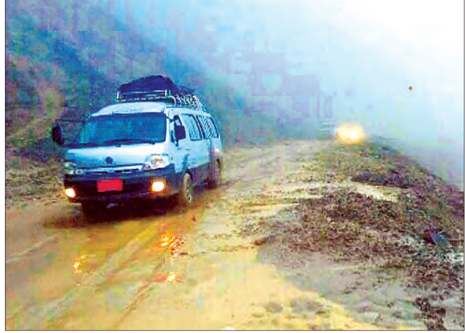
ချင်းပြည်နယ် ဟားခါး-ဂန့်ဂေါလမ်းတွင် တောင်ပြိုမြေများဖယ်ရှားပြီးကားများသွားလာနေစဉ်

စက်အားလူအားဖြင့် ချက်ချင်းသွားရောက်ဖယ်ရှားပေး လျက်ရှိသည်။