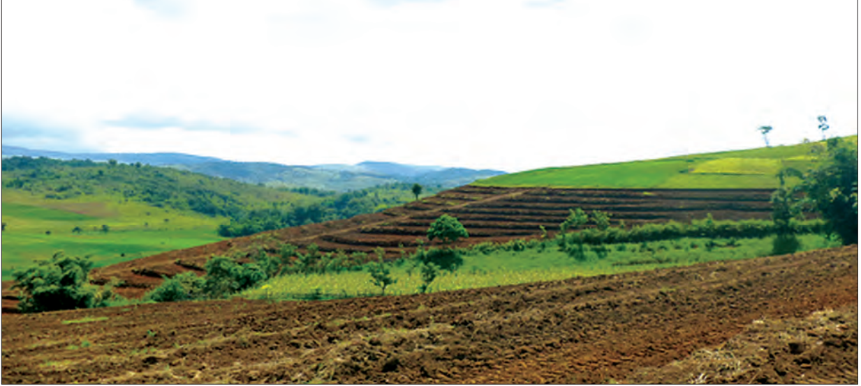
ကုန်းမြင့်လယ်ယာ လေ့ကားထစ်စိုက်ခင်းကိုတွေ့ရစဉ်

ဌာနမှ စိုက်ပျိုးပညာပေးဝန်ထမ်းများကလိုအပ်သောနည်းပညာများကိုရုပ်ပုံ