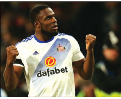
ဆန်းဒါးလန်းတိုက်စစ်မှူး အနီဘီချီ တရုတ်စူပါလိဂ်ကလပ်သို့ ပြောင်းရွှေ့