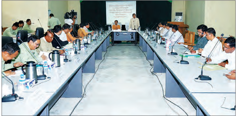
ပြည်ထောင်စုဝန်ကြီး ဒေါက်တာဖေမြင့် လွိုင်ကော်မြို့ သီရိရုပ်ရှင်ရုံဟောင်းမြေနေရာတွင် အဆင့်မြင့်ရုပ်ရှင်ရုံနှင့် Community Centre ပါဝင်သော ခေတ်မီအထပ်မြင့် အဆောက်အအုံသစ်တည်ဆောက်နိုင်ရေးနှင့်ပတ်သက်၍ ဆွေးနွေးညှိနှိုင်းစဉ်

ပြည်ထောင်စုဝန်ကြီးနှင့်အဖွဲ့သည် ဇွန် ၂၅ ရက်က လွိုင်ကော်မြို့ မင်းစုရပ်ကွက်ရှိ သီရိရုပ်ရှင်ရုံဟောင်းနှင့် မြန်မာ့အသံနှင့် ရုပ်မြင်သံကြား၊ တိုင်းရင်းသားလူမျိုးများ ရုပ်သံလိုင်း၊ လွိုင်ကော်သတင်းဌာနခွဲ၊ သတင်းရိုက်ကူး၊ ပေးပို့၊ ထုတ်လွှင့်နေမှု အခြေ