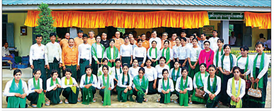
ဝင်းရတနာ ကျောင်းဆောင်သစ်ဖွင့်ပွဲ တက်ရောက်ကြသူများ စုပေါင်းဓာတ်ပုံရိုက်စဉ်

တစ်ဆောင် ဆောက်လုပ်လှူဒါန်းခဲ့သည်။ ယနေ့လွှဲပြောင်းပေးသော ကျောင်းဆောင်သစ်သည် (၈၀x၃၂) ပေရှိ RC