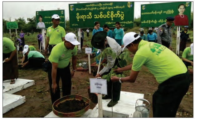
တသံတခရိုင် အုပ်ချုပ်ရေးမှူးချုပ်ကြီးဝင်းအောင်အမှတ် (၂၀) ၌ ဇွန်လတတိယပတ်က စုပေါင်းသစ်ပင်စိုက်ပျိုးပွဲ ကျင်းပရာ ဧရာဝတီဒေသကြီး လွှတ်တော်ဥက္ကဋ္ဌ ဦးအောင်ကျော်ခိုင်နှင့် လွှတ်တော်ကိုယ်စားလှယ်များ၊ တိုင်းဒေသကြီး သစ်တောဦးစီးဌာန ညွှန်ကြားရေးမှူး ဦးခင်မောင်မြင့်နှင့် ဌာနဆိုင်ရာတာဝန်ရှိသူများ ပူးပေါင်း၍ သစ်ပင်များ စိုက်ပျိုးကြစဉ် ငွှေးမင်း

အဆိုပါ ရေတံခါးကျေးရွာတွင် အိမ်ခြေ ၁၂၀၊ လူဦးရေစုစုပေါင်း ၃၈၀ ခန့်ရှိပြီး ဒေသခံပြည်သူများနှင့် ဆက်စပ်ကျေးရွာများပါ လျှပ်စစ်မီး ၂၄ နာရီ ရရှိအသုံးပြုနိုင်တော့မည်ဖြစ်သည်။ ကျေးရွာများ လျှပ်စစ်မီးရရှိစေရေးအတွက် ကျေးလက်ဒေသဖွံ့ဖြိုးရေးအစီအစဉ်ဖြင့် တိုင်းဒေသကြီးအစိုးရအဖွဲ့၏ ခွင့်ပြုရန်ပုံငွေကျပ်သိန်း ၂၅၀၀ ဖြင့် ရေတံခါးကျေးရွာ၊ ချောင်းဦးကျေးရွာ၊ ရခိုင်ချောင်း(တောင်)ကျေးရွာနှင့် ရခိုင်ချောင်း(မြောက်) ကျေးရွာလေးရွာတို့အား လျှပ်စစ်မီးရရှိရေးလုပ်ငန်းများနှင့် မြို့ပေါ်ရှိ ရပ်ကွက်များအတွင်း၌ ဆွေးမြည့်သစ်သားတိုင်၊ သံတိုင်အစား ကွန်ကရစ် ကျောက်တိုင် ၁၆၀ အား လဲလှယ်ခြင်းလုပ်ငန်းများ ဆောင်ရွက်ပြီးစီးကြောင်း မြို့နယ်လျှပ်စစ်မန်နေဂျာမှ သိရသည်။ နိုင်လင်းကျော်