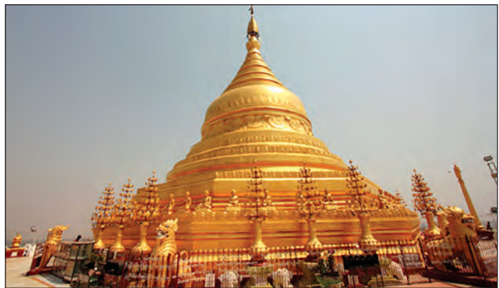
လောကနန္ဒာ စေတီ

လောကနန္ဒာစေတီသည် ပုဂံဘုရားနှင့် မတူမပြားလွန်စေတီတို့ကိုသို့ ဧရာဝတီမြစ်ကမ်း နဖူးတွင် တည်ရှိသည်။ အနော်ရထာမင်းသည် စွယ်တော်ပွားကို ရတနာပန်းတောင်းအတွင်း၌ ထည့်ကာ အဓိဋ္ဌာန်ပြုလျက် ဆင်ဖြူတော်ပေါ် တင်၍ စေလွှတ်ခဲ့သည်။ ဆင်ဖြူတော်သည် ဧရာဝတီမြစ်ကမ်း သီရိပစ္စယာ ဒုတိယနန်းတော် ရာဇာဏီတောင်ဘက်၊ ပုဂံသင်္ဘောဆိပ်အနီး ကုန်းမြင့်တွင် ဝပ်ခဲ့ရာ အနော်ရထာသည်