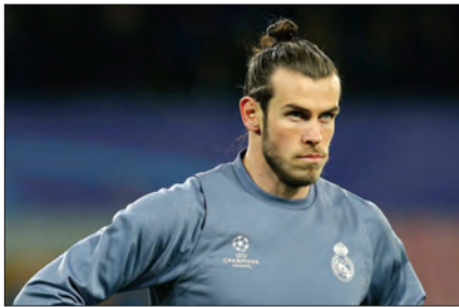
ဂါရတ်ဘေးလ် ပရီမီယာလိဂ်သို့ ပြန်လာဖွယ်ရှိနေ

ရဲတပ်ဖွဲ့တွင်အသုံးပြုသောခေတ်မီသည့်လက်နက်များအစား လက်ရှိအခြေအနေနှင့် ကိုက်ညီသော လက်နက်များ ပြောင်းလဲတပ်ဆင်ခြင်းဆောင်ရွက်လျက်ရှိ