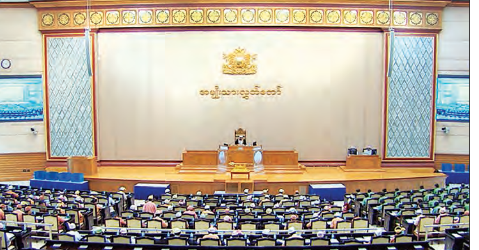
အမျိုးသားလွှတ်တော် အစည်းအဝေး ကျင်းပစဉ်

ထိုသို့ စစ်ဆေးရာတွင် ကုန်ကြမ်းပစ္စည်းများကို ပြင်ပရုပ်သွင်တိုက်ဆိုင်စစ်ဆေးခြင်း ပြုလုပ်ပြီး လိုအပ်ပါက ပါဝင်ဓာတ်ပစ္စည်းများကို ဓာတ်ခွဲစမ်းသပ်စစ်ဆေးခြင်း ပြုလုပ်ပါကြောင်း၊ ကုမ္ပဏီများအနေဖြင့် ပရဆေးကုန်ကြမ်း သို့မဟုတ် အဆီအနှစ်များအား တိုင်းရင်းဆေးဝါးများ ဖော်စပ်ရာတွင် အသုံးပြုသော ကုန်ကြမ်းပစ္စည်းများဖြစ်ကြောင်း လာရောက်လျှောက်ထားပါက တိုင်းရင်းဆေးပညာ ဦးစီးဌာနမှ တင်သွင်းသည့် ကုမ္ပဏီ၏ ဓာတ်ခွဲစမ်းသပ်တွေ့ရှိချက်အား သေချာစွာ စိစစ်/ စစ်ဆေးပြီး ထောက်ခံပေးပါကြောင်း၊ ပရဆေး ကုန်ကြမ်းရောင်းချသူ တိုင်းရင်းဆေးဝါးထုတ်လုပ်ရန် ကုန်ကြမ်းဝယ်ယူသူများအနေဖြင့်လည်း မိမိတို့ရောင်းချ ဝယ်ယူမည့်ပစ္စည်းအား သိရှိပြီး သေချာစွာစစ်ဆေး