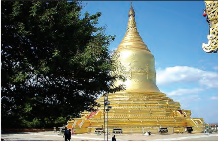
ရွှေစည်းခုံ စေတီ

ရွှေစည်းခုံသည် ပုဂံရှိ ငုံ့၍တည်ထားသော စေတီဘုရား ၄၃ ဆူအနက် တစ်ဆူဖြစ်ပြီး စေတီတော်ကို တုရင်တောင်မှသယ်ယူခဲ့သည့်