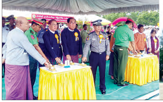
ရန်ကုန်တိုင်းဒေသကြီးအတွင်း၌ ဖမ်းဆီးရမိသော မူးယစ်ဆေးဝါးများ မီးရှို့ဖျက်ဆီးပွဲ

အခမ်းအနားများသို့ တိုင်းဒေသကြီးလွှတ်တော်ဥက္ကဋ္ဌ ဦးတင်မောင်ထွန်း၊ တိုင်းဒေသကြီးတရားလွှတ်တော် တရားသူကြီးချုပ် ဦးဝင်းဆွေ၊ တိုင်းဒေသကြီး လွှတ်တော် ဒုတိယဥက္ကဋ္ဌ ဦးလင်းနိုင်မြင့်၊ တိုင်းဒေသကြီးဝန်ကြီးများ၊ မြန်မာနိုင်ငံ ရဲတပ်ဖွဲ့မှူး ရဲအရာရှိကြီးများ၊ မြန်မာနိုင်ငံမူးယစ်ဆေးဝါးဆန့်ကျင်ရေး အသင်း ဗဟို အဖွဲ့နာယက ဦးတင်လှိုင်၊ ဥက္ကဋ္ဌ ဦးစိုးဝင်းနှင့်အဖွဲ့ဝင်များ၊ NGO အဖွဲ့အစည်းအသီးသီးမှ တာဝန်ရှိသူများ၊ အကဲဖြတ်ပိုင်များ၊ ဆရာ ဆရာမများ၊ ပြိုင်ပွဲဝင် ဆုရ ကျောင်းသား၊ ကျောင်းသူများနှင့် မိသားစုများ၊ သတင်းပီဒီယာများ၊ ဖိတ်ကြား ထားသူများ စုစုပေါင်း ၃၀၀ ခန့် တက်ရောက်ခဲ့ကြောင်း သတင်းရရှိသည်။ (သတင်းစဉ်)