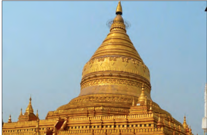
တုရင်တောင်စေတီ

ပုဂံစေတီပုထိုးများ(ပြန်ကြားရေးဝန်ကြီးဌာန) ပုဂံသုတေသနလမ်းညွှန်(ဦးစိုကေ)