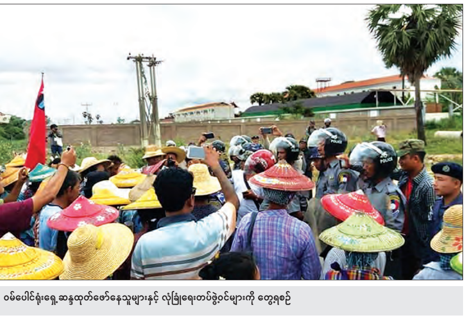
ဝမ်းပေါင်ရုံးရှေ့ဆန္ဒထုတ်ဖော်နေသူများနှင့် လုံခြုံရေးတပ်ဖွဲ့ဝင်များကို တွေ့ရစဉ်