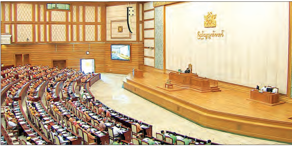
ပြည်သူ့လွှတ်တော်အစည်းအဝေး ကျင်းပစဉ်

ရခိုင်ကမ်းလှန် ရွှေသဘာဝဓာတ်ငွေစီမံကိန်းကို ၂၀၁၀ ပြည့်နှစ်တွင် စတင်အကောင်အထည်ဖော်ခဲ့ပြီး တည်ဆောက်ရေးကာလ သုံးနှစ်ခန့်ကြာမြင့်ခဲ့ကြောင်း၊ အဆိုပါစီမံကိန်းတွင် တရုတ်နိုင်ငံ CNPC ကုမ္ပဏီမှ ရင်းနှီးမြှုပ်နှံမှု ၅၀ ဒသမ ၉ ရာခိုင်နှုန်း၊ တောင်ကိုရီးယားနိုင်ငံ Daewoo ကုမ္ပဏီမှ ၂၅