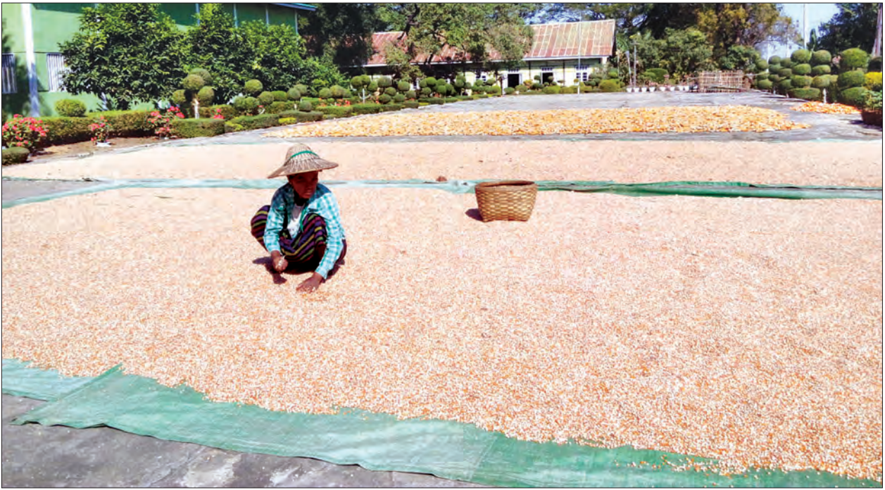
တပ်ကုန်းစိုက်ပျိုးရေး သုတေသနခြံ၌ စပ်မျိုးပြောင်းများ နေလှန်းထားသည်ကို တွေ့ရစဉ်

မြန်မာနိုင်ငံ၏ စိုက်ပျိုးထုတ်လုပ်သည့် နေရာတွင် ထုတ်လုပ်မှု တိုးတက်အောင် ဆောင်ရွက်ရန်အတွက် မျိုးကောင်း မျိုးသန့်များကို အသုံးပြုနိုင်ရန် အရေးကြီးသည် အချက်ပင်ဖြစ်သည်။ မျိုးကောင်းမျိုးသန့်များကို တောင်သူများ အသုံးပြုနိုင်ရန် စိုက်ပျိုးရေး၊ မွေးမြူရေး နှင့် ဆည်မြောင်းဝန်ကြီးဌာနအောက်ရှိ သက်ဆိုင်ရာ ဦးစီးဌာနများကလည်း မျိုးသစ်များထုတ်လုပ်နိုင်ရေး နိုင်ငံ တကာနှင့်ပူးပေါင်း၍ ဆောင်ရွက်လျက် ရှိကြောင်း သိရသည်။ ထို့အပြင် ရေဆင်း စိုက်ပျိုးရေးတက္ကသိုလ်မှလည်း နိုင်ငံ တကာမှ စိုက်ပျိုးရေးပညာရှင်များနှင့် ပူးပေါင်း၍ စိုက်ပျိုးရေးနည်းပညာများ တိုးတက်ရေးအတွက် ဆောင်ရွက်လျက်ရှိ ကြောင်း သိရသည်။