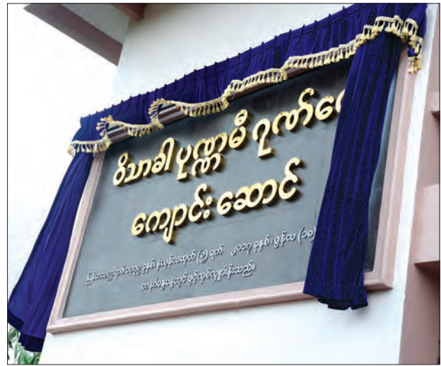
နိုင်ငံတော်သမ္မတ၏ဇနီး ဒေါ်စုစုလွင် ဝိသာခါ ပုဏ္ဏမီ ဂုဏ်ဝေ သီလရှင်စာသင်ကျောင်း ဆောင်သစ် ကမ္ဘည်းမော်ကွန်းကို စက်ခလုတ်နှိပ် ဖွင့်လှစ်ပေးစဉ် (သတင်းစဉ်)

ထို့နောက် ဝိသာခါဖောင်ဒေးရှင်း ဥက္ကဋ္ဌ ဒေါက်တာစုလှနှင့် အဖွဲ့ဝင်များ က သီလရှင်စာသင်တိုက် ပဓာန နာယက သီလရှင်ဆရာကြီး ဒေါ်ဖေယျာသီရိထံ စာသင်ကျောင်း၊ စာကြည့်တိုက်တို့နှင့် ပတ်သက်သည့် စာရွက်စာတမ်းများကို ပေးအပ်သည်။