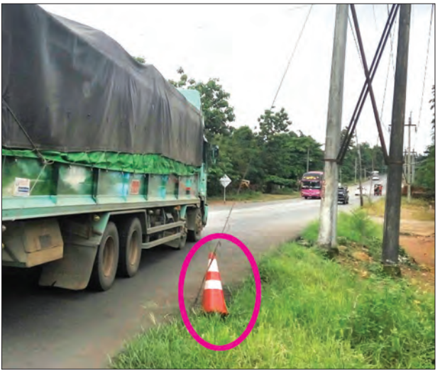
တာမုမဖြစ်ပါဘူး၊ ဖြစ်ခဲ့ရင်တော့ လူကား၊ ဓာတ်တိုင်တွေ ပျက်စီးဆုံးရှုံးမှုများမယ်” ဟု ဒေသခံကျေးရွာသားတစ်ဦးက ပြောသည်။ (မိုး/လေ)

နိုင်ငံတော်ကဦးဆောင်မှုဖြင့် မွန်ပြည်နယ်အတွင်း လမ်းပန်းဆက်သွယ်ရေး ပိုမိုကောင်းမွန်လာစေရေးအတွက် သက်ဆိုင်ရာကုမ္ပဏီများက လမ်းများတိုးချဲ့ ဆောင်ရွက်နေရာ ယခင်က စိုက်ထူထားရှိခဲ့သော လမ်းမီးတိုင်အချို့မှာ ယခုကဲ့သို့ နီးကပ်စွာရောက်ရှိလာသည်ဟု သိရသည်။ “ဒီ လမ်းအတွေ့မှာ တာမုမဖြစ်ရင်တော့