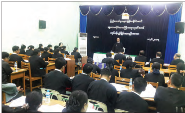
ထိခိုက်ပျက်စီးမှုများ ဖြစ်ပေါ်လာခြင်းနှင့် စစ်တမ်းများ ပြုစုရာတွင် အခက်အခဲများ ဖြစ်ပေါ်လာခြင်းများကို ဖော်ပြခဲ့ပြီး တရားရုံးများမှ လိုက်နာဆောင်ရွက်ရန် တောင်းဆိုခဲ့သည်။

မန္တလေးတိုင်းဒေသကြီး တရားလွှတ်တော်နှင့် ခရိုင်တရားသူကြီးများ၊ မြို့နယ်တရားသူကြီးများ လုပ်ငန်းညှိနှိုင်းအစည်းအဝေးကို ဇွန် ၁၇ ရက် နံနက်ပိုင်းက မန္တလေးတိုင်းဒေသကြီး တရားလွှတ်တော်အစည်းအဝေးခန်းမ၌ ကျင်းပသည်။ (ယာပုံ) အစည်းအဝေးတွင် တိုင်းဒေသကြီး တရားလွှတ်တော်တရားသူကြီးချုပ် ဦးစိုးသိန်းက တစ်နှစ်အထက် အချုပ်တရားခံပါ ရာဇဝတ်မှုများ၊ နှစ်နှစ်အထက်ခံဝန်ပေးထားသော ရာဇဝတ်မှုများ၊ သုံးနှစ်အထက် ကြန့်ကြာနေသော တရားမမှုများ အပြန်ပြန်ပြုတ်ရေးကိစ္စ၊ တရားရုံးများ၏ လုံခြုံရေးကိစ္စ၊ အများပြည်သူနှင့် ဆက်ဆံရာတွင် တရားရုံးများမှ လိုက်နာဆောင်ရွက်ရန်ကိစ္စ၊ တရားခွင့်စည်းကမ်းလိုက်နာရန်ကိစ္စ၊ ပြစ်မှုနှင့်လျော်ညီသော ပြစ်ဒဏ်ချမှတ်ရန်ကိစ္စ၊ တရားဥပဒေစိုးမိုးရေးကို ထိခိုက်စေသော ရာဇဝတ်မှုများတွင် ထိခိုက်ပျက်စီးမှုများ ဖြစ်ပေါ်လာခြင်းနှင့် စစ်တမ်းများ ပြုစုရာတွင် အခက်အခဲများ ဖြစ်ပေါ်လာခြင်းများကို ဖော်ပြခဲ့ပြီး တရားရုံးများမှ လိုက်နာဆောင်ရွက်ရန် တောင်းဆိုခဲ့သည်။