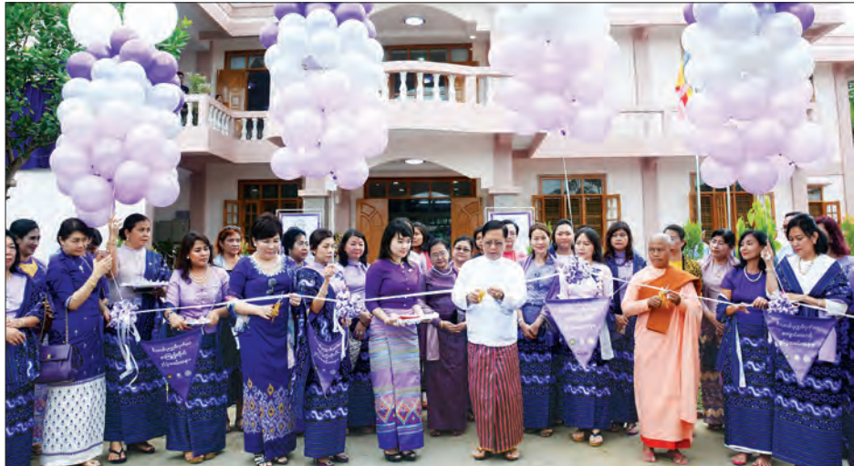
ပြည်ထောင်စုဝန်ကြီး သူရဦးအောင်ကို၊ သီလရှင်ဆရာကြီး ဒေါ်ဖေယျာသီရိနှင့် ဖောင်ဒေးရှင်းနာယက ပါမောက္ခ ဒေါက်တာ ဝင်းမင်းသစ်တို့ ဝိသာခါ ပုဏ္ဏမီ ဂုဏ်ဝေ သီလရှင်စာသင်ကျောင်းဆောင်သစ်ကို ဖဲကြိုးဖြတ်ဖွင့်လှစ်စဉ် (သတင်းစဉ်)

သီလရှင် စာသင်ကျောင်းဆောင်သစ် နှင့် စာကြည့်တိုက် တည်ဆောက်လှူဒါန်း ခြင်းနှင့် စပ်လျဉ်း၍ ဂုဏ်ပြုအမှာစကား ပြောကြားသည်။ ယင်းနောက် နိုင်ငံတော်သမ္မတ၏ ဇနီးနှင့် အခမ်းအနားသို့ တက်ရောက် လာကြသူများသည် စုပေါင်း၍ မှတ်တမ်း တင် ဓာတ်ပုံရိုက်ကြသည်။ (သတင်းစဉ်)