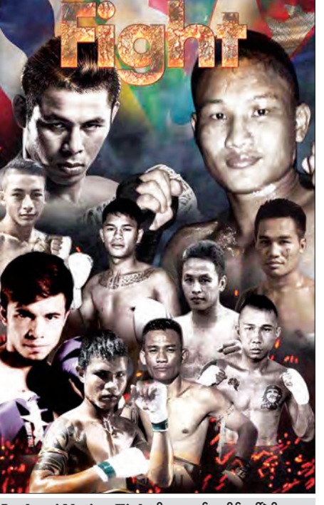
Lethwei Nation Fight ရိုးရာလက်ဝှေ့စီနီခေါ်ပွဲပို့စတာကိုတွေ့ရစဉ်

Lethwei Nation Fight ရိုးရာလက်ဝှေ့စီနီခေါ်ပွဲတွင် ရှိဝင်ခများကို ဝါသနာရှင်ပြည်သူများ လူလတ်တန်းစားမရွေး ကြည့်ရှုအားပေးနိုင်ရန် ရှေးဟောင်းတွင် ငွေကျပ် ၅၀၀၀၀၊ ဒုတိယတန်းတွင် ငွေကျပ် ၄၀၀၀၀၊ တတိယတန်းတွင် ငွေကျပ် ၂၅၀၀၀၊ ၂၀၀၀၀ မှ အနိမ့်ဆုံးငွေကျပ် ၅၀၀၀ အထိ လျှော့ချပေးထားပြီး ကြိုတင်လက်မှတ်မှာယူလိုလျှင် ဇူလိုင်-၀၉-၇၃၀၀၉၆၆၆၊ ၀၉-၂၅၄၂၄၁၆၀ ဇော်ပစ်တိုင်းထောင်စီဒီယိုနှင့် PHOENIX GYM သိမ်ဖြူရိုးရာလက်ဝှေ့အားကစားရုံ ဇူလိုင်-၀၉-၇၃၂၂၂၂ တို့သို့ ဆက်သွယ်နိုင်ကြောင်းနှင့် လတ်တလောမည်သည့်ရုပ်သံလိုင်းမှ တိုက်ရိုက်ထုတ်လွှင့်ရန် အစီအစဉ်မရှိသေးကြောင်း သိရသည်။