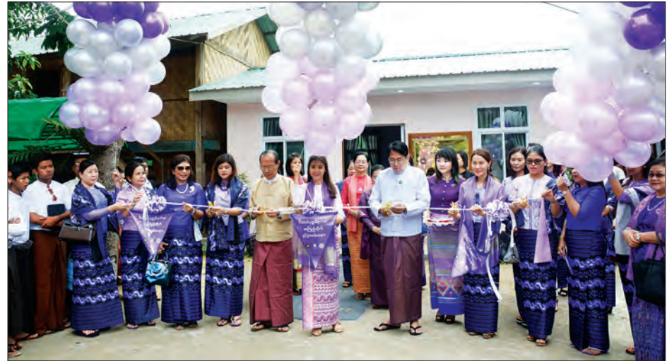
ပြည်ထောင်စုဝန်ကြီး ဒေါက်တာဖေမြင့်၊ နေပြည်တော်ကောင်စီဥက္ကဋ္ဌ ဒေါက်တာမျိုးအောင်နှင့် ဝိသာခါဖောင်ဒေးရှင်းဥက္ကဋ္ဌ ဒေါက်တာစုလှတို့ ဝိသာခါ ပုဏ္ဏမီ ဂုဏ်ဝေ စာကြည့်တိုက်ကို ဖဲကြိုးဖြတ်ဖွင့်လှစ်စဉ် (သတင်းစဉ်)