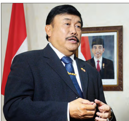
မြန်မာနိုင်ငံဆိုင်ရာ အင်ဒိုနီးရှားနိုင်ငံသံအမတ်ကြီး Mr. Ito Sumardi

မြန်မာနိုင်ငံမှာ သဘာဝအရင်းအမြစ်တွေ ပေါများတဲ့အတွက် အင်ဒိုနီးရှား လုပ်ငန်းရှင်တွေအနေနဲ့ မြန်မာနိုင်ငံမှာ စက်ရုံ၊ အလုပ်ရုံတွေ ထူထောင်ပြီး ရင်းနှီးမြှုပ်နှံမှုတွေလုပ်ဖို့ ကြိုးပမ်းနေကြပါတယ်။ ရည်ရွယ်ချက်ကတော့ အလုပ်အကိုင်အခွင့်အလမ်းတွေ ဖော်ဆောင်ပါမယ်။ ဒါ့အပြင် မြန်မာ အလုပ်သမားအများစုအတွက် လုပ်ငန်းခွင်ကျွမ်းကျင်မှုရှိစေမယ့် သင်တန်း ကျောင်းတွေ တည်ဆောက်ဖို့အစီအစဉ်ရှိ