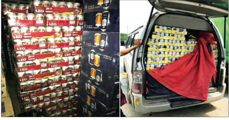
တရားဝင်စာရွက်စာတမ်းအထောက်အထား တစ်စုံတစ်ရာတင်ပြနိုင်ခြင်းမရှိသော Leo Beer နှင့် Singha Beer များ

ကုန်းလမ်း၌ Starex နှင့် Nissan UR Van ယာဉ်တို့အား မုပွလင်ရဲစခန်းမှ တားဆီး၍ မရမ်းချောင့် အမြဲတမ်းစစ် ဆေးရေးစခန်း ပူးပေါင်းစစ်ဆေးရေးအဖွဲ့ ဖြင့် စစ်ဆေးခဲ့ရာ တရားဝင်စာရွက် စာတမ်းအထောက်အထားတစ်စုံတစ်ရာ တင်ပြနိုင်ခြင်းမရှိသော Leo Beer (330ml) (1x24Can) (230)Pkgs, Singha Beer (330ml) (1x24 Can) (230)Pkgs နှင့် သယ်ဆောင် သည့် ယာဉ်နှစ်စီး စုစုပေါင်း ခန့်မှန်း တန်ဖိုး ငွေကျပ် ၂၇ ဒသမ ၆ သန်းခန့် အား တွေ့ရှိ၍ ဖမ်းဆီးခဲ့ကြောင်း သတင်း ရရှိသည်။ (သတင်းစဉ်)