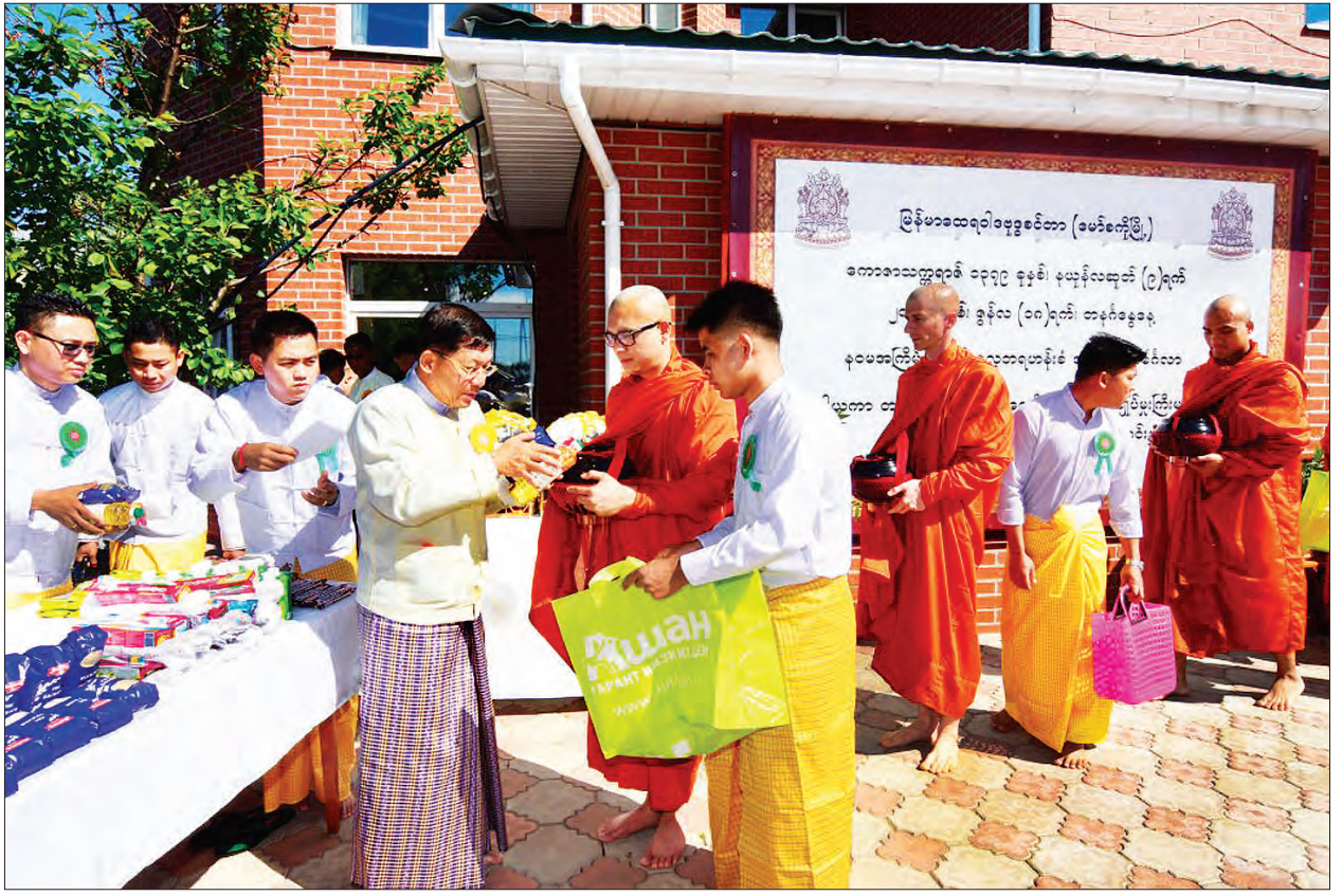
မော်စကိုမြို့ရှိ မော်စကိုပုဒ္ဒဝိဟာရ ဘုန်းတော်ကြီးကျောင်း၌ တတိယအကြိမ် ဒုလ္လဘရဟန်းခံအလှူမင်္ဂလာအခမ်းအနားတွင် တပ်မတော်ကာကွယ်ရေးဦးစီးချုပ် ဗိုလ်ချုပ်မှူးကြီး မင်းအောင်လှိုင် သိမ်ဆင်းလောင်းလှူစဉ် (သတင်းစဉ်)

အဆိုပါ မော်စကိုမြို့ရှိ ပုဒ္ဒဝိဟာရဘုန်းတော်ကြီးကျောင်း၌ ကျင်းပမည့် တတိယ အကြိမ်မြောက် ဒုလ္လဘရဟန်းခံအလှူမင်္ဂလာအခမ်းအနားတွင် ဒုလ္လဘရဟန်းလောင်း များဖြစ်ကြသည့် ရုရှားနိုင်ငံတွင် ပညာသင်ကြားလျက်ရှိသော တပ်မတော်မှ အရာရှိ ခြောက်ဦး၊ ရုရှားနိုင်ငံသား နှစ်ဦးနှင့် ကမ္ဘောဒီးယားနိုင်ငံသား နှစ်ဦးတို့အား ယနေ့ နံနက်ပိုင်းတွင် အဆိုပါဘုန်းတော်ကြီးကျောင်းတွင် ဆံချခြင်း၊ သင်္ကန်းတောင်းခြင်း၊ သရဏသုံးပါးနှင့် ဆယ်ပါးသီလခံယူဆောင်တည်၍ သာမဏေရ ပဉ္စမဂါလာနှင့် ဥပသမ္ပဒမင်္ဂလာများ ကျင်းပပြုလုပ်ခဲ့ကြောင်းနှင့် ယခုနှစ် နွေရာသီကျောင်းပိတ်ရက် တွင် ပညာတော်သင် အရာရှိ ၈၀ ဒုလ္လဘရဟန်းဝတ်မည်ဖြစ်ကြောင်း သတင်းရရှိသည်။ (သတင်းစဉ်)