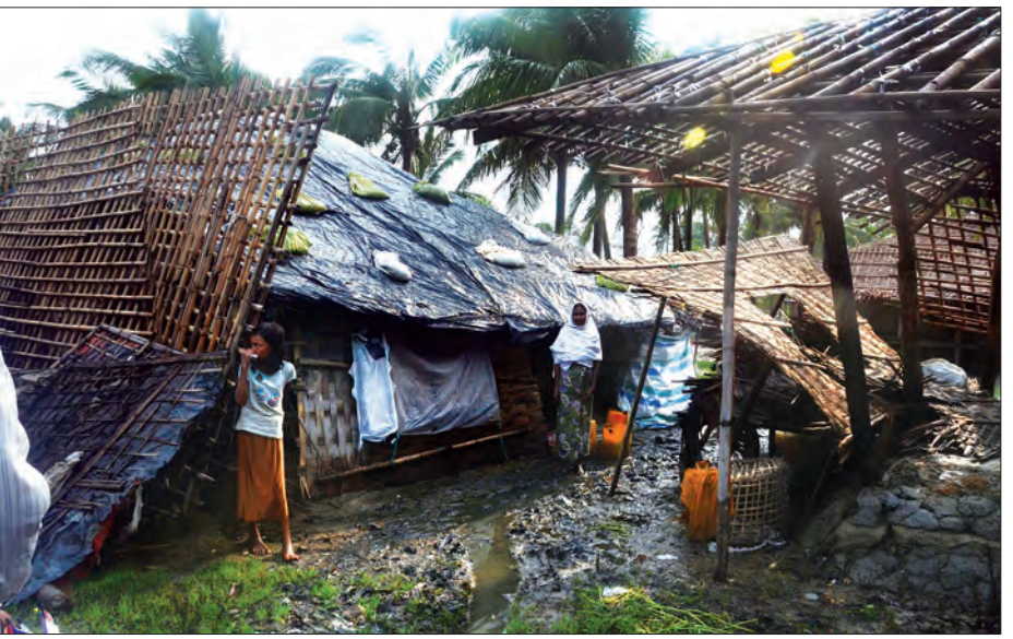
မောင်တောမြို့နယ် ကညင်တန်းကျေးရွာအုပ်စု မောင်နီကျေးရွာရှိ နေအိမ်ပျက်စီးမှုများကို တွေ့ရစဉ်

ကျေးရွာရှိ ကျေးလက်အိမ်ရာများ အမိုးလန်ပျက်စီးမှု၊ လက်ဝဲဘက်ကျေးရွာ မူလတန်းလွန်ကျောင်း ပျက်စီးမှု အခြေအနေနှင့် ကျေးရွာသောက်သုံးရေကန် ပြုပြင်ထိန်းသိမ်းရန် လိုအပ်မှုတို့ကို စစ်ဆေးပြီး မောင်တောမြို့နယ် အုပ်ချုပ်ရေးမှူးရုံး၌ မှီရာမှန်တိုင်းကြောင့် ဒေသတွင်း ပျက်စီးဆုံးရှုံးမှု အခြေအနေများနှင့်စပ်လျဉ်း၍ ဆွေးနွေးကြသည်။ စစ်တမ်းများရယူ ကော်မတီအဖွဲ့ဝင်များသည် ယနေ့နံနက်ပိုင်းတွင် မောင်တောမြို့နယ်ရှိ ကညင်တန်းကျေးရွာအုပ်စုမှ မောင်နီရွာ၊ ကျီးကန်းပြင်ကျေးရွာအုပ်စုမှ အောင်သာယာ၊ အောင်မင်္ဂလာနှင့် မောင်နှမကျေးရွာ