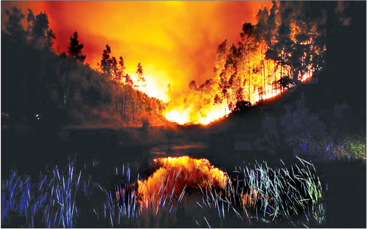
လောင်ကျွမ်းခဲ့သည်။ မီးသတ်ကယ်ဆယ်ရေး အဖွဲ့ဝင်များသည် နိုင်ငံတစ်ဝန်းရှိ နေရာဒေသအများစုတို့တွင် အပူချိန်သည် ၄၀ ဒီဂရီဆဲလ်ဆီးယပ်စ်အထက်ကျော်လွန် လျက်ရှိပြီး မီးလောင်ကျွမ်းမှုဖြစ်ပွားသည့်ဧရိယာ အတွင်း၌ လေပြင်းများတိုက်ခတ်နေခဲ့ခြင်းက မီးတောက်လောင်မှုအခြေအနေကို ပိုမိုဆိုးရွားစေ ခဲ့ကြောင်း သိရသည်။ (ရိုက်တာ)

စနေနေ့က တောမီးလောင်ကျွမ်းမှု သည် လစွာ့စွန်းအရှေ့တောင်ပိုင်းမှ ၂၀၀ကီလိုမီတာအကွာ တောင်ကုန်း ထူထပ်သည့် ဧရိယာတစ်ခုဖြစ်သည့် ပက်ဒရိုဂါအိဉ် ပြင်းထန်သည့်အပူလှိုင်း နှင့်မိုးရွာသွန်းမှုမရှိဘဲ မိုးကြိုးပစ်ခတ်မှု များဖြစ်နေချိန်တွင် အကြီးအကျယ်