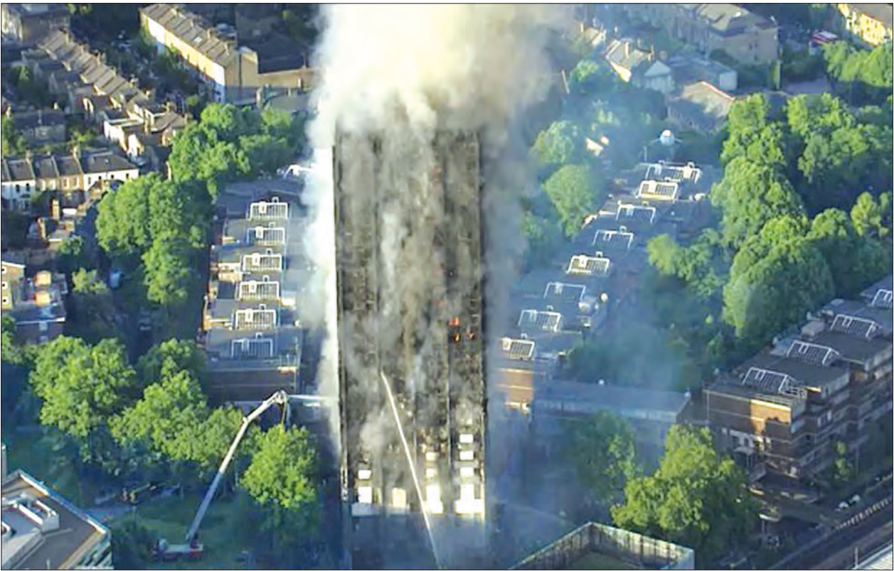
မီးလောင်သည့် ညွှန်ချက်များကြောင့် နီးလာခဲ့သည့် တိုက်ခန်းနေသူများသည် မီးခိုးများဖြင့် ပြည့်နှက်နေသည့် စင်္ကြာ