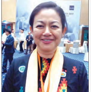
ဒေါက်တာ သက်သက်ခိုင် လွှတ်တော် ကိုယ်စားလှယ်

ဒေါက်တာနေမျိုးထွန်း ဒုတိယညွှန်ကြားရေးမှူးချုပ် နည်းပညာ၊ သက်မွေးပညာနှင့် လေ့ကျင့်ရေးဦးစီးဌာန ဒီနေ့ကျင်းပတဲ့ ညီလာခံဟာ နည်းပညာကဏ္ဍ၊ သက်မွေး ပညာကဏ္ဍတွေနဲ့ပတ်သက်ပြီး နိုင်ငံတကာမှာ ကြုံတွေ့နေ ရတဲ့အခက်အခဲတွေနဲ့ ဖြတ်ကျော်လာခဲ့ရတဲ့ အတွေ့အကြုံ တွေကို မျှဝေကြခြင်းဖြစ်ပါတယ်။ ကျွန်တော်တို့နိုင်ငံဟာ လည်း အာဆီယံဒေသတွင်းမှာပါဝင်တဲ့အတွက် ဒေသတွင်း နိုင်ငံအချင်းချင်း နည်းပညာ၊ သက်မွေးပညာတွေနဲ့ပတ်သက် လို့ အကောင်အထည်ဖော်ဆောင်ရွက်နေတာတွေကို အပြန် အလှန်မျှဝေနေခြင်းလည်း ဖြစ်ပါတယ်။ ဒီစီရိမ်မှာ အဓိကအားဖြင့် အစီအစဉ်ဖော်ပြချက်လုပ်သား