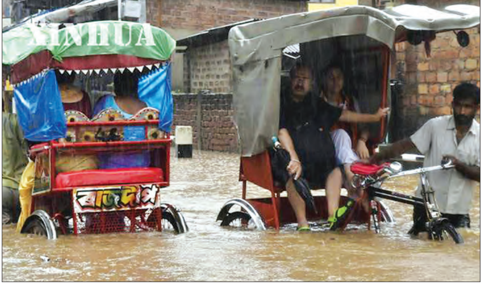
လျှပ်စစ်စီးနေသော ဝိုင်ယာကြိုးနှင့် လန်ချားထိမိသောကြောင့် ဓာတ်လိုက်သေဆုံးခြင်းဖြစ်ကြောင်း၊ ကျန်ရစ်မိသားစုအတွက်နှစ်နာကြေးငွေ ရူပီးလေးသိန်းပေးအပ်သွားမည်ဖြစ်ကြောင်း

အက်ဆမ်ပြည်နယ်မြို့တော် ဂူဝါဟက်တီတွင် ကျောင်းသားငယ်တစ်ဦးနှင့် လန်ချားမောင်းသူတစ်ဦး ဓာတ်လိုက်သေဆုံးခဲ့ကြောင်း သိရသည်။ ရေကြီးနေသောရေယာအတွင်းတွင်