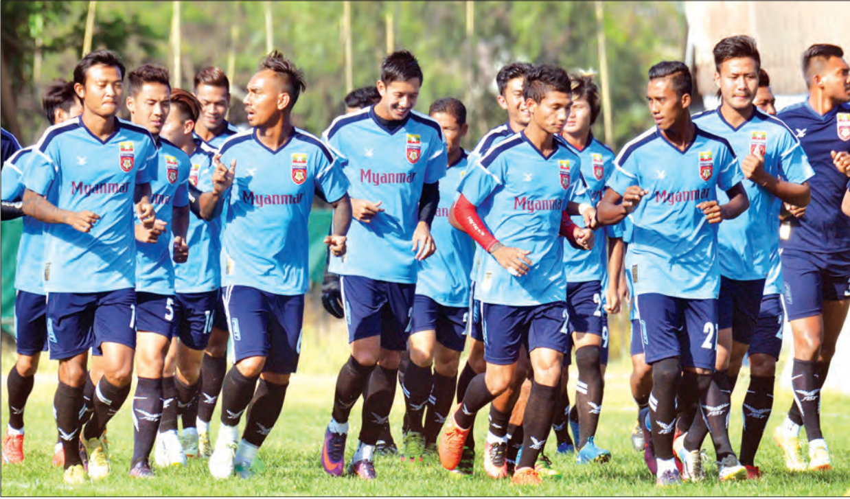
အာရှဖလားတတိယအဆင့် ခြေစစ်ပွဲယှဉ်ပြိုင်နေသည့် မြန်မာ့လက်ရွေးစင်အသင်း