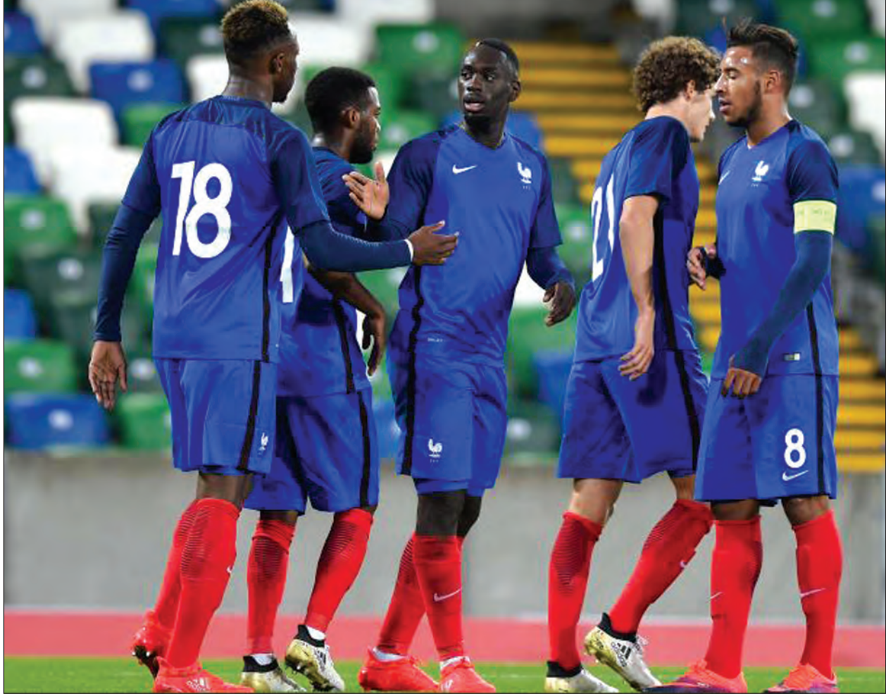
ရောက်လာတဲ့ ပြင်သစ်လူငယ်တွေဟာ အခုပွဲမှာ အီတလီနဲ့ ဆုံတွေ့ရာမှာပို့ ပွဲကျပ်ဖြစ်နေပါတယ်။ ပြင်သစ်တိုက်စစ်မှူး မက်ဆီမင်း၊ အေဂ်ဂတ်စတင်းတို့က ဂိုးသွင်းထက်မြက်သူတွေဖြစ်ပြီး သူဒမ်၊ နီတာ၊ ဟာရစ်နဲ့ ကယ်ရီရာတို့ကလည်း ဂိုးသွင်းနိုင်သူတွေဖြစ်ပါတယ်။ တိုက်စစ်မှူး၊ အေဂ်ဂတ်စတင်းဟာ အခုအချိန်အထိ သုံးဂိုးသွင်းယူထားနိုင်လို့ ဂိုးအများဆုံးသွင်းယူနိုင်သူအဖြစ် မျှော်မှန်းနေပြီဖြစ်ပါတယ်။ အီတလီတို့က အုပ်စု(D)မှာ သုံးပွဲကစားခဲ့ရာမှာ ဥရုဂွေးကို တစ်ဂိုး-ဂိုးမရှိနဲ့ ရှုံးပြီး တောင်ကိုရီးယားအသင်းကို နှစ်ဂိုးပြတ်နဲ့နိုင်ကာ ဂျပန်အသင်းကိုတော့ နှစ်ဂိုးစီသရေပွဲဖြစ်ခဲ့ပါတယ်။ အုပ်စုဒုတိယနဲ့ တက်လာတဲ့ အီတလီမှာတော့ တိုက်စစ်မှူး အော်ဆိုလီနီ၊ ဖာမီလီတို့ရှိနေပြီး ဂိုးသွင်းသေချာသူတွေဖြစ်ပါတယ်။ ဒါပေမယ့် တိုက်စစ်ထက်မြက်ပြီး ခံစစ်လုံခြုံတဲ့ ပြင်သစ်ကိုတော့ အသာစီးရယူဖို့ မလွယ်တာမို့ ပြင်သစ်တို့ပဲ ကွာတားတက်ရောက်ဖို့ အခွင့်အရေးများနေတာတော့ အမှန်ပါပဲ။

အုပ်စု(E)မှာတော့ ပြင်သစ်တို့ သုံးပွဲကစားခဲ့ရာမှာ ဟွန်ဒူးရပ်စ်ကို သုံးဂိုးပြတ်နဲ့ နိုင်ခဲ့သလို ဝီယက်နမ်ကိုလည်း လေးဂိုးပြတ်အနိုင်ယူကာ နယူးဇီလန်ကိုလည်း နှစ်ဂိုးပြတ်အနိုင်ယူခဲ့တာမို့ ရှုံးပွဲမရှိခဲ့ပါဘူး။ ၁၆ သင်းအဆင့်ကို ရှုံးပွဲမရှိ၊ ဝေးဂိုးမရှိနဲ့ တက်