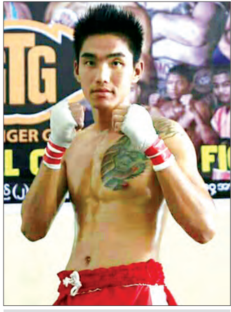
ဆလင်းချမ်းမြေ့ကို (ထွန်းသွင်)

သတင်း- မောင်စိန်လွင်(မြန်မာ့အလင်း)