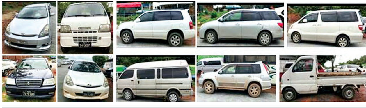
တရားဝင်စာရွက်စာတမ်း အထောက်အထားတစ်စုံတစ်ရာတင်ပြနိုင်ခြင်းမရှိသည့် Toyota Crown၊ Toyota Alphard၊ Suzuki Carry၊ Nissan Elgrand၊ Nissan X-Trail၊ Toyota Kluger၊ Nissan Wingroad၊ Diahatsu Hijet၊ Toyota Hiace၊ Toyota Wish တို့ကို တွေ့ရစဉ်

တားဆီးမှု ၁၆ မှု ခန့်မှန်းတန်ဖိုး ငွေကျပ် ၁၄၇ ဒသမ ၅၄ သန်းခန့်အား ဖမ်းဆီးခဲ့ကြောင်း သိရသည်။ ထူးခြားဖမ်းဆီးမှုအနေဖြင့် မေ ၃၀ ရက်တွင် မြဝတီမှ ရန်ကုန်သို့သွားရောက်မည့် Toyota Crown တစ်စီး၊ Toyota Alphard နှစ်စီး၊ Suzuki Carry တစ်စီး၊ Nissan Elgrand တစ်စီး၊ Nissan X-Trail တစ်စီး၊ Toyota Kluger နှစ်စီး၊ Nissan Wingroad တစ်စီး၊ Diahatsu Hijet တစ်စီး၊ Toyota Hiace တစ်စီးနှင့် Toyota Wish သုံးစီးတို့အား မရမ်းချောင့် အမြဲတမ်းစစ်ဆေးရေးစခန်း ပူးပေါင်းစစ်ဆေးရေးအဖွဲ့က တားဆီးစစ်ဆေးခဲ့ရာ တရားဝင်စာရွက်စာတမ်းအထောက်အထား တစ်စုံတစ်ရာ တင်ပြနိုင်ခြင်းမရှိသဖြင့် အဆိုပါယာဉ် ၁၄ စီး စုစုပေါင်း ခန့်မှန်း တန်ဖိုး ငွေကျပ် ၄၆ သန်းခန့်အား တွေ့ရှိ၍ ဖမ်းဆီးခဲ့ကြောင်း သိရသည်။ (သတင်းစဉ်)