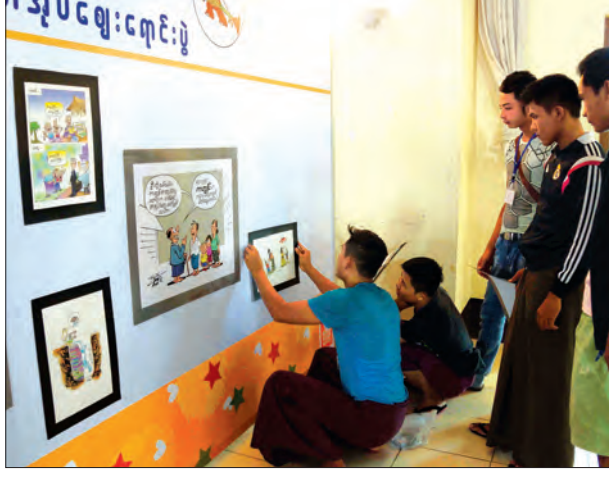
ကလေးစာပေပွဲတော်တွင် ခင်းကျင်းပြသရန် ပြင်ဆင်နေမှုကိုတွေ့ရစဉ်

ကလေးစာပေပွဲတော်ကြီးတွင် မြန်မာနိုင်ငံ စာပေထုတ်ဝေသူနှင့် မြန်မာ့သုတေသနအသင်းမှ တာဝန်ရှိသူများက ပွဲတော်သို့လာရောက်သည့် ကလေးငယ် များ၊ ကျောင်းသား ကျောင်းသူများနှင့် စာပေချစ်မြတ်နိုးသည့် မိဘပြည်သူ များအား စာအုပ်စာစောင်များကို ဈေးနှုန်းချိုသာစွာဖြင့် ဝယ်ယူနိုင်ရန် အတွက် စာအုပ်ဆိုင်ပေါင်း ၆၀ ကို ခင်းကျင်းဖွင့်လှစ်၍ ကူညီဆောင်ရွက် ပေးလျက်ရှိကြောင်း သိရသည်။ အောင်မင်းဟန်