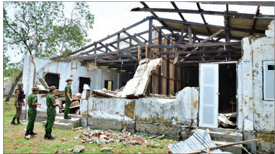
ဒုတိယတပ်မတော်ကာကွယ်ရေးဦးစီးချုပ် နယ်မြေခံတပ်အတွင်း ပျက်စီးမှုများကို ကြည့်ရှုစစ်ဆေးစဉ်

ချုပ် ကာကွယ်ရေးဦးစီးချုပ်(ကြည်း) ဒုတိယဗိုလ်ချုပ်မှူးကြီး စိုးဝင်းသည် အဖွဲ့ဝင်များနှင့်အတူ ယနေ့နံနက်ပိုင်းတွင် ဆိုင်ကလုန်းမုန်တိုင်း မိုရာ၏အရှိန်