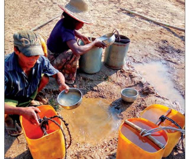
အတွက် ရေလျှပ်အိမ်လိုပါက လည်း ကောင်း၊ စက်ရေတွင်း လျှပ်အိမ်လိုပါက လည်းကောင်း ဖုန်း- ၀၉၂၀၄၃၀၀၂ သို့ ဆက်သွယ်လျှောက်ထားနိုင်ကြောင်း သိရ သည်။