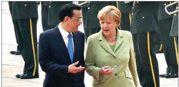
တရုတ်နိုင်ငံသို့ အလည်အပတ်ရောက်ရှိလာသော ဂျာမနီဝန်ကြီးချုပ် အိန်ဂျလာ မာကယ်အား တရုတ်ဝန်ကြီးချုပ် လီက ၂၀၁၄ခုနှစ် ဇူလိုင် ၇ ရက်က ကြိုဆိုခဲ့စဉ် (လီသည် ဂျာမနီနှင့် ဘယ်လ်ဂျီယံနိုင်ငံများသို့ တရားဝင်ခရီးစဉ်သွားရောက်ရန် ပေကျင်းမှ မေ ၃၁ ရက်တွင် ထွက်ခွာခဲ့သည်။ ဂျာမနီနိုင်ငံ ဘာလင်မြို့တွင် လီသည် အိန်ဂျလာမာကယ်နှင့်တွေ့ဆုံမည်ဖြစ်သည်။)

လီသည် ၎င်း၏ဘယ်လ်ဂျီယံခရီးစဉ်အတွင်း ဥရောပကောင်စီဥက္ကဋ္ဌ ဒေါ်နယ်တပ်စ်၊ ဥရောပကော်မရှင်ဥက္ကဋ္ဌ ဂျိန်းကလော်ဒီဂျန်ကာတို့နှင့်အတူ (၁၉) ကြိမ်မြောက် တရုတ်-ဥရောပခေါင်းဆောင်များအစည်းအဝေးကို ကျင်းပသွားမည် ဖြစ်ကြောင်း သိရသည်။