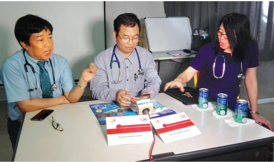
ဆောင်ရွက်သကဲ့သို့ လေ့ကျင့်နိုင်မည်ဖြစ်ပြီး မြန်မာနိုင်ငံနုလုံးသွေးကြောချဲ့ပညာရှင်များအဖွဲ့၏ အလုပ်ရုံဆွေးနွေးပွဲကို ရန်ကုန်၊ မန္တလေး၊ နေပြည်တော်တို့၌ တစ်လှည့်စီပြုလုပ်လျက် ရှိရာ ယခု မန္တလေးတွင် စတုတ္ထအကြိမ် ပြုလုပ်ခြင်းဖြစ်ကြောင်း သိရသည်။ မင်းထက်အောင် (မန်းကိုယ်ပွား)

အဆိုပါ အလုပ်ရုံဆွေးနွေးပွဲ၌ သင်ကြားပို့ချချက်များကို သင်ထောက်ကူအရပ်များဖြင့် လူနာများကို မိမိတို့ ကိုယ်တိုင်