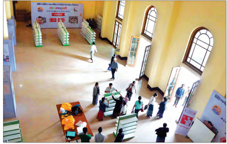
ကလေးစာပေပွဲတော်ကျင်းပရန် တောင်ကြီးတက္ကသိုလ်အဆောက်အအုံအတွင်း ပြင်ဆင်ဆောင်ရွက်နေမှုကိုတွေ့ရစဉ်

ပြန်ကြားရေးဝန်ကြီးဌာန၊ ပညာရေး ဝန်ကြီးဌာနနှင့် ရှမ်းပြည်နယ်အစိုးရ အဖွဲ့တို့ ပူးပေါင်းကျင်းပမည့် ကလေး စာပေပွဲတော်ကို ဇွန် ၂ ရက်မှ ၄ ရက် အထိ တောင်ကြီးမြို့၊ တောင်ကြီး တက္ကသိုလ် (ဘက်စုံခန်းမ) အဆောက် အအုံ၌ ကျင်းပမည်ဖြစ်သည်။ ကလေးစာပေပွဲတော် ကျင်းပမည့် တောင်ကြီး တက္ကသိုလ် (ဘက်စုံခန်းမ) အဆောက်အအုံ၌ သက်ဆိုင်ရာ ပြခန်းများအလိုက် ခင်းကျင်းပြသနိုင် ရန်အတွက် ကြိုတင်ပြင်ဆင်မှုလုပ်ငန်း များကို ယနေ့ နံနက်ပိုင်းမှစတင်၍ ဆောင်ရွက်လျက်ရှိသည်။ ကလေးစာပေပွဲတော်၏ အဓိက ရည်ရွယ်ချက်ဖြစ်သည့် ကလေးစာပေ များ ခင်းကျင်းပြသနိုင်ရန်အတွက် စာအုပ်စင်များနှင့် ဆရာကြီးမင်းသုဝဏ် ၏ စာပေမှတ်တမ်း၊ စာအုပ်များနှင့် ဓာတ်ပုံပြခန်းကို တက္ကသိုလ်ခန်းမထဲ တွင် ပြသနိုင်ရန်အတွက် ပြန်ကြား ရေးနှင့် ပြည်သူ့ဆက်ဆံရေးဦးစီး ဌာနမှဝန်ထမ်းများက ပြင်ဆင်ဆောင် ရွက်မှုများ စတင်ဆောင်ရွက်လျက် ရှိသည်။ ကလေးစာပေပွဲတော်ကို ကလေး များ၏ ဉာဏ်ရည်ဉာဏ်သွေးနှင့် အတွေးအခေါ်အယူအဆများ ထက်မြက်