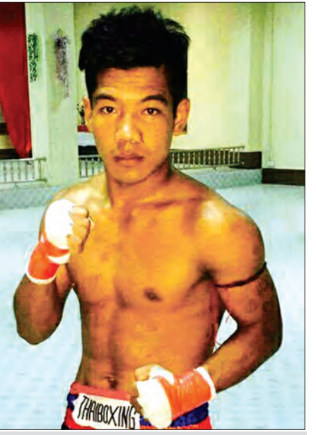
ဟံသာဝတီသား (အဖြူရောင်သွေးသစ်)