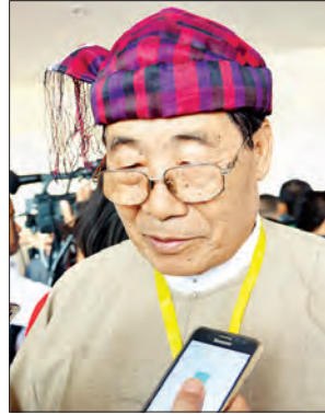
ဒေါက်တာ တူးဂျာ