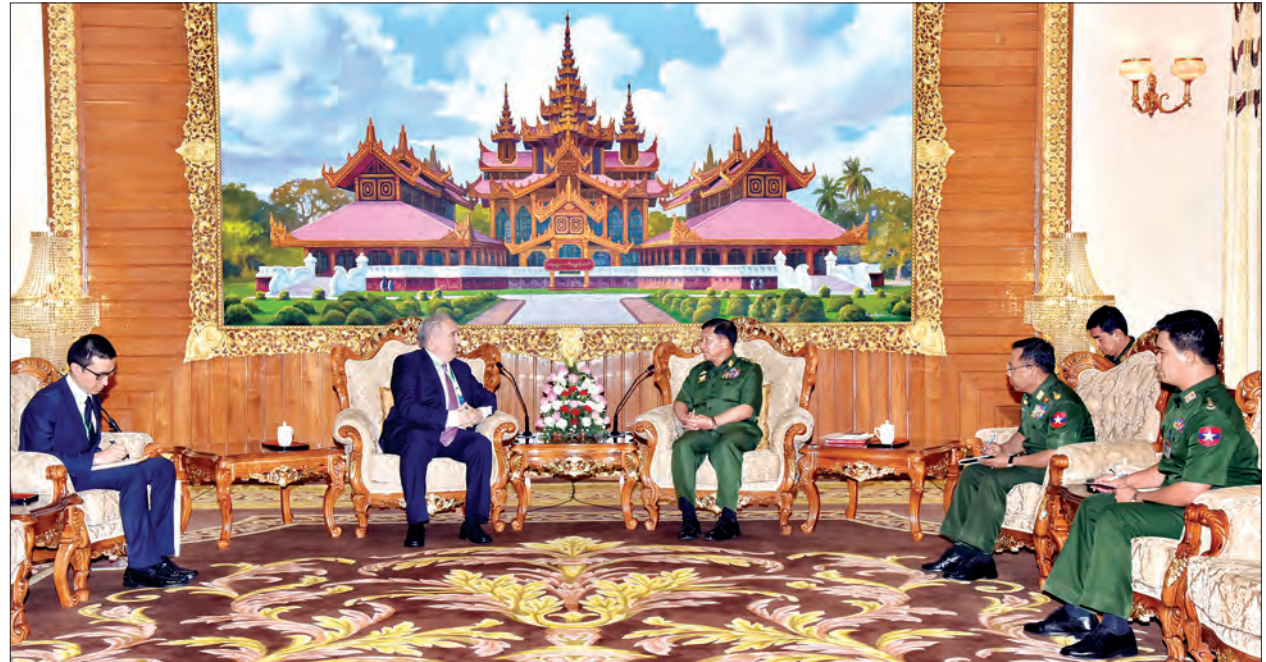
တပ်မတော်ကာကွယ်ရေးဦးစီးချုပ် ဗိုလ်ချုပ်မှူးကြီး မင်းအောင်လှိုင်နှင့် တူရကီနိုင်ငံ သံအမတ်ကြီး H.E.Mr. Kerem Divanlioglu တို့ တွေ့ဆုံဆွေးနွေးစဉ် (သတင်းစဉ်)

ရွက်ရာတွင် ရင်ဆိုင်နေရသည့် အကြမ်းဖက်မှုကိစ္စရပ်များ၊ နိုင်ငံ၏လုံခြုံရေး၊ ဒီမိုကရေစီရေးနှင့် ဖွံ့ဖြိုးတိုးတက်မှုများ လုပ်ဆောင်ရာတွင် ပြင်ပပယောဂဝင်လာပါက အခက်အခဲများတွေ့ရှိနိုင်မှုအခြေအနေများကို ဆွေးနွေးသည်။ တပ်မတော်ကာကွယ်ရေး ဦးစီးချုပ်က မြန်မာနိုင်ငံနှင့် တူရကီနိုင်ငံသည် အလှမ်းကွာဝေးသော်လည်း မိတ်ဆွေနိုင်ငံများဖြစ်ကြောင်း၊ ရှေးယခင်တူရကီအင်ပါယာမှာ များစွာကြီးမားကျယ်ပြန့်ပြီး ယဉ်ကျေးမှုအရ၊ နည်းပညာအရ၊ စီးပွားရေးအရ မြင့်မားသည်ကို လေ့လာသိရှိရပါကြောင်း၊ လက်ရှိအခြေအနေတွင်လည်း နှစ်နိုင်ငံပူးပေါင်း ဆောင်ရွက်မှုနှင့်ပတ်သက်၍ နယ်ပယ်များစွာရှိကြောင်း၊ တချို့ စီးပွားရေးပူးပေါင်းဆောင်ရွက်မှုများတွင် နောက်ကွယ်မှ ကိစ္စရပ်များ ပါဝင်မှုများရှိနေသည်ကို တွေ့ရှိရ၍ သိရှိလုပ်ဆောင်ရန်လိုအပ်ကြောင်း၊ အကြမ်းဖက်မှုကာကွယ်တားဆီးရေးလုပ်ငန်းများမှာလည်း တစ်နိုင်ငံတည်း လုပ်ဆောင်၍မရသဖြင့် တပ်မတော်နှစ်ရပ်အကြား အကြမ်းဖက်မှုဆိုင်ရာများတွင် အပြန်အလှန်သတင်းဖလှယ်ရယူ၍ ပူးပေါင်းဆောင်ရွက်နိုင်ကြောင်း၊ နှစ်နိုင်ငံတပ်မတော်နှစ်ရပ်