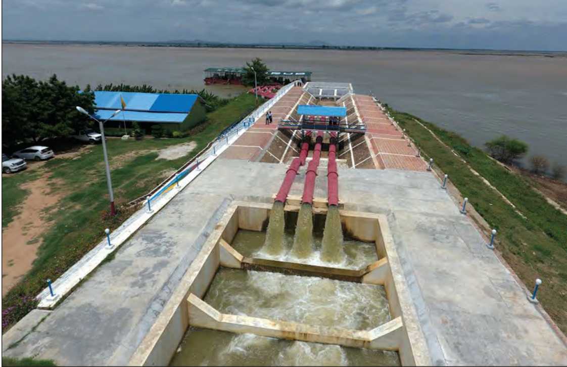
ဧရာဝတီမြစ်ကမ်း မြစ်ရေတင်တစ်ခုမှ ရေများတင်ပေးနေစဉ်

မြင်းခြံ မေ ၃၀ မန္တလေးတိုင်းဒေသကြီး မြင်းခြံခရိုင်တွင် ၂၀၁၆-၂၀၁၇ ဘဏ္ဍာနှစ်အတွင်း မြစ်ရေတင်ကြီးကိုခွင့်ဆောင်ရေတင်နှစ်ခုမှ ရေများဖြင့် စပါးအပါအဝင် သီးနှံစိုက်ဧက ၁၃၈၀၀ နီးပါး စိုက်ပျိုးရန် လျာထားခဲ့သော်လည်း လျာထားဧကထက် လျော့နည်း၍ ၁၅၀၀၀ ကျော်သာ စိုက်ပျိုးရေ ပေးဝေနိုင်ခဲ့ကြောင်း သိရသည်။