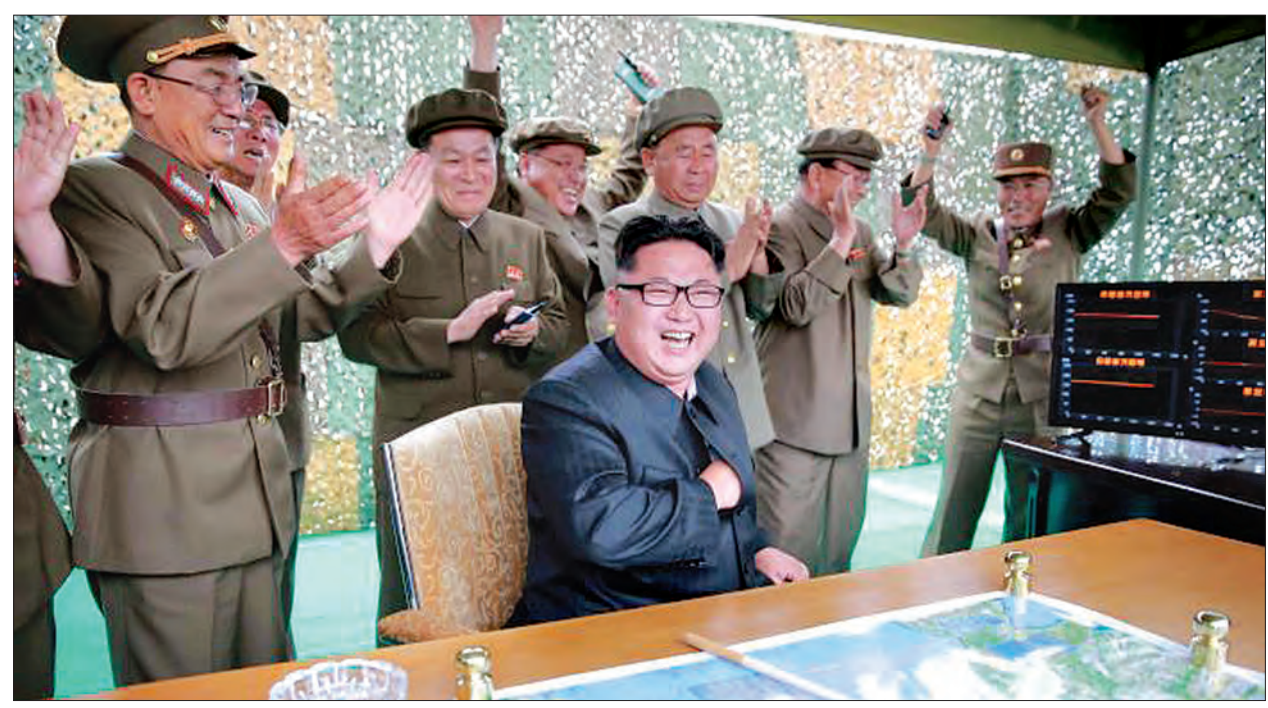
၂၀၁၆ ခုနှစ် ဇွန်လက Hwasong-10 တာလတ်ပစ်ခံဒုံးကျည်စမ်းသပ်မှုအတွင်း မြောက်ကိုရီးယားခေါင်းဆောင် ကင်ဂျုံအမ်းအားတွေ့ရစဉ်

ပြုယမ်း မေ ၃၀ မြောက်ကိုရီးယားခေါင်းဆောင် ကင်ဂျုံအမ်းသည် တိုက်ချင်းပစ်ခံဒုံးကျည်စမ်းသပ်မှုကို ကြီးကြပ်ခဲ့ပြီးနောက်တွင် မဟာဗျူဟာမြောက်ပြီး စွမ်းအားကြီးမားသည့်လက်နက်များကို ပိုမိုထုတ်လုပ်ရန် အမိန့်ပေးအပ်လိုက်ကြောင်း မြောက်ကိုရီးယားနိုင်ငံပိုင် ကိုရီးယားဗဟိုသတင်းအေဂျင်စီက အင်္ဂါနေ့ သတင်းတွင် ဖော်ပြခဲ့သည်။ တနင်္လာနေ့က စမ်းသပ်ပစ်ခံဒုံးကျည်စမ်းသပ်မှုသည် ယခင်ထုတ်လုပ်ခဲ့သည့် ဘားရှင်းဖြစ်သည့် ဟွာဆောင်းဒုံးကျည်နှင့်ယှဉ်လျှင် နည်းပညာအဆင့်မြင့်တင်ထားပြီး လူအစားစက်ကို အစားထိုးသုံးကာ ကြိုတင်ပစ်ခတ်နိုင်သည့် အစီအစဉ် တပ်ဆင်ထားကြောင်း ကိုရီးယားဗဟိုသတင်းအေဂျင်စီက ဖော်ပြထားသည်။ မြောက်ကိုရီးယားက စမ်းသပ်ပစ်ခံဒုံးကျည်စမ်းသပ်မှုသည် တာလတ်ပစ်ခံဒုံးကျည်သည် မြောက်ကိုရီးယား အရှေ့ဘက်ကမ်းရိုးတန်းပေါ်တွင် ကျရောက်ခဲ့ပြီး ယင်းပစ်ခတ်မှုသည် နိုင်ငံတကာက ဖိအားပေးမှုများနှင့် ပိတ်ဆို့မှုများ ပိုမိုကျရောက်လာမည့် ခြိမ်းခြောက်မှုများကို စိန်ခေါ်လိုက်သည့် မြန်နှုန်းမြင့် ဒုံးကျည်စမ်းသပ်မှုဖြစ်သည်ဟု ဆိုသည်။ မြောက်ကိုရီးယားခေါင်းဆောင်က မြောက်ကိုရီးယားနိုင်ငံကို အမေရိကန်၏ ရန်မှကာကွယ်သွားနိုင်ရန်အတွက် စွမ်းအားကြီးမားသည့် လက်နက်အမြောက်အမြားကို အချိန်နှင့်တစ်ပြေးညီ ကြိမ်ဖန်များစွာ ပိုမိုထုတ်လုပ်သွားမည်ဖြစ်ကြောင်း ပြောကြားခဲ့သည်။ မြောက်ကိုရီးယားသည် အမေရိကန်က ပြုလုပ်လျက်ရှိသည့် စစ်ရေးလေ့ကျင့်မှုနှင့်ဆိုင်သည့် စစ်ပွဲအတွက်ဟန်ပြင်နေမှုအဖြစ် မှတ်ယူလျက်ရှိသည်။ (ရိုက်တာ)