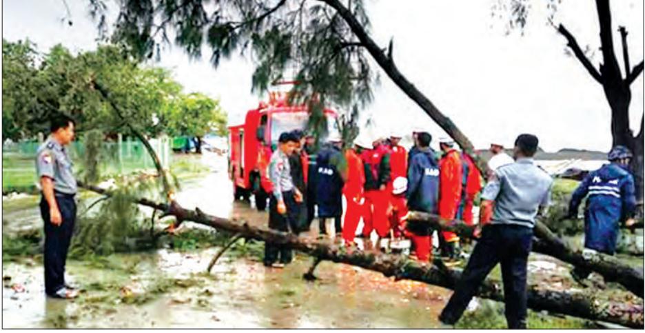
စစ်တွေမြို့၌ လေဘေးကြောင့် အပျက်အစီးများကို ရှင်းလင်းစဉ်

မေ ၂၉ ရက်နှင့် ၃၀ ရက်တို့တွင် တိုက်ခတ်ခဲ့သော မိုရာ ဆိုင်ကလုန်းမုန်တိုင်းသည် ရခိုင်ပြည်နယ်အနှံ့ လေပြင်းများ ဖြစ်ပေါ်ခဲ့ရာ မုန်တိုင်းစက်ကွင်းအဝန်းအပိုင်းတွင် ကျရောက်သော ရခိုင်ပြည်နယ် မြောက်ပိုင်းမြို့နယ်များအနက် စစ်တွေမြို့နယ်တွင် မုန်တိုင်းဒဏ်ကြောင့် ပျက်စီးဆုံးရှုံးမှုများစွာရှိနေပြီး ကယ်ဆယ်ရေးစခန်းများ၌ လေဘေးဒုက္ခသည် ၃၀၀ ကျော် ရောက်ရှိနေကြောင်း သိရသည်။ မိုရာ ဆိုင်ကလုန်းမုန်တိုင်းသည် ဘင်္ဂလားပင်လယ်အော်ထဲတွင် ရက်အနည်းငယ် အရှိန်ယူခဲ့ပြီး မေ ၂၉ ရက်ည ၁၀ နာရီခန့်တွင် စစ်တွေမြို့အနီးမှ ဖြတ်သန်းရာ မုန်တိုင်းစက်ကွင်းလေရှိန်ကြောင့် စစ်တွေမြို့တွင် လေထန်စပြုလာပြီး လျှပ်စစ်မီးပြတ်တောက်သွားသည်။ လေသည် တစ်စတစ်စပြင်းထန်လာပြီး ညသန်းခေါင်ကျော်လာသည်နှင့် ပိုမိုပြင်းထန်လာကာ စစ်တွေမြို့၏ မြေခံမိုပိုင်းဖြစ်သော ရွှေပြား၊