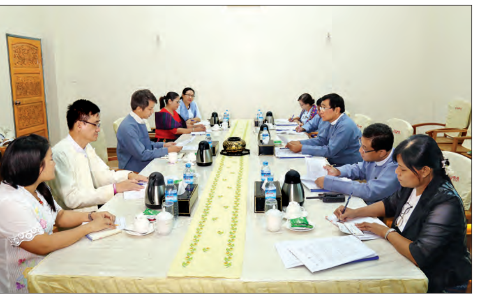
ပြည်ထောင်စုဝန်ကြီး ဒေါက်တာဝင်းမြတ်အေးနှင့် ပူးပေါင်းလုပ်ငန်းစဉ်အဖွဲ့ (Joint Strategy Team - JST) မှ တာဝန်ရှိသူ တို့ တွေ့ဆုံဆွေးနွေးစဉ်

ပေးရေး၊ လူသားချင်းစာနာမှု အကူအညီ များပေးအပ်ရေးအတွက် နိုင်ငံတော်နှင့် ဒေသခံအဖွဲ့အစည်းများ ပေါင်းစပ်ညှိနှိုင်း ဆောင်ရွက်ပေးရေးတို့ကို တင်ပြခဲ့ပြီး ဝန်ကြီးဌာနတက်မှလည်း တိုက်ပွဲရှောင် စခန်းများအတွက် လူသားချင်းစာနာ ကူညီမှု၊ အသက်မွေးဝမ်းကျောင်းပညာ ရပ်များ သင်ကြားပေးမှု၊ ဥပဒေနှင့်အညီ ကလေးသူငယ် အခွင့်အရေး၊ အမျိုးသမီး အခွင့်အရေး၊ သက်ကြီးရွယ်အို အခွင့် အရေး၊ မသန်စွမ်းသူများ အခွင့်အရေး စသည်ဖြင့် ထိခိုက်အားနည်းလွယ်သူများ အတွက် ကာကွယ်စောင့်ရှောက်ရေး လုပ်ငန်းများ ဆောင်ရွက်ပေးမှုတို့ကို ရှင်းလင်းဆွေးနွေးပြီး အဖွဲ့၏ တင်ပြချက် များအပေါ် ကူညီဆောင်ရွက်ပေးရေးနှင့် ငြိမ်းချမ်းရေးလုပ်ငန်းစဉ်များတွင်လည်း အားလုံးပူးပေါင်း ပါဝင်ဆောင်ရွက်ကြရန် ဆွေးနွေးခဲ့ကြသည်။ (သတင်းစဉ်)