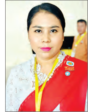
မိကွန်ချမ်း

ထိုကဲ့သို့ ဂုဏ်ယူဖွယ်ရာကောင်းလှသည့် အောင်မြင်မှုများ ရရှိခဲ့မှုနှင့်အတူ ပြည်ထောင်စုငြိမ်းချမ်းရေးညီလာခံ (၂၁)ရာစုပင်လုံ ဒုတိယအစည်းအဝေး နောက်ဆုံးနေ့တွင် တက်ရောက်လာသူအချို့၏ သဘောထားအမြင်နှင့် ရင်တွင်း စကားသံများကို ထုတ်နုတ်ဖော်ပြရလျှင် -