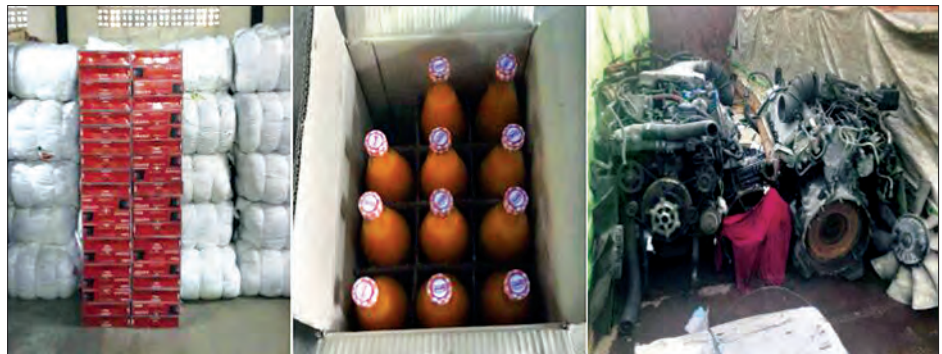
တရားမဝင် စာရွက်စာတမ်းအထောက် အထားတစ်စုံတစ်ရာတင်ပြနိုင်ခြင်းမရှိ သည့် လှည်းကုန်၊ စားသောက်ကုန်နှင့် မော်တော်ယာဉ် အစိတ်အပိုင်းများ

ခန့်မှန်းတန်ဖိုးငွေကျပ် ၁၀ ဒသမ ၄၃၉၆ သန်းခန့် စုစုပေါင်းတားဆီးမှု ၁၄ မှု၊ ခန့်မှန်းတန်ဖိုး ငွေကျပ် ၁၃၃ ဒသမ ၈၃၉၆ သန်းခန့်အား ဖမ်းဆီးရမိခဲ့ကြောင်း သတင်းရရှိသည်။ အလားတူ ထူးခြားဖမ်းဆီးမှုအနေ ဖြင့် မေ ၂၆ ရက်တွင် မြဝတီမှ ရန်ကုန်သို့ သွားရောက်မည့် ၁၂ ဘီးယာဉ် ခြောက်စီး အား ရန်ကုန်မြို့အဝင်အမှတ် (၂)လမ်းမ ကြီး၌ အကောက်ခွန်ဦးစီးဌာန (ရုံးချုပ်) အထူးကင်းအဖွဲ့က ရှောင်တခင်စစ်ဆေး ခဲ့ရာ တရားဝင်စာရွက်စာတမ်း အထောက်အထား တစ်စုံတစ်ရာ တင်ပြနိုင်ခြင်းမရှိသည့် Queen အချိုရည် (1x12) (150) Pkgs, ဘေထုပ် (1 x 48kg) (330)Pkgs, 19" Monitor (100)Pcs, Scanner (40)Pcs, ကွမ်းစားဆေး (240) Pkgs, Rice Cooker (1x4) (50) Pkgs, ကော်ကုန်ကြမ်း (1x100Kg) (30) Drums, Charger Controller Auto Equalizer (1)U, Nissan Diesel Engine with Gear Box(Used) (1)U, Nissan Diesel Engine (Used) (1)U, Cycle Tyre (1200)U, Cotton Fabric, Women Sarong စုစုပေါင်း 927 kg နှင့် သယ်ဆောင်သည့် ယာဉ်ခြောက်စီး စုစုပေါင်း ခန့်မှန်း တန်ဖိုးငွေကျပ် သန်း ၃၀၀ခန့်အားတွေ့ရှိ၍ ဖမ်းဆီးခဲ့ကြောင်း သတင်းရရှိသည်။ (သတင်းစဉ်)