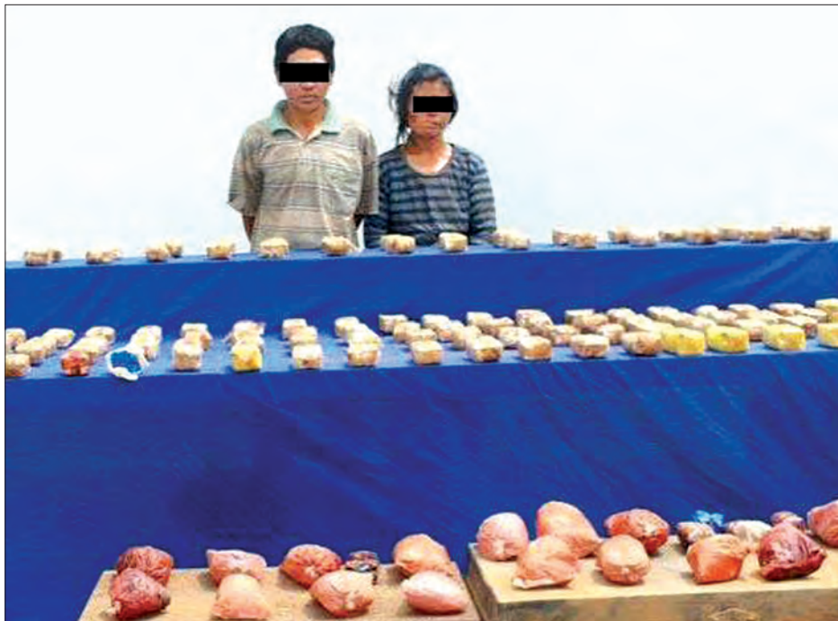
သည့် ပန်းရောင်အမှုန့် အလေးချိန် ၁၂ ဒဿမ ၈၄)ကီလိုခန့်၊ စိတ်ကြွေးသွပ်ဆေးပြား ပြုလုပ်ရန် အသင့်ရေစပ်ထား နှစ်ကီလိုခန့်ပါ တစ်ထုပ်တို့အား ရှာဖွေတွေ့ရှိခဲ့ပြီး မူးယစ်ဆေးဝါးများနှင့်အတူ ဖမ်းဆီးရမိသူ အားကျွေးနှင့် မာထုတို့အား တာချီလိတ်မြို့မရဲစခန်းက အရေးယူဆောင်ရွက်ထားကြောင်း သိရသည်။

တာချီလိတ်မြို့နယ် လွယ်တော်ခမ်းအုပ်စု ပါခါးကျေးရွာအနီးရှိ လက်ဖက်ခြံအား တာချီလိတ်တပ်နယ်မှ တပ်မတော်သားများနှင့် မူးယစ်တစ်ဖွဲ့စု တပ်ဖွဲ့ဝင်များ ပါဝင်သည့် ပူးပေါင်းအဖွဲ့က မေ ၂၉ ရက်တွင် ဝင်ရောက်ရှာဖွေရာ မြေကျင်းအတွင်း မြှုပ်ထားသော သံသေတ္တာနှစ်လုံးအတွင်းမှ စုစုပေါင်း ကာလတန်ဖိုးငွေကျပ် သိန်းပေါင်း ၄၀၇၆ တန်ဖိုးရှိ စိတ်ကြွေးသွပ်ဆေးပြားများ ရှာဖွေတွေ့ရှိခဲ့ကြောင်း သိရသည်။