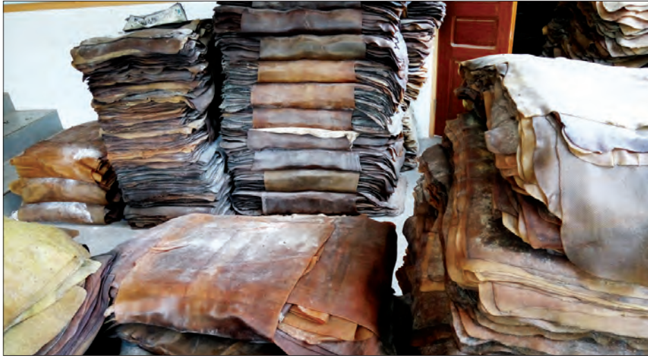
သုဝဏ္ဏတီ မေ ၃၀

မွန်ပြည်နယ်အတွင်းရှိ ရော်ဘာဈေးကွက်သည် ယခုနှစ်အတွင်း ရော်ဘာတစ်ပေါင်လျှင် ငွေကျပ် ၁၃၀၀ အထိ ဈေးကောင်းရရှိခဲ့သော်လည်း သင်္ကြန်လွန်ကာလများမှ စတင်၍ ဈေးများဆက်တိုက်ကျဆင်းလာခဲ့ကြောင်း၊ ယခုပေါက်ဈေးအတိုင်း ရောင်းဝယ်နေကြသူများရှိသကဲ့သို့ ရော်ဘာဈေးပြန်တက်လာသောအခါ ရော်ဘာပြားများ သိုလှောင်၍ စောင့်မျှော်နေကြသူများလည်း ရှိကြောင်း သိရသည်။ သထုံမြို့နယ် သုဝဏ္ဏတီမြို့ အနီးပတ်ဝန်းကျင်ကျေးရွာများ၌ မေ ၂၈ ရက်က ရော်ဘာပေါက်ဈေးနှုန်းများမှာ (ဒေသအခေါ်) ရော်ဘာပေါက်တစ်ပေါင် ငွေကျပ် ၈၄၀ နေလှန်း တစ်ပေါင် ငွေကျပ် ၈၂၀ နေလှန်း တစ်ပေါင် ငွေကျပ် ၇၂၀ မှ ငွေကျပ် ၈၀၀ အထိ အဆုတ်တုံးတစ်ပေါင်