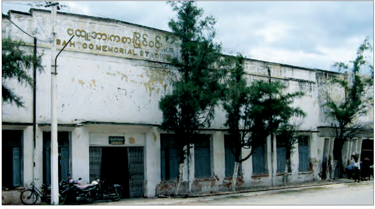
၂၀၀၀ ပြည့်ဝန်းကျင်က ပထူးအားကစားပြိုင်ဝင်း

မှန်းတွဲပွဲ လောင်းကစားတစ်မျိုးကို ကိုယ်လက်ကြံ့ခိုင်ရေးကောင်စီဆရာများ ထွင်လိုက်သောအခါ အများဆဲ၊ တအားဆဲ၊ သောက်ကျိုးနည်းဆဲကုန်ကြတော့သည်။ ယခုသော်မှန်းတွဲပွဲ၏ အမွေဆိုး ‘အဆဲ’ သည် ပထူးကွင်းတွင် မင်းမူလျက်ရှိနေပေပြီ။ ခွန်အားမွေးပြီး ကျွမ်းကျင်မှုလေ့ကျင့်ကာ အစွမ်းကုန် ယှဉ်ပြိုင်ကြရသည့် အားကစားစိတ်ဓာတ်မွေးမြူရာ ပထူးကွင်းသည် ယခုသော် အစွမ်းကုန်ဆဲရေးရာ