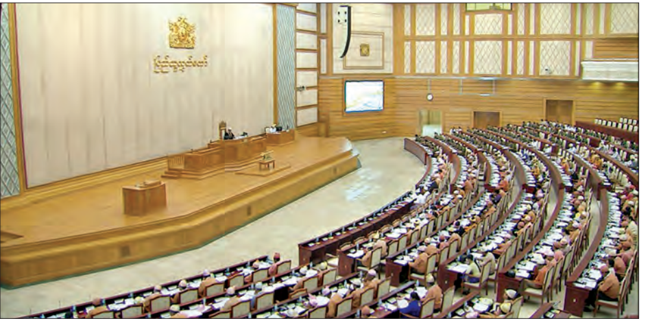
ဒုတိယအကြိမ် ပြည်သူ့လွှတ်တော် ပဌမပုံမှန်အစည်းအဝေး ဆဋ္ဌမနေ့ ကျင်းပနေစဉ်

အဆိုနှင့်စပ်လျဉ်း၍ အဂတိလိုက်စားမှုတိုက်ဖျက်ရေးကော်မရှင်ဥက္ကဋ္ဌ ဦးမြဝင်းက ဝန်ထမ်းများက ပြည်သူ့လူထုကို ရုံးဌာနများသို့ အကြိမ်ကြိမ်ချိန်းဆိုကာ အချိန်ဆွဲ စိတ်အနှောင့်