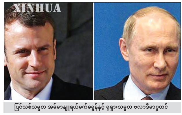
ပြင်သစ်သမ္မတ အမ်မာနျူရယ်မက်ရွန်နှင့် ရုရှားသမ္မတ ဝလာဒီမာပူတင်

ပါရီ မေ ၃၀ ပြင်သစ်နိုင်ငံသမ္မတ အမ်မာနျူရယ် မက်ရွန်နှင့် ရုရှားနိုင်ငံသမ္မတပူတင်တို့သည် အကြမ်းဖက်နှိမ်နင်းရေး ကိစ္စရပ်များတွင် ပိုမိုပူးပေါင်းဆောင်ရွက်မှုများ လုပ်ဆောင်သွားရန် ဘာဆိုင်နန်းတော်၌ ယမန်နေ့က တွေ့ဆုံဆွေးနွေးခဲ့ကြသည်။ နှစ်နိုင်ငံခေါင်းဆောင်များ တွေ့ဆုံဆွေးနွေးမှုအပြီး ပြုလုပ်ခဲ့သည့် ပူးတွဲသတင်း ကြေညာချက်တွင် မက်ရွန်က ပြင်သစ်နိုင်ငံအနေဖြင့် အကြမ်းဖက်ဝါဒတိုက်ဖျက်ရေးကဏ္ဍတွင် ရုရှားနိုင်ငံနှင့် ပူးပေါင်းဆောင်ရွက်မှု တိုးမြှင့်လိုကြောင်း ပြောကြားခဲ့သည်။ ရုရှားနိုင်ငံအနေဖြင့် အကြမ်းဖက် နှိမ်နင်းရေးကို ဦးစားပေးဆောင်ရွက်သွားရန် သဘောတူပြီးနောက် အကြမ်းဖက်ဝါဒအား ချေမှုန်းနိုင်မည်ဟု ယုံကြည်ကြောင်း သတင်းစာရှင်းလင်းပွဲတွင် ပူတင်က ပြောကြားခဲ့သည်။ (ဆင်ဟွာ)