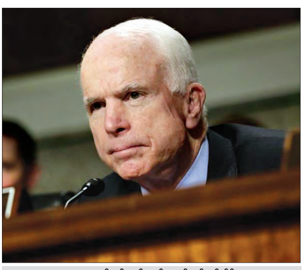
အမေရိကန်လွှတ်တော်အမတ် ဂျွန်မက်ကီနန်း

ဝါရှင်တန် မေ ၃၀ အမေရိကန်ဆီးနိတ်လွှတ်တော်အမတ် ဂျွန်မက်ကီနန်းက ရုရှားသမ္မတ ဝလာဒီမာပူတင်သည် အိုင်အက်စ်အစွန်းရောက်အဖွဲ့ထက်ပင် ကြောက်စရာကောင်းသည့် ကမ္ဘာ့လုံခြုံရေးကို ခြိမ်းခြောက်သူဖြစ်ကြောင်း ပြောကြားခဲ့ပြီး ဆီးနိတ်လွှတ်တော်အနေဖြင့် အမေရိကန်ရွေးကောက်ပွဲတွင် ကြားဝင်စွက်ဖက်ခဲ့သည်ဟု သော့စွပ်ချက်နှင့် ပတ်သက်၍ ရုရှားနိုင်ငံအား ပိတ်ဆို့အရေးယူမှု များလုပ်ဆောင်သွားရန် အလေးအနက်ဆောင်ရွက်မည်ဖြစ်ကြောင်း ၎င်းကသတိပေးပြောကြားခဲ့သည်။ အမေရိကန် ကွန်ဂရက်လွှတ်တော်၌ နိုင်ငံခြားရေးရာမူဝါဒများ၏ အသံကို ဦးဆောင်ဖြန့်ဝေနေသူဖြစ်သည့် မက်ကီနန်းသည် ဩစတြေးလျနိုင်ငံ၌ ပြုလုပ်ခဲ့သည့် အင်တာဗျူးတစ်ခုတွင် ယင်းသို့ပြောကြားခဲ့ခြင်းဖြစ်သည်။ အင်တာဗျူးအမေးအဖြေတွင် မက်ကီနန်းက ပူတင်သည် အိုင်အက်စ်အစွန်းရောက်အဖွဲ့ထက်ပင် စိုးရိမ်ဖွယ်ကောင်းသည့် အရေးအကြီးဆုံး ခြိမ်းခြောက်မှုတစ်ခုပင် ဖြစ်ကြောင်း ဩစတြေးလျရုပ်သံတစ်ခုမှ ထုတ်လွှင့်တင်ဆက်ခဲ့သည့် အင်တာဗျူးတွင် ပြောကြားခဲ့သည်။ ရုရှားအနေဖြင့် အမေရိကန်၏ ရွေးကောက်ပွဲရလဒ် ပြောင်းလဲသွားအောင် လုပ်ဆောင်ချက် အောင်မြင်ခဲ့သည်ဟု ဖော်ပြနိုင်သည့် သက်သေအထောက်အထားမရှိသော်လည်း ၎င်းတို့သည် မကြာသေးမီက ပြုလုပ်ခဲ့သည့် ပြင်သစ်ရွေးကောက်ပွဲအပေါ်