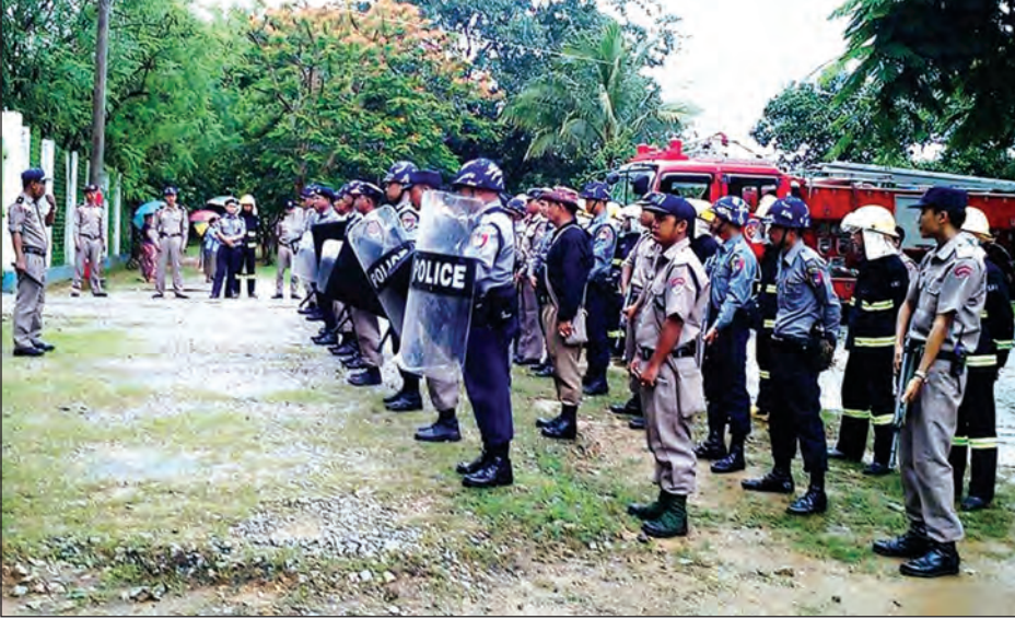
ကြုံတွေ့ပါက ကယ်ဆယ်ခြင်းနှင့် အရေးပေါ်ပြုစုကုသနည်း လုပ်ငန်းစဉ်များ၊ သဘာဝဘေးကြောင့် ဖြစ်ပေါ်လာမည့် အပျက်အစီးများအား ရှင်းလင်းဖယ်ရှားကာ အပျက်အစီးများအကြားတွင် လက်တွေ့ကယ်ဆယ်မှုလုပ်ငန်း ဆောင်ရွက်ပုံများနှင့် အကျဉ်းထောင်အတွင်း မီးလောင်မှု ဖြစ်ပွားပါက မီးငြိမ်းသတ်မှုလုပ်ငန်း စဉ်အဆင့်ဆင့်ကို ညွှန်ကြားချက်များနှင့်အညီ ကြိုတင်သရုပ်ပြလေ့ကျင့်ခြင်းများ ဆောင်ရွက်ခဲ့ကြောင်း သိရသည်။ ကျော်စိုး(ကျောင်းသား)

ကျောင်းသား ၂၀၀ သဘာဝဘေးအန္တရာယ် ကြုံတွေ့လာပါက အရေးပေါ်ရှာဖွေကယ်ဆယ်ရေး သရုပ်ပြလေ့ကျင့်မှု အစီအစဉ်တစ်ရပ်ကို မေ ၂၀ ရက်က တနင်္သာရီတိုင်းဒေသကြီး ကျောင်းသားမြန်မာ့ကျောင်းသားအဖွဲ့အစည်း ထောင်တွင် ပြုလုပ်ခဲ့ကြောင်း သိရသည်။ လေ့ကျင့်မှုအစီအစဉ်ကို ကျောင်းသား ခရိုင်နှင့် မြို့နယ်နှင့် ရဲတပ်ဖွဲ့များ၊ မြို့နယ် မီးသတ်ဦးစီးဌာနမှ မီးသတ်တပ်ဖွဲ့ဝင် များ၊ အကျဉ်းထောင်တာဝန်ခံနှင့် ဝန်ထမ်းများ ပူးပေါင်းဆောင်ရွက်ခြင်း ဖြစ်ပြီး မမျှော်မှန်းနိုင်သည့် သဘာဝဘေး အန္တရာယ်များ ဖြစ်ပေါ်ကြုံတွေ့လာပါက အကျဉ်းသား အကျဉ်းသူများနှင့် အကျဉ်းထောင်ဝန်ထမ်း မိသားစုများ အသက်အန္တရာယ် ထိခိုက်ဒဏ်ရာရခြင်း နှင့် ပျက်စီးဆုံးရှုံးမှု လျော့နည်းစေရန် ရည်ရွယ်၍ ပြုလုပ်ခြင်းဖြစ်ကြောင်း သိရသည်။ ရှာဖွေကယ်ဆယ်ရေး လေ့ကျင့်မှု အစီအစဉ်တွင် သဘာဝဘေးအန္တရာယ်