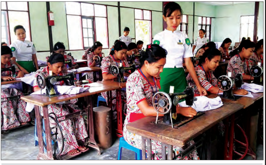
အိမ်တွင်းမှုသက်မွေးလုပ်ငန်းသင်တန်းကျောင်းမှ သင်တန်းသူများလေ့လာသင်ယူနေစဉ်

အမျိုးဂုဏ်ဇာတိဂုဏ်စောင့်ထိန်းပြီး အကျင့်စာရိတ္တကောင်းမွန်သော အမျိုးသမီးများဖြစ်လာစေရန်၊ တိုင်းချစ်ပြည်ချစ်မျိုးချစ်စိတ် အစဉ်ရှင်သန်ထက်မြက်နေသော အမျိုးသမီးများ ဖြစ်လာစေရန်နှင့် ရိုးရာယဉ်ကျေးမှု၊ အိမ်တွင်းမှုပညာရပ်များ ပိုမိုထွန်းကားပြန့်ပွားလာစေရန် ရည်ရွယ်ချက်ပါးရပ်ဖြင့် အစပြုလုပ်ဆောင်ခဲ့ခြင်းဖြစ်သည်။ အမျိုးသမီးအိမ်တွင်းမှု သက်မွေးလုပ်ငန်း ပညာသင်တန်းကျောင်းတွင် ယခင်က ဟင်းလျာချက်ပြုတ်နည်း၊ ကြိမ်ဝါးနှင့် ရက်ကန်းအတတ်ပညာများကိုပါ သင်ကြားပေးခဲ့သော်လည်း ယခုနောက်ပိုင်းတွင် အကြောင်းအမျိုးမျိုးတို့ကြောင့် အမျိုးသမီးအများစု စိတ်ဝင်စားမှု အရှိဆုံးဖြစ်သော အခြေခံအိမ်တွင်းမှုသင်တန်းနှင့် အဆင့်မြင့်စက်ချုပ်သင်တန်းတို့ကိုသာ လေ့ကျင့်သင်ကြားပေး