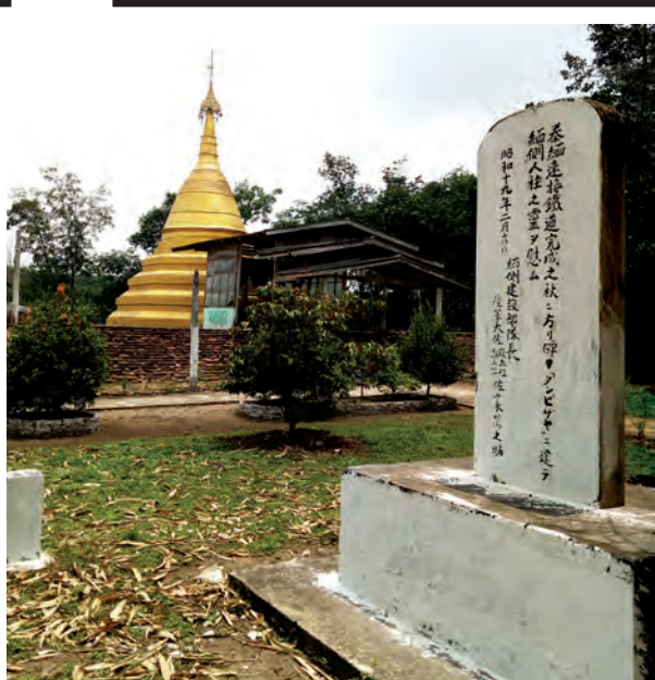
သံဖြူဇရပ် ရန်ပေးမာန်ပြေစေတီကိုဖူးတွေ့ရစဉ်

လည်းမဟုတ်။ သေမင်းတမန်လမ်းပေါ်ရှိ “မြစ်” အမည်ကို အစွဲပြုခေါ်ဆိုသည့် တံတားနှစ်စင်းတို့၏ အမှန်တကယ် ဖြစ်စဉ်များ ဖြေပြင်သက်သေ အထောက်အထားအရ ဒေသခံစာရေးသူတစ်ဦး အနေဖြင့် သိသမျှ ကြိုးပမ်းတင်ပြခြင်း ဖြစ်ပါသည်။