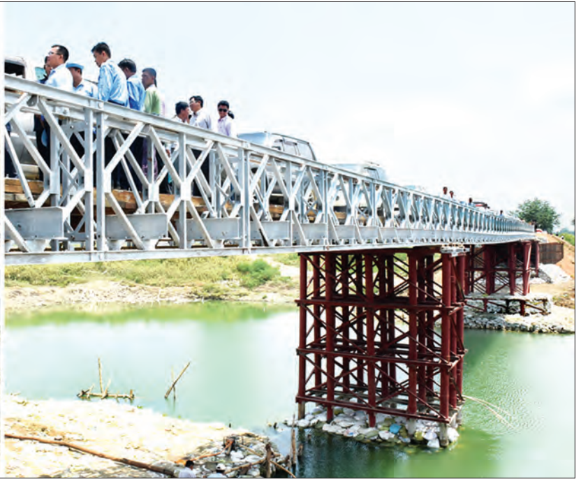
ဒုတိယသမ္မတ ဦးဟင်နရီဝန်ထီးယူ လက်ပံတန်းထိန်တော-မိုးညို-တာပွန်-နတ္တလင်းလမ်းမပေါ်ရှိ ငါးပြေမတ်တာတည်ဆောက်ပြီးစီးမှုအခြေအနေကို ကြည့်ရှုစစ်ဆေးစဉ် (သတင်းစဉ်)

မှု ဖြစ်ပေါ်နေခြင်းတို့ကြောင့် ဒေသခံပြည်သူများ၏ အသက်အိုးအိမ်စည်းစိမ်များ ပျက်စီးဆုံးရှုံးခြင်း၊ စိုက်ပျိုးသီးနှံများပျက်စီးဆုံးရှုံးခြင်း၊ မဖြစ်ပေါ်စေရေးအတွက် ဆည်မြောင်းနှင့်ရေအသုံးချမှု စီမံခန့်ခွဲရေးဦးစီးဌာနမှ တာဝန်ရှိသူများ တာပတ်လုပ်ငန်းဆောင်ရွက်ခြင်းတို့အား ဆောင်ရွက်လျက်ရှိသည်။