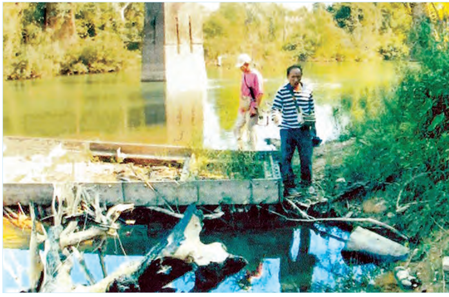
ဇမိတံတားကြီး၏ လက်ကျန်ကွန်ကရစ်ထောက်တိုင် သုံးခုအနက် တစ်တိုင်နှင့် သံပေါင်တစ်ခုကို တွေ့ရစဉ်

ရထားလမ်းကို ၁၉၄၂ ခုနှစ် စက်တင်ဘာလ ၁၆ ရက်နေ့ တွင် စတင်ဖောက်လုပ်ခဲ့၏။ အချို့မှတ်တမ်းများက ၁၉၄၂ ခုနှစ် နိုဝင်ဘာလ ၂ ရက်နေ့ဟူ၍ ဖော်ပြပြီး မြန်မာနိုင်ငံဘက်မှ သံဖြူဇရပ်နှင့် ထိုင်းနိုင်ငံဘက်အခြမ်း ကန်ချာနဘူရီကို အခြေခံ စခန်းအဖြစ် သတ်မှတ်ခဲ့၏။ ၁၉၄၃ ခုနှစ် အောက်တိုဘာလ လောက်တွင် ဘုရားသုံးဆူတောင်ကြားလမ်း၏ တောင်ဘက် ၁၈ ကီလိုမီတာအကွာ “ကွန်ကျိုတော” ဌာန စစ်ကမ်းရထား လမ်းနှစ်ခုဆက်သွယ်ပေါင်းဆုံ၏။ မြန်မာနိုင်ငံဘက်မှ ရထား လမ်းအရှည်မှာ ဘုရားသုံးဆူအထိ ၆၉ မိုင်ရှိပြီး ထိုင်းနိုင်ငံ