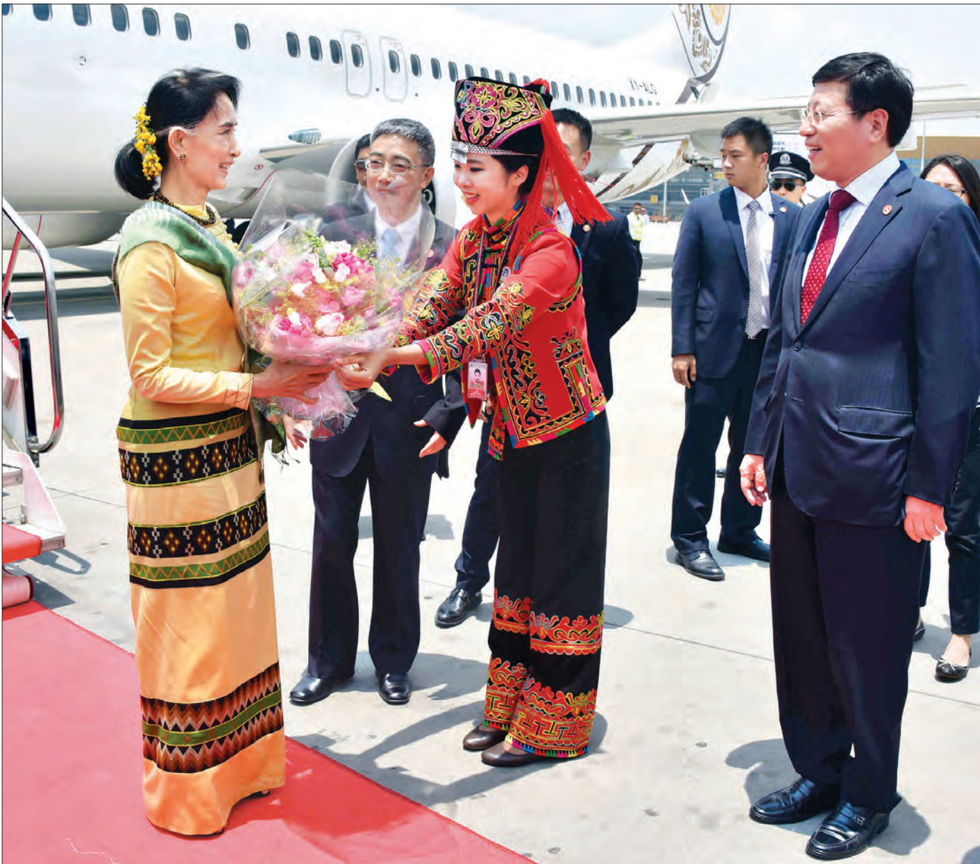
နိုင်ငံတော်၏အတိုင်ပင်ခံပုဂ္ဂိုလ် ဒေါ်အောင်ဆန်းစုကြည်အား တရုတ်ပြည်သူ့သမ္မတနိုင်ငံ ကူမင်းလေဆိပ်၌ တာဝန်ရှိသူများက ကြိုဆိုနှုတ်ဆက်စဉ် (သတင်းစဉ်)

ပေကျင်း မေ ၁၃ နိုင်ငံတော်၏ အတိုင်ပင်ခံပုဂ္ဂိုလ် ဒေါ်အောင်ဆန်းစုကြည်သည် တရုတ်ပြည်သူ့သမ္မတနိုင်ငံ ပေကျင်းမြို့၌ မေ ၁၄ ရက်နှင့် ၁၅ ရက်တွင် ကျင်းပမည့် Belt and Road နိုင်ငံတကာ ပူးပေါင်းဆောင်ရွက်ရေးဖိုရမ်သို့ တက်ရောက်ရန် ယနေ့ ဒေသစံတော်ချိန် မွန်းလွဲ ၁ နာရီတွင် မြန်မာအမျိုးသားလေကြောင်းလိုင်းဖြင့် ကူမင်းမြို့သို့ရောက်ရှိရာ ယူနန်ပြည်နယ် ဒုတိယ အုပ်ချုပ်ရေးမှူး H.E. Mr. Chen Shun၊ မြန်မာနိုင်ငံဆိုင်ရာ တရုတ်သံအမတ်ကြီး မစ္စတာ ဟန်လျန်း၊ မြန်မာကောင်စစ်ဝန်ချုပ် ဦးစိုးပိုင်နှင့် တာဝန်ရှိသူများက ကူမင်းလေဆိပ်၌ ကြိုဆို