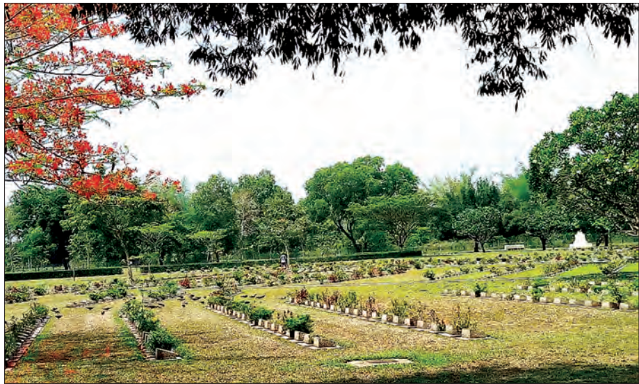
သံဖြူဇရပ် နေသဟာယစစ်သင်္ချိုင်းကို တွေ့ရစဉ်

အထူးတလည် တင်ပြလိုသည်မှာ ထိုင်းနိုင်ငံသည် စစ်ဘေးဒဏ်မခံရဘဲ The Bridge On The River Kwei ကို အကြောင်းပြု၍ နာမည်ကျော်ကြား အထူးဝင်ငွေကောင်းခဲ့သလို စစ်ဘေးဒဏ် အလုံးအလဲခံစားခဲ့ရသော မိမိတို့သံဖြူဇရပ်သားများအဖို့ “ဇမိတ်” ကိုအခြေခံသော “ဇမိတ်တား” (Zami) ကို ခေတ်မီနည်းပညာများဖြင့် ဆက်တင်များဖန်တီးတည်ဆောက်ပြီး သေမင်းတမန် ရထားလမ်းပြတိုက် ဝါခရူမြို့ဟောင်း၊ မဟာမိတ်စစ်သင်္ချိုင်း၊ စက်စဲအပန်းဖြေကမ်းခြေတို့နှင့် ဆက်စပ်၍ ကမ္ဘာလှည့်ခရီးသည်များအား အလုံးအရင်းဖြင့် ဆွဲဆောင်ပုံဖော်သင့်ကြောင်း ဆန္ဒပြုတင်ပြလိုက်ရပေသည်။