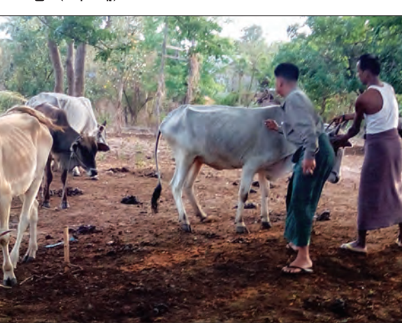
နိုင်ငံတစ်ဝန်း သစ်တောစွမ်းဖြင့် စိမ်းလန်းစေရမည်

ကန်ဘလူ မေ ၁၃ ကန်ဘလူခရိုင် ကျွန်းလှမြို့နယ်တွင် မေ ၁၀ ရက်က ထန်းပင်ကုန်းကျေးရွာအနီး တောင် တလုံးတောတိုက်၌ ခွားများရောဂါဖြစ်ပွား၍ သေဆုံးမှုများရှိခဲ့ပြီး ပေါင်ပုပ်လက်ပုပ် ရောဂါဖြင့် ခွားထီးနှစ်ကောင်၊ သီးချုပ်ဝမ်းချုပ်ဖြင့် ခွားမနှစ်ကောင်သေဆုံးခဲ့ ကြောင်း သိရသည်။ အဆိုပါနေ့တွင် ကျွန်းလှမြို့နယ်နှင့် မြို့နယ်မေးမြူရေးနှင့် ကုသ ရေးဦးစီးဌာနမှ ဦးစီးမှူးနှင့် ဝန်ထမ်းများ၊ ကျေးရွာအုပ်စုအုပ်ချုပ်ရေးမှူးနှင့် တွေ/ အုပ် စာရေးဝန်ထမ်းများ၊ မွေး/ ကုသဝန်ထမ်းများ၊ ကျန်းမာရေးလုပ်သားများသည် ၎င်းခွားသေဆုံးမှုဖြစ်ပွားခဲ့သော တောတိုက်နှင့် အနီးဝန်းကျင်ရှိ ကျေးရွာများသို့ ကွင်းဆင်းစစ်ဆေးခဲ့ပြီး ဆက်လက်၍ ရောဂါကူးစက် ပြန့်ပွားမှုမရှိစေရေးကာကွယ် ဆေးများ ထိုးနှံပေးရန် ဆောင်ရွက်ခဲ့ကြောင်း သိရသည်။