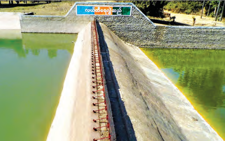
လယ်တီရေလွှဲဆည်အတွင်း ရေဝင်ရောက်မှု အခြေအနေကို တွေ့ရစဉ်

ပခုက္ကူ မေ ၁၃ ပခုက္ကူခရိုင်တွင် ဆည်တစ်ခုစုစုပေါင်း ၃၀ ခုရှိသော်လည်း မိုးခေါင်ရပ်ဝန်း ဒေသဖြစ်သဖြင့် ဆည်အတွင်း ရေဝင် ရောက်မှုနည်းပါးခြင်းကြောင့် ၂၀၁၆-၂၀၁၇ ခုနှစ်တွင် စိုက်ပျိုးသီးနှံများ လျာထားကေ ပြည့်မီအောင်စိုက်ပျိုးနိုင် ခြင်းမရှိကြောင်း ခရိုင်ဆည်မြောင်း နှင့် ရေအသုံးချမှုစီမံခန့်ခွဲရေးဦးစီးဌာန (ခရိုင်) ဦးစီးမှူးရုံးက သိရသည်။