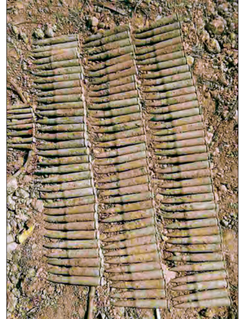
မြေတူးဖော်ရာမှ တွေ့ရှိရသော ကျည်ဆန်များ

သိန်းနီ မေ ၁၃ ရှမ်းပြည်နယ်မြောက်ပိုင်း လားရှိုးခရိုင် သိန်းနီမြို့နယ် ရေပူအမြဲတမ်းစစ်ဆေးရေးစခန်း၌ မေ ၁၁ ရက်က အကောက်ခွန်မှတရားမဝင်တင်သွင်းလာသော တရုတ်နိုင်ငံထုတ်ဟန်းဆက်များ ဖမ်းဆီးရမိခဲ့သည်။ မူဆယ်မှ မန္တလေးသို့မောင်းနှင်လာသော ရွှေလီရတနာခရီးသည်တင်ယာဉ်ပေါ်တွင် Mi Phone ၄၀၀၊ Huawei Phone ၂၃၀၅ လုံးနှင့် Hair mark ၂၈၈၀၊ Power 5 Express ခရီးသည်တင်ယာဉ်ပေါ်တွင် Kenbo Phone ၁၀၇၆ လုံး၊ Abc gold sun Phone အလုံး ၁၇၀၂ လုံး၊ Mi Phone အလုံး ၂၀ တို့အား သိမ်းဆည်းရမိပြီး တန်ဖိုးစိစစ်တွက်ချက်ကာ လားရှိုးမြို့ အကောက်ခွန်ဦးစီးဌာနမှူးရုံးသို့ လွှဲပြောင်းပေးသွားမည်ဖြစ်ကြောင်း သိရသည်။ ချစ်လှ(ပြန်/ဆက်)