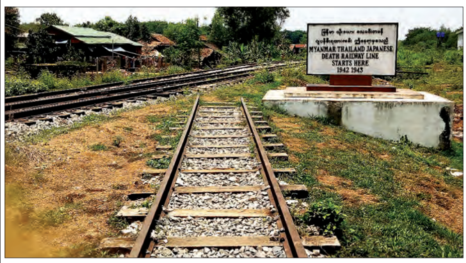
မြန်မာ-ယိုးဒယား(ထိုင်း) သေမင်းတမန် ဂျပန်မီးရထားလမ်းတစ်နေရာကို တွေ့ရစဉ်

ဇမိတံတားသည် သေမင်းတမန်လမ်း တံခါးဝမြို့ဖြစ်သော သံဖြူဇရပ်မှ အနီးဆုံးတည်ရှိသည့် စစ်အတွင်း ရထားလမ်း တံတားဟောင်းတစ်ခုဖြစ်ရာ မဟာမိတ်စစ်လေယာဉ်များ ဖုံးကြဲ ခံရပြီး ပြိုကျပျက်စီးခဲ့ရသည်။ စစ်အတွင်းက လွန်စွာကြမ်းတမ်း ခါးသီးလှသော ချွေးတပ်စခန်းကြီးများ အနက် အဆိုးရွားဆုံး တပ်ဒိန်စခန်းနှင့် အနီးကပ်ဆုံးတည်ရှိသည့် တံတားတစ်ခု လည်း ဖြစ်လေ၏။