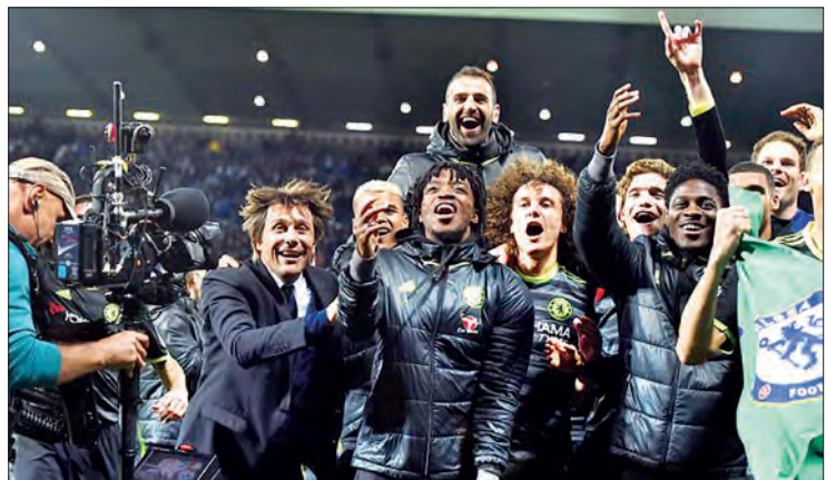
ဝက်စ်ဘရမ်းအသင်းကို အနိုင်ရရှိပြီးနောက် ပွဲစဉ်မကုန်မီ ဖလားရရှိသွားသည့် ချယ်လ်ဆီးနည်းပြနှင့် အသင်းသားများ အောင်ပွဲခံနေစဉ်

သတင်း - သီဟ အင်္ဂလန်ပရီမီယာလိဂ် ၂၀၁၆-၂၀၁၇ ဘောလုံးရာသီတွင် ချယ်လ်ဆီးအသင်းသည် ပွဲကျန်တစ်ပွဲအပါအဝင် နှစ်ပွဲအလိုတွင် ချန်ပီယံအဖြစ် ဖလားဆွတ်ခူးခဲ့သည်။ ပွဲစဉ်(၃၇) အစောဆုံးပွဲစဉ်တစ်ပွဲဖြစ်သော ဝက်စ်ဘရမ်းနှင့် ချယ်လ်ဆီးပွဲတွင် ချယ်လ်ဆီးအတွက် တစ်လုံးတည်းသော အနိုင်ရိုက်ကို ပွဲစဉ် ၅ မိနစ်တွင် လူစားဝင်လာသော ဘတ်ချူအာရီက သွင်းယူခဲ့ပြီး ဒုတိယနေရာမှ စပါးအသင်းကို ၁၀ မှတ်ဖြတ်ကာ ချန်ပီယံဖြစ်ခဲ့သည်။ နည်းပြကွန်တီ၏ ချယ်လ်ဆီးအသင်းသည် ပရီမီယာလိဂ်ဖလား ခြောက်ကြိမ်မြောက် ရရှိခြင်းဖြစ်သည်။ သက်တမ်းရင့် အင်္ဂလန်အမှတ်ပေးပြိုင်ပွဲကြီးကို ၁၈၈၈ ခုနှစ်တွင် စတင်ခဲ့ပြီး ၁၉၉၂ ခုနှစ်အထိ Football League အမည်ဖြင့် ယှဉ်ပြိုင်ခဲ့သည်။ စတင် ယှဉ်ပြိုင်ခဲ့သည့်နှစ်တွင် ပရက်စတန်အသင်းက နှစ်နှစ် ဆက်တိုက်ချန်ပီယံဖြစ်ခဲ့သည်။ ယင်းမှတစ်ဆင့် ၁၉၉၂ မှ ၁၉၉၂ ခုနှစ်ထိ Football League First Division အမည်ဖြင့် ပြောင်းလဲယှဉ်ပြိုင်ခဲ့သည်။ ၁၉၉၂ ခုနှစ်မှ လက်ရှိအချိန်ထိ Premier League အမည်ဖြင့် ကျင်းပလျက်ရှိသည်။ လက်ရှိ ချန်ပီယံဖြစ်ခဲ့သည့် ချယ်လ်ဆီးအသင်းကို ၁၉၀၅ ခုနှစ်တွင် စတင်တည်ထောင်ခဲ့ပြီး နှစ်ပေါင်း ၁၁၂ နှစ် ပြည့်ခဲ့ပြီဖြစ်သည်။ စာမျက်နှာ ၁၄ ကော်လံ ၅ *