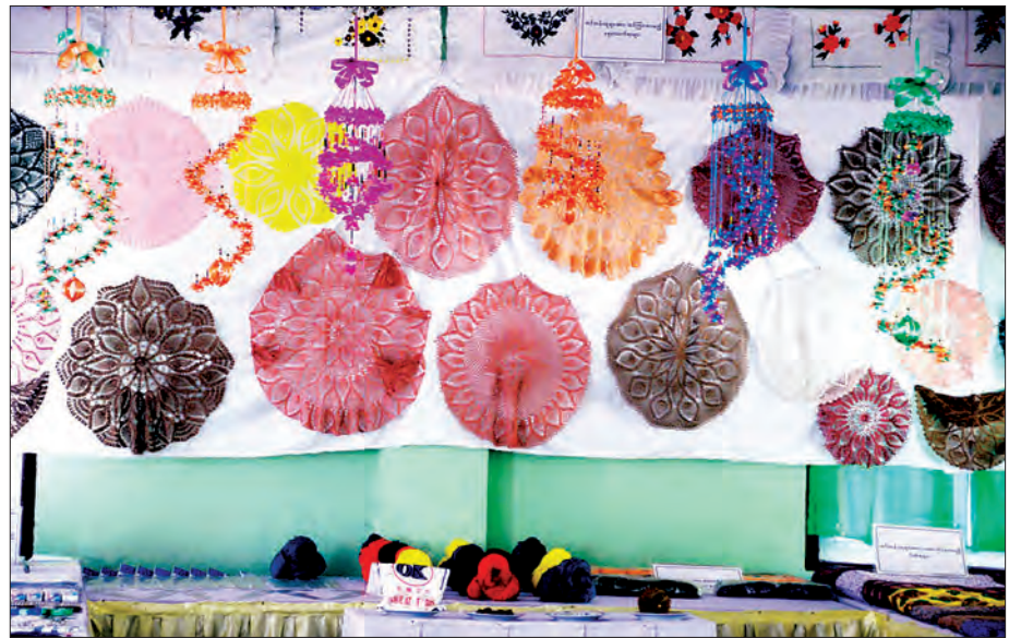
သင်တန်းသူများရက်လုပ်သော အထည်နှင့် အသုံးအဆောင်ပစ္စည်းများ

သင်တန်းကျောင်းသူအများစုမှာ အဝေးနယ်စွန့်နယ်ဖျား ဒေသကျေးရွာများမှဖြစ်ပြီး သင်တန်းသူအများစုမှာ အဆောင်နေသူများဖြစ်ကာ နေ့စဉ်စားစရိတ်တစ်ဦးလျှင်ဟင်းလျာဖိုး ငွေကျပ် ၇၅၀၊ ဆန်နှစ်ဘူး၊ ဆီနှစ်ကျပ်သား၊ ပဲသုံးကျပ်သား၊ ဆား ဒသမ ၅ ကျပ်သားတို့ကို နိုင်ငံတော်က ထောက်ပံ့ပေး ထားပြီး နယ်စပ်ဒေသသင်တန်းသူများအတွက် အသွား၊ အပြန် ခရီးစရိတ်ပါ ကူညီပေးထားကြောင်းသိရသည်။ ထို့အပြင် သင်တန်း ကာလအတွင်း သင်တန်းအထောက်အကူပြု ပစ္စည်းများ ဖြစ်သည့် ပေကြိုး၊ ပေတံ၊ တစ်ချောင်းထိုးအပ်၊ ကတ်ကြေး၊ ဗလာစာအုပ်၊ အကွတ်စာအုပ်၊ ခဲတံ၊ ဘောလံပင်၊ ခဲဖျက်၊ လက်ချုပ်အပ်၊ စက်ချုပ်အပ်နှင့် သင်တန်းသူတစ်ဦးလျှင် ပိတ်စကိုကို ၂၀ စီကိုလည်း နိုင်ငံတော်မှ ကျွန်ုပ်တို့ခွင့်ပြု ထားသည်။ နိုင်ငံတော်အနေဖြင့် အဆိုပါ သင်တန်းများ တစ်နှစ်လျှင် ၉၆ ရက်၊ ရက်သတ္တ ၁၄ ပတ်အတွက် ငွေကျပ် သိန်းပေါင်း ၁၅၀ ဝန်းကျင်အကုန်ကျခံထားပြီး များမကြာမီ တွင်လည်း အဆိုပါအမျိုးသမီးအိမ်တွင်းမှုသက်မွေးလုပ်ငန်း ပညာသင်တန်းကျောင်း၌ အဆင့်မြင့်စက်ချုပ်သင်တန်း ကို ထပ်မံတိုးချဲ့ဖွင့်လှစ်တော့မည်ဖြစ်၍ မျှော်မှန်းဘယ်ဆီဝေး နေသော အနောက်တစ်ခါးအမျိုးသမီးထုရဲ့ အလုပ်အကိုင်အခွင့် အလမ်း လက်ရှိအခြေအနေမှာ အမြန်ဆုံးကျော်လွှားနိုင်ပါ စေကြောင်း . . .။