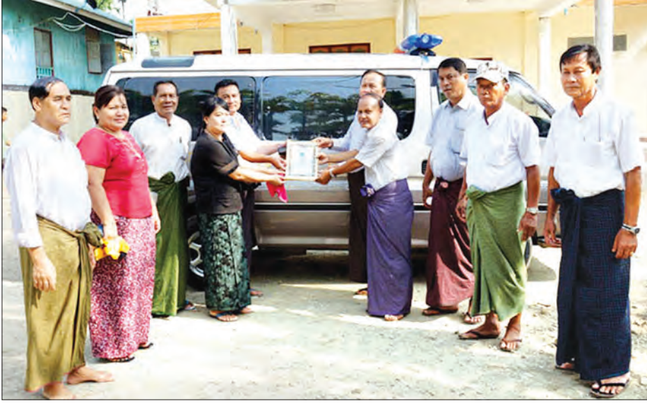
ငှားရမ်းပြီး အသုံးပြုနေရတာ။ အခုတော့ နိဗ္ဗာန်ယာဉ်ကို ငှားသုံးစရာမလိုတော့ပါဘူး။ ဒါကြောင့် ပြည်သူတွေကို အသင်းအနေနဲ့ ကူညီပေးနိုင်တော့မှာပါ။ ကျွန်တော်တို့အသင်းအနေနဲ့ စတည်ထောင်တော့ အသင်းဝင်အရေအတွက် ၂၀၀ လောက်ရှိပေမယ့် အခုနောက်ပိုင်းမှာတော့ ကင်းကွာပြီး အဆက်အသွယ် ပြတ်သွားတာတွေရှိတော့ အသင်းဝင်

မောင်တော မေ ၁၃ ရခိုင်ပြည်နယ် မောင်တောနာရေးကူညီမှု အသင်းသို့ ယာဉ်တစ်စီး၊ မီးစက်တစ်လုံး၊ ကားဂိုဒေါင်တစ်လုံးနှင့် အအေးပေးခေါင်းတစ်လုံး လှူဒါန်းပေးအပ်သည့် အခမ်းအနားကို မေ ၁၂ ရက် မွန်းလွဲပိုင်းက မောင်တောမြို့ ဗဟိုလ်ကျောင်းတိုက်၌ ကျင်းပသည်။ (ယာပုံ)