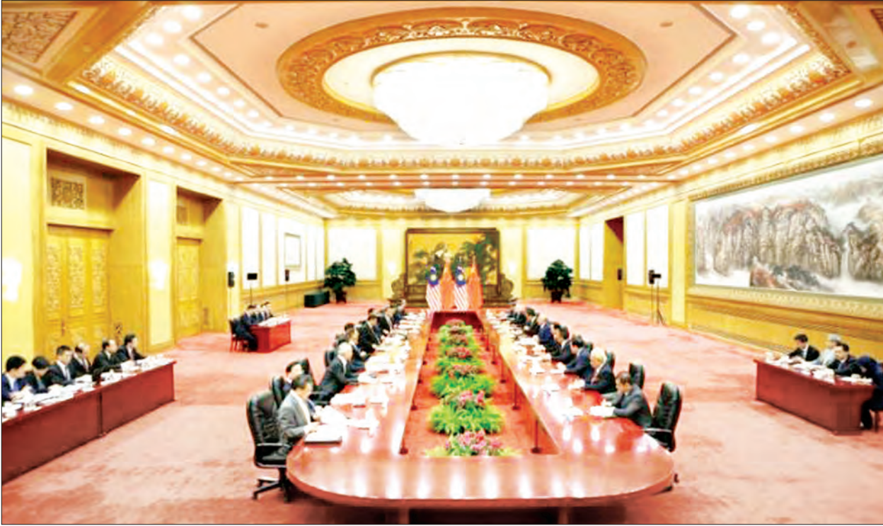
ခေတ်သစ်ပိုးလမ်းမကြီးဖိုရမ်မကျင်းပမီ တရုတ်သမ္မတနိုင်ငံနှင့် နိုင်ငံတကာခေါင်းဆောင်များ တွေ့ဆုံစဉ်