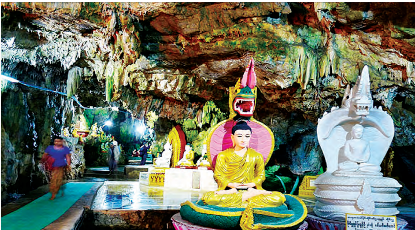
အောင်သပြေဂူအတွင်းရှိ ဗုဒ္ဓဆင်းတုတော်များကိုဖူးတွေ့ရစဉ်

ဂူတိုင်းသမိုင်းဖြစ်ရပ်များ အနည်းနှင့် အများ ရှိကြသည်ချည်းပင်။ ယခု အောင်သပြေဂူအဝင်မှ လျှောက်လမ်း ပြုလုပ်ထားသည့်အတိုင်း ဝင်လာခဲ့ရာ စိတ်ထဲတွင်ထူးခြားစွာ ခံစားရသည်။ ဝမ်းနည်းသလို၊ ဝမ်းသာသလိုခံစားမှုက ရောထွေးနေသည်။ ဂူထဲရောက်သည်နှင့် ဂူနံရံများတွင် ကလာပ်လိုလို၊ ပလွင်လိုလို ပြုလုပ်ထားသည့်အပေါ်တွင် ဗုဒ္ဓဆင်း တုတော်များကို တွေ့မြင်ဖူးမြော်ရ