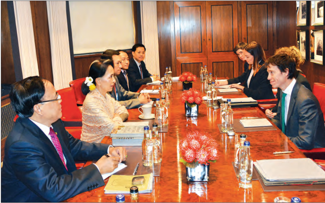
နိုင်ငံတော်၏ အတိုင်ပင်ခံပုဂ္ဂိုလ် ဒေါ်အောင်ဆန်းစုကြည်နှင့် ဗြိတိန်နိုင်ငံ အပြည်ပြည်ဆိုင်ရာ ဖွံ့ဖြိုးတိုးတက်ရေးဝန်ကြီးဌာန ဒုတိယဝန်ကြီး Mr. Rory Stewart တို့ တွေ့ဆုံဆွေးနွေးစဉ်