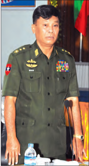
ပြည်ထောင်စုဝန်ကြီး ဒုတိယဝန်ကြီးကျော်ဆွေ

လုပ်ငန်းဖြစ်ကြောင်း၊ ယာဉ်အန္တရာယ်၊ လမ်းအန္တရာယ် ဖြစ်ပွားမှုများသည် လွန်စွာကြီးမားသည့် ခြိမ်းခြောက်မှုအဖြစ် တဖြည်းဖြည်းကြီးထွားလျက်ရှိပြီး အဆိုပါကြီးထွားမှုကို ဟန့်တားထိန်းချုပ်နိုင်ရန် ကမ္ဘာတစ်ဝန်းလုံး၌ Road Safety ကိစ္စရပ်ကို အထူးအလေးအနက်