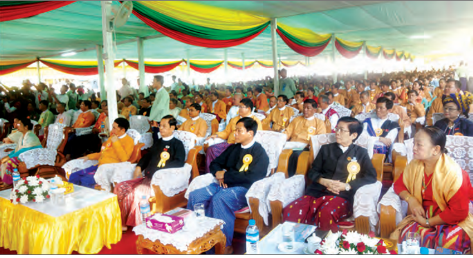
ပြည်သူ့လွှတ်တော်ဥက္ကဋ္ဌ ဦးဝင်းမြင့် ဗိုလ်ချုပ်အောင်ဆန်းတံတား (ဘီလူးကျွန်း) ဖွင့်ပွဲအခမ်းအနားတွင် အမှာစကားပြောကြားစဉ် (သတင်းစဉ်)

❖ ရှေ့မှ ပြည်သူ့လွှတ်တော်ဥက္ကဋ္ဌ ဦးဝင်းမြင့်က ဤတံတားသည် မုတ္တမပင်လယ်ကေ့၏ အစိတ်အပိုင်းတစ်ခုဖြစ်သော ပင်လယ်ဝကို ဖြတ်သန်းပြီး မော်လမြိုင်မြို့နှင့် ယခင်က တစ်သီးတခြားဖြစ်နေ သည့် လူထုထင်ရှား ကျွန်းကြီးတစ်ကျွန်းဖြစ်သော ဘီလူးကျွန်း ကို ဆက်သွယ်ပေးသော တံတားတစ်စင်းဖြစ်ပါကြောင်း၊ ဘီလူး ကျွန်းသည် လူဦးရေ တစ်သိန်းနီးပါးကျော်ရှိပြီး ဧရိယာ ၈၅၈ စတုရန်းကီလိုမီတာခန့်ရှိသည့်အတွက် စင်ကာပူနိုင်ငံထက် ပိုမိုကျယ်ဝန်းသော ကျွန်းကြီးဖြစ်ပါကြောင်း၊ လမ်းပန်းဆက်သွယ် ရေး ပိုမိုကောင်းမွန်လာသည်နှင့်အမျှ ဒေသခံပြည်သူလူထု၏ ကုန်ထုတ်လုပ်မှုများနှင့် စီးပွားရေးလုပ်ငန်းများ ဖွံ့ဖြိုးလာမည် ဖြစ်ပြီး ခရီးသွားလာရေးလုပ်ငန်းများလည်း တိုးတက်လာမည် ဖြစ်ပါကြောင်း၊ ဒေသခံပြည်သူများအတွက် အလုပ်အကိုင် အခွင့်အလမ်းများ ပိုမိုရရှိစေပြီး လူမှုစီးပွားဘဝများ ဖြင့်မား လာမည်ဖြစ်ပါကြောင်း၊ ပညာရေး၊ ကျန်းမာရေး စသည့်ကိစ္စများ တွင်လည်း ပိုမိုကောင်းမွန်လာမည်ဖြစ်ပါကြောင်း၊ ဒေသခံများ သာမက တစ်နိုင်ငံလုံးက အသုံးပြုနိုင်သည့်အတွက် ကူးလူး ဆက်ဆံမှုလွယ်ကူသည်နှင့်အမျှ တိုင်းရင်းသားညီအစ်ကို မောင်နှမများအကြား ချစ်ကြည်ရင်းနှီးမှု ပိုမိုရရှိလာမည်ဖြစ်ပါ ကြောင်း၊ ပြည်ထောင်စုစိတ်ဓာတ် တိုးပွားလာမည်လည်း ဖြစ်ပါကြောင်း။