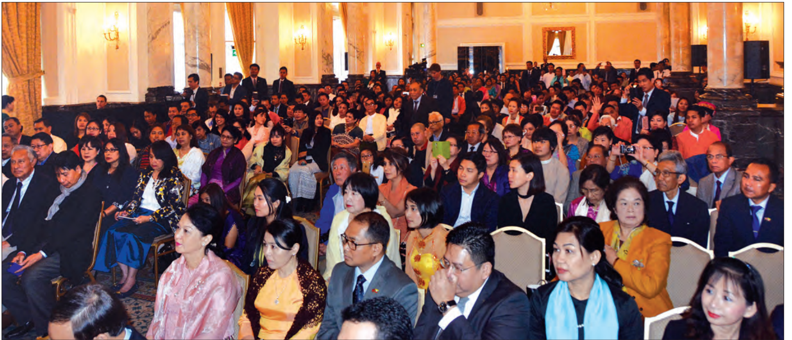
နိုင်ငံတော်၏ အတိုင်ပင်ခံပုဂ္ဂိုလ် ဒေါ်အောင်ဆန်းစုကြည်နှင့် ဗြိတိန်နိုင်ငံရောက် မြန်မာနိုင်ငံသားများတွေ့ဆုံပွဲသို့ တက်ရောက်လာကြသူများအား တွေ့ရစဉ်

ကိစ္စရပ်များ၊ မြန်မာ-ဗြိတိန်နှစ်နိုင်ငံ အကြား ပူးပေါင်းဆောင်ရွက်လျက်ရှိသည့် ပညာရေး၊ ကျန်းမာရေး၊ လှုပ်စစ်စွမ်းအင်ကဏ္ဍများ တိုးမြှင့်ရေးကိစ္စရပ်များအပေါ် အမြင်ချင်းဖလှယ်ဆွေးနွေးကြသည်။ (သတင်းစဉ်)