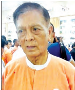
နိုင်သောင်ညွန့်