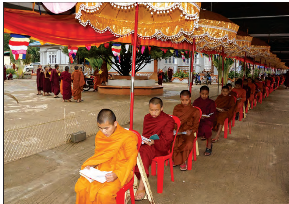
အာဂုံပြန်ဆိုခြင်း ဖြေဆိုရန် စောင့်ဆိုင်းနေကြသည့် သံဃာတော်များ

ပင်လုံ မေ ၉ ရှမ်းပြည်နယ်(တောင်ပိုင်း) ပင်လုံမြို့တွင် နှစ်စဉ်ကျင်းပဖြစ်သော (၅၉)ကြိမ် မြောက် ရှမ်းပြည်နယ်လုံးဆိုင်ရာ ပရိယတ္တိ သဒ္ဓမ္မပါလ စာပွဲတော်ကို ပင်လုံ မြို့ ပရိယတ္တိစာသင်တိုက် ပိဋကတ်ကျောင်းနှင့် မင်္ဂလာမေတ္တာကျောင်း များ၌ မေ ၄ ရက်မှစတင်၍ ကျင်းပလျက်ရှိကြောင်း သိရသည်။