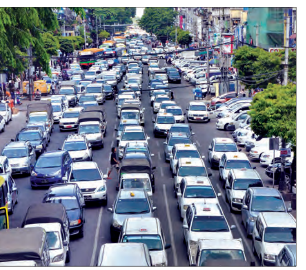
သတင်း-မြင့်မောင်စိုး

ပညာအထောက်အကူပြု ပစ္စည်းတွေလိုအပ်ပါတယ်။ ဒါကြောင့်မို့ သတ်မှတ်အရှိန်လွန်မောင်းနှင်တဲ့ ယာဉ်မောင်းတွေကို စစ်ဆေးအရေးယူနိုင်ဖို့ SpeedoMeter တွေ ရန်ကုန်မြို့ရှိ အဓိကလမ်းမကြီးတွေမှာ တပ်ဆင်သွားမှာ ဖြစ်ပါတယ်” ဟု ယာယီရဲမှူးမျိုးအောင်မြင်က ပြည်သူ့ဥပဒေပြု မြန်မာနိုင်ငံ ယာဉ်လမ်း အန္တရာယ်ကင်းရှင်းရေးအဖွဲ့က ကြီးမှူးကျင်းပသည့် စတုတ္ထအကြိမ်မြောက် ကုလသမဂ္ဂယာဉ်လမ်းအန္တရာယ်ကင်းရှင်းရေး သီတင်းပတ်ဖွင့်လှစ်ခြင်း အခမ်းအနားတွင် ပြောကြားသည်။ သတ်မှတ်အရှိန်နှုန်းထက် ပိုမောင်းနှင်သော ယာဉ်မောင်းများအား Speedo-Meter မှရရှိသော အချက်အလက်များအရ ချက်ချင်းချလန်ဖြတ်၍ မော်တော်ယာဉ် ဥပဒေနှင့်အညီ တရားရုံးစွဲတင် အရေးယူဆောင်ရွက်သွားမည်ဖြစ်ကြောင်း၊ ကနဦးအနေဖြင့် ဇူလိုင် ၃၀၀၀၀ ဒဏ်ရိုက်မည်ဖြစ်ကြောင်း၊ နောက်ပိုင်းတွင် လိုင်စင်ပိတ်သိမ်းသည်အထိ အရေးယူမှုများဆောင်ရွက်သွားမည်ဖြစ်ကြောင်း ၎င်းက ထပ်မံပြောသည်။