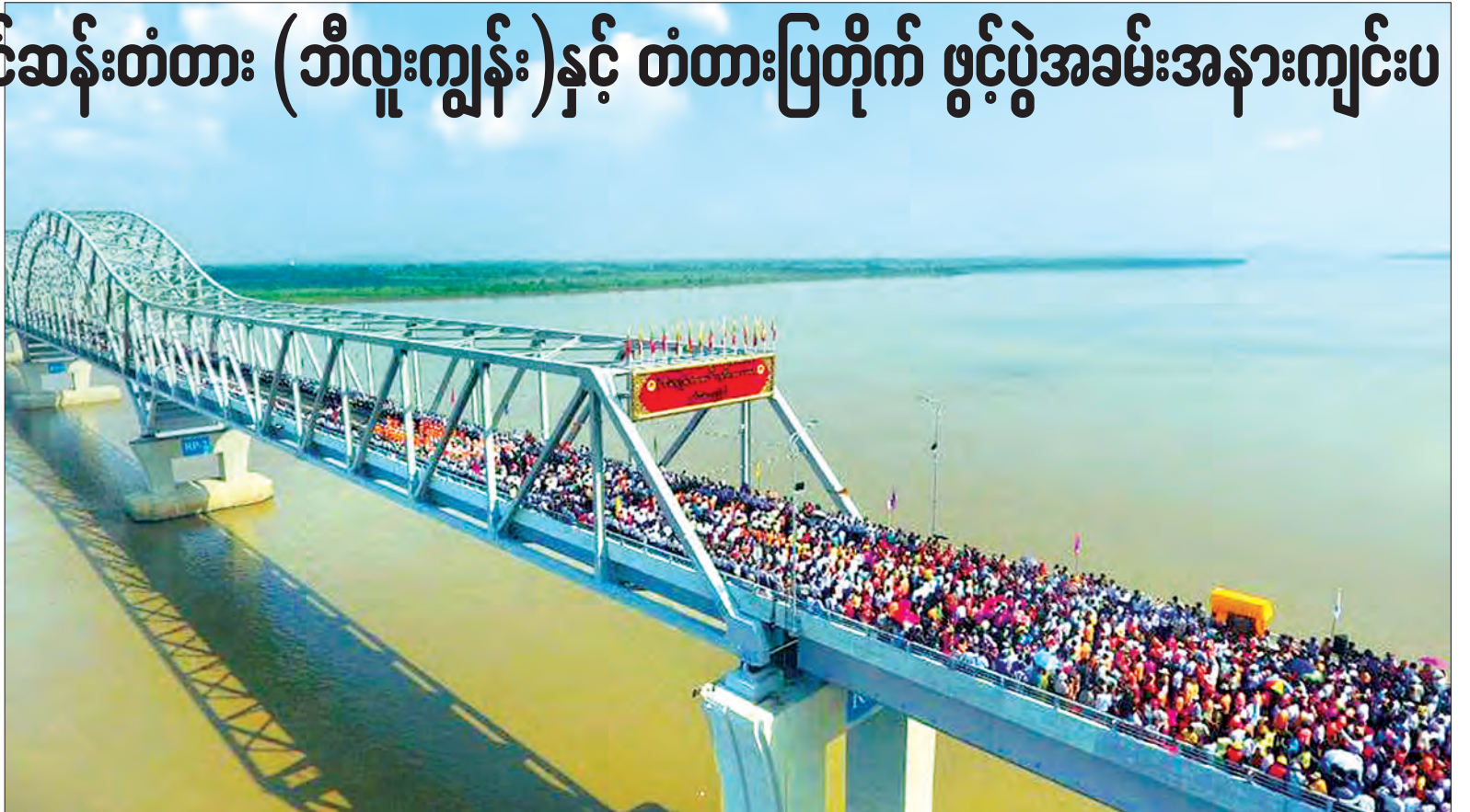
ပိုလ်ချုပ်အောင်ဆန်းတံတား (ဘီလူး ကျွန်း)ဖွင့်ပွဲအခမ်းအနား ကျင်းပစဉ်