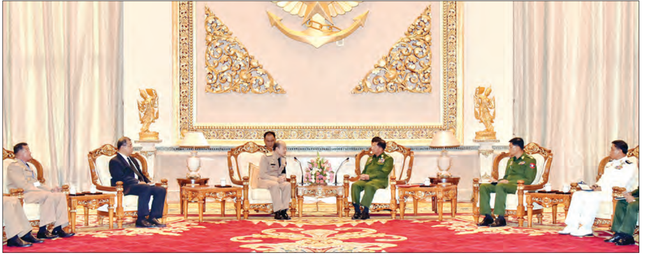
တပ်မတော်ကာကွယ်ရေးဦးစီးချုပ် ဝိုလ်ချုပ်မှူးကြီး မင်းအောင်လှိုင်နှင့် ထိုင်းဘုရင့်တပ်မတော် ရေတပ်ဦးစီးချုပ် Admiral Na Arreenich တို့ တွေ့ဆုံဆွေးနွေးစဉ်