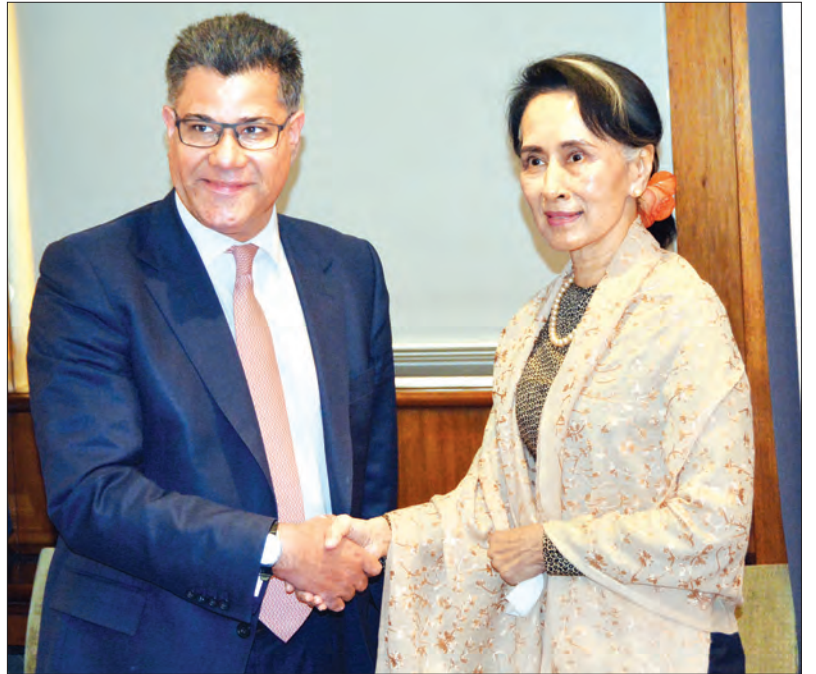
နိုင်ငံတော်၏ အတိုင်ပင်ခံပုဂ္ဂိုလ် ဒေါ်အောင်ဆန်းစုကြည်နှင့် နိုင်ငံခြားရေးနှင့် ဓနသဟာယ ရေးရာဝန်ကြီးဌာန အာရှနှင့် ပစိဖိတ်ဒေသဆိုင်ရာ ဒုတိယဝန်ကြီး Mr. Alok Sharma တို့ ရင်းရင်းနှီးနှီးနှုတ်ဆက်စဉ်

ရှေ့မှ လုပ်ရမည်ဖြစ်ပါကြောင်း၊ နှလုံးရည်ပြည့်ဝအောင် လုပ်ရမည်ဖြစ်ပါကြောင်း၊ အစိုးရသစ်အနေဖြင့် ပြည်သူ့အပေါ်တွင် မေတ္တာထားပြီး နိုင်ငံအပေါ်တွင် သစ္စာစောင့်သိပါကြောင်း၊ မြန်မာနိုင်ငံသားများအနေဖြင့် ပြည်ပတွင် နေထိုင်သော်လည်း မိမိတို့သားသမီးများအား မြန်မာ့ယဉ်ကျေးမှု သိရှိအောင်နှင့် မြန်မာစကားကိုသင်ကြားပေးထားသင့်ပါကြောင်း၊ မြန်မာနိုင်ငံကို ကူညီချင်လျှင် မြန်မာ့ယဉ်ကျေးမှုကို အခြေခံနားလည်ရမည် ဖြစ်ပါကြောင်း၊ ကိုယ့်ယဉ်ကျေးမှုကို လေးစားရမည်ဖြစ်ပါကြောင်း ပြောကြားသည်။