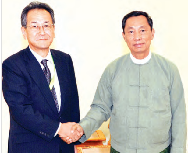
ပြည်ထောင်စုလွှတ်တော်၊ ဥပဒေရေးရာနှင့်အထူးကိစ္စရပ်များ လေ့လာဆန်းစစ်သုံးသပ်ရေးကော်မရှင်ဥက္ကဋ္ဌ သူရဦးရွှေမန်း၊ ဂျပန်နိုင်ငံ သံအမတ်ကြီး မစ္စတာတာတရှိဟိဂူချိအား ရင်းရင်းနှီးနှီးဆက်စဉ် (သတင်းစဉ်)