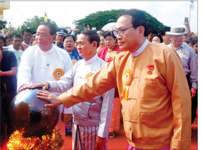
ပြည်သူ့လွှတ်တော်ဥက္ကဋ္ဌ ဦးဝင်းမြင့်၊ ပြည်ထောင်စုဝန်ကြီး ဦးဝင်းခိုင်၊ ပြည်နယ်ဝန်ကြီးချုပ် ဒေါက်တာအေးခံတို့က ကမ္ဘည်းမော်ကွန်းကျောက်စာတိုင်ကို စက်ခလုတ်နှိပ် ဖွင့်လှစ်ပေးစဉ် (သတင်းစဉ်)

ပြည်ထောင်စုစိတ်ဓာတ် ပိုမိုခိုင်မြဲစေရန်အတွက် ပြည်ထောင်စုစိတ်ဓာတ် သို့မဟုတ် ပင်လုံစိတ်ဓာတ်ကို စတင် မွေးမြူပေးခဲ့သည့် အမျိုးသားခေါင်းဆောင် လွတ်လပ်ရေး ဗိသုကာတပ်မတော်၏ ဧည့်သည် ဦးဝင်းမြင့်အောင်ဆန်းကို သတိရ ဂုဏ်ပြုသောအားဖြင့် အမည်ပေးခြင်းမှာလည်း သင့်လျော် မွန်မြတ်လှပါကြောင်း၊ ကမ္ဘာ့နိုင်ငံများတွင်လည်း မိမိနိုင်ငံအတွက် ကိုယ်ကျိုးမဖက်၊ အနစ်နာခံပြီး အသက်ကို ပဓာနမထားသည့် တိုင်းပြည်နှင့် လူမျိုးအတွက် စွန့်လွှတ်စွန့်စား ဆောင်ရွက်ခဲ့သည့် သူရဲကောင်းများ၊ နိုင်ငံခေါင်းဆောင်များကို မှတ်တမ်းတင် ကမ္ဘာ့ထိုးပြီး အလေးထားဂုဏ်ပြုနေကြသည်ကို အားလုံးအသိ ဖြစ်ပါကြောင်း၊ အိမ်နီးချင်းနိုင်ငံ တစ်နိုင်ငံဖြစ်သည့် အိန္ဒိယနိုင်ငံ တွင် မျိုးချစ်ခေါင်းဆောင်ကြီး မဟတ္တမဂန္ဒီ၏အမည်ကိုဂုဏ်ပြုပြီး တံတားများအမည်ပေးခဲ့သည်များ ရှိခဲ့ပါကြောင်း။