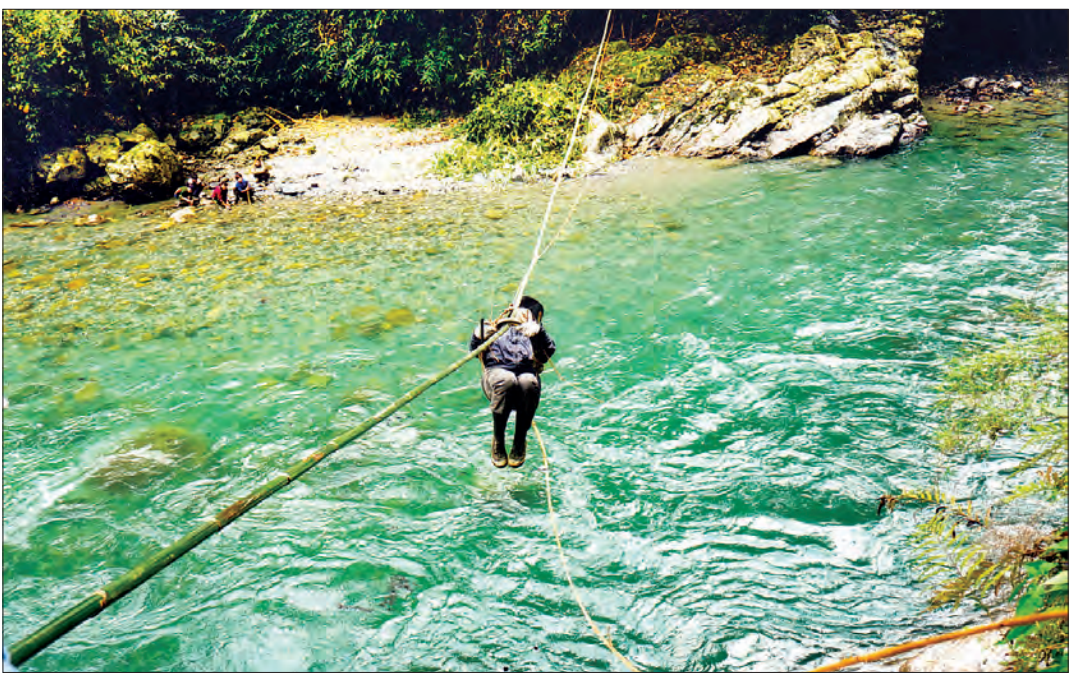
သဘာဝခေါ်သံဖောင်ဒေးရှင်း တောင်တက်အဖွဲ့ လွန်ခရုမာဒင်ရေခဲတောင်သို့ သွားရောက်သည့်ခရီးတွင် တွေ့ရစဉ်