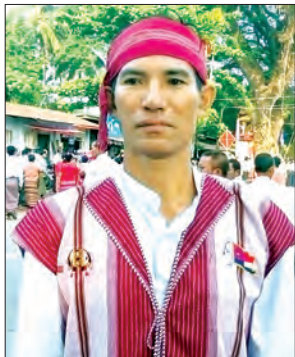
စောဗိုလ်စိန်ဦး