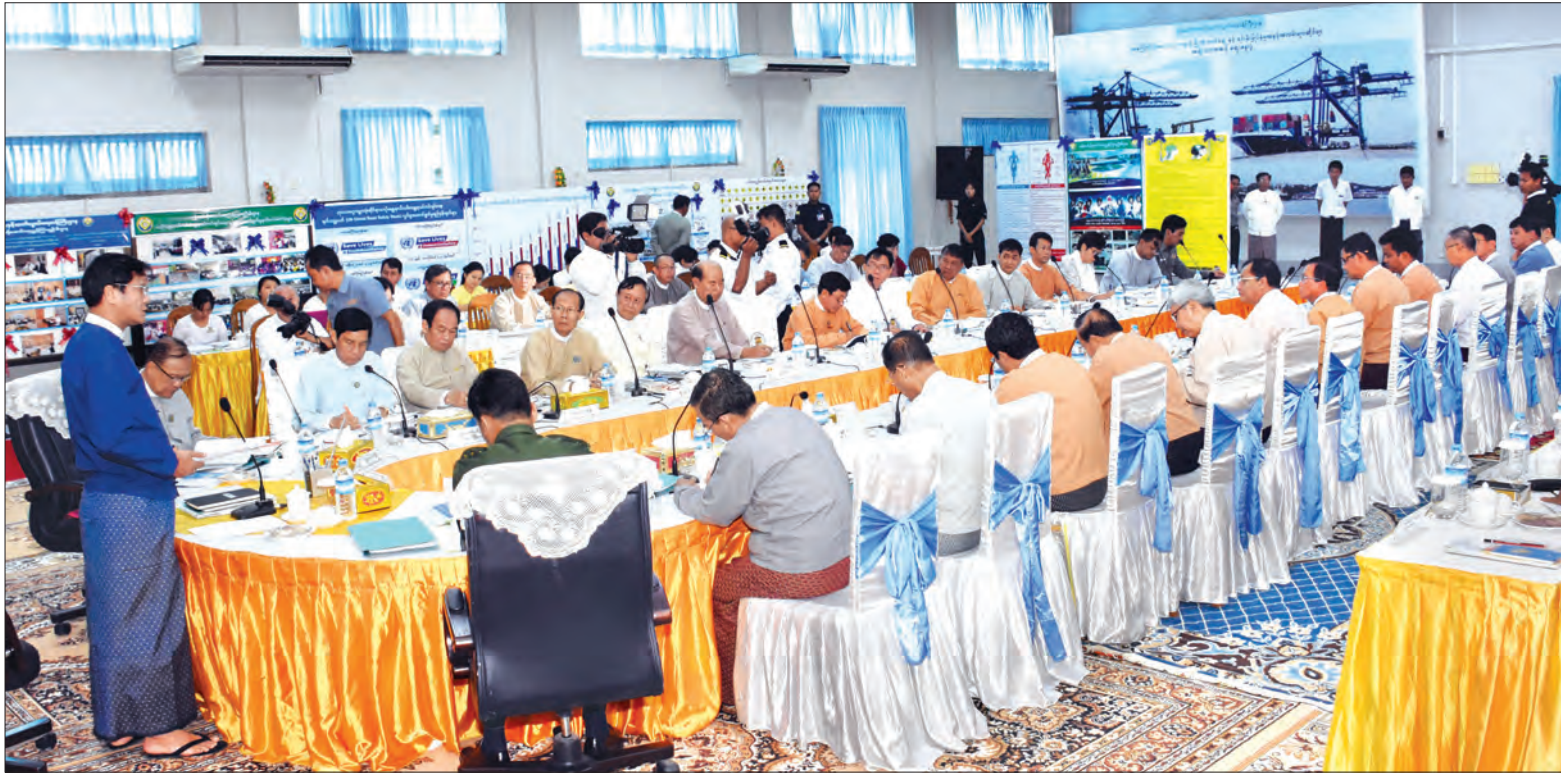
ဒုတိယသမ္မတ ဦးဟင်နရီဇန်တီးယူ အမျိုးသားယာဉ်အန္တရာယ်၊ လမ်းအန္တရာယ်ကင်းရှင်းရေးကောင်စီ၏ ဒုတိယအကြိမ် အစည်းအဝေးတွင် အမှာစကားပြောကြားစဉ်