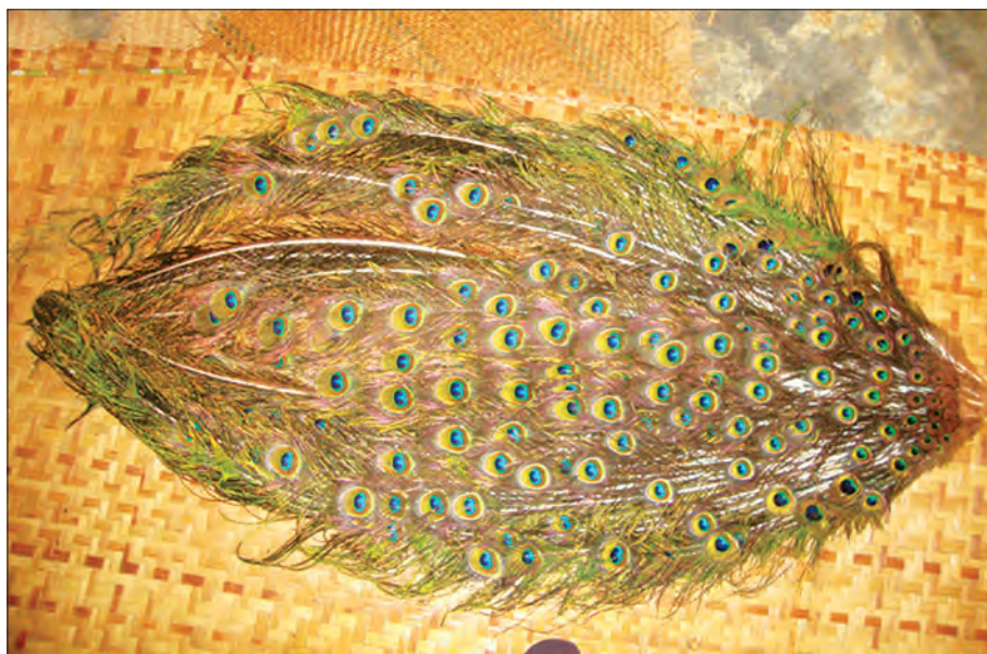
ထောင်ချောက်နှင့် ထောင်ဖမ်းမှုကြောင့်သေဆုံးသွားသည့် ဥဒေါင်းငှက်ဖို၏ အရည်သုံးတောင်ခန့်ရှိ အမြီးကွက်အား တွေ့ရစဉ်

“ဒီတောထဲမှာ ဥဒေါင်းငှက် တော်တော်များများ တွေ သေးတယ်။ အရေအတွက်ကတော့ အတိအကျမပြောနိုင်ဘူး။ တပို့တွဲလဆိုရင် အမွှေးအတောင်ချွတ်ချပြီး လူသွားလူလာ ခေါင်းပါးတဲ့ တောထဲမှာဥတယ်။ တစ်ခါဥရင် ငါးလုံးကနေ သုံးလုံးအထိပဲ ဥတယ်။ သူ့ရဲ့ဥက ငန်းဥလိုပဲ အဖြူရောင်ပါ။ ၄၅ ရက်လောက်ဆိုရင် သားပေါက်တယ်။ အခုဆိုရင် ဥဒေါင်း ပေါက်လေးတွေဖြစ်နေပြီ။ ဒီအချိန်က ဥဒေါင်းပေါက်လေးတွေ ကြီးထွားလာအောင် ဥဒေါင်းမ၊ ဥဒေါင်းဖိုကြီးတွေက တောထဲ