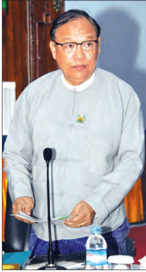
ပြည်ထောင်စုဝန်ကြီး ဦးသန်းစင်မောင်

ရှင်းလင်းတင်ပြချက်များအပေါ် အစည်းအဝေးသို့ တက်ရောက်လာကြသူများက လေ့လာသုံးသပ်ပြီး အတွေးသစ်၊ အကြံသစ်၊ ဉာဏ်သစ်များကို အခြေခံကာနိုင်ငံ၏ ပကတိအခြေအနေမှန်နှင့် ကိုက်ညီဆီလျော်သည့် လုပ်ငန်းစဉ်သစ်များဖော်ထုတ်နိုင်ရေးနှင့် အဆိုပါ