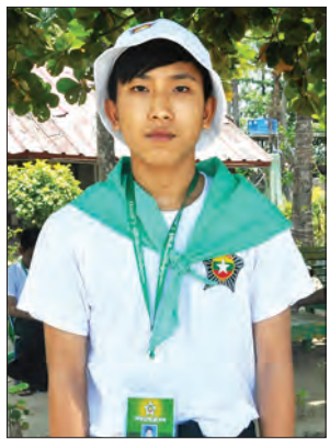
ခမ်းဆုန်

ကိုယ်မရောက်ဖူးတဲ့ ဒေသရောက်တဲ့အတွက် ဆန်းဆန်းပြားပြားအတွေ့အကြုံတွေရတယ်။ သူငယ်ချင်းတွေလည်း အများကြီးရတယ်။ သူတို့ဒေသအကြောင်းတွေလည်း သိခွင့်ရခဲ့တယ်။ တိုင်းရင်းသား သူငယ်ချင်းတွေလည်း ပါတယ်။ ဘာသာစကားအခက်အခဲရှိပေမယ့် ပြောဆိုဆက်ဆံရတာ အဆင်ပြေပါတယ်။ ထူးချွန်တဲ့လူငယ်တွေကို နိုင်ငံတော်က မြေတောင်မြှောက်ပေးနေတယ်။ နောင်လာမယ့် ညီငယ်ညီမငယ်တွေလည်း လူရည်ချွန်တွေဖြစ်ဖို့