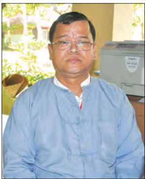
ဒုတိယညွှန်ကြားရေးမှူးချုပ် ဦးညွန့်စိုး

၂၀၁၃ခုနှစ်မှစ၍ လူရည်ချွန်စီမံကိန်းကို တက်စပညာထူးချွန်လူငယ်စီမံကိန်းအဖြစ် ပြန်လည်ဆောင်ရွက်လာခဲ့ကာ ပုဂံ၊ အင်းလေး၊ ငွေဆောင်တို့တွင် စခန်းများဖွင့်လှစ်၍ ကျောင်းသားကျောင်းသူများ နေထိုင်အပန်းဖြေခြင်း၊ လေ့လာရေးခရီးစဉ်များ၊ ဟောပြောပွဲလုပ်ငန်းစဉ်များကို ဆောင်ရွက်ခဲ့ကြသည်။