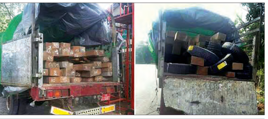
တရားဝင်စာရွက်စာတမ်းအထောက်အထားတစ်စုံတစ်ရာတင်ပြနိုင်ခြင်းမရှိသော ကျွန်းသစ်ခွဲသားအရွယ်အစားမျိုးစုံ

အဆိုပါ စစ်ဆေးရေးစခန်းများက တင်သွင်း/တင်ပို့သော ကုန်ပစ္စည်းများ အား စစ်ဆေးမှုပြုလုပ်ဆောင်ရွက်လျက် ရှိရာ ၂၀၁၇ ခုနှစ် ဧပြီ ၂၉ ရက် ရေပူ အမြဲတမ်းစစ်ဆေးရေးစခန်းက တားဆီး မှုလေးမူ ခန့်မှန်းတန်ဖိုးငွေကျပ် ၁၃၈