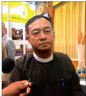
ဗိုလ်မှူးကြီး ဝဏ္ဏအောင်

JMC-U မှာ နှစ်လတစ်ကြိမ် အစည်းအဝေးလုပ်မယ်။ အဲဒီအစည်းအဝေးကနေ တိုင်းရင်းသားတွေ၊ အရပ်သားကိုယ်စားလှယ်ပါဝင်တဲ့ ဆုံးဖြတ်ချက်တွေအတိုင်း ဆောင်ရွက်သွားမှာ ဖြစ်ပါတယ်။ မိုင်းရှင်းလင်းရေးက NCA မှာလည်းပါတယ်။ ဆွေးနည်းဆွေးနေးနေတယ်။ ဆက်လက် ဆောင်ရွက်သွားမှာပါ။ အရင်က တပ်မတော်သားကိုယ်စားလှယ်တွေ အဆိုပြုတဲ့ ကရင်ပြည်နယ်မှာ Pilot Project ရှေ့ပြေးစီမံချက်တွေ ဆောင်ရွက်သွားဖို့ စီမံထားတာတွေရှိခဲ့ပါတယ်။ JCB ကနေ တစ်နှစ်ကို အမေရိကန် ဒေါ်လာ ၆ ဒသမ ၅ သန်း JMC ကို ခွင့်ပြုပါတယ်။ ဒေါက်တာရွှေခါးရီ(အတွင်းရေးမှူး-၁) ပြည်ထောင်စုအဆင့် ပစ်ခတ်တိုက်ခိုက်မှုရပ်စဲရေးဆိုင်ရာ ပူးတွဲစောင့်ကြည့်ရေးကော်မတီ တတ်လျက်ကတစ်နှစ်စာဒေါ်လာ ၆ ဒသမ ၅ သန်းရှိတယ်။