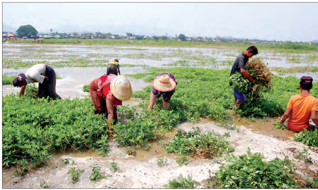
မြေပဲခင်းများတွင် ဧရာဝတီမြစ်ရေဝင်၍ တောင်သူများခက်ခဲစွာရိတ်သိမ်းနေစဉ်

ရေလွှမ်းစိုက်ခင်း ဧရိယာစုစုပေါင်း ၆၉၆၇ ဒဿမ ၄၀ ဧကဖြစ်ပြီး ဆောင်းမြေပဲနှင့် စပါးပျက်စီး ဧက ၁၃၂၂ ဒဿမ