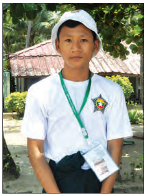
ဝိုင်းစံရွက်ဆိုင်

ငွေဆောင်ကမ်းခြေက ဒါပထမဆုံးရောက်ဖူးတာပါ။ ငွေဆောင်ကမ်းခြေရောက်တော့ မွန်းကျပ်တာတွေ လွတ်ထွက်သွားပြီး စိတ်တွေပေါ့ပါး လန်းဆန်းသွားတယ်။ ဘော်လခဲမှာတော့ သိပ်