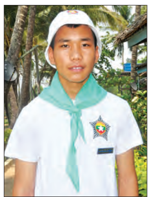
အိဆတ်လားဒင့်ပွီးအာ

အပန်းဖြေလေ့လာရေးခရီးစဉ်မှာ တိုင်းရင်းသားမျိုးစုံပါတယ်။ ဒီခရီးစဉ်က