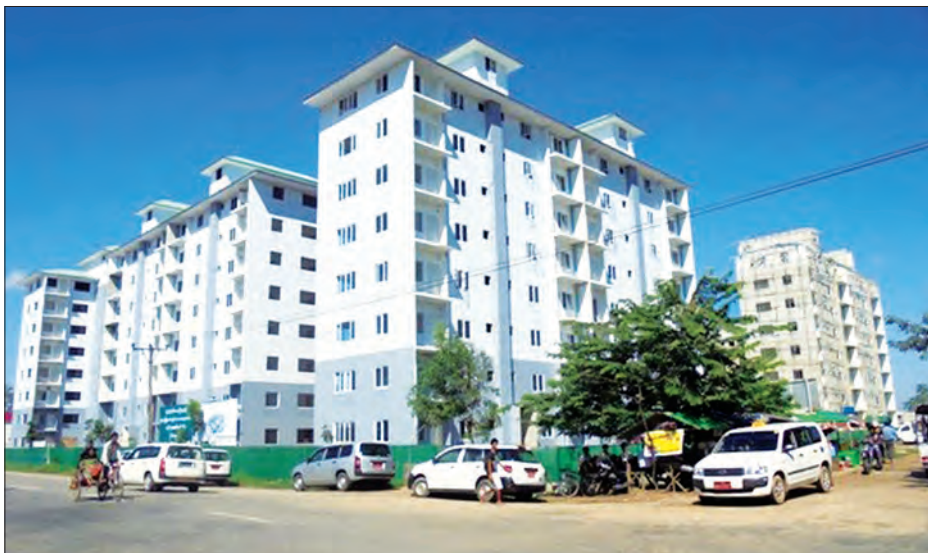
လက်ရှိလူနေထိုင်ကြပြီဖြစ်သော ပိုလ်ပထူးတန်ဖိုးမျှတအိမ်ရာစီမံကိန်း Phase 1 အပိုင်းကို တွေ့ရစဉ်

လမ်းထောင့်ဆုံရာနေရာ၌ တည်ရှိသည်။ ပိုလ်ပထူးတန်ဖိုးမျှတ အိမ်ရာစီမံကိန်း Phase 2 အပိုင်း၌ အိမ်ခန်းအကျယ် စတုရန်းပေ ၉၀၀ အကျယ်အဝန်းရှိ အထပ်မြင့် ရှစ်ထပ်တိုက်အဆောက်အအုံ ၁၉ လုံးနှင့် အိမ်ခန်းအကျယ် စတုရန်းပေ ၆၀၀ အကျယ်အဝန်းရှိ အထပ်မြင့်ရှစ်ထပ်တိုက်အဆောက်အအုံ ရှစ်လုံးတို့အား ဆောက်လုပ်သွားမည် ဖြစ်ပြီး စုစုပေါင်း အဆောက်အအုံ ၂၇ လုံးဆောက်လုပ်သွားမည်ဖြစ်ကာ အိမ်ခန်းပေါင်း ၈၆၄ ခန်း ပါဝင်မည်ဖြစ်သည်။ ဆောက်လုပ်မည့် အိမ်ခန်းအကျယ် စတုရန်းပေ ၆၀၀ အကျယ်အဝန်းရှိ အိမ်ခန်းများအတွင်း ဧည့်ခန်း၊ အိမ်ခန်း နှစ်ခန်း၊ ရေချိုးခန်း၊ မီးဖိုခန်းများပါဝင်ပြီး အိမ်ခန်းအကျယ် စတုရန်းပေ ၉၀၀ အကျယ်အဝန်းရှိ အိမ်ခန်းများအတွင်း ဧည့်ခန်း၊ အိမ်ခန်း သုံးခန်း၊ ရေချိုးခန်း၊ မီးဖိုခန်းများပါဝင်ကာ အဆောက်အအုံများအတွင်း လှေကားအပါအဝင် ဓာတ်လှေခါးများ ထည့်သွင်းဆောက်လုပ် သွားမည်ဖြစ်သည်။ အိမ်ခန်း ၁၆ ခန်း