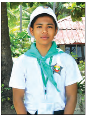
သော်တာစိုး

အခုလို လေ့လာရေးအပန်းဖြေခရီးလာရတာ ကိုယ့်ပြည်နယ်ထဲကတင် မဟုတ်ဘဲ တခြားပြည်နယ်နဲ့ တိုင်းဒေသကြီးတွေကလည်းပါတော့ တစ်ယောက်နဲ့ တစ်ယောက် သူငယ်ချင်းတွေ ဖြစ်သွားတယ်။ ရင်းနှီးမှုတွေဖြစ်ပြီး သူတို့ဒေသရဲ့ ယဉ်ကျေးမှုတွေ၊ ဓလေ့တွေ သိခွင့်ရခဲ့တယ်။ ရခိုင်မှာနေတော့ ငလီဘက်တော့ ရောက်ဖူးပါတယ်။ ငွေဆောင်က ဒါပထမဆုံးအကြိမ်ပါ။ မြေပြန်ဒေသတွေမှာက လမ်းပန်းဆက်သွယ်ရေးက အားလုံးအဆင်ပြေတယ်။ အမ်းမှာက တောင်ကုန်း၊