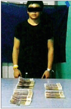
ထိုင်းနိုင်ငံသားအား ငွေစက္ကူအတုများ နှင့်အတူ တွေ့ရစဉ်

ကျပ်ငါးရာတန် မြန်မာငွေစက္ကူအတု ၃၃ ရွက်ကို ရှာဖွေတွေ့ရှိ သိမ်းဆည်း ရမိခဲ့သည်။ ဖြစ်စဉ်နှင့်ပတ်သက်၍ မြန်မာငွေစက္ကူအတုနှင့်အတူ တွေ့ရှိခဲ့သည့် ထိုင်းနိုင်ငံသား နတ်ခြားနီးအား မြဝတီမြို့မှရဲစခန်းတွင် အမှုဖွင့်အရေးယူထားပြီး ဆက်လက်စစ်ဆေးလျက်ရှိကြောင်း သိရသည်။ မင်းသူ၊ ထွန်းထွန်းထွေး(ဘားအံ)