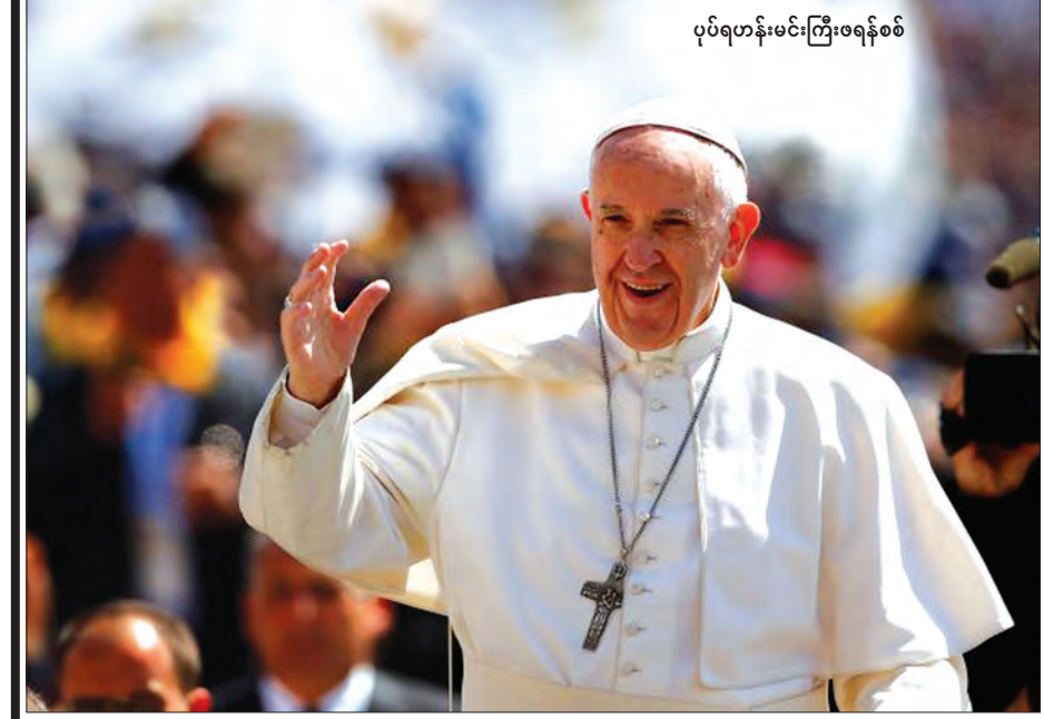
ပုပ်ရဟန်းမင်းကြီးဖရန်စစ်

ယခုလအတွင်း ပင်နီဇွဲလားနိုင်ငံတွင် ဆူပူမှုများဖြစ်ပွားကာ လူ ၃၀ နီးပါး သေဆုံးခဲ့ရသည်။ ပုပ်ရဟန်းမင်းကြီးဖရန်စစ်သည် စိန့်ပီတာရပ်ပြင်၌ လူထောင်ပေါင်းများစွာတို့ကို ပြောကြားသည့် မိန့်ခွန်းတွင် ယင်းသို့ တိုက်တွန်းခဲ့ခြင်းဖြစ်သည်။