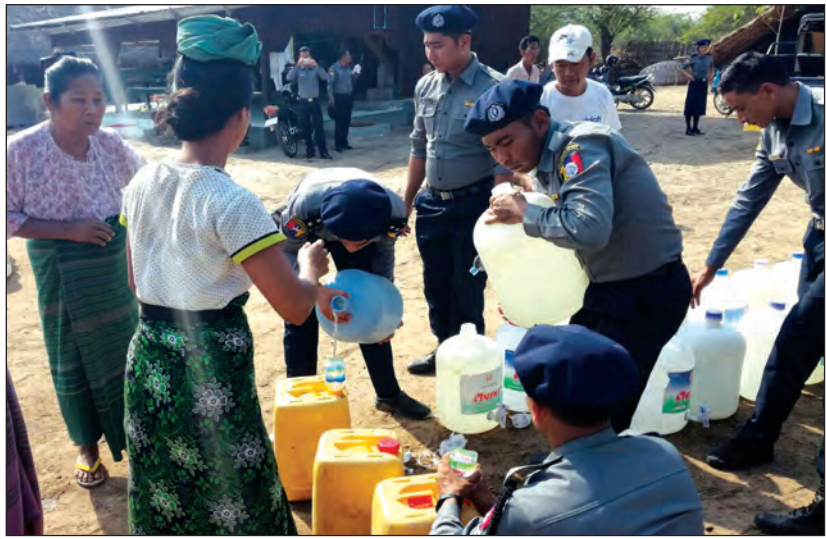
ဝက်လက် ဧပြီ ၃၀

စစ်ကိုင်းတိုင်းဒေသကြီး ဝက်လက်မြို့နယ် ဟန်လင်းကျေးရွာတွင် ရေရှားပါးပြတ်လပ်နေသဖြင့် ပြည်သူများ သောက်ရေအခက်အခဲ မဖြစ်စေရေးအတွက် သောက်ရေသန့်များကို ရွှေဘိုခရိုင်ရဲတပ်ဖွဲ့မှူး၏ ကြီးကြပ်မှုဖြင့် ဝက်လက်မြို့နယ် ရဲတပ်ဖွဲ့က ဧပြီ ၂၇ ရက်တွင် ကျေးရွာအရောက် သွားရောက်လှူဒါန်းခဲ့ကြောင်း သိရသည်။ ဟန်လင်းကျေးရွာအုပ်စုအတွင်းရှိ မလားကုန်းရပ်၊ မင်းရပ်၊ ပတ္တလာရပ်၊ ကုန်းကြောင်းရပ်၊ မင်းရွာရပ်၊ ကိုးအိမ်ထောင်ရပ်၊ တောင်ဘိုရပ်တို့ရှိ ပြည်သူများအတွက် ကျပ် ၁၇၀၀၀၀ တန်ဖိုးရှိ သောက်ရေသန့်ကြီး ၄၃၀ ကို ရဲတပ်ဖွဲ့ဝင်များက ကျေးရွာအရောက် သွားရောက်လှူဒါန်းပေးခဲ့ကြောင်း သိရသည်။ ယခုနေ့ရာသီတွင် ဝက်လက်မြို့နယ်အတွင်း ကျေးရွာများ၌ သောက်ရေအခက်အခဲမဖြစ်စေရန်အတွက် ဝက်လက်မြို့နယ် ရဲတပ်ဖွဲ့၏ အစီအစဉ်ဖြင့် မြို့နယ်ရဲတပ်ဖွဲ့မှူးရုံးအနေဖြင့် သောက်ရေသန့်များ လှူဒါန်းပေးလျက်ရှိကြောင်း သိရသည်။