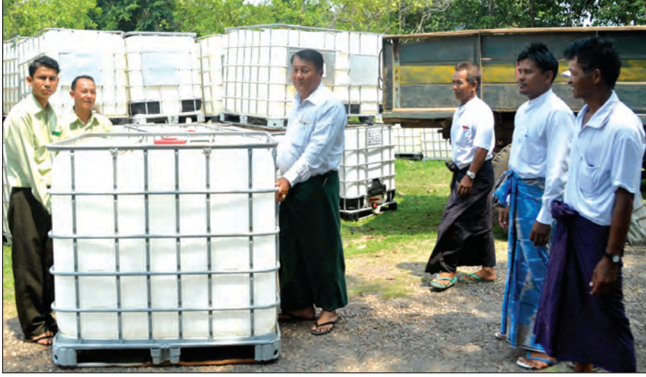
တန်ဖိုးရှိကြောင်း သိရသည်။ ကျေးရွာ တစ်ရွာလျှင် ရေပီပါနှစ်လုံးစီကို မြို့နယ် ကျေးရွာအုပ်ချုပ်ရေးမှူးများထံ ဖြန့်ဝေပေးအပ်ခဲ့သည်။ (မြို့နယ် ပြန်/ဆက်)

မွန်ပြည်နယ် ချောင်းဆုံမြို့နယ်အတွင်းမှ ရေရှားပါးသည့်ကျေးရွာများတွင် သောက်သုံးရေလုံလောက်မှုရှိစေရန် အတွက် သဘာဝဘေးအန္တရာယ်ဆိုင်ရာ ရန်ပုံငွေ ထိန်းသိမ်းရေးကော်မတီမှ ပေးအပ်သည့် လီတာ ၁၀၀၀ ဆံ့ ရေပီပါများကို ဧပြီ ၂၈ ရက်က မြို့နယ်အထွေထွေအုပ်ချုပ်ရေးမှူးရုံးက ကျေးရွာများသို့ ဖြန့်ဝေပေးခဲ့ကြောင်း သိရသည်။