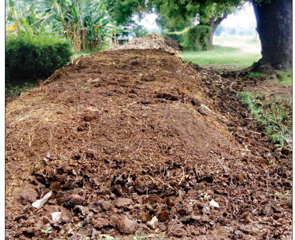
သဘာဝမြေဆွေးမြေဩဇာပြုလုပ်ထားပုံ

နွေရာသီတွင် မြေဆွေးပုံပြုလုပ်မည်ဆိုပါက တစ်ပတ်တစ်ကြိမ်ရေဖျန်းပေးလျှင် အကောင်းဆုံး ဖြစ်ကြောင်း၊ ရေအချို့ဘတ်ကိုထိန်းနိုင်ရန်အတွက် အပေါ်မှ ပလတ်စတစ် အကြည်စ သို့မဟုတ် မိုးကာများအုပ်ထားပေးရမည်ဖြစ်ကြောင်း၊ တောင်သူများအနေဖြင့် မြေဆီလွှာပြုပြင်ရာတွင် တစ်ဧကကို သဘာဝမြေဆွေးမြေဩဇာ အလျား ပေ ၃၀၊ အနံ ရှစ်ပေ၊ အမြင့်လေးပေတစ်ပုံ အသုံးပြုရန်လုံလောက်ကြောင်း အဆိုပါ မြေဆွေးပုံများကိုပြုလုပ်ပြီး သုံးလကြာတွင်စိုက်ခင်းများ၌ အသုံးပြုနိုင်ကြောင်း သိရသည်။