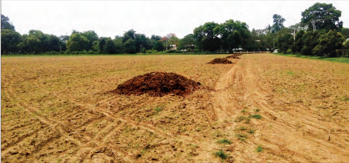
သီးနှံမစိုက်ပျိုးမီ ယာခင်းထဲတွင် သဘာဝမြေဆွေးမြေဩဇာများပုံထားစဉ်

“ကျွန်တော်တို့မြို့မှာဆိုရင် မြေကြီးတွေက သုံးသီးစိုက်တဲ့အတွက် အင်မတန်မှ အပေါ့ယာ Top Soil တွေဟာ သီးနှံတွေစားသုံးမှုနောက်ကို ပါသွားတဲ့အခါ မြေဆီလွှာ အားနည်းလာတယ်။ အဲဒီမှာ နောက်ထပ် မြေဆီလွှာပြုပြင်ထိန်းသိမ်းခြင်းလုပ်ငန်းတွေလုပ်ရပါတယ်။ အဲဒီလို ပြုလုပ်တဲ့အခါမှာ တစ်နှစ်ကို မြေဆွေးတန် ၄၀၀ လောက်ထုတ်ပြီး နွေရာသီသီးနှံတွေသိမ်းပြီးတဲ့အချိန်မှာ ယာမြေတွေထဲကို လိုက်ထည့်ရပါတယ်။ ကျွန်တော်တို့မြို့က ယာမြေပြုပြင်တဲ့အခါမှာ သဘာဝမြေဆွေးမြေဩဇာကိုပဲ အသုံးပြုပါတယ်။ မြေပြုပြင်ဖို့ကောင်းတဲ့အချိန်ကတော့ မိုးမကျခင် အတွက်တွေထဲမှာ လိုက်ဖြန့်ပါတယ်။ ပြီးရင် ၁၆ သွားတစ်စပ် လက်ရှိ မြေကြီးနဲ့ ထည့်ထားတဲ့ သဘာဝမြေဆွေးမြေဩဇာကို သမအောင်မွှေပေးရပါတယ်။ အဲဒါပြီးရင် သုံးသွားဒါမှမဟုတ် ခုနှစ်သွားနဲ့ မွှေပြီးနားထားရပါတယ်။ ပြီးရင်တော့ မိုးဦးကျပြီဆိုတာနဲ့ ပဲတီစိမ်းပဲ စိုက်စိုက်၊ နေကြာပဲစိုက်စိုက်၊ ဘယ်သီးနှံမဆို စိုက်ပျိုးဖို့အတွက် မြေဆီလွှာတွေပြန်ပြီး ကျန်းမာလာပါမယ်။ တောင်သူတွေအနေနဲ့လည်း သဘာဝမြေဆွေးမြေဩဇာကို အသုံးပြုပြီး မြေဆီလွှာပြုပြင်မယ်ဆိုရင်လည်း အခက်အခဲဘာမှမရှိပါဘူး။ မလုပ်နိုင်စရာလည်းမရှိပါဘူး။ မြေဩဇာပြုလုပ်မယ်ဆိုရင် အကွက်ထဲကထွက်လာတဲ့ အမှိုက်သရိုက်တွေကို အသုံးပြုပြီးပြုလုပ်ရတာပါ” ဟု တပ်ကုန်စိုက်ပျိုးရေး