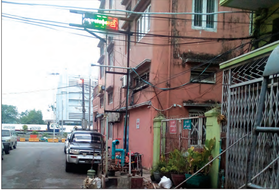
အဝီစိရေစက်နှင့် ရေတင်ပေးနေချိန်ကို အသိပေးထားသော ဆိုင်းဘုတ်