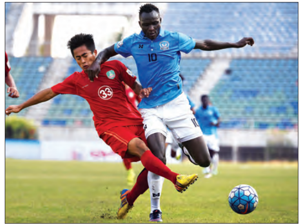
မြဝတီနှင့် စီးတီးရန်ကုန်အသင်း လိဂ်ပြိုင်ပွဲတွင် တွေ့ဆုံခဲ့စဉ်