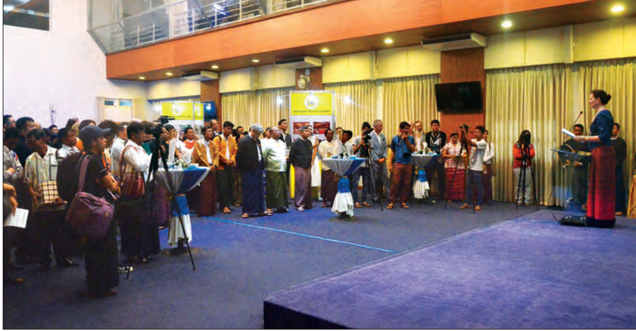
ပစ်ခတ်တိုက်ခိုက်မှုရပ်စဲရေးဆိုင်ရာ ပူးတွဲစောင့်ကြည့်ရေးကော်မတီရန်ပုံငွေဆိုင်ရာ ထောက်ပံ့မှုပလက်ဖောင်း (JMC Support Platform) စတင်သည့် အခမ်းအနား ကျင်းပစဉ်

ဒါကို နိုင်ငံတကာက စုပေါင်းထည့်ဝင်တာပါ။ အခု ပထမနှစ်အတွက်ပါ။ ဒေသန္တရအဆင့် JMC-L တွေ ဖွဲ့ဖို့ရှိတယ်။ နောက် NCA လက်မှတ်ထိုးတဲ့ အဖွဲ့တွေ ပိုပြီးများလာရင် ဒီထက် ကြီးလာမှာပေါ့။ အခုကဒေသန္တရအဆင့် JMC-L ဆယ်ခုအတွက် ရည်မှန်းထားတယ်။ အခုကဒေသန္တရအဆင့်ဖွဲ့ဖို့ ရှေ့အပတ်ထဲမှာ အစည်းအဝေးရှိတယ်။ ဒါကိုသဘောတူရင် စတင်မယ်။ ဘယ်နေရာစလုပ်မယ်ဆိုတာကို လျာထားတာတွေမရှိဘူး။ ဆယ်နေရာလုပ်မယ်လို့ပဲ ရည်ရွယ်ထားတာရှိတယ်။ ကြည့်ရမှာက Local Level ဖွဲ့မယ်ဆို ထိတွေ့မှုရှိနိုင်မယ့် ဖြစ်နိုင်ခြေများတဲ့ နေရာတွေမှာ ဖွဲ့မယ်။ ဒေါ်လာ ၆ ဒသမ ၅ သန်းသုံးစွဲဖို့ အသေးစိတ် စီစဉ်ရေးဆွဲထားတာရှိတယ်။ ကော်မတီတွေက ဒေသအဆင့်ကနေ ပြည်ထောင်စုအဆင့်ထိ သတ်မှတ်ထားတဲ့ အစည်းအဝေးတွေ လုပ်မယ်။ နဲ့ပါတ်တစ်အနေနဲ့ လိုအပ်တဲ့ဝန်ထမ်းတွေ ခန့်မယ်။