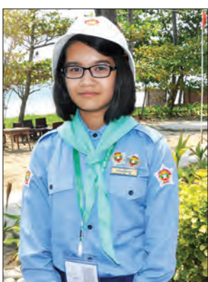
လှယဉ်ကျေး

ကြီးရတယ်။လူရည်ချွန်ဟောင်းကြီးတွေနဲ့ တွေ့ဆုံရတဲ့အတွက် သူတို့လုပ်ကိုင်ဆောင်ရွက်နေတဲ့ လူမှုအကျိုးပြုလုပ်ငန်းတွေကိုလည်း လုပ်ချင်လာတယ်။ ရည်မှန်းချက်ကတော့ တိုးရစ်ဂိုက်တစ်ယောက်ဖြစ်ချင်တယ်။ ငယ်ငယ်ကတည်းက ခရီးသွားရတာ ဝါသနာပါတယ်။