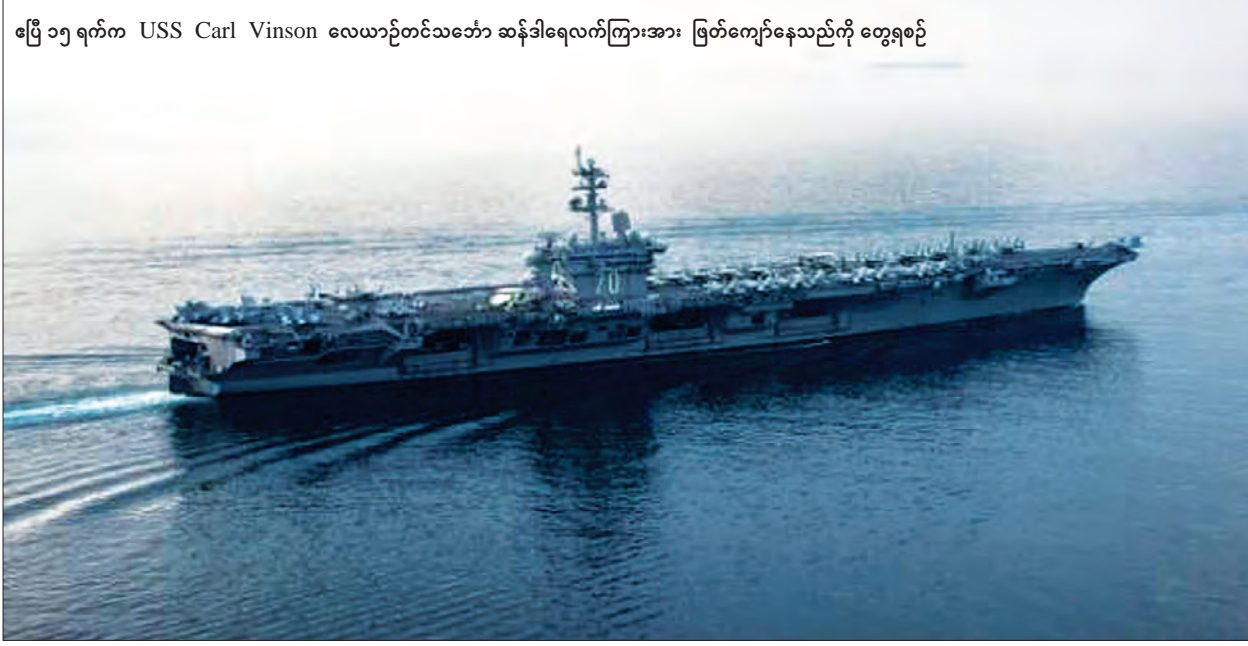
ဧပြီ ၁၅ ရက်က USS Carl Vinson လေယာဉ်တင်သင်္ဘော ဆန်ဒါရေလက်ကြားအား ဖြတ်ကျော်နေသည်ကို တွေ့ရစဉ်

အစီအစဉ်နှင့် ဒုံးကျည်စမ်းသပ်မှုများ ရှေ့တိုးဆောင်ရွက်လာမှုနှင့် အမေရိကန် နှင့် ၎င်း၏ အာရှမဟာမိတ်နိုင်ငံများ အား တိုက်ခိုက်မည်ဟု မြောက် ကိုရီးယားက ခြိမ်းခြောက်လာမှုအပေါ် တင်းမာလာသည့် တုံ့ပြန်မှုတစ်ရပ် အနေဖြင့် အမေရိကန်သမ္မတ ဒေါ်နယ် ထရန်သည် ကိုရီးယားကျွန်းဆွယ် ရေပိုင်နက်အတွင်းသို့ USS Carl Vinson တိုက်ခိုက်ရေးအုပ်စုအား စေလွှတ်ရန် အမိန့်ပေးခဲ့သည်။ အမေရိကန် တိုက်ခိုက်ရေးအုပ်စု သည် ကိုရီးယားကျွန်းဆွယ်ဧရိယာ အတွင်းသို့ ချဉ်းကပ်ဝင်ရောက်လာပြီး ဖြစ်သော်လည်း တိုက်ခိုက်ရေးအုပ်စု ရောက်ရှိနေသည့် နေရာအတိအကျကို အမေရိကန်က ဖော်ပြခြင်းမရှိပေ။ အမေ ရိကန် ဒုတိယသမ္မတ မိုက်ပန့်စ်က လေယာဉ်တင်သင်္ဘောသည် ရက်အနည်း ငယ်အတွင်း ကိုရီးယားကျွန်းဆွယ် သို့ ရောက်ရှိလိမ့်မည်ဖြစ်သည်ဟုသာ ဖော်ပြခဲ့ပြီး အသေးစိတ်ပြောကြားခဲ့ခြင်း မရှိပေ။ မြောက်ကိုရီးယားအနေဖြင့်လည်း (ရိုက်တာ) အလျော့ပေး တင်းမာခဲ့ခြင်းဖြစ်သည်။ မြောက်ကိုရီးယားအာဏာရ အလုပ် သမားပါတီက ထုတ်ဝေသည့် ရီဒေါင် ဆင်မန်သတင်းစာက မြောက်ကိုရီးယား တော်လှန်ရေး အင်အားစုများသည် အမေရိကန်နယ်လီယားစွမ်းအင်သုံး လေယာဉ်တင်သင်္ဘောကို တစ်ကြိမ် တိုက်ခိုက်ခြင်း နှစ်မြှုပ်သွားအောင် ပြုလုပ် ပစ်ရန် အသင့်ပြင်ဆင်ထားပြီးဖြစ် ကြောင်း ဖော်ပြရေးသားခဲ့သည်။ ယင်းသတင်းစာတွင် အမေရိကန် လေယာဉ်တင်သင်္ဘောအား ရိုင်းရိုင်း ကြမ်းတမ်းသည့် တိရစ္ဆာန်တစ်ကောင် အဖြစ် ခိုင်းနှိုင်းခဲ့ပြီး ယင်းသင်္ဘောအား တိုက်ခိုက်မှုသည် မြောက်ကိုရီးယား၏ စစ်အင်အားကိုပြသမည့် ဥပမာတစ်ခု ဖြစ်လာလိမ့်မည်ဟု၍ ပြောဆိုရေးသား ခဲ့သည်။ မြောက်ကိုရီးယားဘက်မှ ထိုသို့ တုံ့ပြန်ခြင်းမြောက်ပြောဆိုမှုကို ရီဒေါင် ဆင်မန်သတင်းစာ၏ စာမျက်နှာသုံး တွင် ရေးသားဖော်ပြခဲ့ခြင်းဖြစ်ကြောင်း သိရသည်။