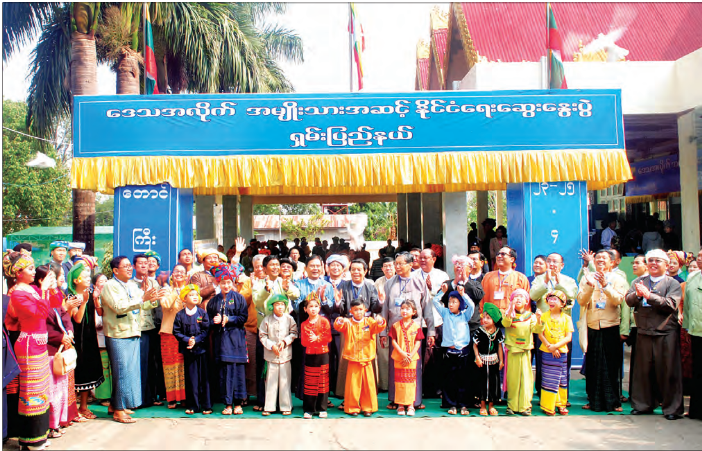
ရှမ်းပြည်နယ်ဒေသအလိုက် အမျိုးသားအဆင့်နိုင်ငံရေးဆွေးနွေးပွဲကို ဖဲကြိုးဖြတ်ဖွင့်လှစ်ပေးပြီး တိုင်းရင်းသားကလေးငယ်များက ငြိမ်းချမ်းရေးအထိမ်းအမှတ် ချီးမြှင့်မှုများ လွှတ်ပေးကြစဉ် (သတင်းစဉ်)