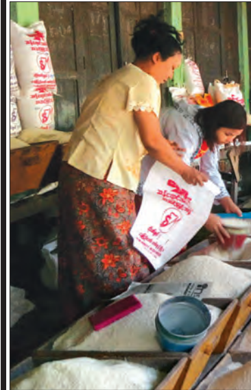
ဆန်ပွဲရုံတစ်ရံတွင် ဆန်များရောင်းချနေသည်ကို တွေ့ရစဉ်

ကြက်သွန်ဖြူ (ကြူကုတ်) ဈေးဆက်တိုက်တက် ကြက်သွန်ဖြူကတော့ ဈေးဆက်တိုက်တက်နေပါတယ်။ ဧပြီလဆန်းပိုင်းကတည်းက ဈေးတက်နေတာဖြစ်ပြီး မတ်လနဲ့ နှိုင်းယှဉ်လိုက်ရင်တော့ တစ်ပိဿာကို ငွေကျပ် ၁၀၀၀ နီးပါး တက်လာပါတယ်။ လတ်တလောပေါက်ဈေးကတော့ ကြက်သွန်ဖြူ (ကြူကုတ်) က တစ်ပိဿာကိုငွေကျပ် ၅၉၀၀ ပေါက်ဈေးရှိပါတယ်။ အာလူး အသစ်ဝင်ရောက် အာလူးကတော့ ရှမ်းသိန်ကုန်းဆိုတဲ့ အမျိုးအစားက သင်္ကြန်နှစ်ကူးကာလပြီးတဲ့အချိန်မှာ ဝင်ရောက်လာပါတယ်။ ငွေကျပ် ၂၇၀ ကနေ ငွေကျပ် ၇၃၀ အထိ ပေါက်ဈေးရှိနေပါတယ်။ နှမ်းဖြူ နှစ်သစ်ကူး ရုံးပိတ်ရက်အပြီး ကုန်စည်ဒိုင်စဖွင့်ချိန်မှာတော့ နှမ်းဖြူက ၄၅ ပိဿာကို ငွေကျပ် ၁၀၃၀၀၀ ပေါက်ဈေးရှိနေပါ တယ်။ နှမ်းနက် (စမုံ) နဲ့နှမ်းညို ဈေးအနည်းငယ်တက် နှမ်းနက် (စမုံ) ကလည်း ၄၅ ပိဿာကို ငွေကျပ် ၁၂၆၀၀၀ ကနေငွေကျပ် ၁၃၃၀၀၀ ပေါက်ဈေးရှိနေပြီး နှမ်းညိုကတော့ ငွေကျပ် ၈၀၀၀၀ ကနေ ငွေကျပ် ၈၅၀၀၀ ပေါက်ဈေးရှိနေပါတယ်။ နှမ်းညိုကတော့ တစ်အိတ်ကို ငွေကျပ် ၅၀၀၀ ဈေးတက်လာပြီး တော့ နှမ်းနက် (စမုံ) ကတော့ ငွေကျပ် ၃၀၀၀ လောက် ဈေးတက်လာပါတယ်။