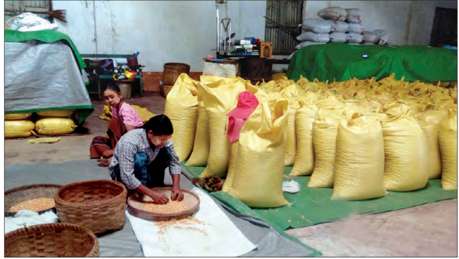
တပ်ကုန်းစိုက်ပျိုးရေးသုတေသနဌာနမှ စမ်းသပ်စိုက်ပျိုးထားသော ပြောင်းမျိုးဈေးကွက်တင်ရန် ပြင်ဆင်နေစဉ်

အဲဒီမျိုးရဲ့ ထူးခြားချက်က တစ်ဧက အထွက်နှုန်း တင်း ၁၂၀ ကနေ ၁၂၅ တင်း အထိ ထွက်ပါတယ်။ ကျွန်တော်တို့ စမ်းသပ်စိုက်ဧကတွေထဲမှာ စမ်းသပ်စိုက်ပျိုးတဲ့အခါမှာလည်း ပြောင်းအစိုတင်း ၁၂၀ အထိ ထွက်ရှိခဲ့ပြီး နောက် ပွဲရုံတင်သွင်းဖို့ အခြောက်ခံပြီးတဲ့အခါမှာ တင်း ၁၃၀ အထိ ထွက်ရှိခဲ့ဖူးပါတယ်။