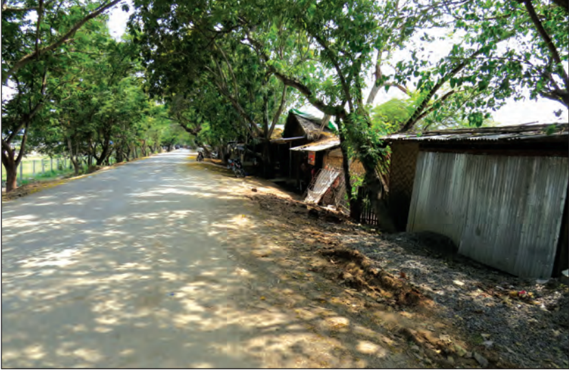
ကျောင်းတော်ရာ-လယ်ကိုင်း ကားလမ်းဘေးမှ ဆိုင်ခန်းများ

သတင်းစာရှင်းလင်းပွဲနှင့်စပ်လျဉ်း၍ သတင်းမီဒီယာအသီးသီးကိုကယ်စားပြုသည့် သတင်းထောက်ရှစ်ဦးက နယ်မြေကွင်းဆင်းပြီး ကျောင်းတော်ရာကျေးရွာ အုပ်ချုပ်ရေးမှူးထံ ဆက်သွယ်မေးမြန်းရာအထက်မှ တာဝန်ပေးချက်အရ ဆောင်ရွက်ခြင်းဖြစ်ကြောင်းနှင့် မီဒီယာများမေးမြန်းသည်ကို မြို့နယ်အုပ်ချုပ်ရေးမှူး၏ ခွင့်ပြုချက်ရမှ ဖြေကြားနိုင်မည်ဖြစ်ကြောင်း ပြန်လည်ပြောကြားသည်။ ပွင့်ဖြူမြို့နယ် အုပ်ချုပ်ရေးမှူးအား မီဒီယာများက သွားရောက် ဆက်သွယ်ရာတွင် မင်းဘူးခရိုင် အုပ်ချုပ်ရေးမှူးနှင့် လိုက်ပါသွားပြီး လုပ်ငန်းတာဝန်များ ဆောင်ရွက်နေကြောင်း ရုံးဝန်ထမ်းများထံမှ သိရသည်။ ဇေယျတု(မကွေး)