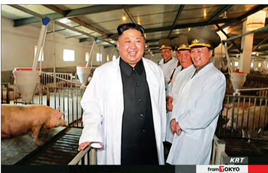
ပိုင်းလော့များ၏ အစာအာဟာရ အတွက် အထောက်အကူပြုမည့် မွေးမြူ ရေးအခြေစိုက်စခန်းတစ်ခု မြောက် ကိုရီးယားတွင် ယခုရှိနေပြီဖြစ်ကြောင်း မှူးများအတွက် ဝက်သားနှင့် ဆက်စပ်

မြောက် ကိုရီးယားခေါင်းဆောင် ကင်ဂျုံအမ်းသည် လေတပ်မတော်က ပိုင်ဆိုင်သည့် ဝက်မွေးမြူရေးခြံသို့ သွားရောက်လည်ပတ်ခဲ့ကြောင်း မြောက် ကိုရီးယား နိုင်ငံပိုင်သတင်းမီဒီယာက ဖော်ပြသည်။ ကင်ဂျုံအမ်း၏ ထိုသို့သွားရောက် လည်ပတ်မှုက စစ်ရေးနယ်ပယ်တွင် တိုးတက်မှုရရှိရေးအတွက် ထိထိဝင်ဝင် ဆောင်ရွက်ရန် ၎င်း၏အားထုတ်ကြိုးပမ်း မှုကို ထင်သာမြင်သာရှိစေရန် ရည်ရွယ် ကာ သွားရောက်ခဲ့ခြင်းဖြစ်သည်ဟု ယူဆရကြောင်း သတင်းမီဒီယာများ တွင် ဖော်ပြခဲ့သည်။ ပြီးခဲ့သည့်နှစ် ဩဂုတ်လအတွင်းက ဆောက်လုပ်ပြီးစီးခဲ့သည့် ဝက်မွေးမြူ ရေးခြံသို့ရောက်ရှိနေသည့် ကင်ဂျုံအမ်း ၏ ပုံရိပ်များကို ကိုရီးယားဗဟိုရုပ်မြင် သံကြားဌာနက တနင်္ဂနွေနေ့တွင် ထုတ်လွှင့်ပြသခဲ့သည်။