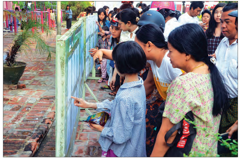
အတန်းကူးပြောင်းစာရင်းကြည့်ရှုသူ ကျောင်းသား၊ ကျောင်းသူများနှင့် မိဘများကိုတွေ့ရစဉ်

ယနေ့ထုတ်ပြန်သော အတန်းကူးပြောင်းစာရင်းများအရ ရာခိုင်နှုန်း မြင့်မားသည့်အပြင် A ဖြင့် အောင်မြင်သူ များပြားသည့်အတွက် အောင်စာရင်း လာရောက်ကြည့်ရှုသူ ကျောင်းသား၊ ကျောင်းသူများသာမက မိဘများပါ ပျော်ရွှင်လျက်ရှိကြောင်း သိရသည်။