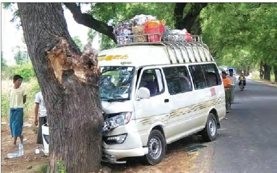
ရရှိခဲ့သောကြောင့် ချမ်းပြည်အောင်အား မုံရွာမြို့မှရဲစခန်းက အရေးယူထားကြောင်း သိရသည်။

စစ်ကိုင်းတိုင်းဒေသကြီး မုံရွာမြို့၊ အလုံရပ်ကွက် မုံရွာ-ရေဦးကားလမ်း မိုင်တိုင်အမှတ်(၂/၉၃)ကြား၌ ဧပြီ ၂၂ ရက်က ယာဉ်တိုက်မှုဖြစ်ပွားကြောင်း သတင်းအရ ယာဉ်ထိန်းရဲတပ်ဖွဲ့က သွားရောက်စစ်ဆေးခဲ့သည်။