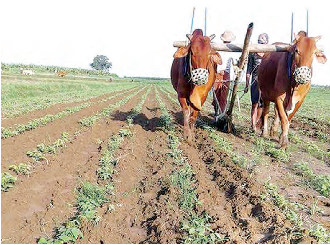
ပွင့်ဖြူမြို့နယ်၌ တောင်သူများ လယ်ယာလုပ်ငန်းခွင်ဝင်ရောက်နေစဉ်

မကွေးတိုင်းဒေသကြီး ပွင့်ဖြူမြို့နယ်အတွင်း၌ ဧပြီ ၁၆ ရက်က တိုက်ခတ်ခဲ့သော မာရသာမုန်တိုင်းကြောင့် မြေအစိုဓာတ်ရရှိ၍ တောင်သူများ ကိုင်းမြေလုပ်ငန်းခွင်များသို့ စောစီးစွာဝင်ရောက် လုပ်ကိုင်နိုင်ခဲ့သော်လည်း စိုက်ပျိုးထားသော နှမ်းခင်းများမှာ ပျက်စီးသွားခဲ့ကြောင်း သိရသည်။ “အရင်နှစ်တုန်းကတော့ ဒီအချိန်ဆို ရေတင်ပြီး နှမ်းကြဲရတာ။ ခုတော့ သင်္ကြန်တုန်းက ရွာလိုက်တဲ့မိုးကြောင့် အစိုဓာတ်ရပြီး ရေတင်စရာ မလိုတော့ဘဲ နှမ်းကြဲလို့ရသွားတယ်။ တပေါင်းလ ကတည်းကရေတင်စိုက်ထားတဲ့နှမ်းတွေလည်းရှိ တယ်။ ဒါပေမယ့် နှမ်းခင်းတွေက သိပ်မကောင်းဘူး။ ခုမိုးနဲ့စိုက်တဲ့နှမ်းခင်းတွေကတော့ ဘယ်လို လာမယ်မသိသေးဘူး။ အရင်နှစ်က ရာသီဥတု ကောင်းတော့ နှမ်းတွေရကြတယ်။ သင်္ကြန်တုန်းက ရွာလိုက်တဲ့မိုးကြောင့် ကိုင်းမြေသမားတွေအတွက် အဆင်ပြေပေမယ့် လယ်သမားတွေအတွက်တော့ မကောင်းခဲ့ဘူး။ လယ်ထဲမှာ တပေါင်းလထဲက မြောင်းရေနဲ့စိုက်ထားတဲ့ နှမ်းခင်းတွေ အကုန်မိ ပြီးသေကုန်တယ်။ တချို့အပင်ကြီးတွေလောက်ပဲ ကျန်တော့။ ဒါတောင် နောက်ကောင်းမယ်။ မကောင်းဘူးဆိုတာ မသိရသေးဘူး။ ပျက်စီးတဲ့ ဧကကတော့ ဘုရားအနောက်ဘက်ကွင်းက အကုန်နီးပါးဆိုတော့ ဧက ၂၀၀ ကျော်လောက် ရှိတယ်။ ဒီဘက်က လယ်မြေတွေက မိုးစပါးပြီးရင် တချို့ကနှမ်းတို့၊ ကုလားပဲတို့၊ စိုက်ကြတယ်။ သီးလှည့်စိုက်ပျိုးရတော့ မြေဆီလွှာကိုထိန်းသိမ်း