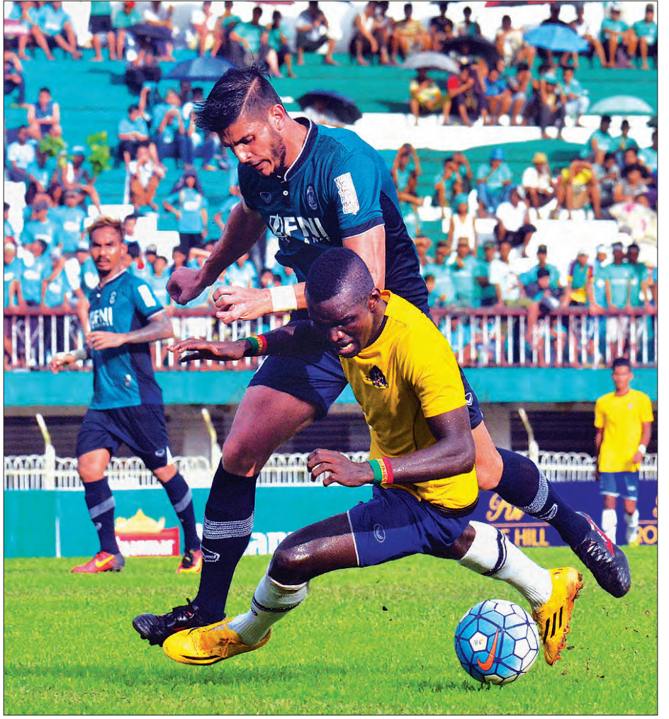
၂၀၁၆ ပြိုင်ပွဲ ဗိုလ်လုပွဲတွင် မကွေးနှင့် ရန်ကုန်အသင်း ယှဉ်ပြိုင်နေစဉ်

ရန်ကုန် ဧပြီ ၂၃ ၂၀၁၇ ရာသီ ဗိုလ်ချုပ်အောင်ဆန်းခိုင်း ရုံးထွက်ပြိုင်ပွဲ ပွဲစဉ်ရေးဆွဲပွဲအခမ်းအနား ကို ဧပြီ ၂၄ ရက် (ယနေ့) မွန်းလွဲ ၂ နာရီတွင် MFF ရုံး၌ ကျင်းပမည်ဖြစ်သည်။ ယင်းပြိုင်ပွဲတွင် အသင်းပေါင်း ၂၂ သင်း ဝင်ရောက်ယှဉ်ပြိုင်မည်ဖြစ်ပြီး AFC Cup ပြိုင်ပွဲဝင်ခွင့်အတွက် အရေးပါသည့် ပြိုင်ပွဲလည်း ဖြစ်သည်။ ယင်းပြိုင်ပွဲတွင် MNL ကလပ် ၁၂ သင်း၊ MNL-2 (ပထမတန်း) ကလပ် ၁၀ သင်းတို့ ဝင်ရောက်ယှဉ်ပြိုင်မည်ဖြစ်ပြီး ပထမအဆင့်ပွဲစဉ်များကို မေ ၂ ရက်တွင် စတင်ကျင်းပမည်ဖြစ်သည်။ ပထမအဆင့်တွင် ပထမတန်း ကလပ်အသင်းများသာ ဝင်ရောက်ယှဉ်ပြိုင်မည်ဖြစ်ပြီး MNL ကလပ်အသင်းများမှာ ဒုတိယအဆင့်မှ စတင်ယှဉ်ပြိုင်ရမည်ဖြစ်သည်။ ဗိုလ်ချုပ်အောင်ဆန်းခိုင်း ရုံးထွက်ပြိုင်ပွဲ ယှဉ်ပြိုင်မည့်အသင်းများမှာ MNL ကလပ်အသင်းများဖြစ်သော လက်ရှိချန်ပီယံ မကွေး၊ ရန်ကုန်၊ ရတနာပုံ၊ ဇွဲကပင်၊ ရှမ်းယူနိုက်တက်၊ ဧရာဝတီ၊ ရခိုင်၊ GFA၊ နေပြည်တော်၊ ဟံသာဝတီ၊ ချင်းယူနိုက်တက်၊ Southern၊ ပထမတန်းကလပ်အသင်းများဖြစ်သော စီးတီး၊ ရန်ကုန်၊ မြဝတီ၊ မဟာယူနိုက်တက်၊ ဖီးနစ်၊ ဖန်ဂန်၊ တက္ကသိုလ်၊ မောရဝတီ၊ စီးတီးစတာ၊ ဒဂုံနှင့် ငွေကြယ်ပွင့်လေးများအသင်းတို့ ဝင်ရောက်ယှဉ်ပြိုင်မည်ဖြစ်သည်။ သန့်လျင်ယူနိုက်တက် အသင်းသည် လစာကြေးကျန်ပြဿနာများကြောင့် လိဂ်ပြိုင်ပွဲမှ ထုတ်ပယ်ခံခြင်းဖြစ်သည်။ လူငယ်ကစားသမားများ ပြိုင်ပွဲအတွေ့အကြုံရရန် ပထမတန်းပြိုင်ပွဲ ယှဉ်ပြိုင်နေသည့် ဖီးနစ် အသင်းမှာလည်း ရုံးထွက်ပြိုင်ပွဲတွင် ဝင်ရောက်ယှဉ်ပြိုင်မည်ဖြစ်သည်။