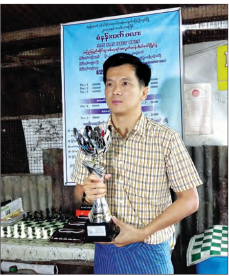
ကမ္ဘာ့အပျော်တမ်းစစ်တုရင်ချန်ပီယံ ဝင်းထွန်းအား ချန်ပီယံ ဆုဖလားနှင့်အတူတွေ့ရစဉ်

ကမ္ဘာ့အပျော်တမ်းစစ်တုရင်ချန်ပီယံ ဝင်းထွန်းသည် ဧပြီ ၁ ရက်က ထုတ်ပြန်သော ကမ္ဘာ့စစ်တုရင်အဖွဲ့ချုပ်၏ လက်ရည်စံနှုန်းသတ်မှတ်ချက် ၂၂၃၀ ရှိကြောင်း၊ ၎င်းသည် လက်ရည်စံနှုန်း ၂၀၀၃ ကမ္ဘာ့အပျော်တမ်းစစ်တုရင်ပြိုင်ပွဲတွင်လည်း ပထမဆု ဆွတ်ခူးနိုင်ခဲ့သည်။ သတင်း-မြင့်မောင်စိုး