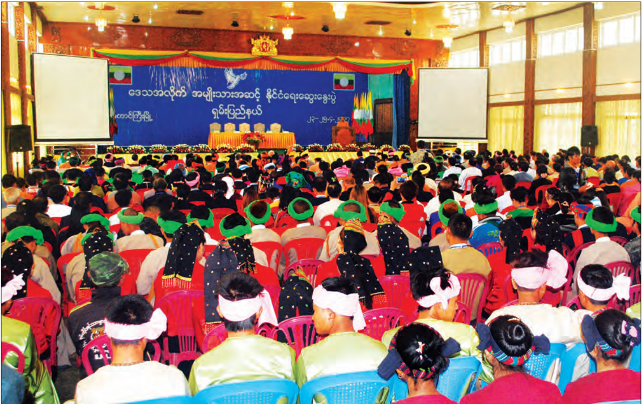
ရှမ်းပြည်နယ်ဒေသအလိုက် အမျိုးသားအဆင့် နိုင်ငံရေးဆွေးနွေးပွဲ ကျင်းပစဉ်

ဆက်လက်၍ နိုင်ငံတော်အတိုင်ပင်ခံရုံးဝန်ကြီးဌာန ပြည်ထောင်စုဝန်ကြီး ဦးကျော်တင်ဆွေက ရှမ်းပြည်နယ်တွင် အရေးကြီးသည့်သမိုင်းမှတ်တိုင်တစ်ခု စိုက်ထူ နိုင်ခဲ့ကြောင်း၊ ရှမ်းပြည်နယ်သည် ပြည်ထောင်စုကြီးအတွက် အခြေခံအုတ်မြစ်ဖြစ်သည့် ပင်လုံစိတ်ဓာတ်ကို စတင်မွေးဖွားပေးခဲ့သော ဒေသလည်းဖြစ်ကြောင်း၊ အမျိုးသား ညီညွတ်ရေးနှင့် ပြည်ထောင်စုငြိမ်းချမ်းရေးအတွက် ဘူမိနက်သန်နေရာတစ်ခု ဖြစ်ကြောင်း၊ ဒေသအလိုက် အမျိုးသားအဆင့်နိုင်ငံရေးဆွေးနွေးပွဲကို ရှမ်းပြည်နယ်၏