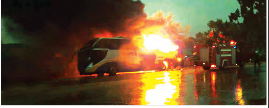
ပူးပေါင်း၍ အချိန်မီ မီးငြိမ်းသတ်ခဲ့ ကြောင်းနှင့် ယာဉ်ပေါ်တွင် စီးနင်းလိုက်ပါ ယာဉ်နှစ်စီးတို့က ဒေသခံများနှင့် လာခဲ့ကြသည့် ခရီးသည်များ ထိခိုက်