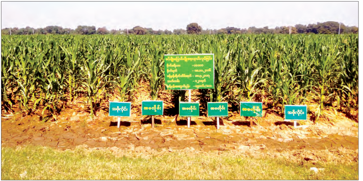
တပ်ကုန်းစိုက်ပျိုးရေးသုတေသနဌာနမှ စမ်းသပ်စိုက်ပျိုးထားသော ရေဆင်းစပ်မျိုး(၁၀) စိုက်ခင်း

အခုဆို နေပြည်တော်ထဲက တောင်သူတွေကိုယ်တိုင် လာရောက်ဝယ်ယူတာတွေ ရှိပါတယ်။ အရင်က တောင်သူတွေက သူတို့ခေါင်းထဲမှာ စွဲသွားတဲ့မျိုးကလွဲရင် ကျန်တဲ့မျိုးကို ညွှန်းလို့မရတာတွေရှိတယ်။ ခုတော့