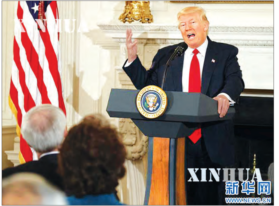
XINHUA 新华网 WWW.NEWS.CN

အမေရိကန်သမ္မတရွေးကောက်ပွဲ မဲဆွယ်စည်းရုံးရေး ကာလအတွင်း ဒေါ်နယ်ထရန်က အဆိုပါ သဘော တူညီမှုစာချုပ်နှင့်ပတ်သက်ပြီး ထပ်ကာ ထပ်ကာ ဝေဖန်ပြောကြားခဲ့သည်။ ထို့အပြင် အဆိုပါ သဘောတူညီမှု စာချုပ်သည် သမိုင်းတစ်လျှောက်တွင် အဆိုးရွားဆုံးကိစ္စတစ်ခုဖြစ်ကြောင်း၊ ၎င်းသဘော တူညီမှုစာချုပ်ကို ပယ်ဖျက်ခြင်း သို့မဟုတ် ပြန်လည် ဆွေးနွေးမည်ဖြစ်ကြောင်း ပြောကြား ခဲ့သည်။ (ဆင်ဟွာ)