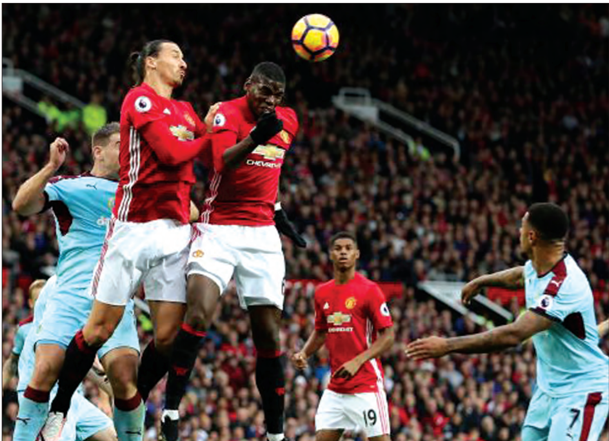
ခဲတွဲငါးပွဲမှာ တစ်ဂိုးမှ မသွင်းနိုင်ခဲ့ပါဘူး။ စတုတ်ဟာ ပထမအကျော့ ဆွမ်ဆီးနဲ့ ကစားခဲ့ရာမှာ သုံးဂိုး-တစ်ဂိုးနဲ့ နိုင်ပွဲရခဲ့တာမို့ အခုပွဲမှာလည်း လက်ရှိနိုင်ပွဲရခဲ့တဲ့ ခြေစွမ်းနဲ့ စိတ်ဓာတ်မြင့်တက်မှုကြောင့် အနိုင်ဆုံးသရေပွဲကစားပါလိမ့်မယ်။

ရှုံးပွဲတွေဆက်တိုက် ကြုံတွေ့နေတဲ့ စတုတ်တို့ကတော့ ဟားလီစီးတီးကို အနိုင်ရပြီး နောက် ရှုံးပွဲတွေရပ်တန့်နိုင်ခဲ့ပါတယ်။ ဆွမ်ဆီးတို့ကတော့ နောက်ဆုံးသုံးပွဲကစားခဲ့ရာမှာ ရှုံးပွဲတွေများခဲ့တာမို့ ဒီပွဲမှာ ရလဒ်ကောင်းဖော်ဆောင်နိုင်ဖို့ ကြိုးစားလာပါလိမ့်မယ်။ ဆွမ်ဆီးရဲ့အားနည်းချက်က တိုက်စစ်ဖြစ်ပြီး အခုတလော နောက်ဆုံးကစား