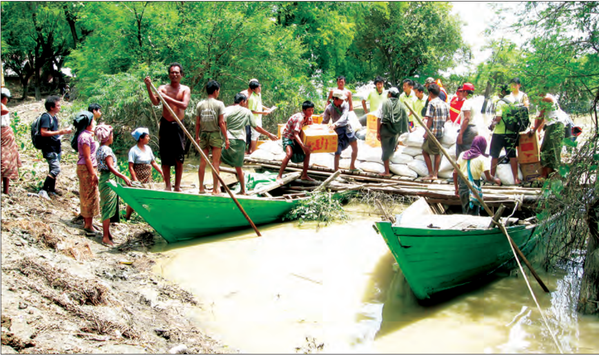
၂၀၁၅ ခုနှစ်က ဖွင့်ဖြူမြို့နယ်အတွင်း ရေလွှမ်းမိုးခဲ့သည့်ကျေးရွာများသို့ ပရဟိတအဖွဲ့များ ကျေးရွာအရောက် လှူဒါန်းနေကြစဉ်

အလှူအတန်းပြုလုပ်ခြင်းနှင့် ပရဟိတလုပ်ငန်းလုပ်ကိုင် သူများသည် မိမိတို့၏ ရုပ်ပိုင်းဖွံ့ဖြိုးမှုနှင့် ကျန်းမာရေးကောင်းမွန်ခြင်းများအပေါ် အကျိုးသက်ရောက်မှုရှိ မရှိ စမ်းသပ်နိုင်ရန်အတွက် အင်္ဂလန်နိုင်ငံ ကိုလံဘီယာတက္ကသိုလ်မှ သုတေသန ပညာရှင်များက အသက် ၅၅ နှစ်နှင့် အထက် လူကြီးများကို ငွေကြေးထောက်ပံ့ပေးပြီး စမ်းသပ်ခဲ့ရာ အလှူအတန်းလုပ်သူများသည် နှလုံးသွေးတိုးရှိလျှင်ပင် လှူဒါန်းပြီး အချိန်တွင် သွေးပေါင်တိုင်းပါက သွေးပေါင်သည် မလှူဒါန်းမီအချိန်ထက် ပိုမိုကောင်း မွန်နေသည်ကို လေ့လာတွေ့ရှိရကြောင်း မှတ်တမ်း များက ဆိုသည်။ ၁၉၉၂ ခုနှစ်တွင် ပုံနှိပ်ဖော်ပြခဲ့သည့် သုတေသနစာတမ်းတစ်ခုတွင်လည်း အခြားလူများကို ကူညီခြင်း နှင့် ရုပ်ပိုင်းကျန်းမာရေး ကောင်းမွန်မှုတို့အကြား ဆက်စပ်နေကြောင်း ဖော်ပြထား သည်။