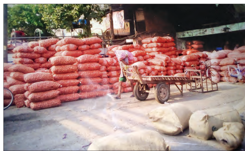
ကြက်သွန်နီအိတ်များ ဈေးကွက်သို့ တင်ပို့ရန် ပြင်ဆင်နေစဉ်

များအတွက် မြေယာပြုပြင်လုပ်ကိုင်နေပြီ ဟုပြောသည်။ အောင်လံဒေသတွင်လည်း ပဲမျိုးစုံ အပါအဝင် သီးနှံများစိုက်ပျိုးရေးအတွက် မြေယာပြုပြင် ထယ်ရေးဝင်လာကြ ကြောင်း၊ မြေသားပြုပြင်ထွန်းယက်ခြင်း အတွက် မြေအစိုဓာတ်ရသော်လည်း မိုးထပ်မံရလျှင် ပဲတီစိမ်း၊ ဝါအစရှိသည် များ စိုက်ပျိုးရန်ပြင်ဆင်ထားကြောင်း သိရသည်။ မြစ်သားနှင့် ဝမ်းတွင်းနယ်များတွင် လှောင်ကြက်သွန်အများစု တူးဖော်ပြီး၍ ဈေးကွက်သို့တင်ပို့ခြင်း၊ သိမ်းဆည်း သိုလှောင်ခြင်းများ ပြုလုပ်ပြီးဖြစ်နေ သည်ဟု ပြောသည်။ ဧပြီ ၁၆ ရက်က မုန်တိုင်းမိုးကြောင့် ကြက်သွန်ခင်းအချို့ ရေထိပျက်စီးသည့် သတင်းနှင့်အတူ ဧပြီ ၁၈ရက်က ရန်ကုန် ဈေးကွက်တွင် ဈေးမြင့်တက်မှုရှိလာသည်။ ယင်းနေ့တွင်ရန်ကုန်ဈေးကွက်သို့ ကြက်သွန်နီပိဿာချိန် ၉၆၀၀၀ သာ ဝင်ရောက်သော်လည်း ဧပြီ ၂၀ ရက် တွင်မူပိဿာချိန် ၂၄၀၀၀ ဝင်ရောက်လာ သည်။ ဈေးနှုန်းတန်သွားကာ ဆိပ်ဖြူ လက်ကားတစ်ပိဿာလျှင်ငွေကျပ် ၆၀၀- ၉၀၀- ၉၅၀- ၉၅၀၊ တောင်တွင်း ၆၀၀- ၉၅၀- ၉၅၀ နှုန်းရှိသည်ဟု ဈေးကွက်မှ သိရသည်။ မုန်တိုင်းမိုးကြောင့် ကြက်သွန်ခင်း အချို့ပျက်စီးသဖြင့် တူးဖော်ရန် အခက် အခဲရှိနိုင်သည်ဆိုသော စကားရပ်များ ပေါ်ထွက်လာသော်လည်း သကြက် ပိတ်ရက်အလွန် ပွဲရုံဖွင့်ရက် တတိယနေ့ တွင် ကြက်သွန်နီများ ရန်ကုန်ဈေးကွက်