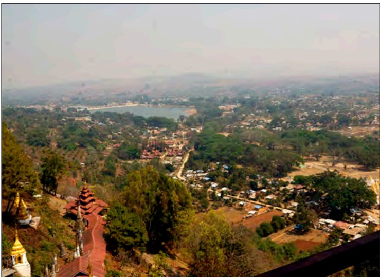
ပင်းတယမြို့ ရှုခင်းအား ရွှေဥမင်ဂူမှမြင်တွေ့ရစဉ်

ဂူအတွင်းမှပြန်ထွက်လာပြီးနောက် အမှတ်တရပစ္စည်း အရောင်းဆိုင်များ၊ ဒေသထွက် လက်ဖက်နှင့် ဒေသအစားအစာများ ရောင်းချသည့် ဈေးတန်းကိုလည်း လေ့လာခဲ့သည်။ ရွှေဥမင်ဂူသို့ နိုင်ငံခြားသား ခရီးသွားဧည့်သည်များ လာရောက်မှုများ၍ နိုင်ငံခြားသားများဖြင့် စည်ကားနေသည်ကိုလည်း တွေ့ရှိခဲ့ရသည်။ ပင်းတယဂူကို သွားရောက်ဖူးမြော်ပြီးနောက် ကျေးဇူးရှင်ကဲ့လုံဆရာတော်ကျောင်းသို့ ဆက်လက်ထွက်ခွာလာခဲ့သည်။ ကုံလုံကျောင်းတိုက်သည် ပင်းတယမြို့နှင့် ခုနစ်မိုင်ခန့် ကွာဝေးသည်။ ကုံလုံကျောင်းတိုက်သို့ ရောက်ရှိပြီးနောက် ဆရာတော်ကြီး သီတင်းသုံးတော်မူခဲ့သည့် ကျောင်းတိုက်ကိုလည်းကောင်း၊ ဘူးသီးဘုရားကျောင်းဆောင်သို့လည်းကောင်း၊ ထို့နောက် ဆရာတော်ကြီး၏ ရုပ်ကလာပ်တော်ထားရှိရာ စံကျောင်းသို့လည်းကောင်း သွားရောက်၍ ရုပ်