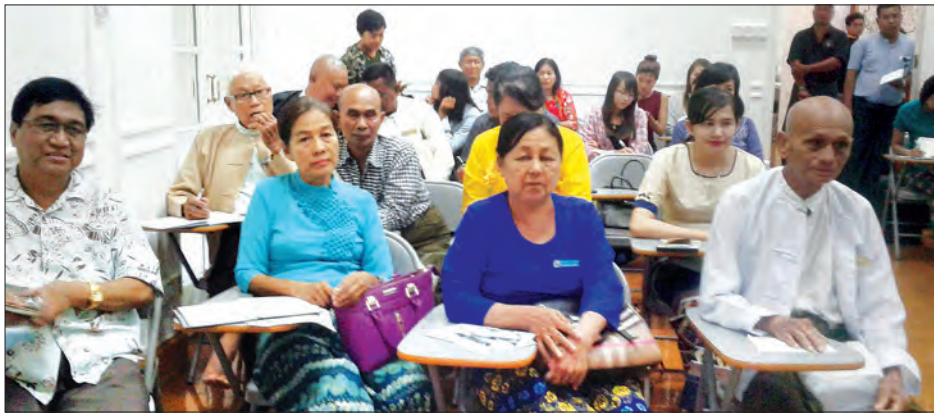
စတုတ္ထအကြိမ် ဧရာဝတီနိုင်ငံတကာစာပေပွဲတော်ကျင်းပနိုင်ရေး ညှိနှိုင်းအစည်းအဝေးသို့ တက်ရောက်သူများကို တွေ့ရစဉ်