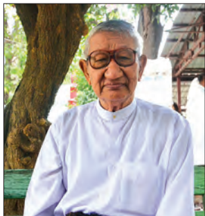
မောင်သစ်လွင် (လူထု)

သတင်းစာဆရာကြီး ဟံသာဝတီဦးဝင်းတင် ကွယ်လွန်ခြင်း သုံးနှစ်ပြည့်အထိမ်းအမှတ် အခမ်းအနားကို ဧပြီ ၂၁ ရက် နံနက် ၈ နာရီက မန္တလေးမြို့အစုရုံးမြို့နယ် တောင်သမန် အင်းစောင်းရှိ တောင်လေးလုံးကျောင်းတိုက်၌ ကျင်းပခဲ့သည်။