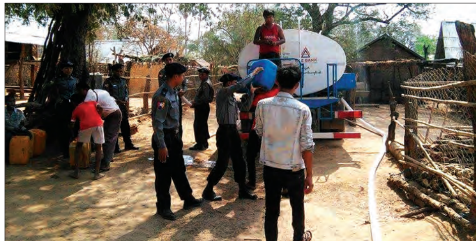
ရောက်လှူဒါန်းခဲ့ကြောင်း သိရသည်။ ဆက်လက်၍ မြို့နယ်အတွင်းရှိ ရေရှားပါးပြတ်လပ်နေသော ကျေးလက်ဒေသများသို့လည်း ရေများသွားရောက် လှူဒါန်းပေး သွားမည်ဖြစ်ကြောင်း သိရသည်။