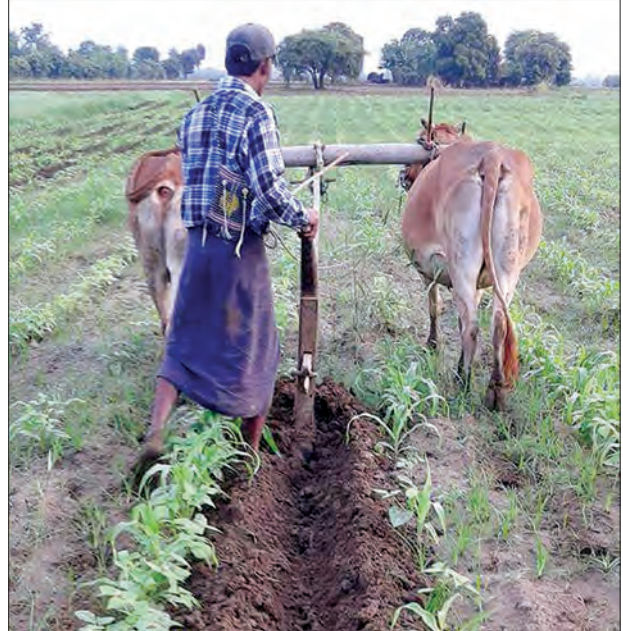
မုန်တိုင်းအပြီး တောင်သူများ လယ်ယာလုပ်ငန်းခွင် ဝင်နေစဉ်

သို့ ပုံမှန်ထက် ပိုမိုဝင်ရောက်လာသည်ကို မြင်တွေ့လာရသည်။ ကျောက်ပန်း တောင်နယ်၌ မိုးများ၍ ထန်းလျက် နေလှန်းမရဆိုသော ပြောဆိုမှုများဖြင့် ထန်းလျက် ဈေးမြင့်တက်ခြင်း ကြုံတွေ့ ရန်ရှိသည်။ သို့သော် သကြားဈေးနှုန်း နိမ့်ကျနေခြင်း မုန်တိုင်းပြီးသွားခြင်းတို့ ကြောင့် ထန်းလျက်ဈေးမြင့်လာခြင်း မရှိသေးဟု ထန်းလျက်အဝယ်တော် တစ်ဦးက ပြောသည်။ မာရသ မုန်တိုင်းဖြစ်စဉ်သည် ထိခိုက်ပျက်စီးခြင်းအချို့ ရှိခဲ့သော်လည်း အထက်ဒေသရေရှားပါးခြင်းကိုလျော့ပါး စေခြင်း၊ စိုက်ပျိုးရေးလုပ်ငန်းများစတင် လုပ်ကိုင်နိုင်ရန် အထောက်အကူအဖြစ် မြေအစိုဓာတ်လုံလောက်စွာ ရရှိစေခြင်း