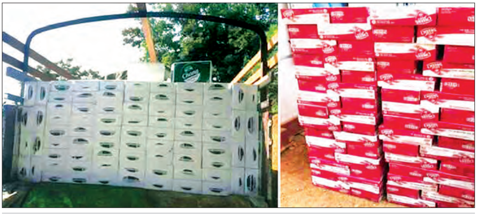
တရားဝင်စာရွက်စာတမ်း အထောက်အထားတစ်စုံတစ်ရာ တင်ပြနိုင်ခြင်းမရှိသည့် Beer Chang နှင့် Cheers Beer များကို တွေ့ရစဉ်

မိုင်အနီး၌ ၁၂ ဘီးယာဉ် သုံးစီးအား သတင်းရရှိ၍ မရမ်းချောင့်အမြဲတမ်း စစ်ဆေးရေးစခန်း ပူးပေါင်းစစ်ဆေးရေး အဖွဲ့က ရှောင်တခင် သွားရောက် စစ်ဆေးခဲ့ရာ တရားဝင်စာရွက်စာတမ်း အထောက်အထား တစ်စုံတစ်ရာတင်ပြ နိုင်ခြင်းမရှိသည့် Beer Chang (330ml)(1x 24 Can)(5250) Pkgs ၊ Cheers Beer (330ml) (1 x 24 Can)(450) Pkgs နှင့် သယ်ဆောင်သည့်ယာဉ်သုံးစီးစုစုပေါင်း ခန့်မှန်းတန်ဖိုးငွေကျပ် ၁၁၉ သန်းခန့် အား တွေ့ရှိ၍ ဖမ်းဆီးခဲ့ကြောင်း သတင်းရရှိသည်။ (သတင်းစဉ်)