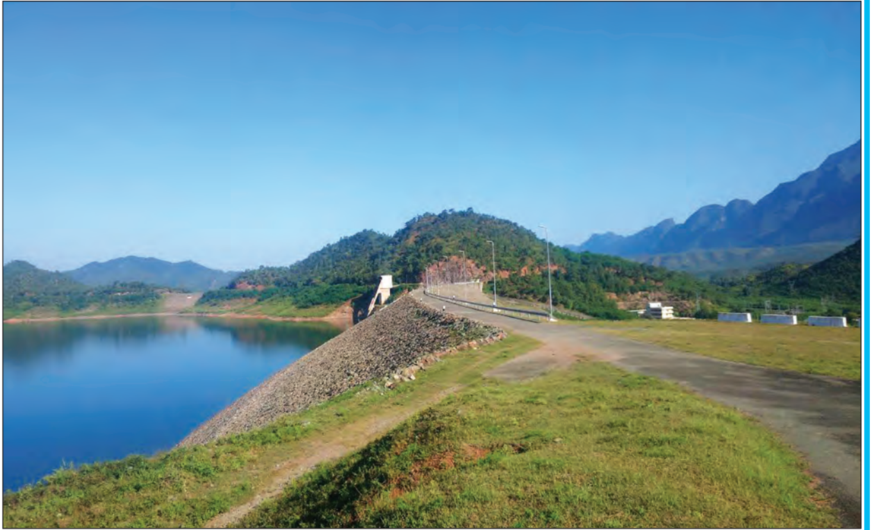
သဘာဝ တောတောင်များကြားမှ ကင်းတားရေးလှောင်တံမံ ပတ်ဝန်းကျင်အလှ

ကင်းတားရေးလှောင်တံမံ ကန်အတွင်း လက်ရှိရေပမာဏမှာ ယခုနှစ် ဧပြီ ၃ ရက်