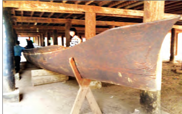
ကျွန်းတစ်လုံးထွင်းလှေကြီး

များ လှေလာကြည့်ရှုနိုင်ရန်အတွက် အင်းတော်မြို့နယ် တံခွန်တိုင်ကျေးရွာ ကျောင်းတွင် ရှေးဟောင်းလက်လှည့် အပ်ချုပ်စက်၊ သစ်တစ်လုံးထွင်း ကျွန်းလှေကြီးနှင့်အတူ စာချွန်လွှာသုံး ပစ္စည်း၊ မှန်စီရွှေချ ယွန်းထည်ပစ္စည်း များ၊ ပေပုရပိုက်များ အစရှိသည့် ရှေး ဟောင်းယဉ်ကျေးမှု အမွေအနှစ်ပစ္စည်း များ မပျောက်ပျက်စေရေးအတွက် ဆက်လက်ထိန်းသိမ်း ထားရှိပါကြောင်း နှင့်မည်သူမဆို လာရောက်လေ့လာ ကြည့်ရှုနိုင်ပါကြောင်း ဆရာတော်ထံမှ သိရသည်။