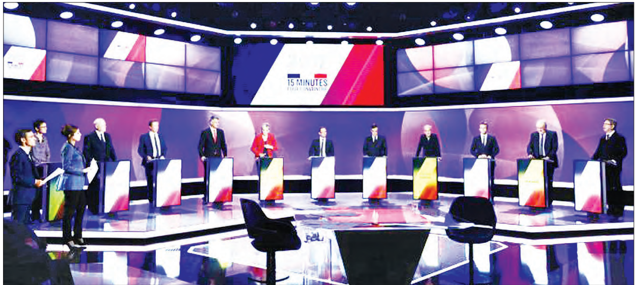
သမ္မတရွေးကောက်ပွဲဝင်ရောက်ယှဉ်ပြိုင်သူ ကိုယ်စားလှယ် ၁၁ ဦးကို ပြင်သစ်ရပ်မြင်သံကြားချန်နယ်တစ်ခုရှိ စတူဒီယိုခန်းအတွင်း၌ တွေ့ရစဉ်