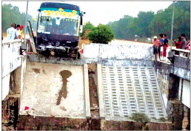
အမြန်လမ်း၌ ခရီးသည်တင်ယာဉ် လမ်းလယ်ကျွန်းကတ်တုံး ဝင်တိုက်

ဒဏ်ရာများရရှိသွားခဲ့သည်။ ရဲစခန်းက အမှုဖွင့်အရေးယူဆောင်ရွက် ဖြစ်စဉ်နှင့်ပတ်သက်၍ ယာဉ်မောင်း ထားကြောင်း သိရသည်။ ဇော်မင်းဦးအား ကျောင်းကုန်းမြို့မှ ဝင်းကြိုင် (ပြန်/ဆက်)