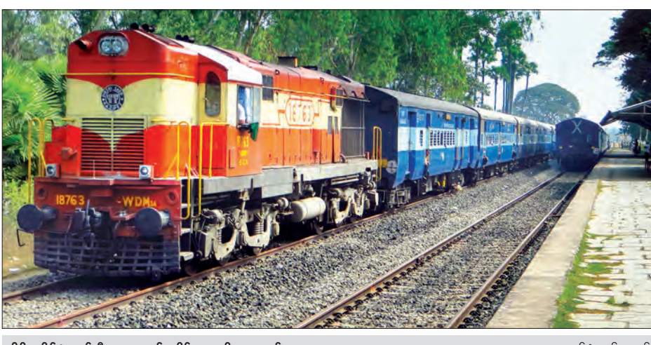
အိန္ဒိယနိုင်ငံထုတ် မီးရထားစက်ခေါင်းများကို တွေ့ရစဉ်

“ကျွန်တော်တို့ မြန်မာ့မီးရထားအနေနဲ့ ခရီးသွားပြည်သူတွေ အဆင်ပြေစေဖို့ အတတ်နိုင်ဆုံးဘက်ပေါင်းစုံကနေ ဖြည့်ဆည်း လုပ်ဆောင်ပေးနေပါတယ်။ အခု အစိုးရသစ်လက်ထက်မှာလည်း ပထမဆုံးအနေနဲ့ စက်ခေါင်းအသစ်တွေကို အိန္ဒိယနိုင်ငံကနေ ဝယ်ယူထားပြီးပါပြီ။ အခုလာမယ့် မေ ၁ ရက်ဆိုရင် အိန္ဒိယယူထားတဲ့ စက်ခေါင်းသစ်တွေ ရောက်ရှိလာ