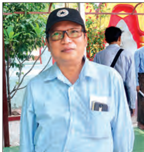
စာရေးဆရာဆူးငှက်