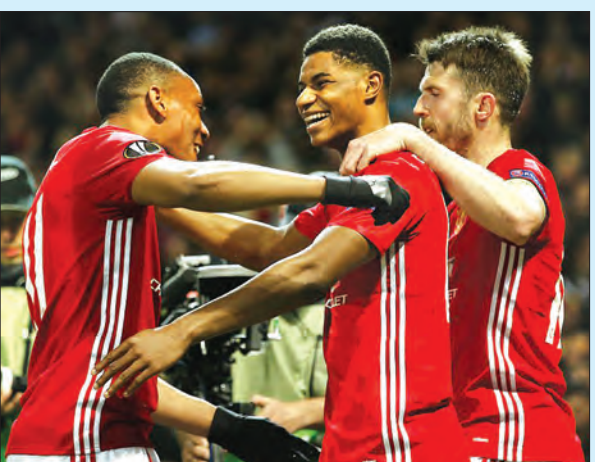
မန်ယူအတွက် အနိုင်ဂိုးကို အချိန်ပို၌ သွင်းယူပေးသည့် ရက်ချိဖိုဒ်ကို ကစားစော်များ နှင့်အတူ တွေ့ရစဉ်

အခြားပွဲစဉ်များအဖြစ် ဂျန်နီနှင့်ဆယ်လ်တာတီဂိုတို့မှာ တစ်ဖက်တစ်ဂိုးစီ သရေကျခဲ့ပြီး နှစ်ကျော့ပေါင်းရလဒ် လေးဂိုး-သုံးဂိုးဖြင့် ဆယ်လ်တာတီဂိုတို့ အနိုင်ရခဲ့သည်။ ရှော်လ်ကေးနှင့်အိုင်းယက်တို့ပွဲတွင် သုံးဂိုး-နှစ်ဂိုးဖြင့် အချိန်ပို ထိ ယှဉ်ပြိုင်ခဲ့ပြီး နှစ်ကျော့ပေါင်းရလဒ် လေးဂိုး-သုံးဂိုးဖြင့် အိုင်းယက်အသင်း အနိုင်ရရှိခဲ့သည်။ ဘက်ဆစ်တပ်နှင့်လိုင်ယွန်ပွဲမှာ ပယ်နယ်တီ အဆုံးအဖြတ်ထိ ယှဉ်ပြိုင်ခဲ့ပြီး နှစ်ကျော့ပေါင်းရလဒ် ၁၀ ဂိုး-၉ ဂိုးဖြင့် လိုင်ယွန်အသင်း အကြံ ပိုလ်လုပွဲသို့ တက်ရောက်ခဲ့သည်။ သီဟ