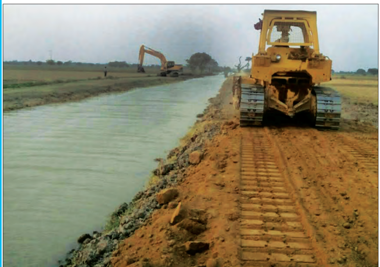
ကင်းတားတံမံ ပြုပြင်ထိန်းသိမ်းရေးလုပ်ငန်းများကို မြန်မာ့ ဆည်မြောင်းနှင့် ရေအသုံးချမှု စီမံခန့်ခွဲရေးဦးစီးဌာနက စက်ယန္တရားများဖြင့် ဆောင်ရွက်စဉ်

အုပ်ချုပ်ရေးမှူး၏ ပြောကြားချက်အရ တံမံအနီးရှိ သစ်တောများအတွင်းတွင် တရားမဝင် သစ်ထုတ်လုပ်မှုများ ရှိနေပြီး တရားမဝင် သစ်ဆွဲလှေများ၊ တရားမဝင် သစ်ကားများမှာလည်း သွားလာသယ်ယူနေဆဲဖြစ်ကြောင်း၊ သက်ဆိုင်သည့် ဌာနများသို့ စာပို့တိုင်ကြား တင်ပြမှုရှိသော်လည်း ဖမ်းဆီးမှုအားနည်းနေခြင်းကြောင့် တရားမဝင်သစ်ခုတ်သူများမှာ အတင့်ရနေဆဲဖြစ်ကြောင်း၊ ကူမဲ-ကင်းတားတံမံသွား (၂၁)လမ်းပိုင်းတွင် တရားမဝင်သစ်ကားများမှာ တာဝန်ရှိသူများက ဖမ်းဆီးချိန်မျိုးမှလွဲ၍ ကျန်အချိန်များတွင် ပုံမှန်သွားလာနေလျက်ရှိကြောင်း သိရသည်။