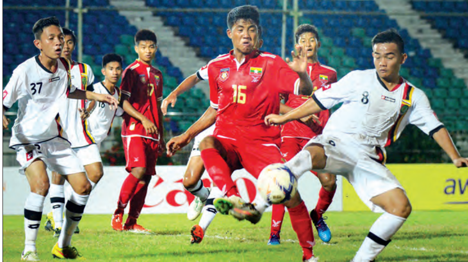
၂၀၁၆ အာရှ ယူ-၁၉ ခြေစစ်ပွဲအတွက် မြန်မာအသင်း ယှဉ်ပြိုင်နေစဉ်

ကွာလာလမ်ပူ ဧပြီ ၂၁ ၂၀၁၈ အာရှ ယူ-၁၉ ခြေစစ်ပွဲ အုပ်စု မဲခွဲပွဲကို ယနေ့မွန်းလွဲပိုင်းက မလေးရှား နိုင်ငံ၌ ကျင်းပရာ မြန်မာ ယူ-၁၉ အသင်း သည် အာရှထိပ်သီး တရုတ်အသင်းနှင့် တစ်အုပ်စုတည်း ကျရောက်ခဲ့သည်။ မြန်မာယူ-၁၉ အသင်းသည် ယခုနှစ် အတွင်းယှဉ်ပြိုင်ရမည့် အာရှ ယူ-၁၉ ခြေစစ်ပွဲအပါအဝင် အာဆီယံယူ-၁၈ ပြိုင်ပွဲတွင် အောင်မြင်မှုရရန် အချိန်ယူ ပြင်ဆင်လျက်ရှိသည်။ ယင်းခြေစစ်ပွဲကို ၄၃ သင်း ယှဉ်ပြိုင် မည်ဖြစ်ပြီး အနောက်အာရှဇုန်တွင် ၂၂ သင်း၊ အရှေ့အာရှဇုန်တွင် ၂၁ သင်း ယှဉ်ပြိုင်မည်ဖြစ်သည်။ အုပ်စုမဲခွဲထားမှု အရ အုပ်စု (က)တွင် ဘာရိန်း၊ ယူအေ အီး၊ အိုမန်၊ နီပေါ၊ ကာဂျစ္စတန်၊ အုပ်စု (ခ) တွင် ဥဒဘက်ကစွတန်၊ တာဂျစ် ကစွတန်၊ ဘင်္ဂလားဒေ့ရှ်၊ သီရိလင်္ကာ၊ မော်လ်ဒိုဗား၊ အုပ်စု(ဂ)တွင် အီရတ်၊ ကာတာ၊ လက်ဘနွန်၊ အာဖဂန်နစွတန်၊ အုပ်စု(ဃ)တွင် ဆော်ဒီ၊ ယီမင်၊ တာ့ခမ် နစွတန်၊ အိန္ဒိယ၊ အုပ်စု(င)တွင် အီရန်၊ ပါလက်စတိုင်း၊ ဂျော်ဒန်၊ ဆီးရီးယား၊ အုပ်စု(စ)တွင် တောင်ကိုရီးယား၊ မလေးရှား၊ တီမော၊ ဘရူနိုင်း၊ အင်ဒိုနီးရှား၊ အုပ်စု(ဆ)တွင် တရုတ်၊ မြန်မာ၊ ဖိလစ်ပိုင်၊ ကမ္ဘောဒီးယား၊ အုပ်စု(ဇ)တွင် ဝီယက်