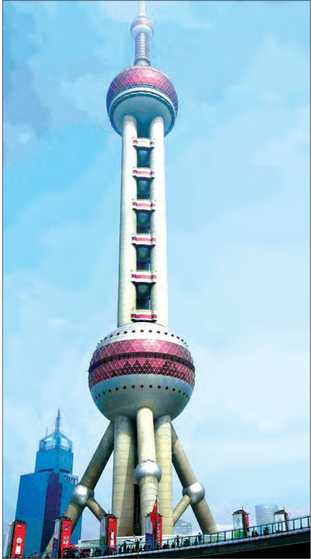
ရှန်ဟိုင်းမြို့ရှိ အရှေ့တိုင်းပုလဲမျှော်စင်ကို တွေ့ရစဉ်

ထားသည်။ အဆိုပါပြတိုက်ကို ၁၉၅၂ ခုနှစ်တွင် စတင်တည်ဆောက်ခဲ့ပြီး ၁၉၉၆ ခုနှစ်တွင် ပြီးစီးခဲ့သည်။ ပြတိုက်အတွင်း တွင် ရှည်လျားသွယ်တန်းသော အနုပညာ ပြခန်း(၁၁)ခုနှင့် ပြပွဲအခန်း သုံးခန်းပါရှိပြီး ရှေးခေတ်တရုတ်လူမျိုးများ အသုံးပြု သည့် ကြေထည်၊ ငွေထည်အိုးများ၊ တရုတ်စာစုတ်လက်ရေးမှတ်တမ်းများ၊ ပန်းပုလက်ရာများ၊ တရုတ်လူမျိုးတို့၏ ကြွယ်ဝချမ်းသာမှု၊ ဂုဏ်သိက္ခာကြီးမား မှုတို့ကို ဖော်ပြသည့် ကျောက်မျက်ရတနာ ပစ္စည်းများနှင့် တိုင်းရင်းသားလူမျိုးများ၏ အသုံးအဆောင်များကို ပြသထားသည်။