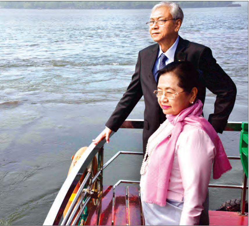
(ဓာတ်ပုံ-ပြန်/ဆက်)