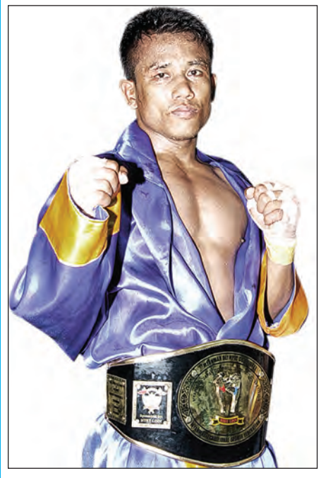
စောဇမန်း(မြန်မာ)

ယခုနှစ်တွင် ဂျပန်နိုင်ငံ၌ မြန်မာနိုင်ငံ ရိုးရာလက်ဝှေ့အဖွဲ့ချုပ်၊ ဂျပန်နိုင်ငံ အပြည်ပြည်ဆိုင်ရာ ရိုးရာလက်ဝှေ့အဖွဲ့ချုပ်နှင့် မြန်မာမီဒီယာဂရု(ပ်)တို့ ပူးပေါင်းကာ မြန်မာ့ရိုးရာလက်ဝှေ့ ပြိုင်ပွဲများကို နှစ်လတစ်ကြိမ်ဖြင့် တစ်နှစ်အတွင်း စုစုပေါင်း ခြောက်ပွဲ ကျင်းပသွားမည်ဖြစ်ပြီး ဖေဖော်ဝါရီ၊ ဧပြီ၊ ဇွန်၊ ဩဂုတ်၊ အောက်တိုဘာနှင့် ဒီဇင်ဘာလတို့တွင် စီစဉ်ကျင်းပ သွားမည်ဖြစ်သည်။ ယခု တတိယအကြိမ်မြောက် ရိုးရာ