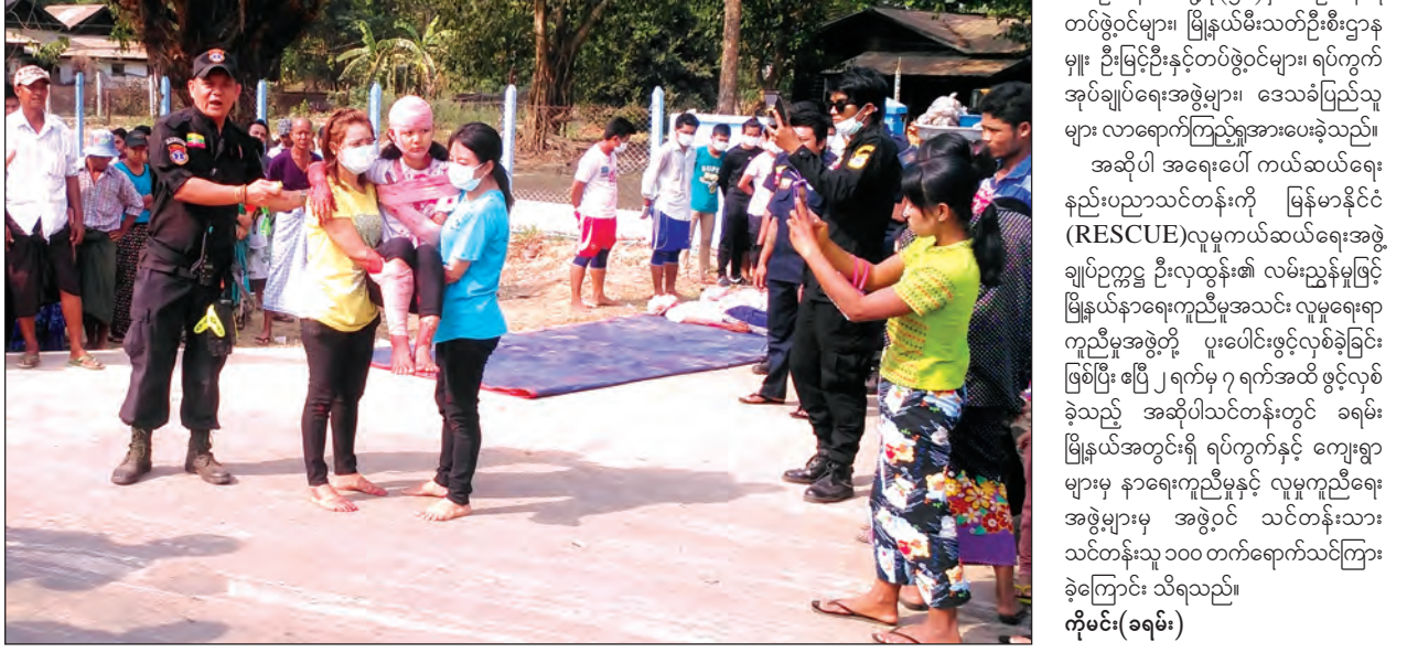
ကယ်ဆယ်ရေးအဖွဲ့ဝင်များက သင်တန်းသားများအား အရေးပေါ်ကယ်ဆယ်ရေးနည်းပညာ သင်တန်းပေးသွင်းနေကြောင်း ဖော်ပြပေးခဲ့သည်။

သရုပ်ပြပွဲတွင် သင်တန်းသားသင်တန်းသူ ၁၀၀ နှင့် သင်တန်းနည်းပြများက ယာဉ်တိုက်မှုမှ ကယ်ဆယ်ရေးနှင့် ယာဉ်တိုက်မှုများတွင် ဒဏ်ရာရလူနာများအား အရေးပေါ်ကူညီကယ်ဆယ်ခြင်း၊ လူနာတင်