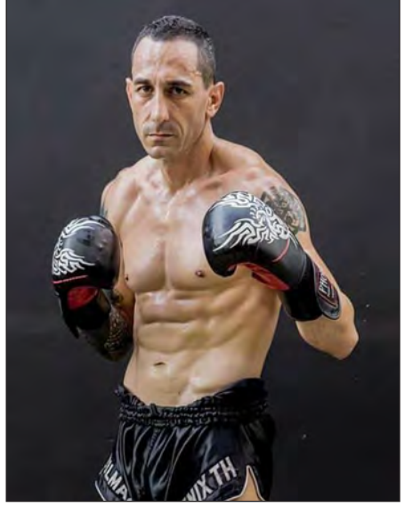
အက်ဒမ်(ဩစတြေးလျ)

ပွဲစဉ်တွင် မြန်မာနိုင်ငံမှ ကျားဘတ်နန်းနှင့် အမေရိကန်နိုင်ငံမှ ကိုဒီမိုဘာလီ၊ ၅၆ ကီလိုတန်းပြိုင်ပွဲတွင် မြန်မာနိုင်ငံမှ မျိုးဆက်