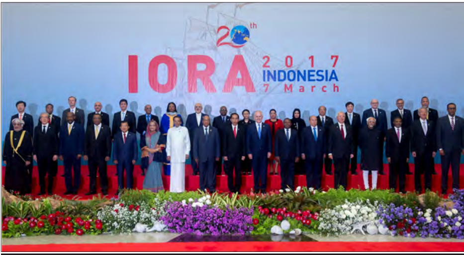
အင်ဒိုနီးရှားနိုင်ငံ ဂျကာတာမြို့တွင်ကျင်းပခဲ့သည့် ပထမအကြိမ် ထိပ်သီးအစည်းအဝေး

အိန္ဒိယသမုဒ္ဒရာ ကမ်းခြေတစ်လျှောက် တည်ရှိသည့် နိုင်ငံပေါင်း ၂၃ နိုင်ငံအနက် ဩစတြေးလျ၊ ဘင်္ဂလားဒေ့ရှ်၊ ကိုမိုရိုစ်၊ အိန္ဒိယ၊ အင်ဒိုနီးရှား၊ အီရန်၊ ကင်ညာ၊ မဒဂါကာစကား၊ မလေးရှား၊ မောရစ်ရှပ်၊ မိုဇမ်ဘစ်၊ အိုမန်၊ ဆေးရှ်လ်စ်၊