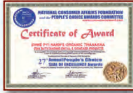
People Choice Award

(၃) ရွှေပြည်နန်းစက်ရုံတွင် အသုံးပြုသောရေမှာ သာမန်ရေထက် အဆ ၃၀၀၀ ပိုမိုသန့်စင်။