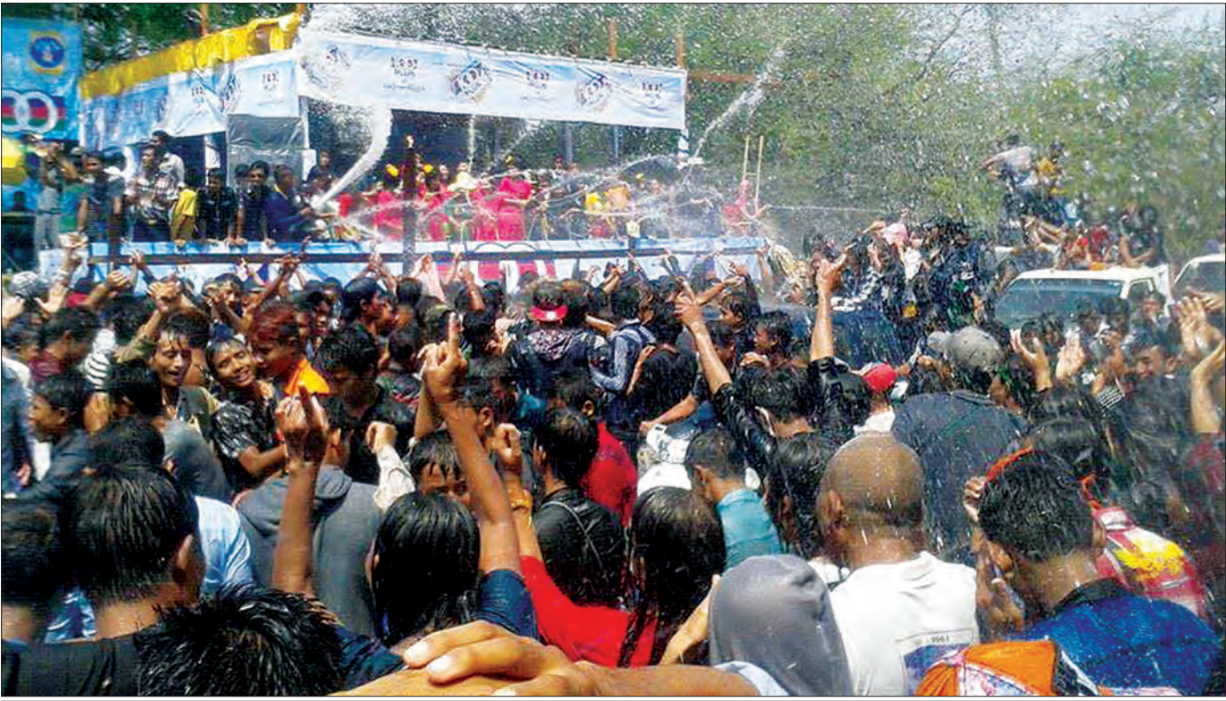
ယမန်နှစ် မကွေးသင်္ကြန်ပုံရိပ်ကို တွေ့ရစဉ်

သို့သော် ယခုခေတ်များသင်္ကြန်ကား ယခင်ယခင်ခေတ် များကဲ့သို့ မဟုတ်တော့ပေ။ သင်္ကြန်၏အနှစ်သာရပျောက်ဆုံး ခဲ့ပြီ။ မိရိုးဖလာလေ့ထုံးစံတို့ မတွေ့မြင်ရတော့။ မြို့ကြီး များတွင် မိန်းကလေး၊ ယောက်ျားကလေး သရုပ်ပျက်အဝတ် အစားများဝတ်ဆင်၍ အပျော်ကြူးကြသည်။ အမိုးဖွင့်ကားများ