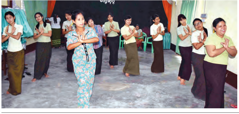
မြန်မာ့ရိုးရာ မန္တလေး မဟာသင်္ကြန်ပွဲတော်တွင် မန္တလေး အောင်မြေသစ်မြို့နယ် မြို့နယ်အထွေထွေအုပ်ချုပ်ရေး မိသားစု၏ မန္တလေးအောင်မြေ ရေကစားမဏ္ဍပ်ကို ၂၆ လမ်းနှင့် ကမ်းနားလမ်းထောင့် မြို့တော်ဥယျာဉ် အနီးတွင် ရေကစားမဏ္ဍပ်ဖြစ်ရာ ဧပြီ ၇ ရက်က မန္တလေးပန်တျာကျောင်းမှ အကနည်းပြဖြင့် ဖျော်ဖြေ ရေးအကအဖွဲ့ အဆို၊ အက လေ့ကျင့်စဉ် ထွက်လှအောင်(မန္တလေး)