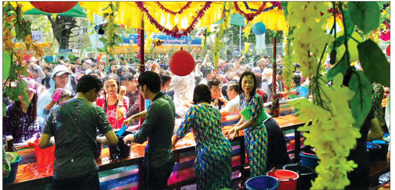
(၁၃)ကြိမ်မြောက် ရခိုင်ရိုးရာယဉ်ကျေးမှုသင်္ကြန်(ရန်ကုန်) ရေသဘင်ပွဲ ဆင်နွှဲနေစဉ်

သတင်း- မောင်စိန်လွင်(မြန်မာ့အလင်း)