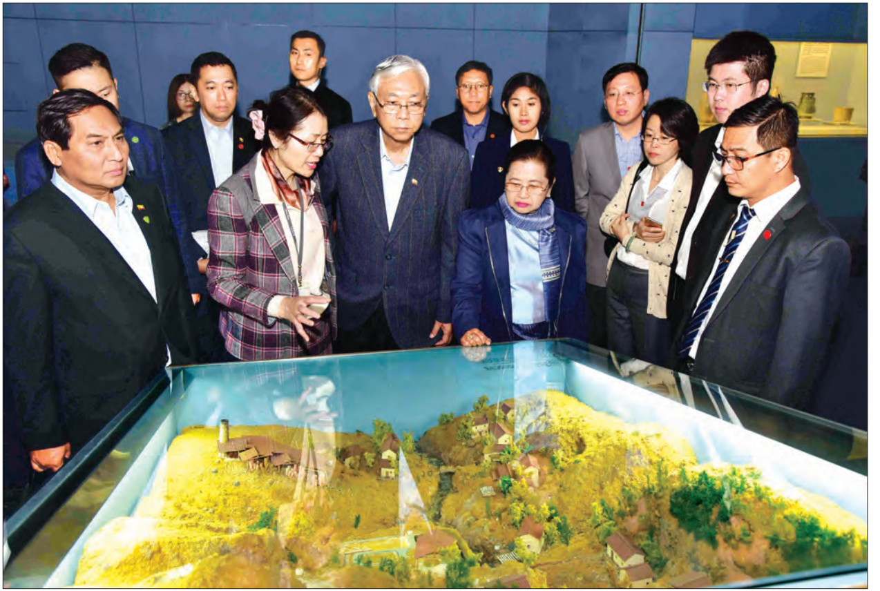
နိုင်ငံတော်သမ္မတ ဦးထင်ကျော်နှင့် ဇနီး ဒေါ်စုစုလွင် ရှန်ဟိုင်းအမျိုးသားပြတိုက်အတွင်း ရှေးဟောင်းတရုတ်လူမျိုးတို့၏ ရိုးရာယဉ်ကျေးမှု ဓလေ့ထုံးတမ်းစဉ်လာများ ကြည့်ရှု လေ့လာစဉ်

ရှန်ဟိုင်း အမျိုးသားပြတိုက်သည် ရှန်ဟိုင်းမြို့လယ်တွင် တည်ရှိပြီး ရှေးဟောင်း တရုတ်ယဉ်ကျေးမှုနှင့် ဓလေ့ထုံးတမ်းစဉ်လာများကို အပြည့်အဝ ခံစားသိရှိနိုင်အောင် စီစဉ်ဆောင်ရွက်