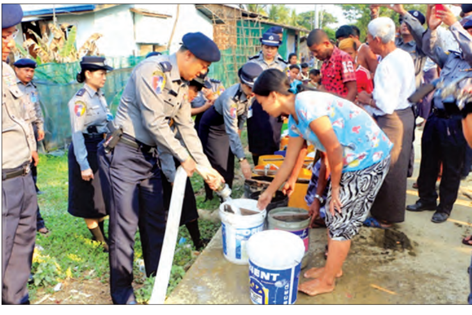
ရေဂါလန် ၄၄၀၀၊ သောက်ရေသန့်ဘူး သုံးရေ ၁၅ ဂါလန်နှုန်းဖြင့် ရေဂါလန် ၂၅၀၀၊ သောက်ရေသန့်ဘူး ငါးလီတာဝင် ဘူး ၂၅၀၊ သောက်ရေသန့်ဘူး ငါးလီတာဝင် ရပ်ကွက်၌ အိမ်ထောင်စုတစ်စုလျှင် ဘူး ၂၂၀၊ ၂၀ လီတာဝင် ၇၅