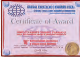
Global Excellence Award