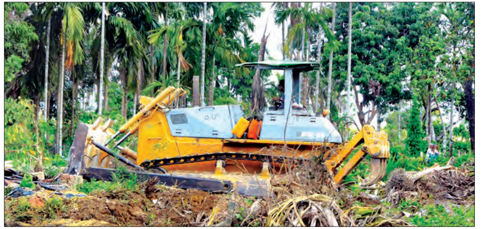
ဝါးပိတ်ကျေးရွာတွင် စက်ယန္တရားများဖြင့် မြေယာပြန်လည်ဖော်ထုတ်နေသည်ကို မတ်လ နောက်ဆုံးပတ်က တွေ့မြင်ရစဉ်

ဝင်လမ်းထွက်လမ်းရှိလာမယ်။ ရေသွား ရေလာကောင်းမယ်။ လိုအပ်ရင် ထပ်မံ ဖော်ထုတ်ပေးသွားမယ်လို့ ကျွန်တော် သိထားပါတယ်” ဟုပြောသည်။ “မြေနေရာတွေ စနစ်တကျ ဖော်ထုတ်လို့ ပြန်လည်ပေးအပ်ပြီး ရင်တော့ နေအိမ်တွေ ပြန်လည်ဆောက် လုပ်နိုင်ဖို့ အစိုးရအနေနဲ့ ထောက်ပံ့ ကြေးတွေလည်းပေးမှာပါ။ လက်ရှိမှာ တော့ ထောက်ပံ့မှုအနေနဲ့ ကျီးကန်းပြင် အလယ်ရွာနဲ့ ဝါးပိတ်ကျေးရွာတွေ ကိုတော့ WFP (ကမ္ဘာ့စားနပ်ရိက္ခာ အစီအစဉ်)က လစဉ် ဆန်၊ ဆီ နဲ့ ပဲ ကို လစဉ်ထောက်ပံ့ပါတယ်။ တိုင်းရင်းသား ရွာနစ်ရွာမှာတော့ ဆင်းရဲနွမ်းပါးတဲ့ သူတွေကို ရွေးချယ်ထောက်ပံ့ပေးပါ တယ်။ အကုန်လုံးကို ထောက်ပံ့တာ မျိုးတော့ မရှိပါဘူး” ဟု ကျီးကန်းပြင် အုပ်ချုပ်ရေးမှူးက ဆိုသည်။