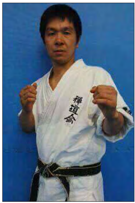
တာရူဟိုကို ကူဘို(ဂျပန်)