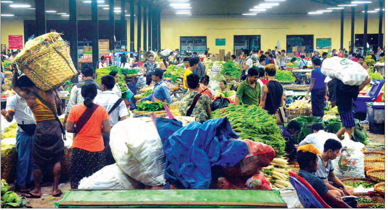
သီရိမင်္ဂလာဈေးရှိ ဟင်းသီးဟင်းရွက်ဈေးတန်းကို တွေ့ရစဉ်

“စိုက်ပျိုးရေးမှာ နည်းပညာပိုင်း အားနည်းမှုနဲ့ ပြည်ပကတင်သွင်းလာတဲ့ စိုက်ပျိုးရေးသုံးဓာတ်မြေဩဇာ၊ ပိုးသတ်ဆေး၊ မှီဆေးနဲ့ တခြားစိုက်ပျိုးရေးသုံးပစ္စည်းတွေ ဈေးနှုန်းကြီးမြင့်မှုတွေကလည်း ပြည်ပသစ်သီးဝလံ ဈေးကွက်ကို ယှဉ်ပြိုင်ဖို့ အားနည်းစေ