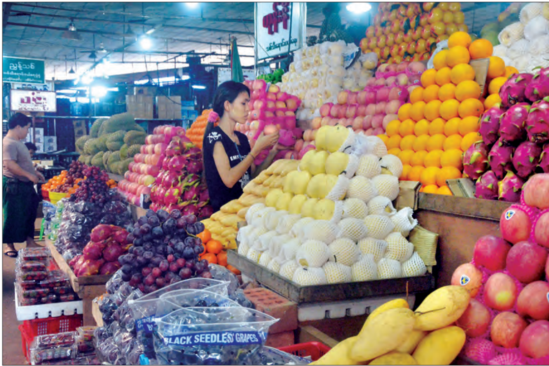
သီရိမင်္ဂလာဈေးရှိ သစ်သီးမျိုးစုံရောင်းဝယ်ရေးဆိုင်ကို တွေ့ရစဉ်

သတင်းဆောင်းပါး - မင်းသစ်(သတင်းစဉ်)၊ ဇော်ကြီး(ပဏိတ)၊ ဓာတ်ပုံ - ဖေဇော်