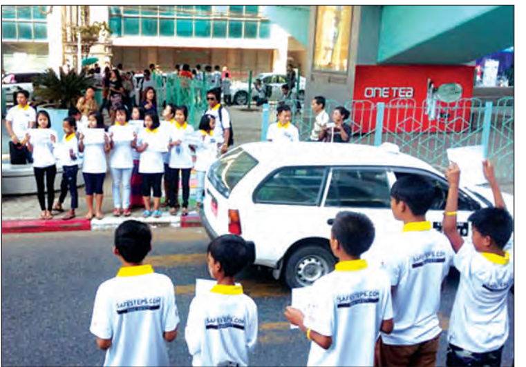
ခွဲကြသည်။ ယာဉ်အန္တရာယ်၊ လမ်းအန္တရာယ်ကင်းရှင်းရေး ရက်သတ္တပတ်လှုပ်ရှားမှုကို ၂၀၁၆ ခုနှစ် နိုဝင်ဘာလအတွင်းက ပထမအကြိမ်အဖြစ် ရန်ကုန်မြို့တွင် ဆောင်ရွက်ခဲ့ပြီး ဒုတိယအကြိမ်ကို မွန်ပြည်နယ်တွင် ဆောင်ရွက်ခဲ့ကာ ယခု တတိယအကြိမ်ကို ရန်ကုန်မြို့တွင် ထပ်မံဆောင်ရွက်ခြင်း ဖြစ်ကြောင်း သိရသည်။ သန်းထိုက်(လှိုင်သာယာ)

ယာဉ်အန္တရာယ်၊ လမ်းအန္တရာယ်ကင်းရှင်းရေး အသိပညာပေး လှုံ့ဆော်မှုအဖြစ် ယာဉ်မောင်းစဉ် လက်ကိုင်ဖုန်းမပြောပါနှင့်၊ သတ်မှတ်ယာဉ်ကြောမှ မောင်းနှင်ပါ၊ မှုးရင်မမောင်းနှင့် မောင်းရင်မမှူးနှင့် ပြိုင်မမောင်းရ လှမောင်းရ ဆိုင်ကယ်စီးလျှင် ဦးထုပ်ဆောင်းပါ၊ အရှိန်နှုန်းကန့်သတ်ချက်များအား လိုက်နာပါ၊ ခဏလေးစောင့်လျှင် အသက်ရှင် စည်းကမ်းပြည့်ဝ ဂုဏ်ရှိစွာ နိုင်ငံကြီးသား ပီသသူများ စည်းကမ်းလိုက်နာကြ စသည့် စာရွက်များကို လှုပ်ရှားမှုတွင် ပါဝင်ဆောင်ရွက်သူ ကျောင်းသား ကျောင်းသူလေးများက ကိုင်ဆောင်၍ ယာဉ်/လမ်းအန္တရာယ်ကင်းရှင်းရေးအတွက် တက်ကြွစွာ အသိပညာပေးဆောင်ရွက်