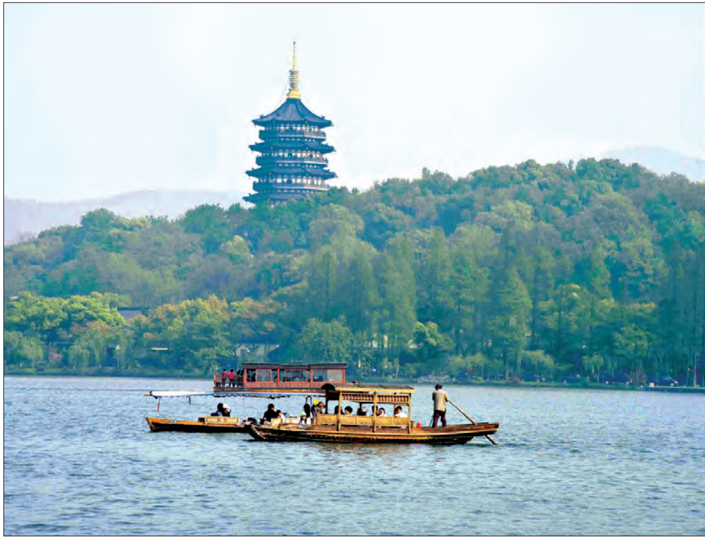
နိုင်ငံတော်သမ္မတ ဦးထင်ကျော်နှင့် ဇနီး ဒေါ်စုစုလွင်တို့ ဟန်ကျိုးမြို့ရှိ အနောက်ဘက်ကန်ကို ကြည့်ရှုလေ့လာစဉ်

ထိုနောက် နိုင်ငံတော်သမ္မတနှင့် ဇနီးနှင့်အဖွဲ့သည် ခေတ္တတည်းခိုမည့် ပေကျင်းမြို့ကျောက်ယုထိုင် နိုင်ငံတော် ဧည့်ဂေဟာသို့ ရောက်ရှိကြသည်။ (သတင်းစဉ်)