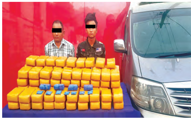
စိတ်ကိုပြောင်းလဲစေသော ဆေးဝါးများဆိုင်ရာဥပဒေအရ အရေးယူထားကြောင်း သိရသည်။