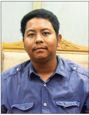
ဦးထက်နိုင်ဇော်