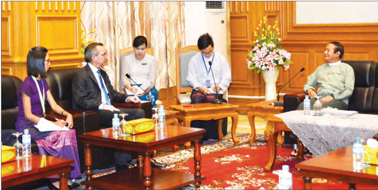
ပြည်သူ့လွှတ်တော်ဥက္ကဋ္ဌ ဦးဝင်းမြင့်နှင့် အမေရိကန်နိုင်ငံ သံအမတ်ကြီး မစ္စတာ စကော့အလန်မာစီရယ်လ်တို့ တွေ့ဆုံဆွေးနွေးစဉ်