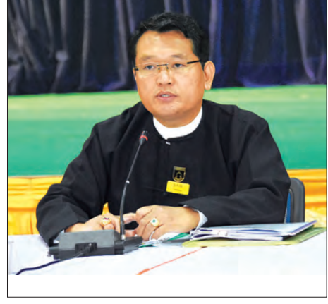
ညွှန်ကြားရေးမှူးချုပ် ဦးကိုကိုနိုင်

ကြောင်း၊ လာဘ်ပေးလာဘ်ယူမှုများနှင့် ပတ်သက်သည့် တိုင်ကြားမှုများရှိပါက သိလျှင်ဖြစ်စေ၊ သတင်းကျော်ဇောလျှင် ဖြစ်စေ စုံစမ်းစစ်ဆေးမှုများဆောင်ရွက်ပြီး ပေါ်ပေါက်လာသည့် အတိုင်း စီမံခန့်ခွဲမှုအပိုင်းမှ ဆက်လက်ဆောင်ရွက်ပါကြောင်း၊ အဂတိလိုက်စားမှုတိုက်ဖျက်ရေးကော်မရှင်နှင့်လည်း ပူးပေါင်းဆောင်ရွက်လျက်ရှိပါကြောင်း၊ တရားသူကြီးများလိုက်နာရမည့် ကျင့်ဝတ်များကို ထုတ်ပြန်ကြေညာ အကောင်အထည်ဖော်ဆောင်ရွက်သွားမည်ဖြစ်ပါကြောင်း ဖြေကြားသည်။ ညွှန်ကြားရေးမှူးချုပ် ဦးကိုကိုနိုင်က တရားရုံးကိစ္စရပ်များသည် နှစ်ဖက်ပြိုင်ဆိုင်သည့်ကိစ္စရပ်များဖြစ်၍ တိုင်ကြားခြင်းများရှိပါကြောင်း၊ တိုင်စာများကိုဖျောက်ဖျက်၍ မရပါကြောင်း၊ အဂတိလိုက်စားမှုတိုက်ဖျက်ရေးကော်မရှင်၏ အရေးယူသည့်စာရင်းများတွင် တရားသူကြီးများပါဝင်ပါကြောင်း