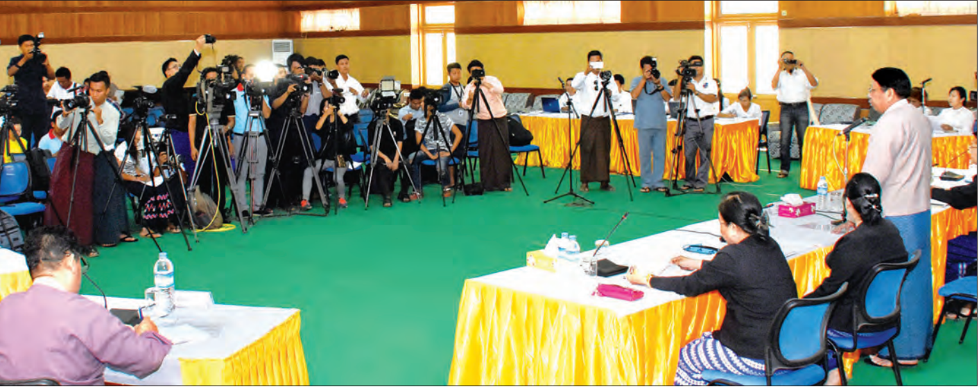
နိုင်ငံတော်အစိုးရ၏ ပထမတစ်နှစ်တာကာလအတွင်း ဆောင်ရွက်ခဲ့မှုများနှင့် ပတ်သက်သည့် သတင်းစာရှင်းလင်းပွဲကျင်းပစဉ်

ပြည်ထောင်စုတရားလွှတ်တော်ချုပ်မှ ညွှန်ကြားရေးမှူးချုပ် ဦးကိုနိုင်က ပြည်ထောင်စုတရားလွှတ်တော်ချုပ်အနေဖြင့် တရားစီရင်ရေးဆိုင်ရာ ပြုပြင်ပြောင်းလဲမှုများ ဆောင်ရွက်နိုင်ရန် တရားစီရင်ရေးဆိုင်ရာ မဟာဗျူဟာစီမံကိန်းကို နိုင်ငံ