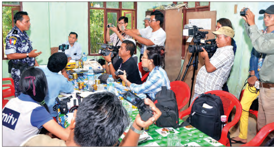
ဘူးသီးတောင်မြို့နယ် တောင်ဘေကျေးရွာ၌ တောင်ဘေနယ်မြေရဲစခန်းမှူးက ပြည်တွင်း ပြည်ပ သတင်းမီဒီယာအဖွဲ့အား နယ်မြေအခြေအနေနှင့်ပတ်သက်၍ ရင်းလင်းပြောကြားစဉ်

၂၀၁၆ အောက်တိုဘာ ၉ ရက်က အကြမ်းဖက်စီးနင်း တိုက်ခိုက်ခံရတဲ့အခြေအနေတွေအပြင် နယ်မြေတည်ငြိမ် အေးချမ်းရေးဆောင်ရွက်နေမှုနဲ့ နောက်ဆုံးအခြေအနေတွေကို ပြည်တွင်း ပြည်ပမီဒီယာများမှတစ်ဆင့် အများပြည်သူတို့ သိရှိ ခွင့်ရရှိမှာ ဖြစ်ပါတယ်။ ဒီလိုဆောင်ရွက်ပေးနိုင်ခြင်းအားဖြင့် မီဒီယာတစ်ခုတည်းကပဲ သတင်းတွေ ပုံဖော်တင်ဆက်နေတာမျိုး မဟုတ်ဘဲ သတင်းဌာနစုံစုံရှုထောင့်စုံ မြင်ကွင်းစုံကနေ သတင်း မှန်တွေ ပုံနှံ့ရောက်ရှိသွားမှာ ဖြစ်ပါတယ်။ ဒါကြောင့် မောင်တော ဒေသရဲ့ သတင်းမှန်တွေကို ပြည်တွင်းသမားက ပြည်ပကပါ သိရှိနိုင်မှာ ဖြစ်ပါတယ်။