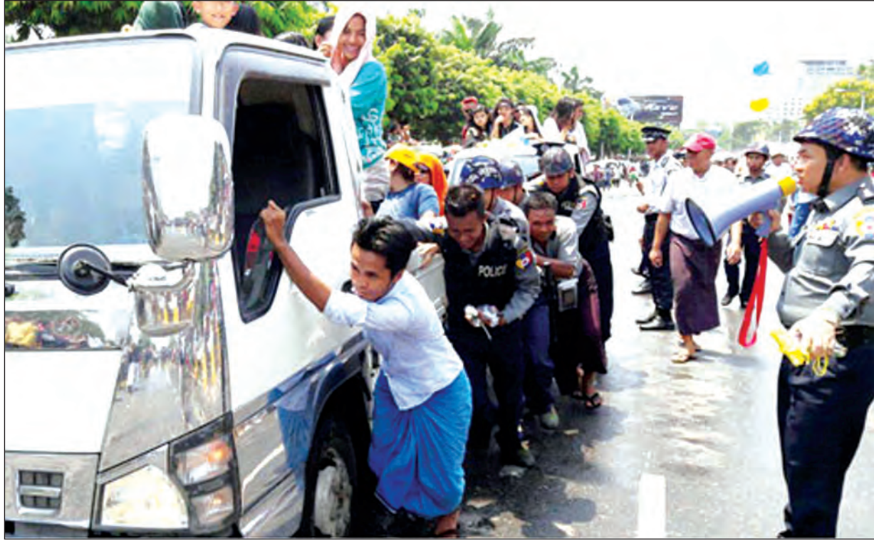
ယခင်နှစ် သင်္ကြန်ကာလအတွင်း ပျက်နေသောယာဉ်တစ်စီးကို ဝိုင်းဝန်းကူညီတွန်းပေးနေသည့် ရဲတပ်ဖွဲ့ဝင်များ

မြန်မာနိုင်ငံ ရဲတပ်ဖွဲ့ဝင်များသည် ယခုနှစ် သင်္ကြန်ကာလတွင်လည်း အတာရေ သဘင်ပွဲတော် ဆင်နွှဲနေကြသောပြည်သူများ စိတ်အေးချမ်းသာစွာဖြင့် ရေကစား