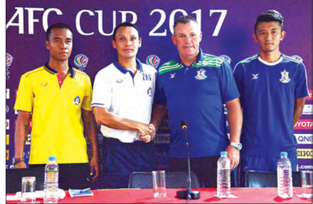
ပွဲကြိုသတင်းစာရှင်းလင်းပွဲတွင် အသင်းနည်းပြချုပ်များ နှုတ်ဆက်ကြစဉ်