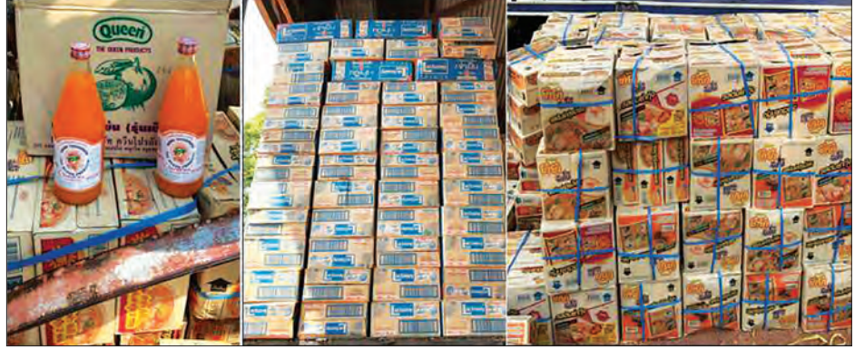
သွင်းကုန်ကြေညာလွှာတွင် ကြေညာထားသည်ထက် ပိုမိုသယ်ဆောင်လာသော Instant Noodle၊ "Queen" Orange Juice နှင့် Soy Milk များကို တွေ့ရစဉ်

နေပြည်တော် ဧပြီ ၄ တရားမဝင်ကုန်စည်များ တားဆီးထိန်းချုပ်ရေးအတွက် ရေပူနှင့် မရမ်းချောင့် အမြဲတမ်းစစ်ဆေးရေးစခန်းတို့အား ဌာနဆိုင်ရာ ပူးပေါင်းအဖွဲ့များဖြင့် မတ် ၁ ရက်တွင် စတင်ဖွင့်လှစ် ဆောင်ရွက်ခဲ့ပြီး ဧပြီ ၃ ရက်က မန္တလေး-မုဆယ် ပြည်ထောင်စုလမ်းမကြီးတစ်လျှောက် ကုန်သွယ်မှုယာဉ်ပို့ကုန် ၆၂၃ စီး၊ သွင်းကုန် ၅၁၆ စီး၊ ရန်ကုန်-မြောက်လမ်းမကြီးတစ်လျှောက် ကုန်သွယ်မှုယာဉ် ပို့ကုန် ၅၂ စီး၊ သွင်းကုန် ၁၈၁ စီး၊ ကုန်စည်များ သယ်ယူပို့ဆောင်လျက်ရှိသည်။