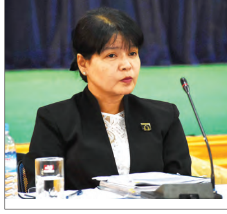
ဒုတိယညွှန်ကြားရေးမှူးချုပ် ဒေါ်အေးအေးကြည်သက်

တရားရေးမဏ္ဍိုင် ပြုပြင်ပြောင်းလဲမှုတွင် အားနည်းနေသည်ဟူသည့် ပြောဆိုဝေဖန်ချက်များအပေါ် ညွှန်ကြားရေးမှူးချုပ် ဦးကိုကိုနိုင်က ဌာန၏ မူလပင်ကိုသဘောသဘာဝအရ တိုင်ကြားစာများပြားခြင်းဖြစ်ပါကြောင်း၊ ပြုပြင်ပြောင်းလဲရေးများ ဆောင်ရွက်လျက်ရှိပါကြောင်း၊ အဆိုပါပြုပြင်ပြောင်းလဲမှုများကို ရှင်းလင်းခဲ့ပြီးဖြစ်ပါကြောင်း ဖြေကြားသည်။ တရားစီရင်ရေးဆိုင်ရာများအပေါ် ဝေဖန်မှုများရှိနေခြင်းနှင့် စပ်လျဉ်း၍ ဝေဖန်ရာတွင် တစ်ဦးနှင့်တစ်ဦး အမြင်မတူနိုင်ပါကြောင်း၊ သုံးသပ်ရာတွင်လည်း မတူနိုင်ပါကြောင်း၊ ပွင့်လင်း