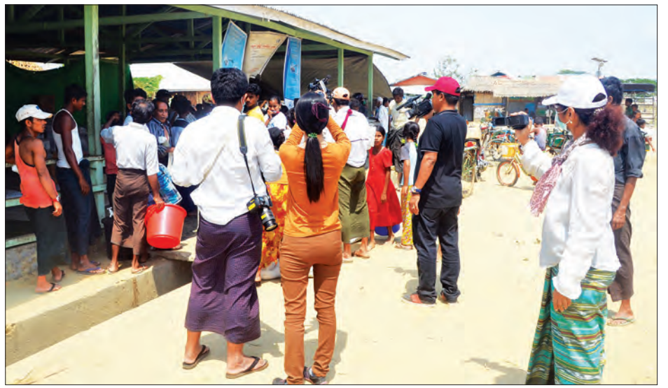
ပြည်တွင်း ပြည်ပမီဒီယာများ စစ်တွေမြို့သတ္တဏ်ကြက်ကယ်ဆယ်ရေးစခန်း၌ သတင်းရယူမေးမြန်းနေစဉ်

ဒီဒေသမှာဖြစ်နေတဲ့ သတင်းအခြေအနေအမှန်ကို တစ်ကမ္ဘာလုံး သိရှိဖို့လိုတယ်။ အဲဒီလို သိရှိနိုင်ဖို့အတွက် တစ်ကမ္ဘာလုံးကို ပျံ့နှံ့နိုင်တဲ့ ဘက်မလိုက်တဲ့ နိုင်ငံခြားသားပါဝင်တဲ့ မီဒီယာတွေကိုပေးဝင်ပြီး ကျွန်တော်တို့လို လွတ်လွတ်လပ်လပ်သတင်းယူခွင့် ပေးလိုက်မယ် ဆိုရင် အခြေအနေအားလုံးကို တစ်ကမ္ဘာလုံးက သိသွားမယ်။ ဒါဆိုရင်တော်တော်လေး ထိရောက်မှု ရှိနိုင်ပါတယ်