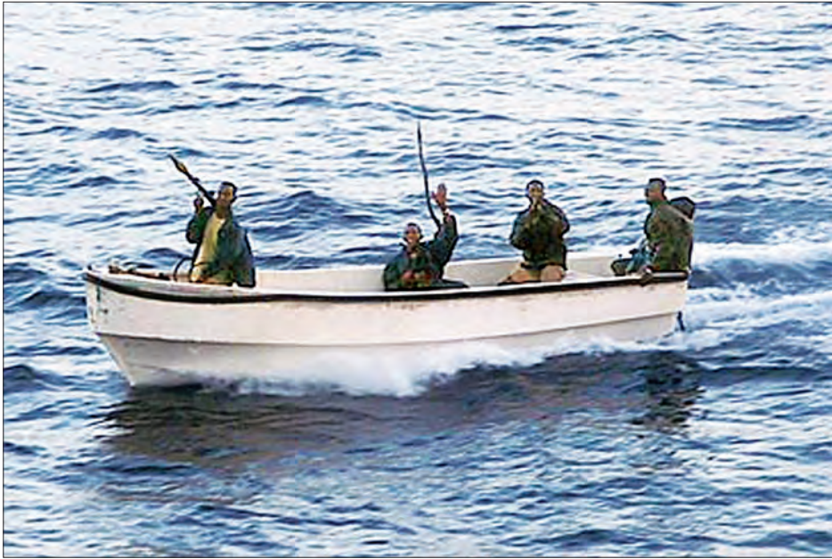
သင်္ဘောများအားပြန်ပေးဆွဲမှုပြုလုပ်နေသည့် ဆိုမာလီပင်လယ်စားပြုများကို တွေ့ရစဉ်

နိုင်ရီဘီ ဧပြီ ၄ သင်္ဘောသား ၁၀ ဦး လိုက်ပါလာသော အိန္ဒိယကုန်တင် သင်္ဘော တစ်စင်းသည် ဆိုမာလီကမ်းလှန်ပင်လယ်ပြင်အရောက်တွင် ပြန်ပေးဆွဲခံခဲ့ရကြောင်း ရေကြောင်း အရာရှိတစ်ဦးက ယမန်နေ့က ပြောကြားခဲ့သည်။