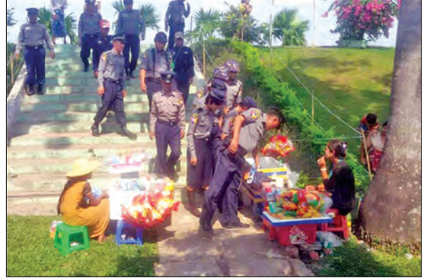
အအေးဆိုင်များတွင် ဘီယာ၊ အရက် ရောင်းချခြင်းမရှိစေရန် စစ်ဆေးနေစဉ်

တစ်နှစ်တွင်တစ်ကြိမ်သာ ရေကစားနိုင်သည့် သင်္ကြန်ပွဲတော်ကာလတွင် ပါဝင် ဆင်နွှဲကြသူများအနေဖြင့် မိမိနိုင်ငံ၊ မိမိလူမျိုး၏ဂုဏ်ကို မြှင့်တင်ထိန်းသိမ်း စောင့် ရှောက်လျက် ယဉ်ကျေးမှုအမွေအနှစ်များကို မပျောက်ပျက်စေဘဲ ၂၀၁၇ ခုနှစ် မြန်မာ့ရိုးရာ အတာသဘင်ပွဲတော်တွင် အေးချမ်းပျော်ရွှင်စွာဖြင့် ပါဝင်ဆင်နွှဲနိုင်ပါ စေကြောင်း ဆုမွန်ကောင်းတောင်းရေးသားလိုက်ပါသည်။ ။