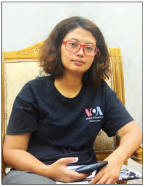
ဒေါ်မေမေ