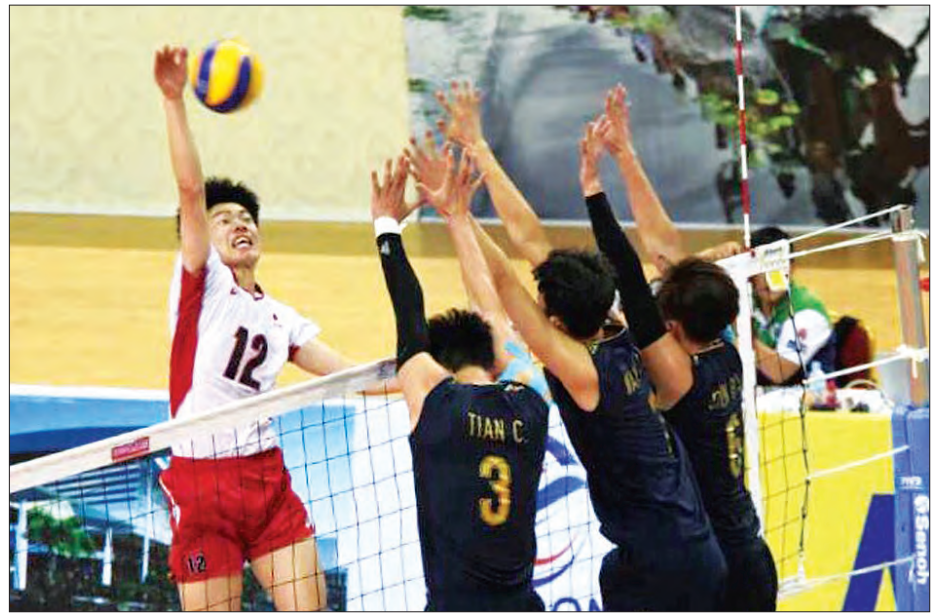
ဆီမီးစိုင်းနယ်ပွဲတွင် ဂျပန်နှင့် တရုတ်အသင်းတို့ ယှဉ်ပြိုင်နေစဉ်