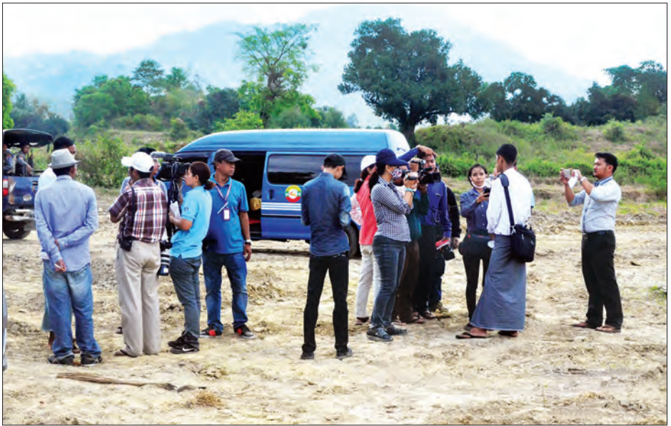
မောင်တောမြို့နယ် ဝါးပိတ်ကျေးရွာတွင် ပြန်လည်နေရာချထားရေးအတွက် ဆောင်ရွက်နေမှုအခြေအနေကို သတင်းရယူစဉ်

အောက်တိုဘာ ၉ ရက်ဖြစ်စဉ်နောက်ပိုင်း ဒီမှာ ဘာတွေ ဆောင်ရွက်မှုရှိသလဲဆိုတာ သိချင်လို့လာတာ။ ပထမဆုံး ဘူးသီးတောင်က တင်းမေရွာကို သွားခဲ့တယ်။ နောက်မောင်တော မှာရှိတဲ့ ရွာ ၁၀ ရွာ လောက်သွားခဲ့တယ်။ အကြမ်းဖက်ဖြစ်စဉ်