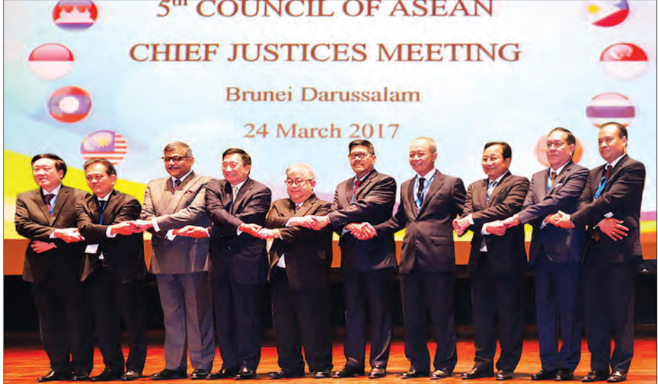
ပြည်ထောင်စုတရားသူကြီးချုပ် ဦးထွန်းထွန်းဦး (၅) ကြိမ်မြောက် အာဆီယံတရားသူကြီးချုပ်များကောင်စီ အစည်းအဝေး တက်ရောက်လာသည့် တာဝန်ရှိသူများနှင့်အတူ စုပေါင်းမှတ်တမ်းတင် ဓာတ်ပုံရိုက်ရင်း

“အာဆီယံတရားသူကြီးချုပ်များ အစည်းအဝေး” ကို ၂၀၁၃ ခုနှစ်မှစတင်၍ ဒေသတွင်း တရားစီရင်ရေးဆိုင်ရာ အစည်းအဝေးအဖြစ် နှစ်စဉ်ကျင်းပခဲ့ပြီး ယခုအခါ “အာဆီယံတရားသူကြီးချုပ်များ အစည်းအဝေး” အား “အာဆီယံတရားသူကြီးချုပ်များကောင်စီ” ဟု အမည်ပြောင်းလဲ၍ အာဆီယံမူဘောင်အတွင်း သီးခြားရပ်တည်သည့် အဖွဲ့အစည်းအဖြစ် အာဆီယံပဋိညာဉ်စာတမ်း၏ ဇယား ၂ တွင် မှတ်ပုံတင်စာရင်းတင်သွင်းပြီး ဖြစ်သည်။ ပြည်ထောင်စုတရားလွှတ်တော်ချုပ်သည် အာဆီယံတရားသူကြီးချုပ်များကောင်စီ၏ ရည်မှန်းချက်ဖြစ်သည့် အာဆီယံဒေသတွင်း တရားစီရင်ရေးဆိုင်ရာ ပူးပေါင်းဆောင်ရွက်မှုလုပ်ငန်းများတွင် ဆက်လက်ပါဝင်ဆောင်ရွက်သွားမည် ဖြစ်ကြောင်း သိရသည်။ (သတင်းစဉ်)