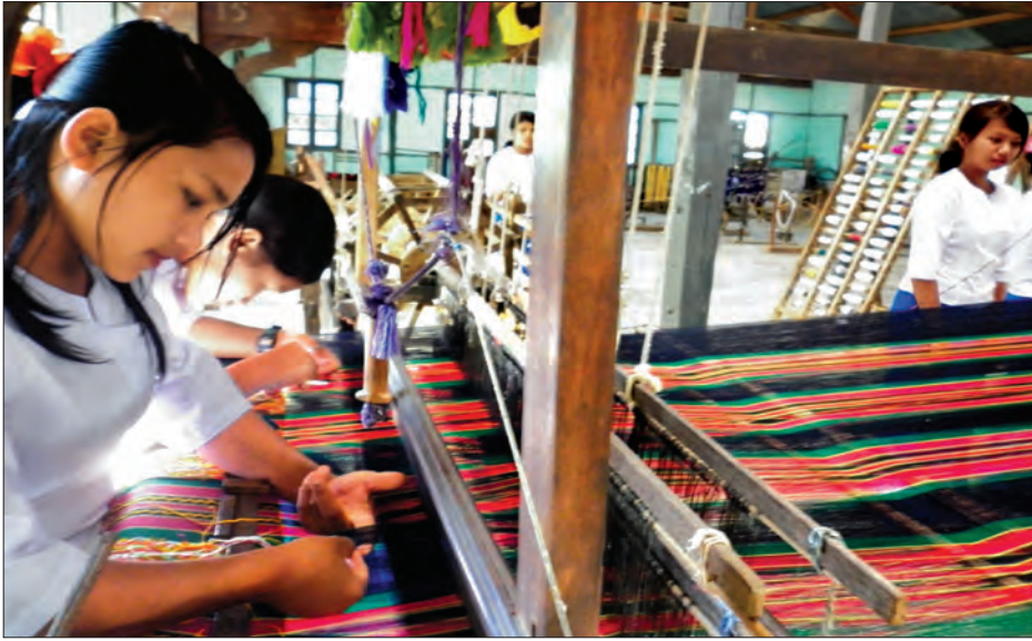
ချင်းပြည်နယ်ရှိ သင်တန်းသူများ ချင်းရိုးရာအထည် ရက်လုပ်နေမှုကို တွေ့ရစဉ်

“ပြည်တွင်းနှင့် နိုင်ငံတကာ ရင်းနှီးမြှုပ်နှံမှုနှင့် ဖွံ့ဖြိုးတိုးတက် ရေးဆိုင်ရာအထောက်အပံ့များ တိုးတက်ရရှိရေး ဆောင်ရွက်ရန်၊ နယ်စပ်ကုန်သွယ်မှု ပိုမိုတိုးတက်နိုင်ရေး ဆောင်ရွက်ရန်၊ ချင်းပြည်နယ် လူမှုစီးပွားဖွံ့ဖြိုးတိုးတက်မှုဆိုင်ရာ သုတေ သနလုပ်ငန်းများကို အားပေးမြှင့်တင်ဆောင်ရွက်ရန်ဟူသည့် ရည်မှန်းချက်များထားရှိပြီး ချင်းပြည်နယ်တိုးတက်ဖွံ့ဖြိုးရေး အတွက် ပြည်နယ်အစိုးရက ကြိုးပမ်းဆောင်ရွက်လျက်ရှိ”