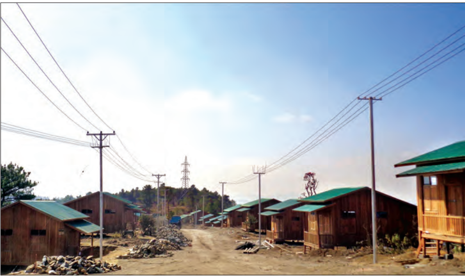
ဟားခါးမြို့၌ ၁၁ ကေဗီလိုင်းနှင့် ၄၀၀ ဝိုလိုင်း တည်ဆောက်ပြီးစီးမှုကို တွေ့ရစဉ်