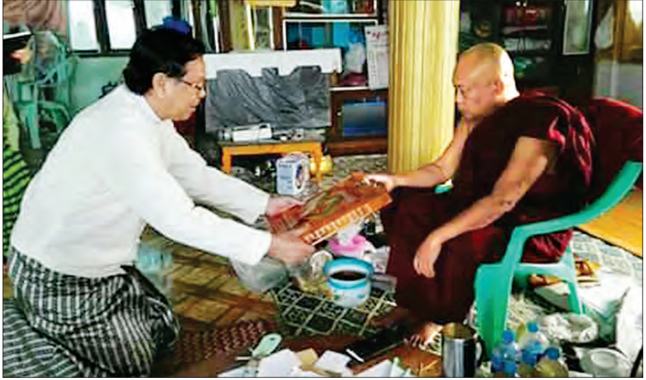
ဦးသိန်းနိုင်က ရှင်းလင်းတင်ပြခဲ့မှုများနှင့် အသွေးပြည့်မီရေးနှင့် တံတားတည်များ အမြန်ထုတ်ပေးနိုင်ရေးအတွက် ပတ်သက်၍ သတ်မှတ်ကာလအတွင်း ဆောက်ရေးစီမံကိန်းတွင် ပါဝင်သွားသော ဆွေးနွေးမှုများကြားခဲ့ကြောင်း သတင်းရရှိအချိန်မီပြီးစီးရေး၊ သတ်မှတ်အရည် တောင်သူများ၏ မြေယာနစ်နာကြေးသည်။ (သတင်းစဉ်)

နာရီတွင် အမျိုးသားလွှတ်တော် ဒုတိယဥက္ကဋ္ဌသည် ပြည်သူ့လွှတ်တော် ကိုယ်စားလှယ် ဦးစစ်နိုင်၊ ခရိုင်အုပ်ချုပ်ရေးမှူး၊ မြို့နယ်အုပ်ချုပ်ရေးမှူးများ၊ အမျိုးသားလွှတ်တော်ရုံးမှ တာဝန်ရှိသူများနှင့်အတူ ရခိုင်ပြည်နယ် မင်းပြားမြို့နယ်၌ တည်ရှိပြီး မင်းပြားမြို့နယ်နှင့် မြေပုံမြို့နယ်တို့သို့ ဆက်သွယ်သွားလာနိုင်မည့် ကြပ်စင်တံတား ပေ ၁၉၂၀ တည်ဆောက်ရေးစီမံကိန်းသို့ သွားရောက်ကြည့်ရှုစစ်ဆေးသည်။ တံတားတည်ဆောက်ရေး ရှင်းလင်းဆောင်တွင် တာဝန်ခံ ဒုတိယဥက္ကဋ္ဌကြီးရေးမှူး(မြို့ပြ)