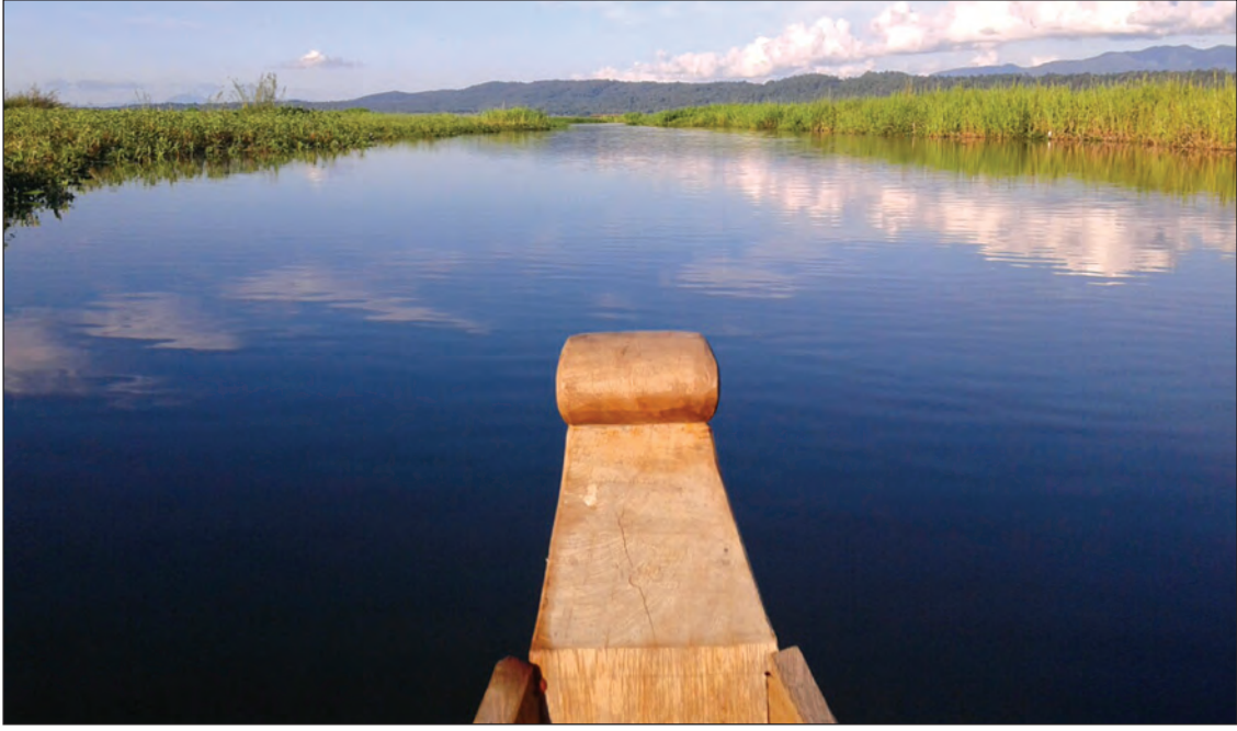
အင်းတော်အင်း ခေါ် အင်းတော်လေးအင်းအတွင်း မြင်ကွင်း

စစ်ကိုင်းတိုင်းဒေသကြီး ကသာခရိုင် အင်းတော်မြို့တွင် တည်ရှိသော အင်းတော်အင်းသည် အင်းတော်ကြီးနှင့် အင်းလေးကန်တို့ပြီးလျှင် မြန်မာနိုင်ငံတွင် တတိယအကြီးဆုံး အင်းကြီးတစ်ခုဖြစ်သည်။ အင်းတော်အင်းကို အင်းတော်လေးအင်းဟုလည်း ခေါ်ကြသည်။ ထိုသို့ နိုင်ငံ၏ တတိယအကြီးဆုံးအင်းဖြစ်သည့် အင်းတော်လေးအင်းသည် ယခင်က အလျား ငါးမိုင်၊ အနံ့နှစ်မိုင်ကျော် ရှိခဲ့ရာမှ ယခုအခါ တဖြည်းဖြည်း တိမ်ကောလာရာ အလျား လေးမိုင်၊ အနံ့နှစ်မိုင်ကျော်ခန့်သာရှိတော့ကြောင်း သိရသည်။ အင်းပတ်လည်တွင်ရှိကြသည့် ကျေးရွာငါးရွာမှ အိမ်ခြေ ၈၀၀ ခန့်ရှိ လူဦးရေ ၅၀၀၀ ခန့်သည် ထိုအင်းကိုအမှီပြု၍ ရေလုပ်ငန်းနှင့် စိုက်ပျိုးမွေးမြူရေးလုပ်ငန်းများကို လုပ်ကိုင်နေကြသည်။ အင်းတော်အင်းပတ်လည်ရှိ ကျေးရွာများမှ တောင်သူလယ်သမား ၁၀၀၀ ခန့်သည် လယ်ယာမြေ ၈၀၀၀ ခန့်ကို စိုက်ပျိုးကြပြီး အသက်မွေးဝမ်းကျောင်းပြုခဲ့ကြသည်မှာ နှစ်ပေါင်း ၅၀ နီးပါး ရှိနေပြီဖြစ်ကြောင်းလည်း သိရသည်။ စိုက်ပျိုးမြေရယူခြင်းနှင့် အင်းတိမ်ကောခြင်း အဆိုပါလယ်မြေများသည် အင်းပတ်လည်မှ အင်းတိမ်ကောသွားသော မြေနေရာများဖြစ်ကြပြီး အင်းရေကျချိန်တွင် စပါးစိုက်ပျိုးကြကာ စပါး ရိပ်သိမ်းပြီးချိန်တွင် ပဲမျိုးစုံကိုစိုက်ပျိုးကြကြောင်း သိရသည်။ အချို့သော သီးနှံစိုက်ပျိုးသူများသည် အင်းရေအောက်တွင် ငှက်အရည်ကြီးများ ထိုးစိုက်၍ ငှက်အရင်းတွင် သစ်ခက်သစ်ရွက်များ စုပုံချည်နှောင်ပြီး နန်းမြေရရှိအောင် ပြုလုပ်ကြသဖြင့် အင်းတိမ်ကောသွားနိုင်ကြောင်း တွေ့ရသည်။ ထိုကဲ့သို့ပြုလုပ်ခြင်းဖြင့် စိုက်ပျိုးမြေများ ရရှိလာသော်လည်း အင်းတော်အင်းသည် တဖြည်းဖြည်းနှင့် ကျဉ်းမြောင်းသွား