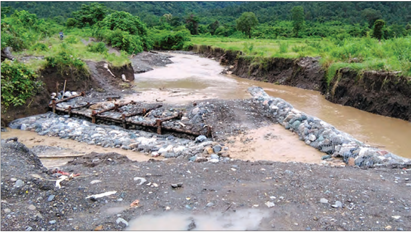
၂၀၁၆-၂၀၁၇ ဘဏ္ဍာနှစ် ပြည်နယ်ရန်ပုံငွေ(ငွေလုံးငွေရင်း)ဖြင့် တီးတိန်မြို့နယ် ဒိမ်ဇန်ကျေးရွာ ခွေလွှဲချောင်းလယ် ရေသွယ်မြောင်း ပြုပြင်ခြင်းလုပ်ငန်းဆောင်ရွက်ထားစဉ်

ချင်းပြည်နယ်ဝန်ကြီးချုပ်က “နိုင်ငံတော်အကြီးအကဲတွေ လာတဲ့အချိန်မှာ ကျွန်တော်တို့ ဟားခါမြို့သစ် ကတ္တရာလမ်း ခင်းနိုင်ရေးအတွက် စီမံကိန်းရေးဆွဲပြီး တင်ပြခဲ့ပါတယ်။ ရေ၊ မီး၊ လမ်းအားလုံး မကြာမီမှာ အဆင်ပြေသွားမှာ ဖြစ်ပါတယ်။ ဖလမ်းမြို့မှာရှိတဲ့ ရေပေးဝေရေးလုပ်ငန်းက ၂၀၁၅ ခုနှစ်မှာ မိုးရွာသွန်းလို့ ပျက်စီးသွားတဲ့အတွက် ဖလမ်းမြို့ ရေရရှိအောင် နိုင်ငံတော်ကို တင်ပြတဲ့အခါ နိုင်ငံတော်သမ္မတရဲ့ သီးသန့်ရန်ပုံငွေ ကနေ သန်း ၅၀၀၀ ချထားပေးပါတယ်။ အဲဒီသန်း ၅၀၀၀ နဲ့ ဖလမ်းမြို့ရေပေးဝေရေးလုပ်ငန်းကို တင်ဒါခေါ်ယူပြီး ကျွမ်းကျင် တဲ့ပညာရှင်တွေနဲ့ ဆက်လက်ဆောင်ရွက်နေပါတယ်။ ရေပေး ဝေရေးလုပ်ငန်းအောင်မြင်ရင် ဖလမ်းမြို့တစ်မြို့လုံး ဒုက္ခရောက် နေတဲ့ ရေရှားပါးမှုပြဿနာဟာ အဆင်ပြေသွားမှာ ဖြစ်ပါတယ်” ဟု ပြောသည်။