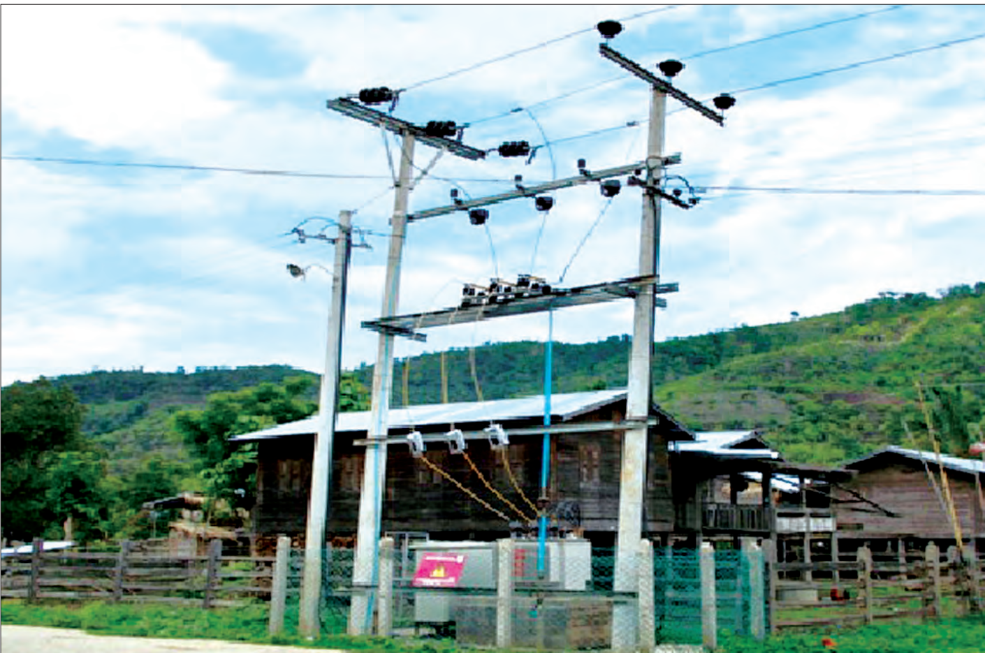
ကယားပြည်နယ်အတွင်း ၁၀ကေစီဓာတ်အားလိုင်း၊ ဝို ၄၀၀ ဓာတ်အားလိုင်း၊ ၁၁/၀ ဒသမ ၄ကေစီ ထရန်စဖော်မာများ တပ်ဆင်ခြင်းလုပ်ငန်း ဆောင်ရွက်ပြီးစီးမှုကို တွေ့ရစဉ်

တစ်နှစ်တာကာလမှာ ရေနံနဲ့သဘာဝ ဓာတ်ငွေ့မြေတွေမှာ တွင်း ၂၉ တွင်း တူးဖော်ခဲ့ပြီး ၁၂ တွင်း အောင်မြင်ခဲ့ ပါတယ်။ ကုန်းပိုင်းနဲ့ ကမ်းလွန်စီမံကိန်း ကနေထွက်လာတဲ့ သဘာဝဓာတ်ငွေ့ကို အရင်က ပြည်တွင်းသုံးအတွက် တစ်ရက်ကို ကုပပေးသန်း ၁၅၀ ကနေ ၂၀၀ အထိ သုံးခဲ့ရာက ၂၀၁၇ ဇန်နဝါရီကနေစပြီး ကုပပေး ၂၃၃ သန်းထိ သုံးစွဲနိုင်ခဲ့ပါတယ်။ လျှပ်စစ်ဓာတ်အားပေးစက်ရုံတွေအတွက် ကုပပေး သန်း ၃၀၊ စက်မှုကဏ္ဍအတွက် ကုပပေး ၃ သန်း စုစုပေါင်း ကုပပေး ၃၃ သန်း ပိုမိုသုံးစွဲနိုင်ခဲ့တဲ့အပြင် ပို့ဆောင်ရေး ကဏ္ဍမှာလည်း အများပြည်သူသုံးခရီးသည် တင်ဖော်တော်ယာဉ် ၁၄၃ စီးကိုလည်း CNG တိုးမြှင့် ဖြန့်ဖြူးပေးနိုင်ခဲ့ပါ တယ်