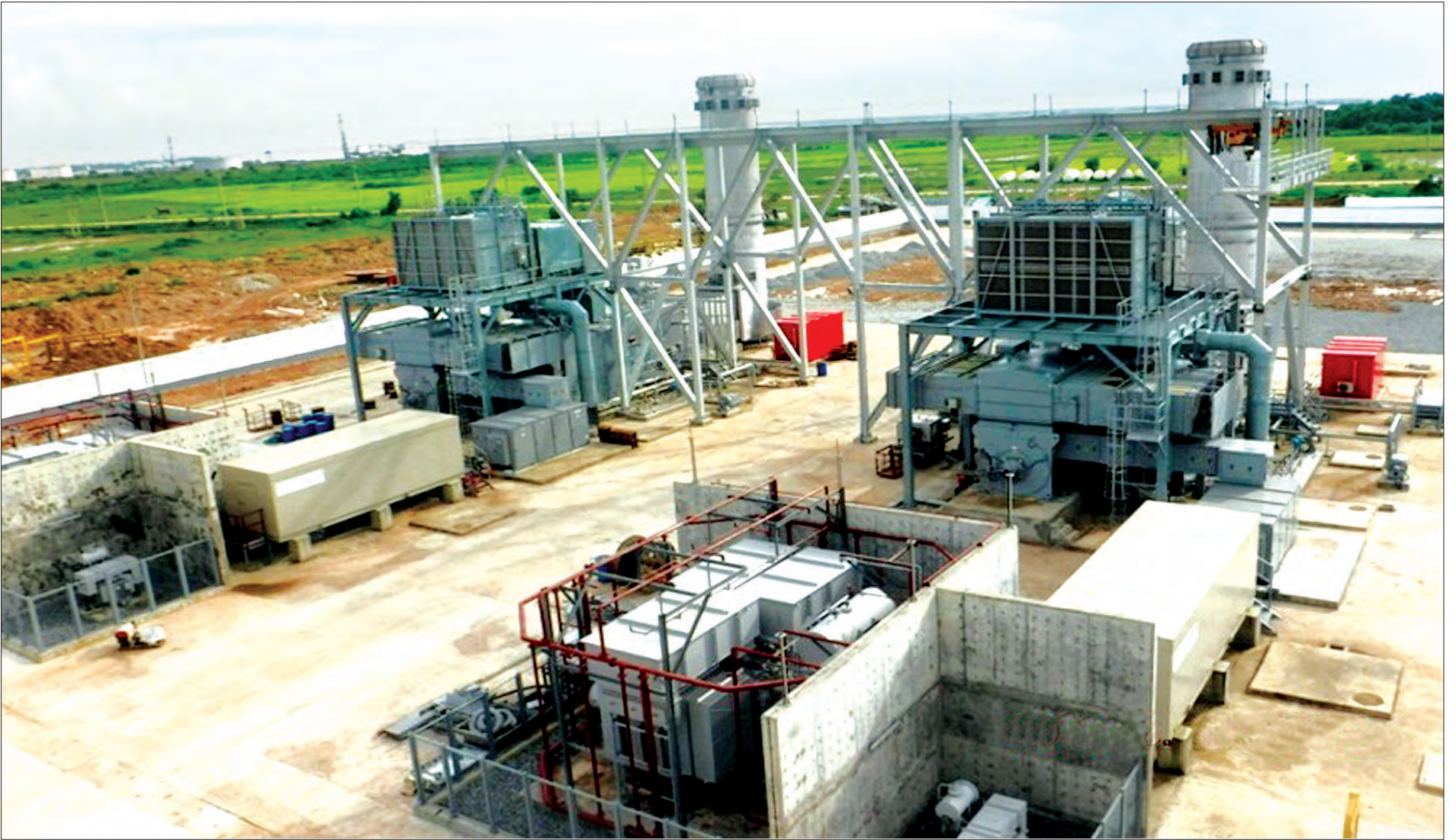
ရန်ကုန်တိုင်းဒေသကြီးအတွင်း သီလဝါ ၅၀ မဂ္ဂါဝပ် သဘာဝဓာတ်ငွေ့သုံး ဓာတ်အားပေးစက်ရုံ ဆောင်ရွက်ပြီးစီးမှုကို တွေ့ရစဉ်

အချုပ်ပိုင်(က)မှ လုပ်ငန်းလိုင်စင်လျှောက်ထားဖို့ အသိပညာပေးခဲ့သလို သက်ဆိုင်ရာ တိုင်းဒေသကြီးနှင့် ပြည်နယ် အစိုးရအဖွဲ့တွေနဲ့ ပူးပေါင်းပြီး ယာယီလိုင်စင် ၁၅၆ ခုအထိ ချထားပေးနိုင်ခဲ့တယ်” ဟု ပြည်ထောင်စုဝန်ကြီးက ရှင်းပြသည်။