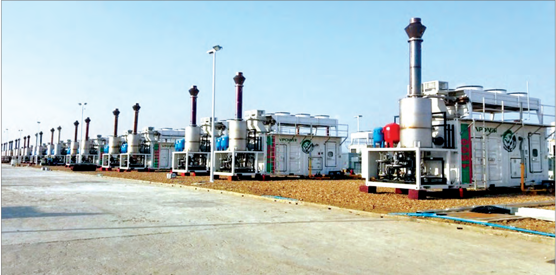
မန္တလေးတိုင်းဒေသကြီးအတွင်း မြင်းခြံ ၁၃၃မဂ္ဂါဝပ် သဘာဝဓာတ်ငွေ့သုံး ဓာတ်အားပေးစက်ရုံအား တွေ့ရစဉ်

လက်ရှိတွင် ရေအားကိုသာ Base Load အဖြစ် ဆောင်ရွက်ကာ ဒုတိယမှာ သဘာဝဓာတ်ငွေ့ဖြင့် ဓာတ်အားထုတ်လုပ်ဖြန့်ဖြူးပေးလျက်ရှိသည်။ ဈေးနှုန်းသက်သာသည့် ရေအား လျှပ်စစ်စီမံကိန်းများ အကောင်အထည်ဖော်ရာတွင် သဘာဝပတ်ဝန်းကျင်ဆိုင်ရာ အခက်အခဲများရှိနေခြင်း၊ တည်ဆောက်ချိန်ကြာမြင့်ခြင်း၊ ရာသီဥတုအခြေအနေအရ ဓာတ်အားလိုအပ်ချက်အပေါ် မူတည်ကာ မောင်းနှင်ရန် အခက်အခဲရှိခြင်း၊ သဘာဝဓာတ်ငွေ့ဖြင့် ဓာတ်အားထုတ်လုပ်ရာတွင် လက်ရှိစက်ရုံများ၏