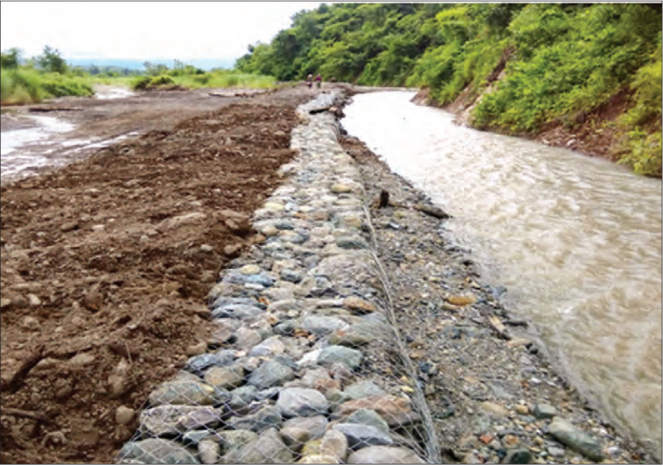
၂၀၁၆-၂၀၁၇ ဘဏ္ဍာရေးနှစ် ပြည်နယ်ရန်ပုံငွေ(ငွေလုံးငွေရင်း) ဖြင့် တီးတိန်မြို့နယ် ဒိုဇန်ကျေးရွာ ပလာတာချောင်းလယ် ရေသွယ်မြောင်း ပြုပြင်ခြင်းလုပ်ငန်းဆောင်ရွက်ပြီးစီးမှုကို တွေ့ရစဉ်

ပြည်နယ်အစိုးရသည် ဒေသနှင့်ကိုက်ညီသော စိုက်ပျိုး မွေးမြူရေးလုပ်ငန်းများ ဖွံ့ဖြိုးလာစေရေး၊ အခြေခံအဆောက် အအုံများ ပိုမိုကောင်းမွန်လာရေး၊ အသေးစားနှင့် အလတ်စား လုပ်ငန်းများ ဖွံ့ဖြိုးတိုးတက်ရေး၊ လူ့စွမ်းအားအရင်းအမြစ်များ ဖွံ့ဖြိုးတိုးတက်ရေး၊ သဘာဝပတ်ဝန်းကျင်ကို စဉ်ဆက်မပြတ် ဖွံ့ဖြိုးတိုးတက်အောင် ဆောင်ရွက်ရေးဟူသည့် မူဝါဒများဖြင့် အချပ်ပို(ဆ)သို့