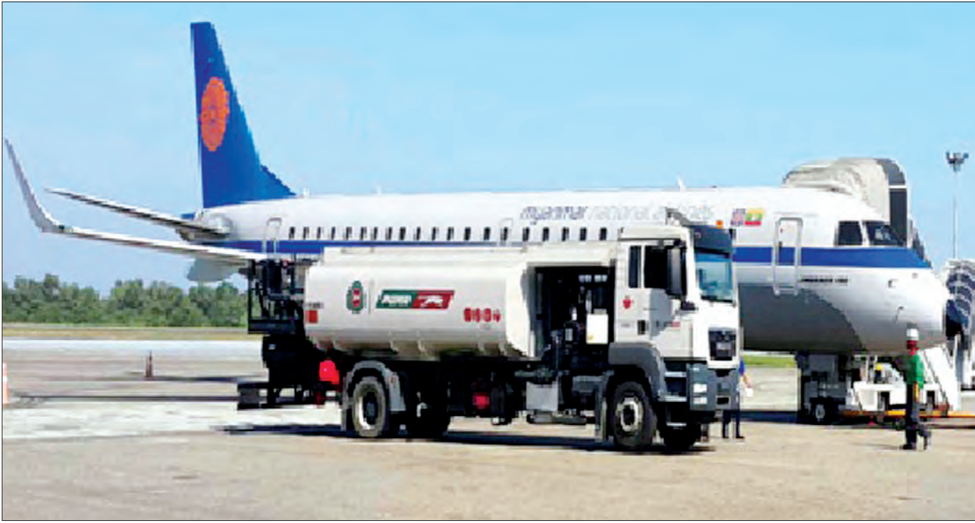
လေယာဉ်ဆီဖြည့်တင်းသည့်ဌာနများအား ဖက်စပ်လုပ်ငန်းပြောင်းလဲဆောင်ရွက်ထားရှိမှုကို တွေ့ရစဉ်

စွမ်းဆောင်ရည်ကျဆင်းလာခြင်း၊ ပုဂ္ဂလိကဓာတ်အား ထုတ်လုပ်သူများထံမှ ဓာတ်အားဝယ်ယူဖြန့်ဖြူးသဖြင့် နိုင်ငံတော်မှ ပိုမိုအရှုံးခံရခြင်း၊ Energymix တွင် တစ်ခုအပါအဝင် ဖြစ်သော ကျောက်မီးသွေးအား ပြည်သူများ၏ သဘောဆန္ဒအရ အကောင်အထည်ဖော် ဆောင်ရွက်နိုင်မှုမရှိသေးခြင်း၊ နှစ်ပေါင်းများစွာ တည်ဆောက်ထားခဲ့သော ဓာတ်အားလိုင်းနှင့်ခွဲရုံများ အဆင့်မြှင့်တင်ရန် ဘဏ္ဍာငွေလိုအပ်နေခြင်း၊ Energymix ကို ယခင်ရေးဆွဲခဲ့ဖူးသော Long Term Energy Master Plan အတိုင်း လက်ရှိအခြေအနေအရ အကောင်အထည်ဖော်ရန် အခက်အခဲရှိနေခြင်း စသည့် စိန်ခေါ်မှုများကိုလည်း ကြုံတွေ့ခဲ့ရကြောင်း ပြည်ထောင်စုဝန်ကြီးက ပြောသည်။