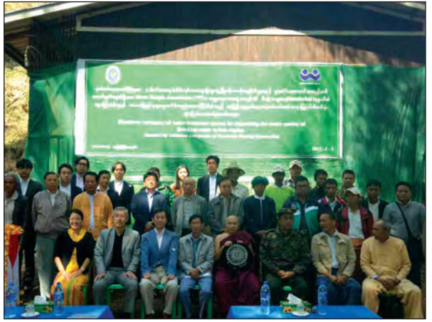
ရေသန့်စက်ဖွင့်ပွဲကျင်းပစဉ်

ရေပြန်ရေထွက်မှ ဖြန့်ဝေလျက်ရှိသောရေသည် သောက်သုံးနိုင်သောအဆင့်ရှိသော်လည်း ကတ်ဒီမီယမ်ဓာတ် မြင့်မားခြင်းနှင့် ရေစေးရေသွက်များ နေခြင်းကြောင့် ရေရှည်တွင် ကျန်းမာရေးနှင့်ညီညွတ်သော သောက်သုံးရေရရှိရေးအတွက် ရေသန့်စက် တပ်ဆင်အသုံးပြုရန်လည်း လိုအပ်လာသည်။ သို့ဖြစ်၍ TPA ၏ အစီအစဉ်ဖြင့် ဆက်လက်အကောင်အထည်ဖော် ဆောင်ရွက်ခဲ့ရာတွင် Shunkokai ကုမ္ပဏီမှ မြန်မာနိုင်ငံအဖွဲ့ဝင်များက ရေသန့်စက် (WTP 240 Hitachi Aqua-Tech Water Treatment System) တန်ဖိုးအားဖြင့် အမေရိကန်ဒေါ်လာ ၃၂၀၀ ကို ပေးလှူခဲ့သည်။ ဒေသခံပြည်သူများက ရေသန့်စက်ထားရှိရန် အဆောက်အအုံနှင့် ရေသန့်သိုလှောင်ရန် ရေတိုင်ကီနှစ်လုံးကို ဆောက်လုပ်လှူဒါန်းခဲ့သည်။