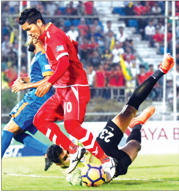
လွဲချော်ခဲ့သလို ကျော်ကိုကို၏ အပိုင်ခေါင်းတိုက်ဂိုးသွင်းမှုနှစ်ကြိမ်မှာလည်း ဂိုးမရခဲ့ပေ။ ပြိုင်ဘက်အသင်း အိန္ဒိယအသင်း အနိုင်ဂိုးရခဲ့ပြီး တန်ပြန်တိုက်စစ်မှ အသင်းခေါင်းဆောင် ချီသရီက သွင်းယူခဲ့ခြင်းဖြစ်သည်။ မြန်မာအသင်းသည် ဒုတိယပွဲအဖြစ် ဇွန် ၁၃ ရက်တွင် မကာအိုအသင်းနှင့် အဝေးကွင်းကစားရမည်ဖြစ်သည်။ သတင်း-ညိုမြတ်သော်တာ၊ ဓာတ်ပုံ-စိုးညွန့်