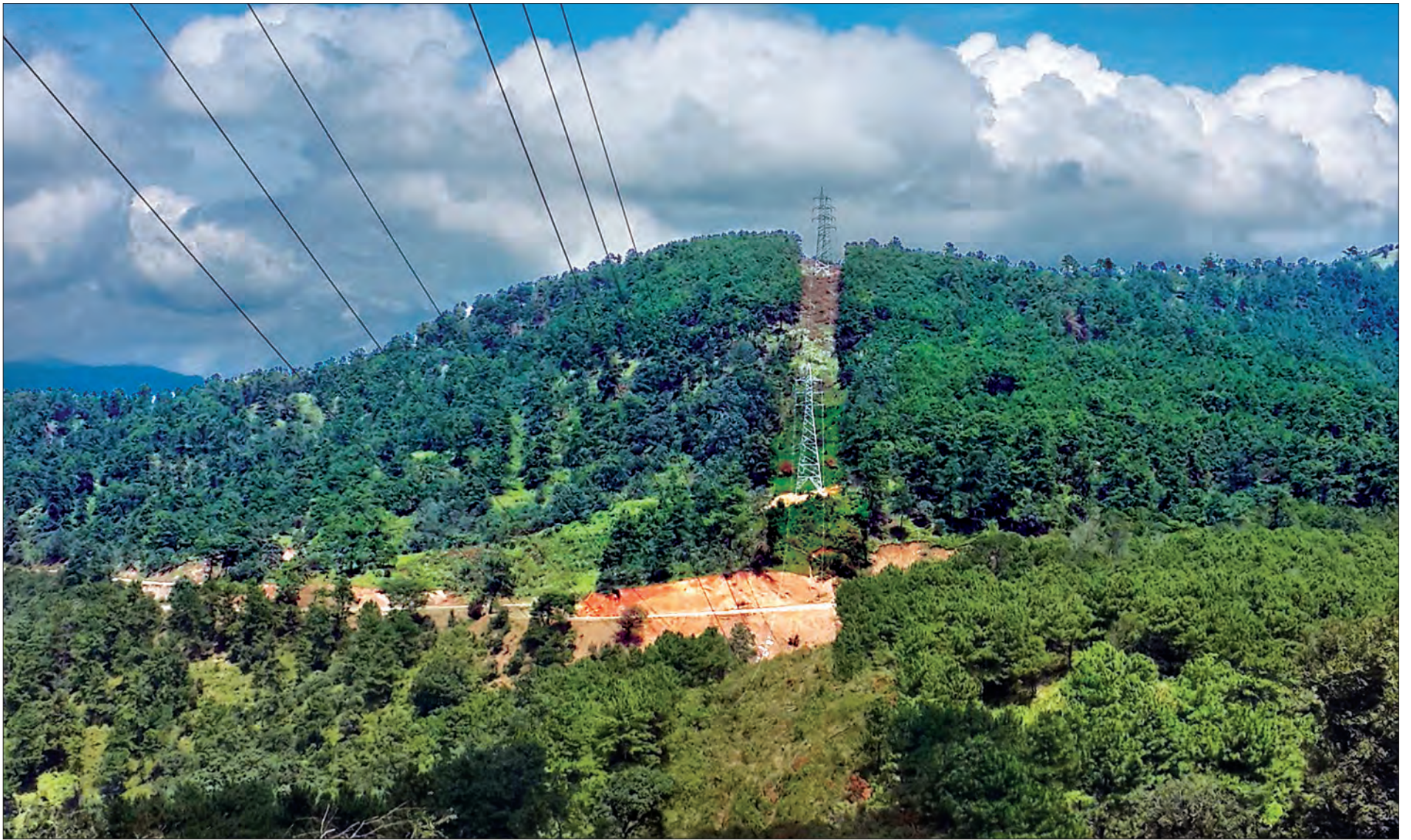
ဟားခါး-ဗလမ်း ၆၆ ကေဗီ ဓာတ်အားလိုင်း ၂၅ မိုင် တည်ဆောက်ပြီးစီးမှုကို တွေ့ရစဉ်