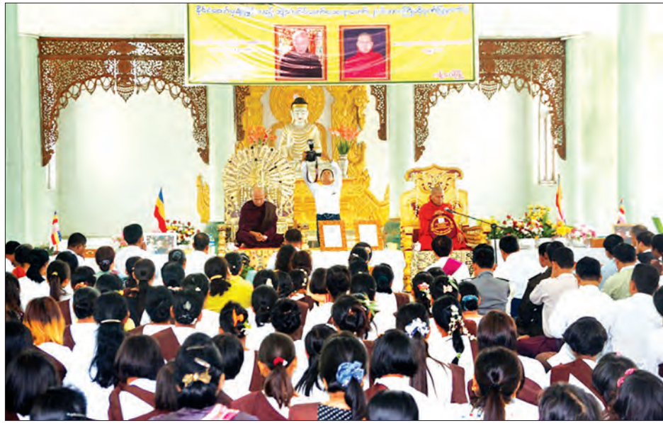
နိုင်ငံတော်က ချီးမြှင့်ဆက်ကပ်သည့် ဗဟုသုတဗဟိုဌာနမှ ဝန်ထမ်းများနှင့် အမျိုးသားလွှတ်တော် ဒုတိယဥက္ကဋ္ဌ ဦးအေးသာအောင်တို့က ဝန်ထမ်းများနှင့် တွေ့ဆုံစဉ် ဘုန်းကြီးကျောင်းဆရာတော် ဘဒ္ဒန္တ ကဝိဓဇနှင့် ကမ္ဘာ့ဓမ္မစာပေ ဝန်ထမ်းများနှင့် တွေ့ဆုံစဉ် ကျောက်ဂူဆရာတော် ဘဒ္ဒန္တ ဣန္ဒာစရိယတို့အား ပင့်ဆောင်ချီးကျူးဂုဏ်ပြုပွဲကို ဝန်ထမ်းမြို့သားသနာ့ပိမာန်တော်၌ မတ် ၂၈ ရက်က ကျင်းပစဉ် (ခရိုင် ပြန်/ဆက်)