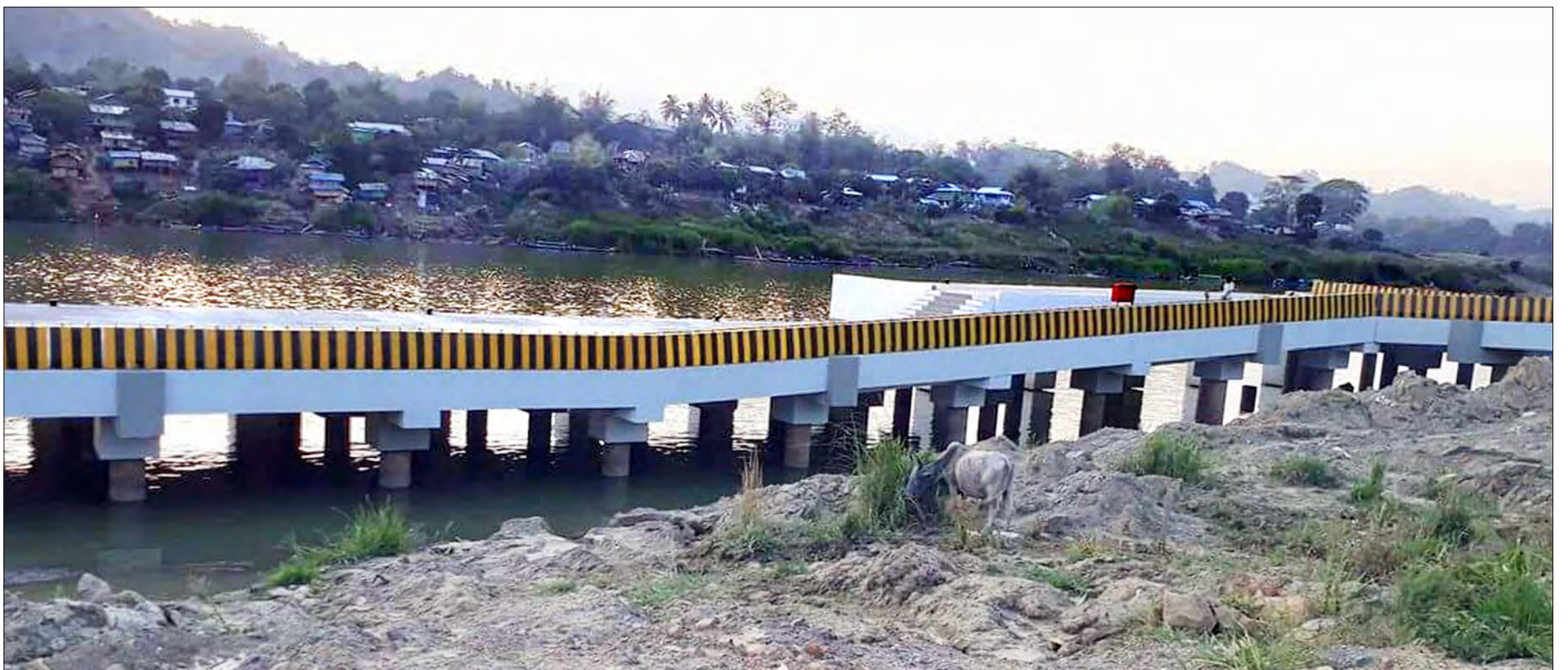
ချင်းပြည်နယ် ပလက်ဝဆိပ်ခံတံတားတည်ဆောက်ပြီးစီးမှုကို တွေ့ရစဉ်