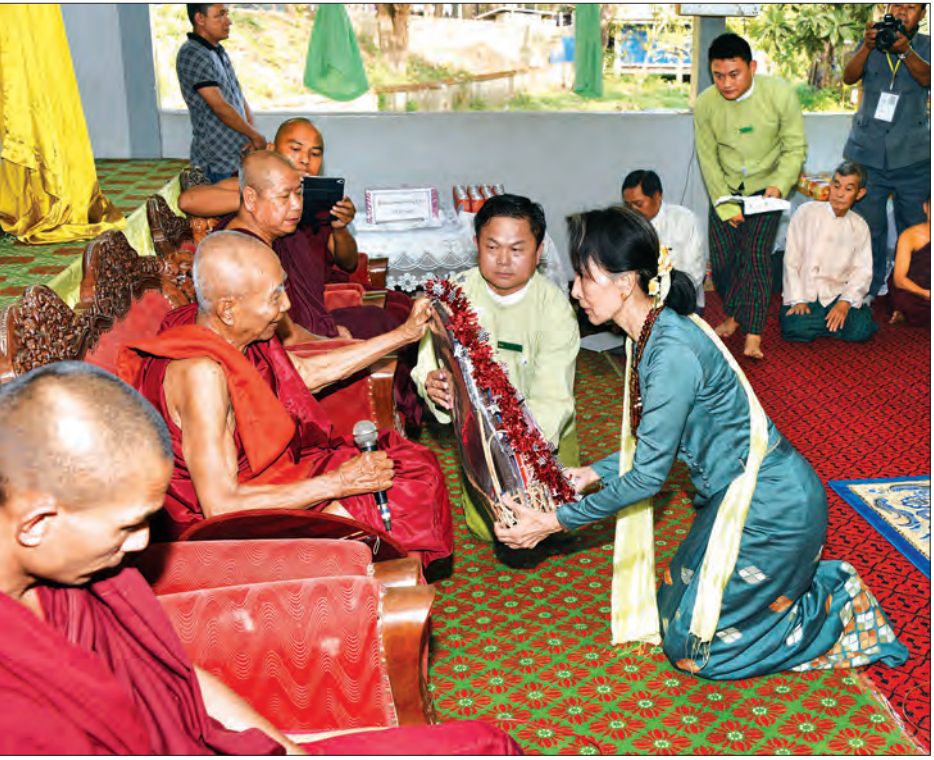
နိုင်ငံတော်၏ အတိုင်ပင်ခံပုဂ္ဂိုလ် ဒေါ်အောင်ဆန်းစုကြည် မြစ်ကြီးနားမြို့ ကျွန်းပင်သာရပ်ကွက်ရှိ ပြည်လုံးချမ်းသာ လူငယ်ဖွံ့ဖြိုးရေး ပရဟိတကျောင်းတိုက်၌ ဆရာတော်အား လှူဖွယ်ပစ္စည်းများ ဆက်ကပ်လှူဒါန်းစဉ်

အခြေအနေကို ကြည့်ပြီးတော့ ဘယ်လိုကောင်းအောင် လုပ်သွားမလဲဆိုတဲ့ အဖြေကို ရှာတာပါ။ တကယ်အဓိက ကျတဲ့အဖြေက ကျွန်မတို့ ငြိမ်းချမ်းရေးရဖို့ပါပဲ။ ငြိမ်းချမ်းရေးရမှ ဒီလို IDP စခန်းတွေအားလုံးကို ကျွန်မတို့ ပိတ်လိုက်နိုင်မှာ ဖြစ်ပါတယ်။ ကျွန်မတို့ရဲ့ ပြည်သူ့ပြည်သားများ ကိုယ့်ရပ်ကိုယ်ရွာမှာ အေးအေးချမ်းချမ်းနေနိုင်မှာ ဖြစ်ပါတယ်။ အဲဒီတော့ မရင်ကလေးမှာ စောစောက ကျွန်မပြောတဲ့အတိုင်းပဲ ပညာရေးကို တော့ ကျွန်မတို့ အဓိကထားချင်ပါတယ်။ ဒီတော့ ကျွန်မတို့ရဲ့ IDP Camp တွေ အားလုံးဟာ ပညာရေးကို ပြည်နယ်ဝန်ကြီးချုပ်အနေနဲ့ အဓိကထားပြီးတော့ ဘယ်နေရာမှာ ကျောင်းနေအရွယ်ကလေး ဘယ်နေရာမှာ ရှိလဲ။ ဒီကလေးတွေဟာ ပညာသင်ကြားဖို့ အခွင့်အရေး ရသင့်လားဆိုတာ ကြည့်ရမှာဖြစ်ပါတယ်။ ဒါက ရေရှည်အတွက် ဖြစ်ပါတယ်။ နောက်ပြီးတော့ ကျန်းမာရေးဆိုတာ ကလည်း ရေရှည်အတွက်ပါ။ ငယ်ငယ်တုန်းက ကျန်းမာရေးကောင်းမှ အသက်ကြီးလာတဲ့အခါကျရင်လည်း ကျန်းမာရေးကောင်းမှာ ဖြစ်ပါတယ်။