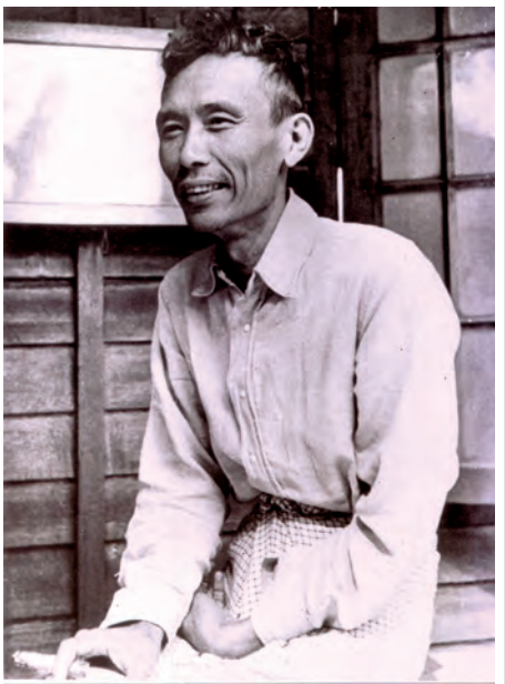
အလင်္ကာကျော်စွာ ဆရာမြို့မြင်ခြင်း

“နေပြည်တော် အသံထွက်ရပ်ရှင်ရိုင်ရှင်ကြီး ဦးဘယ်သူ၊ အသက်ဘယ်နှနှစ်”ဟော...တွဲရက်ဂူကသူ့ခန်းတဲ့”ဟယ်... ဒါကဂူအသစ်၊ အသက်ငယ်ငယ်လေး”ဟောဒီဂူတွေက မိသားစုလေ”စသည်ဖြင့် သည်နေရာမှာပြောနေကျ စကားတွေ ပြောဖြစ်ကြသည်။ တစ်ခါတစ်ရံ ကျွန်တော်တို့သည် လမ်းကလေးဖွဲ့ထွက်ဝင်သွားရသော နေရာမှအုတ်ဂူလေး တစ်လုံးဆီကိုလည်း သွားကြသေး၏။ ဂူကလေးဒီဇိုင်းကမရှိ။ သို့သော် မဆန်း။ ထိုထက်စိတ်ဝင်စားမိသည်က ဂူကလေး ထိပ်မှာ ကပ်ထားသော ကျောက်ပြားထက်က ဝီတသင်္ကေတ များ။ သီချင်းစာသားများ။