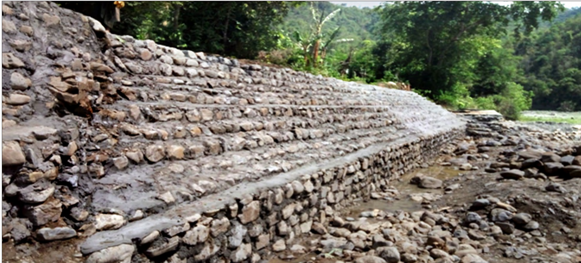
၂၀၁၆-၂၀၁၇ ဘဏ္ဍာရေးနှစ် ပြည်နယ်ရန်ပုံငွေ(ငွေလုံးငွေရင်း)ဖြင့် မင်းတပ်မြို့နယ် ထင်ချောင်းကျေးရွာ ဆည်ရေသွယ်မြောင်း မြေထိန်းနံရံ ပြုပြင်တည်ဆောက်ပြီးစီးမှုကို တွေ့ရစဉ်