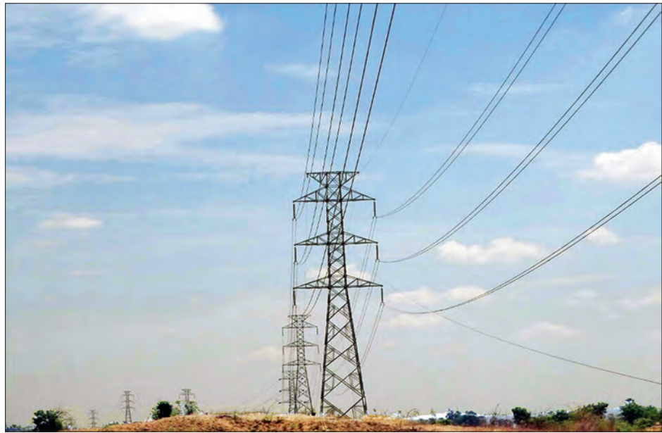
၂၃၀ကေဗွီ တောင်တွင်းကြီး- ရွှေတောင် ဓာတ်အားလိုင်း တည်ဆောက်ခြင်းလုပ်ငန်း ဆောင်ရွက်ပြီးစီးမှုကို တွေ့ရစဉ်

တစ်နှစ်တာအတွင်းမှာ လျှပ်စစ်နှင့်စွမ်းအင်ကဏ္ဍ ဖွံ့ဖြိုးတိုးတက်ရေး လုပ်ဆောင်ချက်တွေက အများကြီးရှိပေမယ့် ပြည်သူလူထု အပြည့်အဝကျေနပ်မှုရရှိမယလို့ မမျှော်လင့်ပါဘူး။ ဒါပေမယ့် ပြည်သူတွေကို ဝန်ဆောင်မှုပေးရတဲ့ ဝန်ထမ်းတွေပီပီ ကိုယ်နဲ့သက်ဆိုင်တဲ့ ကဏ္ဍအပေါ်မှာ ဆက်လက်ကြိုးပမ်းဆောင်ရွက်သွားမှာဖြစ်ပါတယ်”ဟု လျှပ်စစ် နှင့် စွမ်းအင်ဝန်ကြီးဌာန ပြည်ထောင်စုဝန်ကြီး ဦးဖေထွန်းက ပြောကြားခဲ့ပါသည်။