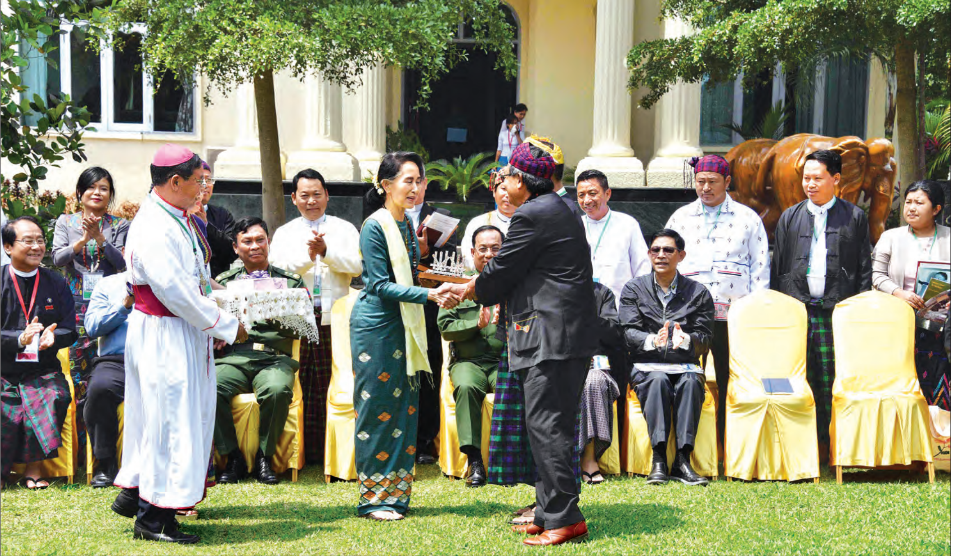
နိုင်ငံတော်၏ အတိုင်ပင်ခံပုဂ္ဂိုလ် ဒေါ်အောင်ဆန်းစုကြည် ကချင်လူထုအဖွဲ့အစည်းခေါင်းဆောင်တစ်ဦးအား ရင်းရင်းနှီးနှီးနှုတ်ဆက်စဉ်