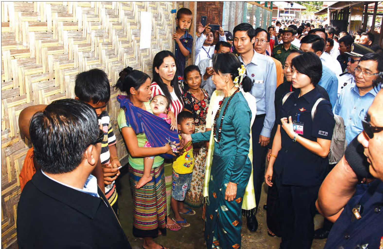
နိုင်ငံတော်၏အတိုင်ပင်ခံပုဂ္ဂိုလ် ဒေါ်အောင်ဆန်းစုကြည် ခတ်ချိုတိုက်ပွဲရှောင်စခန်း၌ နေရပ်စွန့်ခွာသူများအား တွေ့ဆုံအေးပေးစကားပြောကြားစဉ်

အကြောင်းမရှိပါကြောင်း၊ ယခင်က ဖက်ဒရယ်ဟုဆိုလျှင် ရှောင်ရှားလေ့ရှိပါ ကြောင်း၊ ဖက်ဒရယ်ဆိုသည်ကို အဓိပ္ပာယ် ဖွင့်ဆိုရန် လိုအပ်ပါကြောင်း၊ ဖက်ဒရယ် သည် ခွဲထွက်ရန်မဟုတ်ကြောင်း၊ ကမ္ဘာ ပေါ်တွင် ဖက်ဒရယ်ပြည်ထောင်စုနိုင်ငံ အများအပြား ရှိပါကြောင်း၊ မိမိတို့အနေ ဖြင့် ဖက်ဒရယ်ပြည်ထောင်စုတည်