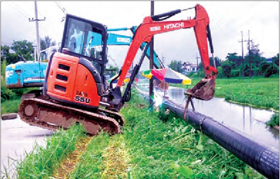
ရန်ကုန်တိုင်းဒေသကြီးနှင့် မကွေးတိုင်းဒေသကြီးအတွင်းရှိ သဘာဝဓာတ်ငွေ့ပိုက်လိုင်းများ အစားထိုးလဲလှယ် ဆက်သွယ်ခြင်း စီမံကိန်းလုပ်ငန်း ဆောင်ရွက်နေစဉ်