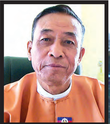
ချင်းပြည်နယ်ဝန်ကြီးချုပ် ဦးဆလင်းလျန်လွယ်