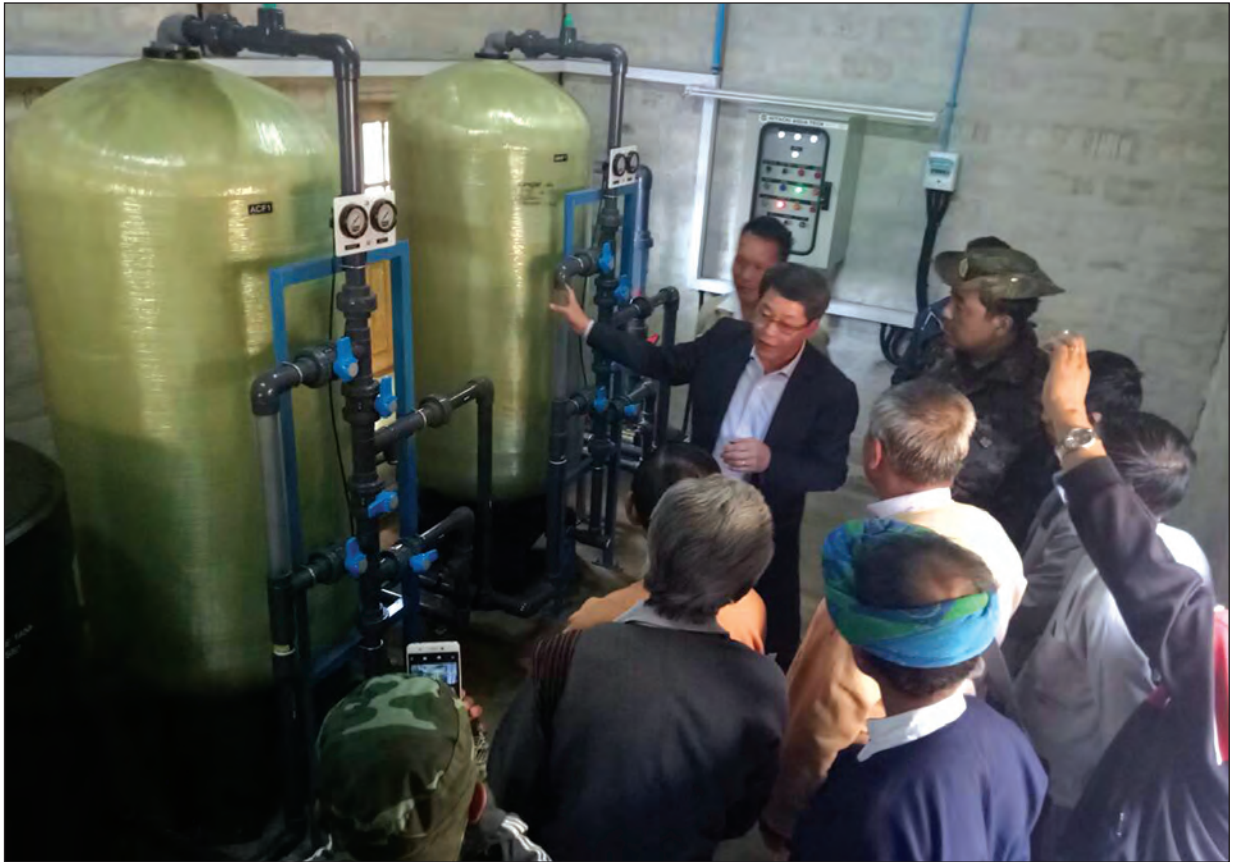
တပ်ဆင်ထားပြီးသော ရေသန့်စက်ကို တာဝန်ရှိသူများ ကြည့်ရှုစစ်ဆေးစဉ်

ထိုသို့ဆောင်ရွက်ရာတွင် ဒေသဖွံ့ဖြိုးရေးနှင့်ပတ်သက်၍ ဒေသအတွင်းရှိ လူနေမှု