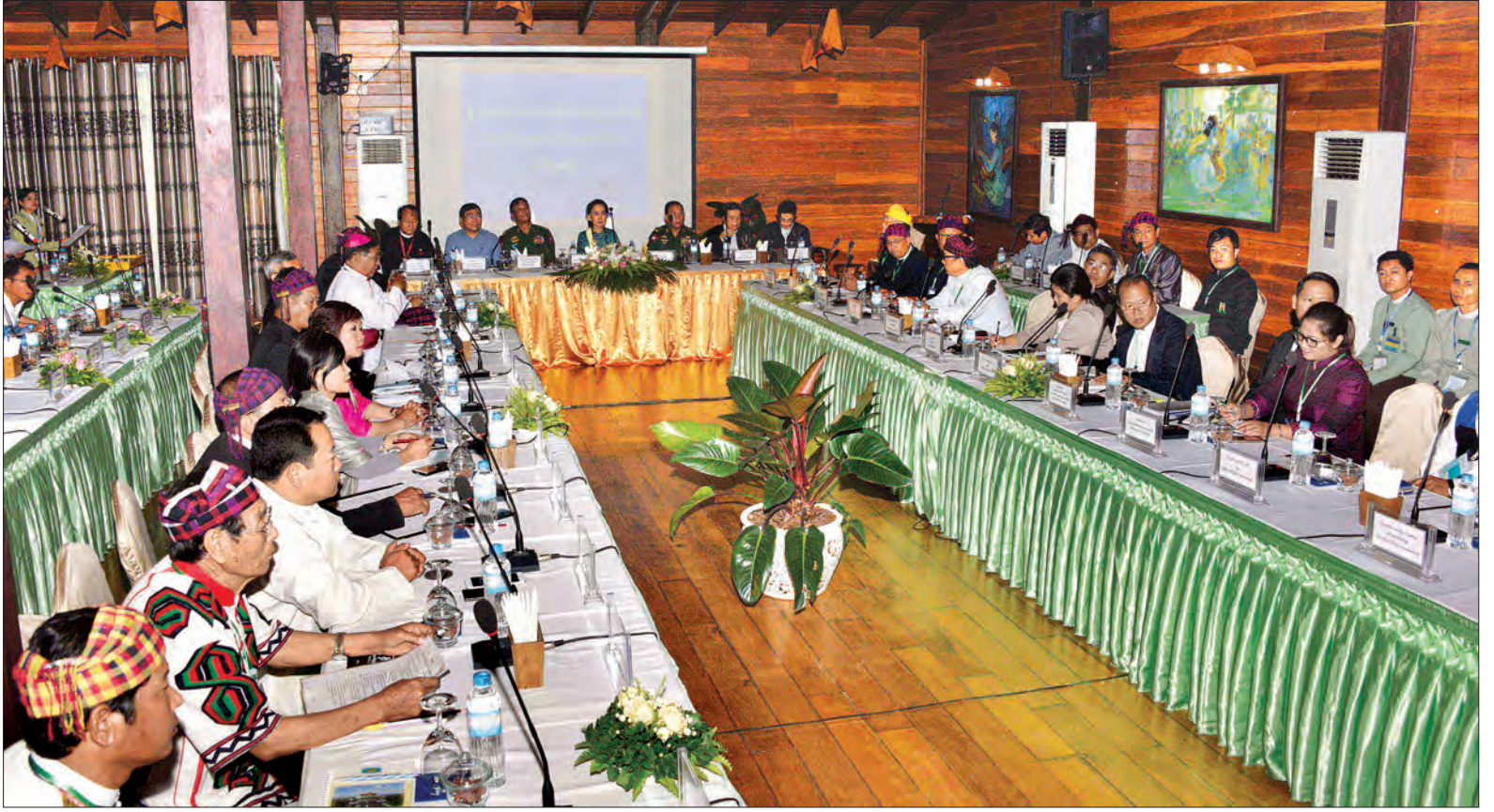
နိုင်ငံတော်၏အတိုင်ပင်ခံပုဂ္ဂိုလ် ဒေါ်အောင်ဆန်းစုကြည် ကချင်လူထုအဖွဲ့အစည်းခေါင်းဆောင်များနှင့် တွေ့ဆုံဆွေးနွေးစဉ်

အမှန်တကယ်ဆန္ဒရှိလျှင် ငြိမ်းချမ်း ရေး ကြိုးပမ်းမှု မအောင်မြင်စရာ