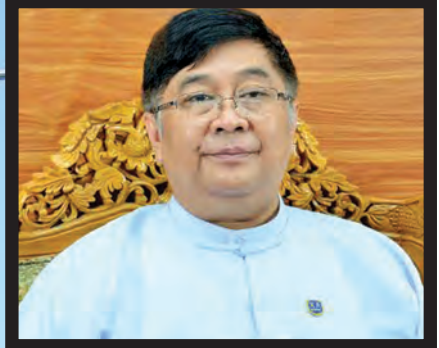
လျှပ်စစ်နှင့် စွမ်းအင်ဝန်ကြီးဌာန ပြည်ထောင်စုဝန်ကြီး ဦးဖေဇင်ထွန်း

ပြည်သူက တစ်ခဲနက်ရွေးချယ်တင်မြောက်ခဲ့သော ပြည်သူ့အစိုးရသစ်၏ သက်တမ်းတစ်နှစ်ပြည့်မြောက်ခဲ့ပြီဖြစ်သည်။ တစ်နှစ်တာကာလအတွင်း နိုင်ငံ၏ နိုင်ငံရေး၊ စီးပွားရေး၊ လူမှုရေးနယ်ပယ်အသီးသီးတွင် ဖွံ့ဖြိုးတိုးတက်မှုရရှိစေရန် ပြုပြင်ပြောင်းလဲမှုများပြုလုပ်ကာ နိုင်ငံတည်ဆောက်ရေးလုပ်ငန်းများကို အားကြီးမာန်တက်ဆောင်ရွက်ခဲ့သည့် ပြည်သူ့အစိုးရ၏ ပြည်သူ့အတွက် ကြိုးပမ်းဆောင်ရွက်မှုများမှာ အားလုံးကောင်းမွန်အောင်မြင်ပါသည်ဟူ၍ မဆိုနိုင်သေးသည့်တိုင် သိသာထင်ရှားစွာမြင်တွေ့နိုင်သည့် အောင်မြင်မှုများ၊ မမြင်တွေ့နိုင်သည့် အောင်မြင်မှုများ၊ စိန်ခေါ်မှုများနှင့် ရုန်းကန်နေရဆဲလုပ်ငန်းစဉ်များဟူ၍ တွေ့ရမည်ဖြစ်သည်။ နိုင်ငံတော်အစိုးရ၏ ပထမတစ်နှစ်တာကာလအတွင်း ပြည်သူများအတွက် ကြိုးပမ်းဆောင်ရွက်မှုများကို ဝန်ကြီးဌာနများ၊ ပြည်ထောင်စုအဆင့်အဖွဲ့အစည်းများ၊ တိုင်းဒေသကြီးနှင့် ပြည်နယ်များအလိုက် မှတ်တမ်းပြုတင်ပြအပ်ပါကြောင်း။