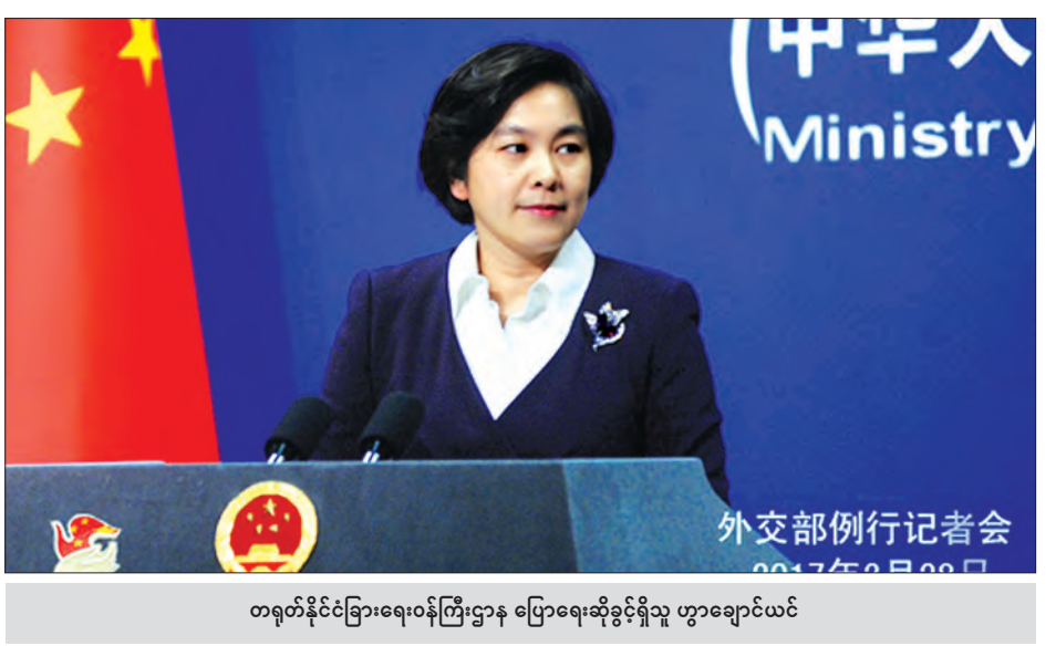
တရုတ်နိုင်ငံခြားရေးဝန်ကြီးဌာန ပြောရေးဆိုခွင့်ရှိသူ ဟွာချောင်ယင်

တရုတ်နိုင်ငံသည် ဖိလစ်ပိုင်နိုင်ငံ နှင့်အတူ တည်ငြိမ်အေးချမ်းသည့် ဆက်ဆံရေး ဖွံ့ဖြိုးတိုးတက်စေရန် သာမက အကျိုးအမြတ်ရရှိနိုင်မည့် ပူးပေါင်းဆောင်ရွက်မှုအတွက် အလား အလာကောင်းသည့် အခြေအနေတစ်ရပ် ကို ဖန်တီးနိုင်ရန် ရေကြောင်းသွားလာမှု ဆိုင်ရာ ပူးပေါင်းဆောင်ရွက်မှုများကို တိုးမြှင့်ရန်နှင့် မတူကွဲပြားမှုများကို သင့်တင့်မျှတအောင် စီမံထိန်းချုပ် ဆောင်ရွက်သွားရန်စိတ်အားထက်သန် လျက်ရှိနေကြောင်း ဟွာကပြောကြား ခဲ့သည်။ တရုတ်နိုင်ငံသည် ဖိလစ်ပိုင်ကမ်းခြေ စောင့်တပ်ဖွဲ့ (PCG) ကိုယ်စားလှယ် များကိုလည်း တရုတ်နိုင်ငံသို့ စောစီး