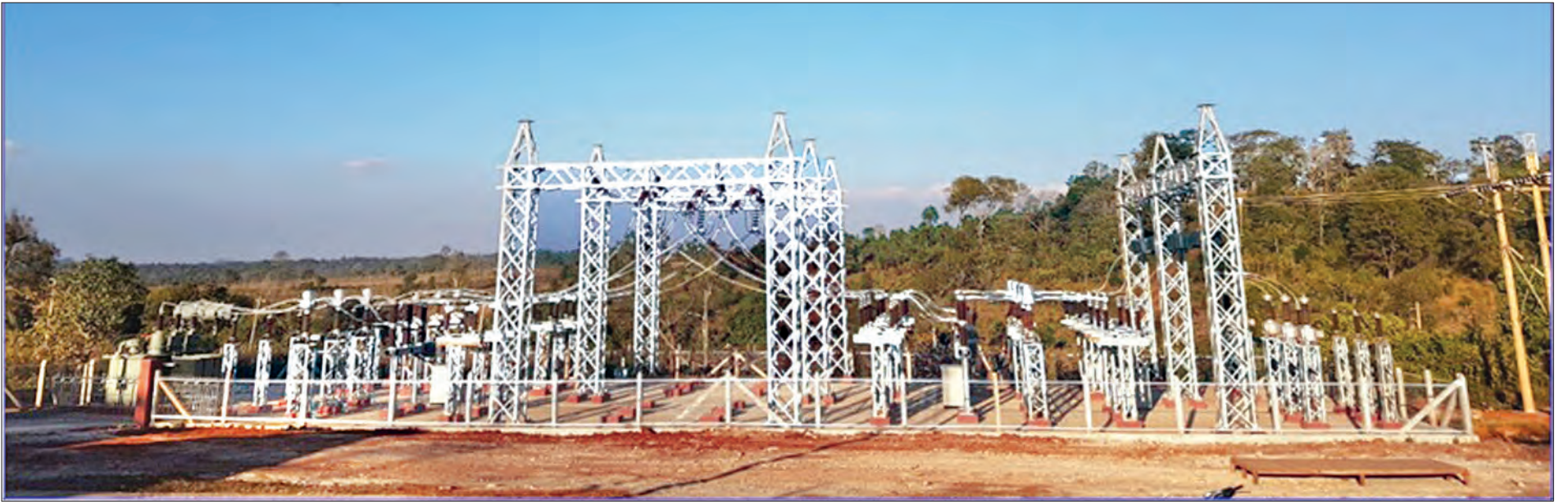
ရမ်းပြည်နယ် ၆၆/၁၁ကေဗွီ၊ ၅အမ်ဗွီအေ ကျေးသီး ဓာတ်အားခွဲရုံ တည်ဆောက်ခြင်းလုပ်ငန်း ဆောင်ရွက်ပြီးစီးမှုကို တွေ့ရစဉ်