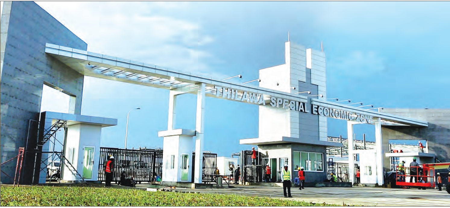
ပဲခူး- သီလဝါ အဝေးပြေးလမ်းမကြီးအတွက် အားထားရမည့် သီလဝါအထူးစီးပွားရေးဇုန်

ဆဲလ်ဖီရိုက်နေသည့် မိန်းကလေးနှစ်ဦး လေယာဉ်တိုက်မိပြီး သေဆုံး