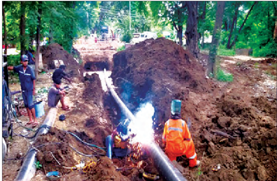
ရန်ကင်းတိုင်းဒေသကြီးနှင့် မကွေးတိုင်းဒေသကြီးအတွင်းရှိ သဘာဝဓာတ်ငွေ့ ပိုက်လိုင်းများ အစားထိုးလဲလှယ် ဆက်သွယ်ခြင်း လုပ်ငန်း ဆောင်ရွက်နေစဉ်