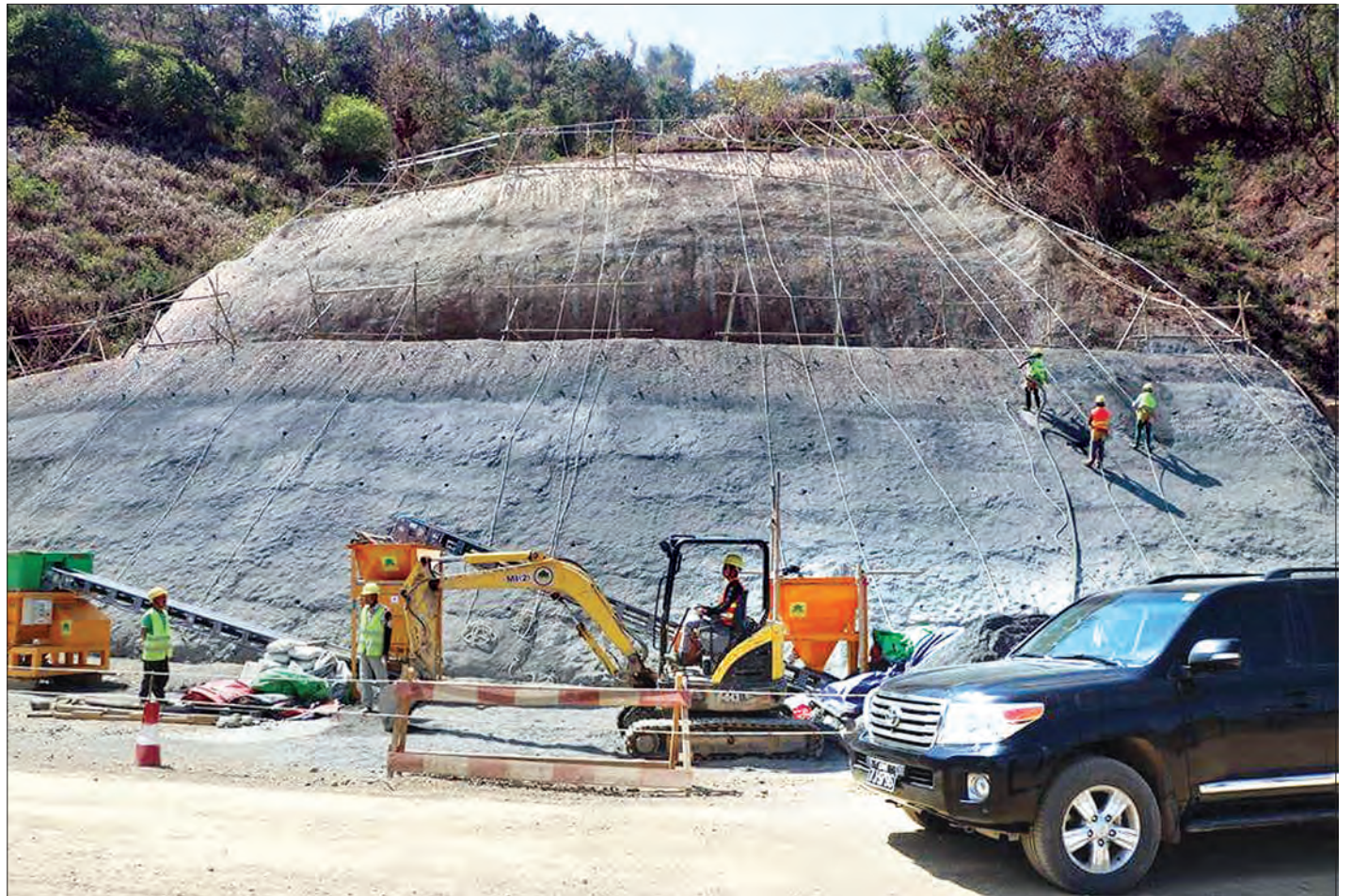
ချင်းပြည်နယ်ရှိ လမ်းမများအား ကောင်းမွန်စေရန် JICA အဖွဲ့က စက်ယန္တရားများဖြင့် ပူးပေါင်းဆောင်ရွက်ပေးစဉ်

ကုန်းမြင့်လယ်ယာများ တိုးတက်ဖော်ထုတ်ရန်နှင့် အော်ဂဲနစ်စိုက်ပျိုးရေးအပါအဝင် ဝင်ငွေရသီးနှံများ တိုးမြှင့် စိုက်ပျိုးထုတ်လုပ်ရန်၊ ဒေသနှင့်ကိုက်ညီသော မွေးမြူရေးလုပ်ငန်း များ ပိုမိုဖွံ့ဖြိုးတိုးတက်လာအောင် ကြိုးပမ်းဆောင်ရွက်ရန်၊ ပြည်နယ်အတွင်း၊ ပြည်နယ်အတွင်းနှင့်အပြင် လမ်းပန်း ဆက်သွယ်ရေး ပိုမိုကောင်းမွန်နိုင်ရေးဆောင်ရွက်ရန်၊ အိမ်တွင် တစ်နိုင်တစ်ပိုင်နှင့် အသေးစား၊ အလတ်စား လုပ်ငန်းများ ဖွံ့ဖြိုးတိုးတက်ရေးအားပေးမြှင့်တင်ဆောင်ရွက် ရန်၊ လျှပ်စစ်ဓာတ်အား ပိုမိုရရှိရေး ဆောင်ရွက်ရန်၊ သဘာဝ အခြေခံ ခရီးသွားလုပ်ငန်း ပိုမိုဖွံ့ဖြိုး တိုးတက်ရေး ဆောင်ရွက် ရန်၊ မြို့ပြဖွံ့ဖြိုးစည်ပင်သာယာရေးလုပ်ငန်းများ ပိုမိုမြှင့် တင်ဆောင်ရွက်ရန်၊ လူ့စွမ်းအားအရင်းအမြစ်ဖွံ့ဖြိုးတိုးတက် ရေးကို မြှင့်တင်ဆောင်ရွက်ရန်၊ ပညာရေး၊ ကျန်းမာရေး နှင့် အခြားဝန်ဆောင်မှုလုပ်ငန်းများ တိုးမြှင့်ဆောင်ရွက် ရန် ပြည်သူများ အလုပ်လက်မဲ့လျော့နည်းပြီး ဆင်းရဲမှု အချပ်ပို(၉)သို့