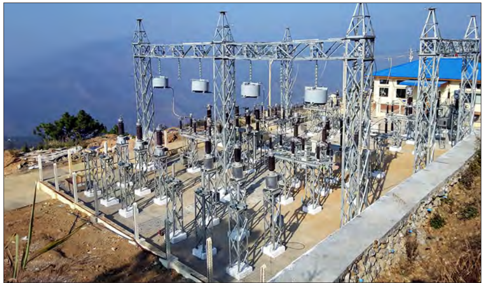
ဗလမ်းမြို့၌ ၆၆/၁၁ ကေဗီ ၅ အမ်ပီအေ ဓာတ်အားခွဲရုံကို တွေ့ရစဉ်