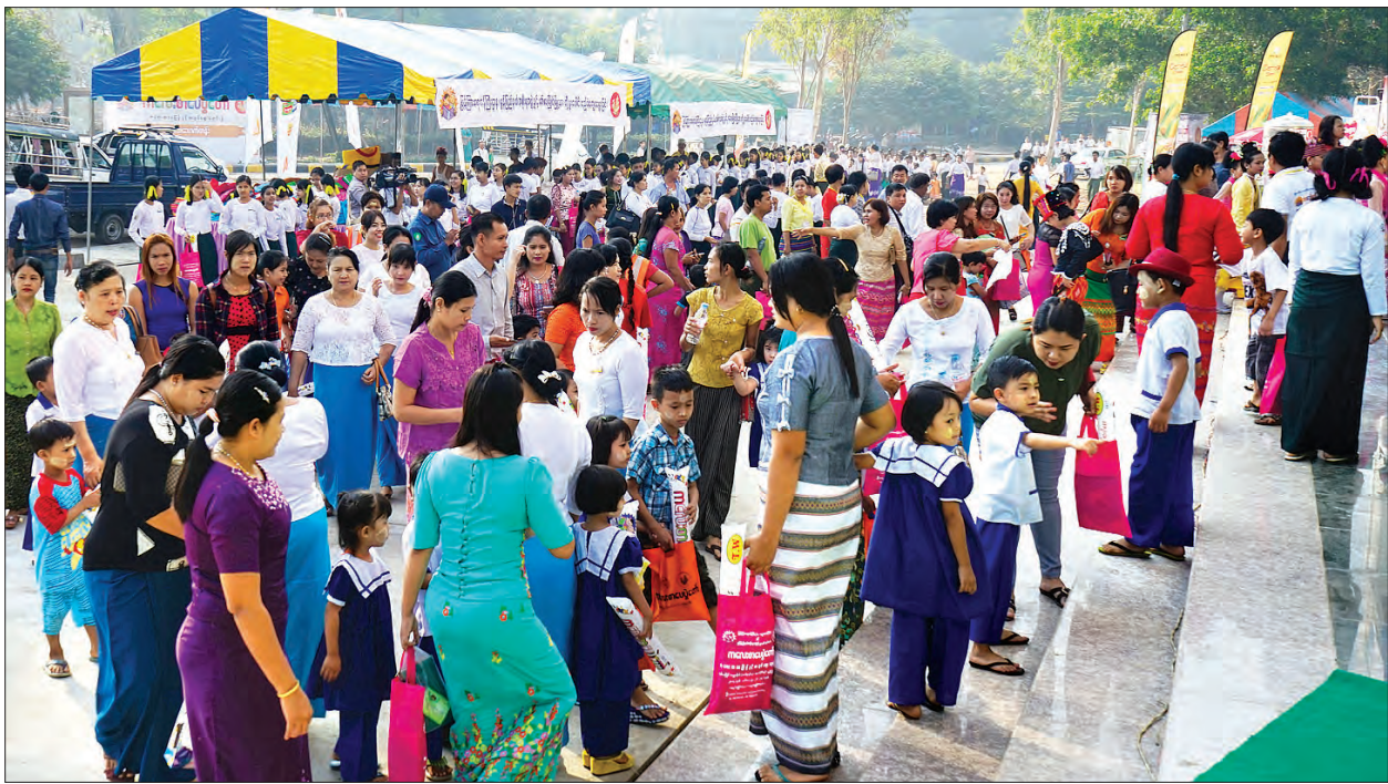
ကလေးစာပေပွဲတော်၊ ကလေးစာပေပြပွဲနှင့် စာအုပ်ဈေးရောင်းပွဲတော်(ဒုတိယ)နေ့ စည်ကားသိုက်မြိုက်စွာကျင်းပ (ဓာတ်ပုံ-အောင်မင်းဟန်)

မွန်ပြည်နယ်ရှိ အခြေခံကျောင်း များနှင့် ဓမ္မစကားလုံး ကျောင်းသား ကျောင်းသူများက ဖျော်ဖြေတင်ဆက် ကပြကြသည်။ ထို့နောက် မူကြိုအဆင့် ကလေး ကိုးဦးနှင့် အခြေခံပညာ မူလတန်းအဆင့်၌ မူလတန်းကျောင်း သား ကျောင်းသူ ၄၀ တို့က ပုံပြောပြိုင်ပွဲ ဝင်ရောက်ယှဉ်ပြိုင်ကြသည်။ ဆက်လက် ၍ အခြေခံပညာ ကျောင်းများမှ မူလတန်း ကျောင်းသား ကျောင်းသူ ၃၀ တို့က (၃၀) ဖြာ မင်္ဂလာသုတ်ရွတ်ဆိုပြိုင်ပွဲတွင်