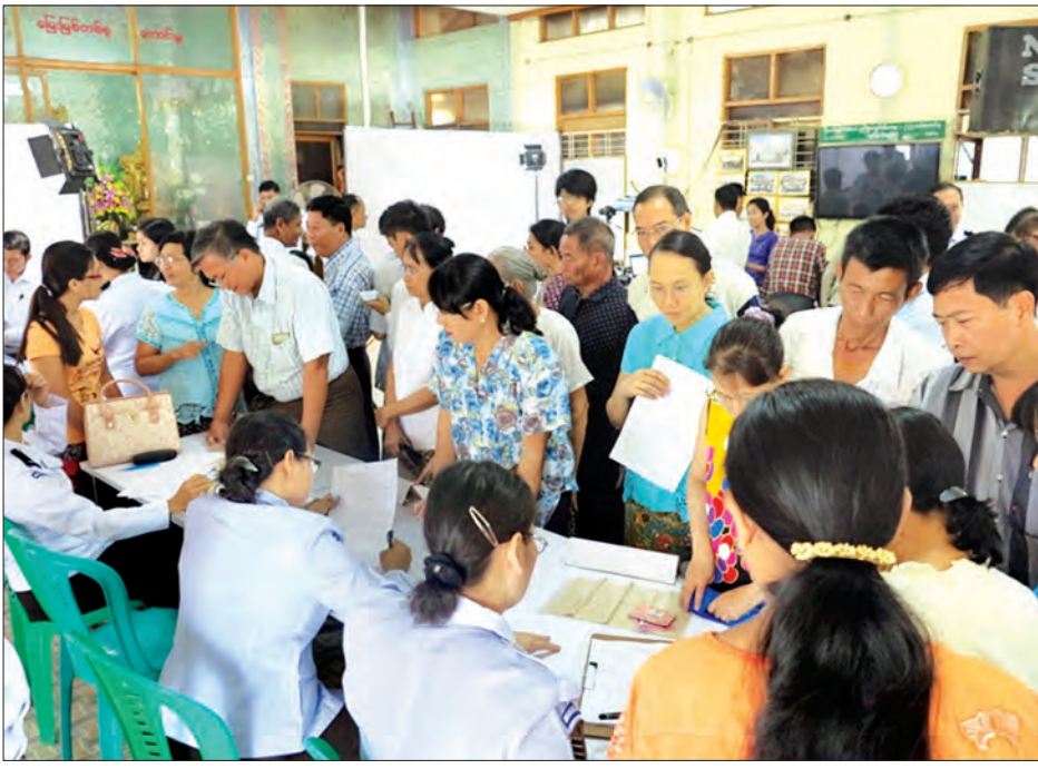
National ID အထောက်အကူပြုစာရင်း ကောက်ယူနေစဉ်