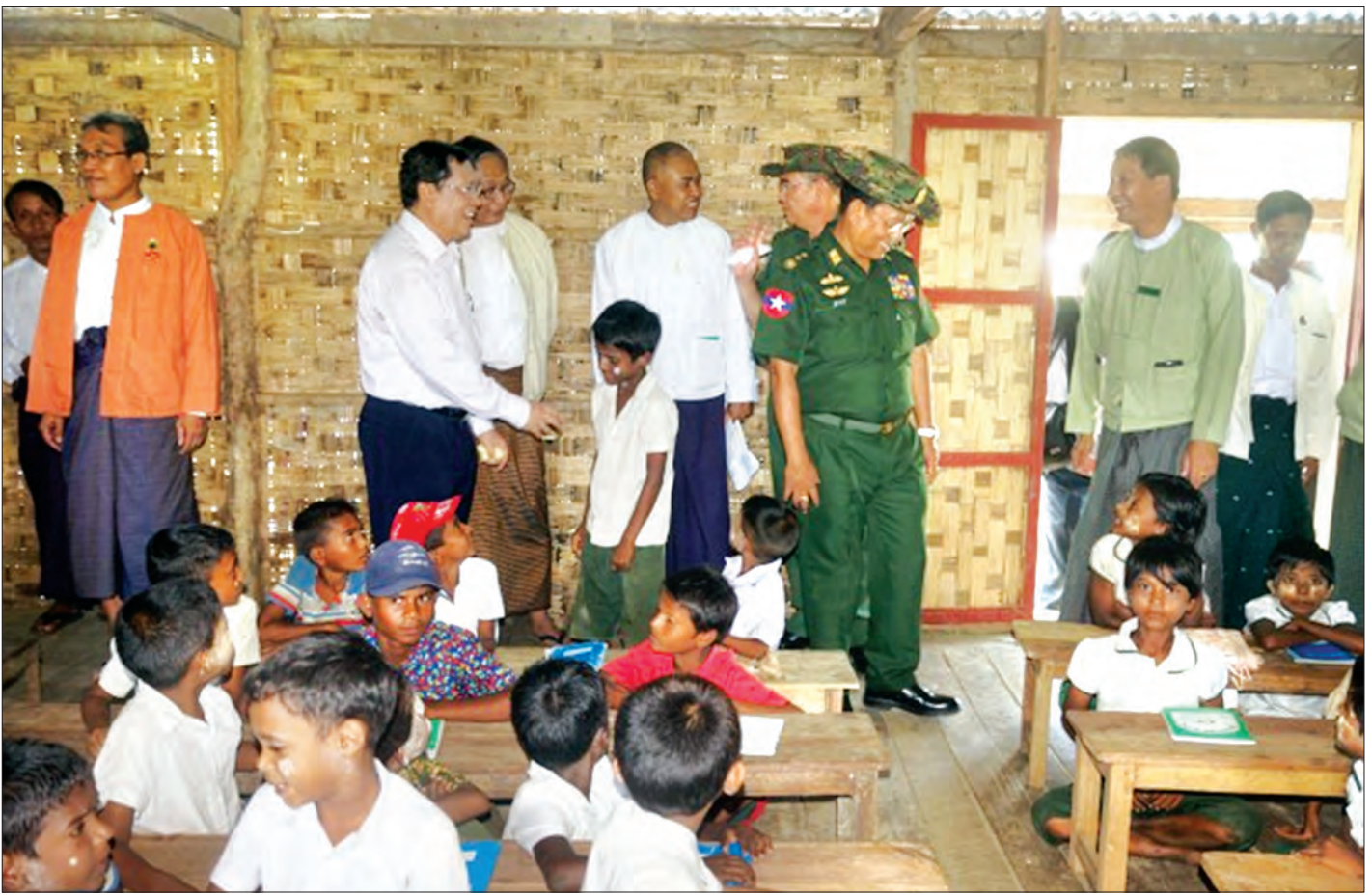
မြေပုံမြို့နယ် ကံသာထွက်ဝ IDP စခန်း၌ ကလေးငယ်များ ပညာသင်ကြားနေသည်ကို တွေ့ရစဉ်

ဝန်ကြီးဌာနအနေနဲ့ လူဝင်မှုကြီးကြပ်ရေးဦးစီးဌာန၊ အမျိုးသားမှတ်ပုံတင်နှင့် နိုင်ငံသားဦးစီးဌာန၊ ပြည်သူ့အင်အားဦးစီးဌာနဆိုပြီး ဦးစီးဌာနသုံးခု ဖွဲ့စည်းထားရှိဆောင်ရွက်လျက်ရှိရာ လူဝင်မှုကြီးကြပ်ရေးလုပ်ငန်းတွေအနေနဲ့ (Black List) ရေးသွင်းထားသူတွေကို ဥပဒေလုပ်ထုံးလုပ်နည်းများနှင့်အညီ စိစစ်ဖြေလျှော့နိုင်ရေးအတွက် Black List စာရင်းရေးသွင်းဖို့ ပေးပို့ထားတဲ့ သက်ဆိုင်ရာဌာနအသီးသီးရဲ့သဘောထားမှတ်ချက်များရယူပြီး ၎င်းတို့၏ ပြန်ကြားချက်အရ အစိုးရသစ်ရဲ့ ရက် ၁၀၀ သစ္စာစီမံချက်ကာလအတွင်းမှာ မြန်မာနိုင်ငံသား ၂၄၈ ဦးနဲ့ နိုင်ငံခြားသား ၃၇၁ ဦး စုစုပေါင်း ၆၁၉ ဦးတို့ကို အမည်မည်းစာရင်းကနေ ပယ်ဖျက်ပေးခဲ့ပြီး ဖြစ်ပါတယ်။ ကျန်ရှိတဲ့ Black List စာရင်းတွေအနက် အမည်မည်းစာရင်းသွင်းထားတဲ့ အကြောင်းရင်းပေါ်မူတည်ပြီး ပယ်ဖျက်ပေးနိုင်ဖို့ ဆက်လက်စိစစ် ဆောင်ရွက်သွားမှာဖြစ်ပါတယ်။ ကမ္ဘာ့နိုင်ငံအသီးသီးမှ မြန်မာနိုင်ငံကို လာရောက်လိုသူတွေ အွန်လိုင်း မှ e-Visa စနစ်နဲ့ ပြည်ဝင်စီမံ အဆင်ပြေချောမွေ့စွာလျှောက်ထားနိုင်ဖို့ အစိုးရသစ်ရဲ့ တစ်နှစ်တာကာလအတွင်း မြန်မာ-ထိုင်း အပြည်ပြည်ဆိုင်ရာနယ်စပ်ဝင်/ထွက်ပေါက် သုံးခု ဖြစ်တဲ့ တာချီလိတ်၊ မြဝတီနဲ့ ကော့သောင်း ဂိတ်တို့မှာ ၁-၉-၂၀၁၆ ရက်နေ့ကစပြီး e-Visa နဲ့ စတင် ဝင်၊ ထွက်ခွင့် ပြုခဲ့ပါတယ်။ အဲဒီအတွက် ပြည်ဝင်စီမံလွယ်ကူပြီး ဌာနအနေနဲ့ နိုင်ငံတော်ဘဏ္ဍာ တိုးတက်ရှာဖွေ