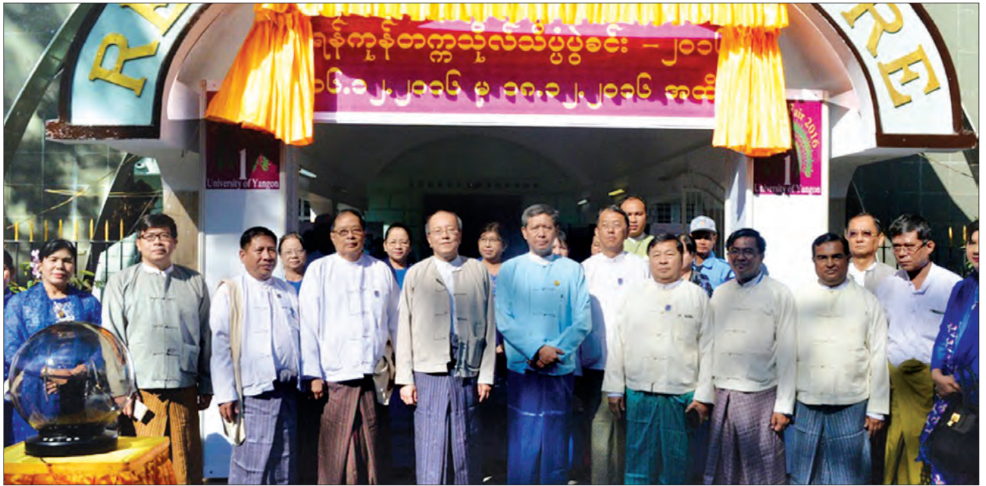
ပြည်ထောင်စုဝန်ကြီး ဒေါက်တာမျိုးသိမ်းကြီးနှင့် တာဝန်ရှိသူများ ရန်ကုန်တက္ကသိုလ် သိပ္ပံပွဲခင်း ဖွင့်ပွဲအခမ်းအနား၌ စုပေါင်းမှတ်တမ်းတင် ဓာတ်ပုံရိုက်စဉ်

ရန်ကုန်တက္ကသိုလ် အဆင့်မြှင့်တင်မှုဆောင်ရွက်ရန်အတွက် Master Plan ရေးဆွဲပြုစုသွားဖို့ကို ဖွံ့ဖြိုးမှု မိတ်ဖက်အဖွဲ့အစည်းတွေနဲ့ ပူးပေါင်းဆောင်ရွက်နေတာ ရှိပါတယ်။ ဒါတင်မကသေးပါဘူး ရန်ကုန်တက္ကသိုလ်၊ မန္တလေးတက္ကသိုလ်အပါအဝင် တက္ကသိုလ်အသီးသီးမှာ နှစ်ပတ်လည်နေ့ အထိမ်းအမှတ်သုတေသနစာတမ်းဖတ်ပွဲတွေ ကျင်းပပေးတာ၊ သိပ္ပံပွဲခင်းတွေ ပြန်လည်ကျင်းပတာ၊ စာအုပ်ပြပွဲတွေ ကျင်းပပေးခဲ့တဲ့