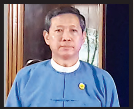
ပညာရေးဝန်ကြီးဌာန ပြည်ထောင်စုဝန်ကြီး ဒေါက်တာမျိုးသိမ်းကြီး