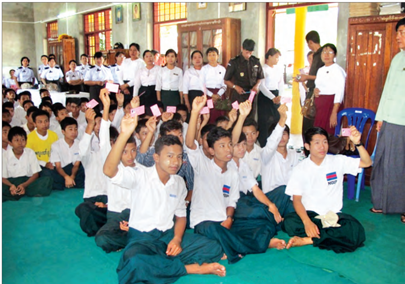
အထက(၆)မြောင်းမြ၌ ကျောင်းသား ကျောင်းသူများအား နိုင်ငံသားစိစစ်ရေးကတ်ပြားများ ထုတ်ပေးနေစဉ်