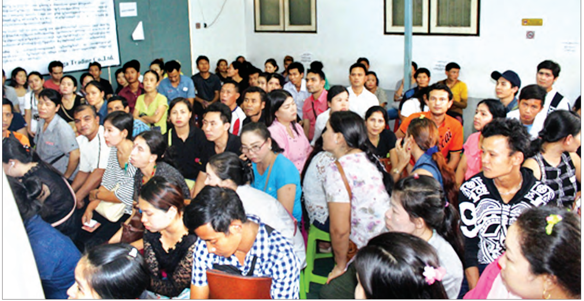
ထိုင်းနိုင်ငံရောက် အထောက်အထားမတင်ပြနိုင်သော မြန်မာအလုပ်သမားများအား မည်သူမည်ဝါဖြစ်ကြောင်းနှင့် သက်သေခံလက်မှတ် (Certificate of Identity-CI) လာရောက်ထုတ်ယူနေစဉ်

အထောက်အထား မတင်ပြ နိုင်တဲ့ မြန်မာအလုပ်သမား တွေကို ထိုင်းနိုင်ငံမှာ မည်သူ မည်ဝါဖြစ်ကြောင်း သက်သေခံ လက်မှတ် (Certificate of Identity - CI) ထုတ် ပေးရေးစခန်းခြောက်ခု ဖွင့်လှစ် ပြီး အခုနှစ် မတ်လ ၃ ရက်နေ့ ကစပြီး ထုတ်ပေးလျက်ရှိရာ မတ်လ ၁၄ ရက်ထိ ၁၂၄၀၈ ဦးထုတ်ပေးခဲ့ပြီးဖြစ်