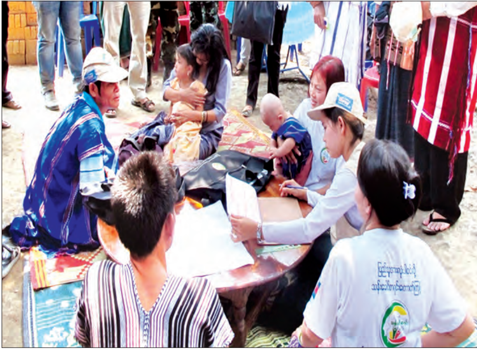
လူဦးရေနှင့် အိမ်အကြောင်းအရာ သန်းခေါင်စာရင်းကောက်ယူနေစဉ်