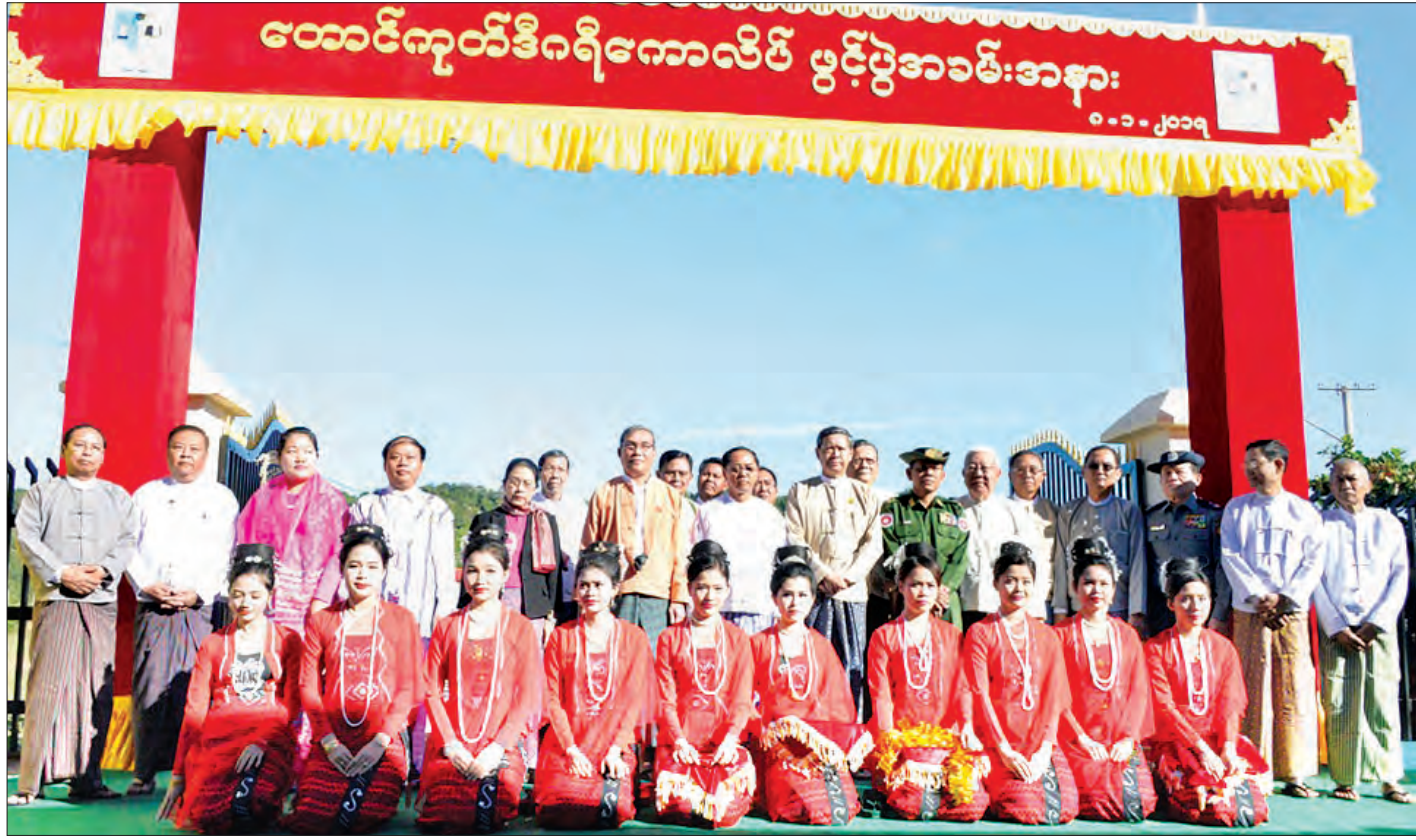
ပြည်ထောင်စုဝန်ကြီး ဒေါက်တာမျိုးသိမ်းကြီးနှင့် တာဝန်ရှိသူများ တောင်ကုတ်ဒီဂရီကောလိပ်ဖွင့်ပွဲ၌ စုပေါင်းမှတ်တမ်းတင် ဓာတ်ပုံရိုက်စဉ်