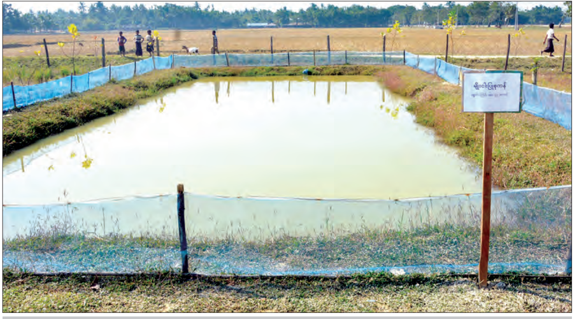
မောင်တောမြို့ရှိ မြို့သူကြီး ရေချိုငါးသားဖောက်စခန်း