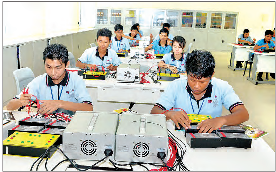
ကျွမ်းကျင်လုပ်သားများ မွေးထုတ်ပေးနိုင်ရေး သက်မွေးပညာသင်တန်းများ ဖွင့်လှစ်ပို့ချပေးစဉ်