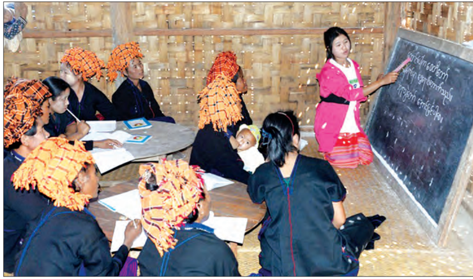
ဒေသခံတိုင်းရင်းသူများအား မြန်မာစာသင်ကြားပေးနေစဉ်

အခုလို ပြည်ပြည်စုံစုံ ဖြေကြားပေးတဲ့အတွက် ကျေးဇူးတင်ပါတယ်ရှင့်။