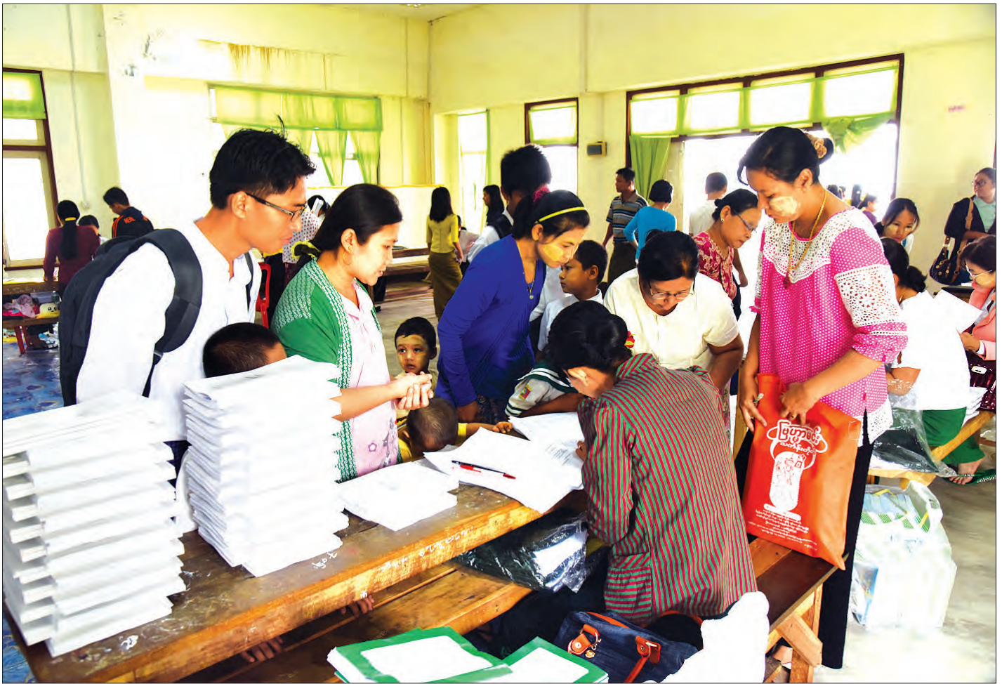
အခမဲ့ပညာရေးစနစ် အကောင်အထည်ဖော်ရေးအတွက် ကျောင်းအပ်နံ့ရေးကာလ၌ ကျောင်းသား ကျောင်းသူများအား ကျောင်းသုံးစာအုပ်များ အခမဲ့ထုတ်ပေးစဉ်

လူတိုင်းအကျိုးဝင်ပညာရေး ဖြေ။ ။ အမြင်အာရုံအားနည်းတဲ့ကျောင်းသား၊ ကျောင်းသူ များက အလက ၅ မရမ်းကုန်းနဲ့ အထက ၅ ကြည့်မြင်တိုင်တို့မှာ တက်ရောက်ပညာသင်ယူနေပြီး အကြားအာရုံအားနည်းတဲ့ တွဲကျောင်းသား၊ ကျောင်းသူများက အထက ၃ ဒဂုံမှာ တက် ရောက် ပညာသင်ယူနေကြပါတယ်။ ကိုယ်လက်အင်္ဂါ မသန်စွမ်း သော ကျောင်းသား ကျောင်းသူများကလည်း အခြားကျောင်း သား၊ ကျောင်းသူတွေလိုပဲ မူလတန်း၊ အလယ်တန်း အထက် တန်းကျောင်းတွေမှာ တက်ရောက်ပညာသင်ယူခွင့်ရှိပါတယ်။ ဒါပေမယ့် ဆရာ၊ ဆရာမတွေက ဒီလိုကျောင်းသား၊ ကျောင်းသူ တွေကို စနစ်တကျ သင်ကြားသင်ယူပေးနိုင်ဖို့ သင်တန်းတွေ ပေးပြီး ဆောင်ရွက်ရမှာဖြစ်ပါတယ်။ လူတိုင်းအကျိုးဝင် ပညာ ရေးကို ပိုမိုအလေးထား ဆောင်ရွက်နိုင်ဖို့အတွက် အမြင်အာရုံချို့ တဲ့တဲ့ ကျောင်းသား၊ ကျောင်းသူတွေ၊ အကြားအာရုံချို့တဲ့တဲ့