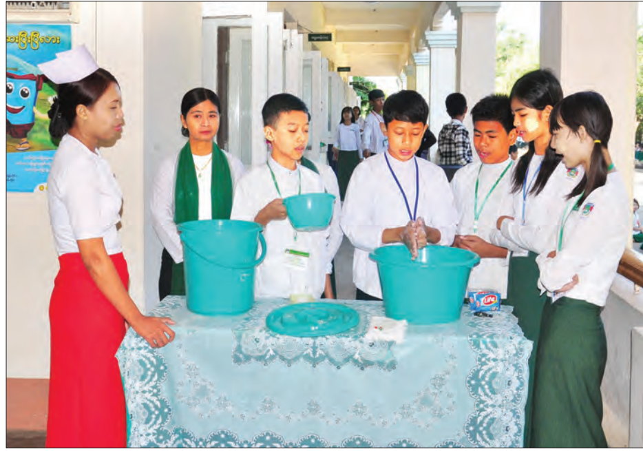
ကျောင်းကျန်းမာရေး မြှင့်တင်ရန်အတွက် ကျောင်းသား ကျောင်းသူများလက်ဆေးနည်းစနစ် သရုပ်ပြစဉ်

ကျောင်းသား ကျောင်းသူတွေကို ယူနီဆက်နဲ့ ပူးပေါင်းပြီး ပလာစတစ်အိတ်တွေ၊ ကျောပိုးအိတ်တွေနဲ့ အခြားလိုအပ်တဲ့ သင်ထောက်ကူပစ္စည်းများကို ၂၀၁၆ ခုနှစ် ဇွန်လမှာ ဖြည့်ဆည်း ဆောင်ရွက်ပေးခဲ့ပါတယ်။