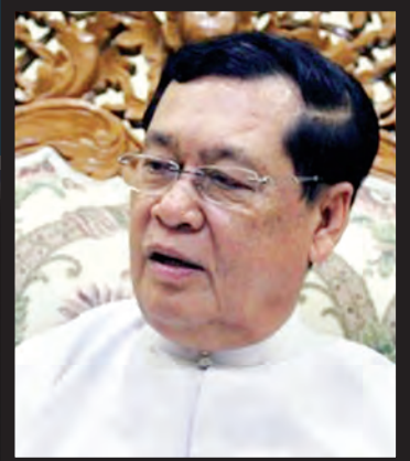
အလုပ်သမား၊ လူဝင်မှုကြီးကြပ်ရေးနှင့် ပြည်သူ့အင်အားဝန်ကြီးဌာန ပြည်ထောင်စုဝန်ကြီး ဦးသိန်းဆွေ