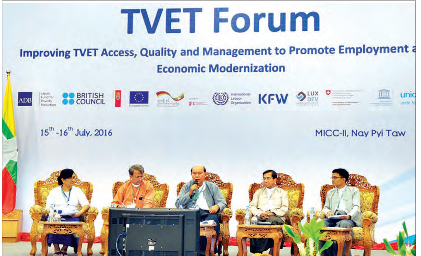
TVET ဝိုရမ် ကျင်းပစဉ်

ဖြေ။ ။ အကြောင်းအမျိုးမျိုးနဲ့ ကျောင်းတက်ရောက်နိုင်ခြင်း မရှိတဲ့သူတွေနဲ့ ပညာမပြီးဆုံးသေးတဲ့အချိန်တွေမှာ