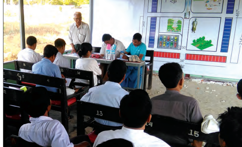
ဗိုလ်ချုပ်အောင်ဆန်းကြေးရုပ်၊ ဗိုလ်ချုပ်ကျောက်တိုင်း လူကြီးအားကစားကွင်းနှင့် ကလေးကစားကွင်း၊ ရေပန်း အလှူများနှင့် ဈေးဆိုင်ခန်း ၅၇ ခန်းတို့ကို ထည့်သွင်း တည်ဆောက်သွားမည်ဖြစ်ကြောင်း ပန်းခြံမြောက် ရေးကော်မတီဥက္ကဋ္ဌ၏ ပြောကြားချက်အရ သိရသည်။ အောင်စိုးဖေ(မြင်းမူ)

မြင်းမူ မတ် ၂၆ စစ်ကိုင်းတိုင်းဒေသကြီး မြင်းမူမြို့တွင် ဗိုလ်ချုပ်အောင် ဆန်း ပန်းခြံ၊ ကြေးရုပ်တူနှင့် ကစားကွင်းများကို စတင် တည်ဆောက်တော့မည်ဖြစ်ကြောင်း မတ် ၂၇ ရက်က ကျင်းပခဲ့သည့် ပန်းခြံမြောက်ရေးကော်မတီ ညှိနှိုင်း အစည်းဝေးမှ သိရသည်။ အစည်းအဝေးတွင် ဗိုလ်ချုပ်အောင်ဆန်းပန်းခြံ ဖြစ် မြောက်ရေးကော်မတီဥက္ကဋ္ဌ ဦးအောင်သန်းက အမှာ စကားပြောကြားပြီး တည်ဆောက်ရေးလုပ်ငန်းကော်မတီ တာဝန်ရှိသူများက လုပ်ငန်းများစတင်ဆောင်ရွက်ရန် လျာထားမှုများကို ရှင်းလင်းပြောကြားသည်။ ထို့နောက် ပြည်သူ့လွှတ်တော်ကိုယ်စားလှယ် ဦးစိုးစံသက်ထွန်းနှင့် ကော်မတီဝင်များက လိုအပ်သည်များကို ဖြည့်စွက် ဆွေးနွေးခဲ့ကြသည်။