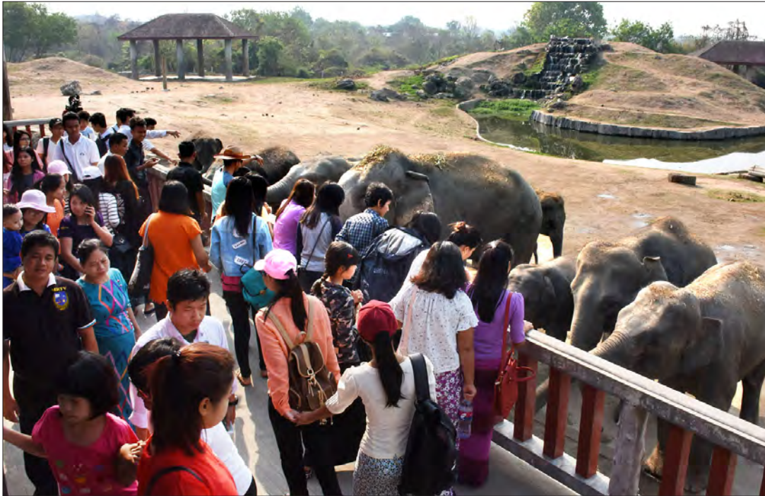
နေပြည်တော် တိရစ္ဆာန်ဥယျာဉ်၌ အပန်းဖြေလာရောက်လေ့လာကြည့်ရှုကြသူများဖြင့် စည်ကားလျက်ရှိသည်ကို တွေ့ရစဉ်