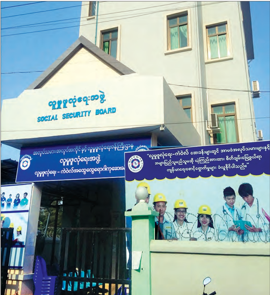
ရန်ကုန်တိုင်းဒေသကြီး လှိုင်သာယာမြို့နယ်တွင် လူမှုစုလုံခြုံရေး ကဲဝဲလ်ဆေးခန်း ဖွင့်လှစ်ထားစဉ်

ကျွမ်းကျင်မှု စံသတ်မှတ်ပြဋ္ဌာန်းရေးအဖွဲ့ မြန်မာနိုင်ငံလုပ်သားများကျွမ်းကျင်မှု စံသတ်မှတ်ပြဋ္ဌာန်း ရေးအဖွဲ့(NSSA)အနေနဲ့ အလုပ်အကိုင် ၁၉ မျိုးအတွက်