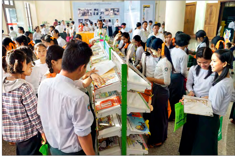
ခင်းကျင်းပြသထားသော စာအုပ်များကို ကျောင်းသား ကျောင်းသူများ စိတ်ဝင်စားစွာ လေ့လာနေကြစဉ်