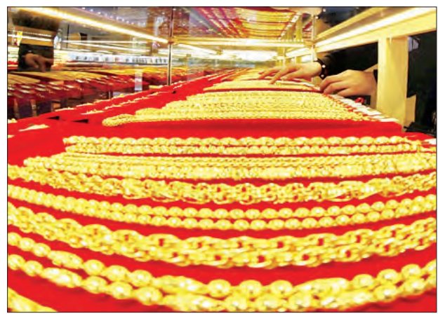
ရွှေအရောင်းဆိုင်တစ်ဆိုင်၌ ရောင်းချရန် ခင်းကျင်းပြသထားသည့် ရွှေထည်ပစ္စည်း များကို တွေ့ရစဉ်