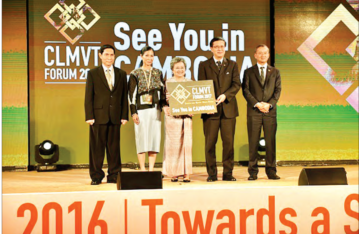
ပြည်ထောင်စုဝန်ကြီး ဦးအုန်းမောင် CLMVT Forum တက်ရောက်စဉ်

အခုလို ပြည်ပြည်စုံစုံဖြေကြားပေးတဲ့အတွက် အထူးကျေးဇူးတင်ရှိပါတယ်ရှင်။