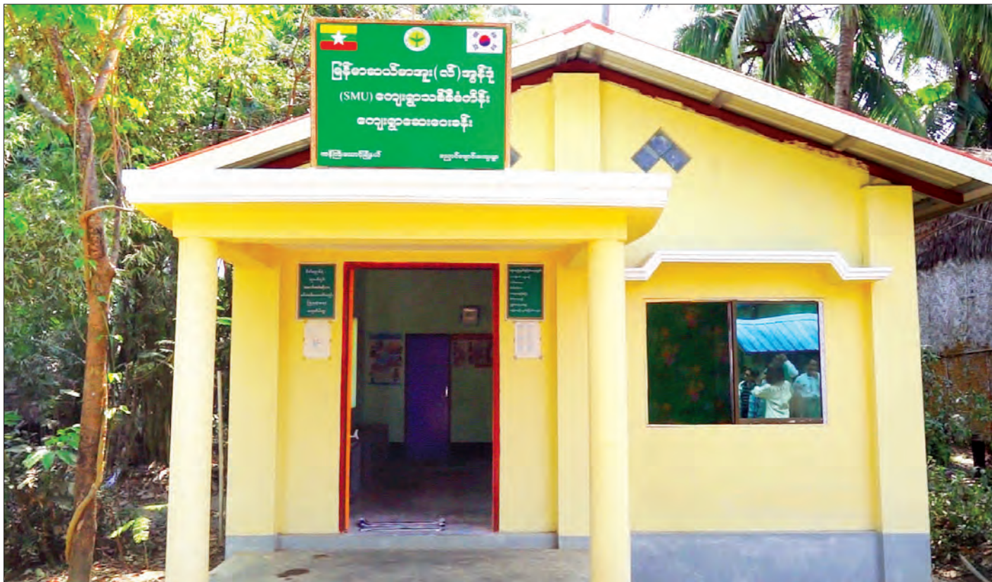
မြန်မာဆယ်မာအူး(လ်) အွန်ဒ် (SMU) ကျေးရွာသစ်စီမံကိန်းအဖြစ် ကန်ကြီးထောင့်မြို့နယ် ညောင်ချောင်းကျေးရွာဆေးပေးခန်းကို တွေ့ရစဉ်

“ပြည်သူတွေကို ပစ်ထားဘဲ အကောင်းဆုံးကြိုးစားပြီး ပြည်သူတွေကို အလုပ်အကျွေးပြုသွားမယ်ဆိုတာကို ပြောရပါတယ်” ဟု ပြောကြားခဲ့ပါကြောင်း။