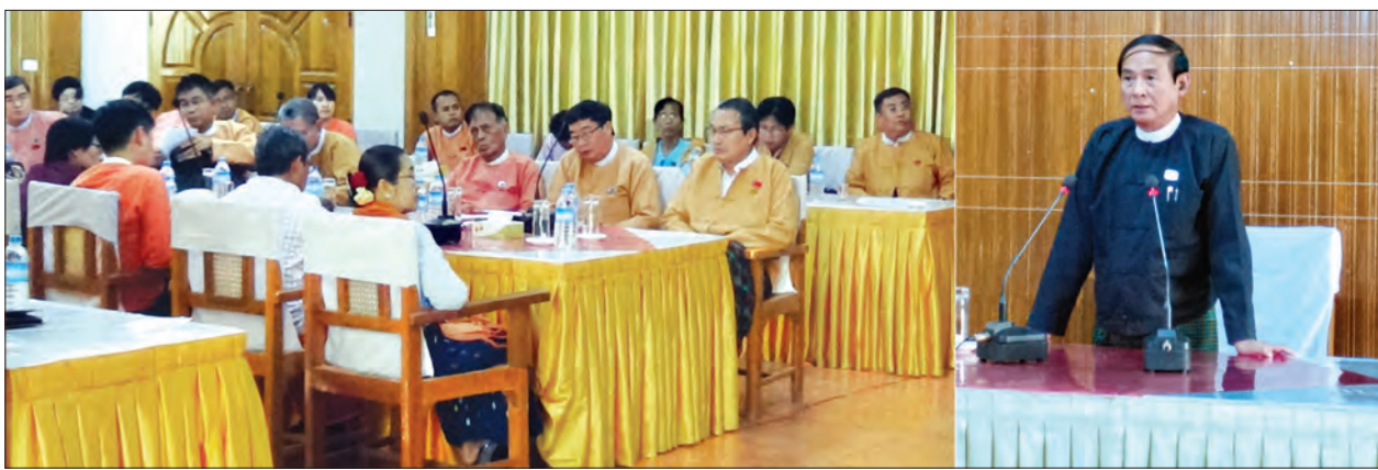
ပြည်သူ့လွှတ်တော်ဥက္ကဋ္ဌ ဦးဝင်းမြင့် မွန်ပြည်နယ် လွှတ်တော်ကိုယ်စားလှယ်များအား တွေ့ဆုံစဉ် (သတင်းစဉ်)

ကိုယ်စားလှယ်များအနေဖြင့် မေး မြန်းသည့်မေးခွန်း၊ တင်သွင်းသည့် အဆို များသည် လွှတ်တော်ဆိုင်ရာဥပဒေ၊ နည်းဥပဒေများတွင် ပါရှိသည့် စည်းကမ်း