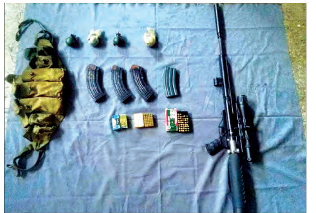
MNDAA လက်နက်ကိုင်အဖွဲ့များ အသုံးပြုသည့်

ရက်က မုဆယ်မှ မန္တလေးသို့ သွားရောက်မည့် ခရီးသည်တင် GI Express အမျိုးအစားယာဉ်သည် ခရီးသည်တင်ဆောင်ခြင်းမရှိဘဲ တရားမဝင်ကုန်ပစ္စည်းများ သယ်ဆောင်လာကြောင်း သတင်းရရှိ၍ ရေပူအမြဲတမ်းစစ်ဆေးရေးစခန်း ပူးပေါင်းစစ်ဆေးရေးအဖွဲ့မှ စစ်ဆေးရန်တားဆီးစဉ် အတင်းမောင်းနှင်ထွက်ပြေးသဖြင့် ပန်ဖတ်ရဲကင်းမှ တားဆီးပေးခဲ့ပြီး ရေပူအမြဲတမ်းစစ်ဆေးရေးစခန်းသို့ ခေါ်ဆောင်၍ စစ်ဆေးခဲ့ရာ တရားဝင်စာရွက်စာတမ်း တစ်စုံတစ်ရာ တင်ပြနိုင်ခြင်းမရှိသည့် စက်ပစ္စည်းများ၊ ကွန်ပျူတာဆက်စပ်ပစ္စည်းများ၊ အလှကုန်ပစ္စည်းများ၊ အိမ်တွင်းအလှဆင်ပစ္စည်းများ၊ လူသုံးကုန်ပစ္စည်းများ၊ ခြင်ဆေးဘူးများနှင့် ပိုးသတ်ဆေးများ စုစုပေါင်း ခန့်မှန်းတန်ဖိုးငွေကျပ် ၁၀ သန်းခန့်ကို တွေ့ရှိ၍ ဖမ်းဆီးခဲ့ကြောင်း သတင်းရရှိသည်။ (သတင်းစဉ်)