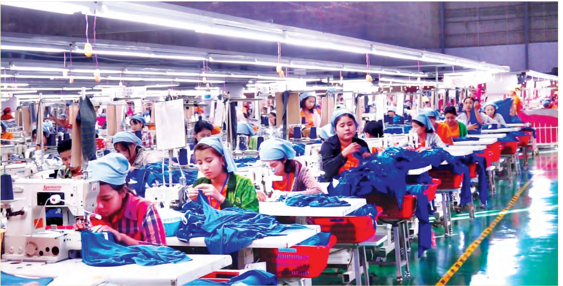
ရာဝတီတိုင်းဒေသကြီးရှိ အထည်ချုပ်စက်ရုံတစ်ရုံ၌ အလုပ်သမားများ အထည်ချုပ်နေမှုကို တွေ့ရစဉ်