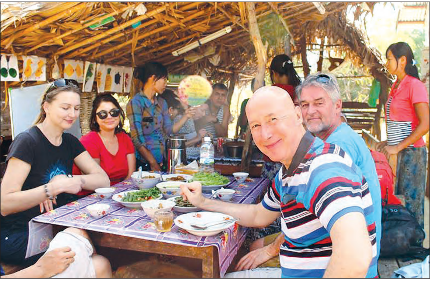
ရပ်ရွာလူထုအခြေပြု ကျေးရွာများတွင် ဒေသခံတို့၏ နေထိုင်မှုစေ့စပ်မှုကို နှစ်ခြိုက်နေကြသည့် ခရီးသွားညွှန်ကြားရေးမှူးချုပ်

ပြည်တွင်း ပြည်ပ ခရီးသွားများတည်းခိုနိုင်သည့် အင်းလေးဒေသရှိ အင်းလေးခေါင်တိုင်ဟူပင်ဟိုတယ်ကို တွေ့ရစဉ်