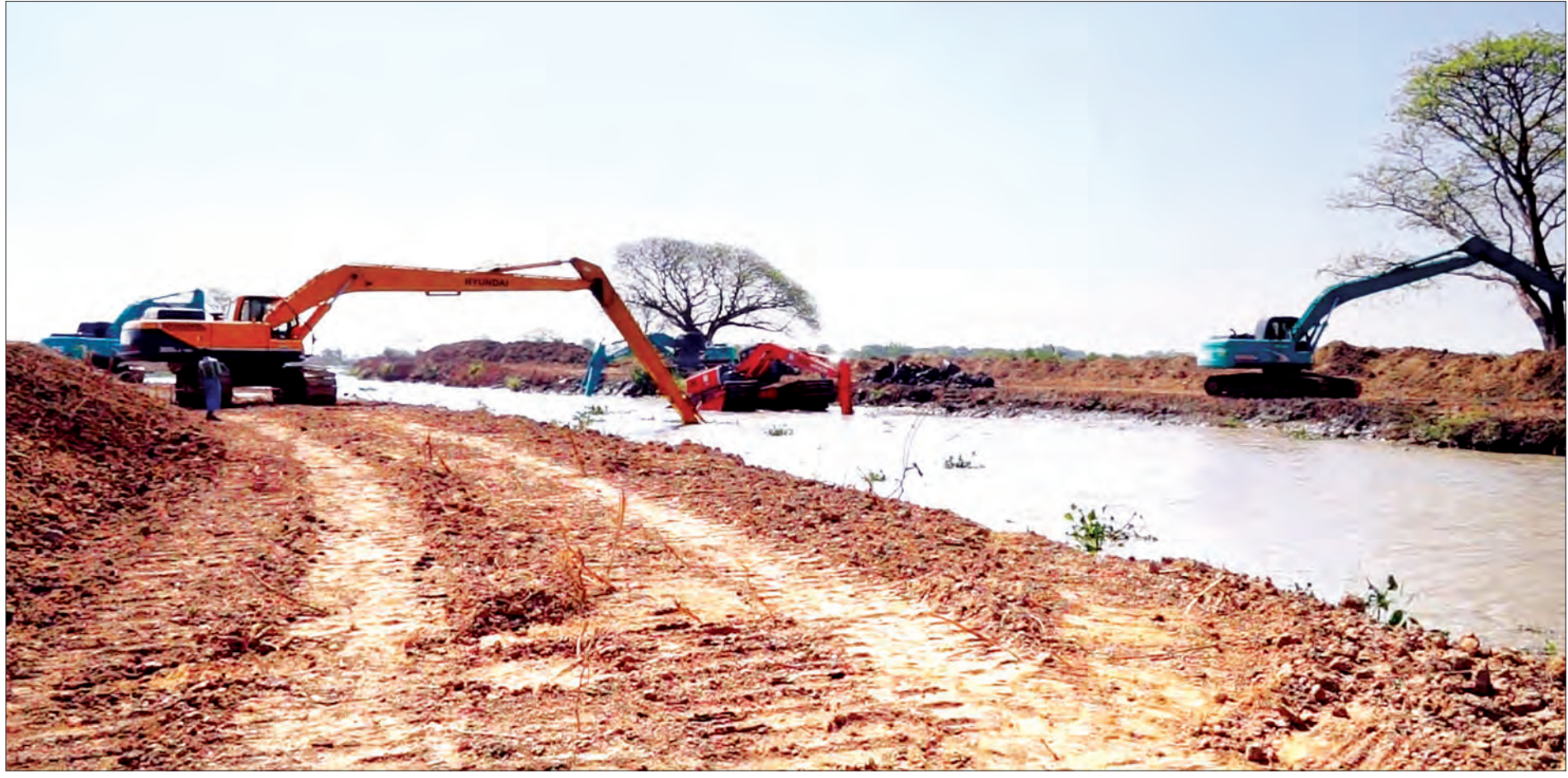
ဧရာဝတီတိုင်းဒေသကြီး၌ ချောင်းကော၊ မြောင်းကောများ ရေစီးရေလာကောင်းမွန်ရေး စက်ယန္တရားများဖြင့် ဆောင်ရွက်နေစဉ်

ကျွန်တော်တို့တိုင်းဟာ စိုက်ပျိုးရေး တိုင်းဖြစ်ပါတယ်။ စိုက်ပျိုးရေးမှာ အောင်မြင်ဖို့အတွက် အဓိကက မျိုးကောင်းမျိုးသန့်ထုတ်ပေးနိုင်ရေး၊ ဓာတ်မြေဩဇာစံချိန်မီများကို ထုတ်ပေးနိုင်ရေး၊ ဒီလိုထုတ်ပေးနိုင်ဖို့အတွက်ဆိုရင် စိုက် / ဘဏ်ချေးငွေကို ပေးရမှာဖြစ်ပါတယ်။ အစိုးရသစ်တက်လာတဲ့အခါမှာ အချိန်မီထုတ်ပေးနိုင်ရေးအတွက် ကြိုးစားခဲ့ကြရပါတယ်။ တစ်နှစ်တာအတွင်းမှာ ကျပ်သန်းပေါင်း ၄၈၀၀၀ ကျော် ထုတ်ပေးနေတဲ့အတွက် အရင်ကထက် ကျပ်သန်းပေါင်း ၁၆၀၀၀၀ ကျော် ထုတ်ပေးနိုင်ခဲ့