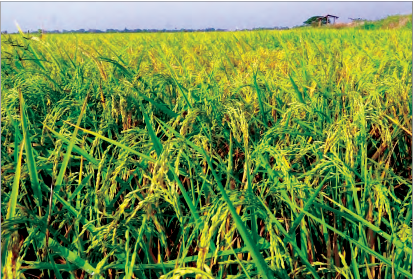
ဧရာဝတီတိုင်းဒေသကြီး၌ အောင်မြင်ဖြစ်ထွန်းနေသော စပါးခင်းအား တွေ့ရစဉ်

ကျွန်တော်တို့တိုင်းဟာ စိုက်ပျိုးရေး တိုင်းဖြစ်ပါတယ်။ စိုက်ပျိုးရေးမှာ အောင်မြင်ဖို့အတွက် အဓိကက မျိုးကောင်းမျိုးသန့်ထုတ်ပေးနိုင်ရေး၊ ဓာတ်မြေဩဇာစံချိန်မီများကို ထုတ်ပေးနိုင်ရေး၊ ဒီလိုထုတ်ပေးနိုင်ဖို့အတွက်ဆိုရင် စိုက် / ဘဏ်ချေးငွေကို ပေးရမှာဖြစ်ပါတယ်။ အစိုးရသစ်တက်လာတဲ့အခါမှာ အချိန်မီထုတ်ပေးနိုင်ရေးအတွက် ကြိုးစားခဲ့ကြရပါတယ်။ တစ်နှစ်တာအတွင်းမှာ ကျပ်သန်းပေါင်း ၄၈၀၀၀ ကျော် ထုတ်ပေးနေတဲ့အတွက် အရင်ကထက် ကျပ်သန်းပေါင်း ၁၆၀၀၀၀ ကျော် ထုတ်ပေးနိုင်ခဲ့