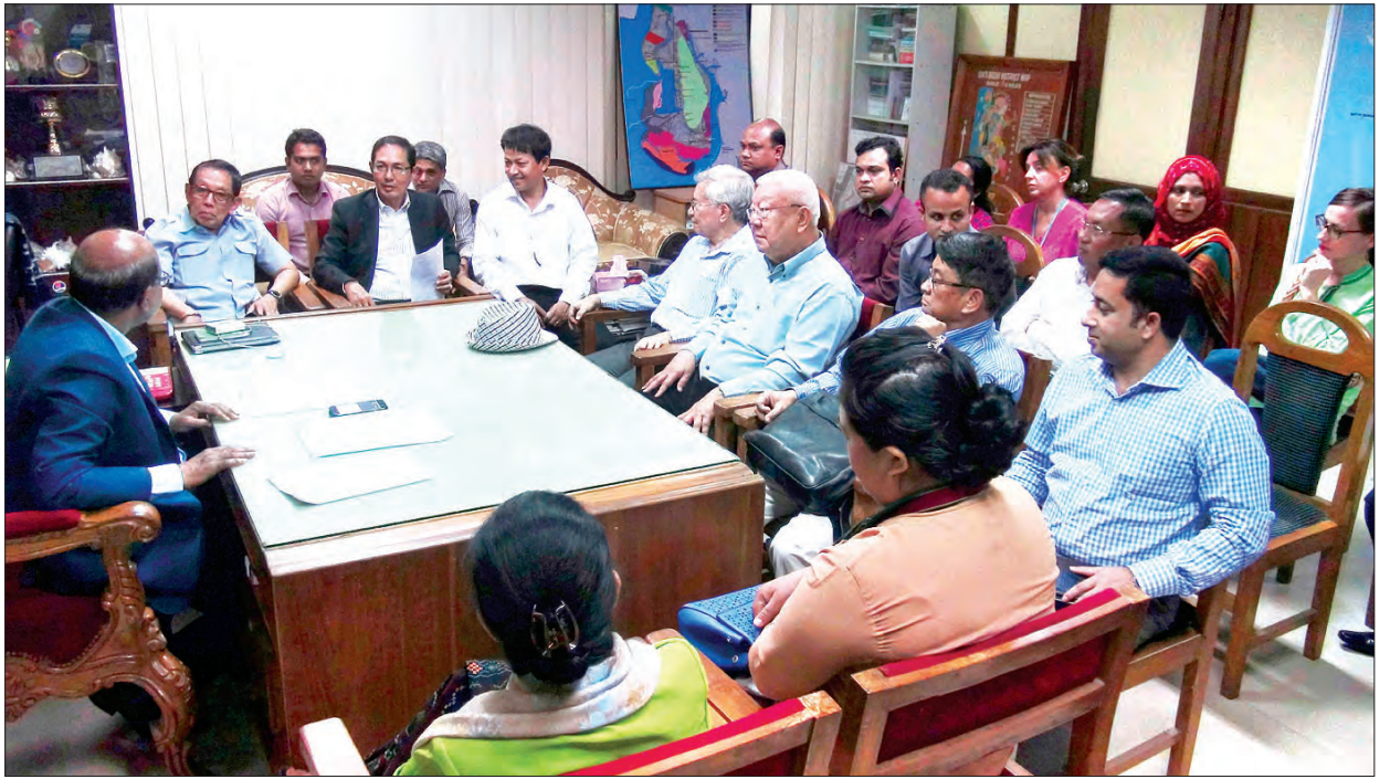
ဘင်္ဂလားဒေ့ရှ်နိုင်ငံ ကော့ခံဘဇားခရိုင် အုပ်ချုပ်ရေးမှူးရုံး၌ အရေးပိုင်နှင့် တွေ့ဆုံဆွေးနွေးနေစဉ်