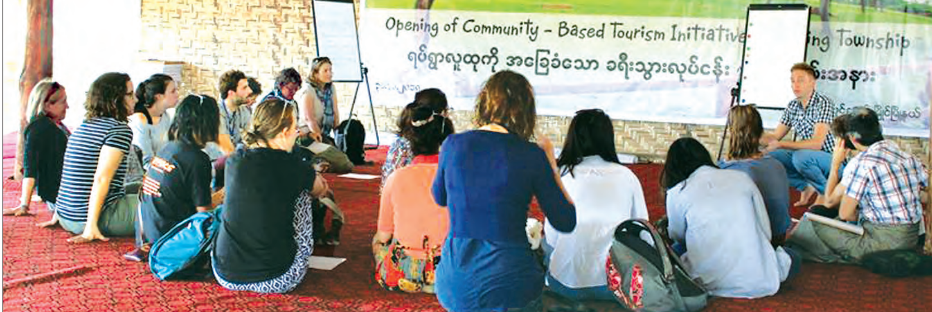
ရပ်ရွာလူထုအခြေပြု ခရီးသွားလုပ်ငန်းများဖော်ထုတ်မြှင့်တင်ရေး အတွေ့အကြုံများ ဖလှယ်ဆွေးနွေးနေစဉ်

နိုင်ငံတော်အစိုးရသစ်ရဲ့ ရက် ၁၀၀ စီမံချက် အပြီးမှာ ခြောက်လအတွင်း ဆောင်ရွက်ရမယ့် စီမံကိန်းအနေနဲ့ တနင်္သာရီတိုင်းဒေသကြီးကို ရွေးချယ်ခဲ့ပြီး ဒေသပြည်သူလူထုရဲ့ လူနေမှုအဆင့်အတန်းဖွံ့ဖြိုးဖို့ အလုပ်အကိုင် အခွင့်အလမ်းသစ်တွေ ရလာဖို့၊ တနင်္သာရီတိုင်းဒေသကြီးအတွင်းမှာရှိတဲ့ သဘာဝဂေဟစနစ်တွေ မပျက်စီးသေးတဲ့ ကျွန်းတွေကို ထိခိုက်မှုမရှိဘဲ ခရီးသွားလုပ်ငန်းနဲ့ အစားထိုးအလုပ်အကိုင်တွေ ဖြစ်လာအောင် စတဲ့ ရည်ရွယ်ချက်တွေနဲ့ ဆောင်ရွက်ခဲ့