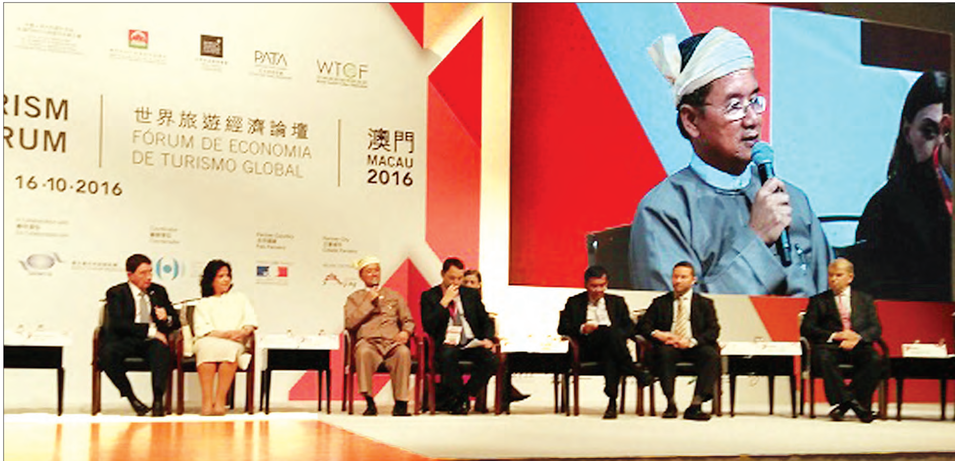
ပထမအကြိမ် တရုတ်-မြန်မာ ခရီးသွားလုပ်ငန်း ပူးပေါင်းဆောင်ရွက်မှုဖိုရမ်တွင် ပြည်ထောင်စုဝန်ကြီး ဦးအုန်းမောင် အမှာစကားပြောကြားစဉ်

အချုပ်ပို (က)မှ ဖြေ ။ ဒေသတွင်း အိမ်နီးချင်းနိုင်ငံတွေ၊ အာဆီယံနိုင်ငံတွေ အားလုံးနဲ့ပူးပေါင်းပြီး ဝန်ကြီးဌာနအနေနဲ့ မြန်မာ့ခရီးသွားလုပ်ငန်းကို အဆင့်မြှင့်တင်နေတာ ဖြစ်ပါတယ်။ CLMV လေးနိုင်ငံအတွက် Four Countries- One Destination ကွန်ဗစ်ကို မြန်မာနိုင်ငံနဲ့ ဒေသတွင်း ခရီးသွားလုပ်ငန်း ပူးပေါင်းဆောင်ရွက်မှု တစ်ရပ်အနေနဲ့ ကမ္ဘောဒီးယား၊ လာအို၊ မြန်မာနဲ့ ဗီယက်နမ် လေးနိုင်ငံခရီးစဉ်ဒေသတစ်ခု ခရီးသွား လုပ်ငန်း ချိတ်ဆက်ဆောင်ရွက်တာကို ၂၀၁၆ ဇူလိုင် ၃၀ ရက်ကနေ ဩဂုတ် ၁ ရက်အထိ ရန်ကုန်မြို့၊ HAGL Complex မှာရှိတဲ့ Melia ဟိုတယ်မှာ ကျင်းပခဲ့ပါတယ်။