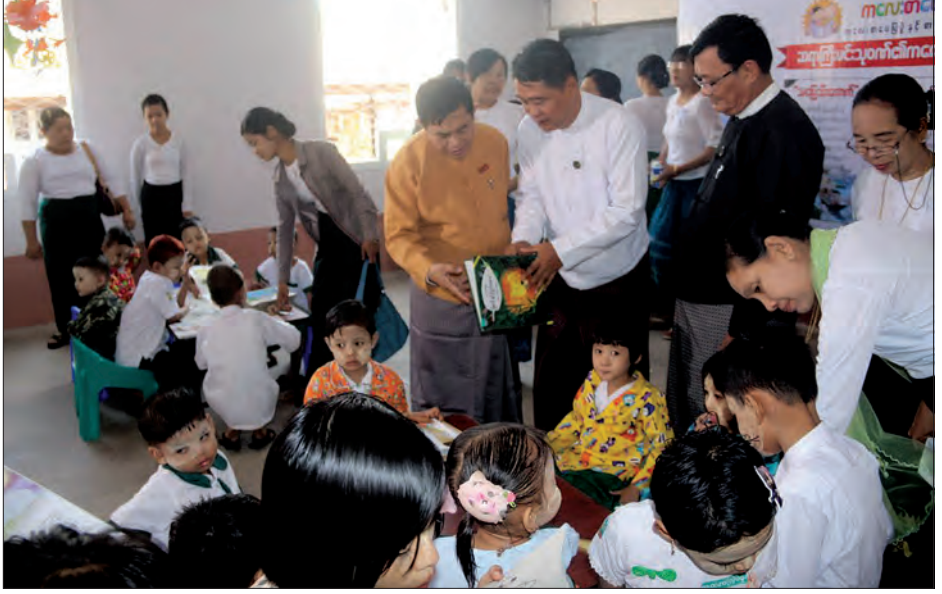
ကလေးစာပေပွဲတော်နှင့် စာအုပ်ဈေးရောင်းပွဲတော်အား မတ် ၂၂ ရက်က ပဲခူးမြို့၊ ရွှေမော်တော်တော်လမ်းရှိ အထက(၁)ကျောင်း၌ ကျင်းပခဲ့ရာ ပဲခူးတိုင်းဒေသကြီး ဝန်ကြီးချုပ် ဦးဝင်းသိန်း၊ တိုင်းဒေသကြီး တရားလွှတ်တော် တရားသူကြီးချုပ် ဦးမောင်မောင်ရွှေနှင့် တာဝန်ရှိသူများက ကလေးစာပေပွဲတော်နှင့်စာအုပ်ဈေးရောင်းပွဲတော်အား လှည့်လည်ကြည့်ရှုအားပေးစဉ် သန့်စင် (ပဲခူး)

ဒေသကြီး၌ မသန်စွမ်းသူ ရာခိုင်နှုန်း ၇ ဒသမ ၆ ရာခိုင်နှုန်း အများဆုံးတွေ့ရှိရပြီး ချင်းပြည်နယ်၌ ၇ ဒသမ ၄ ရာခိုင်နှုန်း ခန့်ရှိပြီးတစ်နိုင်ငံလုံးအနေဖြင့် မသန်စွမ်းအမျိုးသမီးဦးရေသည် မသန်စွမ်းအမျိုးသားဦးရေထက် ပိုမိုတွေ့ရှိရကြောင်း သိရသည်။ မြန်မာနိုင်ငံတွင် အများဆုံးတွေ့ရှိရသည့် မသန်စွမ်းမှု အမျိုးအစားမှာ ဉာဏ်ရည်နှောင့်နှေးခြင်း၊ အကြားအာရုံချို့ယွင်းခြင်း၊ ကိုယ်အင်္ဂါမသန်စွမ်းခြင်းနှင့် အမြင်အာရုံချို့ယွင်းခြင်းတို့ဖြစ်ကြောင်း၊ ကိုယ်အင်္ဂါ မသန်စွမ်းသူ ၈၀ ရာခိုင်နှုန်းခန့်သည် အလုပ်လက်မဲ့ဖြစ်ကြောင်း သိရသည်။ နိုင်ငံရေး(ပြန်/ဆက်)