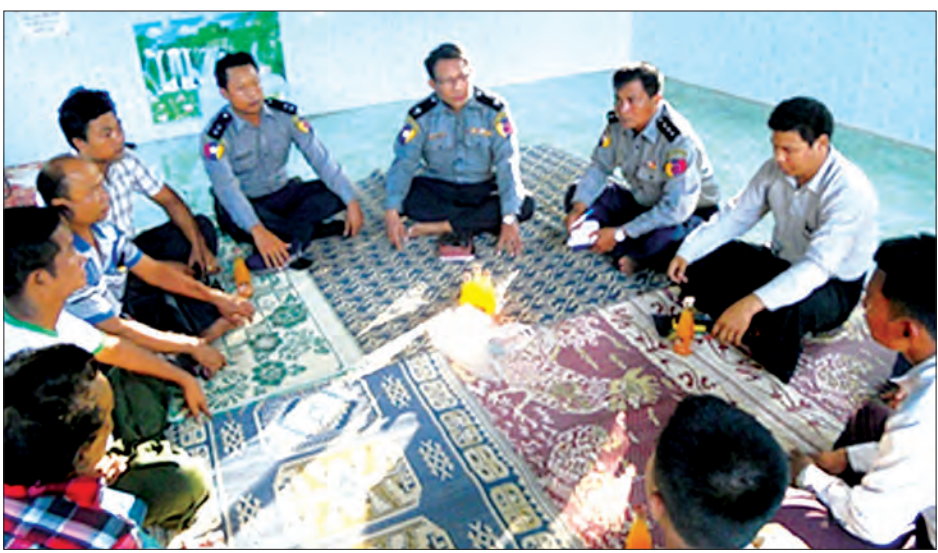
အိမ်တိုင်ရာရောက် ရဲလုပ်ငန်း (Home Visit ) ဆောင်ရွက်နေစဉ်

ပြဿနာဖြေရှင်းမှုကိုရှေးရှုသည့် ရဲလုပ်ငန်းဆိုသည်မှာ လူ့အဖွဲ့အစည်းအတွင်း၌ ဖြစ်ပွားတတ်သည့် ပြဿနာများကို ရဲတပ်ဖွဲ့၏လုပ်ပိုင်ခွင့်အတိုင်းအတာများနှင့်အညီ တုံ့ပြန်ဖြေရှင်းပေးနိုင်ရန်အတွက် မှုခင်းပြဿနာများကို အသေးစိတ်လေ့လာသရုပ်ခွဲ ဆန်းစစ်နိုင်သည့် စွမ်းရည်ဖြစ်သော (Analytical Skill) နှင့် အသိဉာဏ်စွမ်းရည် (Intellectual Skill) များကို အသုံးပြု၍ ပြည်သူ့လူထုနှင့် ပူးပေါင်းဆောင်ရွက်ရမည့် ရဲလုပ်ငန်းဖြစ်ပါသည်။ ဤနည်းလမ်းကို အသုံးပြုရာတွင် ပြဿနာကို စစ်ဆေးခြင်း (Scanning)၊ ပြဿနာဖြစ်စေသည့်