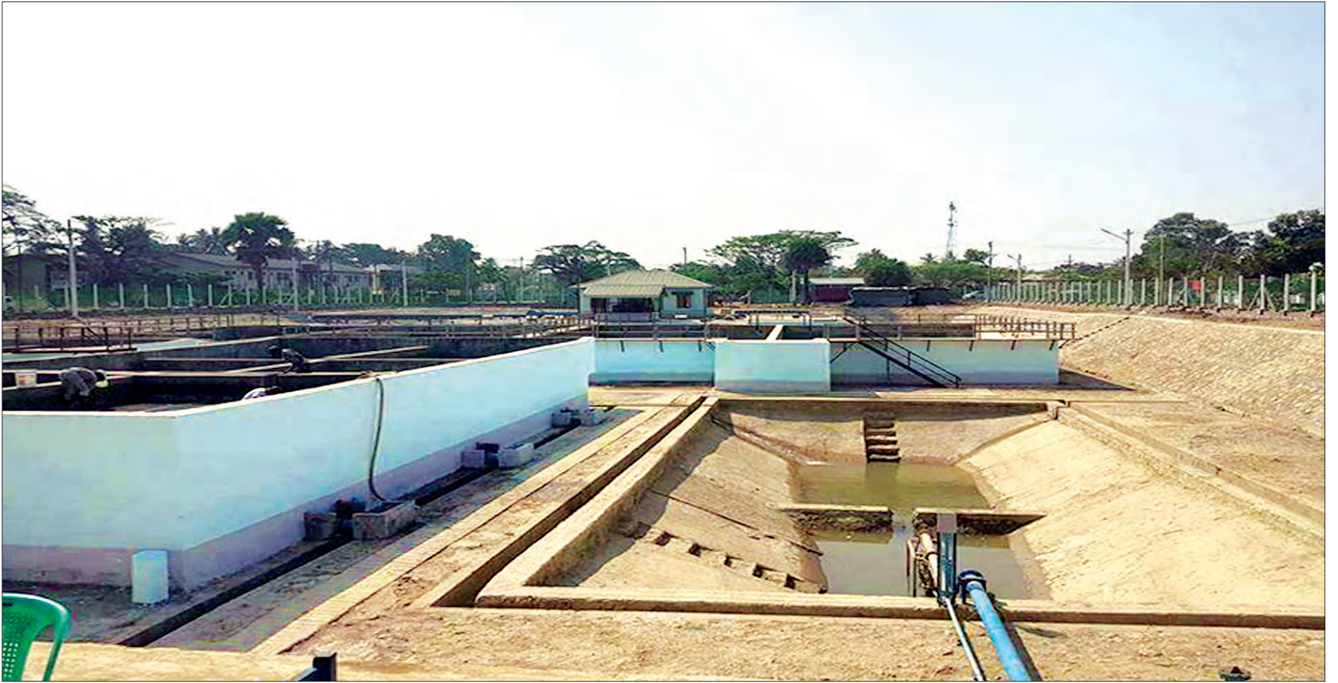
ပြည်သူများ သန့်ရှင်းသောသောက်သုံးရေရရှိစေရန် ရေစုကန်၊ ရေစစ်ကန်များ တည်ဆောက်ထားမှုကို တွေ့ရစဉ်