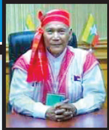
ဧရာဝတီတိုင်းဒေသကြီး ဝန်ကြီးချုပ် မန်းကျော်နီ