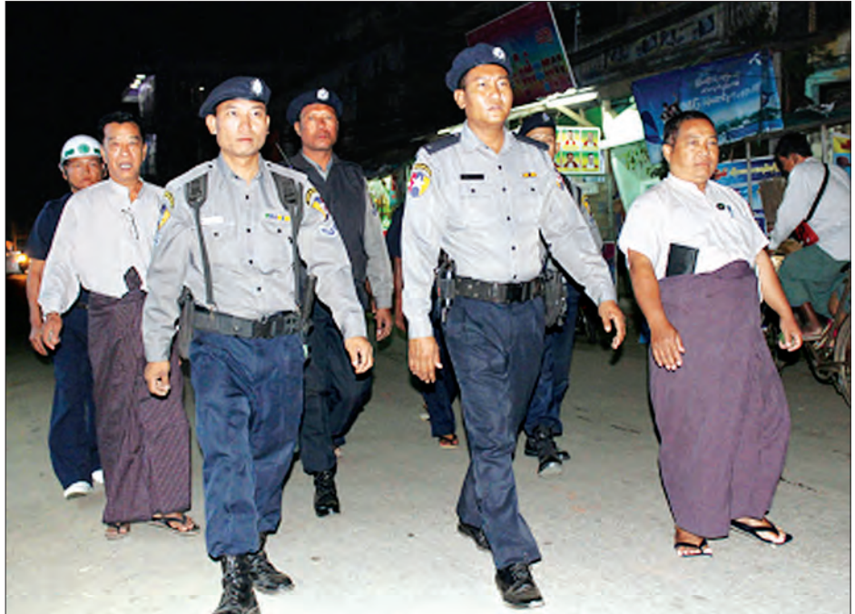
မြန်မာနိုင်ငံ ရဲတပ်ဖွဲ့ဝင်များ ခြေကျင်လှည့်ကင်း ဆောင်ရွက်နေစဉ်

ပြည်သူ့လူထုပူးပေါင်းပါဝင်သော ရဲလုပ်ငန်းဆိုသည်မှာ လူ့အဖွဲ့အစည်းပြဿနာများကို ကွဲပြားစွာသိရှိပြီး ဖြေရှင်းဆောင်ရွက်နိုင်ရန်အတွက် ရဲတပ်ဖွဲ့နှင့် လူ့အဖွဲ့အစည်း ပူးပေါင်းဆောင်ရွက်မှုပင် ဖြစ်ပါသည်။ ထိုသို့ပူးပေါင်းဆောင်ရွက်ခြင်းအားဖြင့် ရဲတပ်ဖွဲ့ဝင်များနှင့် ပြည်သူ့လူထုအကြား ပိုမိုကောင်းမွန်သည့် ဆက်ဆံရေးများဖြင့် အပြန်အလှန်နားလည်မှုနှင့် ယုံကြည်မှုများတိုးပွားစေပြီး လူ့အဖွဲ့အစည်းဆိုင်ရာ ပြဿနာများကိုကိုင်တွယ်ဖြေရှင်းရာတွင် အထောက်အကူဖြစ်စေမည်