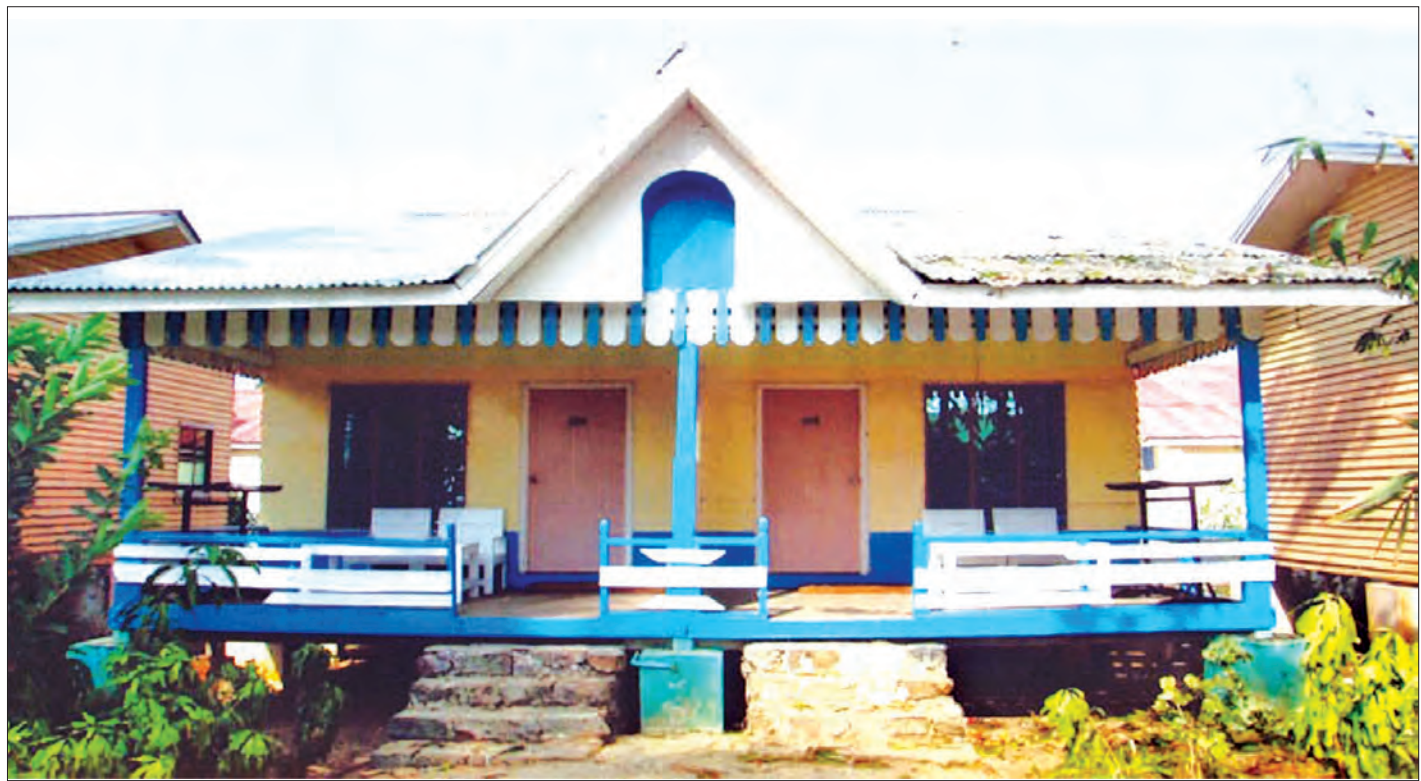
ရာဝတီတိုင်းဒေသကြီးရှိ ငွေဆောင်ယုနေဟိုတယ်အဆောက်အအုံအား တွေ့ရစဉ်

ခရီးသွားကဏ္ဍဖွံ့ဖြိုးတိုးတက်မှုအနေဖြင့် ပုသိမ်၊ ငွေဆောင်၊ ချောင်းသာ၊ ဖျာပုံနှင့် မြတ်မော်တင်စွန်းဒေသများတွင် နိုင်ငံခြားဧည့်သည်များ တည်းခိုနိုင်သည့် အဆင့်မြင့် ဟိုတယ်နှစ်လုံး၊ တည်းခိုရိပ်သာ လေးလုံး၊ အခန်းပေါင်း ၁၇၈ ခန်းအား လုပ်ငန်းလိုင်စင် ချထားခွင့်ပြုဆောင်ရွက်နိုင်ခဲ့သည်။ တိုင်းဒေသကြီးအတွင်း ပြည်တွင်း၊ ပြည်ပ ခရီးသွားဧည့်သည် ဝင်ရောက်မှုမှာ လေးသိန်းခွဲကျော်ရှိသည့်အတွက် ယခင်နှစ်ထက် ၆၉ ရာခိုင်နှုန်း တိုးတက်ဝင်ရောက်လျက်ရှိပြီး ဝင်ငွေရရှိမှုမှာ ပြည်တွင်းကျပ်သန်း ၁၃၁၀၀ ကျော်နှင့် ပြည်ပဒေါ်လာ ၁၆၆၀၀၀ ကျော် ရရှိခဲ့