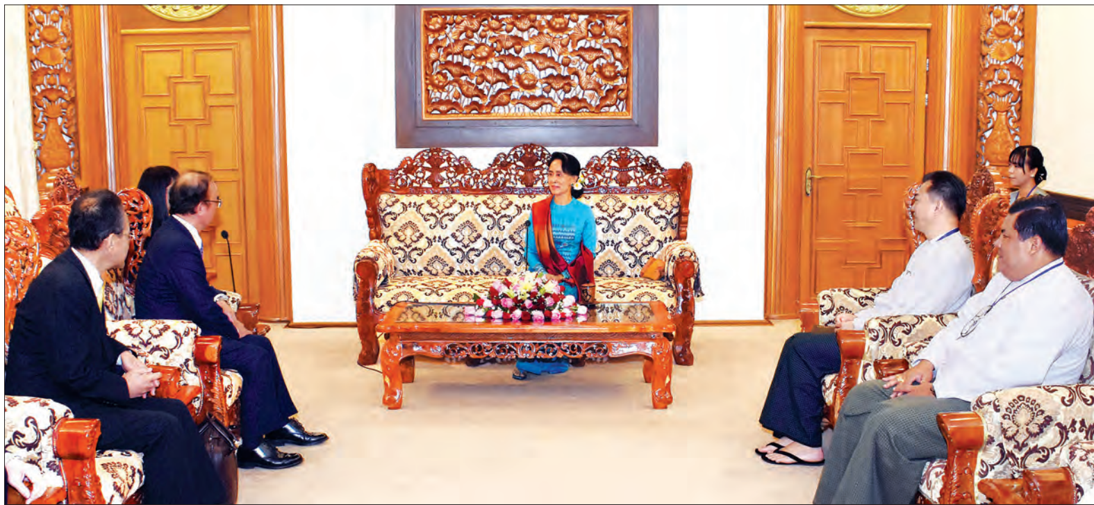
နိုင်ငံတော်၏ အတိုင်ပင်ခံပုဂ္ဂိုလ် ခေါ်အောင်ဆန်းစုကြည် Noritake Co., Ltd ၏ ဥက္ကဋ္ဌ Mr. Tadashi OGURA နှင့်အဖွဲ့အား လက်ခံတွေ့ဆုံစဉ် (သတင်းစဉ်)