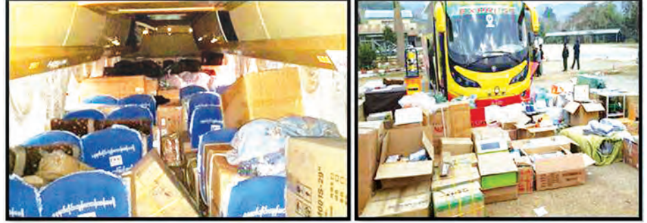
တရားဝင်စာရွက်စာတမ်း တစ်စုံတစ်ရာ တင်ပြနိုင်ခြင်းမရှိသည့် စက်ပစ္စည်းများနှင့် လူသုံးကုန်ပစ္စည်းများ

ရမ်းပြည်နယ် အရှေ့မြောက်ဒေသ ရန်လုံကျိုင်းအနီးပတ်ဝန်းကျင်မှ MNDAA လက်နက်ကိုင်အဖွဲ့များ အသုံးပြုသည့် Airguns သေနတ်နှင့် ခဲယမ်းဆက်စပ်ပစ္စည်းများကို မတ် ၂၁ ရက်က သိမ်းဆည်းရမိခဲ့ကြောင်း သိရသည်။ လောက်ကိုင်မြို့နှင့် အနီးပတ်ဝန်းကျင်တစ်ဝိုက်၌ တပ်မတော်စစ်ကြောင်း များက MNDAA လက်နက်ကိုင်အဖွဲ့များကို ဖြန့်ခွဲထိန်းချုပ်လျက်ရှိရာ မတ် ၂၁ ရက် နံနက် ၁၀ နာရီခွဲက ရန်လုံကျိုင်း ရဲစခန်းအနီးရှိ အဆောက်အအုံများအတွင်း နယ်မြေရှင်းလင်းစဉ် AIR-PORE Airguns တံဆိပ်ပါ Airgun အမျိုးအစား (မှန်ပြောင်းပါ) သေနတ် တစ်လက်၊ ပြိုင်-၂၂ ကျည်အပါအဝင် ကျည်မျိုးစုံ ၁၈၈ တောင်၊ ကျည်အိမ် မျိုးစုံ လေးခု၊ လက်ပစ်ဗုံး လေးလုံးတို့ကို ရှာဖွေတွေ့ရှိ သိမ်းဆည်းရမိခဲ့ကြောင်း သတင်းရရှိသည်။ (သတင်းစဉ်)