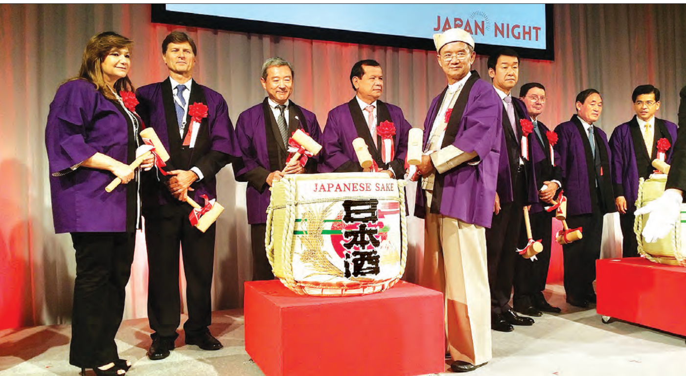
ဂျပန်နိုင်ငံ Tokyo Metropolitan Assembly Federation for Japan Myanmar Friendship ၏ ပံ့ပိုးမှုနှင့် ပထမဆုံး လူစွမ်းအားအရင်းမြစ် အစီအစဉ် Guest Relation တျင်းပစဉ်

မြန်မာ-ထိုင်း နှစ်နိုင်ငံ ခရီးသွားလုပ်ငန်းပူးပေါင်းမှုဆိုင်ရာ နားလည်မှုစာချုပ်လက်မှတ်ရေးထိုးစဉ်