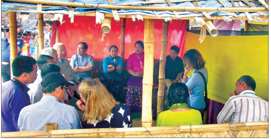
ဘင်္ဂလားဒေ့ရှ်နိုင်ငံ ကော့ခဲဘလားခရိုင် Kutupalong ဒုက္ခသည်စခန်းတွင် IOM အစီအစဉ်ဖြင့် ကော်မရှင်အဖွဲ့ဝင်များ စုံစမ်းမေးမြန်းနေစဉ်