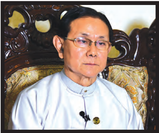
ပြည်ထောင်စုရာထူးဝန်အဖွဲ့ ဥက္ကဋ္ဌ ဒေါက်တာ ဝင်းသိမ်း