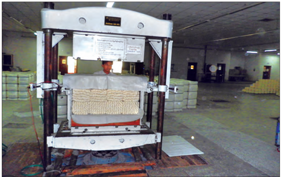
ဘေထုပ်ကြီးစက်

ပြည်သူများ စိတ်ချလုံခြုံစေရေးအတွက် စစ်ဆေးရေးအဖွဲ့ ဖွဲ့စည်းပြီး စနစ်တကျ စစ်ဆေးဆောင်ရွက် ပေးလျက်ရှိသည်။ စက်မှုလယ်ယာကဏ္ဍသို့ ပြောင်းလဲဖော် ဆောင်ရာတွင် အဓိကလိုအပ်ချက်ဖြစ်သည့် လယ်ယာသုံး စက်ပစ္စည်းများနှင့် ယာဉ်၊ ယန္တရားများကို ပြည်သူများ စိတ်ချ လုံခြုံစေရေးအတွက် အသုံးပြုနိုင်ရေးအတွက် မော်တော်ယာဉ် နှင့် လယ်ယာသုံးစက်ပစ္စည်းများ ထုတ်လုပ်မှုကြီးကြပ်ရေးနှင့် စစ်ဆေးရေးအဖွဲ့အား နိုင်ငံတော်သမ္မတရုံး၏ ခွင့်ပြုချက်ဖြင့် ဖွဲ့စည်းခဲ့သည်။