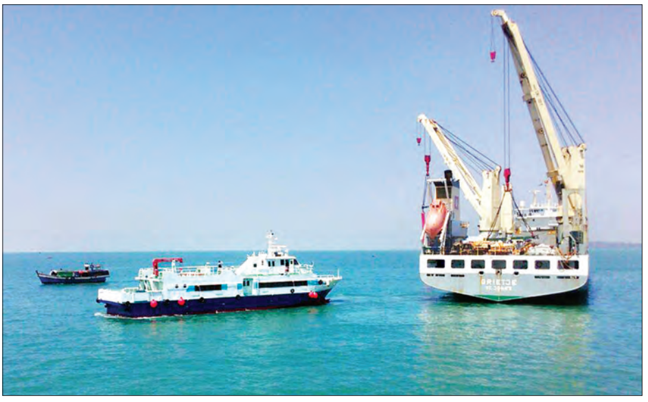
စာမျက်နှာ ၄ ကော်လံ ၁

နေပြည်တော် မတ် ၁၅ ဂျပန်နိုင်ငံက ထောက်ပံ့ပေးအပ်မည့် ယန်းသန်း ၅၀၀ တန်ဖိုးရှိ သော ရေယာဉ်နှစ်စင်းအနက် ယန်း ၂၆၇ ဒသမ ၃၀၀ သန်း တန်ဖိုးရှိ ကစ္ဆပနဒီ (၁) ရေယာဉ်ကို ဂျပန်နိုင်ငံ ကိုဘေးမြို့မှ ရေယာဉ်တင်သင်္ဘော GRIEJ JEဖြင့် တင်ဆောင်လာခဲ့ရာ ကျောက်ဖြူ ဆိပ်ကမ်းအနီးသို့ မတ် ၁၄ ရက် ညနေပိုင်းက ရောက်ရှိရပ်နားခဲ့ပြီး ယနေ့နံနက် ၁၁ နာရီခွဲတွင် ရေယာဉ်တင် သင်္ဘောပေါ်မှ ရေချကာ ငလပွေဆိပ်ကမ်း(ကျောက်ဖြူ)၌ ကျောက်ချရပ်နားထားကြောင်း သိရသည်။ ကစ္ဆပနဒီ (၁) ရေယာဉ်ကို ကိုင်တွယ်ထိန်းသိမ်းမောင်းနှင် မည့် ပြည်တွင်းရေကြောင်းပို့ဆောင်ရေး ရခိုင်ဌာနခွဲမှ ဝန်ထမ်းများအား ကျောက်ဖြူမြို့ ငလပွေဆိပ်ကမ်း၌ ငါးရက်ကြာ လေ့ကျင့်သင်ကြားပေးပြီးနောက် ကစ္ဆပနဒီ (၁) ရေယာဉ်အား စစ်တွေမြို့ သို့ မောင်းနှင်သယ်ဆောင်မည်ဖြစ်ကြောင်း သိရသည်။