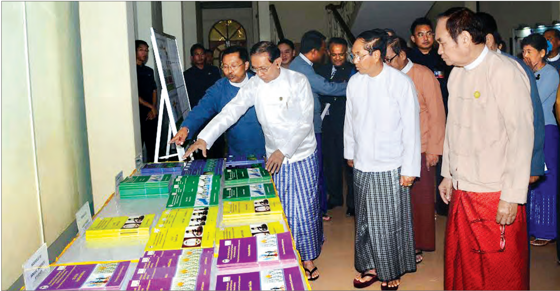
ဒုတိယသမ္မတ ဦးမြင့်ဆွေ မန္တလေးတိုင်းဒေသကြီး ပြင်ဦးလွင်မြို့နယ် ဗဟိုဝန်ထမ်းတက္ကသိုလ် (အထက်မြန်မာပြည်) ရှိ ပြည်သူ့ဝန်ထမ်းအကယ်ဒမီဖွင့်ပွဲ၌ ဗဟိုဝန်ထမ်းတက္ကသိုလ်စာကြည့်တိုက်တွင် ကြည့်ရှုလေ့လာစဉ်

အချုပ်ပို(၁)မှ အမှတ်စဉ်(၁) (Post-Graduate Diploma in Civil Service Management (PGDCSM) ကို စတင်ဖွင့်လှစ် ပို့ချလျက်ရှိပါသည်။