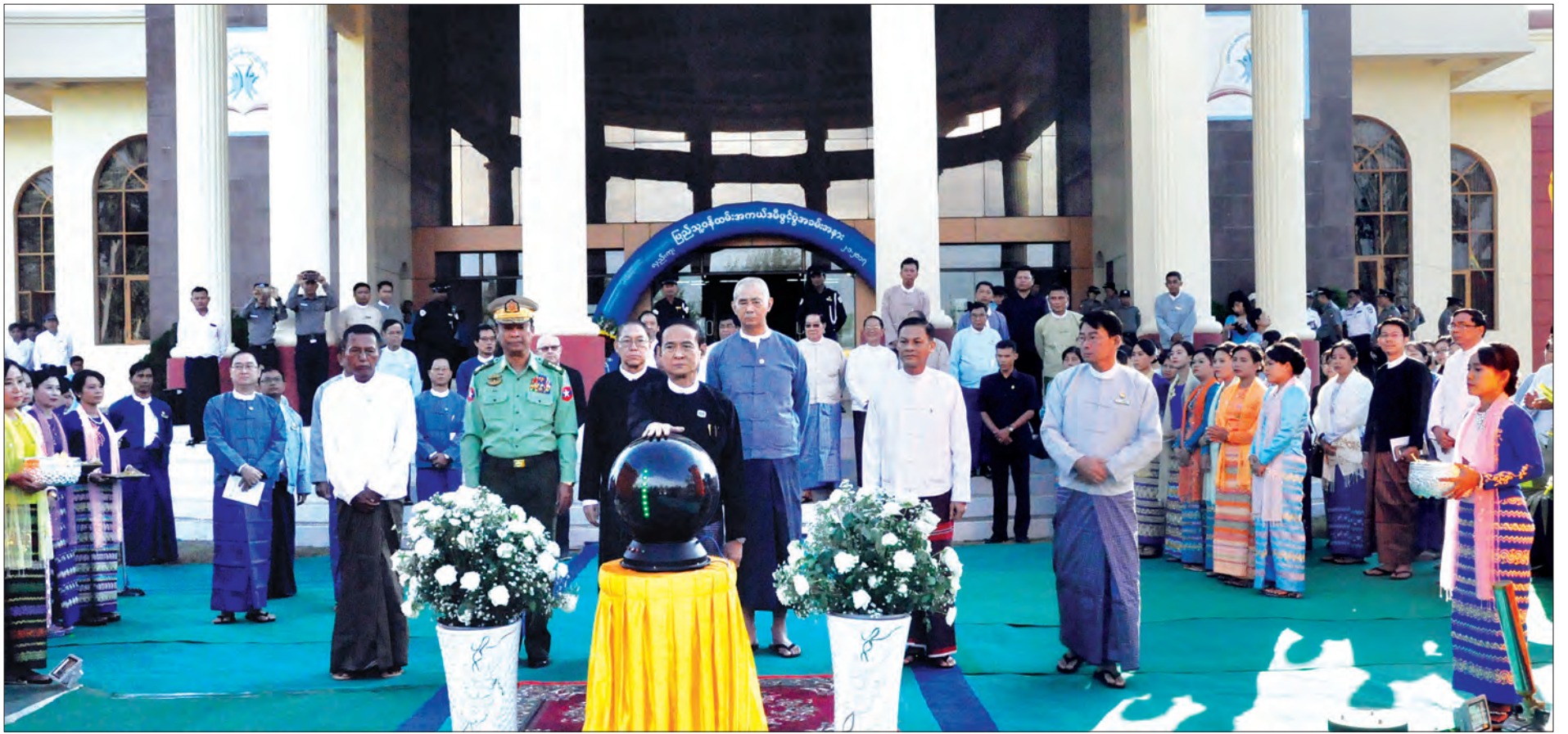
ပြည်သူ့လွှတ်တော်ဥက္ကဋ္ဌ ဦးဝင်းမြင့် ရန်ကုန်တိုင်းဒေသကြီး လှည်းကူးမြို့နယ် ဗဟိုဝန်ထမ်းတက္ကသိုလ် (အောက်မြန်မာပြည်) ရှိ ပြည်သူ့ဝန်ထမ်းအကယ်ဒမီ ကမ္ဘာ့ပွဲများကို စက်ဝလတ်နှိပ်ဖွင့်လှစ်ပေးစဉ်