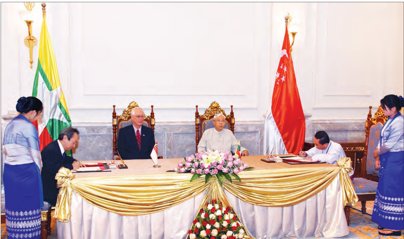
နိုင်ငံတော်သမ္မတ ဦးထင်ကျော်နှင့် ဂုဏ်ထူးဆောင်ဝါရင့်ဝန်ကြီး မစ္စတာ ဂိုချောက်တောင်တို့ရှေ့မှောက်၌ စင်ကာပူ-မြန်မာ သက်မွေးပညာသင်တန်းကျောင်း (SMVTI) တည်ထောင်မှုဆိုင်ရာ နားလည်မှုစာချုပ်လွှာကို ညွှန်ကြားရေးမှူးချုပ် ဒေါက်တာအေးမြင့်နှင့် စင်ကာပူနိုင်ငံသံအမတ်ကြီး မစ္စတာ ရောဘတ်ချွာတို့ လက်မှတ်ရေးထိုးစဉ် (သတင်းစဉ်)

တွေ့ဆုံပွဲအပြီးတွင် နိုင်ငံတော် သမ္မတအိမ်တော်၌ စင်ကာပူ-မြန်မာ သက်မွေးပညာ သင်တန်းကျောင်း (SMVTI) တည်ထောင်မှုဆိုင်ရာ နားလည်မှု စာချုပ်လွှာ ထပ်မံသက်တမ်း တိုး လက်မှတ်ရေးထိုးပွဲအခမ်းအနားကို ဆက်လက်ကျင်းပရာ ပညာရေးဝန်ကြီး ဌာန၊ နည်းပညာ၊ သက်မွေးပညာနှင့် လေ့ကျင့်ရေးဦးစီးဌာန ညွှန်ကြားရေးမှူးချုပ် ဒေါက်တာအေးမြင့်နှင့် စင်ကာပူနိုင်ငံ သံအမတ်ကြီး မစ္စတာ ရောဘတ်ချွာတို့ က နိုင်ငံတော်သမ္မတ ဦးထင်ကျော်နှင့် ဂုဏ်ထူးဆောင် ဝါရင့်ဝန်ကြီး မစ္စတာ ဂိုချောက်တောင်တို့ရှေ့မှောက်၌ နှစ်နိုင်ငံ