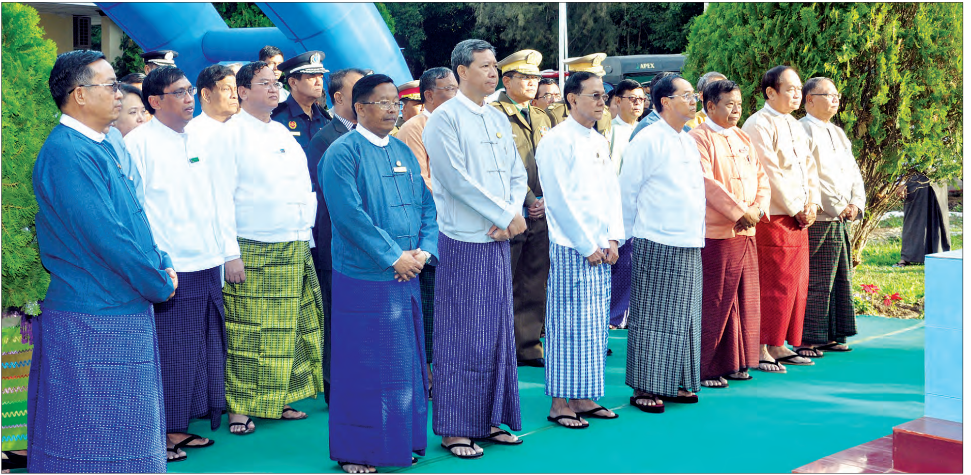
ဒုတိယသမ္မတ ဦးမြင့်ဆွေနှင့် တာဝန်ရှိသူများ မန္တလေးတိုင်းဒေသကြီး ပြင်ဦးလွင်မြို့နယ် ဗဟိုဝန်ထမ်းတက္ကသိုလ် (အထက်မြန်မာပြည်) ရှိ ပြည်သူ့ဝန်ထမ်းအကယ်ဒမီဖွင့်ပွဲအခမ်းအနားသို့ တက်ရောက်စဉ်

အချုပ်ပိုင်(ဆ)မှ ဆွေးနွေးပွဲ၊ ပြည်သူ့ဝန်ထမ်း ပြုပြင်ပြောင်းလဲမှုဆိုင်ရာ မဟာဗျူဟာစီမံချက်ရေးအဖွဲ့အတွက် ပြန်လည်သုံးသပ်တဲ့ ဒုတိယ အကြိမ်မြောက် အုပ်စုလိုက်အလုပ်ရုံဆွေးနွေးပွဲများ၊ ပြည်သူ့ဝန်ထမ်းများရဲ့လုပ်ငန်းကျွမ်းကျင်မှု အရည်အသွေးသတ်မှတ်ချက် မူဘောင်ရေးဆွဲရေးအလုပ်ရုံဆွေးနွေးပွဲ၊ ပြည်သူ့ဝန်ထမ်းများ ပြုပြင်ပြောင်းလဲမှုဆိုင်ရာ မဟာဗျူဟာစီမံချက်ရေးဆွဲရေးအတွက် ပြန်လည်သုံးသပ်တဲ့ တတိယအကြိမ်မြောက်အုပ်စုလိုက်အလုပ်ရုံဆွေးနွေးပွဲ၊ ပြည်သူ့ဝန်ထမ်းကဏ္ဍမှာ ကိုယ်ကျင့်သိက္ခာ၊ အရည်အချင်းအလိုက် ချီးမြှင့်မြှောက်စားမှုနှင့် တန်းတူအခွင့်အရေးရရှိမှုများကို တိုးတက်စေဖို့ စိတ်အားထက်သန်တက်ကြွမှုကို အားပေးခြင်းဆိုင်ရာ အသိပညာမျှဝေမှုစီရမ်းအာဆီယံနိုင်ငံတွေမှာ ကျင့်သုံးနေတဲ့ ပြည်သူ့ဝန်ထမ်းများရဲ့ ကျင့်ဝတ်၊ တန်းတူညီမျှအခွင့်အရေးနှင့် အရည်အချင်းအပေါ်မူတည်၍ တာဝန်ပေးအပ်ခြင်းဆိုင်ရာအမြင်ချင်းဖလှယ်တဲ့ အလုပ်ရုံဆွေးနွေးပွဲ၊ ခေါင်းဆောင်မှုစွမ်းရည်ဖွံ့ဖြိုးတိုးတက်ရေး အစီအစဉ်ဆိုင်ရာ အကြံပြုအလုပ်ရုံဆွေးနွေးပွဲ၊ ဗဟိုဝန်ထမ်း