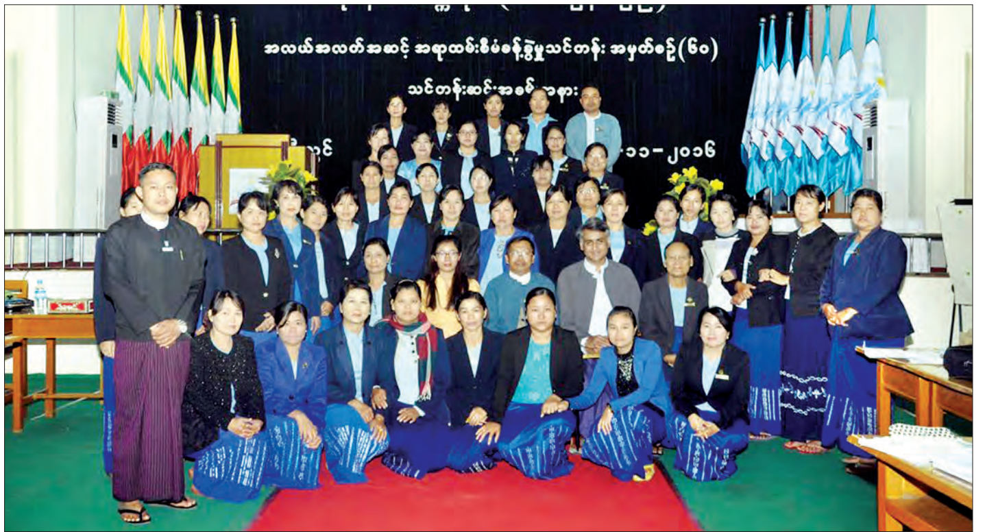
ဗဟိုဝန်ထမ်းတက္ကသိုလ် (အထက်မြန်မာပြည်)၌ အလယ်အလတ်အဆင့် အရာထမ်း၊ အမှုထမ်း စီမံခန့်ခွဲမှုသင်တန်းဆင်းပွဲ၌ စုပေါင်းဓာတ်ပုံရိုက်စဉ်

ဖြေ။ ။ ဌာနတွင်းက ဝန်ထမ်းတွေကို ပြန်လဲအရာရှိ အဆင့်သို့ ရာထူးတိုးမြှင့်ပေးရာမှာ ပြဋ္ဌာန်းချက် တွေအညီ လုပ်သက်သတ်မှတ်ချက်ကို လျော့ပေါ့၍ ရာထူး တိုးမြှင့်ခန့်ထားမယ်ဆိုရင် လစ်လပ်ရာထူးရဲ့ သုံးပုံတစ်ပုံ အတွက်သာ တိုးမြှင့်ခန့်ထားပေးပါတယ်။ ပညာအရည်အချင်းနဲ့ ကျွမ်းကျင်မှုအရည်အချင်းတွေကို လျော့ပေါ့ပြီး ရာထူးတိုးမြှင့်