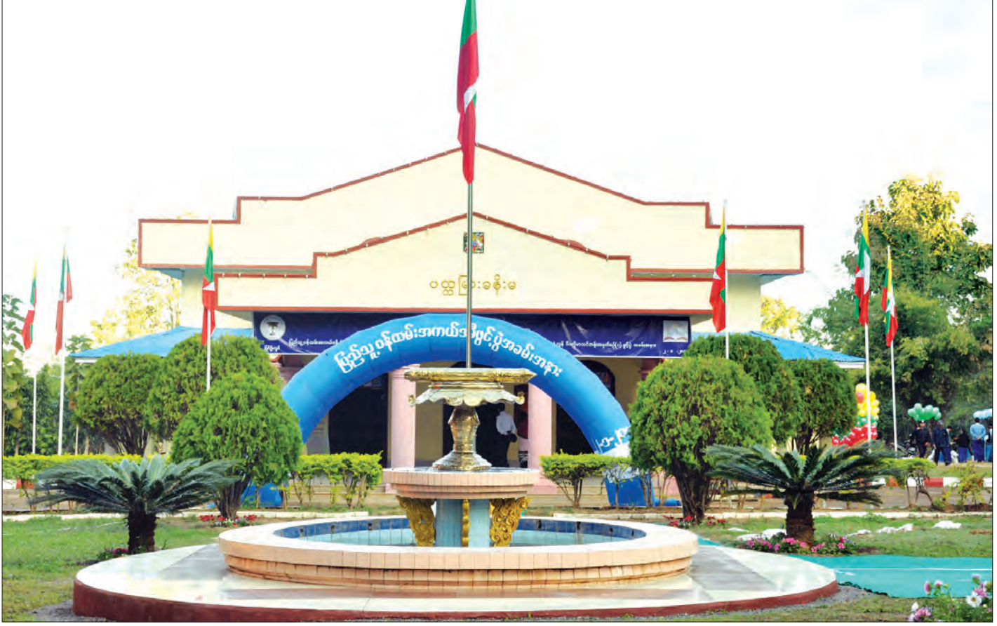
ပြည်သူ့ဝန်ထမ်းအကယ်ဒမီဖွင့်ပွဲအခမ်းအနား ကျင်းပမည့် ပတ္တမြားခန်းမ