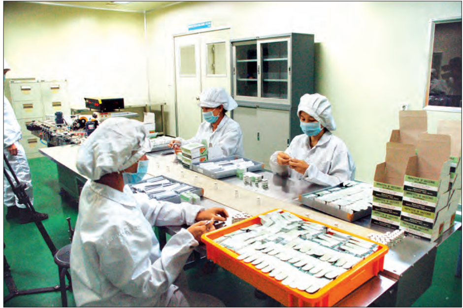
စက်မှုဝန်ကြီးဌာနမှ ထုတ်လုပ်သော ဆေးဝါးများ ထုပ်ပိုးနေစဉ်

သုတေသနနှင့် ဆန်းသစ်တီထွင်မှုများပြုလုပ်ပြီး ထုတ်ကုန်အရည်အသွေး တိုးတက်ကောင်းမွန်စေရေးအတွက် စက်မှုဝန်ကြီးဌာန ဆေးဝါးစက်ရုံများအနေဖြင့် အစိုးရသစ်တာဝန်ယူသည့် ပထမနှစ်အတွင်း ဆေးဝါးအမယ်သစ် ၁၂ မျိုးကို စမ်းသပ်ထုတ်လုပ်ခဲ့သည်။ သိုး၏သွေးအရည်ကြည်မှ ထုတ်လုပ်သည့် မြေပွေးအဆိပ်ခြေဆေးကို စမ်းသပ်စစ်ဆေးမှုများအောင်မြင်၍ အစားအသောက်နှင့် ဆေးဝါးကွပ်ကဲရေးဦးစီးဌာန (FDA) ခွင့်ပြုချက်ဖြင့် ဈေးကွက်အတွင်း ဖြန့်ဖြူးရောင်းချလျက်ရှိ