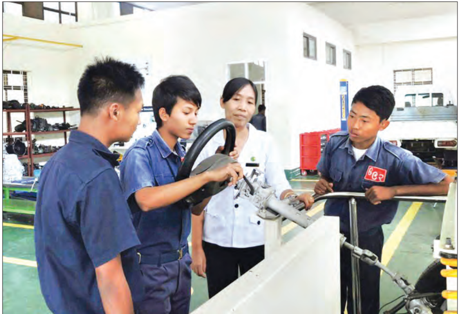
စက်မှုသင်တန်းကျောင်းများတွင် သင်တန်းသားများ မော်တော်ယာဉ်အစိတ်အပိုင်းများဖြင့် လေ့ကျင့်နေစဉ်

အသေးစားနှင့် အလတ်စားစီးပွားရေးလုပ်ငန်းများ (SME)အား ငွေကြေးအရင်းအနှီးရရှိစေရန် ပံ့ပိုးပေးနိုင်ရေးအတွက် နိုင်ငံတော်၏ချေးငွေဖြင့် လုပ်ငန်းရှင် ၄၅၆ ဦး၊ ဂျပန်နိုင်ငံ၏ Two Step Loan ချေးငွေဖြင့် လုပ်ငန်းရှင် ၁၈၉ ဦး