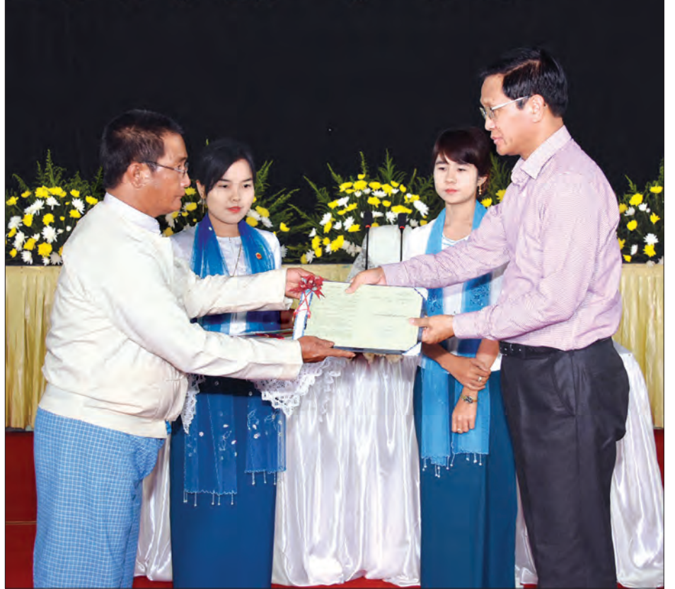
ဒုတိယသမ္မတ ဦးဟင်နရီဗန်ထီးယူ မူလတောင်သူများကိုယ်စား တောင်သူတစ်ဦးအား လယ်ယာမြေလုပ်ပိုင်ခွင့်ပြု လက်မှတ် ပုံစံ(၇)များ ပေးအပ်စဉ် (သတင်းစဉ်)