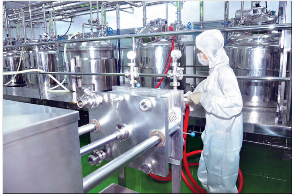
မြေဆိပ်ခြေဆေး အဆင့်ဆင့်ထုတ်ယူမှုကို တွေ့ရစဉ်

အတွက် ကျွမ်းကျင်လုပ်သားများ မွေးထုတ် ပေးရေးအစီအစဉ်များကို ဆောင်ရွက်နိုင်ခဲ့ပါတယ်။ ဒီလိုဆောင်ရွက်ချက်တွေထဲက ပြည်သူလူထုအတွက် အထိရောက်ဆုံးနဲ့ အောင်မြင်မှုအရှိဆုံးတစ်ခုကို ရွေးထုတ်တင်ပြရမယ်ဆိုရင် ကျန်းမာရေးကဏ္ဍအတွက် ပံ့ပိုးပေးနိုင်ခဲ့မှုကို ဦးစားပေးတင်ပြရမှာ ဖြစ်ပါတယ်” ဟု ပြောသည်။