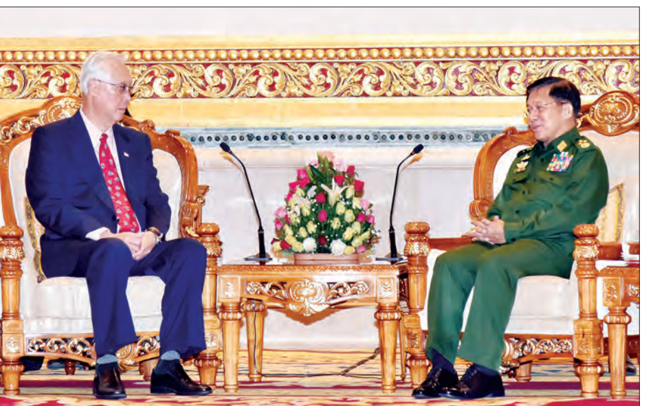
တပ်မတော်ကာကွယ်ရေးဦးစီးချုပ် ဗိုလ်ချုပ်မှူးကြီး မင်းအောင်လှိုင်နှင့် စင်ကာပူသမ္မတနိုင်ငံ ဂုဏ်ထူးဆောင်ဝါရင့်ဝန်ကြီး မစ္စတာ ဂိုချောက်တောင်တို့ တွေ့ဆုံဆွေးနွေးစဉ်

ဒီဇင်ဘာထွန်းအား ဆေးရုံရှိ အထူးကုဆရာဝန်ကြီးများက နားပိုင်းဆိုင်ရာနှင့် နှလုံးပိုင်းဆိုင်ရာ စစ်ဆေးနေမှုကိုကြည့်ရှုပြီး လိုအပ်သည့် စစ်ဆေးကုသမှုဆိုင်ရာများအား ပြည့်စုံစွာဆောင် ရွက်ပေးရေး မှာကြားသည်။