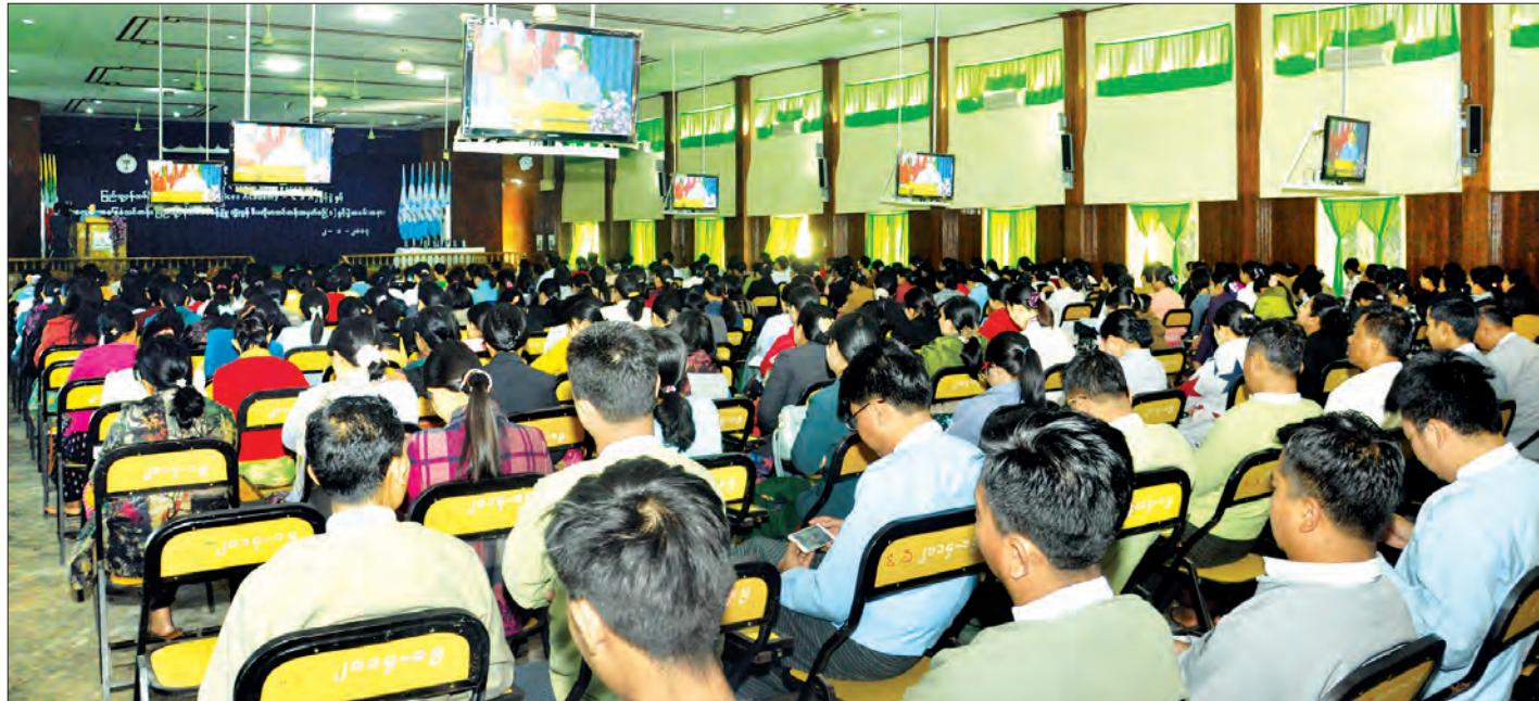
ပြည်သူ့ဝန်ထမ်း စီမံခန့်ခွဲမှု ဘွဲ့လွန်ဒီပလိုမာသင်တန်း ဖွင့်ပွဲအခမ်းအနားကျင်းပစဉ်

ဇနီးသည် ဝန်ထမ်းမဟုတ်တဲ့ အမျိုးသားဝန်ထမ်းတွေအတွက်လည်း ကလေးပြုစောင့်ရှောက်ခွင့် ရက်သတ္တနှစ်ပတ်အချုပ်ပို(ဆ)သို့