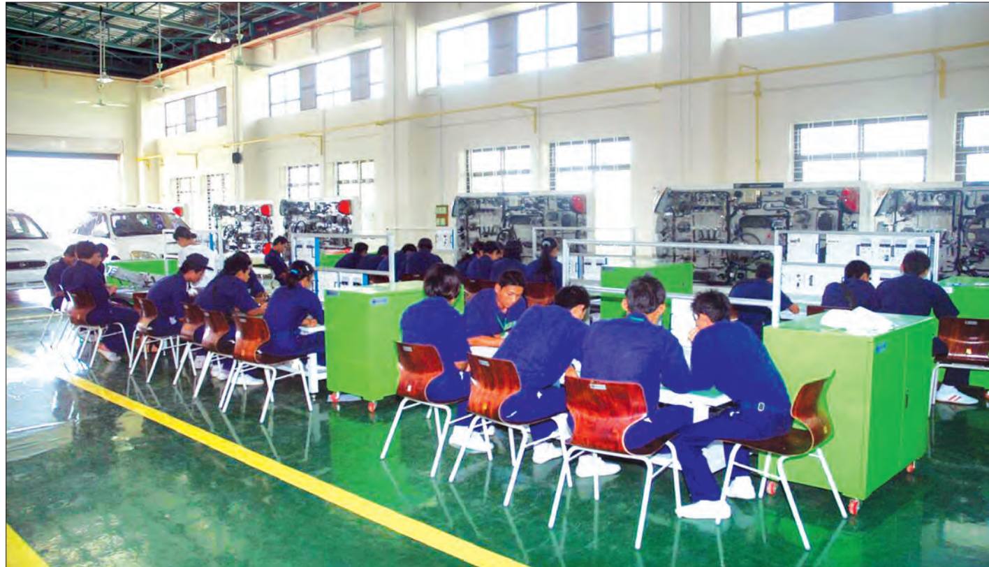
စက်မှုသင်တန်းကျောင်း၌ သင်တန်းသား သင်တန်းသူများ စက်မှုနည်းပညာများ လက်တွေ့လေ့ကျင့်နေစဉ်

တို့အား ချေးငွေ ထောက်ပံ့ပေးနိုင်ခဲ့သည်။ ဗဟိုဘဏ်ဥပဒေအရ ချေးငွေကာလမှာ တစ်နှစ်ဖြစ်သော်လည်း နိုင်ငံတော်အထူးချေးငွေ ဂျပန်နိုင်ငံ၏ Two Step Loan ချေးငွေတို့ဖြင့် ငါးနှစ်ကာလအထိ ထုတ်ချေးပေးနိုင်ခဲ့ပြီး လုပ်ငန်းရှင်များ၏ ရင်းနှီးလည်ပတ်မှုအားကောင်းလာစေရန် ပံ့ပိုးပေးနိုင်ခဲ့သည်။ အပေါင်ပစ္စည်း မရှိသည့်လုပ်ငန်းများအတွက် ချေးငွေအာမခံလုပ်ငန်း Credit Guarantee Insurance - CGI စနစ်ဖြင့် ချေးငွေရရှိစေရေး ဆောင်ရွက်ပေးလျက်ရှိရာ CB Bank ၊ မြန်မာ့အာမခံလုပ်ငန်း၊ အသေးစားနှင့် အလတ်စား စီးပွားရေးလုပ်ငန်းများ ဖွံ့ဖြိုးတိုးတက်ရေးဌာနတို့ ပူးပေါင်း၍ လုပ်ငန်းရှင် ၁၂ ဦးအား CGI စနစ်ဖြင့် ချေးငွေထုတ်ပေးနိုင်ခဲ့ပြီး ချေးငွေရရှိရေးအတွက် လုပ်ငန်းရှင် ၆၄၆ ဦးအား ထောက်ခံချက်ပေးပြီးဖြစ်သည်။