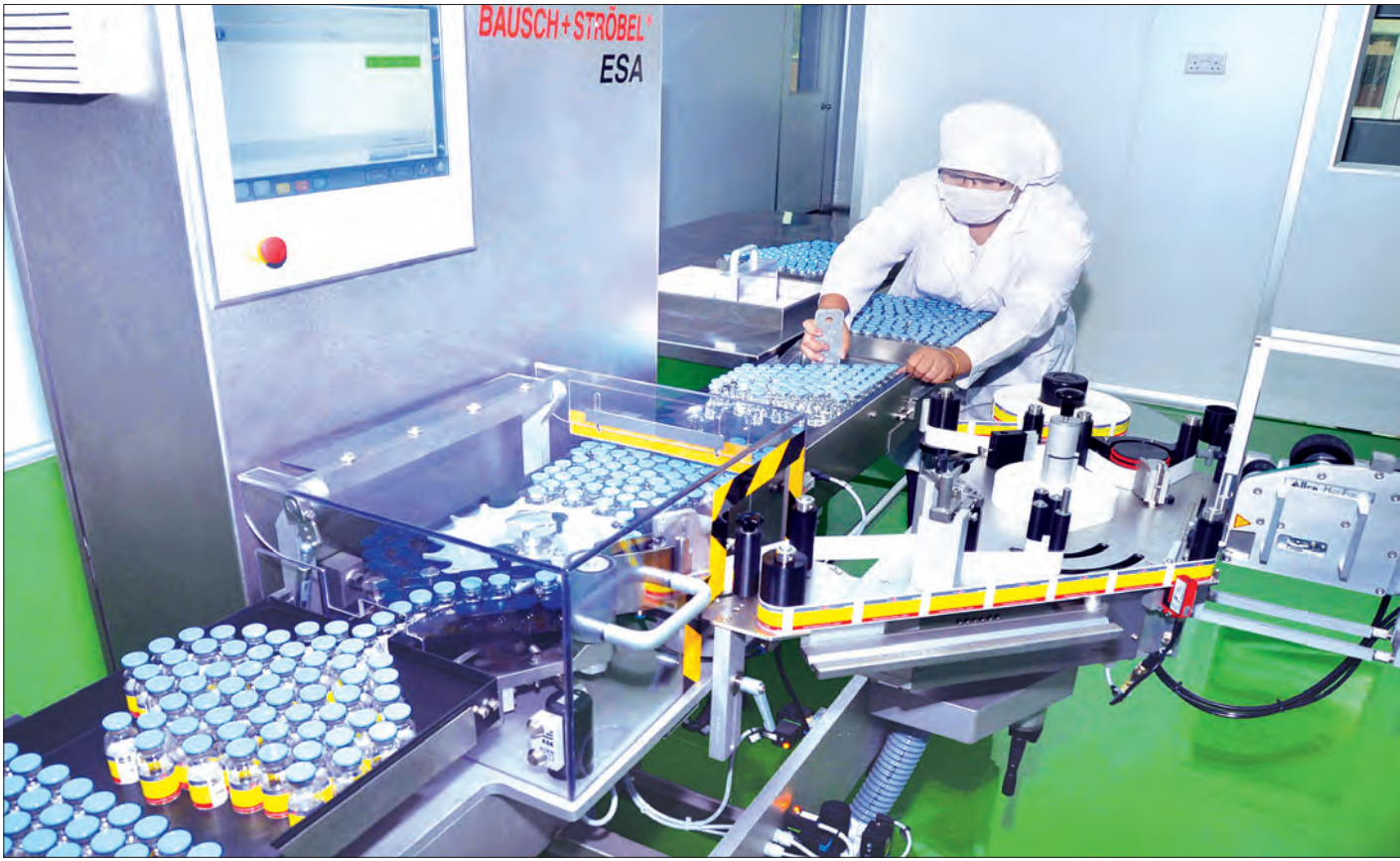
မြေဆိပ်ခြေဆေးများ ထုတ်ယူထုပ်ပိုးနေစဉ်