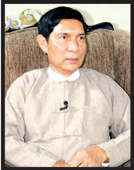
စက်မှုဝန်ကြီးဌာန ပြည်ထောင်စုဝန်ကြီး ဦးခင်မောင်ချို

ပြည်သူ့က တစ်ခဲနက်ရွေးချယ်တင်မြှောက်ခဲ့သော ပြည်သူ့အစိုးရသစ်၏ သက်တမ်းတစ်နှစ်ပြည့်မြောက်ခဲ့ပြီဖြစ်သည်။ တစ်နှစ်တာကာလအတွင်း နိုင်ငံ၏ နိုင်ငံရေး၊ စီးပွားရေး၊ လူမှုရေးနယ်ပယ်အသီးသီးတွင် ဖွံ့ဖြိုးတိုးတက်မှုရရှိစေရန် ပြုပြင်ပြောင်းလဲမှုများပြုလုပ်ကာ နိုင်ငံတည်ဆောက်ရေးလုပ်ငန်းများကို အားကြီးမာန်တက်ဆောင်ရွက်ခဲ့သည့် ပြည်သူ့အစိုးရ၏ ပြည်သူ့အတွက် ကြိုးပမ်းဆောင်ရွက်မှုများမှာ အားလုံးကောင်းမွန်အောင်မြင်ပါသည်ဟူ၍ မဆိုနိုင်သေးသည့်တိုင် သိသာထင်ရှားစွာမြင်တွေ့နိုင်သည့် အောင်မြင်မှုများ၊ မမြင်တွေ့နိုင်သည့် အောင်မြင်မှုများ၊ စိန်ခေါ်မှုများနှင့် ရုန်းကန်နေရဆဲလုပ်ငန်းစဉ်များဟူ၍ တွေ့ရမည်ဖြစ်သည်။ နိုင်ငံတော်အစိုးရ၏ ပထမတစ်နှစ်တာကာလအတွင်း ပြည်သူများအတွက် ကြိုးပမ်းဆောင်ရွက်မှုများကို ဝန်ကြီးဌာနများ၊ ပြည်ထောင်စုအဆင့်အဖွဲ့အစည်းများ၊ တိုင်းဒေသကြီးနှင့် ပြည်နယ်များအလိုက် မှတ်တမ်းပြုတင်ပြအပ်ပါကြောင်း။