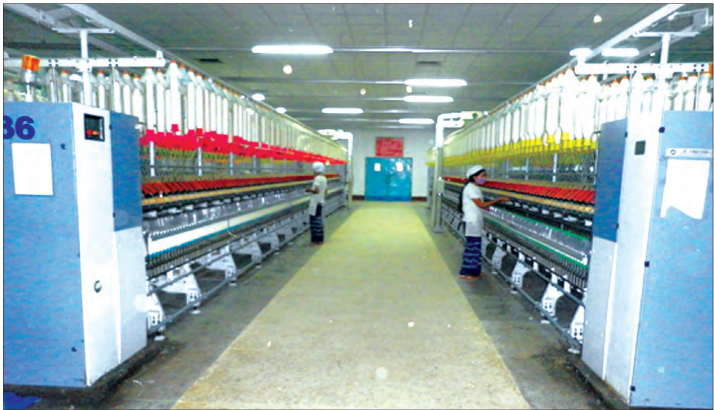
အမှတ်(၇)အထည်စက်ရုံ(မြစ်သား)၌ ထုတ်လုပ်လျက်ရှိသော ဈေးကွက်ဝင် အဆင့်မြင့် ၁/၄၀ ချည် ထုတ်လုပ်မှုကို တွေ့ရစဉ်

ကျန်းမာရေးနှင့် အားကစားဝန်ကြီးဌာနအောက်ရှိ