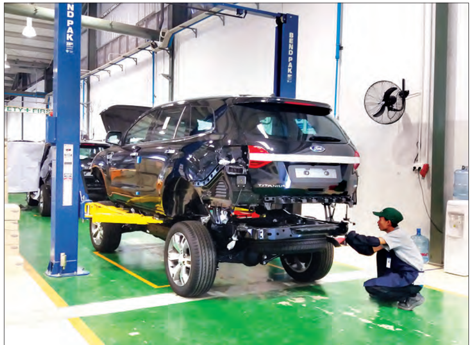
ကားကိုယ်ထည်အစိတ်အပိုင်းများကို တပ်ဆင်နေစဉ်

သို့လည်း သွားရောက်လေ့ကျင့် သင်ကြားပေးခဲ့ပြီး စက်မှုဇုန် လုပ်သားများ၏ ကျွမ်းကျင်မှု Skill ကို မြှင့်တင်ပေးနိုင်ခဲ့သည်။ လယ်ယာသုံးစက်ပစ္စည်းများနှင့် ယာဉ်၊ ယန္တရားများကို