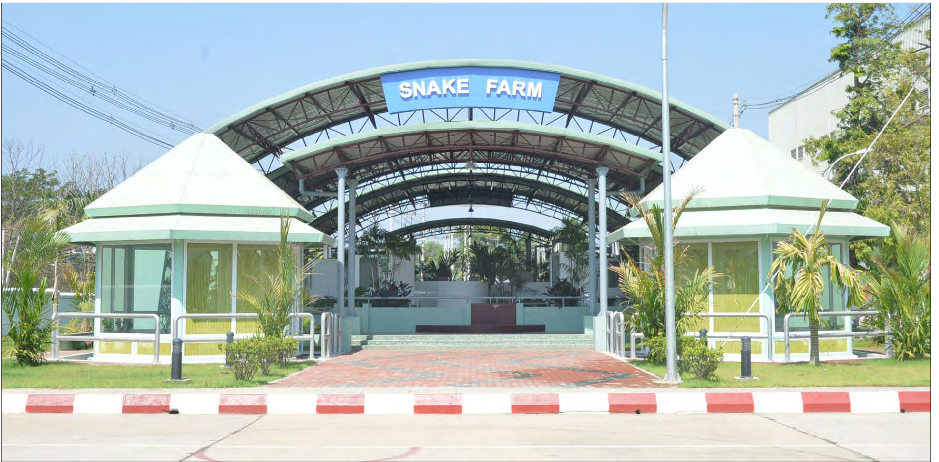
စက်မှုဝန်ကြီးဌာနအောက်ရှိ မြေဆိပ်ဖြေဆေးစက်ရုံကို တွေ့ရစဉ်