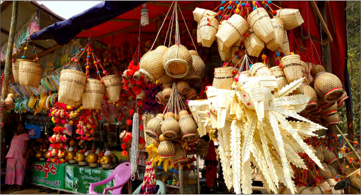
ဘုရားပွဲတော်ရှိ ဆိုင်ခန်းတစ်ခန်းတွင် ရောင်းချနေသည့် ထန်းရွက်ငါးရုပ်များ အပါအဝင် မြန်မာမှုလက်ရာပစ္စည်းများ

အကြောင်းစန့်၍ ပုဂံပြည်မှ မိုင်းမော်ပြည်သို့ မင်းသမီးစောမွန်လှ ပြန်ရမည့်ခရီးပေါ်လာသောကြောင့် ညောင်ဦးရွာ၊ ညဉ့်ရွာ၊ ပလင်း၊ လက်ထုတ်၊ ကောင်းစည်ရွာ၊ တုရွင်းတောင်၊ ကျွန်းဘားရွာများကို ဖြတ်သန်း၍ ခရီးနှင့်ခဲ့လေသည်။ ရွှေစာရံကျေးရွာနှင့် မနီးမဝေး ပန်းချောင်း(ယခု နားငောင်းကျချောင်း) နားသို့ ရောက်သောအခါ မင်းသမီးစောမွန်လှ၏ နားငောင်းသည် ချောင်းအတွင်းကျကာ ချောင်း