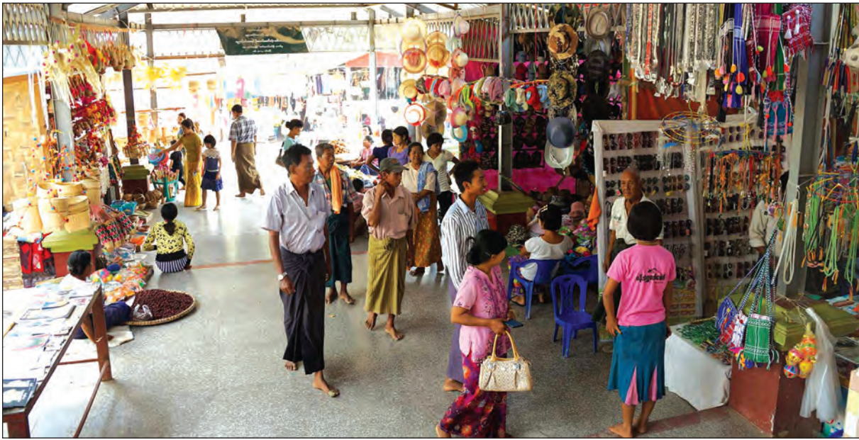
ရွှေစာရံဘုရားပွဲတော်နေ့ ဘုရားပွဲတော်အနီးအနားတွင် ထန်းရည်၊ အရက်၊ ဘီယာဆိုင်များ အများအပြား ဖွင့်လှစ်ရောင်းချလေ့ရှိခြင်းပင်ဖြစ်သည်။

ရွှေစာရံဘုရားပွဲတော်သည် အညာဒေသ ဘုရားပွဲတော်များထဲတွင် ထင်ရှားသည့် ဘုရားပွဲတော်တစ်ခုဖြစ်သည်။ အရှေ့ ရွှေစာရံ ပုဂံ အနောက်၊ တောင်မြောက်ယင်မြော် (မြော်)၊ အညာသီဟတောဟု မော်ကွန်းတင်ထားသည့် ကျော်လေးဆူတွင် ပါဝင်ကာ တန်ခိုးကြီးထင်ရှားလှသည့် ရွှေစာရံဘုရား၏ ပုဒ္ဓူပဇနိယပွဲတော်ကာလဖြစ်သည့် တပေါင်းလပြည့်နေ့မှ တပေါင်းလပြည့်ကျော် ၉ ရက်အတွင်း ရွှေစာရံစေတီတော်အား သွားရောက်ဖူးမြော်ကြည်ညိုခြင်းဖြင့် ထင်ရှားသည့် အညာဒေသ ဘုရားပွဲတော်တစ်ခုကိုလည်း လေ့လာနိုင်ကြမည်ဖြစ်ပေသည်။