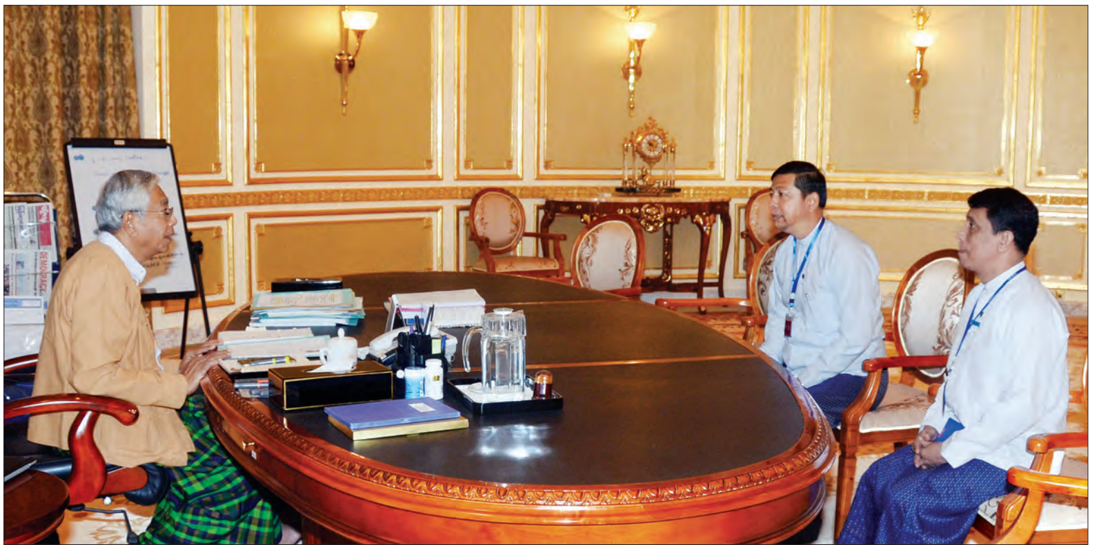
နိုင်ငံတော်သမ္မတ ဦးထင်ကျော်ထံမှ သံအမတ်ကြီးဦးစိန်ဦးနှင့် ဦးကိုကိုနိုင် တို့ ဩဝါဒနှင့် လမ်းညွှန်မှုခံယူစဉ် (သတင်းစဉ်)

နိုင်ငံတော်သမ္မတ ဦးထင်ကျော်ထံသို့ မလေးရှားနိုင်ငံ သံအမတ်ကြီးအဖြစ် ခန့်အပ်ပြီးဖြစ်သော ဦးစိန်ဦးနှင့် လာအို ဒီမိုကရက်တစ် သမ္မတနိုင်ငံ သံအမတ်ကြီး အဖြစ် ခန့်အပ်ပြီးဖြစ်သော ဦးကိုကိုနိုင် တို့သည် ယနေ့ နံနက် ၁၀ နာရီတွင် နိုင်ငံတော်သမ္မတအိမ်တော်ရှိ သမ္မတ ရုံးခန်း၌ လာရောက်တွေ့ဆုံပြီး နိုင်ငံတော် သမ္မတ၏ ဩဝါဒနှင့် လမ်းညွှန်မှုခံယူ ခဲ့ကြသည်။ (သတင်းစဉ်)