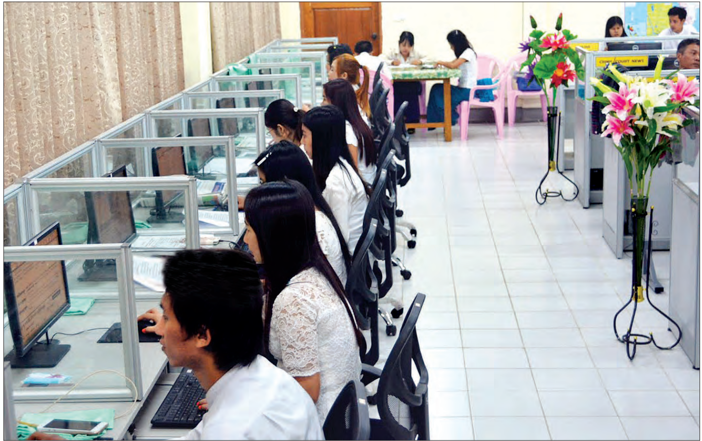
မြန်မာ့အလင်းသတင်းစာတိုက် သတင်းခန်းကို တွေ့ရစဉ်

သတင်းများကို သတင်းဦးအဖြစ် ပြည်သူ့ထံတင်ပြခြင်းများဖြင့် ကြိုးပမ်းဆောင်ရွက်လျက်ရှိပါသည်။ ပြည်ပသတင်းဌာနကြီးများနှင့် သတင်းများဖလှယ်၍ အသုံးပြုနိုင်ခဲ့ပြီး ရိုက်တာသတင်းဌာနမှလည်း သတင်းများကို ဘဏ္ဍာနှစ်တစ်နှစ်စာအတွက် အမေရိကန်ဒေါ်လာ ၁၉၂၀၀ ဖြင့် ဝယ်ယူ၍ သတင်းစာများအတွင်း ထည့်သွင်းဖော်ပြနိုင်ခြင်းဖြင့် နိုင်ငံတကာ ထူးခြားဖြစ်စဉ်များကို ပြည်သူများ မျက်မြင်မပြတ် သိရှိခွင့်ရရှိစေသည်။