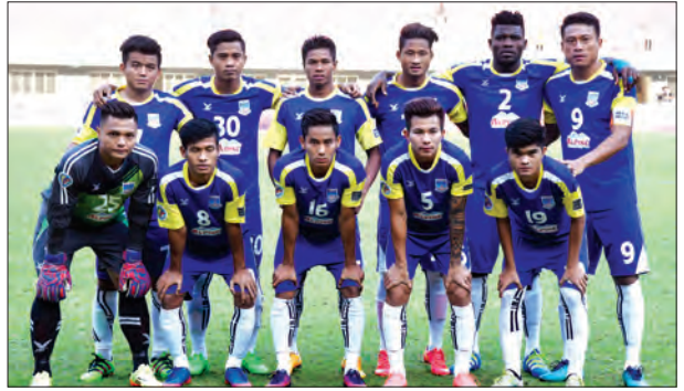
AFC Cup ပြိုင်ပွဲ ယှဉ်ပြိုင်နေသည့် ရတနာပုံအသင်း