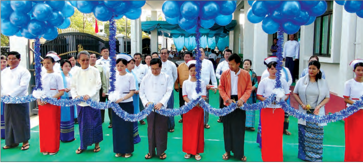
မတ် ၄ ရက်က လူမှုစုလုံခြုံရေးအဖွဲ့နှင့် Care Well Medical Co., Ltd တို့ပူးပေါင်း၍ ရန်ကုန်တိုင်းဒေသကြီး မင်္ဂလာဒုံမြို့နယ်တွင် လူမှုစုလုံခြုံရေး ကာကွယ်ဆေးခန်းအသစ် ဖွင့်ပွဲအခမ်းအနား၌ အလုပ်သမား၊ လူဝင်မှုကြီးကြပ်ရေးနှင့် ပြည်သူ့အင်အားဝန်ကြီးဌာန ပြည်ထောင်စုဝန်ကြီး ဦးသိန်းဆွေနှင့် တာဝန်ရှိသူများက ဖဲကြိုးဖြတ် ဖွင့်လှစ် ပေးစဉ် (၅-၃-၂၀၁၇ ရက် နေ့ထုတ် မြန်မာ့အလင်းသတင်းစာ စာမျက်နှာ-၈ တွင် ဖော်ပြခဲ့သည်။ “အာမခံထားသူ အလုပ်သမားများ ကျန်းမာရေးစောင့်ရှောက်မှုနှင့် အကျိုးခံစားခွင့်များ ထောက်ပံ့ပေး” သတင်း၌ သတင်းဓာတ်ပုံများယွင်းပါရှိသွားသည့်အတွက် တောင်းပန်အပ်ပါကြောင်းနှင့် အဆိုပါသတင်းတွင် ယခုဖော်ပြပါ သတင်းဓာတ်ပုံနှင့် ပူးတွဲဖတ်ရှုပေးပါရန် မေတ္တာရပ်ခံအပ်ပါသည်။ စာတည်း-မြန်မာ့အလင်း (သတင်းစဉ်)

ပညာရေးဘွဲ့ စာပေးစာယူ အနီးကပ်သင်တန်းဖွင့်မည် ရန်ကုန် မတ် ၇ ၂၀၁၆-၂၀၁၇ ပညာသင်နှစ် ပညာရေးဘွဲ့ စာပေးစာယူသင်တန်းသားများ ကိုယ်တိုင်တက်ရောက်ရမည့် နေရာသီအနီးကပ်သင်တန်းနှင့် ဖြေဆိုရမည့် စာမေးပွဲများကို ရန်ကုန်ပညာရေးတက္ကသိုလ်၌ ကျင်းပမည်ဖြစ်သည်။ အမှတ်စဉ်(၃၅) ပထမနှစ်သင်တန်းနှင့် အမှတ်စဉ်(၃၄) ဒုတိယနှစ်သင်တန်း များကို ၂၀၁၇ ခုနှစ် ဧပြီ ၂၆ ရက်မှ မေ ၁၇ ရက်အထိ အနီးကပ်သင်တန်းများ ဖွင့်လှစ်သင်ကြားပြီး စာမေးပွဲကို မေ ၂၂ ရက်မှ မေ ၂၆ ရက်အထိ ကျင်းပမည် ဖြစ်သည်။ သင်တန်းတက်ရောက်ရန်အတွက် ၂၀၁၇ ခုနှစ် ဧပြီ ၂၅ ရက် (အင်္ဂါနေ့) နောက်ဆုံးထား သတင်းပို့ရမည်ဖြစ်ကြောင်း သတင်းရရှိသည်။ (သတင်းစဉ်)