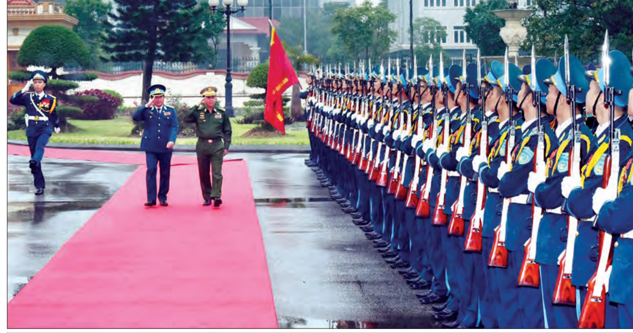
တပ်မတော်ကာကွယ်ရေးဦးစီးချုပ် ဝိယက်နမ်တပ်မတော်အောင်လှိုင်နှင့် ဝိယက်နမ်လေတပ်ဦးစီးချုပ်တို့သည် ဂုဏ်ပြုတင်ဖွဲ့ခံ အလေးပြုခြင်းကိုခံယူပြီး ဂုဏ်ပြုတင်ဖွဲ့အား စစ်ဆေးစဉ် (သတင်းစဉ်)

ယင်းနောက် မြန်မာ့တပ်မတော်ချစ်ကြည်ရေးကိုယ်စားလှယ်အဖွဲ့အား Viettel Group ဌာနချုပ်တွင် နေ့လယ်စာဖြင့် တည်ခင်းပေးခဲ့သည်။ (သတင်းစဉ်)