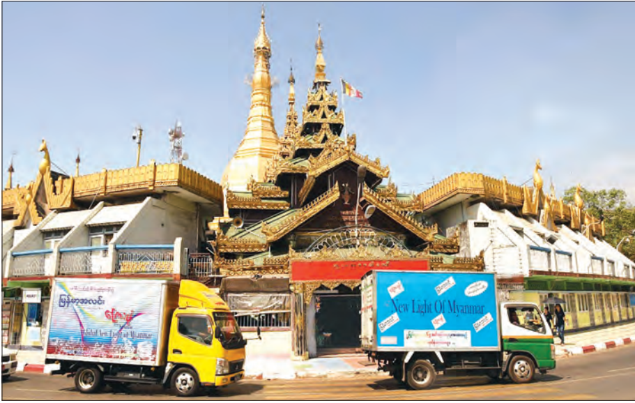
ရန်ကုန်စာဖတ်ပရိသတ်ထံ နေ့စဉ်ထုတ်သတင်းစာများ အချိန်မီရောက်ရှိရေး ဖြန့်ချိရေးလုပ်ငန်းကလည်း စွမ်းစွမ်းတစ်