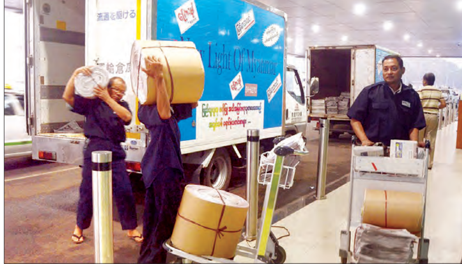
စာဖတ်ပရိသတ်ထံ နေ့စဉ်ထုတ်သတင်းစာများ အချိန်မီရောက်ရှိရေး ဖြန့်ချိရေးလုပ်ငန်းမှ လုပ်သားကြီးများ အားကြီးမာန်တက်ဆောင်ရွက်နေစဉ်

သတင်းများကို သတင်းစာကျင့်ဝတ်နှင့်အညီ မျှတစွာ လက်ဆတ်စွာ၊ ဘက်ညီစွာတင်ပြနိုင်ရေးအတွက် ပြည်သူ့သတင်းစာများက တိကျစွာလိုက်နာကျင့်သုံးလျက်ရှိပြီး သတင်းစာမျက်နှာတိုင်းသည် ပြည်သူ့အတွက် သတင်းအမှန်ပြန်ကြားပေးရန်သာ အဓိကထား ရည်ရွယ်ဖော်ပြနေကြသည်။ အချိန်အဟုန်ဖြင့် ဖွံ့ဖြိုးလာခဲ့သည့် မြန်မာ