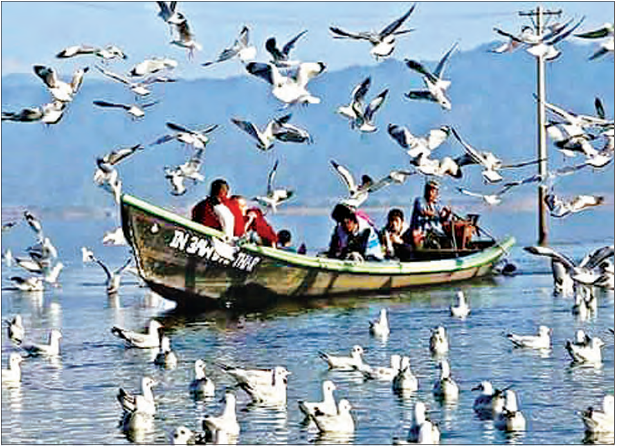
အင်းတော်ကြီး ရွှေမဉ္ဇူဘုရားပွဲသို့ လာရောက်ကြသူများအား တွေ့ရစဉ်

ကစားရခြင်းဖြစ်ပြီး ပြီးခဲ့သည့်ရာသီက V-League ပြိုင်ပွဲတွင် အဆင့်(၄) နေရာရရှိခဲ့သည်။ ထန်ကွမ်နှင့်အသင်း တွင် ဝီယက်နမ်လက်ရွေးစင်ကစားသမား အချို့ပါဝင်နေပြီး နိုင်ငံခြားသားကစား သမားများလည်း ခေါ်ယူထားသည်။ ရတနာပုံအသင်းသည် အုပ်စုလက်ကျန်ပွဲ များအဖြစ် မတ် ၈ ရက်တွင် ထန်ကွမ်နှင့် အသင်းနှင့် အဝေးကွင်း၊ ဧပြီ ၁၈ ရက်တွင် ဟမ်းယူနိုက်တက်အသင်းနှင့် အဝေး ကွင်း၊ မေ ၂ ရက်တွင် ထန်ကွမ်နှင့်အသင်း နှင့် အိမ်ကွင်းပွဲစဉ် ယှဉ်ပြိုင်ကစားရမည် ဖြစ်သည်။ ထို့ကြောင့်ရတနာပုံအသင်း သည် နောက်တစ်ဆင့်တက်ရောက်ရန် အဝေးကွင်းပွဲစဉ်များမှာ အရေးပါလာ မည်ဖြစ်ပြီး ရလဒ်ကောင်းရန် လိုအပ်နေ သည်။ အဝေးကွင်းနှစ်ပွဲတွင် ရလဒ် ကောင်းရယူနိုင်ပါက ရတနာပုံအသင်း အနေဖြင့် နောက်ဆုံးပွဲ အိမ်ကွင်းတွင် အဆုံးအဖြတ် ဖြစ်လာမည်ဖြစ်သည်။ ယခုပွဲကို MRTV မှ တိုက်ရိုက် ပြသမည်ဖြစ်သည်။