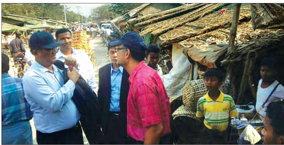
တွင် နေထိုင်ကြသူများ၏ နေထိုင်မှု၊ အခြေအနေများကို စခန်းတာဝန်ခံများ ပေါင်းစပ်ညှိနှိုင်း ဆောင်ရွက်ပေးခဲ့ အလုပ်အကိုင်နှင့် ပညာရေး၊ ကျန်းမာရေး အားမေးမြန်းကာ လိုအပ်သည်များ ကြောင်း သိရှိရသည်။ (သတင်းစဉ်)

အဆိုပါ သံအမတ်ကြီးနှင့်အဖွဲ့သည် ယမန်နေ့မွန်းလွဲပိုင်းတွင် စစ်တွေမြို့ရှိ သက်ကယ်ပြင်နှင့်ဆတ်ရိုးဂျာ ကယ်ဆယ် ရေးစခန်းများ၊ ဒါးပိုင်ဈေးနှင့် သဲချောင်း ဈေးများသို့ သွားရောက်ကြည့်ရှုလေ့လာ ပြီး မလေးရှားနိုင်ငံမှ ပေးပို့လှူဒါန်းသည့် ပစ္စည်းများ ဖြန့်ဝေထောက်ပံ့မှု၊ စခန်းများ