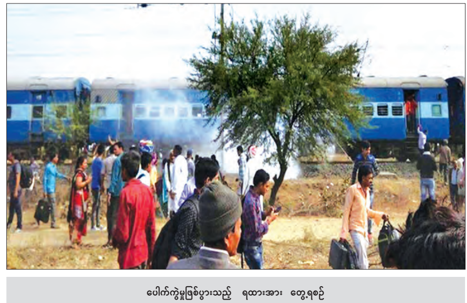
ပေါက်ကွဲမှုဖြစ်ပွားသည့် ရထားအား တွေ့ရစဉ်

အား ဝန်ဆောင်မှုပေးလျက်ရှိသည်။ ဘေးကင်းစိတ်ချရမှုမရှိကြောင်း သိရ သည်။ မီးရထားလမ်းပိုင်းဆိုင်ရာများမှာ နှစ်ကာလ ရှည်ကြာနေပြီဖြစ်သဖြင့် (ဆင်ဟွာ)