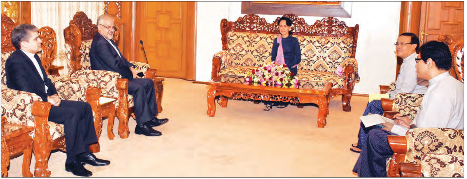
နိုင်ငံတော်၏ အတိုင်ပင်ခံပုဂ္ဂိုလ် ဒေါ်အောင်ဆန်းစုကြည် မြန်မာနိုင်ငံဆိုင်ရာ အီရန် အစွလာမ္မစ် သမ္မတနိုင်ငံ သံအမတ်ကြီးအား လက်ခံတွေ့ဆုံ (သတင်းစဉ်)

နေပြည်တော် မတ် ၇ နိုင်ငံတော်၏ အတိုင်ပင်ခံပုဂ္ဂိုလ်၊ နိုင်ငံခြားရေးဝန်ကြီးဌာန ပြည်ထောင်စုဝန်ကြီး ဒေါ်အောင်ဆန်းစုကြည်သည် ဗဟိုကော်မရှင်အဖွဲ့ဝင်၊ မြန်မာနိုင်ငံဆိုင်ရာ အီရန်အစွလာမ္မစ် သမ္မတနိုင်ငံ သံအမတ်ကြီး H.E. Mr. Mohsen Mohammadi အား ယနေ့ နံနက် ၁၀ နာရီတွင် နိုင်ငံခြားရေးဝန်ကြီးဌာန ပြည်ထောင်စုဝန်ကြီး၏ ဧည့်ခန်းမ၌ လက်ခံတွေ့ဆုံသည်။ (သတင်းစဉ်)