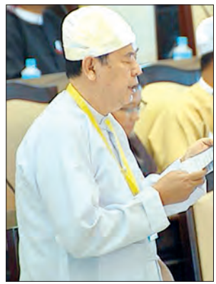
ဒုတိယဝန်ကြီး ဦးဝင်းမော်ထွန်း

ဆက်လက်၍ ဒုတိယဝန်ကြီးက လက်ရှိအခြေခံပညာအထက်တန်းသင်ရိုး တွင် အခြေခံဥပဒေဘာသာရပ်တစ်ခု အဖြစ်မဟုတ်သော်လည်း နိုင်ငံသား ကောင်းများ မွေးထုတ်နိုင်ရန်အတွက် နိုင်ငံသားများ၏ အခွင့်အရေးများ၊ ရပိုင်ခွင့်များ၊ လိုက်နာဆောင်ရွက်ရမည့်