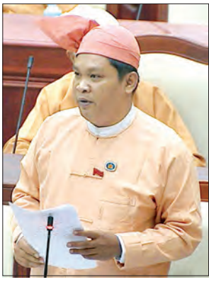
ဥက္ကရသီရိမဲဆန္ဒနယ်မှ လွှတ်တော် ကိုယ်စားလှယ် ဦးကျော်မင်းလှိုင်

ဥက္ကရသီရိမဲဆန္ဒနယ်မှ လွှတ်တော် ကိုယ်စားလှယ် ဦးကျော်မင်းလှိုင်၏ ဥက္ကသီရိမြို့နယ်အတွင်း ဒေသပြည်သူ များ အမှန်တကယ်နေထိုင်လုပ်ကိုင် စားသောက်နေသော ကျေးရွာများ၊ လယ်မြေများနှင့် ယာမြေများကို သစ်တောမြေအဖြစ်မှ ပယ်ဖျက်ပေးရန် အစီအစဉ်ရှိ မရှိ မေးခွန်းနှင့် စပ်လျဉ်း၍ သယံဇာတနှင့် သဘာဝပတ်ဝန်းကျင် ထိန်းသိမ်းရေးဝန်ကြီးဌာန ပြည်ထောင်စု ဝန်ကြီး ဦးအုန်းဝင်းက လက်ရှိအစိုးရသစ် လက်ထက်တွင် နေပြည်တော်ကောင်စီ အတွင်းရှိ သစ်တောနယ်မြေများအတွင်း နှစ်ကာလကြာရှည်စွာ ကျူးကျော် အခြေချ နေထိုင်သူများအတွက် ၂၀၁၃ ခုနှစ်တွင် စာရင်းကောက်ယူခဲ့သော ပြည်ထဲရေးအမည်ပေါက် အိမ်ခြေ ၅၀