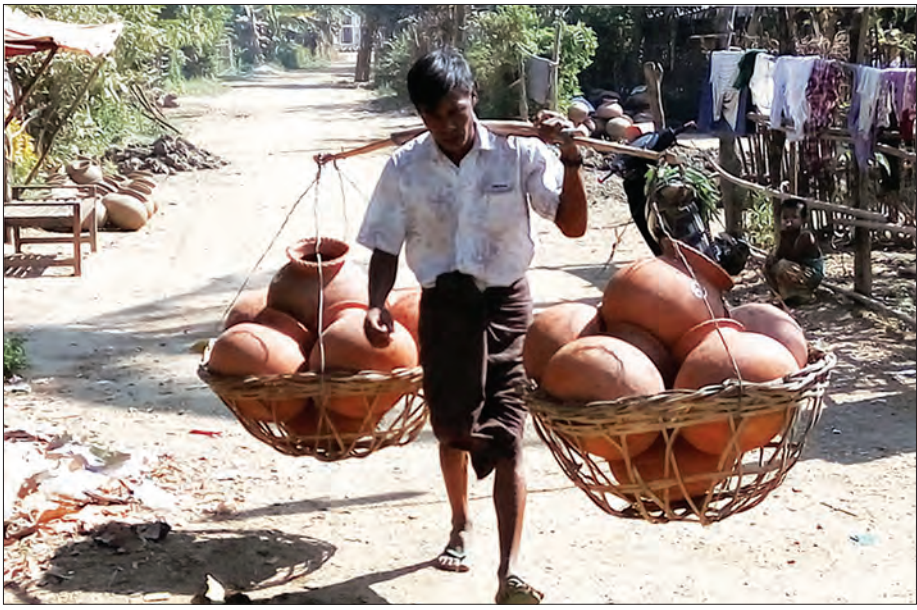
မီးကျက်ပြီး အိုးများသယ်လာသည့် ကို တွေရစဉ်

ညောင်ပင်ဆိပ်ကျေးရွာသည် မကွေးတိုင်းဒေသကြီး သရက်ခရိုင် အောင်လံမြို့နယ်တွင် တည်ရှိပြီး ဖွံ့ဖြိုးတိုးတက်သော ကျေးရွာတစ်ရွာဖြစ်သည်။ စေတီတန်ဆောင်း ကျောင်းကန် ဘုရားများ၊ အခြေခံပညာအထက်တန်းကျောင်းတိုက်နယ်ဆေးရုံ၊ ဆေးပေးခန်း၊ ကျေးရွာစာကြည့်တိုက်များနှင့် စည်ကားသော ကျေးရွာတစ်ရွာဟုဆိုလျှင်လည်း မှားနိုင်မည်မထင်ပါ။ ညောင်ပင်ဆိပ်ကျေးရွာသို့ သွားမည့်အခါ ညောင်ပင်ဆိပ်မြို့မှ ၂၄ မိုင်အကွာ ဒုရင်ပိုလ်ကျေးရွာမှတစ်ဆင့် ကျေးလက်ဒေသဖွံ့ဖြိုးတိုးတက်ရေးဦးစီးဌာနမှ ပြုပြင်ဖောက်လုပ်ပေးထားသော မြေနီကျောက်ချောလမ်းကလေးအတိုင်း နှစ်မိုင်ခန့် သွားလျှင် ညောင်ပင်ဆိပ်ကျေးရွာသို့ ရောက်ရှိနိုင်သည်။ ယခင်က ထိုလမ်းခရီးကို နွားလှည်းများ၊ မြင်းလှည်းများဖြင့်သာ သွား ရောက်ခဲ့ကြရသော်လည်း ယခုအခါတွင် ဆိုင်ကယ်များ၊ ကိုယ်ပိုင်ကားများ၊ ခရီးသည်တင်ကားများဖြင့် နေ့ညပြတ် သွားလာနေကြပြီဖြစ်သည်။