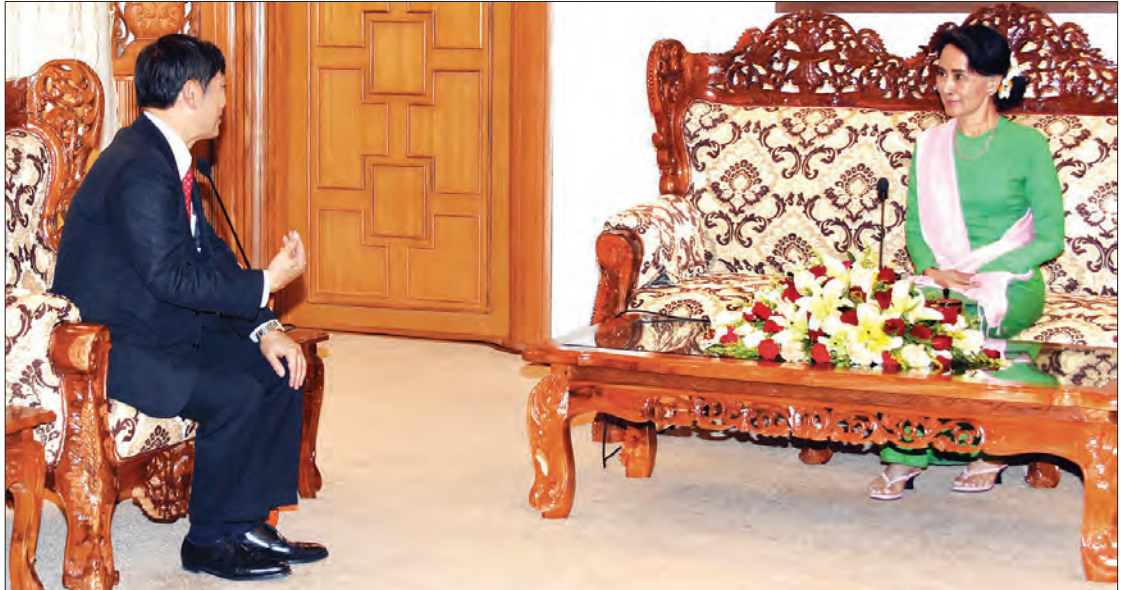
နိုင်ငံတော်၏အတိုင်ပင်ခံပုဂ္ဂိုလ် ဒေါ်အောင်ဆန်းစုကြည်နှင့် ဂျပန်အပြည်ပြည်ဆိုင်ရာအကူအညီပေးရေးအေဂျင်စီ (JICA) ၏ ဥက္ကဋ္ဌ Mr. Shinichi KITAOKA တို့ တွေ့ဆုံဆွေးနွေးစဉ်

ထိုသို့တွေ့ဆုံစဉ် မြန်မာနိုင်ငံနှင့် JICA တို့အကြား နယ်ပယ်ဒေသအသီးသီး၌ အပြန်အလှန် ပူးပေါင်းဆောင်ရွက်မှု၏ အောင်မြင်မှုများနှင့် ဆက်လက်ပူးပေါင်းဆောင်ရွက်ရန်ရှိသည့် ကိစ္စရပ်များကို ဆွေးနွေးကြသည်။ (သတင်းစဉ်)