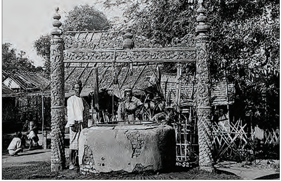
ရှေးခေတ် မန္တလေးမြို့၌ အသုံးပြုခဲ့သော ရေတွင်းအားတွေရစဉ်

ဆံသဆရာဆီမှာပဲ ညှပ်၏။ ‘ဘယ်လိုပုံ ညှပ်မှာလဲ’ ဟု မေးသည့်အခါ အစ်ကိုက ‘ဆံလုံးပဲ ညှပ်မှာ’ ဟု ပြော၏။ ‘ဆံလုံး’ ဆိုတာ ကျွန်တော်မသိ။ သို့သော် စက်ကတ်ကြေးနှင့်ရော၊ ခွက်ကတ်ကြေးနှင့်ပါ အချိန်အတော်ကြာ ညှပ်လိုက်သောအခါ ‘ဆံလုံး’ ဆိုသော ဆံပင်ပုံစံပေါ်လာသည်။ နောက်ကလည်း အပြောင်မဟုတ်၊ ရှေ့ကလည်း အရှည်မဟုတ်။ ထိုဆံပင်ပုံကို သဘောကျသည်။ နောက်တော့ ထိုဆိုင်မှ ထိုဆရာဆီမှာပဲ စောင့်ကာ ဆံပင်ညှပ်သည်။ မကြာမီ ထိုဆိုင်မှ အလုပ်သမားများက ဆိုင်ရှင်နှင့် ဝါဏီဗွေဋီပကွမူဖြစ်ကာ ခွဲထွက်ကြ၏။