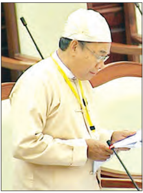
ပြည်ထောင်စုဝန်ကြီး ဦးအုန်းဝင်း

နေပြည်တော် ဖေဖော်ဝါရီ ၂၈ ဒုတိယအကြိမ် ပြည်သူ့လွှတ်တော် စတုတ္ထပုံမှန်အစည်းအဝေး (၁၄) ရက် မြောက်နေ့ကို ယနေ့နံနက်ပိုင်းတွင် နေပြည်တော်ရှိ လွှတ်တော်အဆောက် အအုံ ပြည်သူ့လွှတ်တော် အစည်းအဝေး ခန်းမ၌ ဆက်လက်ကျင်းပသည်။ အစည်းအဝေးတွင် ပြည်သူ့ လွှတ်တော်ဥက္ကဋ္ဌက ပြည်သူ့လွှတ်တော် ကော်မတီအဖွဲ့ဝင် ပြောင်းရွှေ့တာဝန် ပေးအပ်ခြင်းနှင့် ထပ်မံထည့်သွင်းခြင်းကို လွှတ်တော်သို့ အသိပေးတင်ပြသည်။ ယနေ့အစည်းအဝေးတွင် တောင် ဥက္ကလာပ မဲဆန္ဒနယ်မှ လွှတ်တော် ကိုယ်စားလှယ် ဒေါက်တာဦးစောနိုင်၏ တောင်ဥက္ကလာပမြို့နယ်၊ ဥက္ကလာပစေတီ ပရဝဏ်၏ ပေ ၁၀၀ အတွင်း ပေ ၇၀ ထက် မြင့်သောအထပ်မြင့် အဆောက်အအုံ ဆောက်လုပ်နေခြင်းနှင့် ပတ်သက်၍ သက်ဆိုင်ရာဌာနများအနေဖြင့် မည်သို့ စီစဉ်ထားသည်ကို သိလိုကြောင်း မေးခွန်း နှင့်စပ်လျဉ်း၍ သာသနာရေးနှင့် ယဉ်ကျေးမှုဝန်ကြီးဌာန ပြည်ထောင်စု ဝန်ကြီး သူရဦးအောင်ကို တောင် ဥက္ကလာပစေတီတော်သည် ၁၉၉၀ ပြည့် နှစ်တွင် တည်ဆောက်ခဲ့ပြီး ဉာဏ်တော် ၁၀၈ ဝေရှိပါကြောင်း၊ အဆိုပြုမြေကွက် သည် မြေရင် ဦးဌေးအောင်က မူလက မူအားဖြင့် ခွင့်ပြုထားသည့် Basement + ၁ ဥဒမ ၅ ထပ်တိုက်အစား လေးထပ် လျှော့၍ တောင်ဥက္ကလာပစေတီတော်၏ စိန့်ပူတော်နှင့် ထီးတော်တို့ထက်နိမ့်ချပြီး အမြင့် ၉၈ ဝေရှိသော Basement + ၈ ဒဿမ ၅ ထပ်တိုက် အဆောက်အအုံ ဆောက်လုပ်ခွင့်ပြုပေးပါရန် တင်ပြ လျှောက်ထားမှုအား ၂၀၁၅ ခုနှစ် ဧပြီ ၈ ရက်က ကျင်းပသော ရန်ကုန်တိုင်းဒေသ ကြီး အစိုးရအဖွဲ့အစည်းအဝေး အမှတ်စဉ် (၁၈/၂၀၁၅) ဆုံးဖြတ်ချက်အပိုဒ်(၇) အရ သဘောတူကြောင်း အကြောင်းကြား လာပါသဖြင့် အဆိုပါကိစ္စနှင့်စပ်လျဉ်း၍ ရန်ကုန်မြို့တော် စည်ပင်သာယာရေး ကော်မတီမှ သတ်မှတ်ထားသော စည်း ကမ်းများနှင့် ညီညွတ်သဖြင့် ခွင့်ပြုပေး ခဲ့ပြီးဖြစ်ကြောင်း။