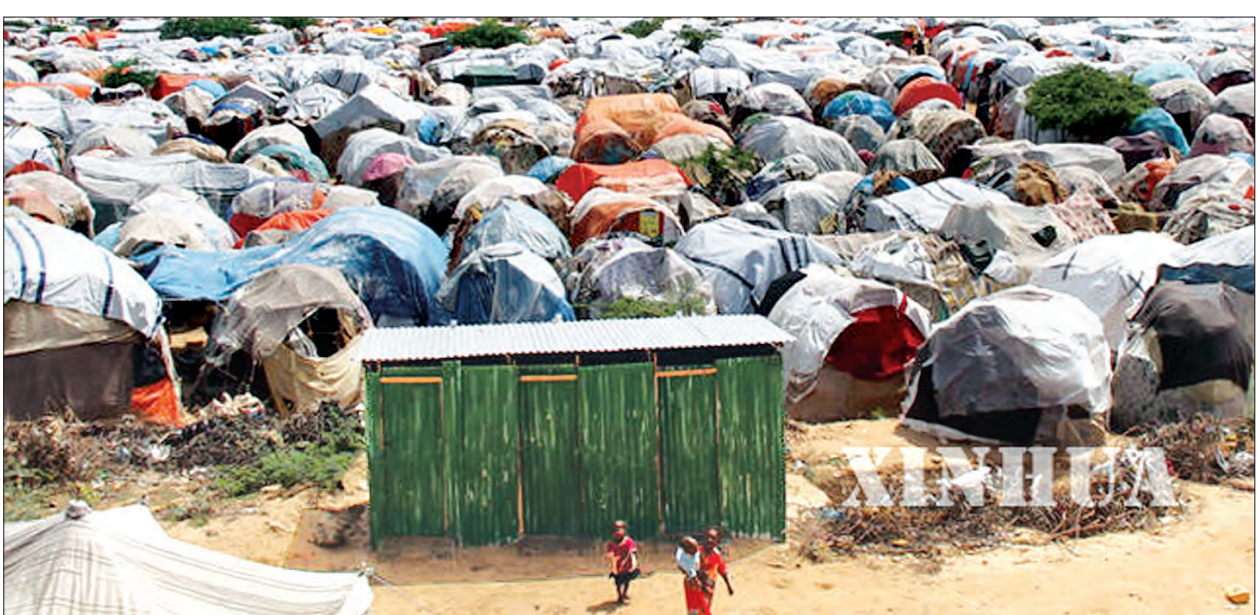
မိုဂါဒ်ရှူးရှိ လူအများကို ရွှေ့ပြောင်းနေရာချထားပေးသည့် စခန်းများအားတွေ့ရစဉ်

ဂျီနီဗာ ဖေဖော်ဝါရီ ၂၈ ဆိုမာလီနိုင်ငံရှိ ပြည်သူ ၁ ဒသမ ၅ သန်း အတွက် လတ်တလောတွင် မိုးခေါင် ရေရှားအခြေအနေနှင့် စားနပ်ရိက္ခာ အခက်အခဲများကြောင့် ကျန်းမာရေး ဆိုးရွားနေမှုများကို ဖြေရှင်းပေးနိုင်ရန် အတွက် အမေရိကန်ဒေါ်လာ ၁၀ သန်း လိုအပ်လျက်ရှိကြောင်း ကမ္ဘာ့ ကျန်းမာရေးအဖွဲ့(ဒဗလူးအိတ်ချ်အို)က မကြာ သေးမီက ပြောကြားလိုက်သည်။ ယင်းပေးပို့ထားသည့် ရောဂါဘယ ဖြစ်ပွားနေသည့်ဒေသများတွင် ကျန်းမာ ရေးစောင့်ရှောက်မှုပေးရန် ကုလသမဂ္ဂ အေဂျင်စီအနေဖြင့် ၂၀၁၇ ပထမ ခြောက်လအတွက် အသုံးပြုသွားရန် တောင်းခံခြင်းဖြစ်ကြောင်း ဒဗလူး အိတ်ချ်အိုက ပြောခဲ့သည်။ ဆိုမာလီယာနိုင်ငံ၌ လက်ရှိတွင် မိုးခေါင်ရေရှားမှု၊ ပတ်ဝန်းကျင် အနံ့ အသက် ဆိုးရွားမှု၊ ကျန်းမာရေးအခြေ အနေ နိမ့်ကျလာမှုများကြောင့် ရိုးရိုးဖွယ် အနေအထားရောက်ရှိနေပြီဖြစ်ကြောင်း မြေထဲပင်လယ် အရေပိုင်းဒေသဆိုင်ရာ ဒဗလူးအိတ်ချ်အို ညွှန်ကြားရေးမှူး မာမော်ဒ်ဖစ်ကီရီက မိုဂါဒ်ရှူးတွင်