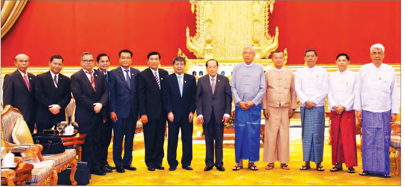
နိုင်ငံတော်သမ္မတ ဦးထင်ကျော်နှင့် ကမ္ဘောဒီးယားနိုင်ငံ ဒုတိယဝန်ကြီးချုပ် မစ္စတာ ဟော်နမ်ဟောင် ဦးဆောင်သည့် ကိုယ်စားလှယ်အဖွဲ့တို့ စုပေါင်းမှတ်တမ်းတင် ဓာတ်ပုံရိုက်စဉ်

တွေ့ဆုံပွဲသို့ ပြည်ထောင်စုဝန်ကြီး ဦးအုန်းမောင်၊ ဒေါက်တာမျိုးသိမ်းကြီး၊ ဒုတိယဝန်ကြီး ဦးမင်းသူ၊ ဦးကျော်မျိုးနှင့် တာဝန်ရှိသူများ တက်ရောက်ကြသည်။ (သတင်းစဉ်)