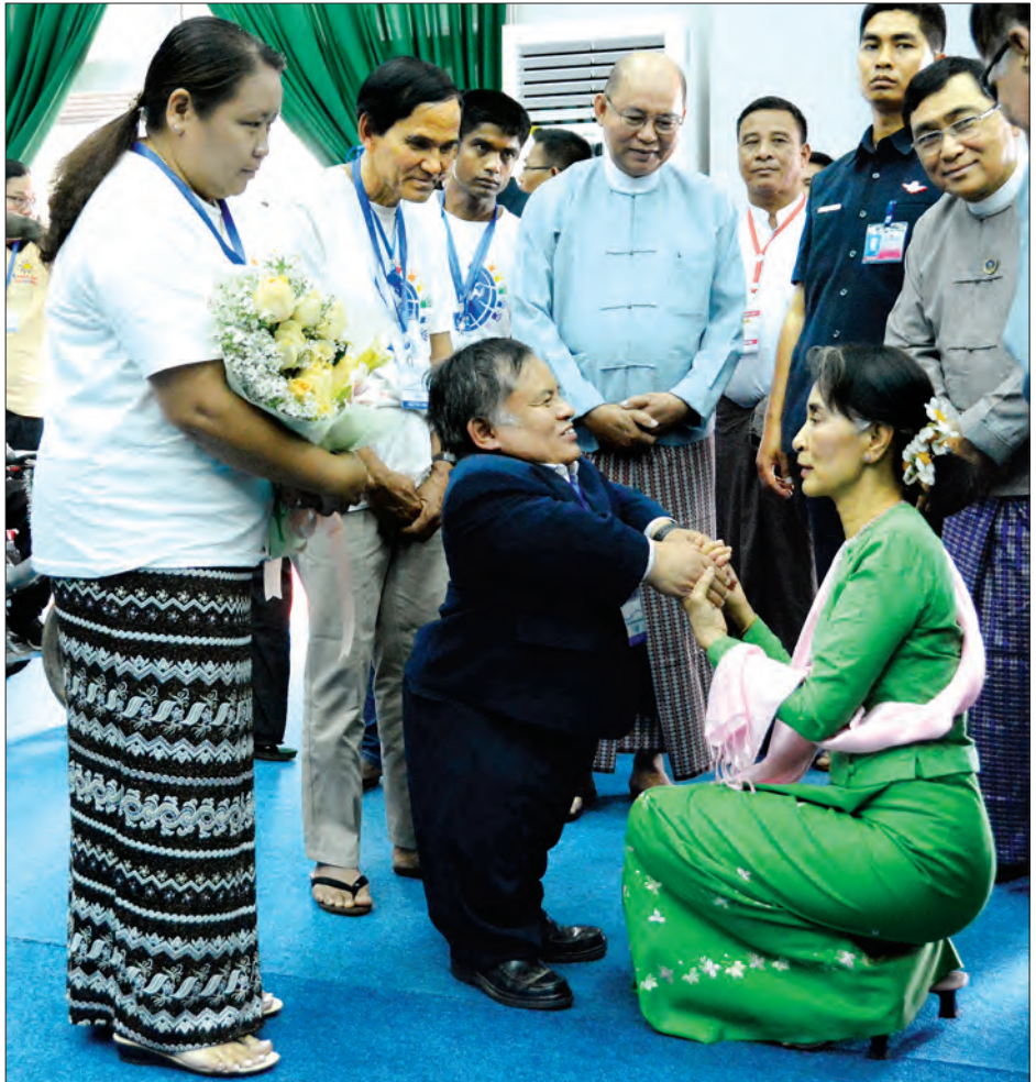
နိုင်ငံတော်၏ အတိုင်ပင်ခံပုဂ္ဂိုလ် ဒေါ်အောင်ဆန်းစုကြည် ငြိမ်းချမ်းရေးတွဲလက်များ Wheel Chair ရထားအဖွဲ့မှ တာဝန်ရှိသူ တစ်ဦးအား ရင်းရင်းနှီးနှီး နှုတ်ဆက်စဉ်

ကျော်လွှား၍ရသည်ဆိုပြီး အားပေးရမည်၊ တိုက်တွန်းရမည်ဖြစ်ပါကြောင်း၊ အားလုံးပိုင်းလုပ်မှု ငြိမ်းချမ်းရေးရမည်ဖြစ်ပါကြောင်း၊ နိုင်ငံတစ်နိုင်ငံ၏ ကံကြမ္မာဆိုသည်မှာ ဒီနိုင်ငံကို မှီတင်းနေသူအားလုံးက ဖော်ဆောင်နေခြင်းဖြစ်ပါကြောင်း၊ တစ်ယောက်တည်းလုပ်၍ တစ်ဖွဲ့တည်းလုပ်၍ မရပါကြောင်း၊ အစိုးရတစ်ဖွဲ့တည်းလုပ်၍မရပါကြောင်း၊ နိုင်ငံကို မှီတင်းနေထိုင်ကြသူများအားလုံး၏ လုပ်ဆောင်