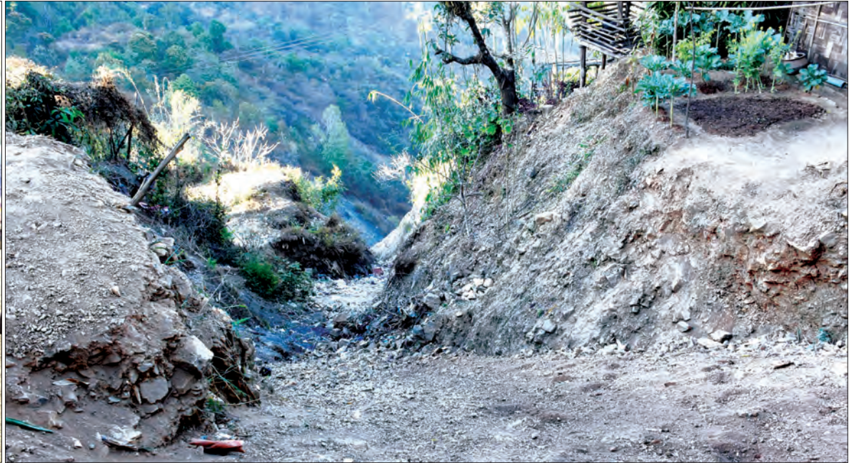
ဒုတိယသမ္မတ ဦးဟင်နရီဝန်ထီးယူ မတူပီမြို့၊ မြေပြိုမှုဖြစ်ပွားသည့်နေရာများကို ကြည့်ရှုစစ်ဆေးစဉ်