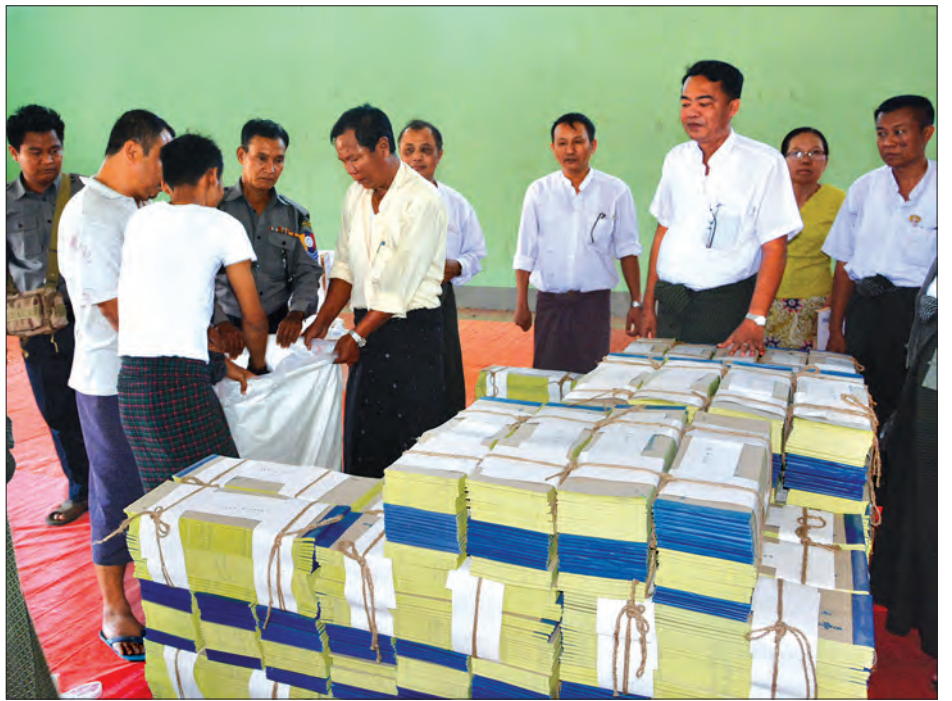
ပြည်ထောင်စုရွေးကောက်ပွဲကော်မရှင်မှ တာဝန်ရှိသူများထံ ပုံနှိပ်ရေးနှင့်ထုတ်ဝေရေးဦးစီးဌာနမှ တာဝန်ရှိသူများက ဆန္ဒမဲလက်မှတ်များ စနစ်တကျ လွှဲပြောင်းစဉ်

“ကျွန်တော်တို့ နေပြည်တော် ပုံနှိပ် စက်ရုံမှ ကြားဖြတ်ရွေးကောက်ပွဲအတွက် ဆန္ဒမဲလက်မှတ်တွေကို ကျင်းပမယ့် သက်ဆိုင်ရာတိုင်းဒေသကြီးနဲ့ ပြည်နယ် တွေကို ဒီနေ့တစ်ရက်တည်းအပြီး ဖြန့်ဝေ ပေးတာ ဖြစ်ပါတယ်။ လာရောက်ထုတ်ယူ တဲ့ တိုင်းဒေသကြီးနဲ့ ပြည်နယ်များမှ