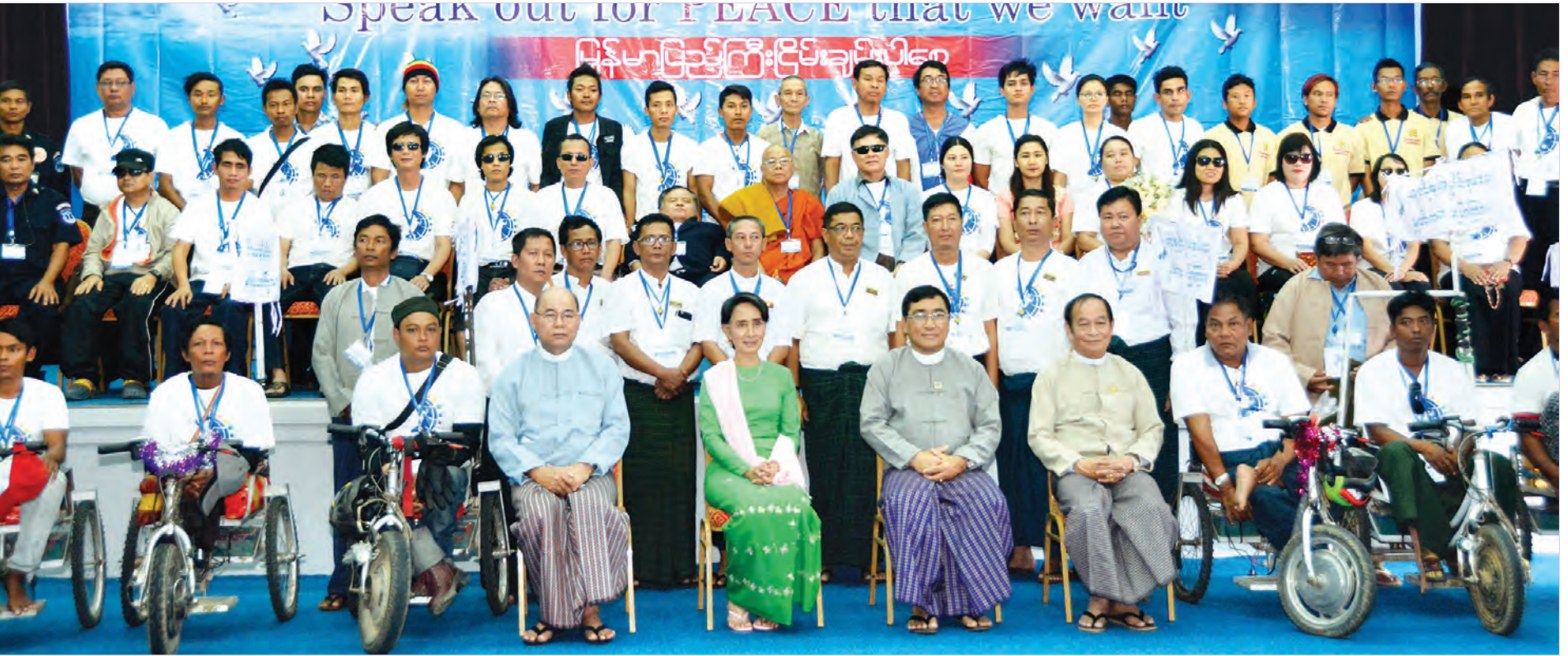
နိုင်ငံတော်၏ အတိုင်ပင်ခံပုဂ္ဂိုလ် ဒေါ်အောင်ဆန်းစုကြည်နှင့် ငြိမ်းချမ်းရေးတွဲလက်များ Wheel Chair ရထားအဖွဲ့တို့ စုပေါင်းမှတ်တမ်းတင် ဓာတ်ပုံရိုက်စဉ် (သတင်းစဉ်)