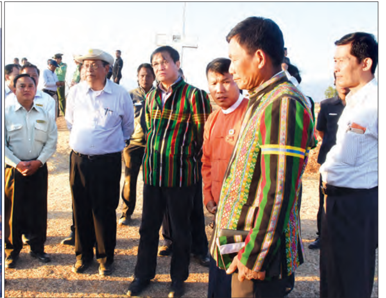
ဒုတိယသမ္မတ ဦးဟင်နရီပန်ထီးယူ မတူပီမြို့၊ မြို့ပြဖွံ့ဖြိုးမှုအခြေအနေကို တောင်ပေါ်ရွာရပ်မှ ကြည့်ရှုစဉ်