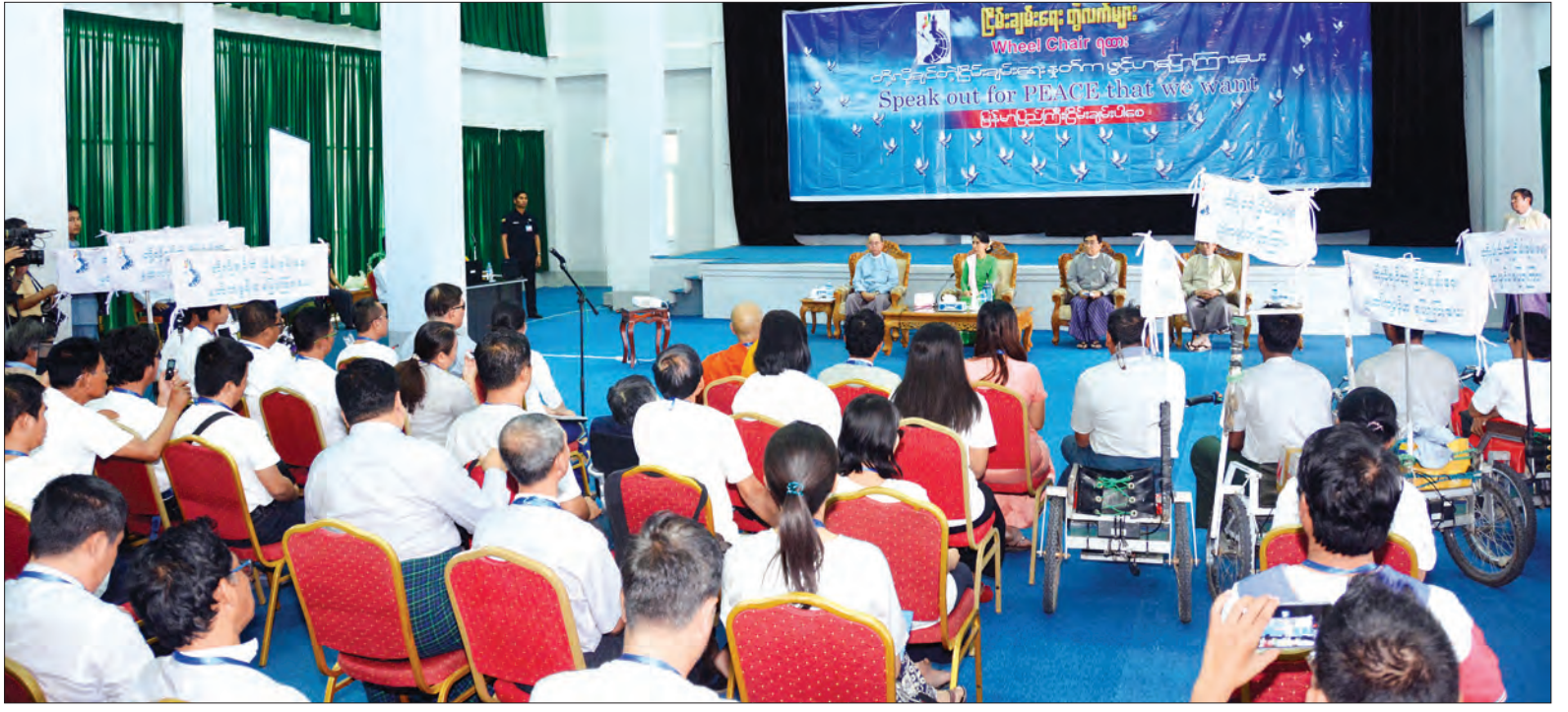
နိုင်ငံတော်၏ အတိုင်ပင်ခံပုဂ္ဂိုလ် ဒေါ်အောင်ဆန်းစုကြည် ငြိမ်းချမ်းရေးတွဲလက်များ Wheel Chair ရထားအဖွဲ့တွေ့ဆုံခြင်းအခမ်းအနားတွင် အမှာစကားပြောကြားစဉ်

နိုင်ငံတကာရေးရာညှိတိုးတက်ရန် ငြိမ်းချမ်းရေးသည် မဖြစ်မနေရလှေမည့် ကိစ္စပင်ဖြစ်ပါကြောင်း၊ ထို့ကြောင့် ငြိမ်းချမ်းရေးကိုထိခိုက်စေသည့် မသန်စွမ်းသည့် စိတ်ဓာတ်ကို မိမိတို့အားလုံးကုစားပေးရမည်ဖြစ်ပါကြောင်း၊ ကုစားပေးသည်ဆိုသည်မှာ စကားနှင့်ချည်းကုစားပေး၍မရဘဲ အလုပ်နှင့် ပြုမည်ဖြစ်ပါကြောင်း၊ စံနမူနာအရ မိမိတွင်ရှိသည့်အခက်အခဲကို ကျော်လွှားနိုင်သည့် အားနည်းချက်များကို ကျော်လွှားနိုင်သည့် ထို့ကြောင့် အားလုံးကိုယ်စိတ်ဓာတ်ပိုင်းဆိုင်ရာ အားနည်းချက်များကို