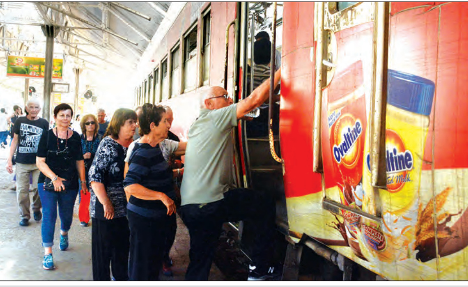
ရန်ကုန်မြို့ပတ်ရထားအား အပျော်တမ်းလိုက်ပါစီးနင်းသော နိုင်ငံခြားသားများကို တွေ့ရစဉ်

ရန်ကုန် ဖေဖော်ဝါရီ ၂၀ စီးပွားရေးအချက်အချာကျပြီး လူဦးရေထူထပ်များပြားသော မြန်မာနိုင်ငံ၏ စီးပွားရေးမြို့တော်ကြီးဖြစ်သည့် ရန်ကုန်မြို့တွင် ဇန်နဝါရီ ၁၆ ရက်က YBS ယာဉ်လိုင်းများ ပြောင်းလဲပြီးနောက် ရန်ကုန်မြို့ပတ်ရထားများတွင် ပြည်ပနိုင်ငံခြားသားခရီးသည်များနှင့် လသုံးလက်မှတ်စီးခရီးသည်များ စီးနင်းမှုပိုများပြားလာကြောင်း မြန်မာ့မီးရထားတိုင်းအမှတ်(၇) သွားလာပို့ဆောင်ရေးဌာနခွဲမှ သိရသည်။