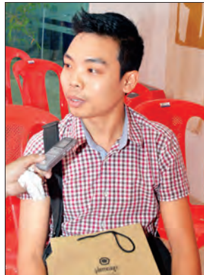
မောင်ညီညီထူး

Book Plaza ဆိုတာ မြန်မာပြည်မှာ အကြီးမားဆုံးနဲ့ အစုံလင်ဆုံး ပလာဇာကြီး ဖြစ်ပါတယ်။ စာပေနဲ့ ပြည့်သူတွေ ဝေးကွာနေရာကနေ ပြန်ပြီးနီးစပ်စေချင်တယ်။ ပလာဇာမှာ စာအုပ်ဝယ်ရတာ မကဘူး။ စာအုပ်ဝယ်နေရင်းနဲ့ လူတွေ အပန်းဖြေအောင်ဆိုပြီးတော့ ကော်ဖီဆိုင်တွေရှိတယ်။ ကလေးကစားကွင်းတွေရှိတယ်။ သူတို့လာပြီး အပန်းဖြေလိုရတဲ့ နေရာတစ်နေရာဖြစ်တယ်။ အပန်းဖြေရင်း စာအုပ်တွေကို စိတ်ဝင်စားလို့ တစ်စုံတစ်ခု ယူဖတ်မိသွားမယ်ဆိုရင် ကျွန်တော်တို့အတွက် တိုင်းပြည်အတွက် အကျိုးအမြတ် ဖြစ်မယ်။ အဓိက လုပ်ချင်တာက စာပေနဲ့လူထု ဝေးကွာနေတဲ့ ကြားက တံတားလေးတစ်ခု ဖြစ်စေချင်ပါတယ်။