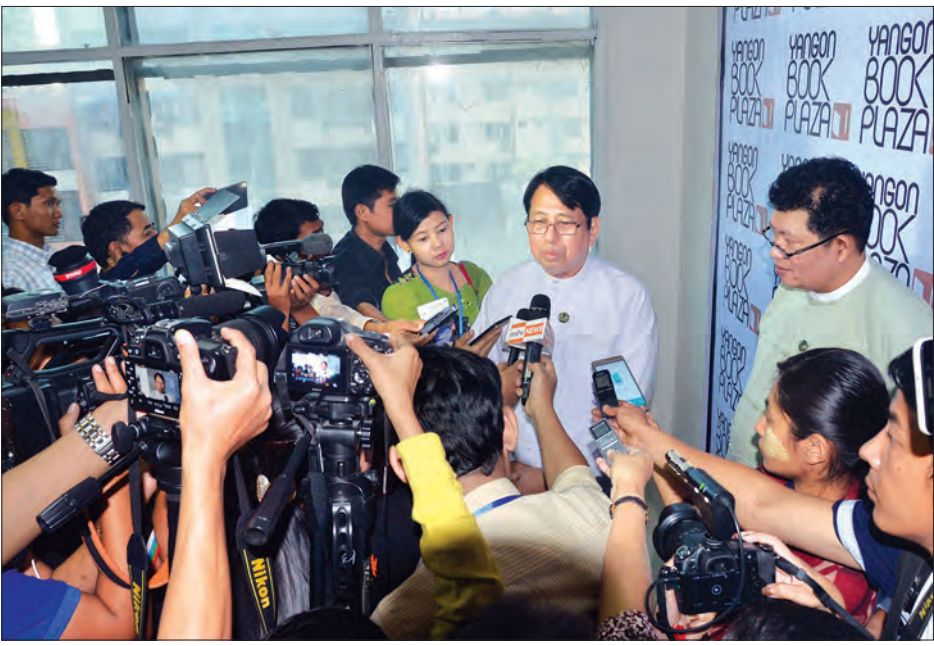
ပြည်ထောင်စုဝန်ကြီး ဒေါက်တာဖေမြင့် မိမိယာသမားများ၏ မေးမြန်းချက်ကို ဖြေကြားနေစဉ်

ပြည်ထောင်စုဝန်ကြီး ဒေါက်တာဖေမြင့် စာအုပ်တွေအပြည့်အစုံနဲ့ စာအုပ်ဆိုင်ကြီးကိုတွေ့ရတဲ့အတွက် အများကြီး ဝမ်းသာပါတယ်။ ငယ်ငယ်လေးကတည်းက စာအုပ်ဆိုင်တို၊ စာကြည့်တိုက်တို သွားရတာ ပျော်တယ်။ စာပေပတ်ဝန်းကျင်မှာပဲ နေချင်တယ်။ ဒီလိုစာအုပ်ဆိုင်တွေမှာ စာအုပ်လည်း ကြည့်လိုရမယ်။ လက်ဖက်ရည်ဆိုင်ထိုင်ပြီး စာအုပ်အကြောင်းတွေလည်း ထိုင်ပြောလိုရတယ်။ ဒီလိုနေရာမျိုးကို အရင်ကတည်းက ရှိစေချင်တာ။ ဒီမှာ စာအုပ်တွေယူပြီး စားပွဲမှာထိုင်ပြီး ဖတ်လိုရတယ်။ ကြိုက်တဲ့ စာအုပ်ဝယ်နိုင်တယ်။ ဒီလိုနေရာမျိုးမှာ ကလေးတွေအတွက်ရော၊ လူကြီးတွေအတွက်ပါ အဆင်ပြေအောင် လုပ်ပေးထားတယ်။ ဒီထက်မက ဖွံ့ဖြိုးတိုးတက်ပါစေလို့ ဆုတောင်းပါတယ်။ စာအုပ်သမားတွေအတွက် စာအုပ်အဟောင်းတန်းလေးပါ ပြည့်စုံအောင်လုပ်ပေးထားတယ်။ အသစ်ရော၊ အဟောင်းပါ မဖတ်ရသေးတဲ့ စာအုပ်တွေ၊ ရှားပါးစာအုပ်တွေ စုဆောင်းတဲ့လူတွေအတွက်လည်း အဆင်ပြေအောင် လုပ်ပေးထားတာ တွေ့ရပါတယ်။