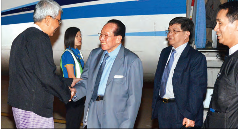
ကမ္ဘောဒီးယားနိုင်ငံ ဒုတိယဝန်ကြီးချုပ် H.E.Mr.HOR Namhong ဦးဆောင်သောကိုယ်စားလှယ်အဖွဲ့အား ဒုတိယဝန်ကြီး ဦးကျော်မျိုးနှင့် တာဝန်ရှိသူများက လေဆိပ်၌ ကြိုဆိုနှုတ်ဆက်စဉ် (သတင်းစဉ်)

နေပြည်တော် ဖေဖော်ဝါရီ ၂၆ ကမ္ဘောဒီးယားနိုင်ငံ ဒုတိယဝန်ကြီးချုပ် H.E.Mr.HOR Namhong ဦးဆောင်သောကိုယ်စားလှယ်အဖွဲ့သည် ယနေ့ည ၇ နာရီ မိနစ် ၂၀ တွင် နေပြည်တော်အပြည်ပြည်ဆိုင်ရာလေဆိပ်သို့ ရောက်ရှိသည်။ ကမ္ဘောဒီးယားနိုင်ငံ ဒုတိယဝန်ကြီးချုပ်နှင့် အဖွဲ့အား ပို့ဆောင်ရေးနှင့် ဆက်သွယ်ရေးဝန်ကြီးဌာန ဒုတိယဝန်ကြီး ဦးကျော်မျိုး၊ နိုင်ငံခြားရေးဝန်ကြီးဌာန အမြဲတမ်းအတွင်းဝန် ဦးကျော်ဇေယျနှင့် တာဝန်ရှိသူများက ကြိုဆိုကြသည်။ (သတင်းစဉ်)