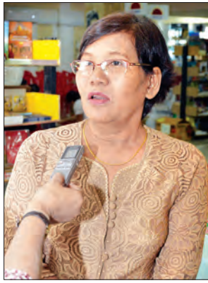
ဒေါ်တုတ်တုတ်