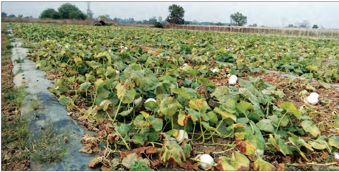
မျိုးစေ့ထုတ် ရွှေဖရုံစိုက်ခင်းကိုတွေ့ရစဉ်

မကွေးတိုင်းဒေသကြီး စလင်းမြို့နယ် ပေါင်းတူးကျေးရွာနယ်နိမိတ်အတွင်းရှိ ယာမြေများတွင် တရုတ်လူမျိုးပိုင် ကုမ္ပဏီတစ်ခုက မြေ ၁၃ ဧကခန့် ငှားရမ်းကာ ဖရုံ၊ သခွားမွှေး၊ ဖရုံနှင့် ကြက်ဟင်းခါး မျိုးစေ့ထုတ်လုပ်ငန်းများ လုပ်ကိုင်နေကြောင်း သိရသည်။ အဆိုပါသီးနှံများ စိုက်ပျိုးနိုင်ရန်အတွက် ခေတ်မီစက်မှုလယ်ယာပုံစံ မြေကွက်များ ဖော်ဆောင်ကာ အဆိုပါကုမ္ပဏီမှ ဖရုံ၊ သခွားမွှေး အစရှိသော သီးနှံများကို စိုက်ပျိုးရန် ယာမြေတစ်ဧကလျှင် မြေငှားခတစ်နှစ်စာ ငွေကျပ် ခုနစ်သောင်းနှုန်းဖြင့် နှစ်နှစ်စာချုပ် ချုပ်ဆိုပြီး ဒေသခံတောင်သူများထံမှ မြေကို ငှားရမ်းကာ မျိုးစေ့ထုတ်လုပ်ငန်းများ လုပ်ကိုင် နေကြောင်း သိရသည်။ “ကျွန်တော်တို့ ကုမ္ပဏီနဲ့ ယာပိုင်ရှင် ငှားရမ်းဖို့ သဘောတူပြီးပြီဆိုရင် အရင်ဦးဆုံး ရေတွင်းတူးကြည့်ပါတယ်။ ရေတွင်းတူးလို့ အောင်တယ်ဆိုရင် နှစ်နှစ်စာချုပ်ချုပ်ပြီးတော့ ငှားရမ်းပါတယ်။ မိုးရာသီမှာဆိုရင်တော့ ကြက်ဟင်းခါး၊ ဖရုံ စတဲ့သီးနှံတွေကို စိုက်ပြီး အခုလိုရွှေဖရုံသီးမှာဆိုရင်တော့ ဖရုံ၊ခရမ်း၊ ချဉ် စတဲ့သီးနှံတွေကို ရေတင်တဲ့စနစ်နဲ့ စိုက်ပျိုး ပြီးတော့ မျိုးစေ့ထုတ်လုပ်တာဖြစ်ပါတယ်။ ခန့်မှန်းခြေပုံမှန်ဆိုရင်တော့ မျိုးစေ့ ၁၀၀ ကီလိုဂရမ် တောင်းပါတယ်။ ကျွန်တော်တို့ ဆီကတော့ သူတို့ဆီကလာတဲ့ အဖို၊ အမမျိုးစေ့ တွေကိုစိုက်ပျိုးပြီး ဝတ်မှုန်ကူးတာတွေ ဘာတွေလုပ်ပြီးတော့ မျိုးစေ့ထုတ်ချိန်ရောက် ပြီဆိုတာနဲ့ မျိုးစေ့ထုတ်ပြီး ကုမ္ပဏီကို ပြန်အပ် ရတာမျိုးပဲ လုပ်ရပါတယ်။ အခုလက်ရှိလုပ်ကိုင်