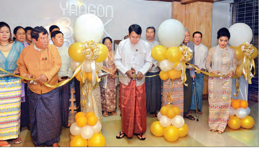
ထို့အပြင် Yangon Book Plaza ကော်မတီက တစ်နှစ်လျှင် လက်ရွေးစင် စာအုပ် ၁၂ အုပ်ကို ရွေးချယ်ကာ စာအုပ်ရေးသားသူ စာရေးဆရာ၊ ဆရာမကြီးများအား ဂုဏ်ပြုချီးမြှင့်မည်ဖြစ်ကြောင်းနှင့် ဖွင့်ပွဲအထိမ်းအမှတ်အဖြစ် ဖေဖော်ဝါရီ ၂၆ ရက်မှ မတ် ၇ ရက်အထိ ဝယ်ယူသော စာအုပ်တန်ဖိုး၏ အနည်းဆုံး ၁၀ ရာခိုင်နှုန်းမှ ၅၀ ရာခိုင်နှုန်းထိ လျှော့စျေးများဖြင့် ရောင်းချပေးသွားမည်ဖြစ်ကြောင်း သိရသည်။ (သတင်းစဉ်)

ရန်ကုန်မြို့တော်ဝန်နှင့်အဖွဲ့သည် စုပေါင်းမှတ်တမ်းတင်စာတံပုံရိုက်ကြပြီး Yangon Book Plaza အတွင်း ခင်းကျင်းစီစဉ်ထားမှုများကို လှည့်လည်ကြည့်ရှုကြသည်။ မြန်မာနိုင်ငံ၏ အကြီးဆုံးနှင့် ပထမဆုံး Yangon Book Plaza ကို နေ့စဉ် နံနက် ၁၀ နာရီမှ ည ၉ နာရီအထိ ပိတ်ရက်မရှိ ဖွင့်လှစ်သွားမည်ဖြစ်သည်။ Yangon Book Plaza ၌ ကလေးကစားကွင်း၊ ကော်ဖီဆိုင်၊ လက်ဆောင်ပစ္စည်းအရောင်းဆိုင်၊ စားသောက်ဆိုင်၊ စာအုပ်မျိုးစုံရောင်းချမည့် စာအုပ်ဆိုင်ကြီးနှစ်ဆိုင်၊ စာပေတိုက် ၃၀ မှ စာအုပ်ဆိုင်ခန်းများ၊ ဈေးဖြေရေးစင်မြင့်များ၊ စာအုပ်အဟောင်း အရောင်းဆိုင်တန်း၊ အင်္ဂလိပ်စာအုပ် သီးသန့်အရောင်းဆိုင်နှင့် စာချစ်သူအများပြည်သူနားနေရန် နေရာများပါရှိသည်။