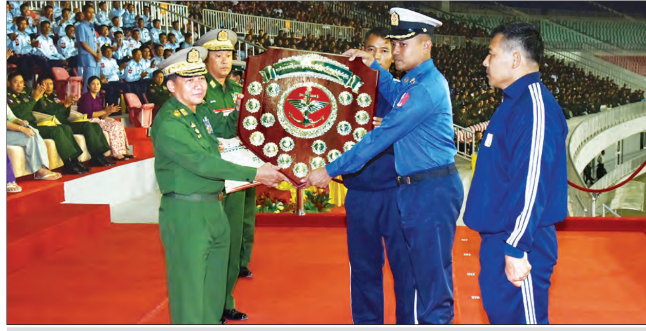
တပ်မတော်ကာကွယ်ရေးဦးစီးချုပ် ဗိုလ်ချုပ်မှူးကြီး မင်းအောင်လှိုင် ဆုတံဆိပ်အများဆုံးရရှိသော ကာကွယ်ရေးဦးစီးချုပ်မှူး(ရေ)ကိုယ်စားပြုအသင်းအား တံခွန်စိုက်ခိုင်းဆု ပေးအပ်ချီးမြှင့်စဉ်

နေပြည်တော် ဖေဖော်ဝါရီ ၂၆ ၂၀၁၇ ခုနှစ် တပ်မတော် (ကြည်း၊ ရေ၊ လေ)အားကစားပြိုင်ပွဲများ ဆုချီးမြှင့်ခြင်းနှင့် ပိတ်ပွဲအခမ်းအနားကို ယနေ့ညနေပိုင်းတွင် နေပြည်တော်ရှိ ဖေယျာသီရိ တပ်မတော်အားကစားကွင်း၌ ကျင်းပသည်။