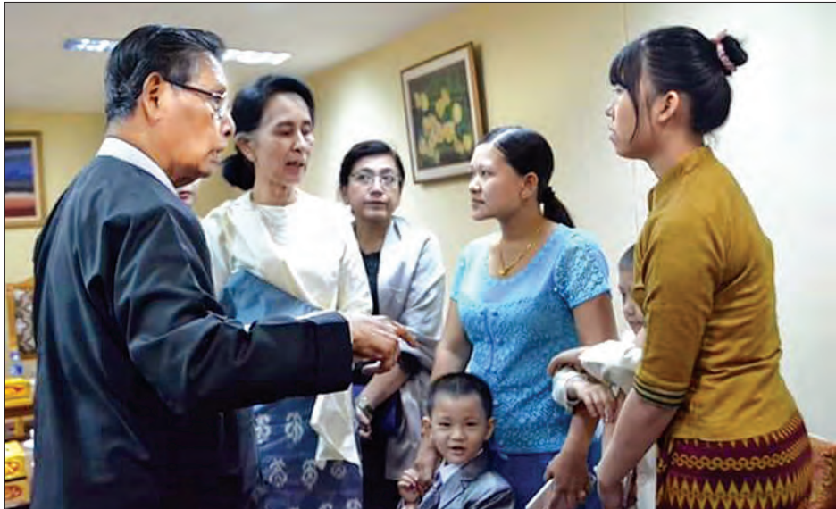
နိုင်ငံတော်၏ အတိုင်ပင်ခံပုဂ္ဂိုလ် ဒေါ်အောင်ဆန်းစုကြည်နှင့် အမျိုးသား ဒီမိုကရေစီ အဖွဲ့ချုပ်နာယက သူရဦးတင်ဦးတို့ အငှားယာဉ်မောင်း ဦးနေဝင်း၊ မိသားစုအား ရင်းရင်းနှီးနှီး အားပေးစကားပြောကြားစဉ် (သတင်းစဉ်)

စရာများထဲတွင် မိမိတို့၏ အဖွဲ့ချုပ်ထဲ တွင် ဦးကျော်၊ ဦးနေဝင်းတို့လို ပုဂ္ဂိုလ်များ ပါခဲ့သည်မှာလည်း မိမိတို့အတွက် အင်မတန်ကျေနပ်စရာတစ်ခု၊ ဂုဏ်ယူ