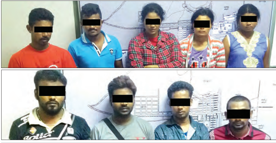
တစ်ဖက်နိုင်ငံမှ တရားမဝင် ဝင်ရောက်လာသူ ကိုးဦးအား တွေ့မြင်ရစဉ်

မြဝတီ ဖေဖော်ဝါရီ ၂၆ ကရင်ပြည်နယ် မြဝတီမြို့ အမှတ်(၁) ရပ်ကွက် ဆီးဂဲလ်ဂိတ်အနီး တစ်ဖက်နိုင်ငံ မှ တရားမဝင် ဝင်ရောက်လာသူများအား ဖမ်းဆီးရမိခဲ့ကြောင်း မြဝတီမြို့မရဲစခန်းမှ သိရသည်။