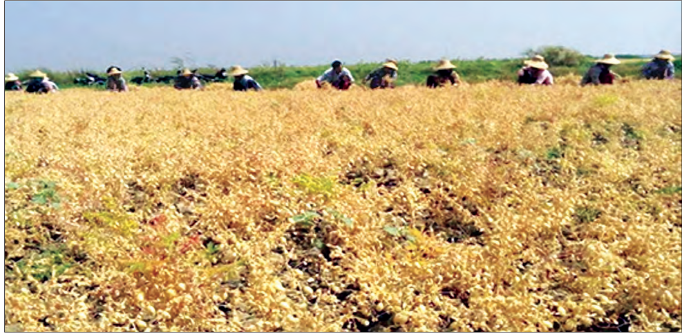
ပေါက်အင်းစိုက်ကွင်း၌ စံပြုမျိုးကောင်းမျိုးသန့် ကုလားပဲမျိုး ရိတ်သိမ်းနေစဉ်

ဒေသရေမြေရာသီဥတုနှင့်ကိုက်ညီပြီး ဈေးကွက်ဝင်ဈေးကောင်းရသည့် အထူးအထွက်တိုး မျိုးကောင်းမျိုးသန့်များကို စိုက်ပျိုးဖြန့်ဖြူးခြင်းဖြင့် တောင်သူများအကျိုးအမြတ် သိသာစွာခံစားနိုင်ပြီး လူမှုစီးပွားဘဝများ ဖွံ့ဖြိုးတိုးတက်လာစေရေးကို ရည်ရွယ်၍ စိုက်ပျိုးရေးဦးစီးဌာန၊ ကော်ဖီ-ရာသီသီးနှံဌာနမှ မျိုးသန့်မျိုးစေ့ထုတ်စိုက်ကွင်းကြီးများ ထူထောင်ဆောင်ရွက် လျက်ရှိရာစစ်ကိုင်း တိုင်းဒေသကြီး ချောင်းဦးမြို့နယ် ပေါက်အင်းစိုက်ကွင်းမှာ ဒေသအတွင်း ဂျုံနှင့် ကုလားပဲမျိုးများကို အောင်မြင်စွာ စိုက်ပျိုးထုတ်လုပ်၍ ဖြန့်ဖြူးပေးလျက်ရှိသော စိုက်ကွင်းကြီးတစ်ခုဖြစ် သည်။