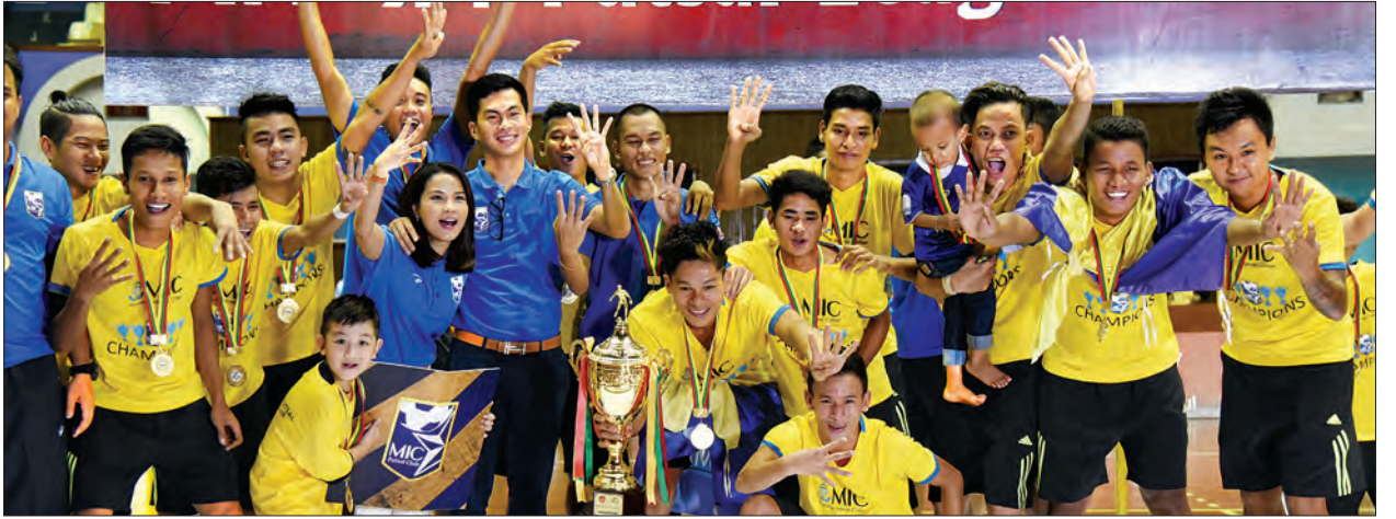
၂၀၁၆ ရာသီ ဖူဆယ်လိဂ်ပြိုင်ပွဲတွင် ဝိုက်စွဲခဲ့သည့် MIC အသင်း

Titan XII အသင်း၊ UM အသင်းနှင့် White Colour အသင်းတို့ ယှဉ်ပြိုင်မည်ဖြစ်သည်။ ပြိုင်ပွဲကို နှစ်ကျော့စနစ်ဖြင့် ကျင်းပမည်ဖြစ်ပြီး ပထမအကျော့ပွဲစဉ်များကို မတ် ၁ ရက်မှ ဧပြီ ၈ ရက်အထိ ကျင်းပမည်ဖြစ်သည်။ ပထမအကျော့ပွဲစဉ်များကို အပတ်စဉ် စနေနေ့များတွင် ပုံမှန်ကျင်းပမည်ဖြစ်ပြီး ဗုဒ္ဓဟူးနေ့တွင် တစ်ပတ်ခြားကျင်းပမည်ဖြစ်သည်။ ယခုပြိုင်ပွဲကို မြန်မာဘဝဂ္ဂိုဏ်းလီမိတက်က အမေရိကန်ဒေါ်လာ ၆၀၀၀၀ စပွန်ဆာပေးထားပြီး ဆုကြေးများအဖြစ် ပထမဆု ငွေကျပ်သိန်း ၅၀၊ ဒုတိယဆု ငွေကျပ်သိန်း ၃၀၊ တတိယဆု ငွေကျပ်သိန်း ၂၀၊ စတုတ္ထဆု ငွေကျပ် ၁၀ သိန်း၊ ချီးမြှင့်မည်ဖြစ်သည်။ ယခုပြိုင်ပွဲတွင်