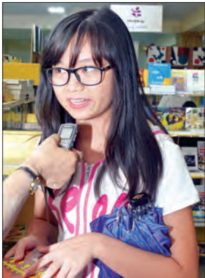
မသက်မွန်မြူး