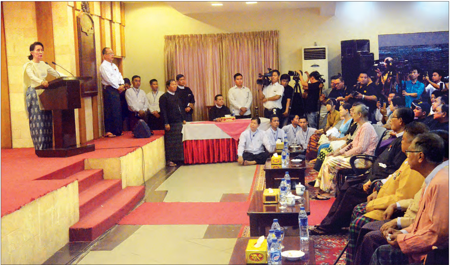
နိုင်ငံတော်၏အတိုင်ပင်ခံပုဂ္ဂိုလ် ဒေါ်အောင်ဆန်းစုကြည် တရားလွှတ်တော်ရှေ့နေ ဦးကိုနီနှင့် အငှားယာဉ်မောင်း ဦးနေဝင်းတို့အတွက် အောက်မေ့ဖွယ်အခမ်းအနားတွင် အမှာစကားပြောကြားစဉ်

ဆက်လက်၍ နိုင်ငံတော်၏ အတိုင်ပင်ခံပုဂ္ဂိုလ်က ဦးကိုနီသည် ဥပဒေအထောက်အကူပြု အဖွဲ့ထဲတွင် ပါဝင်ခဲ့ခြင်းမှာ ယုံကြည်ချက်နှင့် တရား ဥပဒေစိုးမိုးရေးအတွက် တက်တက်ကြွကြွ တတ်နိုင်သလောက် ပါဝင်ကူညီခဲ့သူ ဖြစ်ပါကြောင်း၊ မိမိတို့သည် ဦးကိုနီအား ရဲဘော်ရဲဘက် တစ်ယောက်အနေဖြင့် ရော၊ ဥပဒေပညာရှင်တစ်ယောက်အနေ ဖြင့်ပါ အင်မတန်မှ လေးစားပါကြောင်း၊ တန်ဖိုးထားပါကြောင်း၊ အလားတူ ပုဂ္ဂိုလ်မျိုး များများရှိမှသာ မိမိတို့နိုင်ငံ တွင် ကိုယ်လုပ်ချင်သည့်ကိစ္စကို တရား