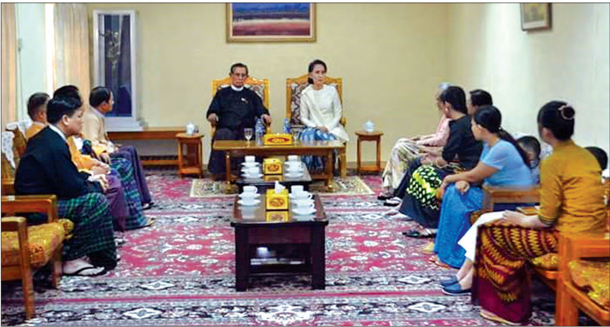
နိုင်ငံတော်၏ အတိုင်ပင်ခံပုဂ္ဂိုလ် ဒေါ်အောင်ဆန်းစုကြည်နှင့် အမျိုးသားဒီမိုကရေစီအဖွဲ့ချုပ်နာယက သူရဦးတင်ဦးတို့ ကျန်ရစ်သူနှစ်ဖက်မိသားစုဝင်များအား အားပေး စကားပြောကြားစဉ် (သတင်းစဉ်)

ချင်ကြောင်း၊ ကိုယ်မကျန်းမာလျှင် စိတ်ချမ်းသာရန်ခက်ကြောင်း၊ ကိုယ် ကျန်းမာသော်လည်း ပူပန်သောကမ္ဘာ နေလျှင်၊ စိတ်လုံခြုံမှုမရှိဘူးဆိုလျှင်၊ ကိုယ့်ပတ်ဝန်းကျင်တွင် လုံခြုံမှုမရှိဘူး ဆိုလျှင်၊ အေးငြိမ်းမှုမရှိဘူးဆိုလျှင် စိတ်လည်း မချမ်းသာပါကြောင်း၊ နိုင်ငံသူ နိုင်ငံသားအားလုံး၊ မိမိတို့နိုင်ငံတွင် မှီတင်းနေထိုင်သူများအားလုံး ကျန်းမာ ရန်၊ ချမ်းသာရန်ဆိုသည့် ရည်ရွယ်ချက် သည် မိမိတို့၏မြူဖြစ်ပါကြောင်း၊ လူသား များအတွက် ရည်ရွယ်ချက်၊ ယုံကြည် ချက် ဖြစ်ပါကြောင်း ပြောကြား သည်။ နိုင်ငံတစ်နိုင်ငံ၏ သမိုင်းအတွက်၊ အစိုးရတစ်ခုအတွက် ၁၀ လ၊ တစ်နှစ် ဆိုသည်မှာ ဘာမျှမဟုတ်ပါကြောင်း၊ ကာလတိုသာရှိပါသေးကြောင်း၊ ဒီလို ကာလတိုလေးအတွင်း မိမိတို့ဘာကျေနပ် ဖွယ်ရာတွေရှိခဲ့သလဲဆိုလျှင် ကျေနပ်ဖွယ် ရာများအသီးသီးရှိပါကြောင်း၊ ထိုကျေနပ်