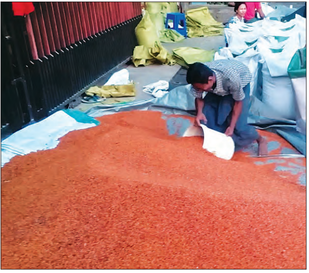
ငွေကျပ် ၁၀၃၀၀၀ အထိ ဈေးမြင့်တက် လာပါတယ်။

ကို ငွေကျပ် ၁၄၃၀၀၀ အထိ မြင့်တက် လာပေမယ့် သောကြာနေ့မှာတော့ တစ်အိတ်ကို ငွေကျပ် ၁၃၅၀၀၀ အထိ ဈေးလျော့ကျခဲ့ပါတယ်။ နှမ်းနက်ကတော့ တနင်္လာနေ့က တစ်အိတ်ကို အမြင့်ဆုံးဈေး ငွေကျပ် ၉၂၀၀၀ ကနေ ၉၃၀၀၀ ရှိပေမယ့် သောကြာနေ့မှာတော့ ငွေကျပ် ၈၈၀၀၀ ကနေ ငွေကျပ် ၉၃၀၀၀ ပေါက်ဈေးရှိ ပါတယ်။ နှမ်းညိုကလည်း ပြီးခဲ့တဲ့ တနင်္လာနေ့ မှာတော့ တစ်အိတ်ကို ငွေကျပ် ၈၂၀၀၀ အထိ မြင့်တက်နေပေမယ့် သောကြာနေ့မှာတော့ တစ်အိတ်ကို ငွေကျပ် ၇၂၀၀၀ ကနေ ငွေကျပ် ၇၅၀၀၀ အထိဈေးကျဆင်းသွားပါတယ်။ ပန်းနှမ်းကလည်း တနင်္လာနေ့က တစ်အိတ်ကို အမြင့်ဆုံးဈေး ငွေကျပ် ၇၈၀၀၀ ရှိခဲ့ပေမယ့် သောကြာနေ့မှာတော့ ငွေကျပ် ၇၅၀၀၀ ကနေ ငွေကျပ် ၇၆၀၀၀ အထိ တစ်အိတ်ကို ငွေကျပ် ၃၀၀၀ နီးပါး ဈေးကျဆင်းခဲ့ပါတယ်။ နှမ်းဖြူကတော့ တနင်္လာနေ့က တစ်အိတ်ကို အမြင့်ဆုံးဈေး ငွေကျပ် ၉၃၀၀၀ မှ ငွေကျပ် ၉၅၀၀၀ ပေါက်ဈေး ရှိခဲ့ပေမယ့် သောကြာနေ့မှာတော့ တစ်အိတ်ကို ငွေကျပ် ၉၅၀၀၀ ကနေ