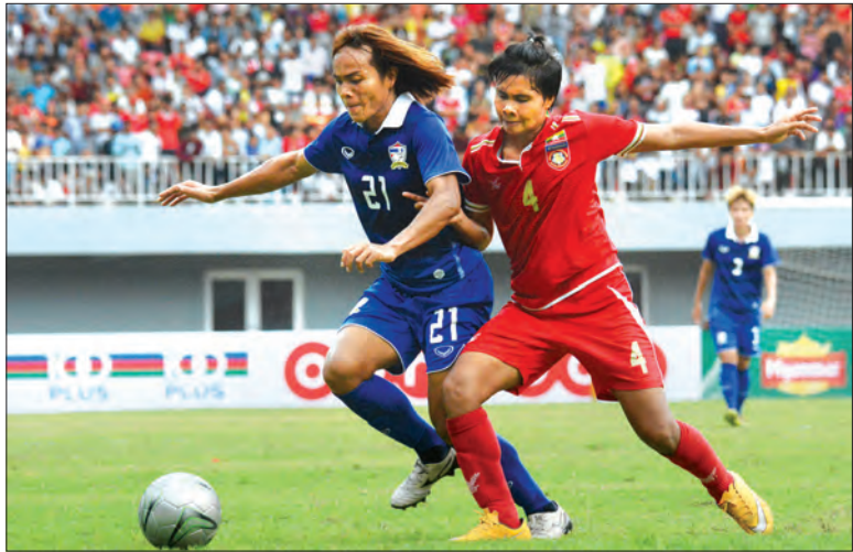
၂၀၁၆ ခုနှစ်က မြန်မာနှင့် ထိုင်းအမျိုးသမီးအသင်းတို့ မန္တလေးမြို့၌ ခြေစမ်းပွဲ ကစားစဉ်

အပြီးတွင် (၂၉)ကြိမ်မြောက် ဆီးရီးယားပြိုင်ပွဲအတွက် ဆက်လက်ပြိုင်ဆိုင်ရမည်ဖြစ်သည်။ မြန်မာအသင်းသည် ယခုနှစ်အတွင်း ယှဉ်ပြိုင်ရမည့် နိုင်ငံတကာပြိုင်ပွဲများအတွက် ၂၀၁၆ ခုနှစ် စက်တင်ဘာလကတည်းက ပြိုင်ဆိုင်ခဲ့ပြီး ဇန်နဝါရီလက တရုတ်၊ ယူကရိန်းနှင့် ထိုင်းအသင်းတို့ ဝင်ရောက်ယှဉ်ပြိုင်သော တရုတ်စိတ်ခေါ်ပြိုင်ပွဲတွင် အတွေ့အကြုံရရှိ