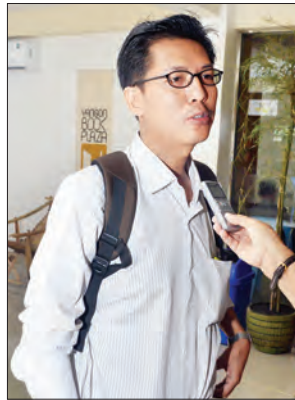
ကိုခွန်ရှားလှိုင်