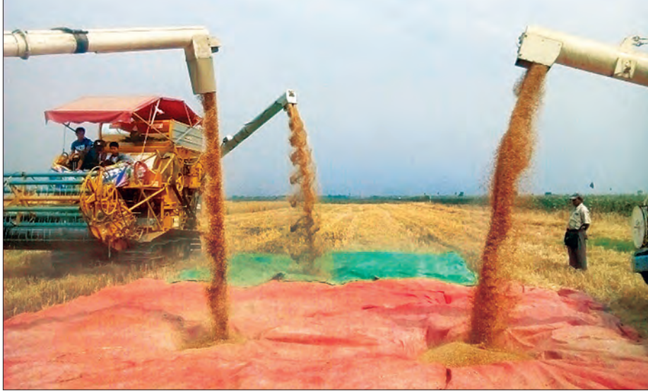
ယမန်နှစ်က ဂျုံစံပြုကွက်အား ရိတ်သိမ်းခြွေလှေ့စဉ်

ပေါက်အင်းစိုက်ကွင်းတွင် ကုလားပဲသီးနှံကို ရိတ်သိမ်း လျက်ရှိပြီး မျိုးကောင်းမျိုးသန့် မျိုးစေ့ထုတ် စိုက်ခင်းများမှ ထွက်ရှိလာသည့် ဂျုံ၊ ကုလားပဲ၊ စပ်မျိုးနေကြာ မျိုးစေ့များ ကိုလားမည့်နှစ်တွင် တိုင်းဒေသကြီးတစ်ခုလုံးအတွက် မျိုးလိုအပ်ချက်များကို ဖြည့်ဆည်းပေးရေးအတွက် စိုက်ပျိုးထုတ်လုပ်သွားမည်ဖြစ်ကာ အထွက်နှုန်းကောင်း ရာသီဥတုဒဏ်ခံနိုင်သည့် ဂျုံ ၊ ကုလားပဲ၊ စပ်မျိုး နေကြာ မျိုးများကို စိုက်ပျိုးလိုသည့် တောင်သူများ၊ ကုမ္ပဏီ များအနေဖြင့် ကော်ဖီ-ရာသီသီးနှံဌာနခွဲ ပေါက်အင်း စိုက်ကွင်းတွင် ဆက်သွယ်စုံစမ်း ဝယ်ယူနိုင်ပြီး စိုက်ပျိုး နည်းပညာများ သိရှိလိုပါကလည်း ဆက်သွယ်မေးမြန်း နိုင်ကြောင်း သိရသည်။