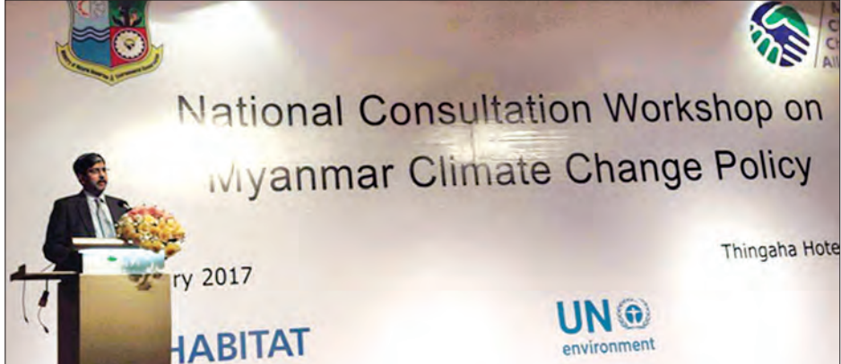
(၁၆-၂-၂၀၁၇)ရက်နေ့က သင်္ဃာတေတပ်မှ ပြုလုပ်သော မြန်မာနိုင်ငံအမျိုးသားအဆင့် ရာသီဥတုပြောင်းလဲမှု မူဝါဒရေးဆွဲရေး ဆိုင်ရာ အလုပ်ရုံဆွေးနွေးပွဲ

၁၉၈၀ ခုနှစ်လောက်ကစပြီး သဘာဝပတ်ဝန်းကျင်ထိန်းသိမ်းရေးသမားတွေ (environmentalist) က လူသားတွေရဲ့ လုပ်ဆောင်မှုတွေဟာ ကမ္ဘာ့ရာသီဥတုပြောင်းလဲမှုတွေကို ဖြစ်စေတယ်။ အထူးသဖြင့် ရုပ်ကြွင်းလောင်စာ (Fossil Fuel) အသုံးပြုမှုများကြောင့် ကာဗွန်ဓာတ်ငွေ့ စွန့်ထုတ်မှုများပြားလာတယ်။ အကျိုးဆက်ကတော့ ကမ္ဘာကြီးပူနွေးလာပြီး ပတ်ဝန်းကျင်ညစ်ညမ်းမှု မြေဆီလွှာအရည်အသွေးတွေကျဆင်းမှု စတဲ့ဆင်နွှဲခြင်းတွေ ဖြစ်လာတယ်တဲ့။ ဒါကြောင့်မို့ ကမ္ဘာကြီးကို ဘယ်သူတွေ ဖျက်ဆီးနေသလဲလို့မေးရင် လူသားတွေပါပဲလို့ ဖြေရမှာပါ။