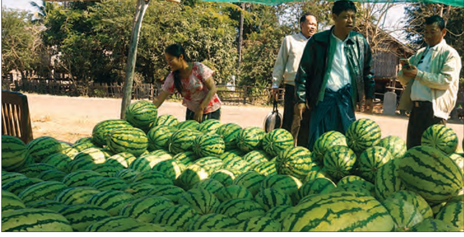
တွင်း ရောင်းချကြပြီး ဖရဲသီးသုံးလုံးကို ငွေကျပ် ၂၀၀၀ ဖြင့် ရောင်းချလျက် ရှိသည်။ ဖရဲခင်းကိုစိုက်ပျိုးရာတွင် ရေ၊ မြေ အဆင်သင့်ရှိရန်လိုကြောင်း၊ စိုက်ပျိုး

ဂန့်ဂေါမြို့နယ် ကျေးရွာများရှိ တောင်သူ များသည် ရေမြေ သင့်တော်သည့်နေရာ များ၌ ဆောင်းရာသီတွင် ဖရဲပင်များ စိုက်ပျိုးရာ အောင်မြင်ဖြစ်ထွန်း၍ ဒေသတွင်း ဖရဲသီးများ ရောင်းဝယ်မှု ဈေးကွက်ရှိလာသည်။ အဆိုပါ ဖရဲသီးမျိုးများကို မန္တလေး မြို့ရှိ မျိုးစေ့ဆိုင်များတွင် ဂန့်ဂေါ- မန္တလေး လိုင်းကားများဖြင့် မှာကြားဝယ်ယူရ ကြောင်းနှင့် အဆိုပါဖရဲမျိုးမှာ ဒေသတွင် ကလေးကြီးတံဆိပ်ဟု ခေါ်တွင်နေသည့် ကလေးပုံပါ ဖရဲသီးမျိုး သံဘူးဟု မှာယူရ ကြောင်း ကျွန်းဒတ်ကျေးရွာမှ ဖရဲစိုက် တောင်သူတစ်ဦးက ပြောသည်။