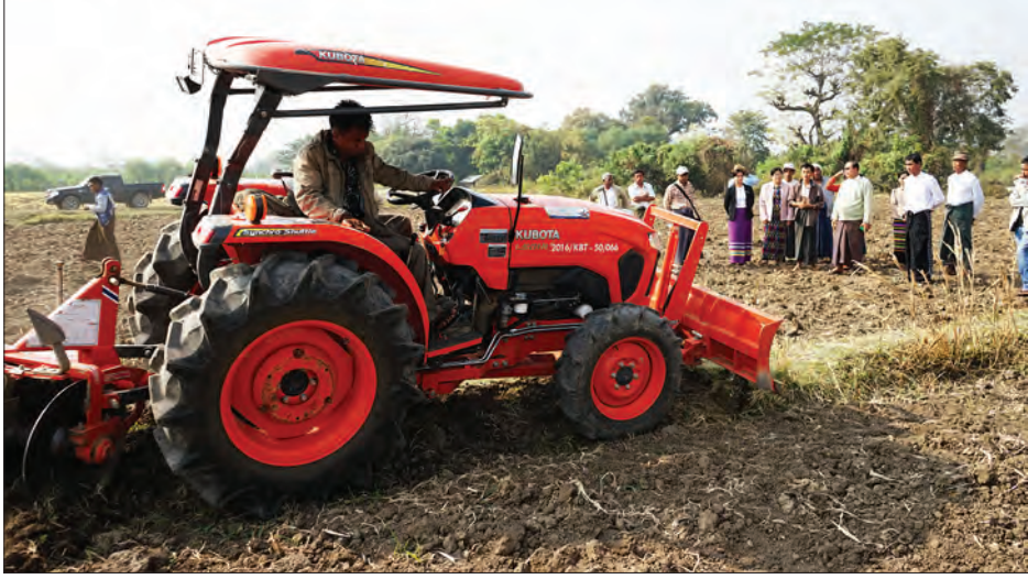
ဥက္ကဋ္ဌ ဦးသိန်းဝင်းက ကျေးဇူးတင်စကား ပြန်လည်ပြောကြားသည်။ ထို့နောက် အခမ်းအနားသို့ တက်ရောက်လာသော တိုင်းဒေသကြီး လွှတ်တော်ကိုယ်စားလှယ်၊ မြို့နယ်

မန္တလေးတိုင်းဒေသကြီး မြစ်သားမြို့နယ် လွန်ကျော်ကျေးရွာတွင် စိုက်ပျိုးရေး၊ မွေးမြူရေးနှင့် ဆည်မြောင်းဝန်ကြီးဌာန၊ သမဝါယမဦးစီးဌာနကကြီးမှူး၍ လွန်ကျော် စိုက်ပျိုးထုတ်လုပ်ရေးသမဝါယမအသင်းပိုင် လယ်ယာမြေများအား စက်မှုလယ်ယာစနစ် ကူးပြောင်းနိုင်ရေး မြေယာများ ပြုပြင်ဆောင်ရွက်ခြင်း အခမ်းအနားကို ဇေဇော်ဝါရီ ၂၁ ရက်က ကျင်းပသည်။