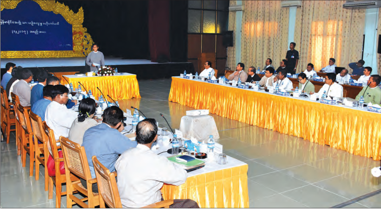
ဒုတိယသမ္မတ ဦးဟင်နရီပန်ထီးယူ မြန်မာနိုင်ငံအမျိုးသားယဉ်ကျေးမှုပဟိုကော်မတီ၏ ပထမအကြိမ် လုပ်ငန်းညှိနှိုင်းအစည်းအဝေးတွင် အမှာစကားပြောကြားစဉ်