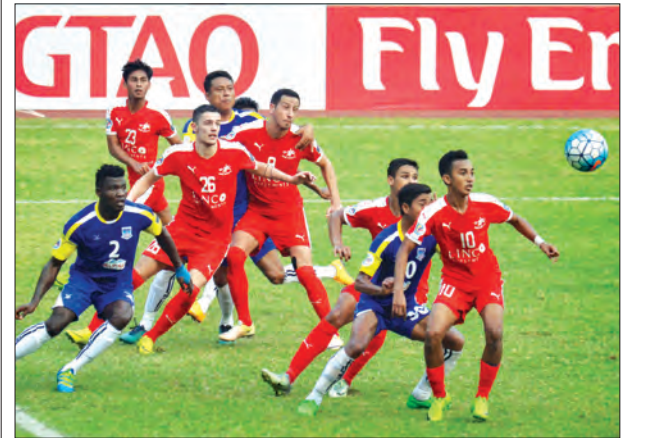
ရတနာပုံနှင့် ဟုမ်းယူနိုက်တက်အသင်းတို့ ယှဉ်ပြိုင်နေစဉ်