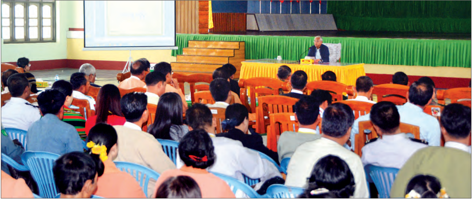
နိုင်ငံတော်သမ္မတ ဦးထင်ကျော် ကလေးမြို့နယ် ပြည်သူ့လူထုနှင့် တွေ့ဆုံစဉ် (သတင်းစဉ်)

ယင်းနောက် နိုင်ငံတော်သမ္မတနှင့် အဖွဲ့သည် ချင်းတွင်းတံတား(ကလေးဝ) တည်ဆောက်ရေး လုပ်ငန်းခွင်အတွင်း လုပ်ငန်းဆောင်ရွက်နေမှု အခြေအနေများကို ကြည့်ရှုစစ်ဆေးသည်။