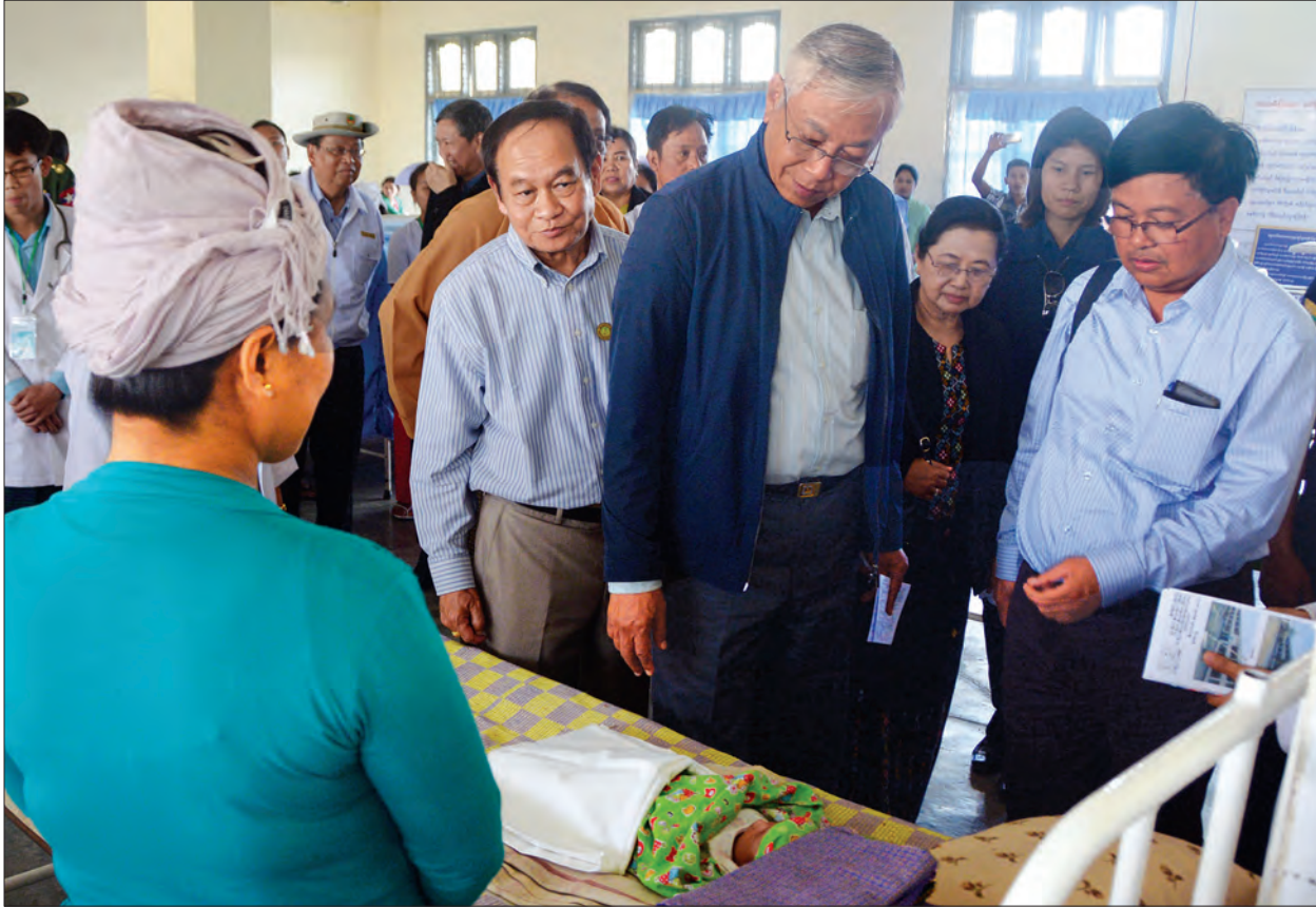
နိုင်ငံတော်သမ္မတ ဦးထင်ကျော်နှင့် ဇနီး ဒေါ်စုစုလွင်တို့ ကလေးမြို့ ပြည်သူ့ဆေးရုံကြီး၌ လှည့်လည်ကြည့်ရှုစဉ် (သတင်းစဉ်)

ထို့နောက် မြစ်သာတံတား (ကလေးဝ) တည်ဆောက်ထားမှုကို ကြည့်ရှုလေ့လာသည်။