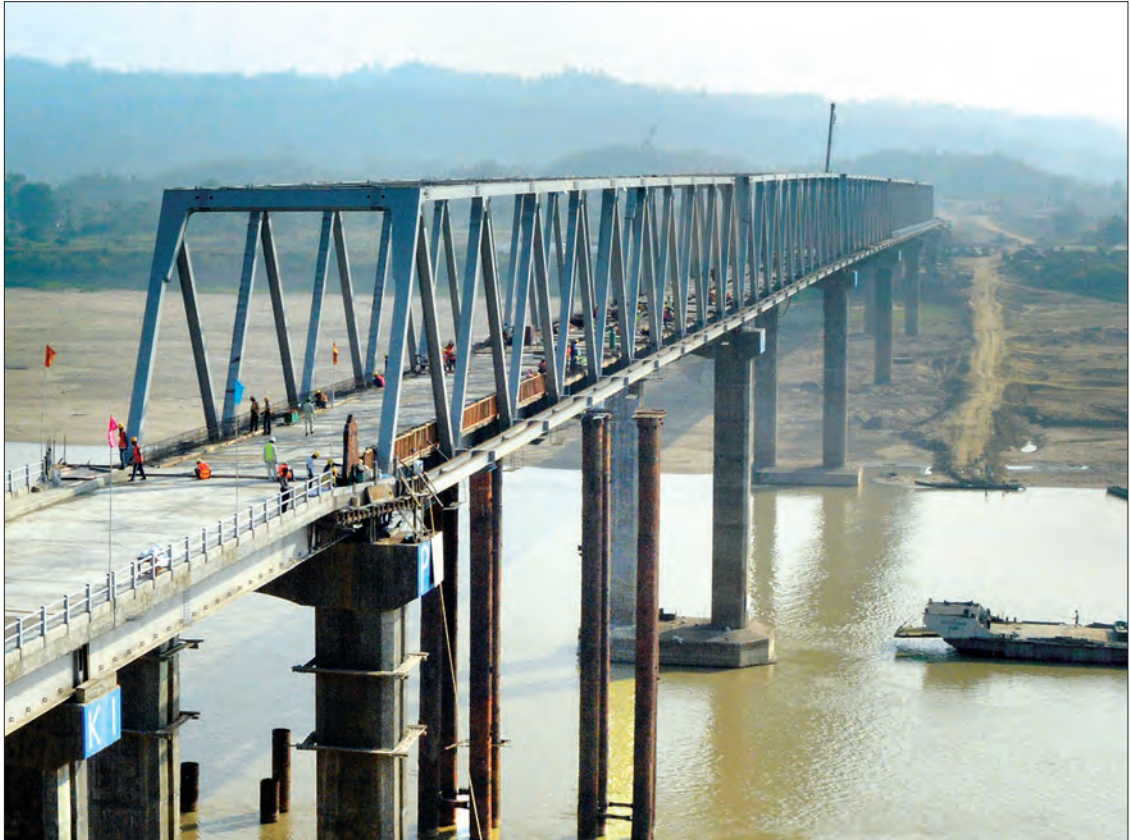
နိုင်ငံတော်သမ္မတ ဦးထင်ကျော်နှင့် ဇနီး ဒေါ်စုစုလွင်တို့ ချင်းတွင်းတံတား(ကလေးဝ) စီမံကိန်းလုပ်ငန်းခွင်ပြီးစီးမှုအခြေအနေကို ကြည့်ရှုစစ်ဆေးစဉ် (သတင်းစဉ်)

နေပြည်တော် ဖေဖော်ဝါရီ ၂၂ ချင်းတွင်းတံတား(ကလေးဝ) စီမံကိန်းလုပ်ငန်းခွင်ပြီးစီးမှုအခြေအနေကို ကြည့်ရှုစစ်ဆေးသည်။ ချင်းတွင်းတံတား(ကလေးဝ) စီမံကိန်းလုပ်ငန်းခွင်ပြီးစီးမှုအခြေအနေကို ကြည့်ရှုစစ်ဆေးစဉ် စာမျက်နှာ ၃ ကော်လံ ၁