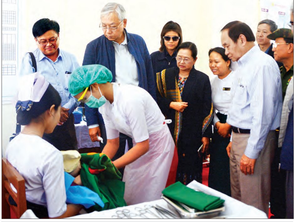
နိုင်ငံတော်သမ္မတ ဦးထင်ကျော်နှင့် ဇနီး ဒေါ်စုစုလွင်တို့ ကလေးမြို့ သူနာပြုနှင့် သားဖွားသင်တန်းကျောင်း၌ လက်တွေ့သင်ကြားနေမှုကို ကြည့်ရှုစဉ် (သတင်းစဉ်)

မလုပ်နိုင်ပါကြောင်း၊ ငွေရေးကြေးရေး အကန့်အသတ်ရှိပါကြောင်း၊ ပြည်သူများ အနေဖြင့် သည်းခံစေလိုပါကြောင်း၊ အစိုးရအနေဖြင့် လုပ်သည်၊ မလုပ်သည်ကို ပြည်သူများအနေဖြင့် စောင့်ကြည့်