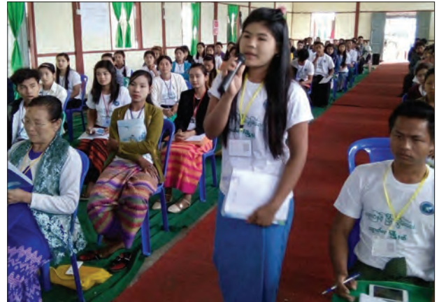
ကျောက်တော်မြို့နယ်၌ လူငယ်နှင့် ငြိမ်းချမ်းရေးဖိုရမ်ကျင်းပ