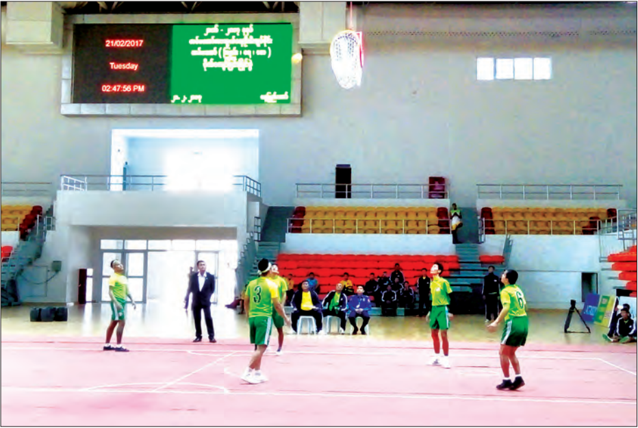
ပထမဆုရရှိသည့် ကာကွယ်ရေးဦးစီးချုပ်(ရေ)အသင်း ယှဉ်ပြိုင်ကစားစဉ်

ပြောပြသည်။ ကွင်းသွင်းခြင်းခတ်ပြိုင်ပွဲပွဲလုံးလုံး တွင် အသင်းတိုင်းအနေအထား ရမှတ် အများဆုံးရရှိကြသည့် ကာကွယ်ရေး ဦးစီးချုပ်(ရေ)အသင်း၊ ကာကွယ်ရေး ဦးစီးချုပ်(လေ)အသင်း၊ အလယ်ပိုင်း တိုင်းစစ်ဌာနချုပ်အသင်းနှင့် တောင်ပိုင်း တိုင်းစစ်ဌာနချုပ်အသင်းတို့ ယှဉ်ပြိုင် ကစားကြရာ ကာကွယ်ရေးဦးစီးချုပ် (ရေ)အသင်းက ရမှတ် ၆၃၀ ဖြင့် ပထမ၊ ကာကွယ်ရေးဦးစီးချုပ်ရုံး(လေ) အသင်းက ရမှတ် ၆၀၀ ဖြင့် ဒုတိယ ရရှိကာ အလယ်ပိုင်းတိုင်းစစ်ဌာနချုပ် အသင်းက ရမှတ် ၄၉၀ ဖြင့် တတိယ ရရှိခဲ့ကြောင်း သိရသည်။ သတင်း-သိမ်သိမ်(မြန်မာ့အလင်း)၊ ဓာတ်ပုံ-သိမ်