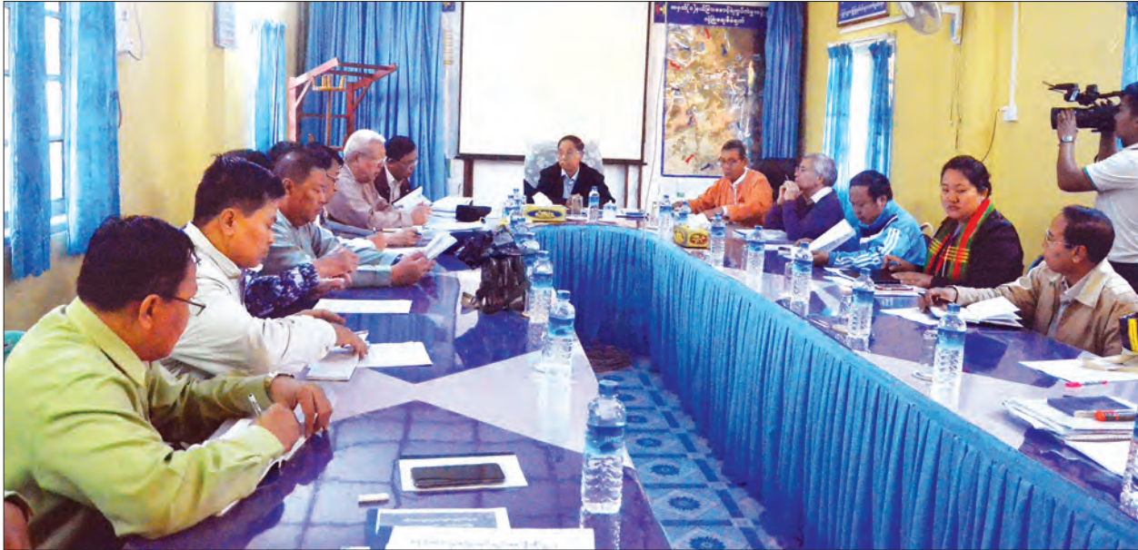
အစီအစဉ်ဖြင့် ကလေးငယ်များအား ပုံမှန်ကာကွယ်ဆေးထိုးခြင်း၊ ဆေးတိုက်ခြင်းနှင့် ကျေးရွာသူ ကျေးရွာသားများ

ယင်းနောက် ဒုတိယသမ္မတနှင့် အဖွဲ့ဝင်များသည် အဆိုပါအလယ်တန်းကျောင်း၌ ကာကွယ်ဆေးထိုး၊ ဆေးတိုက်လုပ်ငန်း အရှိန်အဟုန်မြှင့်တင်ရေး ပေါင်းစည်းကျန်းမာရေး စောင့်ရှောက်မှု