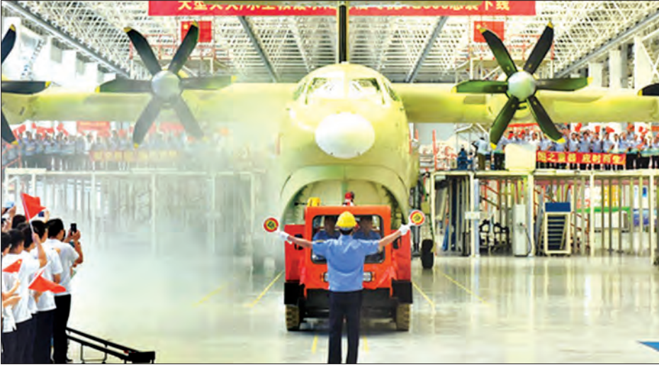
ကွမ်ကျိုး ဖေဖော်ဝါရီ ၁၅ တရုတ်နိုင်ငံ လေယာဉ်ကုမ္ပဏီတစ်ခုက တာဝန်ယူ တည်ဆောက်နေသော