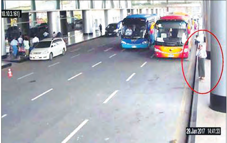
တရားခံ အောင်ဝင်းခိုင်အား လေဆိပ် CCTV မှတ်တမ်းများတွင် တွေ့ရှိရပုံ