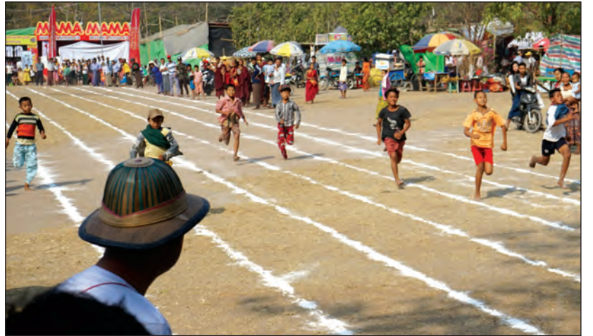
ပျော်ရွှင်စွာ ဝါဝင်ယှဉ်ပြိုင်ခဲ့ကြကြောင်း၊ ပြိုင်ပွဲများအပြီး တွင် ဆုရရှိသည့်ကလေးများအား အလှူရကြောင်း

နတ်မောက်မြို့ပေါ်ရှိ ပရဟိတအဖွဲ့များမှ လူငယ်များ ၏ ကြီးကြပ်မှုဖြင့် ပြိုင်ပွဲများကို ပိုလ်ချုပ်ကြေးရုပ်ရင်ပြင် ရှေ့၌ ကျင်းပခဲ့ခြင်းဖြစ်ကာ ပျော်ရွှင်ဖွယ်ရာ ပြိုင်ပွဲများ အနေဖြင့် ဆေးရောင်စုံပန်းချီပြိုင်ပွဲများ၊ မိတာ ၁၀၀ အပြေးပြိုင်ပွဲ၊ အုပ်ချုပ်ထိုးပြိုင်ပွဲ၊ အာလူးကောက်ပြိုင်ပွဲ၊ သံပုံးရိုက်ပြိုင်ပွဲ၊ ကုလားထိုင်လှပြိုင်ပွဲ၊ ချောတိုင်တက် ပြိုင်ပွဲ၊ လက်ဆင့်ကမ်းအပြေးပြိုင်ပွဲ၊ ခေါင်းအုံးရိုက်ပြိုင်ပွဲ နှင့် ဗန်းရွက်ပြိုင်ပွဲများကို ကျင်းပပေးခဲ့ပြီး မြို့ပေါ် ကျောင်းများမှ ကျောင်းသား ကျောင်းသူလေးများ