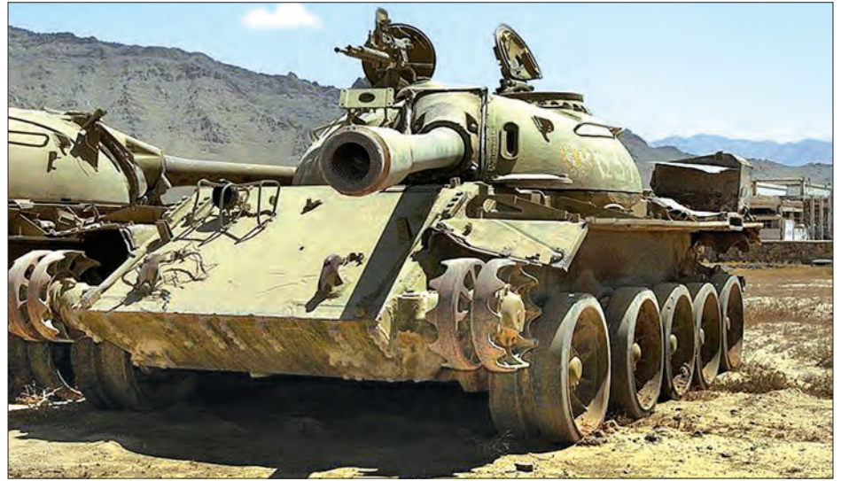
အာဖဂန်စစ်ပွဲတွင် အသုံးပြုသည့် တင့်ကားတစ်စီး

ဂူတာရက်စ်သည် ကုလသမဂ္ဂငြိမ်းချမ်းရေးနှင့် လုံခြုံရေးဆိုင်ရာ မဟာဗျူဟာ လုပ်ဆောင်ချက်နှင့် ဖွဲ့စည်းပုံများကို ပြန်လည်သုံးသပ်ရေးအတွက် ရုံးတွင်း အဖွဲ့တစ်ခုကို ဖွဲ့စည်းသွားမည်ဖြစ်ကြောင်း ကြေညာထားသည်။ (ဆင်ဟွာ)