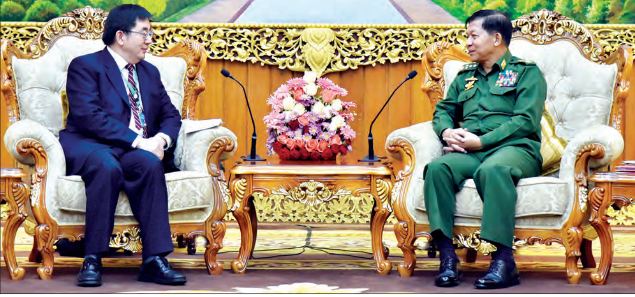
ယနေ့တွင် ဘောလုံးပြိုင်ပွဲ (က)အဆင့် ပထမအကြိမ်ပွဲအဖြစ် မြောက်ပိုင်း တိုင်းစစ်ဌာနချုပ်အသင်းနှင့် အလယ်ပိုင်းတိုင်းစစ်ဌာနချုပ်အသင်းတို့ ယှဉ်ပြိုင်ကစားခဲ့ ကြရာ မြောက်ပိုင်းတိုင်းစစ်ဌာနချုပ်အသင်းက မြောက်ပိုင်း-လေးဂိုးဖြင့် အနိုင်ရရှိပြီး ပိုလ်လှပသို့ တက်ရောက်သွားကြောင်း သတင်းရရှိသည်။ (သတင်းစဉ်)

ကြိုးစားယှဉ်ပြိုင်ကြရမည် တပ်မတော်ကာကွယ်ရေးဦးစီးချုပ်က ယခုနှစ်ပြိုင်ပွဲတွင် တပ်မတော်အားကစား နည်း ၂၉ မျိုးထဲမှ သတ်မှတ်ထားသည့် အားကစားနည်း ၁၄ မျိုးကို ယှဉ်ပြိုင်ကြရမည်ဖြစ် ကြောင်း၊ ပြိုင်ပွဲဝင်အားကစားအသင်းများ၊ စစ်သည်များအနေဖြင့် တစ်ဦးချင်း၏ အရည်အသွေးများ၊ အသင်းအဖွဲ့လိုက်အားကစားစွမ်းရည်များ တိုးတက်သည်ထက် တိုးတက်အောင် ကြိုးစားယှဉ်ပြိုင်ကြရမည်ဖြစ်ကြောင်း၊ ယခုပြိုင်ပွဲများမှ ထူးချွန် ထက်မြက်သည့် တပ်မတော်သားအားကစားသမားများပေါ်ထွက်လာပြီး နိုင်ငံ့ ဂုဏ်ဆောင်လက်ရွေးစင်အားကစားသမားကောင်းများကို ဆက်လက်မွေးထုတ်ပေးနိုင် မည်ဖြစ်ကြောင်း မှာကြားသည်။