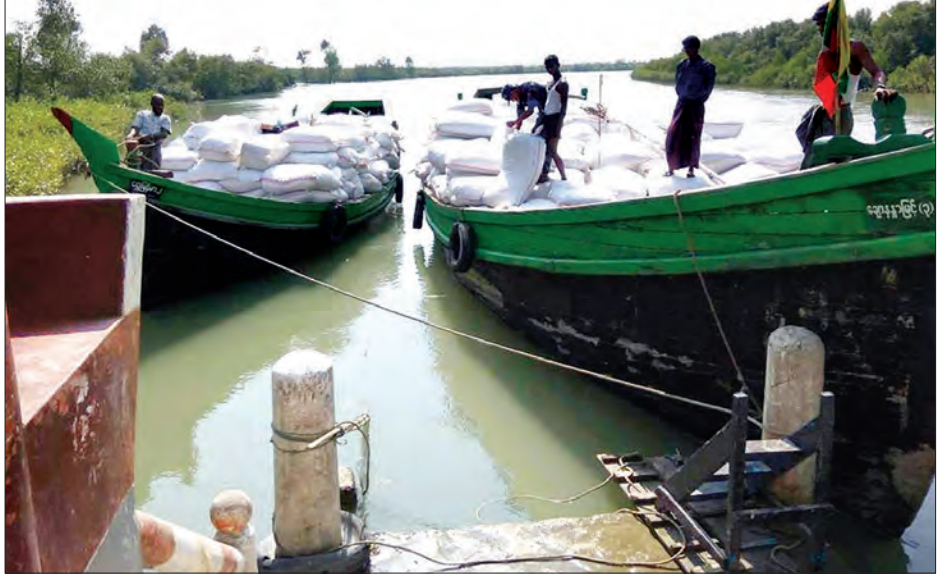
မောင်တော အမှတ်(၁) ဝင် / ထွက်စခန်း (POE) ၌ တစ်ဖက်နိုင်ငံသို့ တင်ပို့မည့် ကုန်ပစ္စည်းများကို တွေ့ရစဉ်

နေပြည်တော် ဖေဖော်ဝါရီ ၁၅ မြန်မာ-ဘင်္ဂလားဒေ့ရှ် နယ်စပ်ရှိ မောင်တော အမှတ်(၁) ဝင် / ထွက်စခန်း (POE) ကို ဖေဖော်ဝါရီ ၁၂ ရက်က ပြန်လည်ဖွင့်လှစ်ခဲ့ကြောင်း သိရသည်။ ၂၀၁၆ ခုနှစ် အောက်တိုဘာ ၉ ရက်က ရခိုင်ပြည်နယ် မောင်တောဒေသတွင် အကြမ်းဖက်ဖြစ်စဉ်များ ဖြစ်ပွားခဲ့ပြီးနောက် အဆိုပါအမှတ်(၁) ဝင် / ထွက်စခန်း (POE) မှ ဝင်ထွက်မှုများ ခေတ္တရပ်ဆိုင်းခဲ့ပြီး ယခုလက်ရှိအခြေအနေတွင် နယ်မြေတည်ငြိမ်အေးချမ်းမှု ပြန်လည်ရရှိလာသဖြင့် နယ်စပ်နယ်နိမိတ်စာချုပ်ပါအချက်များအရ ဥပဒေလုပ်ထုံးလုပ်နည်းများနှင့်အညီ မောင်တောမြို့ အမှတ်(၁)ဝင် / ထွက် စခန်းကို ဖေဖော်ဝါရီ ၁၂ ရက်မှစ၍ ဘင်္ဂလားဒေ့ရှ်နိုင်ငံနှင့် ညှိနှိုင်းဖွင့်လှစ်ခဲ့ကြောင်း သိရသည်။ (သတင်းစဉ်)