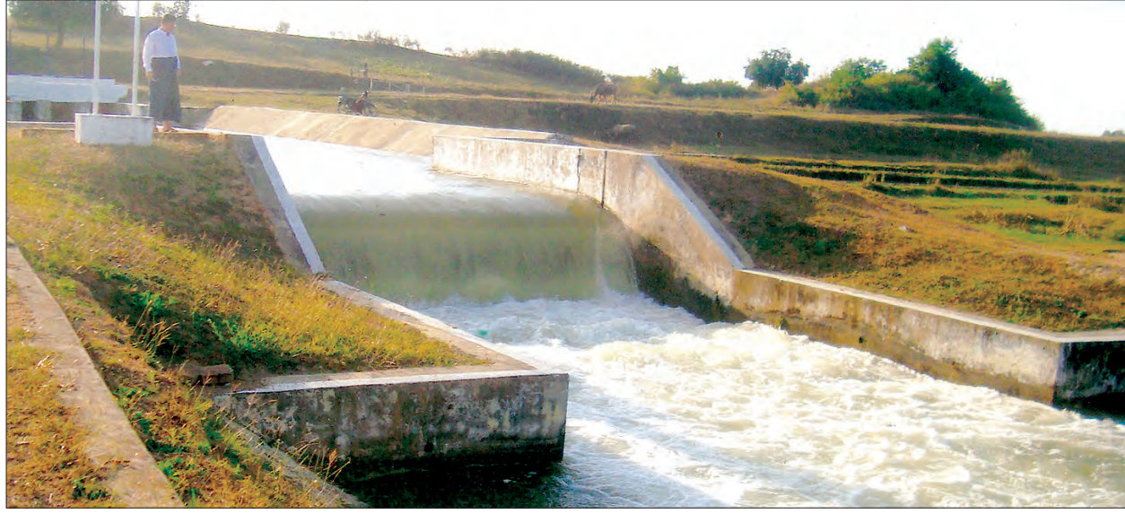
နွေစပါးအတွက် ဆွာချောင်းရေလျှောက်တံခံ ပင်မမြောင်းကြီးမှ ရေလွှတ်ပေးနေစဉ်