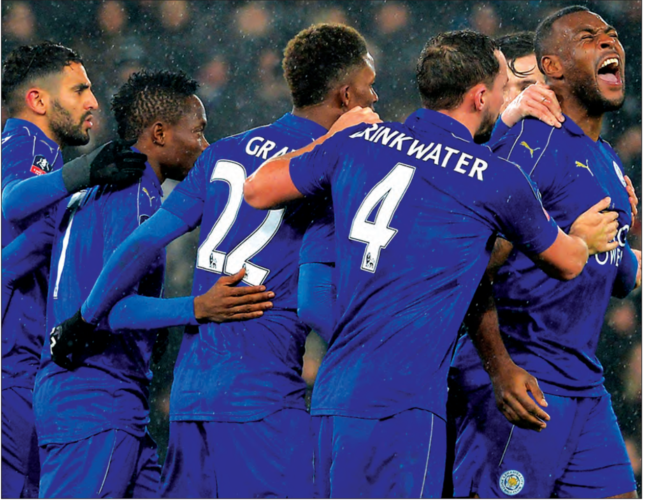
နဲ့ အောက်စ်ဖို့ဒ်အသင်းတို့ရဲ့ နောက်ဆုံးငါးပွဲမှာ သရေတစ်ပွဲသာဖြစ်ခဲ့ပြီး ကျန်လေးပွဲ ကို မစ်ဒယ်ဘရော့တို့ နိုင်ခဲ့တာမို့ အခုပွဲမှာလည်း မစ်ဒယ်ဘရော့တို့ နိုင်ပွဲပဲ ဖြစ်သွား ပါလိမ့်မယ်။ မီဝေါလ်နှင့် လက်စတာ ပထမတန်းပြိုင်ပွဲမှာ ခြေစွမ်းကောင်းတွေ ရရှိနေပြီး ပြိုင်ပွဲရဲ့ ၁၀ ပွဲ ဆက်တိုက်ရှုံးပွဲ မရှိတဲ့ မီဝေါလ်ဟာ ဒီပွဲက အိမ်ကွင်းဖြစ်တာကြောင့် ခြေစွမ်းကျဆင်းနေတဲ့ လက်စတာ

တို့ ပွဲကျပ်ပါပဲ။ ဒီနှစ် အက်ဖ်အေဖလားပွဲမှာ ခရီးဆက်နိုင်ရေး ဒါ့ဘီနဲ့ ပြန်ကန်ပွဲကစား ခဲ့ရတဲ့ လက်စတာရဲ့ ခြေစွမ်းက အားရစရာမကောင်းပါဘူး။ ဒီနှစ်သင်းရဲ့ နောက်ဆုံး ငါးပွဲတွေဆုံခဲ့မှုမှတ်တမ်းကိုကြည့်ရင် လက်စတာတို့ နှစ်ပွဲနိုင်ပြီး မီဝေါလ်တို့က သုံးပွဲ နိုင်ခဲ့ပါတယ်။ မီဝေါလ်ရဲ့ လက်ရှိခြေစွမ်းအရ အခုပွဲမှာ လက်စတာတို့ မျှော်မှန်းချက် တွေ ပြည့်ဝဖို့ မလွယ်ပါဘူး။ မီဝေါလ်တို့ နိုင်ပွဲပါပဲ။ မိုးမြင့်လင်းလက်