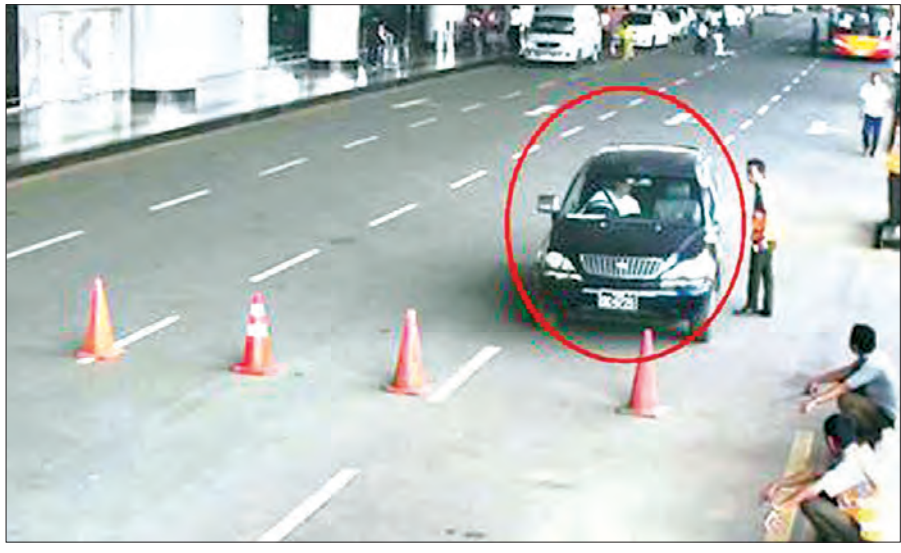
တရားခံ အောင်ဝင်းခိုင်၏ကားကို လေဆိပ် CCTV မှတ်တမ်းများတွင် တွေ့ရှိရပုံ