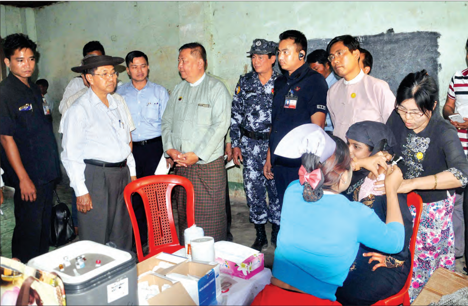
မောင်တော ဖေဖော်ဝါရီ ၁၅

ဖေဖော်ဝါရီ ၁၅ ရက်က ထုတ်ပြန်ခဲ့သည့် ကုလသမဂ္ဂ လူ့အခွင့်အရေးဆိုင်ရာ မဟာမင်းကြီးရုံးအဖွဲ့၏ အစီရင်ခံစာပါ အချက်များနှင့်စပ်လျဉ်း၍ မြေပြင်ကွင်းဆင်း စစ်ဆေးမှုများ ဆောင်ရွက်ရန် ရခိုင်ပြည်နယ် ကျီးကန်းပြင်၌ ရောက်ရှိနေသော စုံစမ်းစစ်ဆေးရေးကော်မရှင်ဥက္ကဋ္ဌ ဒုတိယသမ္မတ ဦးမြင့်ဆွေသည် ယနေ့နံနက် ၈ နာရီခွဲတွင် အမှတ်(၁) နယ်ခြားစောင့်ရဲ ကွပ်ကဲမှု အဖွဲ့မှူးရုံးအစည်းအဝေးခန်းမ၌ ကျင်းပသည့် ကော်မရှင်အဖွဲ့၏ ကွင်းဆင်းစစ်ဆေးတွေ့ရှိချက်နှင့် သုံးသပ်ချက်ညှိနှိုင်းအစည်းအဝေးသို့ တက်ရောက်သည်။