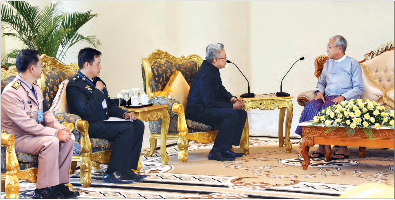
မြန်မာနိုင်ငံသံအမတ်ကြီး မစ္စတာ ပီစန ဆူဟာနာ ဂျာတာအား နိုင်ငံတော်သမ္မတ ဦးထင်ကျော် လက်ခံတွေ့ဆုံစဉ်

တွေ့ဆုံပွဲသို့ နိုင်ငံခြားရေးဝန်ကြီးဌာန ဒုတိယဝန်ကြီး ဦးကျော်တင်နှင့် တာဝန်ရှိသူများ တက်ရောက်ကြသည်။ (သတင်းစဉ်)