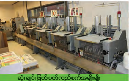
ဆွဲ၊ ချုပ်၊ ဖြတ်၊ ပတ်လည်စက်အမျိုးမျိုး