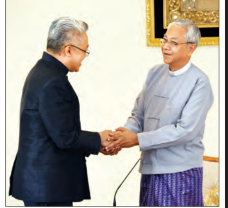
စာ >> ၃