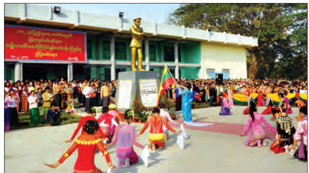
ဖေဖော်ဝါရီ ၁၃ ရက်က ဝန်းမော်မြို့၌ ပိုလ်ချုပ်အောင်ဆန်း ရုပ်တုဖွင့်ပွဲ ကျင်းပ စဉ်