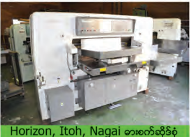
Horizon, Itoh, Nagai ဓားစက်ဆိုင်စုံ