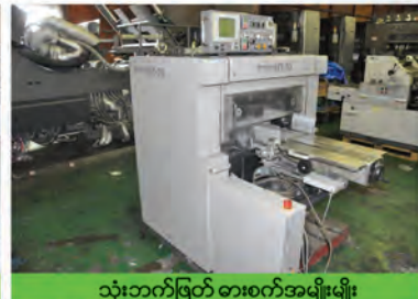
သုံးဘက်ဖြတ် ဓားစက်အမျိုးမျိုး