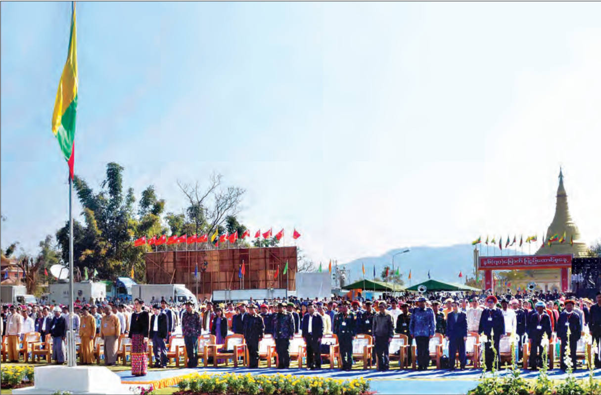
ဖေဖော်ဝါရီ ၁၂ ရက်က ပင်လုံမြို့တွင်ကျင်းပသော နှစ်(၇၀) မြောက် ပြည်ထောင်စုနေ့အခမ်းအနားတွင် နိုင်ငံတော်၏အတိုင်ပင်ခံပုဂ္ဂိုလ် ဒေါ်အောင်ဆန်းစုကြည်နှင့် အခမ်းအနားတက်ရောက်လာကြသူများ နိုင်ငံတော်အလံအား အလေးပြုကြစဉ် (သတင်းစဉ်)