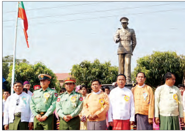
ဖြူမြို့နယ် ဖြူးချောင်းအနီး၌ စိုက်ထူဖွင့်လှစ်ခဲ့သော ပိုလ်ချုပ်အောင်ဆန်း ကြေးရုပ်တုရှေ့တွင် တာဝန်ရှိသူများ စုပေါင်းမှတ်တမ်းတင် ဓာတ်ပုံရိုက်စဉ် သန့်ဇင်