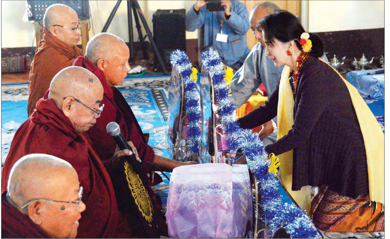
နိုင်ငံတော်၏ အတိုင်ပင်ခံပုဂ္ဂိုလ် ဒေါ်အောင်ဆန်းစုကြည် ဗိုလ်ချုပ်အောင်ဆန်း၏ ၁၀၂ နှစ်မြောက် မွေးနေ့အထိမ်းအမှတ်အဖြစ် သံဃာတော်များထံ လှူဖွယ်ပစ္စည်းများ လှူဒါန်းစဉ်

ပိတယ်”ဟု ပြောကြားသည်။ ယင်းနောက် နိုင်ငံတော်၏ အတိုင်ပင်ခံပုဂ္ဂိုလ်က အဝါရောင်မျိုးဆက်သစ်လူငယ်ပရဟိတအသင်းနှင့် ဒေါ်ကြီးထားပါနဲ့ များများစားကြပါလည်း ကျန်းမာမှာ ဖြစ်ပါတယ်။ အားလုံးကို ကျေးဇူးတင်