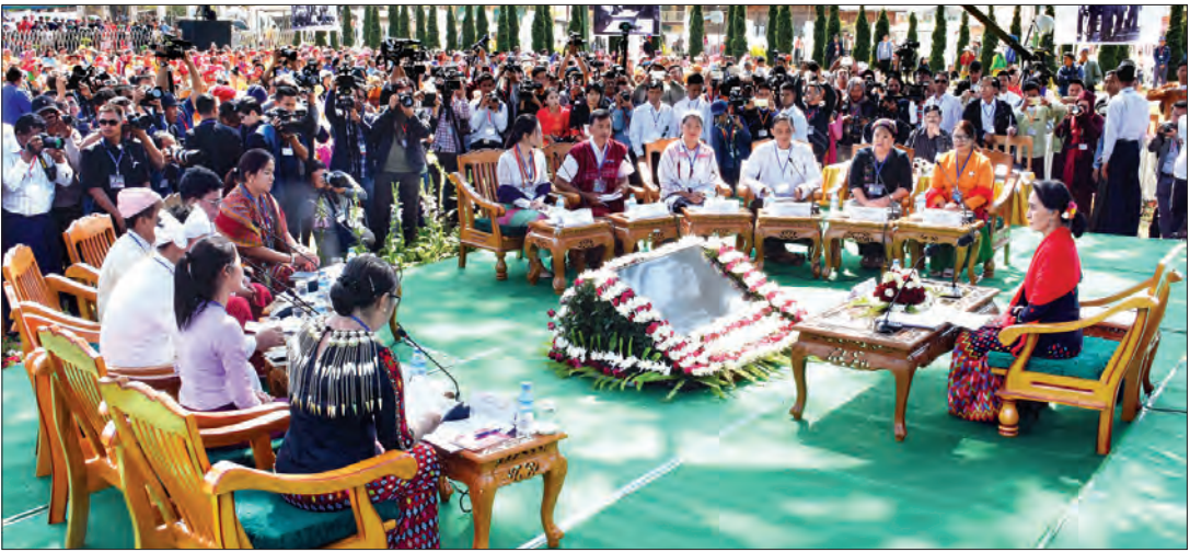
နိုင်ငံတော်၏ အတိုင်ပင်ခံပုဂ္ဂိုလ် ဒေါ်အောင်ဆန်းစုကြည်နှင့် တိုင်းရင်းသားများ၏ ပင်လုံငြိမ်းချမ်းရေးစကားပိုင်း (Panglong Peace Talk) အစီအစဉ် ကျင်းပစဉ် (သတင်းဓာတ်)

ကျွန်မကတော့ ကရင်အမျိုးသားအဆင့် နိုင်ငံရေးဆွေးနွေးပွဲမှာ တောက်လျှောက်ပါခဲ့တယ်။ နော်ဒီးလာ(လိုင်ဇာ)မှာကလည်းက တောက်လျှောက်ပါခဲ့တဲ့သူ တစ်ယောက်အနေနဲ့ အခု ကရင်အမျိုးသားအဆင့် နိုင်ငံရေးဆွေးနွေးပွဲဆိုရင် ပင်လုံကိုရောက်တာနဲ့ ပြန်ပြောင်းပြီးသတိရတာက ပင်လုံအနှစ်သာရအပြည့်နဲ့ ကျွန်မတို့လုပ်ခဲ့ကြလို့သာ အခုတစ်နိုင်ငံလုံးကလည်း ပြောနေတယ်။ ကရင်ပွဲက အလွန်အောင်မြင်တယ်။ ကရင်ပွဲကို အားရတယ်။ ကျေနပ်တယ်ပေါ့။ တကယ်တမ်းမှာ ဘယ်လိုပုံစံမျိုးနဲ့ လုပ်ခဲ့ကြတာလဲဆိုတော့ အခက်အခဲတွေ အများကြီး ရှိခဲ့ကြပါတယ်။ ညှိနှိုင်းရတယ်။ ယုံယုံကြည်ကြည်နဲ့ ကိုယ့်ကိုယ်ကိုယ် အရင်စတာပေါ့။ ကိုယ့်ကိုယ်ကိုယ် အရင်ယုံကြည်ရတယ်။ ပြီးတော့မှ ကိုယ့်ရဲ့လုပ်ဖော်ကိုင်ဖက်ပေါ့။ ဒါမှမဟုတ်ရင် ပူးတွဲပြီး အလုပ်လုပ်မယ့်သူတွေကိုလည်း ယုံကြည်ရတယ်။ ပြီးတော့ ညီညွတ်ညွတ်နဲ့ တစ်ဦးကိုတစ်ဦး လေးစားသမှုနဲ့ သူတူညီမျှ၊ စကားတစ်ခွန်းက အမြဲတမ်း ကျွန်မခေါင်းထဲမှာ ပေါ်နေတာက အမျိုးသားအဆင့် နိုင်ငံရေးဆွေးနွေးပွဲကို စတင်စဉ်တဲ့အခါမှာ ပူးတွဲလုပ်ရတဲ့ ကော်မတီတွေက အများကြီးပါ။ ကရင်တွေဘက်အခြမ်းကတောင် ကရင်တိုင်းရင်းသားလက်နက်ကိုင်က သုံးဖွဲ့၊ ကရင်ပါတီက ငါးဖွဲ့၊ ဘာသာရေးခေါင်းဆောင်တွေ CSO တွေ၊ အဲဒီကနေမှ ကော်မတီတစ်ခု ဆိုတာဖြစ်လာပါတယ်။ အဲဒီမှာ မတူကွဲပြားမှုတွေက နောက်ခံ အကြောင်းအရာတွေ