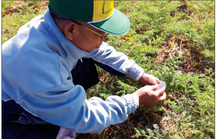
ဥကုပ်ပါးနကျယ်ကောင်များပါဝင်သော ကတ်များကို စိုက်ခင်းအတွင်း ချိတ်ဆွဲနေစဉ် စာတမ်းများ၊ စာအုပ်များကိုလည်း ပံ့ပိုးကူညီခြင်း ရေးဦးစီးဌာန တာဝန်ရှိသူများ၏ ပြောကြားချက် များ ဆောင်ရွက်ပေးလျက်ရှိကြောင်း ခရိုင်စိုက်ပျိုးရေး ဦးစီးဌာနမှ သိရသည်။ ဇွတ်ကုန်

မင်းဘူးခရိုင် စိုက်ပျိုးရေးဦးစီးဌာနအနေဖြင့် ခရိုင်အတွင်း စိုက်ပျိုးရေးလုပ်ငန်းများ တိုးတက် ရေးအတွက် မင်းဘူး၊ ပွင့်ဖြူ၊ စလင်း၊ စေတုတ္တရာ နှင့် ငမဲမြို့နယ် စိုက်ပျိုးရေးဦးစီးဌာနများမှ သီးနှံ ကာကွယ်ရေးတာဝန်ခံများ၊ မြေအသုံးချရေး တာဝန်ခံများအား ပိုးသတ်ဆေးနှင့် ဓာတ်မြေ သြဇာ ပြုပြင်အကြောင်း သင်တန်းများ၊ အရောင်း ဆိုင်များကို ကြီးကြပ်စစ်ဆေးခြင်းဆိုင်ရာ သင်တန်းများ ပို့ချပေးပြီး လိုအပ်သည့် စာရွက်