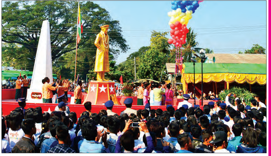
ဖေဖော်ဝါရီ ၁၃ ရက်က နေပြည်တော် တပ်ကုန်းမြို့၌ ပိုလ်ချုပ်အောင်ဆန်း၏ ရုပ်တုဖွင့်ပွဲအခမ်းအနား စည်ကားစွာ ကျင်းပစဉ် တင်ထွန်းတာ