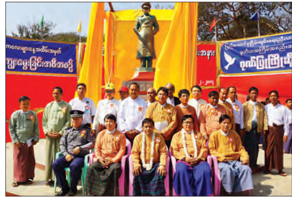
ဖေဖော်ဝါရီ ၁၃ ရက်က ညောင်ဦးမြို့၌ ဖွင့်လှစ်ခဲ့သော ပိုလ်ချုပ်အောင်ဆန်း ကြေးရုပ်တုရှေ့တွင် တာဝန်ရှိသူ များ စုပေါင်း မှတ်တမ်းတင် ဓာတ်ပုံရိုက်စဉ် ရဲသူရအောင်