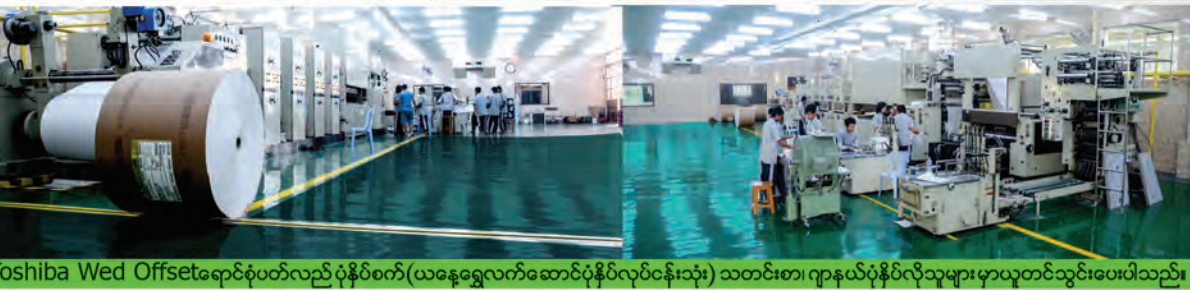
Toshiba Wed Offsetရောင်းစုံပတ်လည် ပုံနှိပ်စက်(ယနေရွှေလက်ဆောင်ပုံနှိပ်လုပ်ငန်းသုံး) သတင်းစာ၊ ဂျာနယ်ပုံနှိပ်လိုသူများ မှာယူတင်သွင်းပေးပါသည်။

ပုံပိုးကူညီနိုင်သော ဝန်ဆောင်မှုများကို မိတ်ဆွေများစိတ်ချမ်းသာမှုရရှိသည်အထိ ကူညီပေးနေပါပြီ။