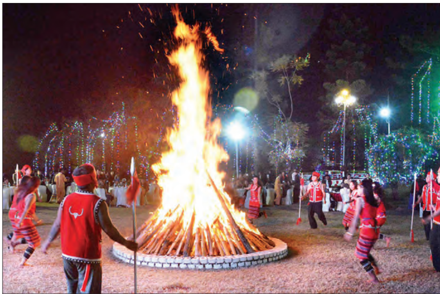
ဖေဖော်ဝါရီ ၁၂ ရက်က တောင်ကြီးမြို့၌ကျင်းပသော နှစ်(၇၀) မြောက် ပြည်ထောင်စုနေ့အခမ်းအနားတွင် တိုင်းရင်းသား များ ရှမ်းရိုးရာမီးပုံပွဲ ပျော်ရွှင်စွာ ဆင်နွှဲစဉ် (သတင်းစဉ်)