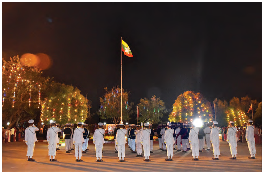
ဖေဖော်ဝါရီ ၁၂ ရက်က နေပြည်တော်၌ နှစ်(၇၀) မြောက် ပြည်ထောင်စုနေ့ နိုင်ငံတော်အလံတင် အခမ်းအနားကျင်းပစဉ် (သတင်းစဉ်)