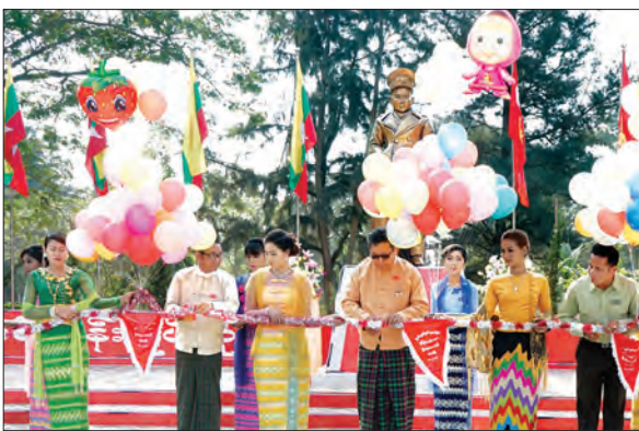
ဖေဖော်ဝါရီ ၁၃ ရက်က မန္တလေးတိုင်းဒေသကြီး စဉ့်ကူးမြို့၌ ပိုလ်ချုပ်အောင်ဆန်း ရုပ်တုဖွင့်ပွဲအခမ်းအနား ကျင်းပစဉ် ဝင်းမောင်