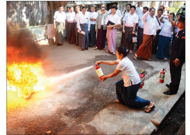
စာနယ်ဇင်းမှ ဝန်ထမ်းတစ်ဦး မီးသတ်သရုပ်ပြသစဉ်