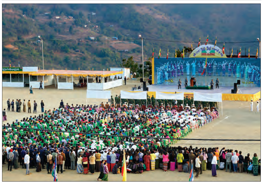
နှစ်(၇၀) မြောက် ပြည်ထောင်စုနေ့အခမ်းအနားကို ဖေဖော်ဝါရီ ၁၂ ရက်က ဖလမ်းမြို့၊ ရာပြည့်အားကစားကွင်း၌ စည်ကား သိုက်မြိုက်စွာ ကျင်းပစဉ် (ခရိုင် ပြန်/ဆက်)