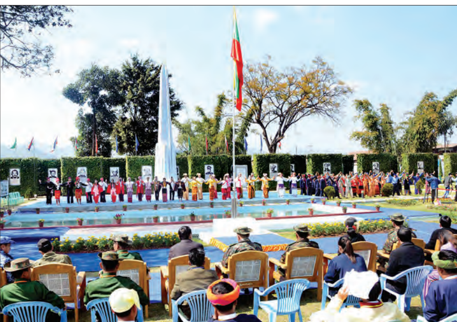
နှစ်(၇၀) မြောက် ပြည်ထောင်စုနေ့အခမ်းအနားကို ဖေဖော်ဝါရီ ၁၂ ရက်က ပင်လုံမြို့၌ ကျင်းပစဉ် (သတင်းစဉ်)