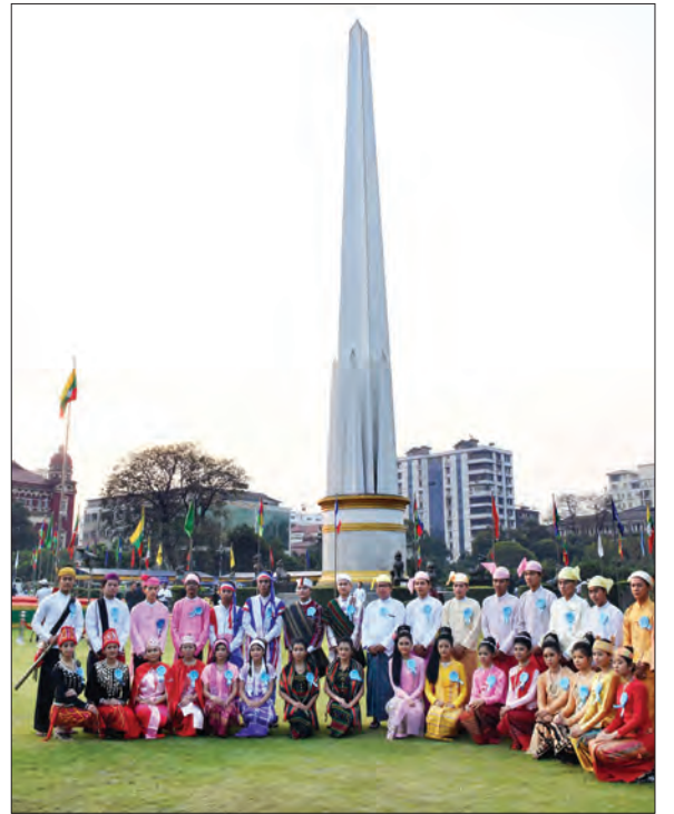
နှစ်(၇၀) မြောက် ပြည်ထောင်စုနေ့အခမ်းအနားကို ဖေဖော်ဝါရီ ၁၂ ရက်က ရန်ကုန်မြို့၊ မဟာဝန္ဓုလပန်းခြံ၌ကျင်းပရာ တက်ရောက်လာသည့် တိုင်းရင်းသားညီအစ်ကိုများ လွတ်လပ်ရေးကျောက်တိုင်ရှေ့၌ စုပေါင်း မှတ်တမ်းတင် ဓာတ်ပုံရိုက်စဉ် (သတင်းစဉ်)