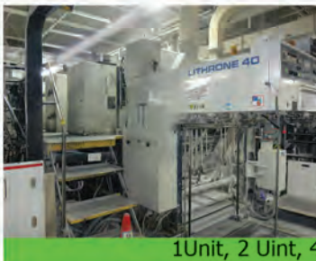
1Unit, 2 Unit, 4Unit အော့ဖ်စက်အမျိုးမျိုး