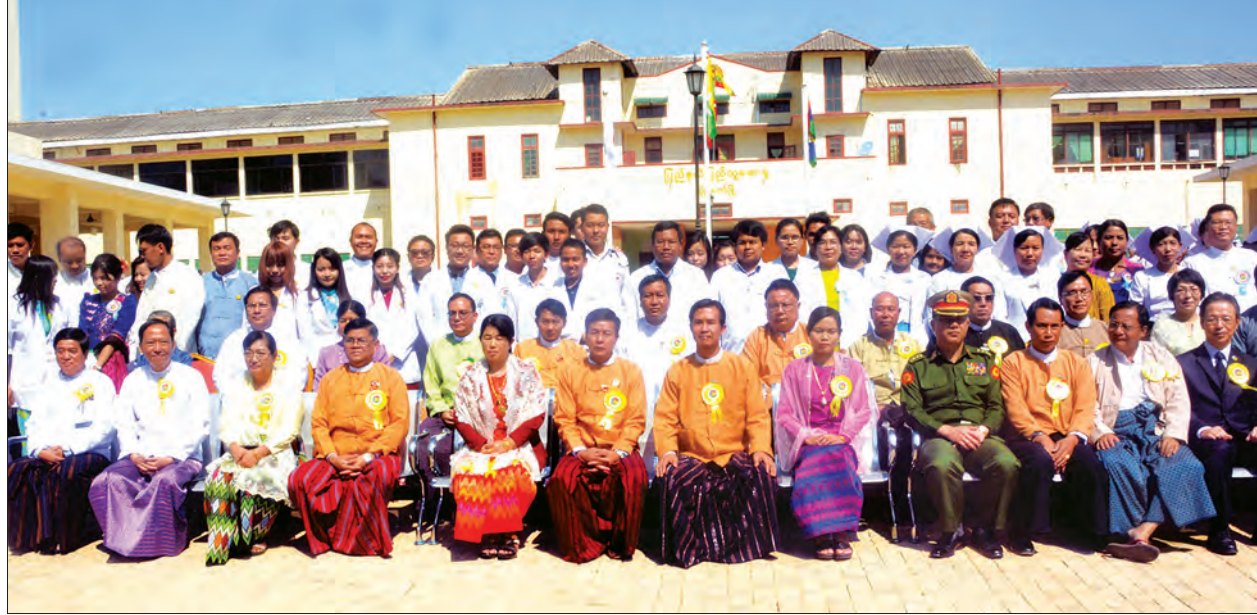
ပြည်နယ်ဝန်ကြီးချုပ် ဦးအယ်လ်စောင်ရွှေနှင့် တာဝန်ရှိသူများ လွိုင်ကော်ခုတင် (၅၀၀)ဆံ့ ပြည်သူ့ဆေးရုံကြီး လွှဲပြောင်းပေးအပ်ပွဲအပြီး စုပေါင်းမှတ်တမ်းတင် ဓာတ်ပုံရိုက်စဉ်

ဂျပန်နိုင်ငံက အကူအညီအဆင်ပြေ တင် မွမ်းမံတည်ဆောက်ပေးသည့် ကယားပြည်နယ် လွိုင်ကော် ခုတင်(၅၀၀) ဆံ့ ပြည်သူ့ဆေးရုံကြီးကို ကျန်းမာရေးနှင့် အားကစားဝန်ကြီးဌာနသို့ လွှဲပြောင်း ပေးအပ်သည့်အခမ်းအနားကို ယနေ့ နံနက် ၁၁ နာရီတွင် အောင်မြင်စွာကျင်းပ ခဲ့သည်။ အခမ်းအနားတွင် ကယားပြည်နယ် ဝန်ကြီးချုပ် ဦးအယ်လ်စောင်ရွှေက ဆေးရုံဆိုင်ဘုတ်ကို စက်ခလုတ်နှိပ် ဖွင့်လှစ်ပေးပြီး စည်ပင်သာယာရေးနှင့် လူမှုရေးဝန်ကြီး ဒေါက်တာအောင်ကျော် ဌေး၊ ကျန်းမာရေးနှင့် အားကစားဝန်ကြီး ဌာန အမြဲတမ်းအတွင်းဝန် ပါမောက္ခ ဒေါက်တာ သက်ခိုင်ဝင်း၊ ဂျပန်သံရုံးမှ Counsellor Mr. Hideaki Matsuo၊ ကုသရေးဦးစီးဌာနမှ ဒုတိယညွှန်ကြား ရေးမှူးချုပ် ဒေါက်တာဌေးအောင်နှင့်