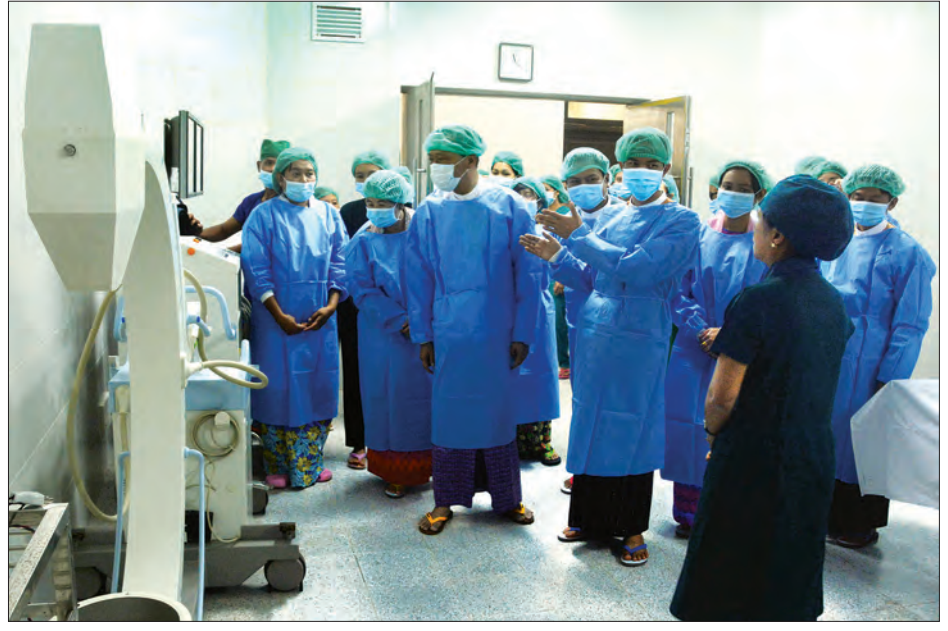
ပြည်နယ်ဝန်ကြီးချုပ် ဦးအယ်လ်စောင်ရွှေနှင့် တာဝန်ရှိသူများ ဆေးရုံကြီးအတွင်း လှည့်လည်ကြည့်ရှုစဉ်

ဌာန၊ ပုံရိပ်ဖော်ဌာန၊ ရောဂါပေဒဌာန၊ ခွဲစိတ်ဌာန၊ ခွဲစိတ်ခန်းမ စသည်ဖြင့် ဌာန အလိုက် ကုသဆောင်ရွက်ပေးသွားမည် ဖြစ်ပြီး ပင်မအဆောက်အအုံ (အနောက် ဘက်ခြမ်း) တွင် သားဖွားနှင့် မီးယပ်ဌာန၊ ရူပဗေဒဆေးကုဌာန၊ နား၊ နှာခေါင်း၊ လည်ချောင်းဌာနနှင့် အထွေထွေရောဂါ ကုဌာနစသည်ဖြင့် ခွဲခြားကုသပေးလျက် ရှိကြောင်း သိရသည်။ ယခု အဆင်ပြေတင်မွမ်းမံတည် ဆောက်ပေးခဲ့သော လွိုင်ကော်ပြည်သူ့ ဆေးရုံကြီးတွင် အသုံးအဆောင်ပစ္စည်း များအဖြစ် လျှပ်စစ်ဆိုင်ရာအသုံး အဆောင်ပစ္စည်းများ၊ လျှပ်စစ်ဓာတ်အား ဖြန့်ဖြူးသည့် ပစ္စည်းကိရိယာများ၊ မီးစက် များ၊ မိုးကြိုးလွှဲစနစ်၊ မီးသတ်ပေးစနစ်၊ ICT ဆိုင်ရာပစ္စည်းများ၊ လေအေးပေး စက်များ၊ ရေပိုက်လိုင်းစနစ်၊ ဆေးဘက် ဆိုင်ရာဓာတ်ငွေ့စနစ်၊ ခုတင် ပစ္စည်းသိမ်း ဝိရိ၊ စားပွဲခုံ၊ လျှပ်စစ်မီး စသည်တို့အပြင် ဆေးရုံအတွက် လိုအပ်သော အဓိက ပစ္စည်းကိရိယာများဖြစ်သည့် လူနာတင် ယာဉ်များ၊ မေ့ဆေးပေးစက်များ၊ သွေးစစ် ကိရိယာများ၊ အဆင်ပြေခွဲစိတ်ကိရိယာ ပစ္စည်းအစုံများ၊ မွေးကင်းစကလေး အနွေးပေးစက်၊ ခွဲစိတ်ခန်းသုံး အဏုကြည့်မှန်ပြောင်း၊ အောက်ဆီဂျင် အားဖြည့်ကိရိယာ၊ လူနာစောင့်ကြည့် ပြသပေးသည့် စက်ကိရိယာ၊ အီးစီဂျီ၊ အသက်ရှူစက်နှင့် အဆင်ပြေဓာတ်မှန် ရိုက်စက် စသည်တို့ကို ခေတ်နှင့်လျော်ညီ စွာ အသုံးပြုနိုင်ရန် ကူညီထောက်ပံ့ တပ်ဆင်ပေးခဲ့ကြောင်း သိရသည်။ ခုတင်(၅၀၀) ဆံ့ လွိုင်ကော်ပြည်သူ့ ဆေးရုံကြီး အဆင်ပြေတင်မွမ်းမံတည် ဆောက်မှုကို ကျန်းမာရေးနှင့် အားကစား ဝန်ကြီးဌာနနှင့် ဂျပန်အပြည်ပြည်ဆိုင်ရာ ပူးပေါင်းဆောင်ရွက်ရေး အေဂျင်စီ (JICA) တို့ ပူးပေါင်းဆောင်ရွက်ခြင်း ဖြစ်ပြီး Toda Corporation က တာဝန် ယူတည်ဆောက်ကာ Mitsubishi Corporation က လိုအပ်သော ပစ္စည်း များကို ကူညီထောက်ပံ့ပေးခဲ့ကြောင်း သိရသည်။