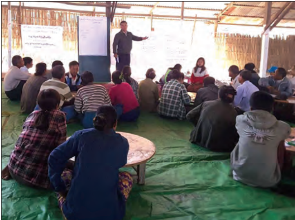
(Community Finance Training)နှင့် စောင့်ကြည့်ကြီးကြပ်ရေးသင်တန်း (Monitoring & Evolution Training)များကို ဖွင့်လှစ်ပေးနေခြင်းဖြစ်ကြောင်း သိရသည်။ (၀၇၇)

မြို့နယ်နည်းပညာအကြံပေးအဖွဲ့(TTA)၊ မြို့နယ်အဆင့် DRD Counterpart လူထုစည်းရုံးရေးမှူး (Community Facilitator)နှင့် လက်ထောက် နည်းပညာမှူး(Technical Facilitator)များ ပူးပေါင်းကာ မြောင်းမြမြို့နယ်အတွင်း ကျေးရွာအဆင့် စီမံကိန်းအကောင်အထည်ဖော်မှု သင်တန်းများအဖြစ် စီမံခန့်ခွဲမှုသင်တန်း (Community Management Training)၊ ကျေးရွာအဆင့် ဝယ်ယူရေး သင်တန်း(Community Procurement Training)၊ ဘဏ္ဍာရေးသင်တန်း