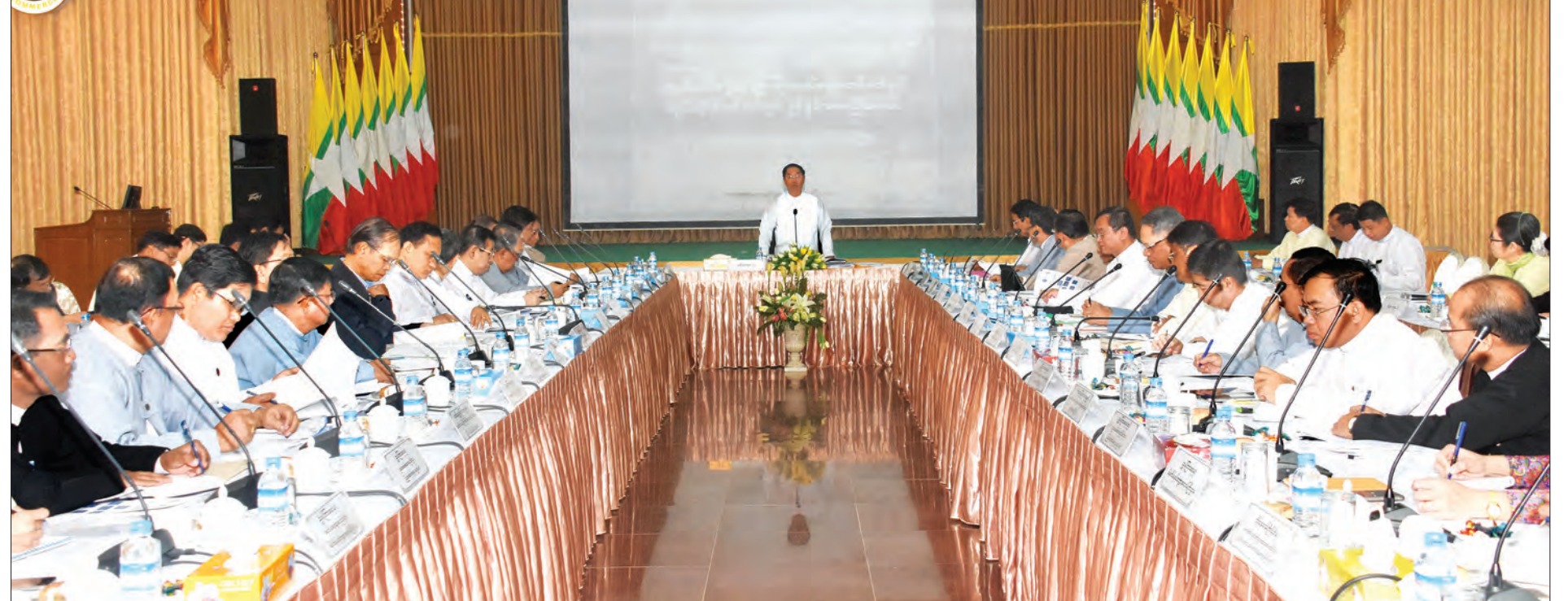
ပုဂ္ဂလိကကဏ္ဍ ဖွံ့ဖြိုးတိုးတက်ရေး ကော်မတီဥက္ကဋ္ဌ ဒုတိယသမ္မတ ဦးမြင့်ဆွေ ပုဂ္ဂလိကကဏ္ဍ ဖွံ့ဖြိုးတိုးတက်ရေးကော်မတီနှင့် လုပ်ငန်းကော်မတီများ ညှိနှိုင်းအစည်းအဝေးတွင် ဆွေးနွေးမှာကြားစဉ် (သတင်းစဉ်)

ပုဂ္ဂလိကကဏ္ဍ ဖွံ့ဖြိုးတိုးတက်ရေးကော်မတီဥက္ကဋ္ဌ ဒုတိယသမ္မတ ဦးမြင့်ဆွေသည် ယနေ့နံနက် ၉ နာရီခွဲတွင် နေပြည်တော်ရှိ စီးပွားရေးနှင့် ကူးသန်းရောင်းဝယ်ရေးဝန်ကြီးဌာန၌ ကျင်းပသည့် ပုဂ္ဂလိကကဏ္ဍ ဖွံ့ဖြိုးတိုးတက်ရေးကော်မတီနှင့် လုပ်ငန်းကော်မတီများ ညှိနှိုင်းအစည်းအဝေးသို့ တက်ရောက် ဆွေးနွေးမှာကြားသည်။