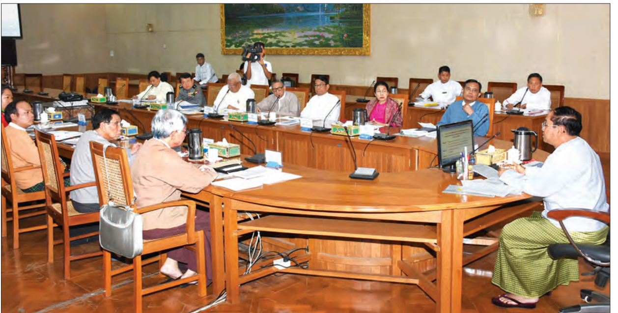
မောင်တောဒေသ စုံစမ်းစစ်ဆေးရေးကော်မရှင် အစည်းအဝေး(၄/၂၀၁၇) ကျင်းပစဉ် (သတင်းစဉ်)