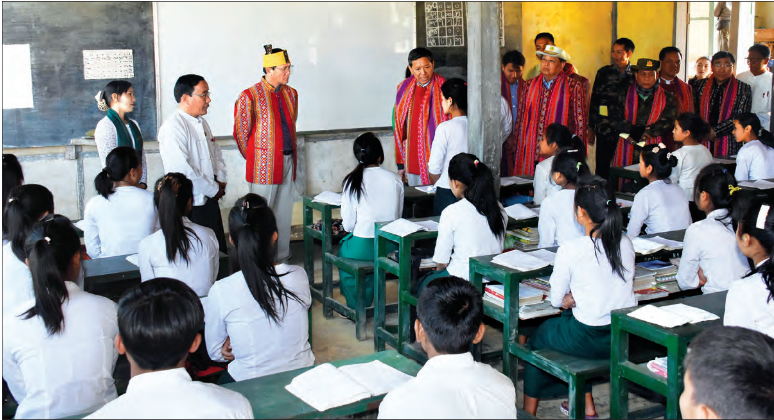
ဒုတိယသမ္မတ ဦးဟင်နရီဗန်ထီးယူ ထန်တလန်မြို့ အမှတ်(၁)အခြေခံပညာအထက်တန်းကျောင်း၌ ကျောင်းသား၊ ကျောင်းသူများ၏ သင်ယူမှု၊ တတ်မြောက်မှုအခြေအနေကို ကြည့်ရှုစစ်ဆေးစဉ် (သတင်းစဉ်)

နေပြည်တော် ဖေဖော်ဝါရီ ၇ ဒုတိယသမ္မတ ဦးဟင်နရီဗန်ထီးယူသည် ပြည်ထောင်စုဝန်ကြီးများ၊ ချင်းပြည်နယ် ဝန်ကြီးချုပ်၊ ဒုတိယဝန်ကြီးများနှင့်အတူ ယမန်နေ့တွင် ဟားခါးမြို့နှင့် ထန်တလန် မြို့ ဖွံ့ဖြိုးရေးလုပ်ငန်းများအား ကြည့်ရှု စစ်ဆေးပြီး ဒေသခံများနှင့်တွေ့ဆုံကာ ဒေသလိုအပ်ချက်များကို မေးမြန်း ဆွေးနွေးသည်။ ရှေးဦးစွာ ဟားခါးမြို့ အမှတ်(၁) အခြေခံပညာ အထက်တန်းကျောင်း နှစ်ထပ် ကျောင်းဆောင်သစ်ဖွင့်ပွဲသို့ တက်ရောက်ရာ ပြည်ထောင်စုဝန်ကြီး ဒေါက်တာ မျိုးသိမ်းကြီး၊ ချင်းပြည်နယ် ဝန်ကြီးချုပ် ဦးဆလှိုင်လွန်လွယ်၊ ချင်း ပြည်နယ်လွှတ်တော်ဥက္ကဋ္ဌ ဦးစိုဘွေနှင့် ပြည်နယ်ဝန်ကြီး ဦးပေါင်လွန်းမင်းထန် တို့က နှစ်ထပ်ကျောင်းဆောင်သစ်ကို ဖဲကြီးဖြတ်ဖွင့်လှစ်ပေးကြသည်။ ထို့နောက် ဒုတိယသမ္မတက အမှတ်(၁) အခြေခံပညာအထက်တန်း ကျောင်း နှစ်ထပ်ကျောင်းဆောင်သစ် ကမ္ဘာ့မော်ကွန်းကို စက်ခလုတ်နှိပ် ဖွင့်လှစ်ပေးပြီး အမွှေးနံ့သာရည်များ ပတ်ဖျန်းပေးသည်။ စာမျက်နှာ ၅ ကော်လံ ၁ ○