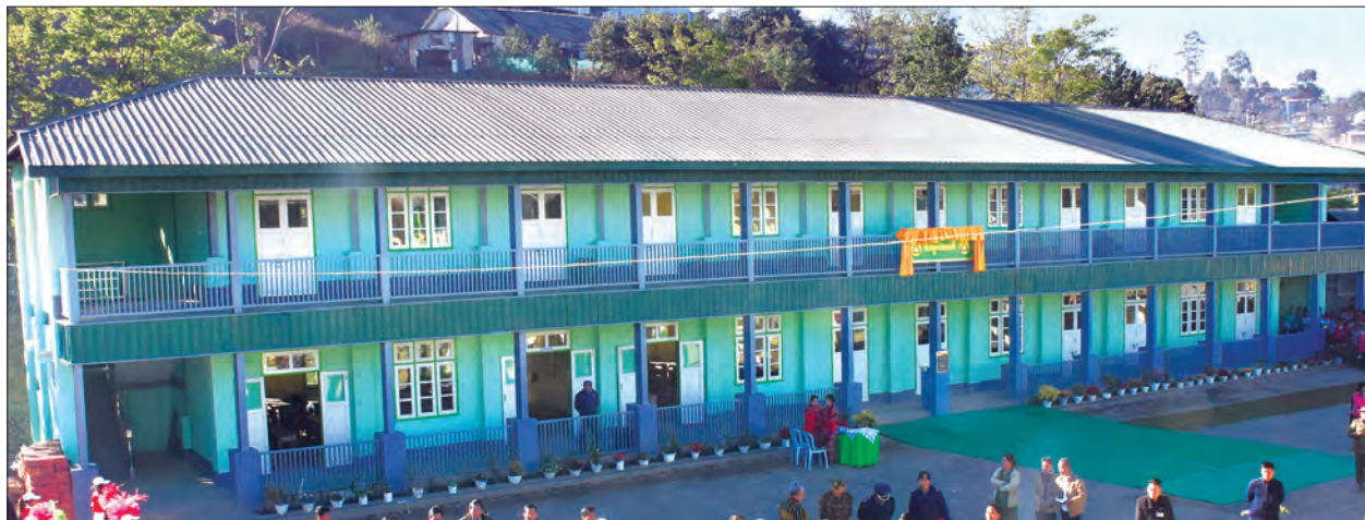
ဟားခါးမြို့ အမှတ်(၁) အခြေခံပညာအထက်တန်းကျောင်း၏ နှစ်ထပ်ကျောင်းဆောင်သစ်ကို တွေ့ရစဉ်

ကျောစုံမှ ယင်းနောက် ဒုတိယသမ္မတသည် အခမ်းအနားသို့ တက်ရောက်လာကြသူများနှင့်အတူ စုပေါင်းမှတ်တမ်းတင်ဓာတ်ပုံရိုက်ပြီး နှစ်ထပ်ကျောင်းဆောင်သစ်ကို ကြည့်ရှုစစ်ဆေးသည်။ ထို့နောက် ဗိုလ်တိုက်ချွန်းခန်းမ၌ ဟားခါးမြို့နယ်လူထုနှင့် ရင်းရင်းနှီးနှီး တွေ့ဆုံရာ ဒေသခံများက ဟားခါးမြို့ သဘာဝဘေးအန္တရာယ် ကြိုတင်ကာကွယ်ရေး၊ လမ်းပန်းဆက်သွယ်ရေး၊