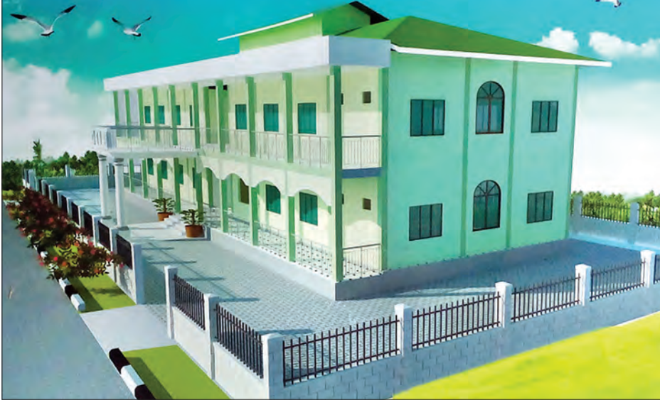
သထုံမြို့နယ်အတွင်း အသစ်ဆောက်လုပ်မည့် သံဃာ့ဆေးရုံသစ်ပုံစံပုံစံ

သထုံဂိလာနသံဃာ့ဆေးရုံသစ်တွင် အနယ်နယ်အရပ်ရပ်မှ မည်သည့် သံဃာတော်များမဆို တက်ရောက်ကုသမှုခံယူနိုင်ပြီး သံဃာတော်အားလုံးအား ဆွမ်းကွမ်း လှူဒါန်းခြင်းဆောင်ရွက်ပေးမည် ဖြစ်သော်လည်း ဆေးကုသစရိတ်များကို မူ သထုံမြို့နယ် ဂိလာနသံဃာတော်များစောင့်ရှောက်ရေးအဖွဲ့အနေဖြင့် ရန်ပုံငွေအခက်အခဲကြောင့် မြို့နယ်သံဃာ့နာယကအဖွဲ့မှ အသိမှတ်ပြုထားသည့် သထုံမြို့နယ်အတွင်းရှိ ကျောင်းတိုက် အသီးသီးမှ သံဃာတော်များကိုသာ ဦးစားပေး ထောက်ပံ့ပေးမည်ဖြစ်ကြောင်း သိရသည်။ ယခုဆောက်လုပ်မည့် သံဃာ့ဆေးရုံသစ်မှာ အလျား ပေ ၁၀၀၊ အနံ ၃၈ ပေ၊ အမြင့် ၁၂ ပေ၊ နှစ်ထပ် အဆောက်အအုံ ဖြစ်သည်။ တန်ဖိုးငွေကျပ် ၂၇၈၇ သိန်း ကုန်ကျမည်ဖြစ်ပြီး သံဃာတော် အပါပဲ ၄၀ ခန့် တက်ရောက်ကုသနိုင်မည်ဖြစ်ကာ ဆေးရုံဆောက်လုပ်ရန်နှင့် ဆေးရုံပြီးစီးပါက တက်ရောက်ကုသမှု ခံယူကြမည့် ဂိလာနသံဃာတော်များအား ကျန်းမာရေး စောင့်ရှောက်မှုများအတွက် အလှူငွေများလိုအပ်လျက်ရှိရာ သထုံမြို့နယ် သံဃာ့နာယကအဖွဲ့နှင့် ဂိလာနသံဃာတော်များ စောင့်ရှောက်ရေးအဖွဲ့တို့သို့ ဆက်သွယ်လှူဒါန်းနိုင်ကြောင်း သိရသည်။ သက်ဦး(သထုံ)