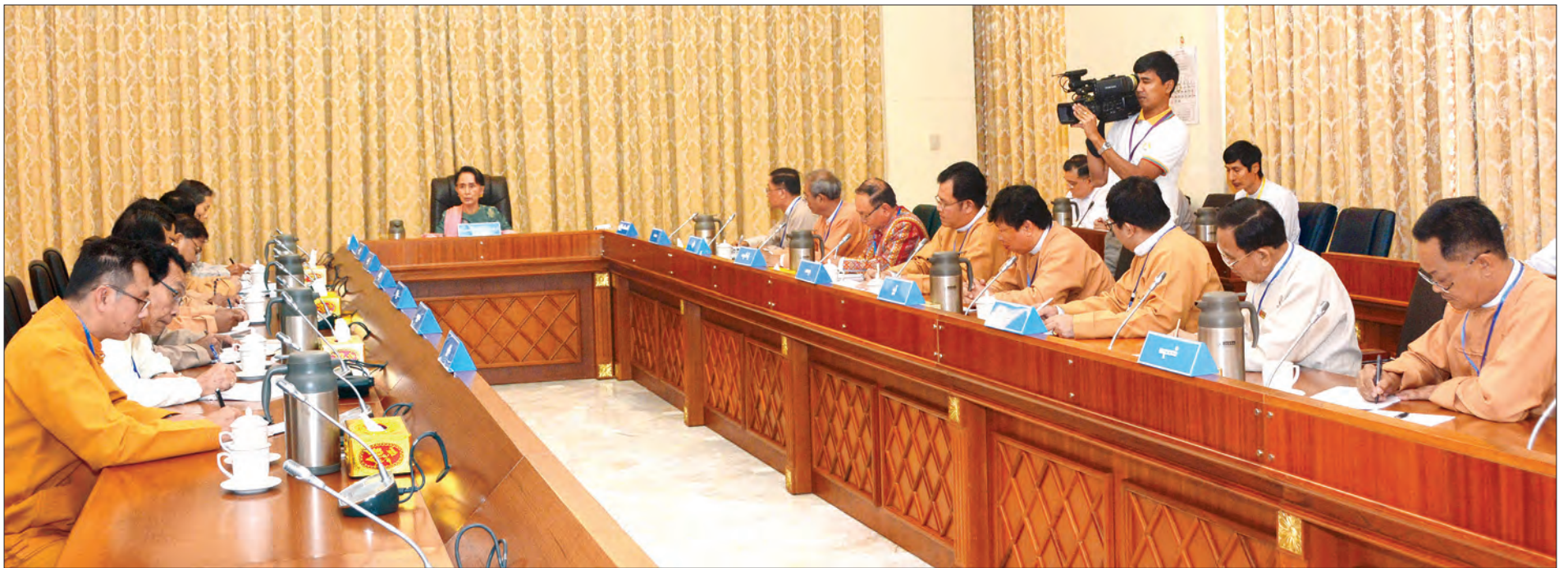
နိုင်ငံတော်၏အတိုင်ပင်ခံပုဂ္ဂိုလ် ဒေါ်အောင်ဆန်းစုကြည် တိုင်းဒေသကြီးနှင့် ပြည်နယ်အစိုးရအဖွဲ့တို့မှ စီမံကိန်းနှင့် ဘဏ္ဍာရေးဝန်ကြီးများအား တွေ့ဆုံစဉ် (သတင်းစဉ်)

နိုင်ငံတော်၏အတိုင်ပင်ခံပုဂ္ဂိုလ် တိုင်းဒေသကြီးနှင့် ပြည်နယ်အစိုးရအဖွဲ့တို့မှ စီမံကိန်းနှင့် ဘဏ္ဍာရေးဝန်ကြီးများအား တွေ့ဆုံ