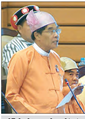
မွန်ပြည်နယ် မဲဆန္ဒနယ်အမှတ်(၁၀)မှ ဦးလှမြင့်(ခ)ဦးလှမြင့်သန်း

မြေများအား လယ်ယာမြေစီမံခန့်ခွဲရေး နှင့် စာရင်းအင်းဦးစီးဌာနမှလည်းကောင်း၊ ကွက်စိပ်မြေပုံများ တိုင်းတာရေးဆွဲ၍ မှတ်တမ်းပြုစု ထိန်းသိမ်းဆောင်ရွက်ခဲ့ပါ ကြောင်း၊ ၁၉၀၆ ခုနှစ်မှစတင်၍ ကြေးတိုင် နှင့် မြေစာရင်းများ ဆောင်ရွက်ခဲ့ရာ တွင် ကျေးရွာအုပ်စုပေါင်း ၁၃၅၅၀ အုပ်စု အတွင်းရှိ ကွင်းပေါင်း ၈၃၅၀ ကွင်း၊ အကွက်ပေါင်း ၁၀၄၄၀ ကွက် စုစုပေါင်း ဧရိယာ ၄၇ ဒသမ ၉၈ ဧကသန်းအပေါ် ကွက်စိပ်မြေပုံများ တိုင်းတာထိန်းသိမ်း ခဲ့ပါကြောင်း၊ ထို့အပြင် နှစ်စဉ် မြေကြီး၊ မြေပြင်နှင့် မြေစာရင်းမှန်ကန်ရေးအတွက် ပြန်တိုင်း/ ပြင်တိုင်း ဆောင်ရွက်ခြင်း လုပ်ငန်းကိုလည်း စီမံကိန်းများချမှတ်၍ အကောင်အထည်ဖော် ဆောင်ရွက် လျက်ရှိပါကြောင်း ပြန်လည်ရှင်းလင်း ဖြေကြားသည်။ မွန်ပြည်နယ် မဲဆန္ဒနယ်အမှတ် (၁၀)မှ ဦးစိုးသီဟ(ခ) မောင်တူး၏ ပေါင် မြို့နယ် မြို့မဧရိယာအတွင်းရှိ ကခုစီး ကျွဲခြံချောင်းအား မူလဧရိယာအတိုင်း သတ်မှတ်တိုင်းတာပေးရန် အစီအစဉ် ရှိ/ မရှိနှင့် ယင်းချောင်းအား ရေစီးဆင်းမှု ဆွဲအားကောင်းစေရန် လိုအပ်သော ချောင်းကော ဧရိယာများအား ပြန်လည် တူးဖော်ပေးရန် အစီအစဉ် ရှိ/ မရှိ မေးခွန်းနှင့်စပ်လျဉ်း၍ ဒုတိယဝန်ကြီး ဦးလှကျော်က ကခုစီးကျွဲခြံချောင်း အရှည်ပေ ၂၀၀၀၀ ခန့် ပြန်လည် တူးဖော်ခြင်းလုပ်ငန်း ဆောင်ရွက်ပါက ခန့်မှန်းကုန်ကျငွေကျပ်သန်း ၂၀၀ ခန့် ကုန်ကျမည်ဖြစ်ပါကြောင်း၊ ထိုသို့ ဆောင်ရွက်ပေးခြင်းဖြင့် ချောင်းအတွင်း ရေစီးဆင်းမှုကောင်းမွန်ပြီး ရေငန်