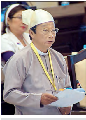
ဒုတိယဝန်ကြီး ဦးလှကျော်

နေပြည်တော် ဇေတ်ဝါရီ ၇ ဒုတိယအကြိမ် အမျိုးသားလွှတ်တော် စတုတ္ထပုံမှန်အစည်းအဝေး ပဌမနေ့ကို ယနေ့နံနက် ၁၀ နာရီတွင် နေပြည်တော် ရှိ အမျိုးသားလွှတ်တော် အစည်းအဝေး ခန်းမ၌ ကျင်းပသည်။ အစည်းအဝေးတွင် မွန်ပြည်နယ် မဲဆန္ဒနယ်အမှတ်(၁၁)မှ ဦးလှမြင့်(ခ) ဦးလှမြင့်သန်း၏ ပြည်ထောင်စုသမ္မတ မြန်မာနိုင်ငံတော်တွင် တစ်မျိုးတည်းသော မြေပုံစနစ် ပြုစုထားရှိရန်နှင့် မြို့ပြနှင့် ကျေးလက်မြေယာများကို ကွက်စိပ် မြေပုံများ ပြုစုမှတ်တမ်းတင်ထားရန် စီမံ ကိန်းချမှတ်ဆောင်ရွက်ရန် အစီအစဉ် ရှိ/ မရှိ နိုင်ငံတော်တွင် စိုက်ပျိုးရေးနှင့် မွေးမြူရေးလုပ်ကိုင်နေသော လယ်ယာ မြေအားလုံးကို မှတ်ပုံတင်နိုင်ရေး နှစ်ရည် စီမံကိန်းချမှတ်ဆောင်ရွက်ရန် အစီအစဉ် ရှိ/ မရှိနှင့် သစ်တောမြေ၊ စားကျက်မြေ များအတွင်း စိုက်ပျိုးလုပ်ကိုင်လျက်ရှိသော ကြောင့် ၂၀၁၂ ခုနှစ် လယ်ယာမြေဥပဒေ အရ မှတ်ပုံတင်ရန် အကျိုးမဝင်သည့်မြေ များနှင့်ပတ်သက်၍ မည်ကဲ့သို့ ဆောင်ရွက် နေသည်ကို သိရှိလိုကြောင်း မေးခွန်းနှင့် စပ်လျဉ်း၍ စိုက်ပျိုးရေး၊ မွေးမြူရေးနှင့် ဆည်မြောင်းဝန်ကြီးဌာန ဒုတိယဝန်ကြီး ဦးလှကျော်က မြန်မာနိုင်ငံအစိုးရဌာန၊ အဖွဲ့အစည်းများတွင် မြေပုံနှင့်မြေပြင် ဆိုင်ရာကိန်းဂဏန်းများ ကောက်ယူသည့် နည်းစနစ်များ၊ ကိန်းဂဏန်းစုစည်းမှု နှင့် မြေပုံထုတ်လုပ်သည့် နည်းစနစ်များ အမျိုးမျိုးအစုံ ကွဲပြားခြားနားနေ သည့်အတွက် တစ်မျိုးတည်းသော မြေပုံ စနစ်တည်ထောင်နိုင်ရန် မြန်မာ အမျိုးသားမြေပုံစနစ် တည်ထောင်ခြင်း