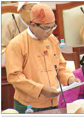
ပွင့်ဖြူမဲဆန္ဒနယ်မှ လွှတ်တော်ကိုယ်စားလှယ် ဦးထွန်းထွန်း

အလားတူ ဒုတိယဝန်ကြီး ဦးကျော်မျိုးက ကျင်းပတဲ့မဲဆန္ဒနယ်မှ လွှတ်တော်ကိုယ်စားလှယ် ဦးစတီဖန်၏ နေပြည်တော်-ကျိုင်းတုံ အသွားအပြန် လေယာဉ်ခရီးစဉ်ကို တစ်ပတ်လျှင် အနည်းဆုံးတစ်ကြိမ် ပြေးဆွဲပေးနိုင်ခြင်း ရှိ/မရှိ သိလိုကြောင်း မေးခွန်းနှင့်စပ်လျဉ်း ၍ မြန်မာနိုင်ငံလေကြောင်း သယ်ယူ ပို့ဆောင်ရေးကဏ္ဍတွင် ပြည်တွင်း ခရီးစဉ်များ ပျံသန်းပြေးဆွဲလျက်ရှိ သော နိုင်ငံတော်ပိုင်လေကြောင်းလိုင်း တစ်လိုင်းနှင့် ပုဂ္ဂလိက လေကြောင်း လိုင်းကိုးလိုင်း စုစုပေါင်း ၁၀ လိုင်း ရှိပါ ကြောင်း၊ မြန်မာအမျိုးသားလေကြောင်း လိုင်းအနေဖြင့် စီးပွားရေးဆန်ဆန် ဆောင်ရွက်ပြီး နိုင်ငံတကာအဆင့်မီ လေကြောင်းလိုင်းအဖြစ် ရပ်တည်နိုင်ရန် ရည်ရွယ်၍ ၂၀၁၃-၂၀၁၄ ဘဏ္ဍာရေးနှစ်မှ စတင်ကာ နိုင်ငံတော်ဘဏ္ဍာရန်ပုံငွေ တောင်းခံခြင်းမပြုတော့ဘဲ မိမိဝင်ငွေ ဖြင့် ရပ်တည်ဆောင်ရွက်လျက်ရှိရာ ယခင် အသုံးပြုနေသည့် ဖော်ကာလေယာဉ် ဟောင်းများနေရာတွင် ဘိုးအင်၊ အေတီ အာရ်ကိုသို ခေတ်မီလေယာဉ်များကို ငှားရမ်းခြင်း၊ ဝယ်ယူခြင်းတို့ကို ပြုလုပ်၍ အစားထိုးခြင်း၊ အေတီအာရ်လေယာဉ် အကြီးစားပြုပြင်ထိန်းသိမ်းရေး အလုပ်ရုံ တည်ဆောက်ခြင်း စသည့် ရင်းနှီးမြှုပ်နှံ မှုများကို လေကြောင်းလိုင်း၏ ဝင်ငွေ အပြင် ထပ်မံလိုအပ်နေသည့် ငွေများကို အမေရိကန်နိုင်ငံ GECAS Co., Ltd ထံမှချေးယူ၍ ရင်းနှီးမြှုပ်နှံမှုများ