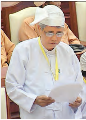
ဒုတိယဝန်ကြီး ဦးကျော်မျိုး

နေပြည်တော် ဇေတ်ဝါရီ ၇ မြန်မာနိုင်ငံပေါ်တွင် နေ့စဉ်ဖြတ်ကျော် ပျံသန်းသည့် လေယာဉ်အစင်းရေသည် နှစ်စဉ်တိုးတက်လျက်ရှိပြီး တစ်နေ့လျှင် အများဆုံးခေါက်ရေ ၆၀၀ ခန့်အား လေယာဉ်ဖြတ်ကျော် ပျံသန်းခရီးများ ကောက်ခံလျက်ရှိရာ ၂၀၁၅-၂၀၁၆ ဘဏ္ဍာရေးနှစ်တွင် အမေရိကန်ဒေါ်လာ ၈၃ ဒသမ ၂၃၃ သန်း၊ ၂၀၁၆-၂၀၁၇ ခုနှစ် ဘဏ္ဍာရေးနှစ် ၂၀၁၆ ခုနှစ် ဒီဇင်ဘာ ၁၃ ရက်အထိ အမေရိကန်ဒေါ်လာ ၅၈ ဒသမ ၄၃၀ သန်း ရရှိခဲ့ပါကြောင်း ပို့ဆောင်ရေးနှင့် ဆက်သွယ်ရေးဝန်ကြီးဌာန ဒုတိယဝန်ကြီး ဦးကျော်မျိုးက ပြည်သူ့လွှတ်တော်တွင် ရှင်းလင်း ဖြေကြားသည်။