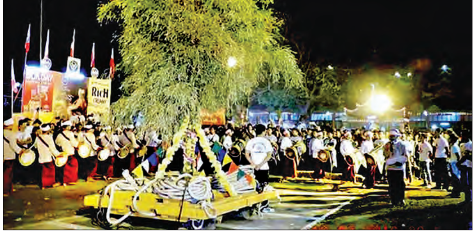
၂၀၁၆ ခုနှစ်က ရခိုင်ရိုးရာ ရထားဆွဲပွဲကျင်းပစဉ်

ကိုကျင်းပကြကြောင်း သိရသည်။ ဆယ့်နှစ်လရာသီပွဲတော်များအနက် တပို့တွဲလတွင် ကျင်းပသော ရခိုင်တို့၏ရိုးရာ ရာသီပွဲတစ်ခုမှာ ရထားဆွဲပွဲဖြစ်သည်။ ရခိုင်တို့သည် ရထားဆွဲပွဲကို တပို့တွဲလတွင် နက္ခတ်တာရာများ စုံလင်သည့်လဖြစ်သောကြောင့် ယခုလတွင် ကျင်းပကြသည်ဟုလည်း သိရသည်။ ရှေးခေတ်ရခိုင်တို့သည် ရထားဆွဲပွဲကိုကျင်းပခြင်းအား ဖြင့် လယ်ယာသီးနှံများအထွက်တိုးခြင်း၊ ကောက်ပဲသီးနှံ ဆန်ရေစပါးများပေါများခြင်း၊ တိုင်းပြည်နိုင်ငံအေးချမ်းသာယာခြင်း၊ မင်းနှင့်ပြည်သူတို့ကြည်ဖြူလက်တွဲကာ အရာရာကိုအောင်မြင်နိုင်စေခြင်းစသည့်ကောင်းခြင်းမင်္ဂလာများ ပြည့်စုံစေသည်ဟု