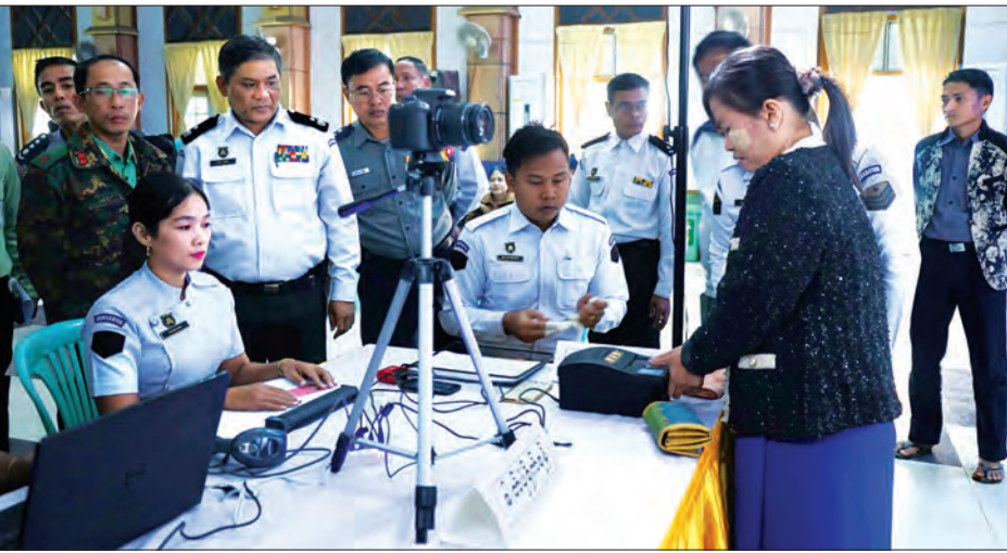
လူဝင်မှုကြီးကြပ်ရေးဦးစီးဌာန မြို့နယ်ဦးစီးမှူးရုံးမှ ဝန်ထမ်းများက ကျေးပင်ကြီးရပ်ကွက်မှ ပြည်သူများအား တစ်ဦးချင်းကိုင်ပေးအချက်အလက်များ ရေးသွင်းခြင်း၊ အိမ်ထောင်စု

နေပြည်တော် ဇန်နဝါရီ ၉ ရခိုင်ပြည်နယ်အတွင်း National Electronic ID (NeID) အထောက်အကူပြုစာရင်းကောက်ယူခြင်းလုပ်ငန်းသင်တန်းကို ဇန်နဝါရီ ၈ ရက် နံနက် ၉ နာရီက စစ်တွေမြို့ရှိ လူဝင်မှုကြီးကြပ်ရေးဦးစီးဌာန ပြည်နယ်ဦးစီးမှူးရုံး အစည်းအဝေးခန်းမ၌ ဖွင့်လှစ်ရာ အမျိုးသားမှတ်ပုံတင်နှင့် နိုင်ငံသားဦးစီးဌာန ညွှန်ကြားရေးမှူးချုပ် ဦးအေးလွင် တက်ရောက်အမှာစကားပြောကြားသည်။ အဆိုပါသင်တန်းသို့ ပြည်နယ်ဦးစီးမှူးရုံး၊ စစ်တွေခရိုင်နှင့် စစ်တွေ၊ ဘူးသီးတောင်၊ မောင်တောမြို့နယ် ဦးစီးမှူးရုံးများမှ စုစုပေါင်း ဝန်ထမ်း ၄၄ ဦး တက်ရောက်ကြပြီး တာဝန်ရှိသူများက NeID အထောက်အကူပြုစာရင်းကောက်ယူနိုင်ရေးအတွက် IT နည်းပညာအသုံးပြု ကောက်ယူခြင်းလုပ်ငန်းဆိုင်ရာများနှင့်ပတ်သက်၍ သင်ကြားပြသကြသည်။ ယနေ့ နံနက် ၉ နာရီက ရခိုင်ပြည်နယ် စစ်တွေမြို့နယ် အတွင်း National Electronic ID (NeID) အထောက်အကူပြုစာရင်း ကောက်ယူခြင်းလုပ်ငန်း ရှေ့ပြေးစမ်းသပ်ဆောင်ရွက်ခြင်းကို စစ်တွေမြို့၊ ဦးဥတ္တမခန်းမ၌ ပြုလုပ်ရာ