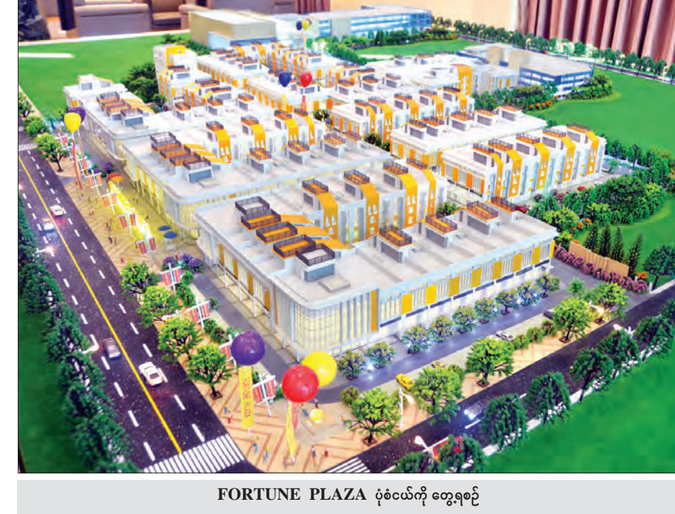
FORTUNE PLAZA ပုံစံပုံကို တွေ့ရစဉ်

အဆိုပါ FORTUNE PLAZA ကို ရန်ကုန်မြို့တော် စည်ပင်သာယာရေးကော်မတီနှင့် ရွှေရပ်ဝန်းဆောက်လုပ်ရေးကုမ္ပဏီတို့ ၂၀၁၅ ခုနှစ် နှစ်ကုန်ပိုင်းမှ စတင်၍ တည်ဆောက်လျက်ရှိကြောင်း၊ ယခုအခါ စီမံကိန်း၏ ပထမအဆင့်မှာ ၈၀ ရာခိုင်နှုန်းပြီးစီးနေပြီဖြစ်ကြောင်း၊ ဧပြီလတွင် ဖွင့်လှစ်သွားရန် မျှော်မှန်းထားကြောင်း၊ အကျယ်အဝန်းအားဖြင့် ၁၆ ဧကရှိကြောင်း သိရသည်။ ယင်းပလာဇာကြီးကို ထိုင်ဝမ်နှင့် စင်ကာပူဒီဇိုင်းနည်းပညာများ အသုံးပြု တည်ဆောက်ထားကြောင်း၊ ပလာဇာအပြင် လူနေဆိုင်ခန်းပေါင်း ၁၃၂ ခန်း ပါဝင်မည်ဖြစ်ကြောင်း၊ ပထမအဆင့် အနေဖြင့် အခန်း ၆၅ ခန်းမှာ တည်ဆောက်ပြီးစီးလုနီးပါး ဖြစ်နေကြောင်း၊ အဆောက်အအုံများမှာ သုံးထပ်ခွဲအဆောက်အအုံဖြစ်ကြောင်း၊ ၂၀၁၈ ခုနှစ် ဇွန်လတွင် တည်ဆောက်မှုအားလုံး ပြီးစီးမည်ဖြစ်ကြောင်း FORTUNE PLAZA မှ CEO မိုက်ကယ်ချန်းက ရင်းပြသည်။ ယင်းပလာဇာကြီး တည်ဆောက်ပြီးစီးသွားပါက အလုပ်အကိုင်အခွင့်အလမ်းများစွာ ပေါ်ထွက်လာမည်ဖြစ်သည့်အပြင် အနီးပတ်ဝန်းကျင်ရပ်ကွက်များလည်း ဖွံ့ဖြိုးတိုးတက်လာကာ လူနေမှုအဆင့်အတန်း မြင့်မားလာနိုင်ကြောင်း သိရသည်။ ယင်းနေရာသည် ယခင်ရေကန်ပျက်ကြီးဖြစ်ခဲ့ပြီး ရန်ကုန်မြို့တော် စည်ပင်သာယာရေးကော်မတီမှ အမှိုက်များဖို့ခွဲကြောင်း၊ ယင်းနောက် စည်ပင်ဝန်ထမ်းအိမ်များ ဆောက်လုပ်ခဲ့ကြောင်း၊ စည်ပင်ဝန်ထမ်းအိမ်များကို တစ်ဖန်ပြောင်းခဲ့ပြီး ကွက်လပ်အဖြစ် ကြားမြင်စွာထားရှိရာမှ စည်ပင်နှင့် အကျိုးတူ PLAZA အဖြစ် ပြောင်းလဲတည်ဆောက်ခဲ့ခြင်းဖြစ်ကြောင်း သိရသည်။