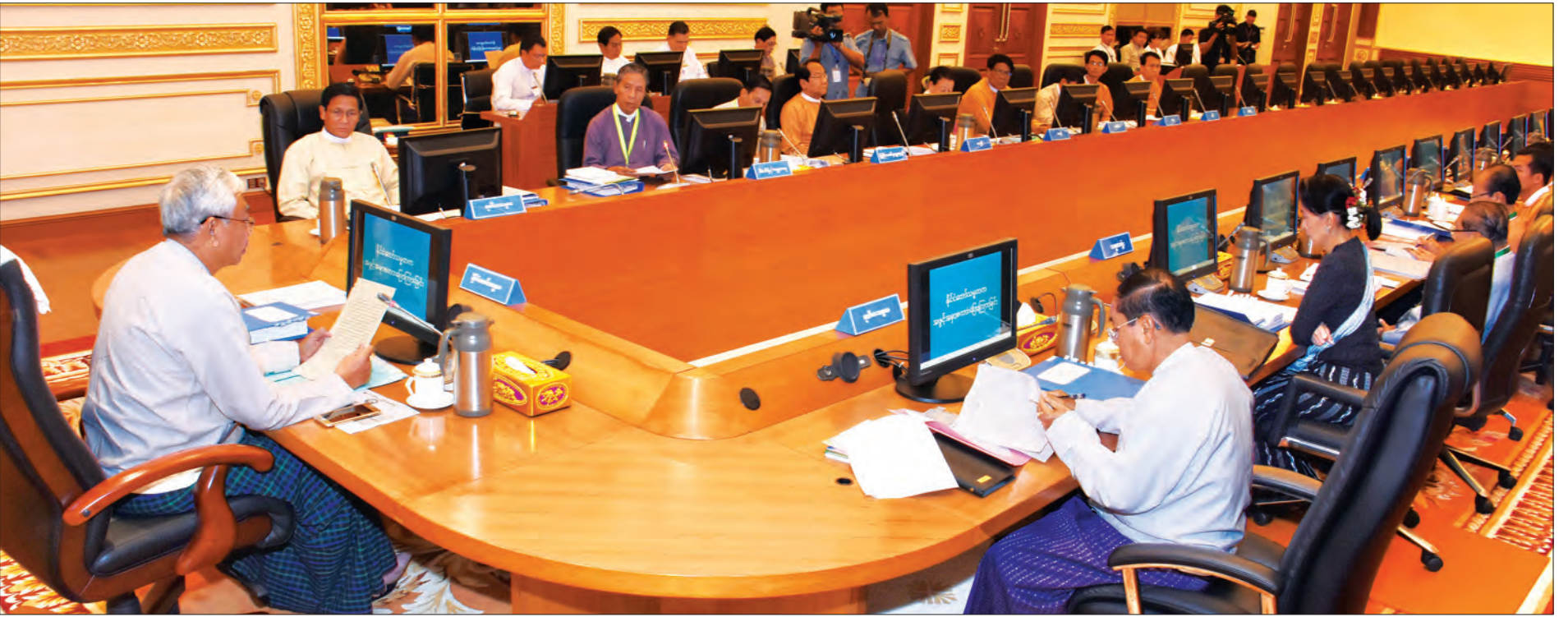
ဘဏ္ဍာရေးကော်မရှင်ဥက္ကဋ္ဌ နိုင်ငံတော်သမ္မတ ဦးထင်ကျော် ဘဏ္ဍာရေးကော်မရှင် (၁/၂၀၁၇) အစည်းအဝေးတွင် အမှာစကားပြောကြားစဉ်