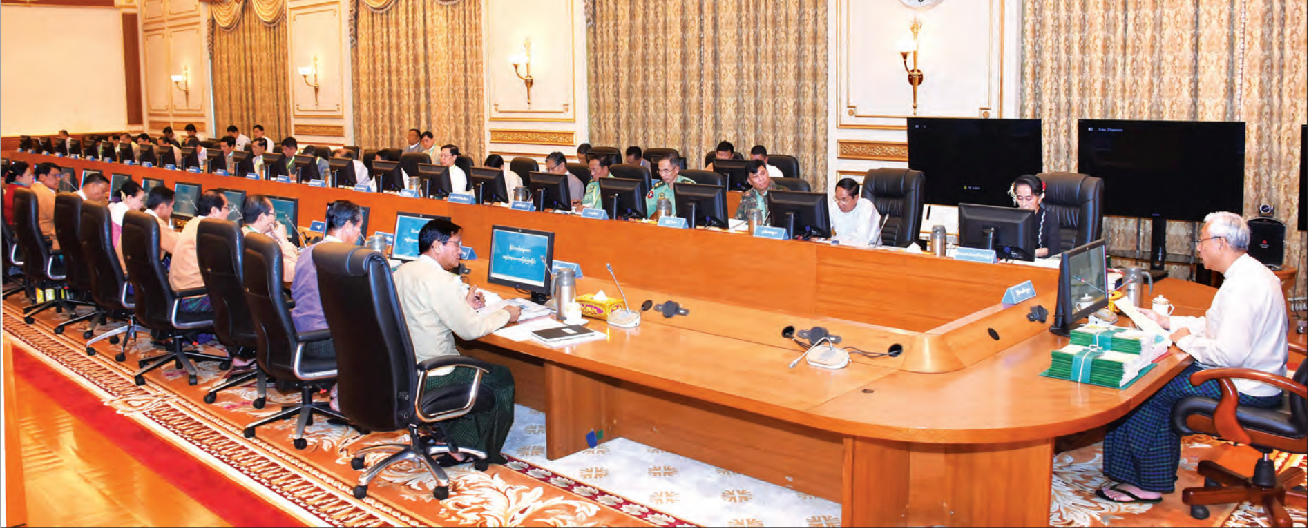
နေပြည်တော် ဇန်နဝါရီ ၉ အမျိုးသားစီမံကိန်းကော်မရှင်(၁/၂၀၁၇) အစည်းအဝေးကို ယနေ့နံနက် ၁၀ နာရီတွင် နိုင်ငံတော်သမ္မတအိမ်တော် ပြည်ထောင်စုအစိုးရအဖွဲ့အစည်းအဝေးခန်းမ၌ ကျင်းပရာ အမျိုးသားစီမံကိန်းကော်မရှင်ဥက္ကဋ္ဌ နိုင်ငံတော်သမ္မတ ဦးထင်ကျော် တက်ရောက်အမှာစကားပြောကြားသည်။ စာမျက်နှာ ၄ ကော်လံ ၁ ❖