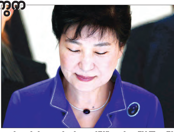
ဟောင်း လေးဦးတို့ လာရောက်သက်သေခံမည်ဖြစ်ပြီး တတိယအကြိမ် ကြားနာခြင်း အတွက်လည်း ငှင်းတို့အား ဆက်လက် ဆင်ခေါ်သွားမည်ဟု သိရသည်။ သမ္မတပတ် သည် အမှုနှင့်ဆိုင်ဆိုင် နေချိန်တွင် ဝန်ကြီးချုပ် ဝှမ်းကျီအနီးက ယာယီသမ္မတအဖြစ် တာဝန်ထမ်းဆောင်နေကြောင်း သိရသည်။ (ဆင်ဟွာ)