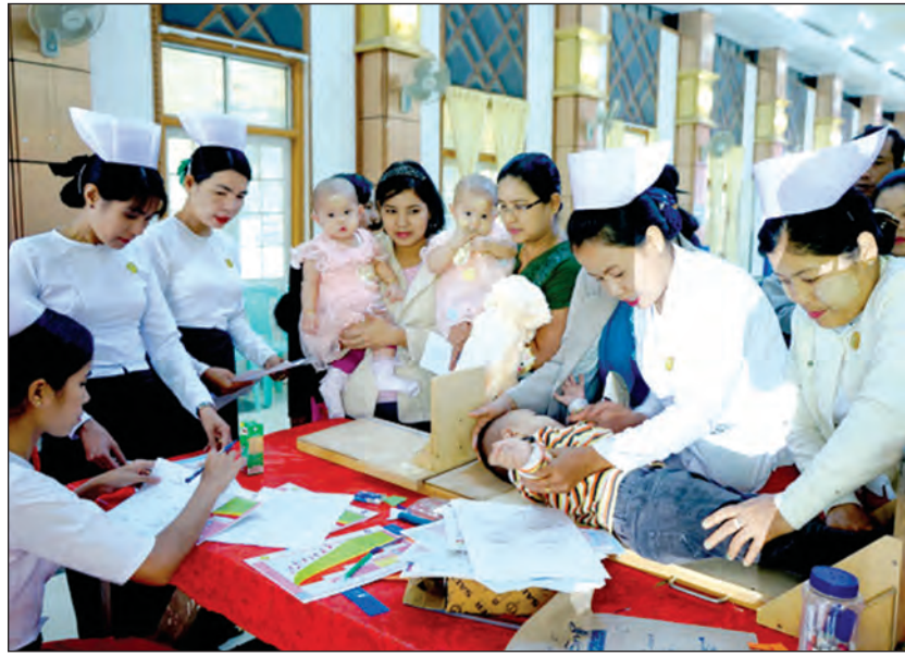
စစ်တွေ ဇန်နဝါရီ ၃ (၆၉)နှစ်မြောက် လွတ်လပ်ရေးနေ့အထိမ်းအမှတ်