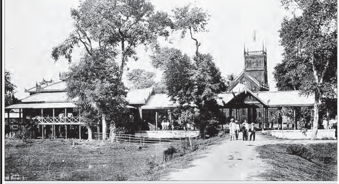
ရတနာပုံခေတ် ဒေါက်တာမတ်ကျောင်း

ဆောက်လုပ်ပေးသည်။ လစာရိက္ခာများ ထောက်ပံ့သည်။ ထို့ထက် ပိုမိုအလေးဂရုပြုသည်မှာ မိမိသားတော်များကို ဒေါက်တာမတ်ထံ အပ်နှံပညာသင်ကြားစေခြင်းဖြစ်သည်။ ထို့ကြောင့် ရွှေတချောင်းအနောက်ကမ်းရှိ ဗြိတိသျှသံတံအတွင်းတွင် ၁၈၆၉ (၁၂၃၁)ခုနှစ်လောက်က S.P.G Royal School ခေါ် သာသနာပြု အင်္ဂလိပ်စာသင်ကျောင်း တစ်ကျောင်း ပေါ်ပေါက်လာတော့သည်။ ဗြိတိသျှသံတံဝင်းအတွင်းတွင် တည်ရှိသောကြောင့် သံတံကျောင်းတော်ဟုလည်း ခေါ်တွင်သည်။ သံတံကျောင်းတော်တွင် ပညာသင်ကြားရန် မင်းတုန်းမင်းက သားတော်ကိုးပါး အပ်နှံသည်။ သီပေါမင်းသားလည်းပါ၏။ တခြား မင်း၊ မှူးမတ်၊ သူဌေးသူကြွယ်တို့၏ သားမြေးများလည်း အပ်နှံကြ၏။ မင်းသားများ ကျောင်းတက်လာကြသောကြောင့် နောက်ပါအခြေအရံ ၄၀ လောက်နှင့် ဆင်စီး၊ ရွှေထီးဆောင်းကာ တခမ်းတနားလာကြသည်။ နောက်တော်ပါး လူပျိုတော်သား၊ လက်ဖက်ရည်တော်သားများကလည်း အခြေအရံ ၁၀ ယောက် ၁၂ ယောက်စီလောက် ပါသေး၏။ သူတို့ကလည်း ထီးဝါတစ်လက်စီ ဆောင်းထားကြသေးသည်။ မင်းသားတစ်ပါး တစ်ပါးလျှင် ဤမျှသော လူသူအခြေအရံများနှင့် ကျောင်းတက်ကြသောအခါ ဆရာမတ်၏ကျောင်းတွင် ကျောင်းသားထက် အခြေအရံကပင် များပြားနေသည်မှာ ထူးဆန်းဖွယ်ဖြစ်ပေသည်။ အခြေအရံတို့က လူလေးရာလောက်ရှိမှာပေါ့။