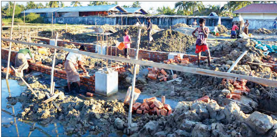
မတ်လကုန်တွင် မောင်တောမြို့နယ် ဆောင်ရွက်လျက်ရှိကြောင်း သိရသည်။ အားကစားနှင့် ကာယပညာဦးစီးဌာန သို့ အပြီးတည်ဆောက်အပ်နှံနိုင်ရေး