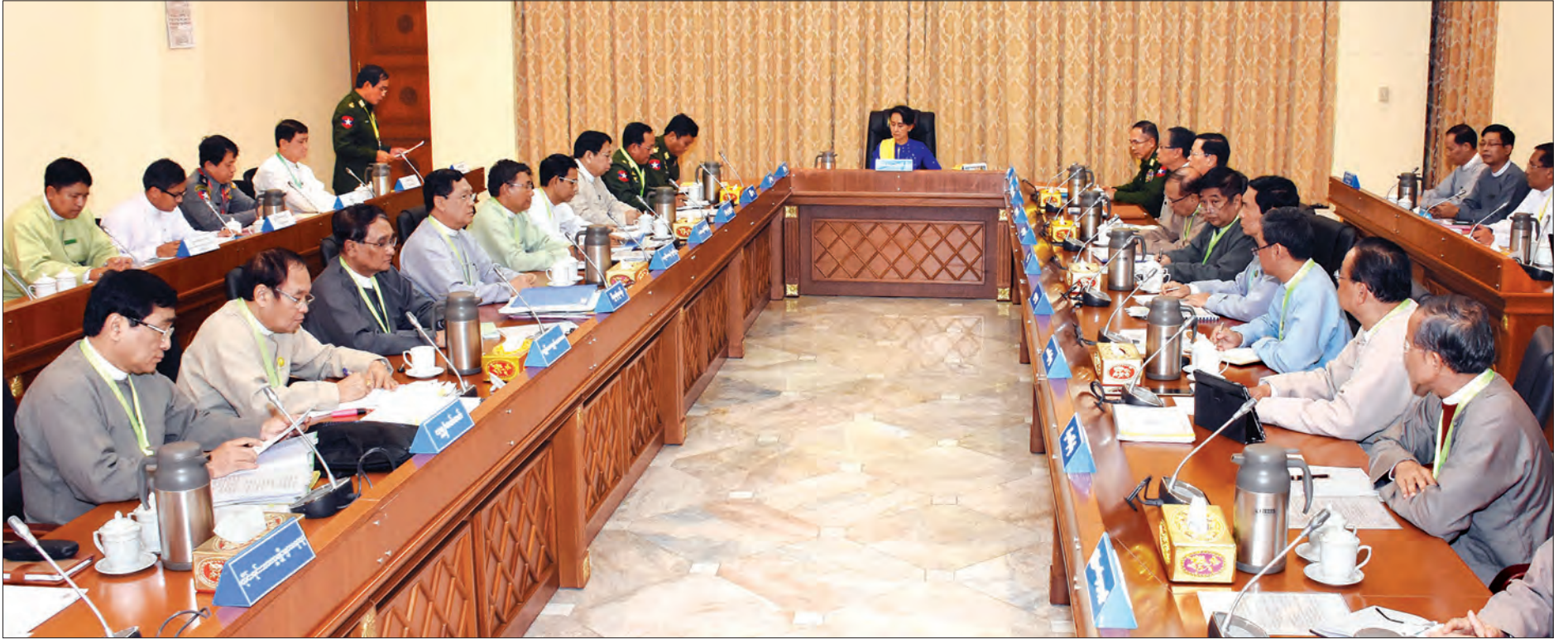
ရခိုင်ပြည်နယ်တည်ငြိမ်အေးချမ်းမှုနှင့်ဖွံ့ဖြိုးမှုတိုးတက်ရေးအကောင်အထည်ဖော်ရေးပဟိုကော်မတီလုပ်ငန်းညှိနှိုင်းစည်းဝေး(၁/၂၀၁၇) ကျင်းပစဉ် (သတင်းစဉ်)