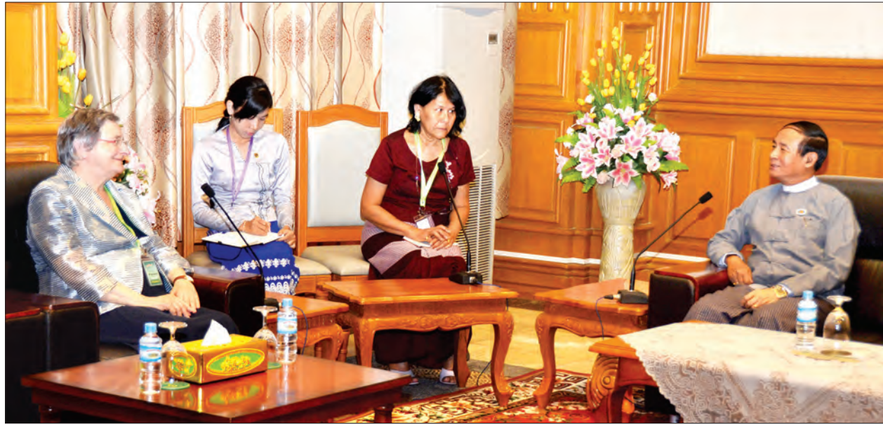
ပြည်သူ့လွှတ်တော်ဥက္ကဋ္ဌ ဦးဝင်းမြင့် အီတလီ-မြန်မာ ချစ်ကြည်ရေးအသင်းဝင် အီတလီလွှတ်တော်အမတ်ဟောင်း Ms. Albertina Soliani အား လက်ခံတွေ့ဆုံစဉ် (သတင်းစဉ်)

တွေ့ဆုံပွဲသို့ ပြည်သူ့လွှတ်တော် ဒုတိယဥက္ကဋ္ဌ ဦးတီခွန်မြတ်နှင့် ပြည်သူ့လွှတ်တော် ရုံးမှ တာဝန်ရှိသူများ တက်ရောက်ခဲ့ကြသည်။ (သတင်းစဉ်)