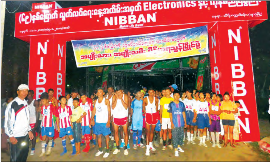
သလိပ်ကြီးတံတားအထိ အသွားအပြန် ခရီးရှည်မိုင်ပေါင်း ၁၀ မိုင် ယှဉ်ပြိုင်ခဲ့ကြ သည်။

ဈာပုံ ဇန်နဝါရီ ၃ ဧရာဝတီတိုင်းဒေသကြီး ဈာပုံမြို့နယ်ရှိ (၆၉)နှစ်မြောက် လွတ်လပ်ရေးနေ့ ကျင်းပရေး ဦးစီးကော်မတီက ဦးဆောင် ကျင်းပသော (၆၉)နှစ်မြောက် လွတ်လပ် ရေးနေ့ အထိမ်းအမှတ် အမျိုးသား၊ အမျိုးသမီး မီနီမာရသွန်ပြိုင်ပွဲကို ဇန်နဝါရီ ၃ ရက် နံနက်က ဈာပုံမြို့၌ စည်ကားသိုက်မြိုက်စွာ ကျင်းပခဲ့သည်။ ယခုနှစ် ဈာပုံမြို့၌ ကျင်းပသည့် မီနီမာရသွန်ပြိုင်ပွဲတွင် အမျိုးသား၊ အမျိုးသမီး အားကစားသမားပေါင်း ၆၉ ဦး ဝင်ရောက်ယှဉ်ပြိုင်ခဲ့ပြီး အမျိုးသား မီနီမာရသွန်အားကစားသမားများသည် ဈာပုံမြို့ပြည်သူ့အားကစားကွင်းမှ ဈာပုံ မြို့နယ် ရုံသင်းတန်းတံတားအထိ အသွား အပြန် ခရီးရှည်မိုင်ပေါင်း ၁၆ မိုင်နှင့် အမျိုးသမီး အားကစားသမားများက ဈာပုံ ပြည်သူ့အားကစားကွင်းရှေ့မှ