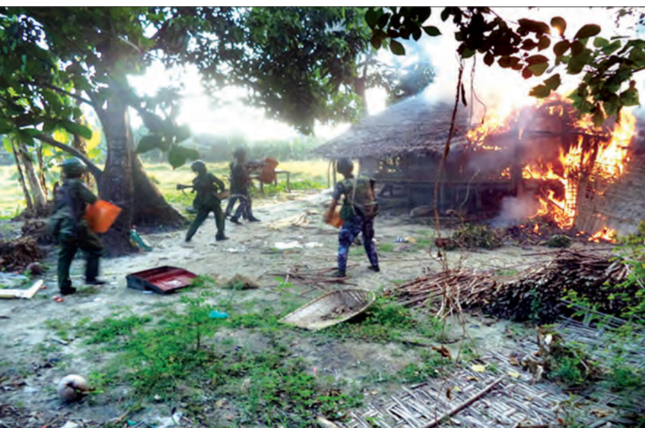
လုံခြုံရေးတပ်ဖွဲ့ဝင်များက ဝါးပိတ်ကျေးရွာတွင် မီးလောင်မှုကို မီးငြိမ်းသတ်နေစဉ်

ကျင်ရှိ တောင်ကုန်းနှင့် တောတန်းများအတွင်းမှ သေနတ်၊ ဓား၊ လှံနှင့် မိုနားများ ကိုင်ဆောင်လျက်ထွက်လာသည့် အကြမ်းဖက်တိုက်ခိုက်သူ ၇၀ ဦးခန့်နှင့် ထိတွေ့မှုဖြစ်ပွားခဲ့ရာ စစ်သည်တစ်ဦး ကျဆုံး၍ အရာရှိတစ်ဦးနှင့် စစ်သည်တစ်ဦးတို့ ဒဏ်ရာရရှိခဲ့ပါသည်။ အကြမ်းဖက်တိုက်ခိုက်သူခြောက်ဦးကို အသေဖမ်းဆီးရမိ၍ သေနတ်တစ်လက်နှင့်ခဲယမ်းအချို့ သိမ်းဆည်းရမိခဲ့ပါသည်။ ၁၀၃၀ အချိန်ခန့်တွင် ပွင့်ဖြူချောင်း ကျေးရွာသို့ လုံခြုံရေးတပ်ဖွဲ့ဝင်များ ရောက်ရှိသည့်အခါ နေအိမ်