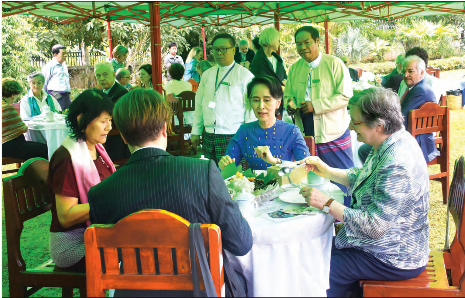
နိုင်ငံတော်၏ အတိုင်ပင်ခံပုဂ္ဂိုလ် ဒေါ်အောင်ဆန်းစုကြည် အီတလီ-မြန်မာ ချစ်ကြည်ရေးအသင်းဝင်များနှင့်အတူ မြန်မာ့ရိုးရာအစားအစာများကို အတူတကွသုံးဆောင်စဉ် (သတင်းစဉ်)

အဆိုပါတည်ခင်းဧည့်ခံပွဲသို့ တက်ရောက်ခဲ့ သည့် အီတလီ-မြန်မာ ချစ်ကြည်ရေးအသင်း မြန်မာနိုင်ငံတာဝန်ခံ ဦးသူရထွန်းက “ဒီအသင်း ကို ၂၀၀၄ ခုနှစ် အီတလီနိုင်ငံ ပါးမားမြို့မှာ စပြီးတော့ တည်ထောင်ဖွဲ့စည်းခဲ့ပါတယ်။ အသင်းရရှိရသည့် ချက်ကတော့ မြန်မာနိုင်ငံရဲ့ပညာရေး၊ အမျိုးသမီး နဲ့ ကလေးသူငယ်များ ဖွံ့ဖြိုးတိုးတက်ရေးအပြင် ဒီမိုကရေစီစနစ်နဲ့ပတ်သက်ပြီးတော့ ပိုမိုခိုင်မာလာ