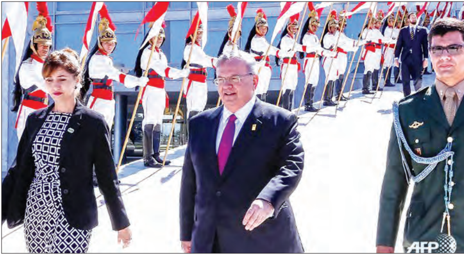
ဘရာဇီးနိုင်ငံဆိုင်ရာ ဂရိသံအမတ်ကြီး ၂၀၁၆ ခုနှစ် မေလက ဘရာဇီးနိုင်ငံသို့သွားရောက်စဉ်

သက်ဆိုင်ရာ အာဏာပိုင်များက သံအမတ်ကြီး ပျောက်ဆုံးမှုနှင့်ပတ်သက် ၍ စုံစမ်းစစ်ဆေးမှုများ ဆောင်ရွက်လျက် ရှိကြောင်း သိရသည်။