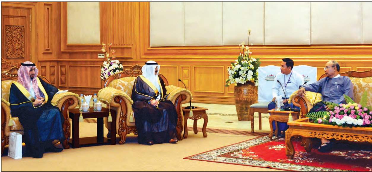
အမျိုးသားလွှတ်တော်ဥက္ကဋ္ဌ မန်းဝင်းခိုင်သန်း ဆော်ဒီအာရေဗျနိုင်ငံ သံအမတ်ကြီး H.E. Mr. Sahal Moustafa Ahmed Ergesous အား လက်ခံတွေ့ဆုံစဉ် (သတင်းစဉ်)