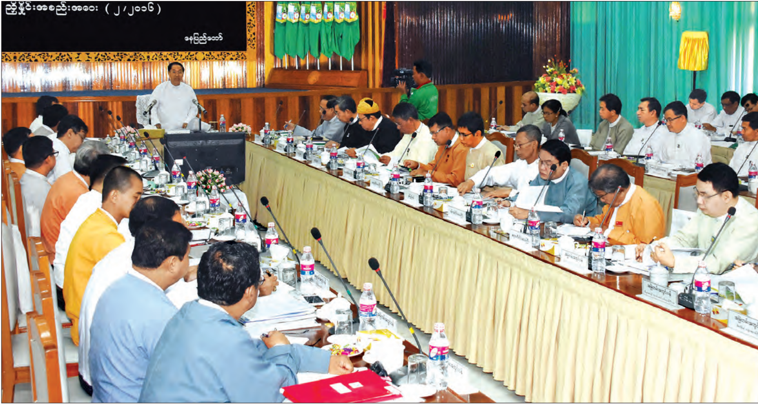
ဒုတိယသမ္မတ ဦးမြင့်ဆွေ အမျိုးသားအဆင့် ပတ်ဝန်းကျင်ထိန်းသိမ်းရေးနှင့် ရာသီဥတုပြောင်းလဲမှုဆိုင်ရာ ဗဟိုကော်မတီ(၂/၂၀၁၆) လုပ်ငန်းညှိနှိုင်းအစည်းအဝေးတွင် အမှာစကားပြောကြားစဉ်