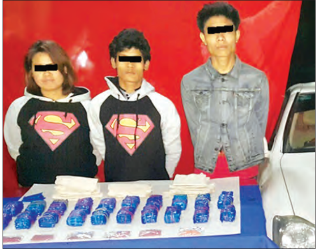
ဆေးပြား ၆၃၄ ပြား သိမ်းဆည်းရမိသဖြင့် ၄၄-တို့အား မူးယစ်ဆေးဝါးနှင့် စိတ်ကိုပြောင်းလဲစေသော ဆေးဝါးများကိုရ