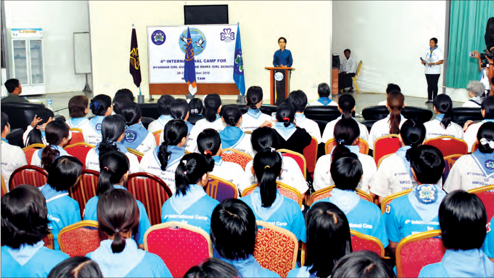
နိုင်ငံတော်၏အတိုင်ပင်ခံပုဂ္ဂိုလ် ဒေါ်အောင်ဆန်းစုကြည် မြန်မာ-ဂျပန် အမျိုးသမီးကင်းထောက်များ၏ စခန်းချမ်းပုံပွဲ၌ အမှာစကားပြောကြားစဉ်