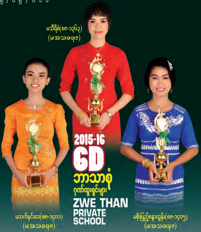
မသီရိစံ(၈၉-၁၃၆၃) (မအသ၊သ၊၀၇၉)

Ph: 075-40266 09-47070028, 09-780119515, 09-791444757, 09-791799665