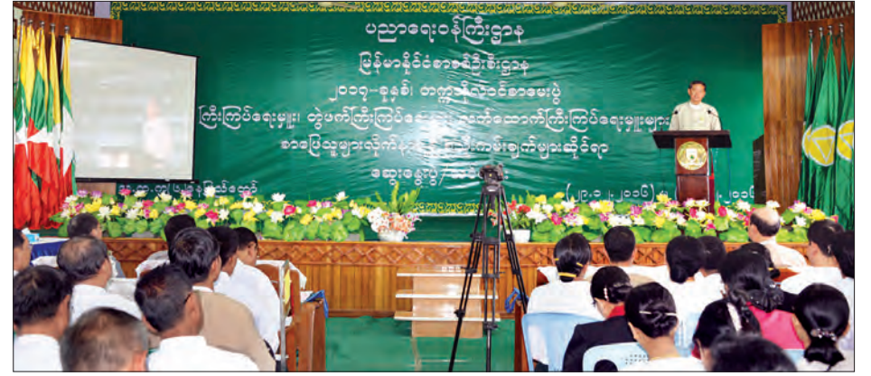
ကြီး၊ ကယားပြည်နယ်နှင့် ရှမ်းပြည်နယ် တောင်ပိုင်း၊ မိတ္ထီလာ၊ ရမည်းသင်းတို့မှ တိုင်းဒေသကြီး/ပြည်နယ်အဆင့်၊ ခရိုင် အဆင့်၊ မြို့နယ်အဆင့်ပညာရေးဝန်ထမ်း များ၊ အခြေခံပညာကျောင်းများမှ သင်တန်းကို ဒီဇင်ဘာ ၂၉ ရက်မှ ၃၁ ကျောင်းအုပ်ကြီးများနှင့် ကိုယ်ပိုင်အထက် ရက်အထိ သုံးရက်ကြာ ကျင်းပမည် ဖြစ်ကြောင်း သတင်းရရှိသည်။ (သတင်းစဉ်)

လှစ်မည်ဖြစ်ကြောင်း၊ စာမေးပွဲဖြေဆိုသူ များ အဆင်ပြေစွာ ဖြေဆိုနိုင်ရေး၊ မသမာ မှုများမပေါ်ပေါက်ရေး၊ တက္ကသိုလ်ဝင် စာမေးပွဲမေးခွန်းနှင့် အဖြေလွှာစာအုပ် များကို စနစ်တကျ ထုပ်ပိုးသိမ်းဆည်း အပ်နှံရန်လိုကြောင်း၊ ဆရာ ဆရာမများ အနေဖြင့် တက္ကသိုလ်ဝင်စာမေးပွဲ ဆောင် ရွက်ခဲ့သော သက်တမ်းတစ်လျှောက် အတွေ့အကြုံများအပေါ် မူတည်၍ ပြန်လည်ဆန်းစစ်ပြီး အားသာချက် အားနည်းချက်များကို အခြေခံ၍ ဆောင်ရွက်သွားကြရန် မှာကြားသည်။ အဆိုပါ ဆွေးနွေးပွဲသို့ အခြေခံ ပညာဦးစီးဌာနအောက်ရှိ နေပြည်တော်၊ မကွေးတိုင်းဒေသကြီး၊ ပဲခူးတိုင်းဒေသ