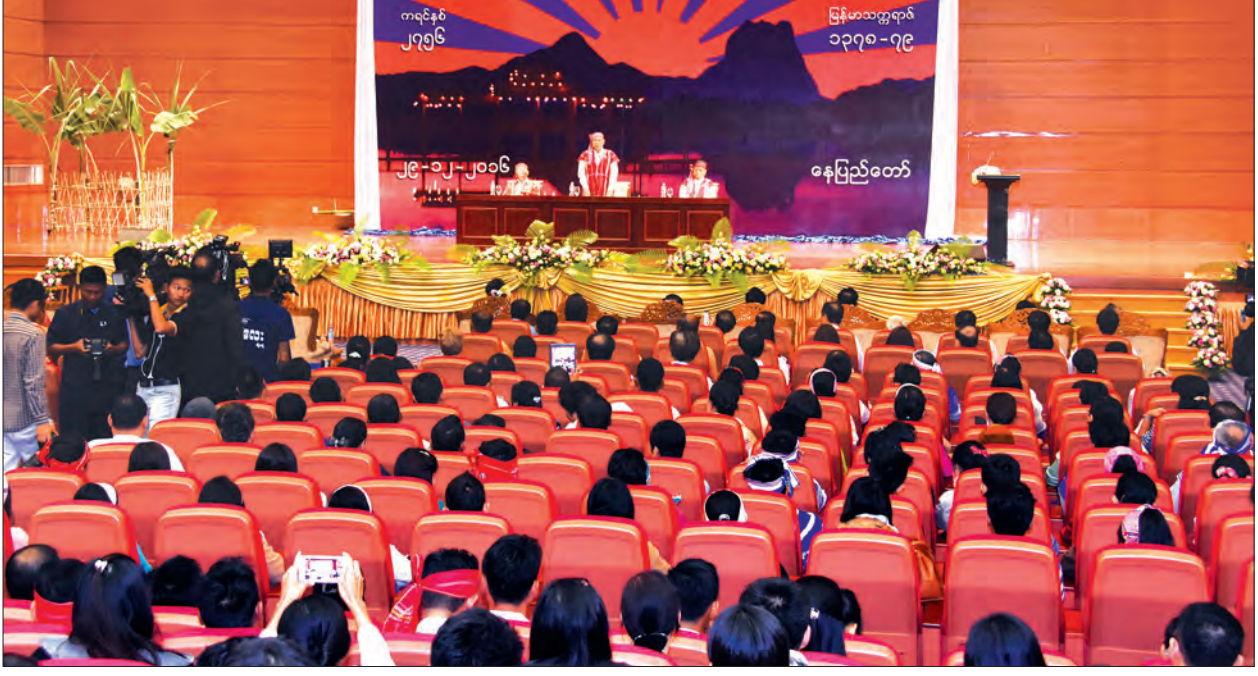
အမျိုးသားလွှတ်တော်ဥက္ကဋ္ဌ မန်းဝင်းခိုင်သန်း ကရင်အမျိုးသား နှစ်သစ်ကူးနေ့အခမ်းအနားတွင် နှစ်သစ်ကူးမိန့်ခွန်းပြောကြားစဉ် (သတင်းစဉ်)

ချစ်ခင်စွာဖြင့် အစဉ်တစိုက်ဆောင်ရွက် သွားကြရမည်ဖြစ်ပါကြောင်း၊ နှစ်ဟောင်း မှ မကောင်းသည်များကို ပယ်ရှား သင်ခန်းစာယူ၍ နှစ်သစ်တွင် စိတ်သစ်၊ လူသစ်နှင့် ငြိမ်းချမ်းသာယာဝပြောသည့် ဒီမိုကရေစီဖက်ဒရယ်ပြည်ထောင်စုကို တည်ဆောက်နိုင်ရေး လုပ်ဆောင်သွား ကြရန် တိုက်တွန်းပြောကြားလိုပါကြောင်း ပြောကြားသည်။ သင်ခန်းစာတစ်ခုဖြစ် ထို့နောက် နိုင်ငံတော်၏ အတိုင်ပင်ခံ ပုဂ္ဂိုလ် ဒေါ်အောင်ဆန်းစုကြည်က ကရင်