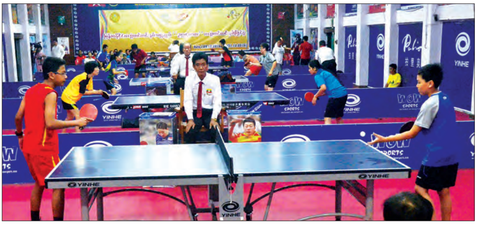
လေ့ကျင့်ပေးသွားမှာပါ” ဟု အရှေ့တောင် အာရှ စားပွဲတင်တင်းနှစ်အဖွဲ့ချုပ်ဒုတိယ ဥက္ကဋ္ဌ မြန်မာနိုင်ငံ စားပွဲတင်တင်းနှစ်အဖွဲ့ ချုပ်ဥက္ကဋ္ဌ ဦးကျော်ကျော်က ပြောကြား သည်။ ပထမနေ့အုပ်စုပတ်လည်ပွဲစဉ်တွင် အမျိုးသား အမျိုးသမီးတစ်ဦးချင်းပြိုင်ပွဲ များ၊ အမျိုးသားတစ်ဦးချင်းအပျော်တမ်း နှင့် လူသစ်တန်းပြိုင်ပွဲများ ယှဉ်ပြိုင်ကြ သည်။ ယင်းပြိုင်ပွဲတွင် အလွတ်တန်းအမျိုး သား အမျိုးသမီးအပျော်တမ်း၊ လူသစ် တန်းပြိုင်ပွဲများ၌ အားကစားသမား ၁၂၀ ဝင်ရောက်ယှဉ်ပြိုင်ကြပြီး ပြိုင်ပွဲကို ဒီဇင်ဘာ ၃၀ ရက်အထိ ကျင်းပမည်ဖြစ် ကြောင်း သိရသည်။ သတင်းနှင့်စာတိတ် တင်စိုး(မြန်မာ့အလင်း)

ရန်ကုန် ဒီဇင်ဘာ ၂၉ မြန်မာနိုင်ငံစားပွဲတင်တင်းနှစ်အဖွဲ့ချုပ် ဥက္ကဋ္ဌဇလား စားပွဲတင်တင်းနှစ်ပြိုင်ပွဲ ဖွင့်ပွဲကို ယနေ့နံနက် ၉ နာရီက ရန်ကုန်မြို့ ဒဂုံမြို့နယ် ဦးဝိစာရလမ်း အမျိုးသား ရေကူး ကန်ရှိ မြန်မာနိုင်ငံစားပွဲတင် တင်းနှစ် အဖွဲ့ချုပ်ခန်းမ၌ ကျင်းပခဲ့သည်။ “ကျွန်တော်တို့ ဥက္ကဋ္ဌဇလားပြိုင်ပွဲ ကို နှစ်စဉ်ကျင်းပတာပါ။ စားပွဲတင် တင်းနှစ်အားကစားသမားအချင်းချင်း ချစ်ကြည်မှု၊ လက်ရည်မြှင့်မားရေးနဲ့ကစား နည်းတိုးတက်ပြန့်ပွားဖို့အတွက် ကျင်းပ တာဖြစ်ပါတယ်။ (၂၉)ကြိမ်မြောက် ဆီးဂိမ်းအောင်မြင်မှု ရရှိဖို့အတွက် လည်း ဒီပြိုင်ပွဲက လက်ရည်ကောင်းတဲ့ ကစားသမားတွေကို ရွေးချယ်သွားမှာပါ။ ဇန်နဝါရီမှာ ဆီးဂိမ်းအတွက် ကစားသမား တွေကို အပြီးသတ်ရွေးချယ်ပြီး စခန်းသွင်း