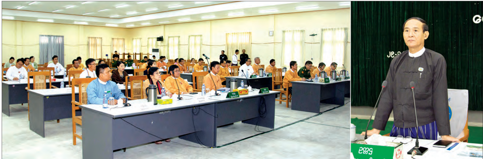
ပြည်သူ့လွှတ်တော်ဥက္ကဋ္ဌ ဦးဝင်းမြင့် ကယားပြည်နယ်လွှတ်တော်ကိုယ်စားလှယ်များအား ဥပဒေပြုရေး၊ ဒေသခံဖွံ့ဖြိုးရေး၊ ငြိမ်းချမ်းရေးနှင့် လွှတ်တော်အတွေ့အကြုံများကို ရှင်းလင်းပြောကြားစဉ် (သတင်းစဉ်)

နေပြည်တော် ဒီဇင်ဘာ ၂၉ ပြည်သူ့လွှတ်တော်ဥက္ကဋ္ဌ ဦးဝင်းမြင့်သည် ကယားပြည်နယ် လွှတ်တော်ကိုယ်စားလှယ်များအား ယနေ့မနက် ၉ နာရီတွင် ပြည်နယ်အစိုးရအဖွဲ့ရုံး အစည်းအဝေးခန်းမ၌ တွေ့ဆုံပြီး ဥပဒေပြုရေး၊ ဒေသဖွံ့ဖြိုးရေး၊ ငြိမ်းချမ်းရေးနှင့် လွှတ်တော်အတွေ့အကြုံများကို ရှင်းလင်းပြောကြားသည်။