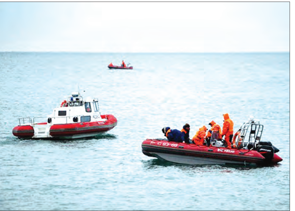
ဌာနပိုင် ခရီးသည်တင် လေယာဉ်သည် သည် ၉၂ ဦးနှင့်အတူ လေယာဉ်ဝန်ထမ်း သို့ ထွက်ခွာလာစဉ် ပင်လယ်ထဲသို့ ဒီဇင်ဘာ ၂၅ ရက်အစောပိုင်းက ခရီး ရှစ်ဦးလိုက်ပါလျက် မော်စကိုမှ ဆီးရီးယား ပျက်ကျခဲ့ခြင်းဖြစ်သည်။ (ဆင်ဟွာ)

မော်စကို ဒီဇင်ဘာ ၂၉ ပင်လယ်နက်အတွင်းသို့ ပျက်ကျသွား သည့် ရုရှားနိုင်ငံကာကွယ်ရေးဝန်ကြီး ဌာနပိုင် Tu-154 ခရီးသည်တင် လေယာဉ်၏အိမ်က အစိတ်အပိုင်းများကို ပင်လယ်ထဲမှ ဆယ်ယူနိုင်ခဲ့ပြီးနောက် ရှာဖွေရေးလုပ်ငန်းများအား အဆုံးသတ် လိုက်ကြောင်း ရုရှားသတင်းအေဂျင်စီ RIA Novosti ၏ ဒီဇင်ဘာ ၂၉ ရက် ဖော်ပြချက်ကိုကား၍ ဆင်ဟွာ သတင်းတစ်ရပ်တွင် ဖော်ပြသည်။ လေယာဉ်ပျက်ကျသည့်နေရာတွင် ရှာဖွေရေးလုပ်ငန်းများလည်း ရပ်တန့် လိုက်ပြီဖြစ်ကြောင်း ရုရှားအာဏာပိုင် များ၏ ပြောကြားချက်ကို ကိုးကား၍ ရုရှားသတင်းအေဂျင်စီ RIA Novosti က ဖော်ပြခဲ့သည်။ လေယာဉ်ပျက်ကျသည့်နေရာတွင် သေဆုံးသူ ၁၉ ဦး၏ အလောင်းများအား ဆယ်ယူနိုင်ခဲ့ကာ အတည်ပြုနိုင်ရေး အတွက်မော်စကိုသို့ လွှဲပြောင်းခဲ့ကြောင်း သိရသည်။ ရုရှားကာကွယ်ရေးဝန်ကြီး