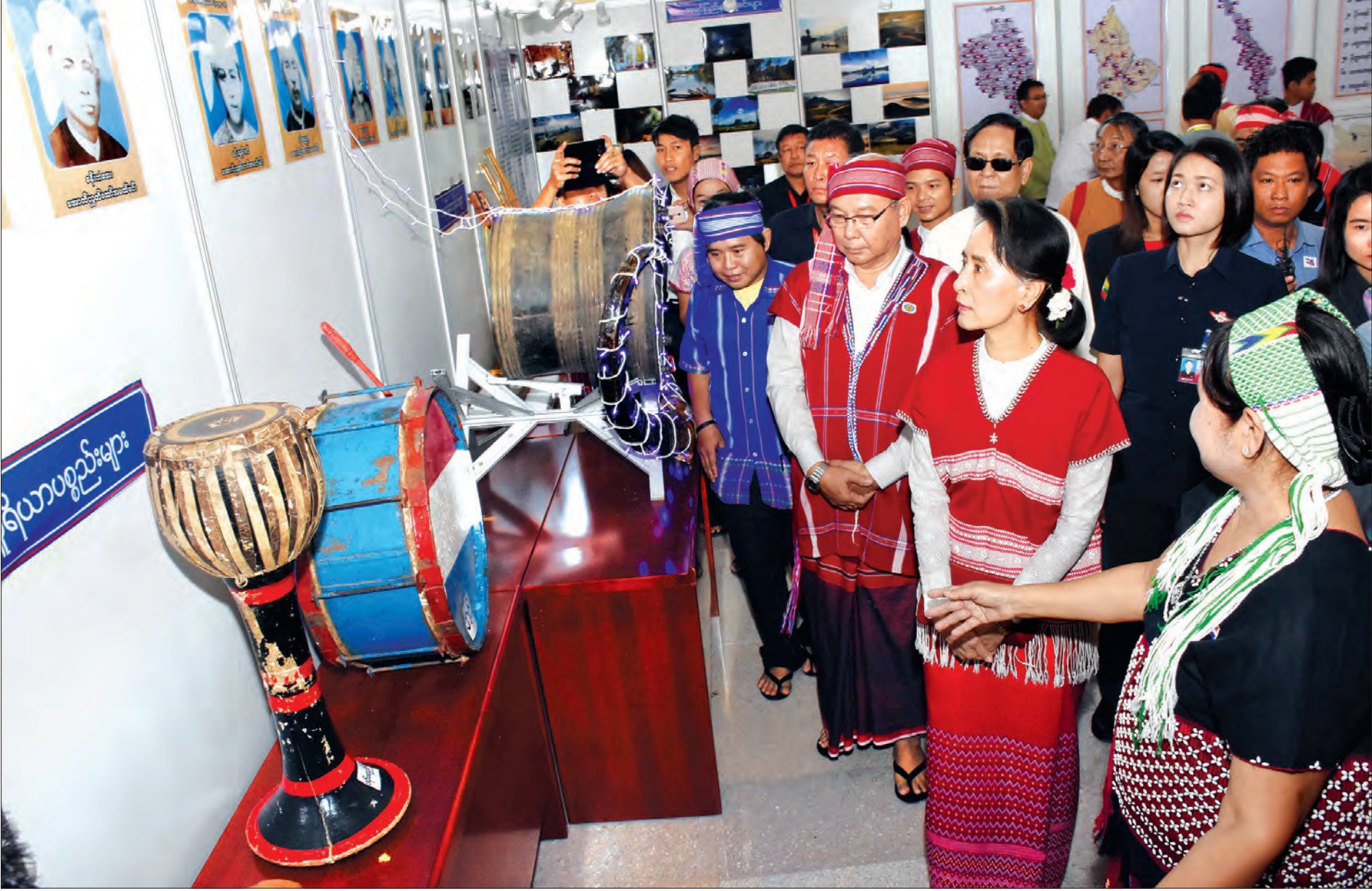
နိုင်ငံတော်၏ အတိုင်ပင်ခံပုဂ္ဂိုလ် ဒေါ်အောင်ဆန်းစုကြည် ကရင်အမျိုးသားနှစ်သစ်ကူးနေ့အထိမ်းအမှတ် ယဉ်ကျေးမှုပြခန်းကို လှည့်လည်ကြည့်ရှုစဉ် (သတင်းစဉ်)

နေပြည်တော် ဒီဇင်ဘာ ၂၉ ကရင်နှစ် ၂၇၅၆ ခုနှစ် သလေးထိုင်ခတ်ဖို ပြာသိုလဆန်း ၁ ရက်နေ့ ကရင်အမျိုးသားနှစ်သစ်ကူးနေ့အခမ်းအနားကို ယနေ့ နံနက် ၉ နာရီခွဲက နေပြည်တော်ရှိ မြန်မာအပြည်ပြည်ဆိုင်ရာကွန်ဗင်းရှင်းဗဟိုဌာန အမှတ်(၂)၅ ကျင်းပရာ နိုင်ငံတော်၏ အတိုင်ပင်ခံပုဂ္ဂိုလ် ဒေါ်အောင်ဆန်းစုကြည် တက်ရောက်၍ နှစ်သစ်ကူးမိန့်ခွန်း ပြောကြားသည်။