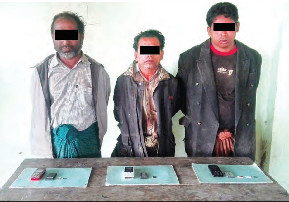
လေးခုတို့နှင့်အတူ ဖမ်းဆီးရမိခဲ့ခြင်း ဖမ်းဆီးရမိသူများအား တရား လျက်ရှိကြောင်း သတင်းရရှိသည်။ (သတင်းစဉ်)

မောင်တောမြို့နယ် ဦးရှည်ကျကျေးရွာအုပ်စု အလယ်ရွာအနီးရှိ တောင်ကြားအတွင်း၌ အနက်ရောင် ဝတ်စုံများ ဝတ်ဆင်ထားပြီး လက်နက်ကိုင်ဆောင်ထားသူ ၁၁ ဦးခန့်သည် ဒီဇင်ဘာ ၁၅ ရက်မှစ၍ ညအချိန်တွင် ကျေးရွာသားများအား စစ်သင်တန်း ပို့ချနေကြောင်းသတင်းအရ တပ်မတော် စစ်ကြောင်းနှင့် နယ်ခြားစောင့်ရဲတပ်ဖွဲ့ ဝင်များပါဝင်သော ပူးပေါင်းအဖွဲ့ဖြင့် သွားရောက်နယ်မြေရှင်းလင်းရာ ဒီဇင်ဘာ ၂၈ ရက် ည ၁၂ နာရီခွဲခန့်တွင် ဦးရှည်ကျကျေးရွာ၌ အာမိတ်ဟူဆောင်၊ ဟာဆူများနှင့် နှုတ်ခမ်းတို့ကို ရွာအတွင်း ရှိလူသွားလမ်း၌ ဖုန်း သုံးလုံး၊ ဆင်းကတ်