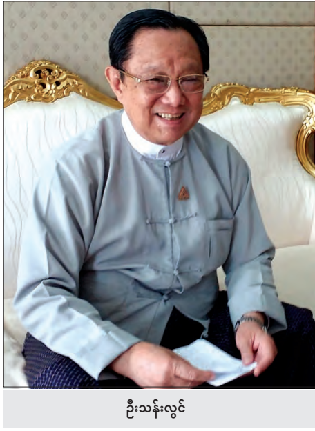
ဦးသန်းလွင်