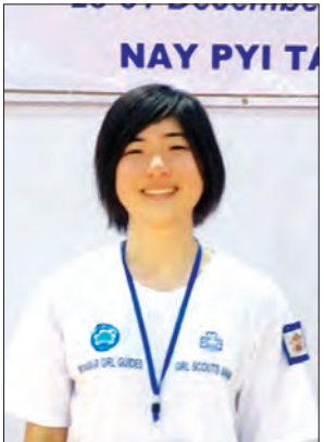
ဒေါက်တာဒေါ်တင်လှကြည်