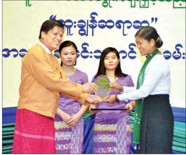
ရန်ကုန် ဒီဇင်ဘာ ၂၉