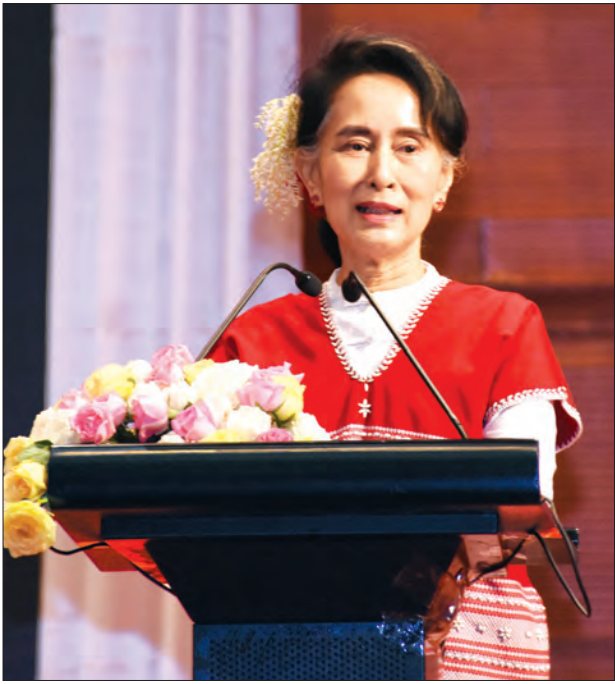
နိုင်ငံတော်၏ အတိုင်ပင်ခံပုဂ္ဂိုလ် ဒေါ်အောင်ဆန်းစုကြည် ကရင်အမျိုးသား နှစ်သစ်ကူးနေ့အခမ်းအနားတွင် မိန့်ခွန်းပြောကြားစဉ် (သတင်းစဉ်)

ကရင်အမျိုးသားများ ညီညီညွတ်ညွတ် ချစ်ချစ်ခင်ခင် ပူးပေါင်းညှိနှိုင်း အဖြေရှာ ဆောင်ရွက်ရာမှ ကရင်နှစ်သစ်ကူးနေ့ကို သတ်မှတ်နိုင်ခဲ့ပါကြောင်း၊ ယင်းကို နမူနာ ယူပြီး မြန်မာနိုင်ငံအတွင်း မှီတင်းနေထိုင် ကြသော တိုင်းရင်းသားများက ညီညီ ညွတ်ညွတ် ချစ်ချစ်ခင်ခင်ဖြင့် ပူးပေါင်း ညှိနှိုင်း အဖြေရှာဆောင်ရွက်ပါက နိုင်ငံ သူ နိုင်ငံသားများ လိုလားတောင့်တနေ သည့် ငြိမ်းချမ်းရေးကို ရရှိမည်မှာ မလွဲ ကောက်နိုင်ပါကြောင်း၊ ကရင်တိုင်းရင်းသား များအနေဖြင့် ကရင်အမျိုးသား နှစ်သစ် ကူးနေ့ကို ခမ်းနားစွာ ကျင်းပနိုင်ခဲ့သည့် ညီညွတ်ချစ်ခင်စွာ ဆောင်ရွက်မှုများကို မေ့ပျောက်မသွားဘဲ နိုင်ငံတော် ဖွံ့ဖြိုး တိုးတက်ရေးအတွက် စည်းလုံးညီညွတ် ကောင်းတာလုပ်ပါက ကောင်းကျိုး ခံစားရမည်ဖြစ်၍ ပြည်ထောင်စု