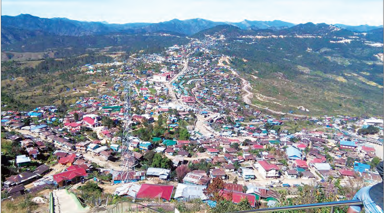
တို့ကို အလေးထားဆောင်ရွက်နေခြင်းဖြစ်ရာ ယခု လက်ရှိအားဖြင့် ပြည်တွင်းပြည်ပ ခရီးသွားများ တည်းခိုနေနိုင်သည့် ကန်ပက်လက်မြို့တွင် အဆင့်မီဟိုတယ် ရှစ်လုံးရှိ

ချင်းပြည်နယ်တွင် ပြည်တွင်း ပြည်ပခရီးသွားလုပ်ငန်းမြှင့်တင်ရေးကို စတင် အကောင်အထည်ဖော်ဆောင်ရွက်လျက်ရှိရာ ယခုပွင့်လင်းရာသီတွင်ချင်းပြည်နယ် ဒေသတစ်ခုလုံး အရှိန်အဟုန်မြှင့်တင်ဆောင်ရွက်သွားမည်ဖြစ်ပြီး ဒေသ၏လိုအပ်ချက် ဖြစ်သော လမ်းပန်းဆက်သွယ်ရေး၊ ခရီးသွားများတည်းခိုစားသောက်နေထိုင်နိုင်ရေး