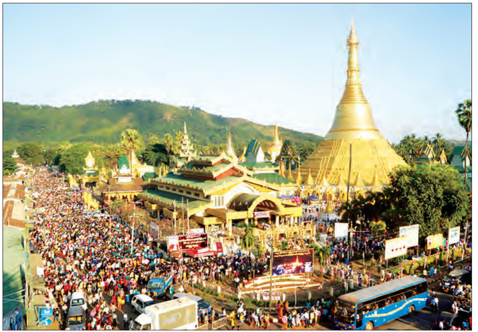
ရွှေစာရံစေတီတော်မြတ်ကြီး စတုတ္ထအကြိမ်မြောက် မြို့လုံးကျွတ်မဟာနိဗ္ဗာန်ဈေးပွဲတော် ကျင်းပစဉ်

စတင်ကာ ဝတ်အသင်းအဖွဲ့များက ညစဉ်ဝတ်ရွတ်ပူဇော်ခဲ့ကြ ကြောင်း ၎င်းက ဆက်လက်ပြောကြားသည်။ “ခုလိုအကြီးကျယ်ဆုံး မဟာနိဗ္ဗာန်ဈေးပွဲတော်ကို ပြုလုပ် နိုင်တာ မြို့သားတစ်ယောက်အနေနဲ့ ဂုဏ်ယူမိတယ်။ ဒီပွဲမှာ လူဖို့အတွက် ကျွန်တော်တို့အဖွဲ့ တစ်နှစ်နီးပါးလောက် ကြိုပြီး စုဆောင်းထားပါတယ်။ အနီးဝန်းကျင်မှာရှိတဲ့ မြို့တွေကပါ လာပြီးဆင်နွှဲကြတာဖြစ်လို့ အစည်ကားဆုံး ပွဲလည်းဖြစ်ပါတယ်” ဟု ဂေါပကဥက္ကဋ္ဌ လူငယ်များအဖွဲ့က ပြောသည်။ အဆိုပါပွဲတော်ကို ညနေ ၄ နာရီတွင် ဖဲကြိုးဖြတ်ဖွင့်လှစ် ပေးကြရာ မွန်၊ ကရင်၊ ပအိုဝ်း တိုင်းရင်းသားရိုးရာယဉ်ကျေးမှု ယိမ်းအဖွဲ့များက ဧည့်ခံဈေးမြေကြိုပြီး ရပ်နီးရပ်ဝေးမှ ပွဲတော်လာပရိသတ်များက သထုံမြို့နယ်အတွင်းရှိ အဖွဲ့အစည်း ပေါင်းစုံတို့၏ ဆိုင်ခန်းပေါင်း ၁၀၀ ကျော်မှ စားသောက်ဖွယ်ရာ မျိုးစုံ ကျွေးမွေးလှူဒါန်းသည့် နိဗ္ဗာန်ဈေးပွဲတော်၌ တပျော်တပါး ဝင်ရောက်ဆင်နွှဲခဲ့ကြသည်။ ပူဇော်ပွဲကို ဒီဇင်ဘာလ ၂၆ ရက်နှင့် ၂၇ ရက်တို့တွင် ကျင်းပမည်ဖြစ်ပြီး ပထမနေ့တွင် မြို့လုံးကျွတ် မဟာနိဗ္ဗာန်ဈေးပွဲတော်နှင့် ဒုတိယနေ့တွင် သံဃာတော် ၁၀၈ ပါးတို့အား ဆွမ်းဆန်စိမ်းလောင်းလှူပွဲကို ကျင်းပသွားမည် ဖြစ်ကြောင်း ဘဏ္ဍာတော်ထိန်း ဂေါပကအဖွဲ့မှ သိရသည်။ သက်ဦး(သထုံ)