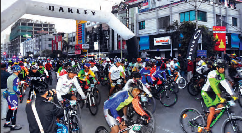
Mountain Bike တောင်တက်ပြိုင်ပွဲနှင့် မန္တလေးတောင်ဆင်းလမ်းကြမ်း Down Hill ဖိတ်ခေါ်စက်ဘီးစီးပြိုင်ပွဲ တာလွှတ်စဉ်