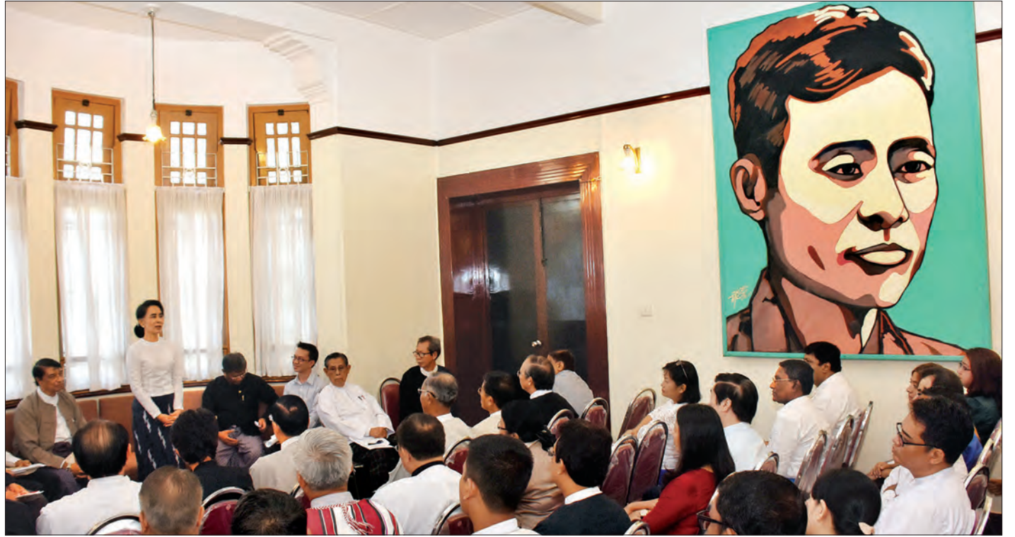
ဘာသာပေါင်းစုံမှဘာသာရေးခေါင်းဆောင်များက နိုင်ငံတော်၏အတိုင်ပင်ခံပုဂ္ဂိုလ် ဒေါ်အောင်ဆန်းစုကြည်၏မိခင်ကြီး ဒေါ်ခင်ကြည်အတွက် ဘာသာပေါင်းစုံဆုတောင်းခြင်းအခမ်းအနား ပြုလုပ်စဉ် (သတင်း-ရှေ့ဖုံး) (သတင်းစဉ်)

ရန်ကုန် ဒီဇင်ဘာ ၂၇ မြန်မာ့ပင်လယ်ပြင်အခြေအနေမှာ လှိုင်းအသင့်အတင့် ရှိ မည်။ (မိုး/လေ)