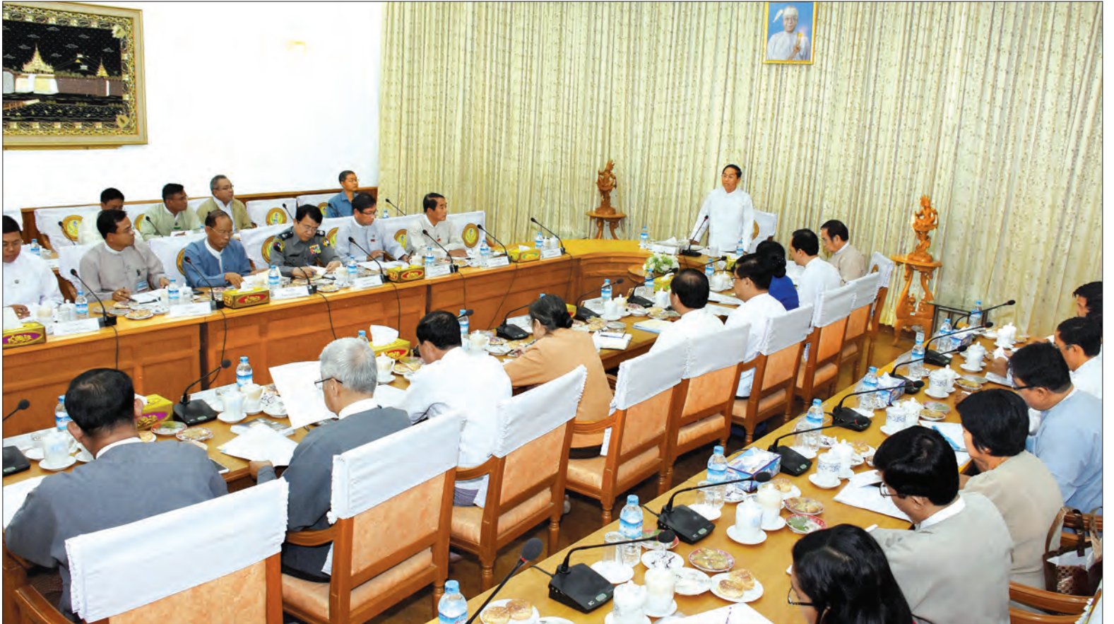
ဒုတိယသမ္မတ ဦးမြင့်ဆွေ (၁၇)ကြိမ်မြောက် မြန်မာ့တိုင်းရင်းဆေးသမားတော်များ ညီလာခံနှင့် နီးနှောဖလှယ်ပွဲကျင်းပရေးဦးစီးကော်မတီနှင့် လုပ်ငန်းကော်မတီအစည်းအဝေးတွင် အမှာစကားပြောကြားစဉ် (သတင်းစဉ်)

နေပြည်တော် ဒီဇင်ဘာ ၂၇ (၁၇)ကြိမ်မြောက် မြန်မာ့တိုင်းရင်းဆေးသမားတော်များ ညီလာခံနှင့် နီးနှောဖလှယ်ပွဲ ကျင်းပရေးဦးစီးကော်မတီနှင့် လုပ်ငန်းကော်မတီအစည်းအဝေးကို ယနေ့ မွန်းလွဲ ၂ နာရီက ကျန်းမာရေးနှင့်အားကစားဝန်ကြီးဌာန အစည်းအဝေးခန်းမ၌ ကျင်းပရာ ဦးစီးကော်မတီနာယက ဒုတိယသမ္မတ ဦးမြင့်ဆွေ တက်ရောက် အမှာစကားပြောကြားသည်။