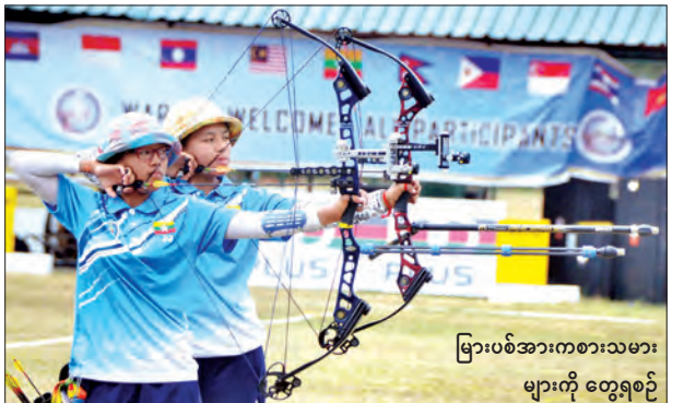
မြားပစ်အားကစားသမားများကို တွေ့ရစဉ်