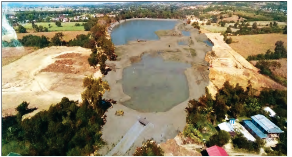
ကန်တော်ကြီးကန် သန့်ရှင်းဖော်ခြင်းလုပ်ငန်းဆောင်ရွက်နေစဉ်

ရမ်းပြည်နယ်တောင်ပိုင်း ညောင်ရွှေမြို့ ရှိ ကန်တော်ကန်သည် ကမ္ဘောဇရေဋ္ဌ သီရိပဝရာ မဟာဝံသ၊ သုဓမ္မရာဇာဘွဲ့နှင့် K.C.L.E (အိန္ဒိယအတုလမဟာရဋ္ဌ သေနာပတိ) (Sir) ဆာဘွဲ့တော်ရ၊ ညောင်ရွှေ မဟာရာဇာစော်ဘွားကြီး (ဆာ)စင်မောင်သည် သက္ကရာဇ် ၁၂၄၁ ခုနှစ်ကတည်းက ဆင်းရဲသား ပြည်သူများ လယ်ယာမြေကောင်းမွန်စွာ လုပ်ကိုင် နိုင်ရန်ရည်သန်၍ ဖောက်လုပ်တူးဖော်ခဲ့သော သမိုင်းဝင်ကန်ကြီးတစ်ကန် ဖြစ်သည်။