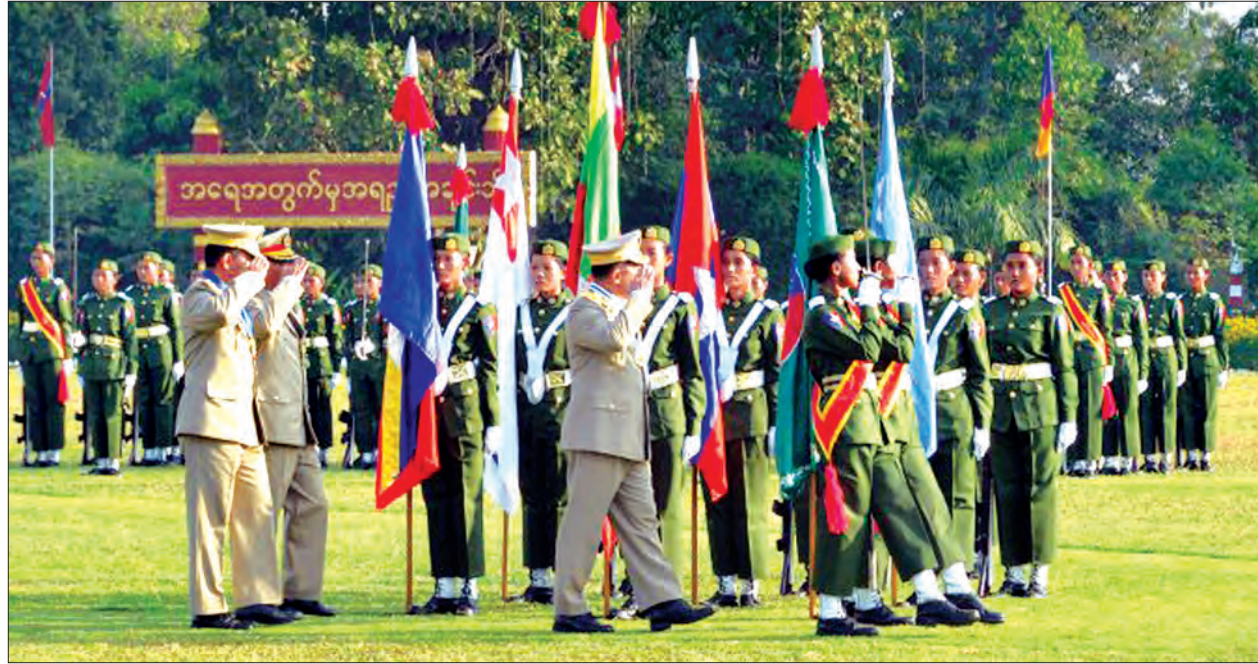
တပ်မတော်ကာကွယ်ရေး ဦးစီးချုပ် ပိုလ်ချုပ်မှူးကြီး မဟာ သရေ စည်သူ မင်းအောင်လှိုင် ဘွဲ့ရအမျိုးသမီး ပိုလ်လောင်းတပ်ခွဲများအား စစ်ဆေးစဉ် (သတင်းစဉ်)

ဆုံးဆုရ ပိုလ်လောင်းအိန္ဒြာအောင်ကျော် နှင့် ၎င်းတို့၏မိဘများအားတွေ့ဆုံ၍ ဂုဏ်ပြုအမှာစကားပြောကြားသည်။