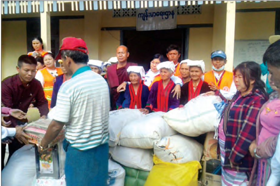
ထောက်ပံ့ပစ္စည်းများ ပေးအပ်ရာ တွင် သီပေါမြို့နယ်အတွင်း လက်ရှိဖြင့်လှစ် ထားသည့် စစ်ဘေးရှောင်စခန်းငါးခု ဖြစ်သည့် မိုးတော၊ သာသနာ ၂၅၀၀ ကျောင်း၊ ဘော်ကြို၊ ပန်လုံ၊ တာပုတ်နေရာ ၅၂ ထုပ်၊ ကြာဆံအိတ်တစ်အိတ် များ၌ ရောက်ရှိနေသည့် လူဦးရေ တို့ကို လှူဒါန်းခဲ့ကြောင်း သိရ သည်။ (ခရိုင် ပြန်/ဆက်)

ရှမ်းပြည်နယ်မြောက်ပိုင်း နမ့်တူမြို့နယ် ပန်လုံကျေးရွာအုပ်စုမှ တိုက်ပွဲများကို တိမ်းရှောင်၍ ကျောက်မဲခရိုင် သီပေါ မြို့နယ်အတွင်း ရောက်ရှိနေသော ပြည်သူ ၁၉၀၀ ကျော်အတွက် ထောက်ပံ့ပစ္စည်း များကို မူဆယ်မြို့နယ် (၁၀၅)မိုင် မိုင်းယု ကျေးရွာအခြေစိုက် ပါရမီလူမှုကူညီ ရေးအသင်းမှ ဒီဇင်ဘာ ၂၅ ရက်က လာရောက်ထောက်ပံ့လှူဒါန်းခဲ့ကြောင်း သိရသည်။