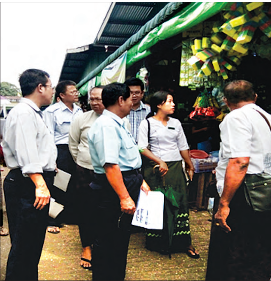
စားသုံးသူအကာအကွယ်ပေးရေးအတွက် ဈေးများသို့ကွင်းဆင်းစစ်ဆေးဆောင်ရွက်နေစဉ်

လူ့သက်တမ်းအနေဖြင့် ၂၀၁၃ ခုနှစ်တွင် မြန်မာနိုင်ငံ၌ ကျား(၆၅)နှစ်၊ မ(၆၈)နှစ် ပျမ်းမျှသက်တမ်းရှိပြီး ၂၀၁၅ ခုနှစ် သို့ရောက်သောအခါ ကျား(၆၂)နှစ်၊ မ(၆၅)နှစ်ဖြစ်လာ၍ ပျမ်းမျှသက်တမ်းများ တဖြည်းဖြည်းတိုလာနေသည်ကို တွေ့ရှိလာရပါသည်။ မကြာသောကာလတွင် ဘေးဥပဒ် အန္တရာယ်ရှိသော စားသုံးပစ္စည်းများကိုသာ ဆက်လက်၍ စားသုံး သုံးစွဲနေပါက မြန်မာ နိုင်ငံ၏ ပျမ်းမျှလူသက်တမ်းသည် ပို၍တိုသွားရုံသာ ရှိပါတော့မည်။ ပျမ်းမျှ လူသက်တမ်း (၄၀)နှစ်၊ (၅၀)နှစ်နှင့် ဘဝသစ်ကူးပြောင်းသွားနိုင်သလို မကူး