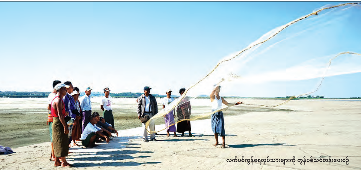
လက်ပစ်ကွန်ရေလုပ်သားများကို ကွန်ပစ်သင်တန်းပေးစဉ်