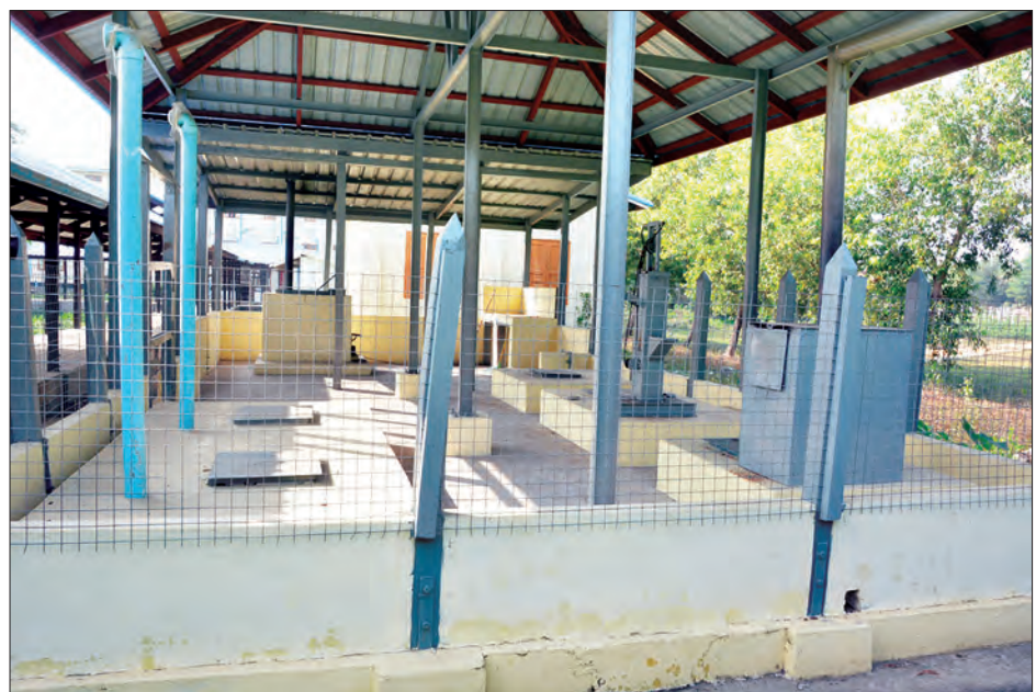
ဘူးသီးတောင် ပြည်သူ့ဆေးရုံ၌ ကူးစက်ရောဂါဖြစ်ပွားမှုကို ထိန်းချုပ်နိုင်ရန် မီးရှို့စွန့်ပစ်သည့်စနစ်ဆောင်ရွက်ထားစဉ်