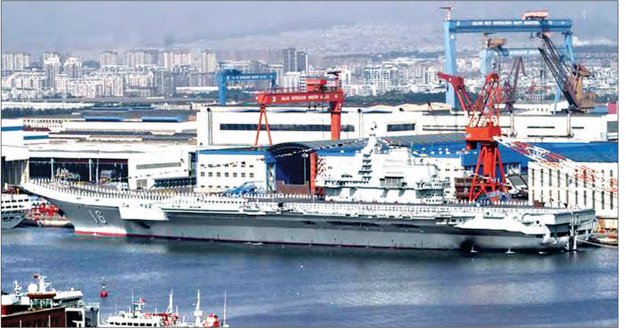
၂၀၁၂ ခုနှစ် စက်တင်ဘာလက လျှောင့်နှင်းလေယာဉ်တင်သင်္ဘောကို တာလျန်ရှိ ဆိပ်ကမ်း၌တွေ့ရစဉ်

အဆိုပါ စစ်သင်္ဘောအုပ်စုသည် ထိုင်ဝမ်နှင့် ဖိလစ်ပိုင်နယ်နိမိတ်အကြားရှိ ဘာရီရေလက်ကြားမှတစ်ဆင့် ထိုင်ဝမ်တောင်ဘက်စွန်းရှိ မိုင်ကိုးဆယ်အကွာအဝေး ကိုဖြတ်ကျော်ဝင်ရောက်လာခဲ့ခြင်းဖြစ်ကြောင်း သိရသည်။