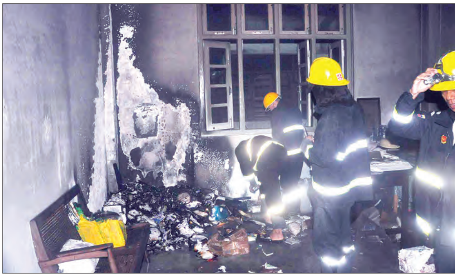
သစ်သားစီရိန်နှင့် အဖြေလွှာစာရွက်များ မီးလောင်မှုအား မီးသတ်တပ်ဖွဲ့ဝင်များ ဝိုင်းဝန်းငြိမ်းသတ်ကြစဉ်

တနင်္သာရီတိုင်းဒေသကြီး မြိတ်မြို့ အထက(၁)ကျောင်း ကုမုဒြာကျောင်းဆောင် ဆရာမများ နားနေဆောင်အတွင်း၌ ဒီဇင်ဘာ ၂၆ ရက် နံနက် ၃ နာရီ မိနစ် ၄၀ ခန့်က မီးလောင်မှုဖြစ်ပွားကြောင်း သိရသည်။