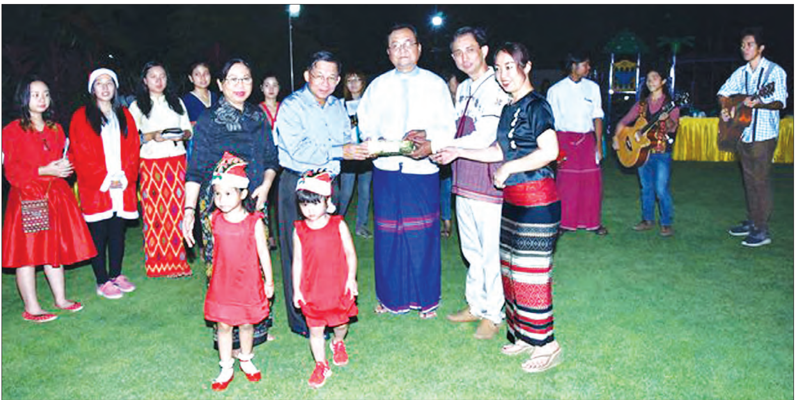
တပ်မတော်ကာကွယ်ရေးဦးစီးချုပ်နှင့် မိသားစုက ခရစ်ယာန်လူငယ်များ ဓမ္မတေးအဖွဲ့အား အလှူငွေများ ပေးအပ်စဉ်

နေပြည်တော် ဒီဇင်ဘာ ၂၆ တပ်မတော်ကာကွယ်ရေး ဦးစီးချုပ် ဗိုလ်ချုပ်မှူးကြီး မင်းအောင်လှိုင်၏ နေအိမ်သို့ ဒီဇင်ဘာ ၂၅ ရက် ညနေပိုင်းက ရန်ကုန်မြို့ရှိ ငြိမ်းချမ်းရေးအတွက် ခရစ်ယာန်လူငယ်များ ဓမ္မတေးအဖွဲ့ လာရောက်၍ ခရစ္စမတ်ဓမ္မတေးသီချင်းများ သီဆိုပြီး ငြိမ်းချမ်းရေးဆုတောင်း စကားများ ဂုဏ်ပြုပြောကြားခဲ့ကြောင်း သိရသည်။ တပ်မတော်ကာကွယ်ရေးဦးစီးချုပ်နှင့် မိသားစုက ဓမ္မတေးသီချင်းများ သီဆိုရာတွင် အသုံးပြုနိုင်ရန်အတွက် လိုအပ်သည်တို့ရှိလာပစ္စည်းနှင့် အလှူငွေများအား ပေးအပ်ခဲ့ကြောင်း သတင်းရရှိသည်။ (သတင်းစဉ်)