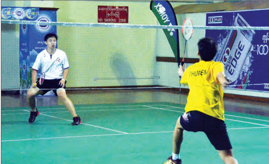
ရန်ကုန် ဒီဇင်ဘာ ၂၆ ကျင်းပမည့် ၂၀၁၆ ခုနှစ် အမျိုးသား ကျန်းမာရေးနှင့် အားကစားဝန်ကြီးဌာန တံခွန်စိုက် ကြက်တောင်ပြိုင်ပွဲဖွင့်ပွဲကို မြန်မာနိုင်ငံကြက်တောင်အဖွဲ့ချုပ်က ယနေ့နံနက် ၉ နာရီက ရန်ကုန်မြို့၊ လမ်းမတော်မြို့နယ် အမျိုးသား ကြက်တောင် အားကစားခန်းမ၌ ကျင်းပ ခဲ့သည်။

“ကျွန်တော်တို့ မြန်မာနိုင်ငံ ကြက်တောင်အဖွဲ့ချုပ် အလုပ်အမှုဆောင် သစ်နဲ့ ပထမဆုံးကျင်းပတဲ့ ပြိုင်ပွဲခြေ လှမ်းပါ။ ဒီပြိုင်ပွဲဟာ မြန်မာ့လက်ရွေး စင်တွေ၊ လူငယ်လက်ရွေးစင်တွေ တိုင်း ဒေသကြီးနဲ့ ပြည်နယ်မှ ကြက်တောင် အားကစားမောင်မယ်တွေ၊ ကလပ် အသင်းတွေက မျိုးဆက်သစ်လူငယ်တွေ၊ ဝါသနာရှင်တွေ ပါဝင်ယှဉ်ပြိုင်ကြပါ တယ်” ဟု မြန်မာနိုင်ငံကြက်တောင်အဖွဲ့ ချုပ်ဥက္ကဋ္ဌ ဦးအောင်ပိုင်က ပြောသည်။ ပထမနေ့ပွဲစဉ်တွင် အမျိုးသား အမျိုးသမီး အသက် ၁၉ နှစ်အောက် တစ်ဦးချင်း၊ သာမန်တန်း တစ်ဦးချင်းပြိုင် ပွဲများ စုစုပေါင်းပွဲစဉ် ၆၇ ပွဲ အကြိတ် အနယ် ယှဉ်ပြိုင်ကစားကြသည်။ ယင်းပြိုင်ပွဲတွင် အတန်း ၂၆ တန်း အားကစားသမား ၃၀၀ ကျော် ပါဝင် ယှဉ်ပြိုင်ကြပြီး ပြိုင်ပွဲကို ဒီဇင်ဘာ ၃၁ ရက်အထိ ကျင်းပသွားမည်ဖြစ်ကြောင်း သိရသည်။