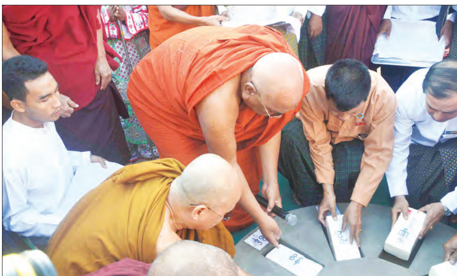
လွှတ်တော်ရုံး အမြဲတမ်းအတွင်းဝန် ဖွင့်လှစ်ပေးခဲ့သည်။ ကျွန်းလှမြို့သစ်တည်နှစ် ၂၀ ပြည့်ပွဲတော် ညွှန်ကြားရေးမှူးချုပ်တို့က ဖဲကြီးဖြတ် ဆက်လက်၍ နံနက် ၈ နာရီတွင် နှင့် သီတဂူဗုဒ္ဓတက္ကသိုလ် ပန္နက်တင်

ကျွန်းလှ ဒီဇင်ဘာ ၂၆ စစ်ကိုင်းတိုင်းဒေသကြီး ကန်ဘလူခရိုင် ကျွန်းလှမြို့သစ်တည်နှစ် ၂၀ ပြည့်ပွဲတော် သီတဂူ ဗုဒ္ဓတက္ကသိုလ် ပန္နက်တင် အုတ်မြစ်စီ မင်္ဂလာနှင့် လွတ်လပ်ရေး ကျောက်တိုင် ဖွင့်ပွဲအခမ်းအနားကို ဒီဇင်ဘာ ၂၆ ရက် နံနက် ၇ နာရီမှ စတင်၍ စည်ကားသိုက်မြိုက်စွာ ကျင်းပခဲ့ကြောင်း သိရသည်။(ယာဝုံ)