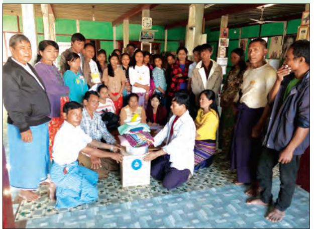
ရှမ်းပြည်နယ်မြောက်ပိုင်း သီပေါမြို့နယ်နှင့် နမူတူမြို့နယ်အတွင်း တိုက်ပွဲဖြစ်ပွားနေသော ကျေးရွာများမှ ကယ်ဆယ်ရေးစခန်းများ၌ ရောက်ရှိခိုလှုံနေကြသည့် စစ်ဘေးရှောင်ပြည်သူများအား ကယ်ဆယ်ရေးနှင့် ပြန်လည်နေရာချထားရေး ဦးစီးဌာနမှ စားသောက်စွယ်စုံများနှင့် လူသုံးကုန်ပစ္စည်းများ ကူညီထောက်ပံ့ခဲ့သည့်ပစ္စည်းများကို ဒီဇင်ဘာ ၂၄ ရက်တွင် ကယ်ဆယ်ရေးစခန်းများအလိုက် ရပ်ကွက်၊ ကျေးရွာအုပ်ချုပ်ရေးမှူးများက ပြန်လည်ပေးအပ်နေစဉ် ဖြစ်သည်။

စိုက်ပျိုးဧကများ ထိခိုက်ပျက်စီးပြီး နွေစပါးစိုက်ပျိုးချိန်တွင် စိုက်ပျိုးရေး လုံလောက်စွာ မရရှိခြင်းတို့ကြောင့် တောင်သူများ နစ်နာရကြောင်း သိရသည်။ အဆိုပါ မြို့နယ်အတွင်း ရေကြီးရေလျှံဖြစ်စဉ်ကို အဓိကဖြစ်စေသော ဟလင်းရေနုတ်မြောင်း၊ ငါးရံမြင်း ရေနုတ်မြောင်း HBC DY-5 ရေဆိုးချောင်းလမ်းစဉ်လူငယ်မြောင်း၊ ပင့်တာရိုး ရေနုတ်မြောင်းနှင့် ပင်ဇင်းရေသွယ်လျှောက် ပြုပြင်ခြင်းလုပ်ငန်းများ ပါဝင်ကြောင်း သိရသည်။ မျိုးဝင်းထွန်း (မုံရွာ)