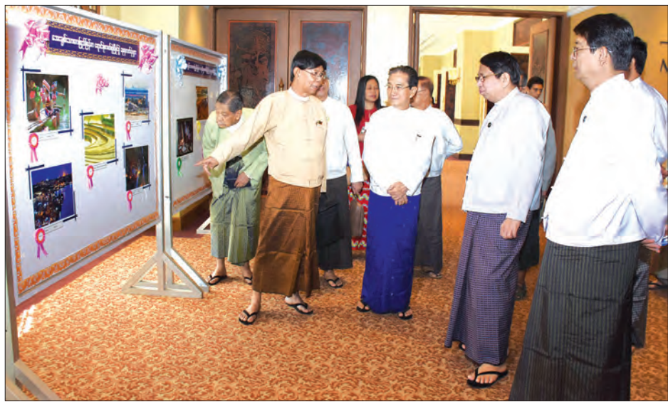
ပြည်ထောင်စုဝန်ကြီး ဒေါက်တာဖေမြင့် (၆၉)နှစ်မြောက် လွတ်လပ်ရေးနေ့အထိမ်းအမှတ် ရောင်စုံဓာတ်ပုံပြိုင်ပွဲ ဆုရ ဓာတ်ပုံများကို လှည့်လည်ကြည့်ရှုစဉ်

အခမ်းအနားတွင် ပြည်ထောင်စုဝန်ကြီးက ပြိုင်ပွဲဝင်များ နှင့် ဆုရရှိသူများတွင် လူငယ်လူသစ် မျိုးဆက်သစ် ဓာတ်ပုံသမား များလည်း ပါဝင်သည့်အတွက် မျိုးဆက်သစ်လူငယ်ဓာတ်ပုံပညာ ရှင်များ ပေါ်ထွက်လာစေရေးကို တစ်ဖက်တစ်လမ်းက အထောက်အကူပြုသည့် ပြိုင်ပွဲလည်းဖြစ်သည်ဟု ပြောလို ကြောင်း၊ ဓာတ်ပုံတစ်ပုံသည် စာလုံးပေါင်းတစ်ထောင်မက ဖော်ပြနိုင်သည့်အတွက် ဓာတ်ပုံပညာရှင်ကြီးများက မိမိတို့ တိုင်းပြည်၏ ရေမြေသဘာဝတောတောင်များကို မိမိတို့ လူမျိုး များ ချစ်မြတ်နိုးသည့်စိတ်ဖြင့်အောင် ဓာတ်ပုံပညာစွမ်းပကား ဖြင့် ရိုက်ကူးပြသနေသူများဖြစ်ကြောင်း၊ တိုင်းပြည်အပေါ် စည်းလုံးညီညွတ်သည့်စိတ်၊ ချစ်မြတ်နိုးသည့်စိတ်အပေါ် အခြေခံ ပြီး ညီညွတ်သည့်စိတ်တည်ဆောက်နိုင်မှသာလျှင် ယခင်က စုပေါင်းညီညွတ်မှုမရှိခဲ့သည့် လွတ်လပ်ရေးကို ဆက်လက်ထိန်းသိမ်း နိုင်မည်၊ တိုင်းပြည်ကို ကာကွယ်စောင့်ရှောက်နိုင်မည်၊ အခြား