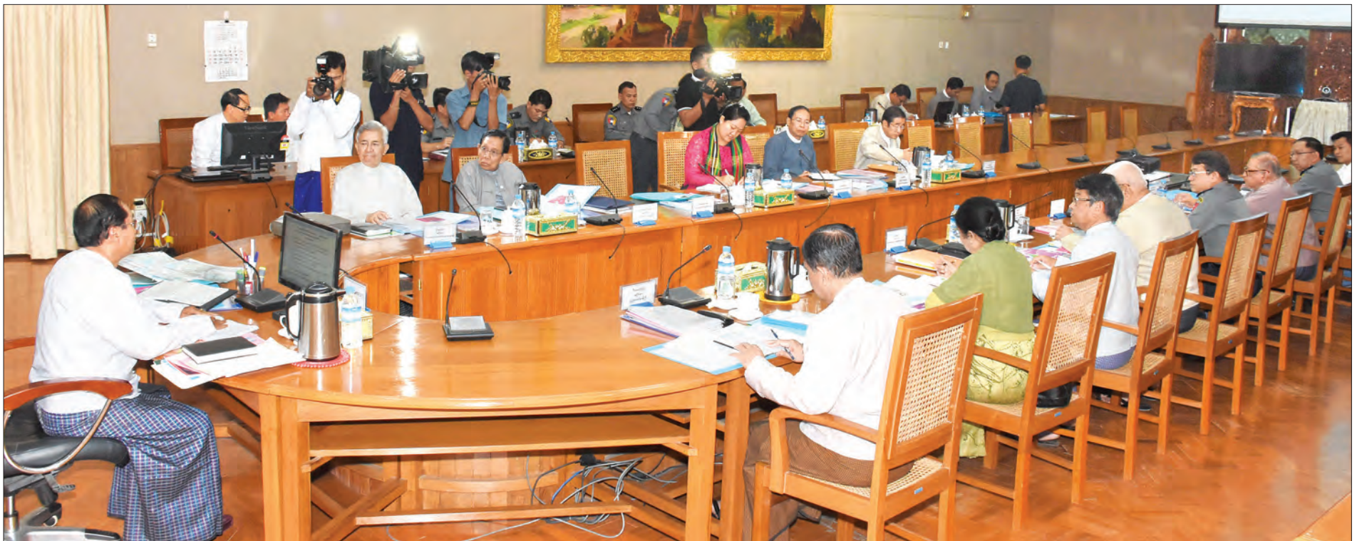
ဒုတိယသမ္မတ ဦးမြင့်ဆွေ ရခိုင်ပြည်နယ် စုံစမ်းစစ်ဆေးရေးကော်မရှင်၏ ၃/၂၀၁၆ လုပ်ငန်းညှိနှိုင်းအစည်းအဝေးတွင် အမှာစကားပြောကြားစဉ်