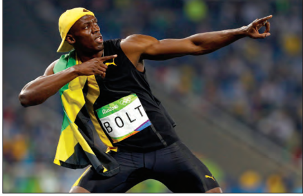
အူစီနီဘော့နှင့် အာယာနာ

နိုင်ငံတကာပြေးခုန်ပစ်အဖွဲ့ချုပ်ရဲ့ ၂၀၁၆ ခုနှစ် တစ်နှစ်တာအကောင်းဆုံး အမျိုးသား အားကစားသမားဆုကို အပြေးချန်ပီယံ တာတိုဘုရင် အူစီနီဘော့နှင့် အကောင်းဆုံး အမျိုးသမီးအားကစားသမားဆုကို အီသီယိုးပီးယားနိုင်ငံမှ အပြေးမယ် အယ်မက်စ် အာယာနာတို့ ရွေးချယ်ခြင်းခံရပါတယ်။