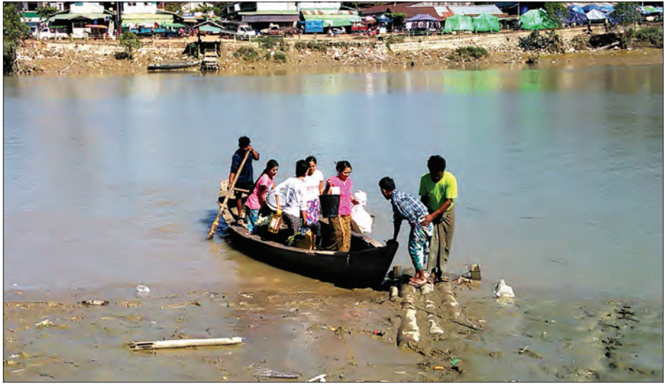
ကားများပင် ဖြတ်သန်းသွားလာနိုင်သည့်အတွက် လှေသမ္ဗန်လုပ်ကိုင်နေသူများ စီးပွားရှာစားသောက်မှု ကျဆင်းလာကာ တိမ်ကော ပျောက်ကွယ်လုနီးပါးကြုံတွေ့လာနေကြောင်း သိရသည်။ နေမျိုးထွဋ်(ရေး)

ရေးချောင်းတောင်မြစ်ကူးတံတားမရှိစဉ်က လက်လှော်လှေသမ္ဗန်လုပ်ငန်းတွင် ကျေးရွာနေပြည်သူများ အဓိက အားထားရသည့် ဆက်သွယ်ရေးလမ်းကြောင်းတစ်ခုဖြစ်ပြီး ယခုအခါ လမ်းပန်းဆက်သွယ်ရေးကောင်းမွန်လာ၍ ဆိုင်ကယ်၊