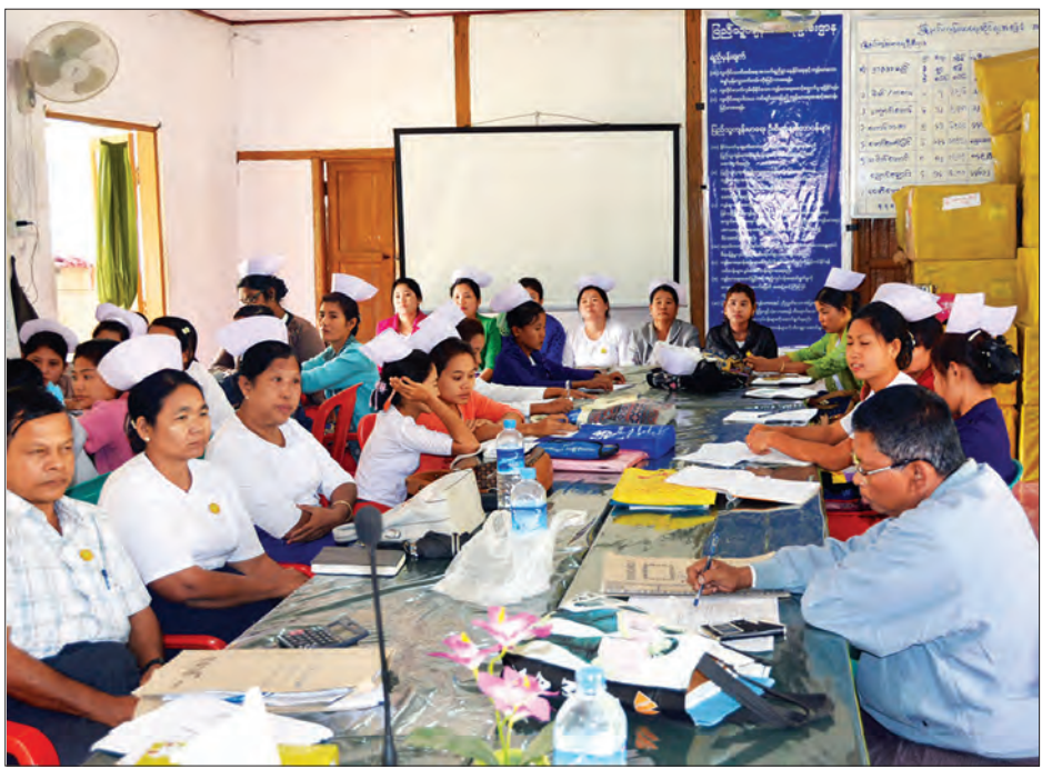
ဘူးသီးတောင်မြို့၊ ခုတင် ၅၀ ဆံ့ပြည်သူ့ဆေးရုံရှိ မြို့နယ်ဆရာဝန်များနှင့် ဝန်ထမ်းများကို တွေ့ရစဉ်

စွန့်ပစ်အညစ်အကြေးတွေကို စွန့်ပစ်တဲ့အခါမှာ Biological waste လို့ခေါ်တဲ့ စွန့်ပစ်အသားတွေ၊ Sharp and Needle လို့ခေါ်တဲ့ ဆူးစေတတ်တဲ့ကိရိယာတွေ၊ လူနာစားသောက်ပြီး ကျန်ခဲ့တာတွေ၊ ဓာတ်မှန်ခန်းက ထွက်လာတဲ့ စွန့်ပစ်ပစ္စည်းတွေ စတာတွေအားလုံးကို တစ်နေရာတည်းမှာ အလွယ်တကူနဲ့ မီးရှို့စွန့်ပစ်နိုင်အောင် စီမံဆောင်ရွက်ထားတဲ့ စနစ်ဖြစ်ပါတယ်” ဟု ၎င်းကဆိုသည်။ အဆိုပါအဆောက်အအုံကို ယခုနှစ်ဇွန်လက စတင်ဆောက် လုပ်ခဲ့ပြီး ခြောက်လခန့်ကြာပြီဖြစ်ကြောင်းသိရသည်။ ထိုသို့ စီမံဆောင်ရွက်ထားရှိမှုကြောင့် ဆေးရုံအတွင်း ကူးစက်ရောဂါ ဖြစ်ပေါ်မှုကို များစွာထိန်းချုပ် ကာကွယ်နိုင်သည့်အပြင်