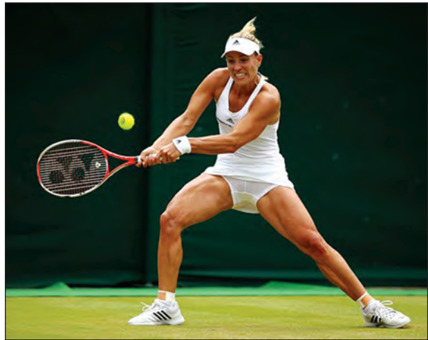
အန်ဂျယ်လီဒါဘာ

ဂျာမနီနိုင်ငံရဲ့ တစ်နှစ်တာအကောင်းဆုံး အမျိုးသမီးအားကစားသမားဆုကို ကမ္ဘာ့နံပါတ် (၁) တင်းနစ်မယ် အန်ဂျယ်လီဒါဘာ ရွေးချယ်ခံရပါတယ်။ ခါဘာအတွက် ပထမဆုံးအကြိမ်ရွေးချယ်ခြင်းခံရတာဖြစ်ပြီး ဂျာမနီနိုင်ငံရဲ့ တစ်နှစ်တာအကောင်းဆုံးအမျိုးသမီးအားကစားသမားဆုကို ကျွမ်းဘားကစားသမား ဟမ်ဘူချန်က ဆွတ်ခူးရရှိပါတယ်။ ဟမ်ဘူချန်ဟာ အိုလံပစ်ရွှေတံဆိပ်ဆုရှင်ဖြစ်ပြီး ၂၀၁၆ ခုနှစ်မှာ အားကစားနဲ့ နိုင်ငံကို အကျိုးပြုခဲ့သူဖြစ်ပါတယ်။