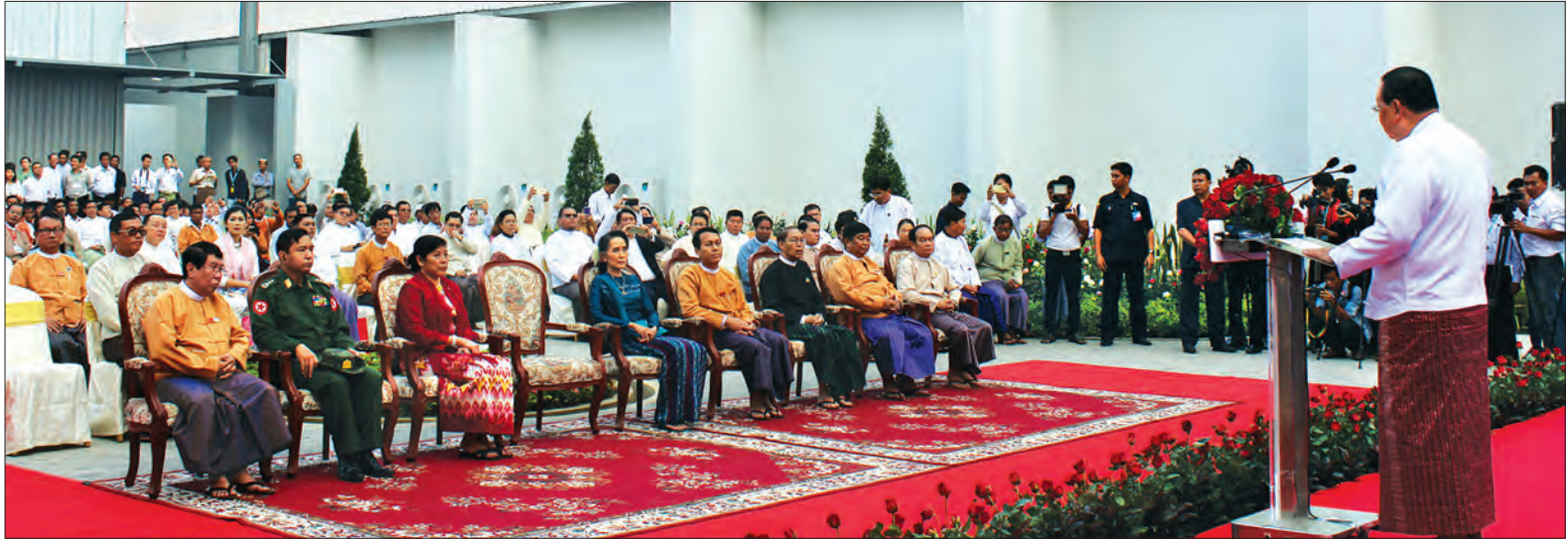
ပြည်ထောင်စုဝန်ကြီး ဦးဝင်းခိုင် ရတနာဒွန်းဆီအဆင့်မြင့်အိမ်ရာ ၁၈ ထပ်အဆောက်အအုံသစ်စီမံကိန်း မိတ်ဆက်ဖွင့်ပွဲအခမ်းအနား၌ အမှာစကားပြောကြားစဉ် (သတင်းစဉ်)

စီမံကိန်းရေးဆွဲထားရာ စုစုပေါင်းအိမ်ရာ ၁ ဒသမ ၈ သိန်းအထိ အကောင်အထည်ဖော်တည်ဆောက်နိုင်မည်ဟု မျှော်မှန်းထားပါကြောင်း။