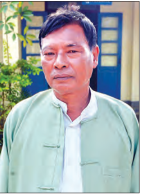
ဦးကျော်သိန်း

ရဲမှူးချုပ် သူရစန်းလွင် အမှတ် (၁) နယ်ခြားစောင့် ရဲကွပ်ကဲမှုဌာနချုပ်(ကျီးကန်းပြင်) အခု ပြည်တွင်းပြည်ပမီဒီယာအဖွဲ့တွေ ရောက်လာတဲ့ အတွက် သတင်းအဖြစ်မှန်ကို သိရမှာပါ။ တချို့သတင်းတွေက ဖြစ်သင့်တာထက် လိုရာကိုခွဲပြီးတော့ ဖော်ပြနေတဲ့အတွက် နိုင်ငံတကာမှာ အထင်မှားတာတွေ အများကြီးရှိနေတယ်။ ဒါကြောင့်မို့ သတင်းကို လျင်လျင်မြန်မြန်နဲ့ ထုတ်ပြန်ပေးနေတာ ပါ။ ကျွန်တော် သိသလောက်ဆိုရင် သတင်းကို နေ့ချင်းထုတ်ပြန် ပေးနေတယ်။ ဒီအပေါ်မှာ ပြည်ပနိုင်ငံတချို့ စွပ်စွဲတာတွေက မမှန်သတင်းတွေ များလာတဲ့အတွက် နိုင်ငံတော်က သတင်း ထုတ်ပြန်ရေးအဖွဲ့တွေကို ဖွဲ့ပြီးတော့ အချိန်နှင့်တစ်ပြေးညီ ထုတ်ပြန်ပေးနေတာပါ။