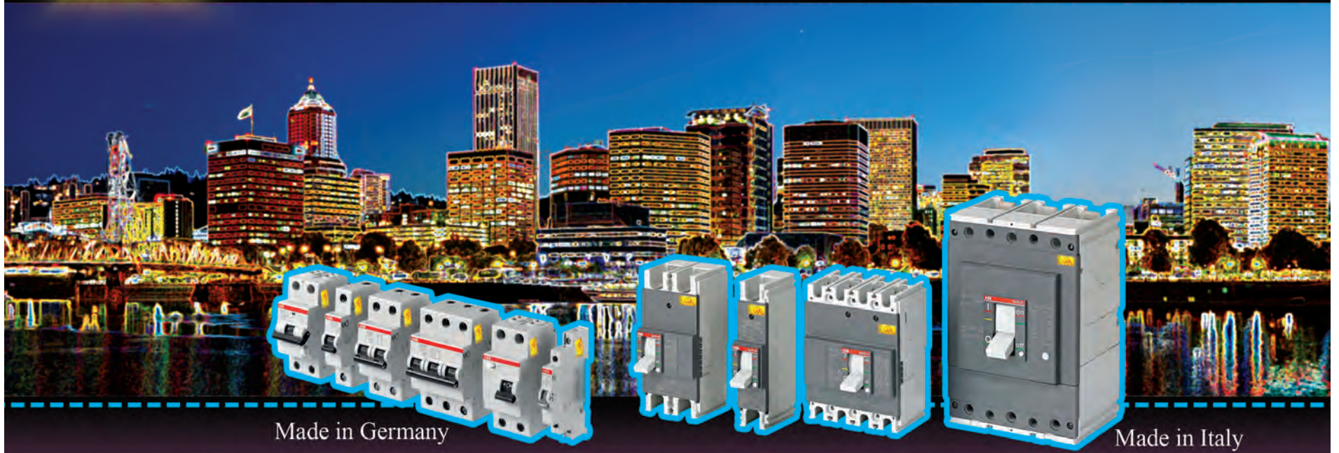
Made in Germany