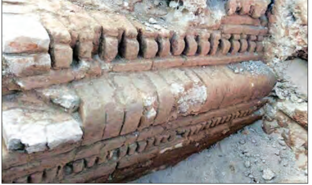
မြစ်သား ဒီဇင်ဘာ ၂၄