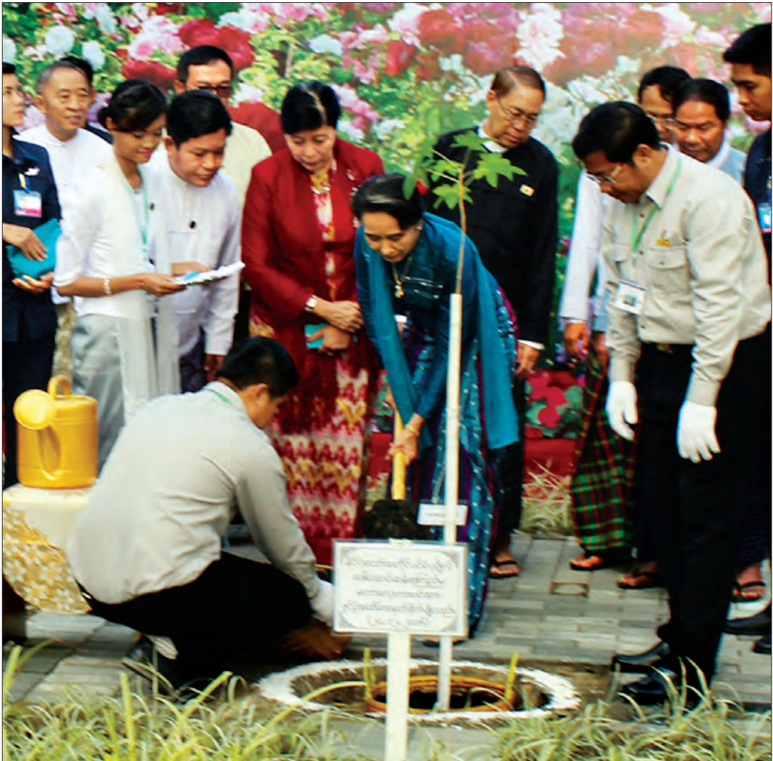
နိုင်ငံတော်၏ အတိုင်ပင်ခံပုဂ္ဂိုလ် ဒေါ်အောင်ဆန်းစုကြည် ရတနာဒွန်းဆီ အဆင့်မြင့်အိမ်ရာ ဝင်းအတွင်း ဖွင့်ပွဲအထိမ်းအမှတ်အဖြစ် မဟာလောကားပင် စိုက်ပျိုးပေးစဉ် (သတင်းစဉ်)

တာဝန်ရှိသည်ဆိုသော်လည်း ဗဟိုပြည်ထောင်စုအစိုးရကလည်း ဝိုင်းဝန်းကူညီသွားမည်ဖြစ်ပါကြောင်း။