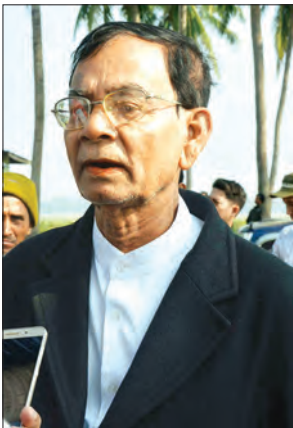
ဆွေယောဒုလ္လာ

ဟိုဘက်က လူတွေလာမယ်ဆိုလည်း ကျွန်တော်တို့ လက်မခံပါဘူး။ ဒီရွာက လူတွေလည်း တခြားရွာတွေကို မသွားနဲ့။ အခြားရွာက လူတွေလည်း ကျွန်တော်တို့ရွာကို မဝင်လာစေနဲ့ဆိုပြီးတော့ ရွာမှာပြောပြီးသားပါ။ ဝင်ခွင့်လည်း