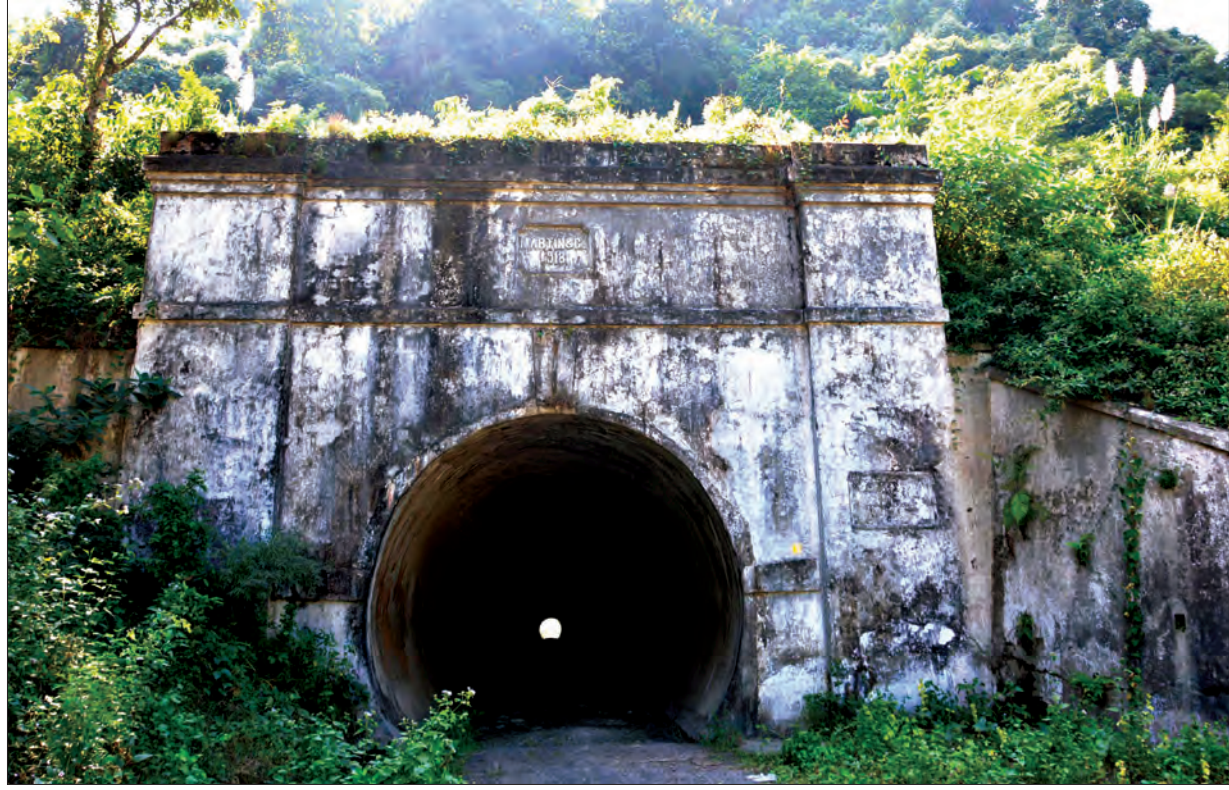
လိုဏ်ဂူကြီးကို တွေ့ရစဉ်

ယခုအခါ မောင်တော-ဘူးသီးတောင်ကားလမ်းတွင် တစ်နေ့လျှင် မော်တော် ကားအစီးရေ ၄၅၀ ကျော် ဖြတ်သန်းသွားလာနေပြီး ယာဉ်ကြောပိတ်ဆို့မှုများ မဖြစ်ရန်၊ ယာဉ်အန္တရာယ်ကင်းဝေးစေရန်နှင့် ယာဉ်ကြီးယာဉ်ငယ်များပါ အလွယ် တကူသွားလာနိုင်ရန်အတွက် လိုဏ်ဂူကြီးရှောင်ကွင်းလမ်းကို လမ်းဦးစီးဌာနက ၂၀၀၉-၂၀၁၀ ခုနှစ်တွင် စတင်ဖောက်လုပ်ခဲ့ပြီး ၂၀၁၃-၂၀၁၄ ခုနှစ်မှာ လိုဏ်ဂူကြီး