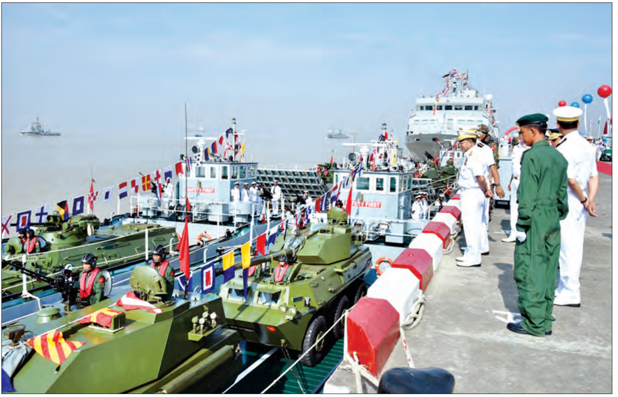
တပ်မတော်ကာကွယ်ရေးဦးစီးချုပ် ဗိုလ်ချုပ်မှူးကြီး မင်းအောင်လှိုင် တပ်တော်ဝင်စစ်ရေယာဉ်များကို ကြည့်ရှုစစ်ဆေးစဉ်

တပ်မတော်ကာကွယ်ရေးဦးစီးချုပ်နှင့် အဖွဲ့ဝင်များသည် တပ်တော်ဝင်စစ်ရေယာဉ်များအား ကြည့်ရှုစစ်ဆေးသည်။ တပ်မတော်ကာကွယ်ရေးဦးစီးချုပ် အရာခံအကြပ်၊ စစ်သည်များအား ဂုဏ်ပြုကြောင်း ပြောကြားသည်။ ယင်းနောက် တပ်မတော်ကာကွယ်ရေးဦးစီးချုပ်နှင့်အဖွဲ့သည် ရေတပ်