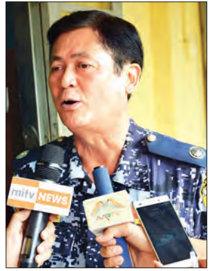
ရဲမှူးချုပ် သူရစန်းလွင်

ရခိုင်ပြည်နယ်အတွင်း ဖြစ်ပွားခဲ့သောဖြစ်စဉ်များနှင့်ပတ်သက်၍ ပြည်တွင်း ပြည်ပသတင်းမီဒီယာအဖွဲ့သည် မကြာမီရက်ပိုင်းက ရခိုင်ပြည်နယ် မောင်တောခရိုင်အတွင်း ကွင်းဆင်းသတင်းရယူခဲ့ကြပြီးဖြစ်သည်။ အဆိုပါခရီးစဉ်အတွင်း ပြည်တွင်းပြည်ပသတင်းမီဒီယာ အဖွဲ့မှ ဖြစ်စဉ်ဖြစ်ပွားစဉ်အတွင်းနှင့် ဖြစ်စဉ်ဖြစ်ပွားပြီးနောက်ပိုင်း အခြေအနေများကို မေးမြန်းသတင်းရယူရာတွင် ဒေသခံများနှင့် တာဝန်ရှိသူများ၏ ပြောကြားခဲ့သည့် စကားသံများကို ကောက်နုတ် စုစည်းဖော်ပြလိုက်ပါသည်။