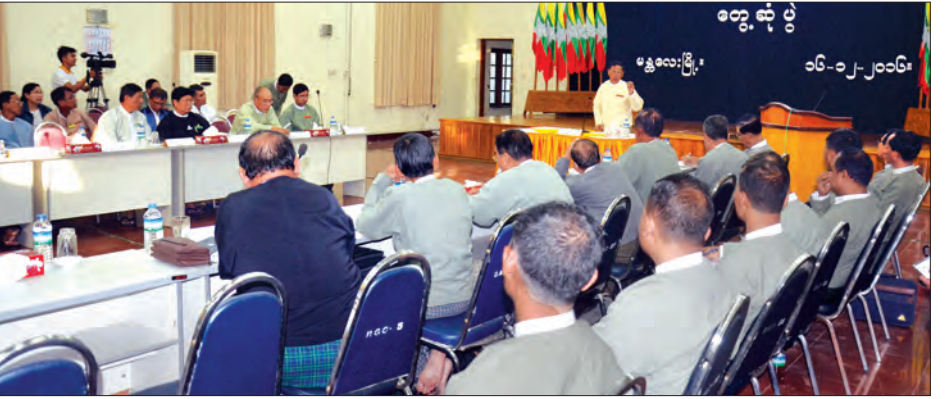
တင်ပြချက်များအပေါ် ပြည်ထောင်စုရွေးကောက်ပွဲကော်မရှင် ဥက္ကဋ္ဌနှင့် ကော်မရှင်အဖွဲ့ဝင်များမှ တွေ့ဆုံပွဲကို ရုပ်သိမ်းလိုက်သည်။

ပြည်ထောင်စုရွေးကောက်ပွဲကော်မရှင်ဥက္ကဋ္ဌ ဦးလှသိန်းသည် ယနေ့ မွန်းလွဲပိုင်းတွင် မန္တလေးတိုင်းဒေသကြီးအတွင်းရှိ ရွေးကောက်ပွဲကော်မရှင်အဖွဲ့ခွဲအဆင့်ဆင့်မှ တာဝန်ရှိသူများနှင့် တွေ့ဆုံသည်။ (ယာပုံ) ပြည်ထောင်စုရွေးကောက်ပွဲကော်မရှင်ဥက္ကဋ္ဌ ဦးလှသိန်းက ၂၀၁၅ ခုနှစ် ရွေးကောက်ပွဲသည် ပြည်သူလူထုနှင့် နိုင်ငံတော်က လက်ခံသော ရွေးကောက်ပွဲ တစ်ရပ်ဖြစ်ခဲ့သော်လည်း အနည်းနှင့်အများဆိုသကဲ့သို့ အားနည်းချက်များ၊ အခက်အခဲ များ ကြုံတွေ့ခဲ့ရမည်ဖြစ်ကြောင်း၊ မန္တလေးတိုင်းဒေသကြီးတွင် လစ်လပ်မဲဆန္ဒနယ်မရှိသည့်အတွက် ကြားဖြတ်ရွေးကောက်ပွဲကျင်းပပေးရန် မရှိသော်လည်း ၂၀၂၀ ပြည့်နှစ် အထွေထွေရွေးကောက်ပွဲအတွက် ကြိုတင်ပြင်ဆင်ဆောင်ရွက်ရန် လိုအပ်ကြောင်း၊ ၂၀၁၅ ခုနှစ် အထွေထွေရွေးကောက်ပွဲအတွေ့အကြုံများကို ပြန်လည်သုံးသပ်ပြီး လာမည့်ရွေးကောက်ပွဲများကို အများပြည်သူ ယုံကြည်လက်ခံသော ရွေးကောက်ပွဲအဖြစ် ကျင်းပပေးနိုင်ရန် အဖွဲ့ခွဲအဆင့်ဆင့်အနေနှင့် ပြင်ဆင်ဆောင်ရွက်ထားရမည် ဖြစ်ကြောင်း၊ အခက်အခဲများနှင့်ပတ်သက်ပြီး ကော်မရှင်အဖွဲ့ခွဲအဆင့်ဆင့်မှ ဆင့်ကဲဆင့်ကဲ တင်ပြချက်များအပေါ် ပြည်ထောင်စုရွေးကော်မရှင်အဖွဲ့အနေဖြင့် အချိန်နှင့်တစ်ပြေးညီ ဆောင်ရွက်ပေးသွားမည်ဖြစ်ကြောင်း၊ တာဝန်ရှိသူများအနေဖြင့်လည်း တင်ပြချက်ကိုသာ စောင့်ဆိုင်းမနေဘဲ လက်အောက်ကိုလည်း အမြဲကြီးကြပ်ဆောင်ရွက်ပေးရန်လိုကြောင်း၊ လုပ်ငန်းများဆောင်ရွက်ရာတွင် တီထွင်မှုရှိရန်နှင့် လေ့လွင့်မှုမရှိစေရန်လိုအပ်ကြောင်း ပြောကြားသည်။ ယင်းနောက် မန္တလေးတိုင်းဒေသကြီးအတွင်းရှိ ရွေးကောက်ပွဲကော်မရှင်အဖွဲ့ခွဲအဆင့်ဆင့်မှ တာဝန်ရှိသူများက ၂၀၁၅ အထွေထွေရွေးကောက်ပွဲတွင် ကြုံတွေ့ခဲ့ရသည့်အခက်အခဲများ၊ လတ်တလောရွေးကောက်ပွဲဆိုင်ရာကိစ္စရပ်များ ဆောင်ရွက်ရာတွင် ကြုံတွေ့ရသည့် အခက်အခဲများကို တင်ပြကြသည်။