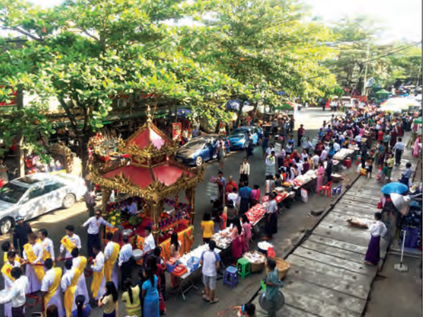
ရန်ကင်းမြို့၊ ဝဟန်းမြို့နယ် မဟာဗေယျအတုလမာရဇိန် ကြေးသွန်းဘုရားကြီး၏ (၁၀၂)ကြိမ်မြောက် ပုဒုမူနိယပွဲတော်ကို ဒီဇင်ဘာ ၁၄ ရက်မှ ၁၆ ရက် အထိ ကျင်းပလျက်ရှိရာ နတ်တော်လပြည့်နေ့ ညနေပိုင်းက သံဃာတော် ၁၆၈ ပါးအား ဆွမ်းဆန်စိမ်းလောင်းလှူပူဇော်ကြစဉ် မောင်ယဉ်ကျေး