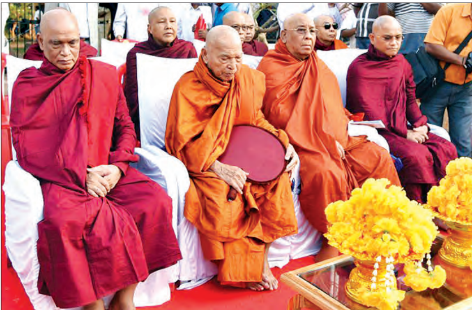
နေပြည်တော် ဒီဇင်ဘာ ၁၆

မြန်မာနိုင်ငံ၏နောက်ဆုံးမင်းဆက် သီပေါမင်းနတ်ပြည်စံသက် နှစ်တစ်ရာပြည့် အလှူအခမ်းအနားကို ယနေ့နံနက်ပိုင်းတွင် အိန္ဒိယ သမ္မတနိုင်ငံ ရတနာဂီရိမြို့ရှိ သီပေါမင်းတရားကြီး အုတ်နန်းပြာသာဒ်ဆောင်၌ ကျင်းပသည်။