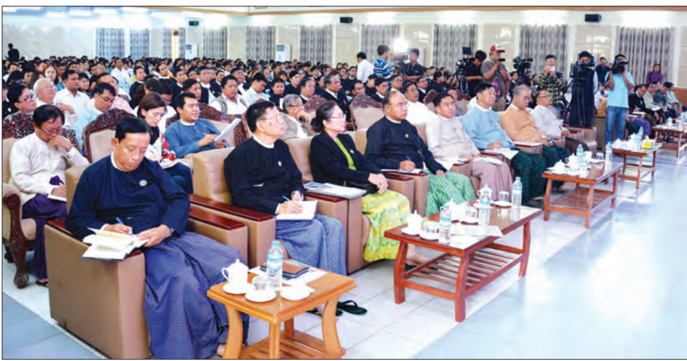
ဆက်လက်၍ ကော်မရှင်ဥက္ကဋ္ဌ သူရဦးရွှေမန်းနှင့် ကော်မရှင်အဖွဲ့ဝင်များသည် မန္တလေးမြို့၊ ချမ်းအေးသာစင် မြို့နယ်တရားရုံးသို့ သွားရောက်လေ့လာကြပြီး ထိုမှတစ်ဆင့် ချမ်းမြေသာစည်မြို့နယ်ရှိ တရားဥပဒေစိုးမိုးရေးစင်တာ သို့ သွားရောက်လေ့လာကြသည်။

နေပြည်တော် ဒီဇင်ဘာ ၁၆ နိုင်ငံအတွင်းတရားဥပဒေစိုးမိုးရေး ပိုမို အားကောင်း ခိုင်မာစေရန် ဥပဒေပြုရေး၊ အုပ်ချုပ်ရေးနှင့် တရားစီရင်ရေး မဏ္ဍိုင်သုံးရပ်တွင် ပြည်သူ့လူထုတစ်ရပ်လုံး ပူးပေါင်းပါဝင်ရေးအတွက် တရားဥပဒေ စိုးမိုးရေးဆိုင်ရာ ဆွေးနွေးပွဲကို ယနေ့ နံနက်ပိုင်းတွင် မန္တလေးမြို့၊ မြို့တော်ခန်းမ ၌ ကျင်းပသည်။ ဆွေးနွေးပွဲတွင် ပြည်ထောင်စုလွှတ်တော်၊ ဥပဒေရေးရာနှင့် အထူးကိစ္စရပ်များ လေ့လာဆန်းစစ်သုံးသပ်ရေးကော်မရှင်ဥက္ကဋ္ဌ သူရဦးရွှေမန်းက နိုင်ငံအတွင်း တရားဥပဒေစိုးမိုးရေးရှိမှုသာ ရပ်ရွာအေးချမ်းသာယာပြီး နိုင်ငံတည်ငြိမ်မည် ဖြစ်ကြောင်း၊ တရားဥပဒေစိုးမိုးရေး ဆောင်ရွက်နိုင်မှသာ နိုင်ငံဖွံ့ဖြိုးတိုးတက်အောင် ဆောင်ရွက်နိုင်မည်ဖြစ်ကြောင်း ပြောကြားသည်။ ဆက်လက်၍ မန္တလေးတိုင်းဒေသကြီး တရားလွှတ်တော် တရားသူကြီးချုပ် ဦးစိုးသိန်း၊ တရားဥပဒေ စိုးမိုးရေးစင်တာမှ တာဝန်ရှိသူများနှင့် အရပ်ဘက်အဖွဲ့အစည်းများမှ တာဝန်ရှိသူများက တရားရုံးဆိုင်ရာကိစ္စရပ်များ၊ အဖွဲ့အစည်းအလိုက် ဆောင်ရွက်ချက်များနှင့် အားနည်းချက်၊ အားသာချက်များကို ရင်းလင်းဆွေးနွေးကြသည်။