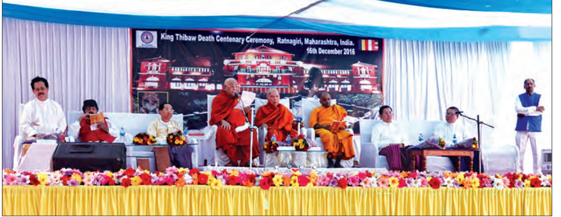
သီတဂူဆရာတော်ကြီးက ဂိုအာပြည်နယ်ရှိ ဗုဒ္ဓဘာသာဝင်များ တွေ့ဆုံပွဲ တက်ရောက်လာသူများအား ဩဝါဒစကား မြွက်ကြားစဉ်

အိန္ဒိယသမ္မတနိုင်ငံ ရတနာဂီရိမြို့ရှိ သီပေါမင်းတရားကြီး အုတ်နန်းပြာသာဒ်ဆောင်၌ ကျင်းပသည့် သီပေါမင်းနတ်ရွာစံသက် နှစ် ၁၀၀ ပြည့် အလှူအခမ်းအနား တက်ရောက်ခဲ့သည့် နိုင်ငံတော်သံယမဟာနာယကအဖွဲ့ ဥက္ကဋ္ဌဆရာတော် အဘိဓဇမဟာရဋ္ဌဂုရု၊ အဘိဓဇအဂ္ဂမဟာသဗ္ဗမ္မဇောတိက ဒေါက်တာဘဒ္ဒန္တကုမာရာဘိဝံသ၊ သီတဂူဆရာတော် ဒေါက်တာ ဘဒ္ဒန္တဉာဏိသရအမျိုးမျိုး၊ သံဃာတော်များနှင့် ဒုတိယသမ္မတ ဦးမြင့်ဆွေ၊ တပ်မတော်ကာကွယ်ရေးဦးစီးချုပ် ဝိုလ်ချုပ်မှူးကြီး မင်းအောင်လှိုင်နှင့် အဖွဲ့ဝင်များသည် Thibaw Point ၌ ယနေ့ ဒေသစံတော်ချိန် ညနေ ၃ နာရီတွင် ဂိုအာပြည်နယ်ရှိ ဗုဒ္ဓဘာသာဝင်များနှင့် တွေ့ဆုံဆွေးနွေးသည်။ ရှေးဦးစွာ တွေ့ဆုံပွဲတက်ရောက်လာကြသူများသည် နိုင်ငံတော်သံယမဟာနာယကအဖွဲ့ ဥက္ကဋ္ဌ ဆရာတော်ကြီးထံမှ တရားနာယူကြပြီး သီတဂူဆရာတော်ကြီးက ဩဝါဒစကားပြောကြားသည်။ ဆက်လက်၍ အိန္ဒိယဗုဒ္ဓဘာသာအစည်းအရုံးကိုယ်စားလှယ် Mr.C.Ruthna Swamy က ဒေသခံ ဗုဒ္ဓဘာသာဝင်များကိုယ်စား မိတ်ဆက်စကားပြောကြားပြီး အိန္ဒိယဆရာတော် Bthale Sumedho က ကျေးဇူးတင်စကား ပြန်လည်ပြောကြားသည်။ ထို့နောက် နိုင်ငံတော်ဒုတိယသမ္မတ ဦးမြင့်ဆွေနှင့် အိန္ဒိယသမ္မတနိုင်ငံဆိုင်ရာ မြန်မာနိုင်ငံသံအမတ်ကြီး ဦးမောင်ဝေတို့က ကျေးဇူးတင်စကားများ ပြန်လည်ပြောကြားခဲ့ကြောင်း သတင်းရရှိသည်။ (သတင်းစဉ်)