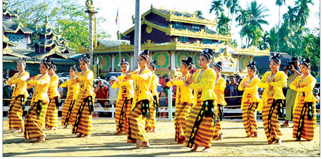
ရခိုင်ပြည်နယ်နေ့ အထိမ်းအမှတ်နေ့တွင် ပြည်နယ်ယဉ်ကျေးမှုအဖွဲ့ ကပြဖျော်ဖြေစဉ်