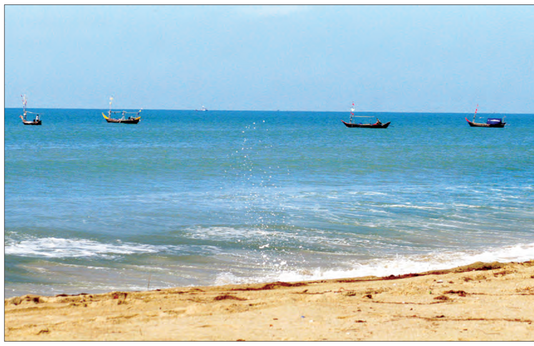
မောင်းမကန်ကမ်းခြေ သဘာဝအလှမြင်ကွင်းကို တွေ့ရစဉ်

သတင်း- ဝေယံဦး ထားဝယ် ဒီဇင်ဘာ ၁၆ ပွင့်လင်းရာသီတွင် ခရီးသွားဧည့်သည် များလာရောက်လျက်ရှိသည့် ထားဝယ် ခရိုင် မောင်းမကန်ကမ်းခြေမှ အနီးဝန်း ကျင်ကျွန်းများသို့ စက်တပ်ရေယာဉ်ငယ် များဖြင့် သွားရောက်လည်ပတ်နိုင်ရန် ပို့ဆောင်ပေးရေး စတင်တော့မည်ဖြစ်ကြောင်း သိရသည်။ “အရင်က မရှိခဲ့ပါဘူး။ အခုတော့ မောင်းမကန်ကမ်းခြေကို လာရောက် အပန်းဖြေတဲ့ ဧည့်သည်တွေအတွက် ဝန်ဆောင်မှုအသစ်တစ်ခုအဖြစ် စက်တပ် ရေယာဉ်ငယ်တွေနဲ့ အနီးဝန်းကျင်ကျွန်း တွေနဲ့ သွားလိုရင်တုံ့နေရာတွေကို လိုက်လံပြသပို့ဆောင်ပေးသွားဖို့ စီစဉ် နေတာဖြစ်ပါတယ်” ဟု ရေယာဉ်ငယ် ဖြင့် ပို့ဆောင်ပေးမည့် အစီအစဉ်ကို စာမျက်နှာ ၅ ကော်လံ ၅ ❖