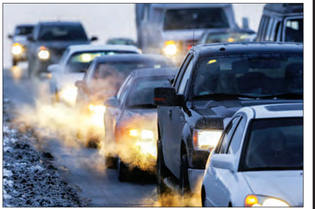
ဒီနည်းလမ်းပေါ်လာတာဟာ သက်ကြီးရွယ်အိုတွေအတွက် အထူးဝမ်းသာစရာ သတင်းအဖြစ် ဖော်ပြလိုက်ရပါတယ်။

အခုဖော်ပြမယ့် သတင်းကတော့ သက်ကြီးရွယ်အိုတွေအတွက် ဝမ်းသာစရာ သတင်းပါ။ သက်ကြီးရွယ်အိုတွေဟာ အိမ်ထဲမှာဖြစ်စေ၊ ရေချိုးခန်းမှာ ဖြစ်စေ၊ လမ်းသွားတဲ့အခါဖြစ်စေ မတော်တဆ ချော်လဲကျတတ်ကြပါတယ်။ ဒီလိုချော်လဲတဲ့အခါ တင်ပို့ဆွဲကုသတာတို့ ပေါင်ကျိုးတာတို့ ဖြစ်တတ်ကြပါတယ်။ အခုတော့ အဲဒီလိုဖြစ်တာ ကာကွယ်နိုင်ဖို့ ခါးပတ်တစ်ခုကို တီထွင်လိုက်ကြပါပြီ။ ဒီလိုတီထွင်ခဲ့တဲ့သူတွေကတော့ အင်္ဂလန်နိုင်ငံက ဒပ်ချပ်လူမျိုး သိပ္ပံပညာရှင်တွေဖြစ်ပါတယ်။ ကားတိုက်တဲ့အခါ ကားမှာ လေအိတ်ထွက်လာတဲ့ ပုံစံမျိုးဖြစ်ပါတယ်။ လဲကျတာနဲ့ လေအိတ်ထွက်လာပြီး အရိုးကိုထိခိုက်ခြင်းက ကာကွယ်မှာဖြစ်ပါတယ်။ ဒါဟာ ဈေးအားဖြင့် USD 450 ခန့်သာ ရှိတယ်လို့ ဆိုပါတယ်။ ဒါဟာ အရိုးကျိုးလို့ ဝေဒနာခံစားရခြင်း၊ ဆေးကုသစရိတ်တို့နှင့်စာရင် ဘာမှမပြောပလောက်ပါဘူး။