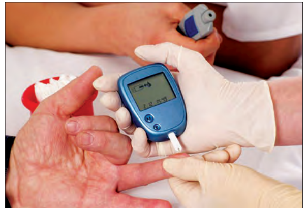
ဇီကာရောဂါသည် အမျိုးသားများမျိုးမအောင်သည့်ရောဂါဖြစ်ပွားနိုင်

Mexico နိုင်ငံမှာ ၁၉၈၀ ပြည့်နှစ်လောက်က လူပေါင်း ၁၄၆ ၂၆ ဟာ ဆီးချိုရောဂါကြောင့် သေဆုံးခဲ့ပါတယ်။ ဒါပြီး ယခုနှစ်ပေါင်း ၃၅ နှစ်အကြာမှာ ဆီးချိုကြောင့် အသက်ဆုံးရှုံးရသူ ၇ သန်းကျော်ရှိတယ်။ ဒါဟာ Mexico တစ်နိုင်ငံလုံး လူဦးရေနဲ့ ၉ ရာခိုင်နှုန်းရှိတယ်လို့ ဆိုပါတယ်။ ဒါကြောင့် နိုင်ငံအစိုးရဟာ အဝလွန်မှုလျှော့ချပြီး ဆီးချိုရောဂါသံသယရှိသူတိုင်းကို ဆီးချိုစမ်းသပ်ခြင်း၊ ဆေးကုသပေးမှုဆောင်ရွက်ခြင်း ပြုလုပ်ပေးနေကြောင်း တင်ပြလိုက်ရပါတယ်။