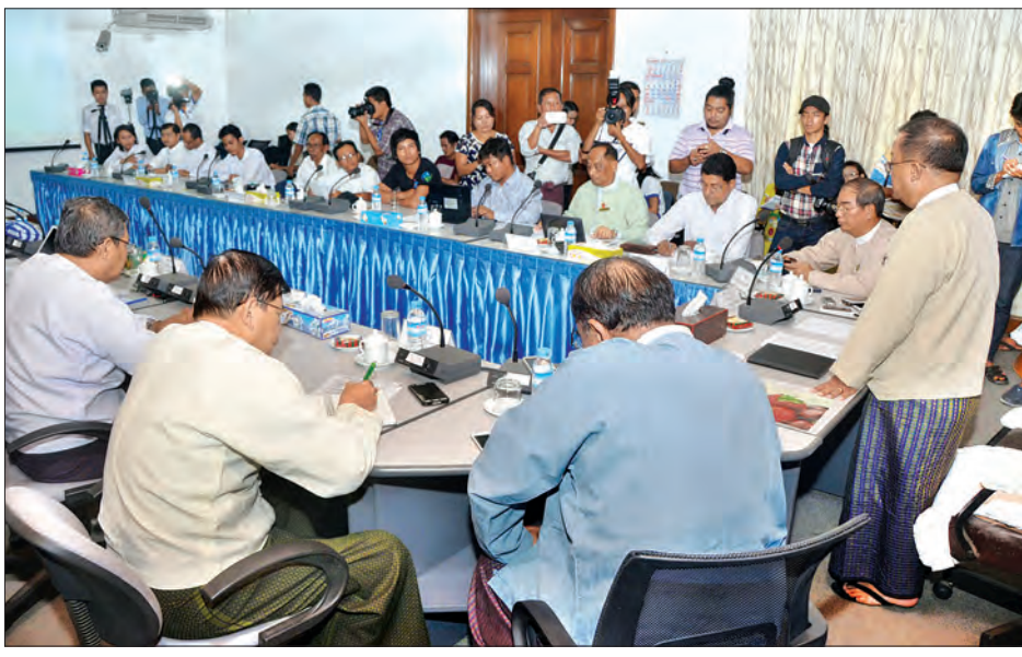
ရန်ကုန်၊ သင်္ဘောသားအဖွဲ့အစည်းလေးဖွဲ့မှ သင်္ဘောသားများက တီတိကျကျ အရေးယူဆောင်ရွက်ပေးရေးကို များအပါအဝင် အချက်ရစ်ချက်နှင့် ပတ်သက်၍ အသေးစိတ်တင်ပြဆွေးနွေးခဲ့ကြောင်း သိရသည်။ ရေကြောင်းပို့ဆောင်ရေးညွှန်ကြားမှုဦးစီးဌာနအနေဖြင့် အဆိုပါတွေ့ဆုံပွဲမှာညှိနှိုင်းဆွေးနွေးမှုများအပေါ် အထက်အဆင့်ဆင့်သို့တင်ပြကာ တောင်းဆိုချက်များနှင့်ပတ်သက်၍ ညှိနှိုင်းပေါင်းစပ်မှုများပြုလုပ်သွားမည်ဖြစ်ကြောင်း သိရသည်။ သတင်း-မြင့်မောင်စိုး

လာတဲ့ အချက်ရစ်ချက်ကို တောင်းဆိုခဲ့ပေမယ့် အချို့အချက်တွေဟာ ရှင်းရှင်းလင်းလင်းမသိရသေးတဲ့အတွက် ဒီကနေ့တွေ့ဆုံပွဲကို ပြုလုပ်ရခြင်းဖြစ်ပါတယ်။ နောင်မှာလည်း လမ်းပေါ်ထွက်ဆန္ဒပြတဲ့အဆင့် ရောက်စရာမလိုတော့ပါဘူး။ ကျွန်တော်တို့ဌာနကို အချိန်မရွေး ဆက်သွယ်ဆောင်ရွက်ပြီး ဖြေရှင်းဆောင်ရွက်ပေးသွားမှာဖြစ်ပါတယ်။ ကျွန်တော်တို့ မဖြေရှင်းနိုင်တဲ့အချက်တွေကိုလည်း အထက်အဆင့်ဆင့်တင်ပြပြီး ပွင့်ပွင့်လင်းလင်းဆောင်ရွက်ပေးသွားမှာ ဖြစ်ပါတယ်။ သင်္ဘောသားနှင့်ရေကြောင်းဦးစီးဌာနဆိုတာ တစ်လုံးတစ်စည်းတည်း သားများ ဘဝတိုးတက်ရေးအတွက် ပူးပေါင်းဆောင်ရွက်သွားမှာဖြစ်ပါတယ်” ဟု ရေကြောင်းပို့ဆောင်ရေးညွှန်ကြားမှုဦးစီးဌာန ညွှန်ကြားရေးမှူးချုပ်