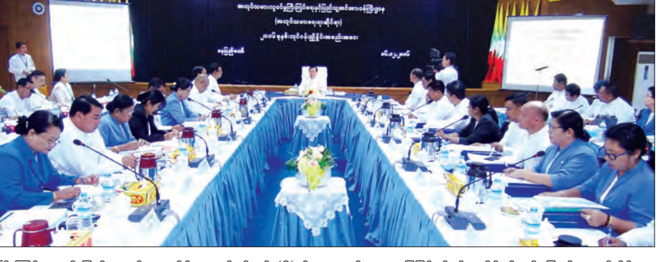
ကြီးကြပ်ရေးနှင့် ပြည်သူ့အင်အားဆိုင်ရာ လုပ်ငန်းစဉ် (၆) မျိုးတို့ကို သတ်မှတ်ဆောင်ရွက်ခဲ့ကြောင်း၊ လက်ရှိအနေအထားအရ ပွင့်လင်းမြင်သာစွာ ဆောင်ရွက်ရန်၊ ပြည်သူ့ကိုပဟိုပြုရန်၊ ဥပဒေနှင့်အညီ ဆောင်ရွက်ရန် ဆက်ဆံရေးပြေပြစ်ရန်နှင့် အချိန်နှင့်တစ်ပြေးညီ သတင်းမီဒီယာများမှတစ်ဆင့် ပြည်သူ့သိရှိအောင် ဆောင်ရွက်နိုင်ရေးသည်လည်း အရေးကြီးပါကြောင်း၊ ဌာနတစ်ခု အောင်မြင်စေရေး ဆောင်ရွက်ရာတွင် အထက်အောက် ဘေးဘယ်ညာဆက်ဆံရေးပြေပြစ်ရန်

အလုပ်သမား၊ လူဝင်မှုကြီးကြပ်ရေးနှင့် ပြည်သူ့အင်အားဝန်ကြီးဌာန (အလုပ်သမားရေးရာ) ဆိုင်ရာ ၂၀၁၆ ခုနှစ် လုပ်ငန်းဆောင်ရွက်မှုနှင့် ရှေ့လုပ်ငန်းစဉ်များ အကောင်အထည်ဖော်ရေး လုပ်ငန်းညှိနှိုင်းအစည်းအဝေးကို ယနေ့ နံနက် ၈ နာရီခွဲတွင် နေပြည်တော်ရှိ အဆိုပါဝန်ကြီးဌာန အစည်းအဝေးခန်းမ၌ ကျင်းပသည်။ (ယာပုံ) အစည်းအဝေးတွင် ပြည်ထောင်စုဝန်ကြီး ဦးသိန်းဆွေက မိမိတို့ဝန်ကြီးဌာနမှ ပြည်သူ့အတွက် ပထမ ရက် ၁၀၀ အတွင်း အကောင်အထည်ဖော်ဆောင်ရွက်ခဲ့ရာတွင် ပြည်သူ့အကျိုးပြု လုပ်ငန်းများကို အဓိကထားဦးစားပေးပြီး ပြည်သူတို့ အမှန်တကယ်လိုလားတောင်းတသည့် ပြည်သူ့အတွက် အမှန်တကယ် အကျိုးဖြစ်ထွန်းစေမည့် လုပ်ငန်းစဉ် ၁၃ မျိုးကို ရွေးချယ်ဆောင်ရွက်ပေးခဲ့ပါကြောင်း၊ အဆိုပါ လုပ်ငန်းစဉ်များထဲမှ အလုပ်သမားရေးရာနှင့်ဆိုင်သော လုပ်ငန်း စဉ် (၇) မျိုး၊ လူဝင်မှု