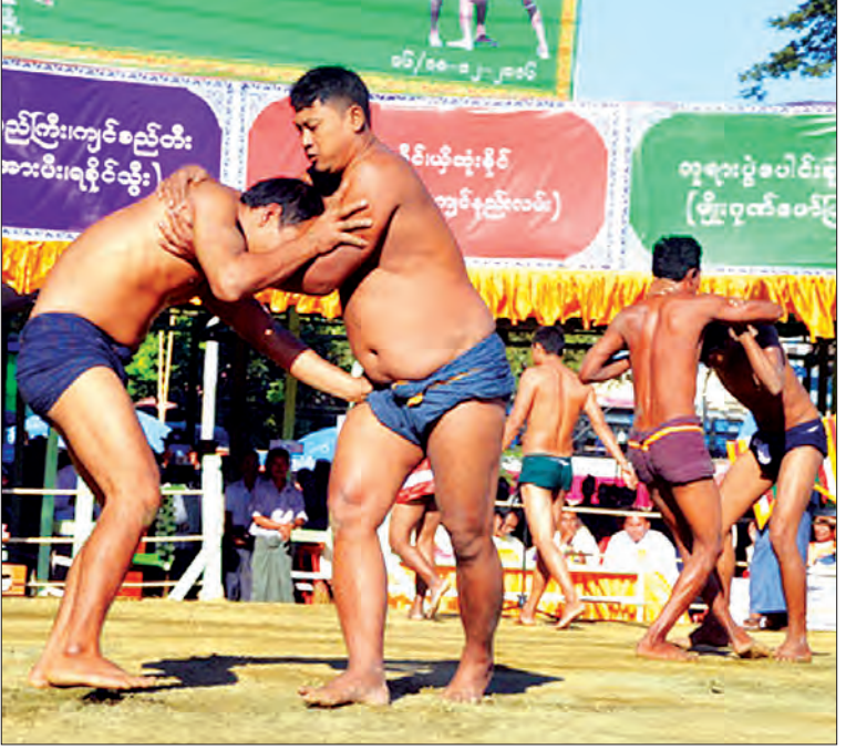
ရခိုင်ရိုးရာ ကျင်ကိုင်ပွဲတွင် ကျင်သန်ကြီးများက သရုပ်ပြသစဉ်