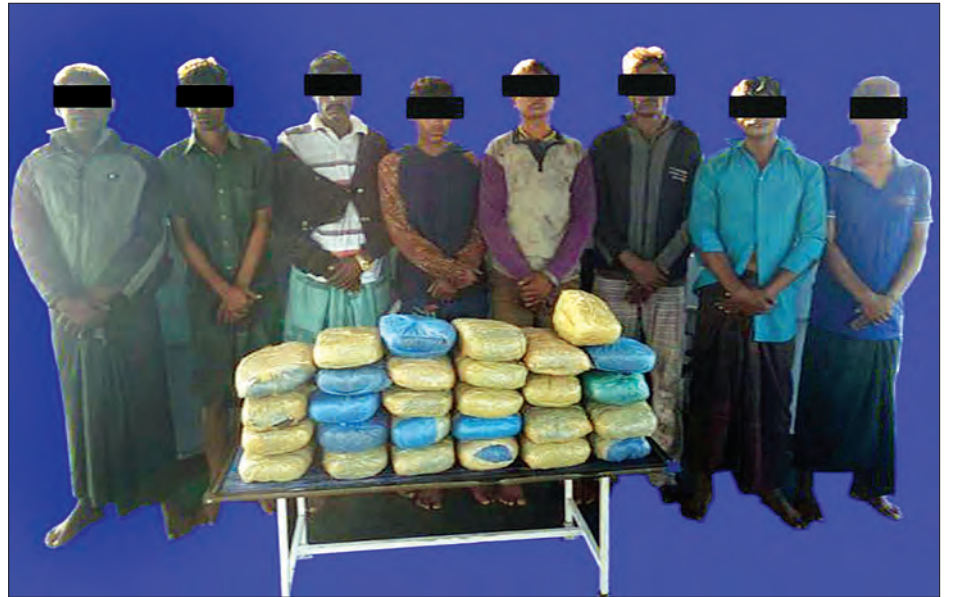
မသင်္ကာသူရှစ်ဦးနှင့်အတူ ဆေးခြောက်များအား တွေ့ရစဉ်