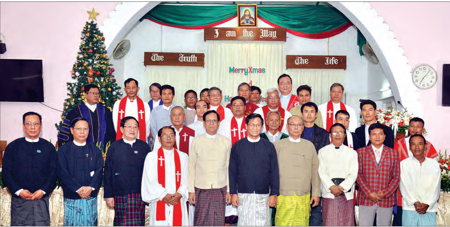
ဒုတိယသမ္မတ ဦးဟင်နရီပန်ထီးယူ အခမ်းအနားသို့ တက်ရောက်လာကြသူများနှင့် မှတ်တမ်းတင်ဓာတ်ပုံရိုက်စဉ် (သတင်းစဉ်)

နေပြည်တော် ဒီဇင်ဘာ ၁၆ ပြည်ထောင်စုသမ္မတမြန်မာနိုင်ငံတော် ဒုတိယသမ္မတ ဦးဟင်နရီပန်ထီးယူသည် ယနေ့ညနေ ၆ နာရီတွင် နေပြည်တော် ခရစ်ယာန်အသင်းတော်များကောင်စီက ကြီးပွားကျင်းပသည့် ခရစ်တော်မွေးနေ့ အကြိုဝတ်ပြုဆုတောင်းခြင်းနှင့် မိတ်သဟာယ ညစာစားပွဲ အခမ်းအနားသို့ တက်ရောက်သည်။ အဆိုပါ ခရစ်တော်မွေးနေ့အကြို ဝတ်ပြုဆုတောင်းခြင်းနှင့် မိတ်သဟာယ ညစာစားပွဲအခမ်းအနားကို ပျဉ်းမနားမြို့၊ ရွှေချီရပ်ရှိ မြန်မာ့နှစ်ခြင်းခရစ်ယာန် အသင်းတော်၌ ကျင်းပရာ အမျိုးသား လွှတ်တော်ဥက္ကဋ္ဌ မန်းဝင်းနိုင်သန်း၊ ပြည်သူ့လွှတ်တော် ဒုတိယဥက္ကဋ္ဌ ဦးတီ ခွန်မြတ်၊ အမျိုးသားလွှတ်တော် ဒုတိယ ဥက္ကဋ္ဌဦးအေးသာအောင်၊ သာသနာရေး နှင့် ယဉ်ကျေးမှုဝန်ကြီးဌာန ပြည်ထောင်စုဝန်ကြီး သူရဦးအောင်ကို၊ နေပြည်တော်ခရစ်ယာန်အသင်းတော် များမှ သင်းအုပ်ဆရာတော်များနှင့် အသင်းသူ အသင်းသားများ၊ ဖိတ်ကြား စာမျက်နှာ ၅ ကော်လံ ၅