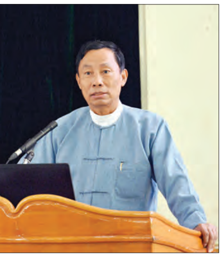
ဆွေးနွေးပွဲသို့ ပြည်ထောင်စုလွှတ်တော်၊ ဥပဒေရေးရာနှင့် အထူးကိစ္စရပ်များ လေ့လာဆန်းစစ်သုံးသပ်ရေးကော်မရှင်ဥက္ကဋ္ဌ သူရဦးရွှေမန်း၊ ဒုတိယဥက္ကဋ္ဌ ဒေါက်တာသန်းဝင်း၊ ဒေါက်တာအောင်ခင်နှင့် ကော်မရှင်အဖွဲ့ဝင်များ၊ မန္တလေးတိုင်းဒေသကြီး တရားလွှတ်တော် တရားသူကြီးချုပ် ဦးစိုးသိန်း၊ ဥပဒေ ဆိုင်ရာ ကျွမ်းကျင်ပညာရှင်များ၊ ဥပဒေ ကျောင်းသား ကျောင်းသူများ၊ လူမှုရေး အဖွဲ့အစည်းများမှ တာဝန်ရှိသူများ တက်ရောက်ကြသည်။ (သတင်းစဉ်)လ