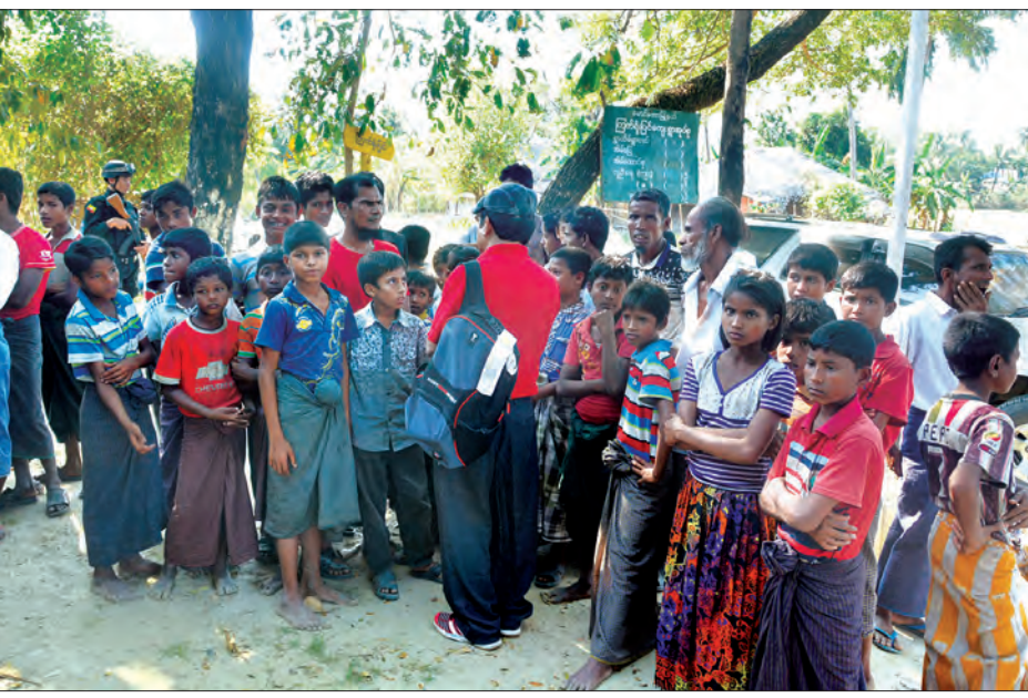
စုံစမ်းစစ်ဆေးရေးအဖွဲ့မှ ကြက်ရိုးပြင်ရွာရှိ ပြည်သူများအား တွေ့ဆုံစဉ်

မီးရှို့တယ်။ လူ ၁၀၀ ကျော်အသတ်ခံရတယ်။ အမျိုးသမီးတွေရော မုဒိမ်းကျင့်ခံရတယ်ဆိုပြီးတော့ ရေးထားတယ်။ အဲဒီရွာကို သွားရောက်ပြီး ဒေသခံတွေနဲ့ တွေ့ဆုံမေးမြန်းမှုတွေလုပ်ခဲ့တော့ သာမန်အားဖြင့်ဆိုရင် သူတို့က အစိုးရနဲ့ အစိုးရအဖွဲ့တွေနဲ့ ပတ်သက်ရင် ရှောင်နေတာကြာတယ်လို့ သိရတယ်။ ဒီနေ့မနက်တော့ တော်တော်များများပဲ တွေ့ခဲ့ရတယ်။ ကောင်းကောင်းမွန်မွန်ပဲ စကားပြောလိုရပါတယ်။ ပြည်ပသတင်း မီဒီယာတွေရေးတာ ယုတ္တိ ရှိ မရှိဆိုတာ သိရအောင် ဒီက