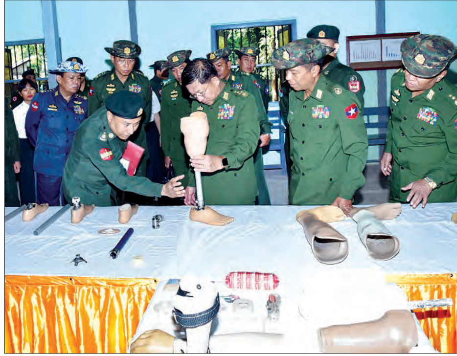
တပ်မတော်ကာကွယ်ရေးဦးစီးချုပ် ဝိုင်းချုပ်မှူးကြီး မင်းအောင်လှိုင် အလုပ်ရုံအတွင်းရှိ ခြေတုလက်တုများကို ကြည့်ရှုစဉ်

ယင်းနောက် တပ်မတော်ကာကွယ် ရေးဦးစီးချုပ်နှင့် အဖွဲ့သည် မင်္ဂလာဒုံ တပ်နယ်ရှိ တပ်မတော်အရုံးအထူးကု ဆေးရုံ၌ ဆေးရုံတက်ရောက်ကုသလျက် ရှိသော ရှေ့တန်းစစ်ဆင်ရေးတာဝန် ထမ်းဆောင်စဉ် ထိခိုက်ဒဏ်ရာရရှိခဲ့သည့် အရာရှိ၊ စစ်သည်များ၏ တစ်ဦးချင်း ထိခိုက်ဒဏ်ရာရရှိမှုနှင့် ဆေးဝါးကုသမှု