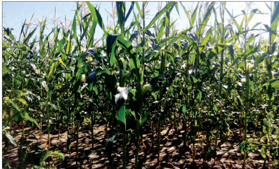
ပွင့်ဖြူမြို့နယ်အတွင်းရှိ ပဲပြောင်းစိုက်ခင်းကိုတွေ့ရစဉ်

ပြောင်းဖူးမျိုးများကို အစားထိုးစိုက်ပျိုးမှု ပိုမိုများပြားလာကြောင်း သိရသည်။ ရွှေတောင်မြို့နယ်အတွင်း မြေနုကွန်းများတွင် စိုက်ပျိုးလေ့ ရှိသည့် ဆောင်းရာသီသီးနှံတစ်မျိုးဖြစ်သော ပြောင်းဖူးများတွင်