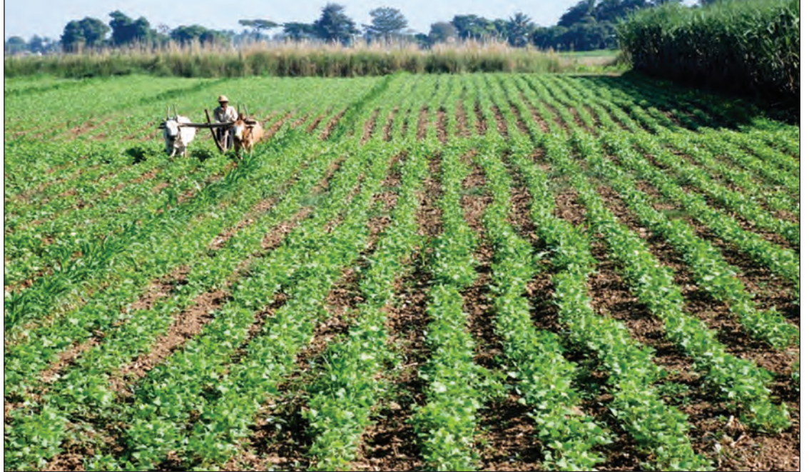
ရိုသည့်။ စပါးအပြင် အခြားသီးနှံများမှာလည်း ဈေးကောင်းရရှိရန်အတွက် ပြည်ပဈေးကွက်ရရှိနိုင်မှုအပေါ်တွင် တည်မှီနေခြင်းဖြစ်ရာ တောင်သူများအနေဖြင့် သီးနှံရွေးချယ်စိုက်ပျိုးရာတွင် ဈေးကောင်းရနိုင်မည့် သီးနှံအမျိုးအစားကို လိုက်လျောညီထွေ ရွေးချယ်စိုက်ပျိုးနိုင်ရန်အတွက် အမြဲလေ့လာဆန်းစစ်ရန် လိုအပ်လျက်ရှိကြောင်းလည်း သိရသည်။

ဖြစ်ကြောင်းလည်း အဆိုပါတောင်သူကပင် ဆက်၍ ပြောကြားသည်။ ကျေးလက်ဒေသများမှ တောင်သူများ၏ လယ်ယာမြေများမှ စိုက်ပျိုးထွက်ရှိသည့် စိုက်ပျိုးရေး ထွက်ကုန်သီးနှံများမှာ ဈေးနှုန်းကျဆင်းနေသော်လည်း လက်ရှိဈေးကွက်မှ ပြန်လည်ဝယ်ယူသုံးစွဲနေကြရသည့် ကုန်ပစ္စည်းများမှာ ဈေးနှုန်းမြင့်မားလျက်ရှိနေခြင်းကြောင့် ဝင်ငွေနှင့်ထွက်ငွေ အချိုးအစားကွာခြားကာ စီးပွားရေးအရ အခက်အခဲများစွာ ကြုံတွေ့နေကြရကြောင်း တောင်သူများက ဆိုသည်။ “အဓိကအားဖြင့် ကျေးလက်နေသူတွေမှာက အကုန်အကျအလွန်များပါတယ်။ ကျောင်းသားစရိတ်၊ ကျန်းမာရေးကဏ္ဍတွေမှာ ကုန်ကျတဲ့အပြင် လူမှုရေးကုန်ကျငွေကလည်း တစ်နှစ်တစ်နှစ်ကို မနည်းပါဘူး” ဟု ကျေးလက်ဒေသနေ တောင်သူတစ်ဦးက ပြောကြားသည်။ လက်ရှိအချိန်တွင် ဈေးကွက်အတွင်း၌ စပါးဈေးနှုန်းများ ကျဆင်းလျက်ရှိရာ ပြည်ပနိုင်ငံအသီးသီး၌ ဆန်စားသုံးမှုလျော့ကျလာသည့်အပြင် စားသုံးမှုပမာဏနှင့် ထုတ်လုပ်မှုအချိုးအစား ကွာခြားခြင်းကြောင့် ပြည်ပဝယ်လိုအား ကျလာ၍ ဖြစ်ကြောင်း၊ လက်ရှိစပါးဈေးနှုန်းအခြေအနေအရ ယခုနှစ်တွင် အမြင့်ဆုံးဈေးနှုန်းမှာ စပါးတင်း တစ်ရာလျှင် ကျပ်လေးသိန်းခွဲထက် မပိုနိုင်ကြောင်း လည်း ကျွမ်းကျင်သူအချို့သုံးသပ်ပြောကြားလျက်