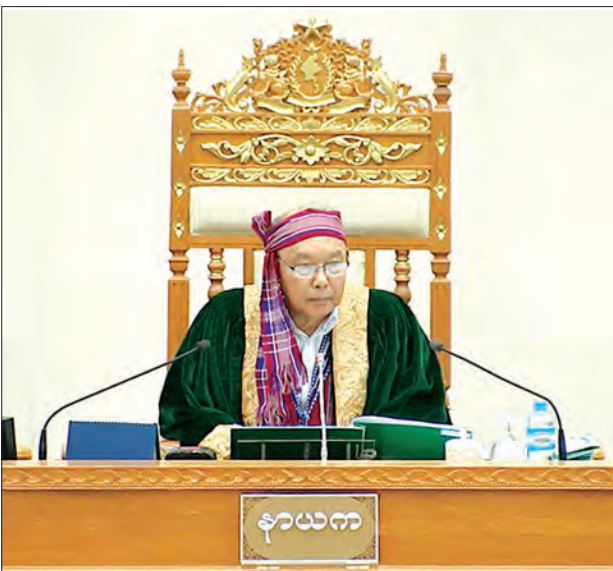
ပြည်ထောင်စုလွှတ်တော်နာယက မန်းဝင်းခိုင်သန်း

လျှော့ချရန်၊ လူမှုဝန်ထမ်း၊ ကယ်ဆယ်ရေး နှင့် ပြန်လည်နေရာချထားရေးဝန်ကြီး ဌာန၏ ငွေကျပ် ၅၂၀ ဒသမ ၇၆၀ သန်းမှ ငွေကျပ် ၁၉ ဒသမ ၉၂၉ သန်း၊ လျှော့ချရန်၊ ပို့ဆောင်ရေးနှင့် ဆက်သွယ်ရေး ဝန်ကြီးဌာန၏ ငွေကျပ် ၂၁၂၈ ဒသမ ၇၆၀ သန်းမှ ငွေကျပ် ၅၆၀ ဒသမ ၉၂၁ သန်း၊ လျှော့ချရန်၊ နေပြည်တော် စည်ပင်သာယာရေးကော်မတီ၏ ငွေကျပ် ၄၆၉၀ ဒသမ ၈၆၆ သန်းမှ ငွေကျပ် ၁၅၉၄ ဒသမ ၈၄၄ သန်း၊ လျှော့ချရန်၊ မြန်မာနိုင်ငံတော်ဗဟိုဘဏ်၏ ငွေကျပ် ၁၃၀၂၅၄ ဒသမ ၆၄၈ သန်းမှ ငွေကျပ် ၅၄၆၆၈ ဒသမ ၉၁၀ သန်း၊ လျှော့ချရန် ပြည်သူ့ဝန်ထမ်းပေးပေးရေး ဝန်ကြီးဌာန၏ အဆိုပြုချက်အတိုင်း လွှတ်တော်က အတည်ပြုခြင်းဖြစ်သည်။