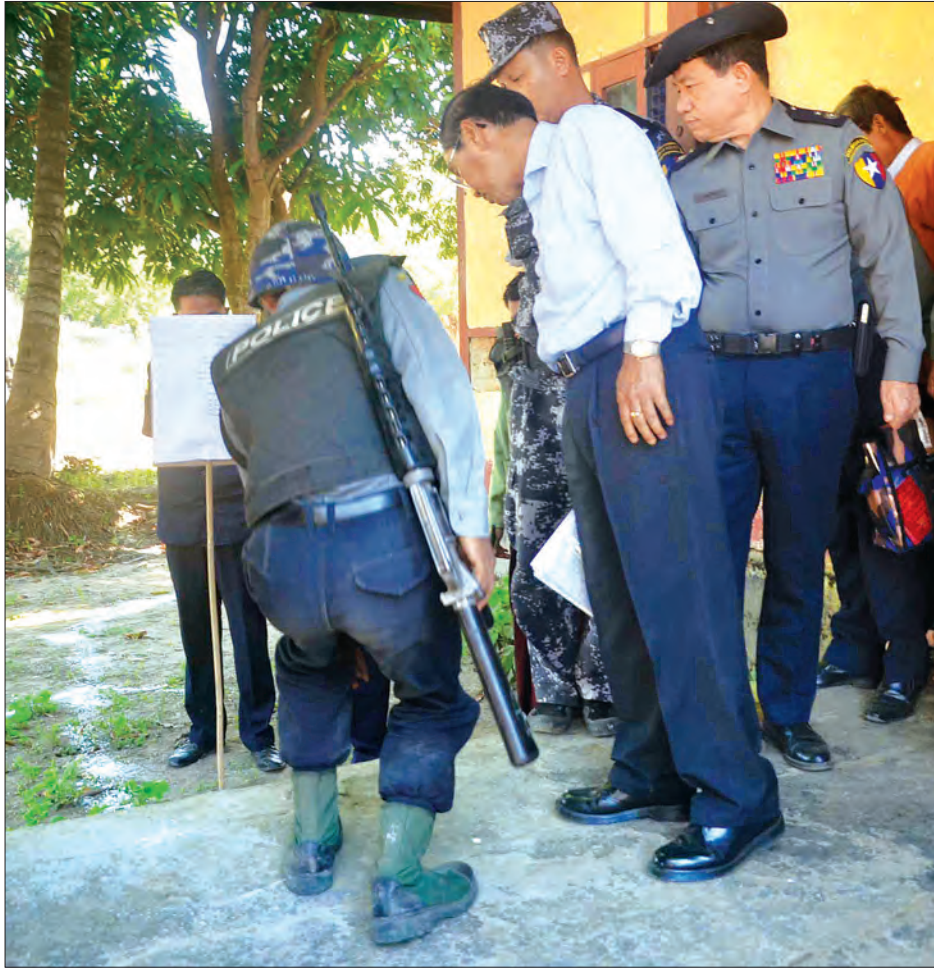
ရခိုင်ပြည်နယ် စုံစမ်းစစ်ဆေးရေးကော်မရှင်ဥက္ကဋ္ဌနှင့် အဖွဲ့ဝင်များအား ကိုးတန်ကောက်စခန်း တိုက်ခိုက်ခံရမှုဖြစ်စဉ်နှင့် စပ်လျဉ်း ၍ မျက်မြင်တွေ့ရှိသူတစ်ဦးက ဖြစ်စဉ်နေရာများအား ရှင်းလင်းပြသစဉ်