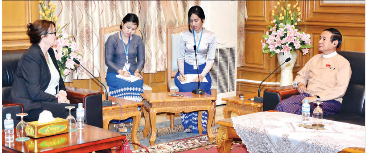
ပြည်သူ့လွှတ်တော်ဥက္ကဋ္ဌ ဦးဝင်းမြင့် မြန်မာနိုင်ငံဆိုင်ရာ ကနေဒါနိုင်ငံ သံအမတ်ကြီး H.E. Ms. Karen MacArthur အား လက်ခံတွေ့ဆုံစဉ်