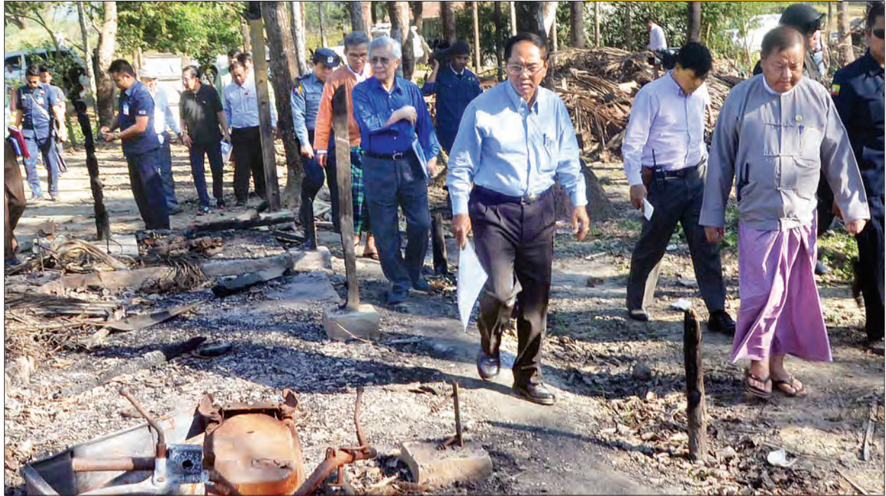
ရခိုင်ပြည်နယ် စုံစမ်းစစ်ဆေးရေးကော်မရှင်ဥက္ကဋ္ဌ ဒုတိယသမ္မတ ဦးမြင့်ဆွေနှင့် အဖွဲ့ဝင်များ ပြောင်ပိုက်ကျေးရွာ မီးလောင်မှုဖြစ်ပွားခဲ့မှုအခြေအနေကို ကြည့်ရှုစစ်ဆေးစဉ်

အဖွဲ့ဝင်များသည် အစွလားဘာသာဝင် မိသားစုများနေထိုင်ရာ ပွင့်ဖြူချောင်းကျေးရွာသို့ရောက်ရှိပြီး အခင်းဖြစ်ပွားစဉ်က ကျေးရွာအတွင်းမှ လက်နက်ငယ်များဖြင့်ပစ်ခတ်မှု၊ တပ်မတော်စစ်ကြောင်းများမှ ဝင်ရောက်ရှင်းလင်းမှု၊ ပွင့်ဖြူချောင်းကျေးရွာ မီးလောင်ခံရမှုအခြေအနေများကို အသေးစိတ်ကြည့်ရှုသည်။ ဆက်လက်၍ ကော်မရှင်ဥက္ကဋ္ဌနှင့် အဖွဲ့ဝင်များသည် အစွလားဘာသာဝင် မိသားစုများနေထိုင်ရာ ပြောင်ပိုက်ကျေးရွာသို့ရောက်ရှိပြီး ရွာသူ ရွာသားများနှင့် တွေ့ဆုံ၍ အောက်တိုဘာ ၁၁ ရက် မွန်းလွဲ ၂ နာရီခွဲက တပ်မတော်စစ်ကြောင်းများနှင့် အကြမ်းဖက်တိုက်ခိုက်သူများ ထိတွေ့မှုဖြစ်ပွားခဲ့သည့်ဖြစ်စဉ်၊ စစ်သည်ငါးဦးကျဆုံးခဲ့မှုဖြစ်စဉ်များ၊ ကျေးရွာမီးလောင်မှုဖြစ်ပွားမှုအခြေအနေနှင့် ကျေးရွာသူများ အမွေကျင့်မှုများ ဖြစ်ပွားခဲ့ခြင်း ရှိ၊ မရှိကို အချိန်ယူ၍ တစ်ဦးချင်းအား အသေးစိတ် မေးမြန်းစစ်ဆေးခဲ့သည်။ အလားတူ ကော်မရှင်အဖွဲ့ဝင် အမျိုးသမီးရေးရာအဖွဲ့ချုပ်ဥက္ကဋ္ဌ ဒေါက်တာဒေါ်သက်သက်ဇင်ကလည်း ကျေးရွာသူ တစ်ဦးအား သီးခြားတွေ့ဆုံ၍ ကိုယ်တိုင် အမေ့ပြုကျင့်ခံရမှု ရှိ၊ မရှိ၊ ကျေးရွာသူ အခြား အမျိုးသမီးငယ်များကိုလည်း အမေ့ပြုကျင့်မှုများ ရှိ၊ မရှိနှင့် မျက်မြင်ကိုယ်တွေ့သိရှိရခြင်း ရှိ၊ မရှိတို့ကို အသေးစိတ်မေးမြန်းသည်။ ညနေပိုင်းတွင် ကော်မရှင်ဥက္ကဋ္ဌနှင့် အဖွဲ့ဝင်များသည် ကျေးရွာပြင်ရှိ အမှတ်