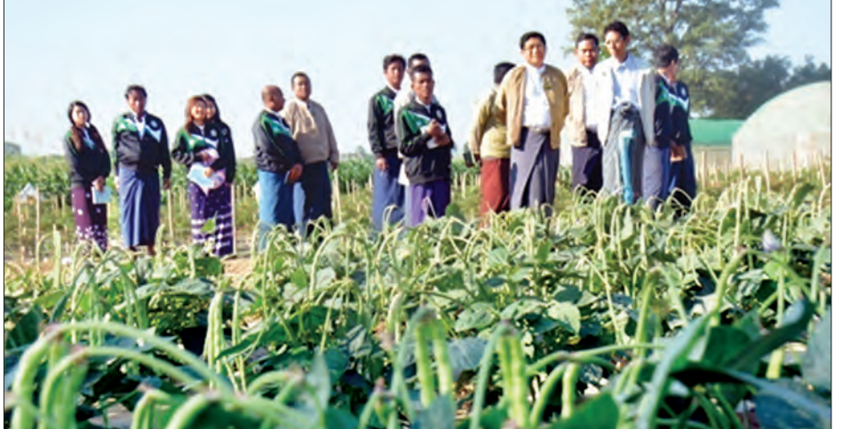
ကာရီမြေဆွေးပြုလုပ်သုံးစွဲနေမှုများကို လည်းကောင်း ကြည့်ရှု ညပဒေပြင်ဆင်ရေး တတိယအကြိမ် လုပ်ငန်းညှိနှိုင်းအစည်းအဝေးပေးရာ စိုက်ကွင်းတာဝန်ခံများက အသေးစိတ်ရှင်းလင်း အသေးသို့တက်ရောက်၍ ဆွေးနွေးအမှာစကား ပြောကြားသည်။ အဆိုပါဆွေးနွေးပွဲသို့ အမြဲတမ်းအတွင်းဝန်များ၊ ညွှန်ကြားရေးမှူးချုပ်များနှင့် ဌာနဆိုင်ရာတာဝန်ရှိသူများတက်ရောက် ဆွေးနွေးကြကြောင်း သတင်းရရှိသည်။ (သတင်းစဉ်)

ပြည်ထောင်စုဝန်ကြီးသည် ယနေ့ နံနက် ၈ နာရီခွဲက နေပြည်တော်ကောင်စီနယ်မြေ ပျဉ်းမနားမြို့နယ် စိုက်ပျိုးရေးသိပ္ပံကျောင်းအနီးရှိ ဥယျာဉ်မြဲဟင်းသီးဟင်းရွက်နှင့် အပင်ဇီဝနည်းပညာဌာနခွဲ၏ တောင်သူပညာပေး သီးနှံစိုက်ကွင်းသို့ ရောက်ရှိစဉ် အထက်ပါအတိုင်း ပြောကြားခြင်းဖြစ်သည်။ ယင်းနောက် စင်တင်ဘူစိုက်ခင်း၊ ခွေးတောက်၊ နာနတ်၊ သင်္ဘော၊ ကျောက်ဖရုံ၊ မာလကာ၊ ကြက်ဟင်းခါး၊ ပဲလင်းမြေ၊ ခဲဝဲနှင့် ရွှေဖရုံသီးနှံများကို GAP နည်းစနစ်ဖြင့် စိုက်ပျိုးအောင်မြင်နေမှုများကို လည်းကောင်း၊ ဖရုံ၊ သခွားမွှေး၊ မုန်လာ၊ မုန်ညင်း၊ ဆလတ်သီးနှံများကို အလိုအလျောက်ရေဖျန်းစနစ်ပါ ပိုက်ကွန်အိမ်များဖြင့် ဓာတုပိုးသတ်ဆေးလွတ် စိုက်ပျိုးထားရှိမှုများကို လည်းကောင်း၊ ငရက်သီး၊ ပဲဖတ်ပုပ်ရည်၊ နှမ်းဖတ်ပုပ်ရည်တို့ဖြင့်ဖျော်စပ်၍ သဘာဝပိုးမွှားကာကွယ်ဆေးရည်အဖြစ် အသုံးပြုစိုက်ပျိုးနေမှုတို့ကိုလည်းကောင်း၊ စိုက်ကွင်းများမှ ထွက်ရှိလာသော သစ်ရွက်အမှိုက်များ၊ ကောက်ရိုးများဖြင့် အီးအမ်ဘီ