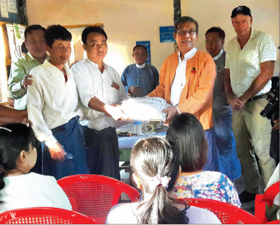
ရခိုင်ပြည်နယ်ဝန်ကြီးချုပ် ဦးညီပု၏ မောင်တောမြို့နယ်သို့ ကူညီထောက်ပံ့ရေးပစ္စည်းများ သွားရောက်ပေးအပ်သည့် ဒီဇင်ဘာ ၉ ရက်နှင့် ၁၀ ရက် ခရီးစဉ်တွင် လူမှုဝန်ထမ်း၊ ကယ်ဆယ်ရေးနှင့် ပြန်လည်နေရာချထားရေးဝန်ကြီးဌာနမှ တာဝန်ရှိသူများလည်း ကူညီထောက်ပံ့ရေးပစ္စည်းများ ပေးအပ်စဉ် (သတင်းစဉ်)

ပြိုင်ပွဲတွင် ဆုရရှိသူများအား ပထမဆု သုံးသိန်းကျပ်၊ ဒုတိယဆု နှစ်သိန်းငါးသောင်းကျပ်၊ တတိယဆု နှစ်သိန်းကျပ်နှင့် အထူးဆု တစ်သိန်းကျပ်စီ ချီးမြှင့်သွားမည်ဖြစ်ပါသည်။ ပြိုင်ပွဲဝင်ဓာတ်ပုံများကို ၂၀၁၇ ခုနှစ် ဇန်နဝါရီလ ၆ ရက်နေ့ ညနေ ၄ နာရီ နောက်ဆုံးထား၍ ဦးကျော်ဇင်စိုး ညွှန်ကြားရေးမှူး(ထုတ်လုပ်)၊ ပြန်ကြားရေးနှင့် ပြည်သူ့ဆက်ဆံရေးဦးစီးဌာန အမှတ်(၂၂၈) သိမ်ဖြူလမ်း ဝိုလ်တထောင်မြို့နယ် ရန်ကုန်မြို့သို့ ပေးပို့ရမည်ဖြစ်ကြောင်းနှင့် ၎င်းနေ့ထက်ကျော်လွန်၍ ပေးပို့လာသောဓာတ်ပုံများအား ပြိုင်ပွဲဝင်ဓာတ်ပုံအဖြစ် လက်ခံမည်မဟုတ်ကြောင်း သတင်းရရှိသည်။ (မြန်မာ့အလင်း)