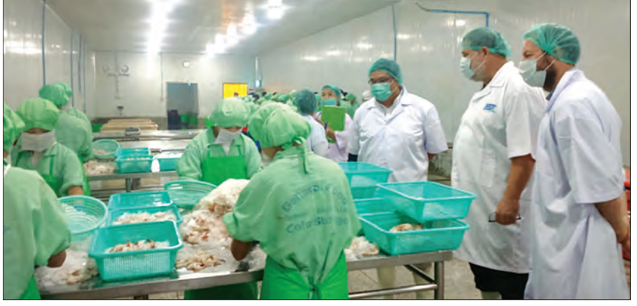
ငါး/ပုစွန် ပြုပြင်ထုတ်လုပ်သည့်စက်ရုံအား EU-FVO Mission မှစစ်ဆေးနေစဉ်

ဖြေ။ ။ ရေထွက်ပစ္စည်းတွေ ပြည်ပသို့တင်ပို့ရာမှာဝယ်ယူ တွဲနိုင်ငံတွေရဲ့ အထူးသဖြင့် (EU)လိုအပ်ချက်များ၊ သတ်မှတ် စံချိန်စံညွှန်းတွေနှင့်အညီ တင်ပို့နိုင်ရေးအတွက် ငါးလုပ်ငန်း