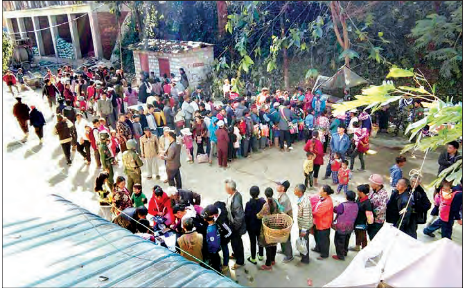
ပြန်လည်ရောက်ရှိလာသော စစ်ဘေးရှောင်ပြည်သူများအား စနစ်တကျ စစ်ဆေးလက်ခံစဉ်

တပ်မတော်စစ်ကြောင်းများ၏ နေ့ည မပြတ် နယ်မြေရှင်းလင်းဆောင်ရွက်မှုများကြောင့် ဒေသတည်ငြိမ်အေးချမ်းလာပြီ ဖြစ်သဖြင့် ဒီဇင်ဘာ ၉ ရက်မှ စတင်၍