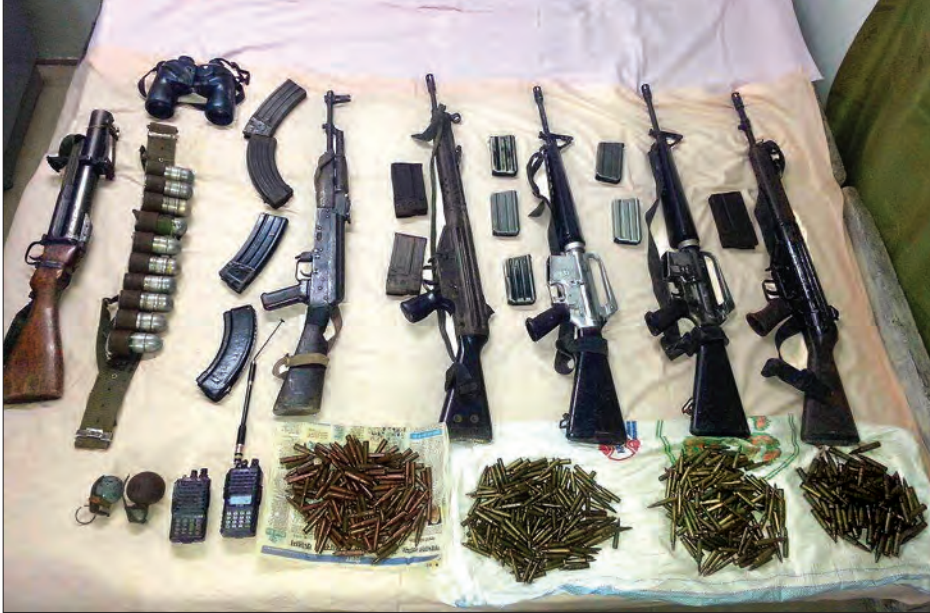
လောင်ချာတစ်ခု၊ ၇ ဒသမ ၆ မီလီမီတာ ပြောင်းရှိသည့် ရိုင်ဖယ်သေနတ်တစ်လက်၊ ၅ ဒသမ ၅ မီလီမီတာရှိသည့်

ဖမ်းဆီးရမိသည့် လက်နက်ခဲယမ်းများမှာ လက်ပစ်ခဲယမ်းဖြင့် ပစ်ခတ်ရသည့်