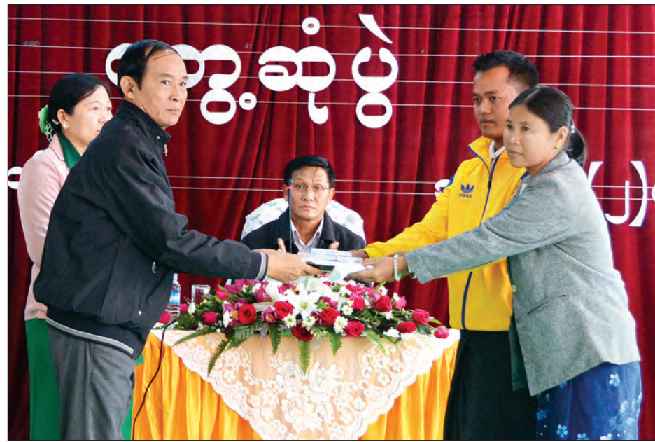
ပြည်သူ့လွှတ်တော်ဥက္ကဋ္ဌ ဦးတင်နရီဖန်ထီးယူ စစ်ဘေးရှောင်ပြည်သူများအား ထောက်ပံ့ပစ္စည်းများ ပေးအပ်စဉ် (သတင်းစဉ်)