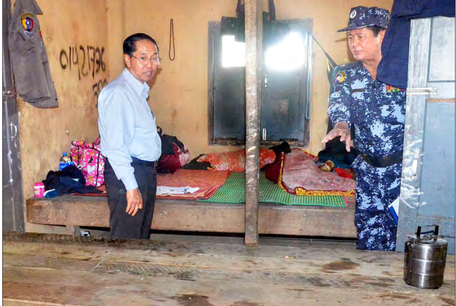
ရခိုင်ပြည်နယ် စုံစမ်းစစ်ဆေးရေးကော်မရှင်ဥက္ကဋ္ဌ ဒုတိယသမ္မတ ဦးမြင့်ဆွေ ကျီးကန်းပြင် ကွပ်ကဲမှုဌာနချုပ် ကာကင်းအဖွဲ့မှ အဖွဲ့ဝင်ငါးဦးအား အကြမ်းဖက်သမားများက သတ်ဖြတ်ခဲ့သည့်နေရာကို ကြည့်ရှုစဉ်

နှင့် အဖြစ်မှန်ပေါ်ပေါက်စေရေး စုံစမ်း စစ်ဆေးရန်နှင့် နောင်အလားတူဖြစ်စဉ် မျိုး ထပ်မံမဖြစ်ပွားစေရေး၊ ဖြစ်စဉ် များနှင့်ပတ်သက်၍ ဆောင်ရွက်နိုင်မှုတွင် နိုင်ငံတော်၏ တည်ဆဲဥပဒေ၊ လုပ်ထုံး လုပ်နည်းများနှင့်အညီ ဆောင်ရွက်ခဲ့ခြင်း ရှိ၊ မရှိကို စစ်ဆေးသုံးသပ်ပြီး အကြံပြု ချက်များအဖြစ် စုံစမ်းစစ်ဆေးရေးအစီရင်ခံစာကို နိုင်ငံတော်သမ္မတထံ သတ်မှတ် ချိန်အမီ တင်ပြမည်ဖြစ်ကြောင်း သိရ သည်။ (သတင်းစဉ်)