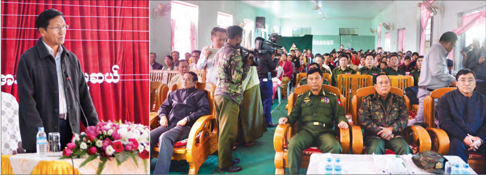
ဒုတိယသမ္မတ ဦးတင်နရီဖန်ထီးယူ မူဆယ်မြို့ အမှတ်(၂) အထက၌ စစ်ဘေးရှောင်ပြည်သူများအား တွေ့ဆုံအမှာစကားပြောကြားစဉ် (သတင်းစဉ်)