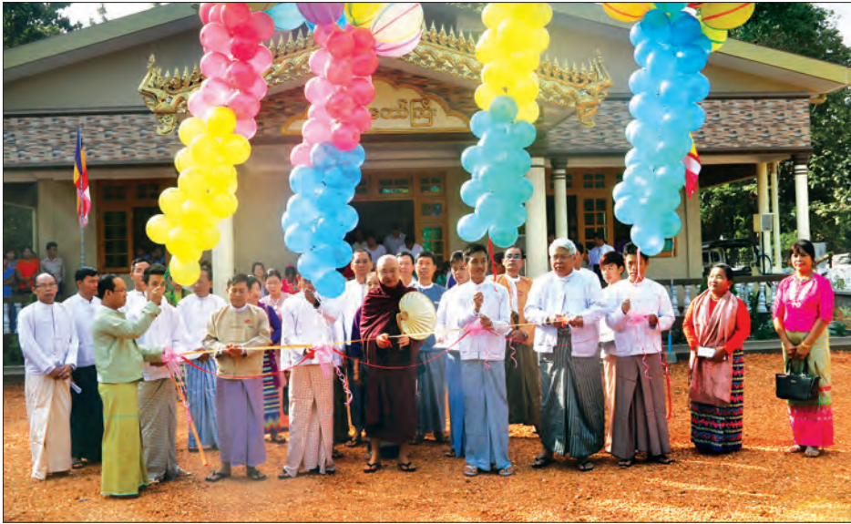
ဖွင့်လှစ်ပေးခဲ့သည်။ အဆိုပါ ဓမ္မာရုံတော်ကြီးကို ပဲခူးဆယ်မိုင်ကုန်း ဓမ္မဒူတတောရ သာသနာ့ရိပ်သာနှင့် ဓမ္မဒူတတက္ကသိုလ်တို့၏ ပဓာနနာယက ပတ်သက်သည့် စာရွက်စာတမ်းများအား ပညာရေးဌာနသို့ လွှဲပြောင်းပေးအပ် ခဲ့ကြောင်း သိရသည်။