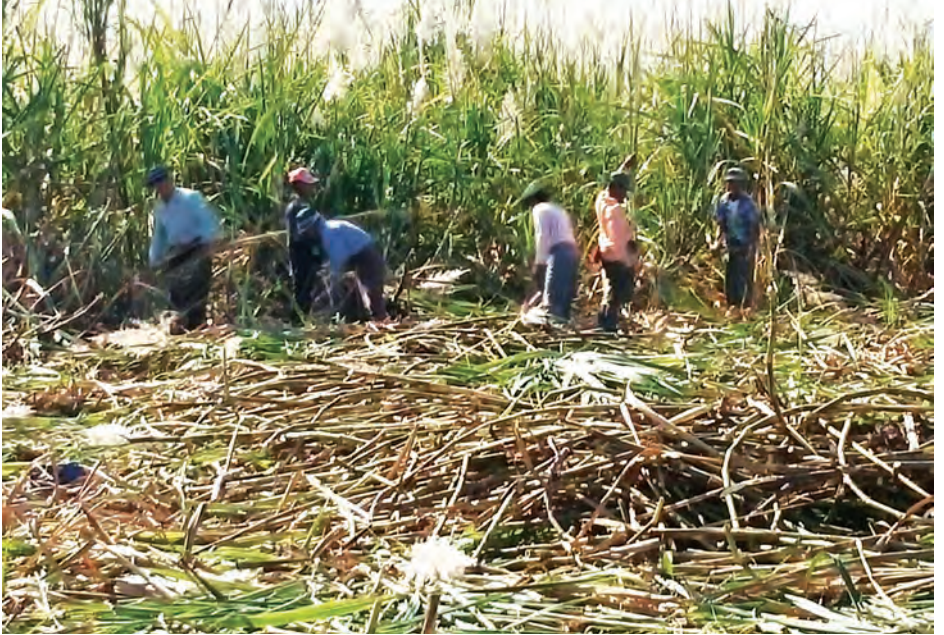
တပ်ကုန်းမြို့နယ်ရှိ ကြံစိုက်ခင်းမှ ကြံများခုတ်ယူနေစဉ်

ကျရောက်မှု ရှိ မရှိ စစ်ဆေးခြင်း၊ မခတ်မီ နှစ်လအလိုတွင် ကြံခင်းထဲ၌ ရေများမကျန်စေရန် ထုတ်ပေးရမည်ဖြစ်သည်။ ခုတ်သိမ်းရာတွင် မျိုးအဖြစ် ခုတ်သိမ်းမည်ဆိုပါက ရှစ်လ (သို့) ကိုးလသားအရွယ်တွင် လည်းကောင်း၊ လမိုင်းထားမည်ဆိုပါက ၁၂ လသားထက်နောက်မကျဘဲ ခုတ်သိမ်းရန်လိုအပ်ကာ မြေပြင်စရိတ်သက်သာခြင်း၊ မျိုးစရိတ်သက်သာခြင်း၊ ကြံလမိုင်းကို သေချာပြုပြင်ပါက စိုက်ခင်းသစ်ကဲ့သို့ အထွက်