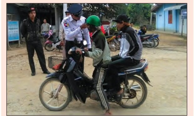
မိုင်းယောင်းမြို့အတွင်း ယာဉ်အန္တရာယ်ကင်းရှင်းရေးအတွက် ဆိုင်ကယ် စီးသူများ ဆိုင်ကယ်စီးထုပ်ဆောင်းရန်၊ ဦးထုပ်မေးသိုင်းကြီးများ တပ်ဆင်မောင်း နှင်ရန်၊ နှစ်ဦးထက်ပိုမိုကြာရန် စသည့် ယာဉ်စည်းကမ်း၊ လမ်းစည်းကမ်းဆိုင်ရာ များကို သက်ဆိုင်ရာဌာနများနှင့် ရပ်ကွက်အုပ်ချုပ်ရေးမှူးများပါဝင်သော ပူး ပေါင်းအဖွဲ့က လူထုတော်လှန်ရေးနှင့် မြို့ပြအခြေခံများ၌ ဒီဇင်ဘာ ၉ ရက်က စစ်ဆေး ပညာပေးမှုများ ဆောင်ရွက်စဉ်။ (မြို့နယ် ပြန်/ဆက်)

ရန်ကုန်တိုင်းဒေသကြီး ဒဂုံမြို့နယ်အတွင်းရှိကျောင်းများမှ ကျောင်းသား ကျောင်းသူများ အား အသိပညာပေးလုပ်ငန်းများကို ဒဂုံမြို့နယ် ပြန်ကြားရေးနှင့် ပြည်သူ့ဆက်ဆံရေး ဦးစီးဌာနက ကွင်းဆင်းဆောင်ရွက်လျက်ရှိရာ ဒီဇင်ဘာ ၉ ရက်တွင် ကျားကူး ဘက ကျောင်းရှိ မူလတန်းကလေးငယ်များ ဉာဏ်ရည်ထက်မြက်စေရန်၊ တီထွင်ဖန်တီး တတ်စေရန်၊ စာဖတ်သည့်အလေ့အထများ ဖြစ်ပေါ်လာစေရန် ရည်ရွယ်၍ ပုံပြင်ပြော ခြင်း၊ ပန်းချီဆွဲခြင်း၊ ကဗျာရွတ်ဆိုခြင်း၊ စက္ကူဖြင့်အရုပ်ပုံခေါက်ခြင်း၊ တစ်ဦးနှင့် တစ်ဦး မိတ်ဆက်စေခြင်းတို့ကိုသွားရောက်ဆောင်ရွက်ပေးခဲ့ပြီး ဆေးလိပ်သောက်သုံးခြင်းနှင့် ကွမ်းစား၏အန္တရာယ်အကြောင်းကိုလည်း နံရံကပ်စာစောင်များပြသ၍ အသိပေးခဲ့ ကြောင်း သိရသည်။ (မြို့နယ် ပြန်/ဆက်)