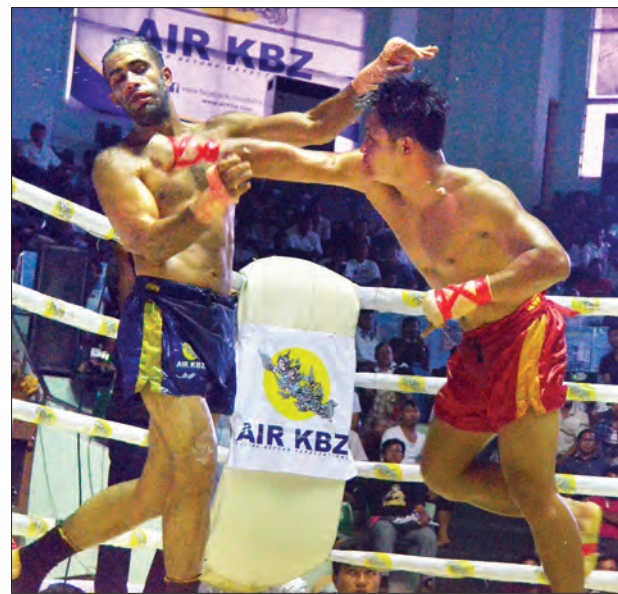
ဖျံသွေးနှင့် နျူကလီးယားဟာဒီ(အီရန်)တို့ အကြိမ်အနယ် ယှဉ်ပြိုင်ထိုးသတ်နေစဉ်

မပြင်းထန်သော်လည်း ဒုတိယအချီတွင် အတင်းဝင် အတင်းထွက် ဝင်လုံးလာသော ထွန်းထွန်းမင်းကို ဒေက သူပင်တိုင် အနီးကပ် တံတောင်ရိုက်ချက်များဖြင့် ပြန်လည်တုံ့ပြန်ခဲ့မှုကြောင့် ပြိုင်ပွဲက ခပ်သွက်သွက်ကလေး ဖြစ်လာခဲ့သော်လည်း ထွန်းထွန်းမင်း၏ ပါဝါပါသော ဘယ်ညာတွဲလုံးများက ဒေမျက်နှာအထိ နာကာ ယိုင်လဲမည့်ပမာပြသောကြောင့် ကျားရိုင်းတစ်ကောင်လို မာန်ဟုန်မိကာ အစာကို အလွတ်မပေးတတ်သော ထွန်းထွန်းမင်း ဘယ်ညာတွဲလုံးများနှင့် အတူ ပါဝါပါသော ညာခြေကန်ချက်တို့ဖြင့် လိုက်လံကန်ကျောက်မှုကြောင့် ဒေကြမ်းပြင်သို့ အကြိမ်ကြိမ်ပြီလဲခဲ့သည်။ သို့သော် ပညာစုံသမ္မာရင် ခေသူမဟုတ်သော ဒေက ညာခြေကန်ချက်များ တွင်တွင်သုံးလာသော ထွန်းထွန်း