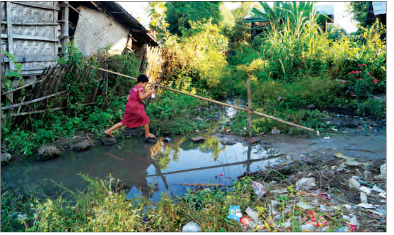
ဒီလမ်းပြုပြင်မယ်ဆိုရင်လည်း သာမန်စိုက်ပျိုး ရေးလုပ်ငန်းနဲ့ အသက်မွေးဝမ်းကျောင်းပြုသူတွေများတာ ကြောင့် ငွေရေး၊ ကြေးရေးမှာ အခက်အခဲဖြစ်ကြပါတယ်” ဟု လယ်သာကျေးရွာမှ ဒေသခံတစ်ဦးက ပြောသည်။ တင်စိုးလွင်

နေပြည်တော် ဥတ္တရခရိုင် ပုဗ္ဗသီရိမြို့နယ် လယ်သာကျေးရွာ အုပ်စု လယ်သာကျေးရွာ၌ ဘုန်းတော်ကြီးကျောင်းနှင့် အခြေခံပညာကျောင်းသို့ ဖြတ်သွားဖြတ်လာပြုနေသည့် ရွာအတွင်းလမ်းတွင် မိုးရာသီအချိန် ရွာ၏အနောက် မြောက်ဘက်ရှိ လယ်ကွင်းများဘက်မှ ရေများရွာထဲသို့ အရည် ပေ ၅၀၀ ခန့် ရေလမ်းသဖွယ်စီးဆင်းလာပြီး ရွာအရှေ့ဘက်သို့ စီးဆင်းနေမှုကြောင့် ရွာမြောက်ဘက်ခြမ်းမှ ကျောင်းသား ကျောင်းသူများနှင့်ပြည်သူများ သွားလာရေးအတွက် အဆင် မပြေသည့်အပြင် ခြင်္သေ့အောင်း၍ ရွာထဲကလေးတို့နေ သည့်အတွက် အဆိုးလမ်းကို အဆင့်မြှင့်တင်ပေးစေလို ကြောင်း ဒေသခံများထံမှ သိရသည်။