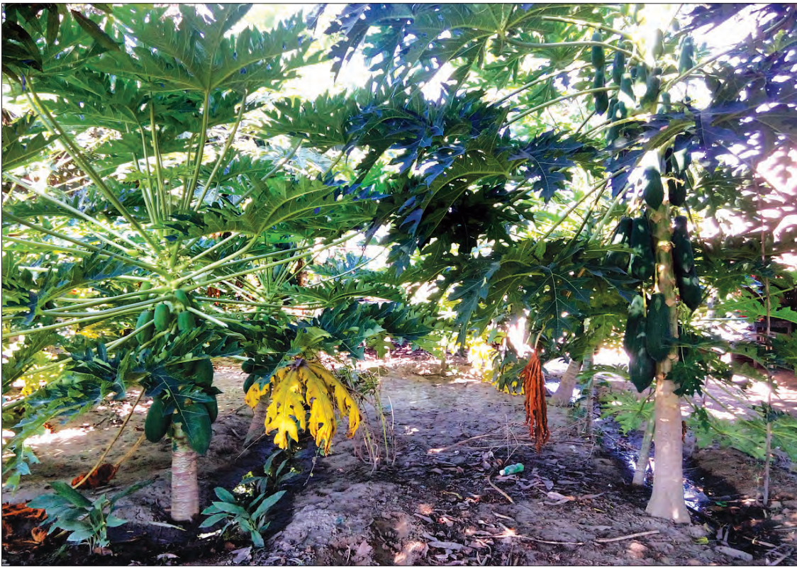
စိုက်တဲ့သူတွေက ဖောက်သည်တွေနဲ့ချိတ်ထားတော့ အဆင်ပြေပါတယ်” ဟု ၎င်းက ဆက်လက်ပြောပြသည်။ ယခုအခါ ပွင့်ဖြူမြို့နယ်အတွင်း၌ ထိုင်ဝမ်သဘောများကို အများအပြားစိုက်ပျိုးလာကြပြီး စရိတ်စကနည်း၍ တောင်သူများအနေဖြင့် စီးပွားရေးတွက်ခြေကိုက်ကြကြောင်း သိရသည်။ ထို့အပြင် အိမ်ပိုင်းကျယ်ရှိသူများအတွက်လည်း ထိုင်ဝမ်သဘောကို အိမ်တွင် တစ်ပိုင်တစ်နိုင် စိုက်ပျိုးနိုင်ခြင်းကြောင့် အပိုဝင်ငွေရရှိနိုင်သည်။

“သဘောပင် အသက်ကတော့ သုံးနှစ်လောက်ခံတယ်။ အသီးမြတ်မချင်း ခူးရောင်းနေရုံပဲ။ ကျွန်တော်တို့ကတော့ မြေထဲမှာပဲ တစ်ပိုင်တစ်နိုင်စိုက်ပျိုးထားတာပါ။ ရွာထဲက အသုပ်သည်တွေက သဘောသီးအစိမ်းကို နေ့တိုင်းလာဝယ်တယ်။ တချို့ကတော့ အမှည့်စားဖို့လာဝယ်တာတွေလည်း ရှိပါတယ်။ များတဲ့အခါကျရင်တော့ ကျောင်းတော်ရာဈေးကို သွားရောင်းပါတယ်။ တချို့များများ