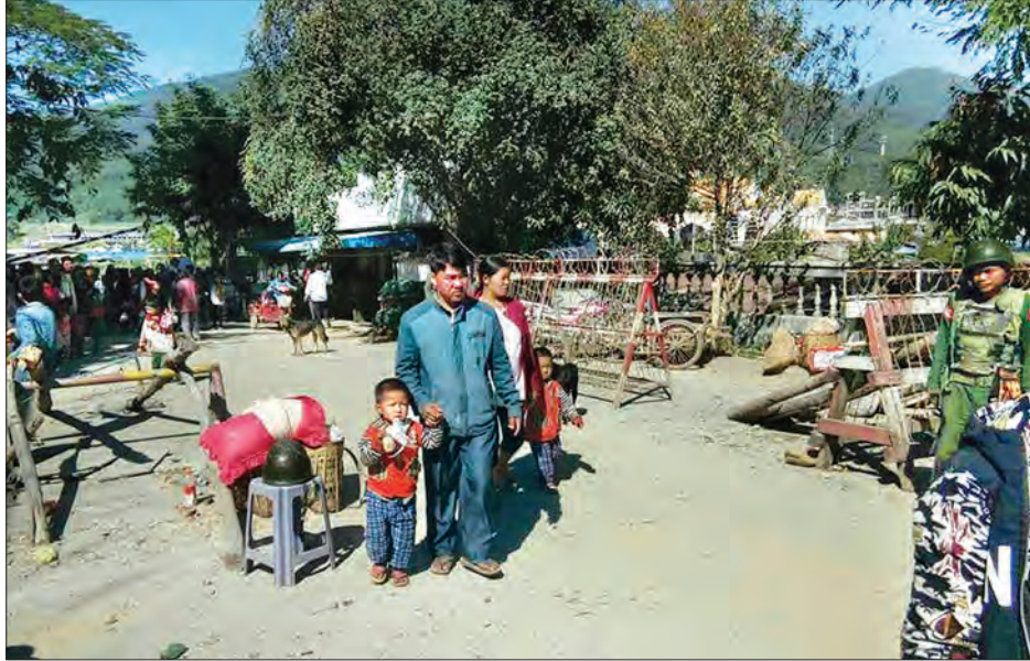
ပြန်လည်ရောက်ရှိလာသော စစ်ဘေးရှောင်မိသားစုကို တွေ့ရစဉ်

စစ်ဘေးရှောင်ပြည်သူများအား တပ်မတော် သားများ၊ မြန်မာနိုင်ငံရဲတပ်ဖွဲ့ဝင်များ၊ မြို့နယ်အုပ်ချုပ်ရေးအဖွဲ့များနှင့် ဌာနဆိုင်ရာဝန်ထမ်းများ ပါဝင်သော ပူးပေါင်း