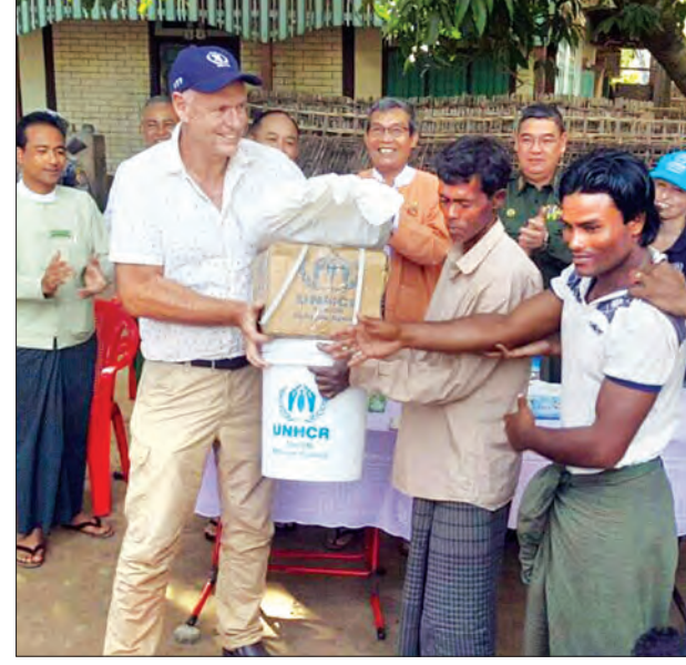
ကုလသမဂ္ဂဌာနကော်မတီးလွယ် ကျေးရွာသားများကို ပစ္စည်းများပေးအပ်စဉ်