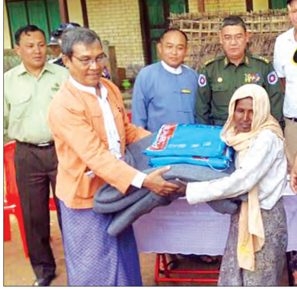
ပြည်နယ်ဝန်ကြီးချုပ် ဦးညီပု ပစ္စည်းများ ထောက်ပံ့ပေးအပ်စဉ်

ကျေးရွာရှိ အိမ်ထောင်စု ၂၇ စု၊ လူဦးရေ ၁၅၀နှင့် ဒုချိရားတန်းကျေးရွာအုပ်စု၊ မြောင်ရွာ (အရှေ့ရွာ)ရှိ အိမ်ထောင်စု ၁၀ စု၊ လူဦးရေ ၅၆ ဦးတို့အား မီးဖိုချောင်သုံးပစ္စည်းများနှင့် လူသားကုန်ပစ္စည်းများကို ထောက်ပံ့ဖြန့်ဝေပေးခဲ့ကြောင်း သိရသည်။ (သတင်းစဉ်)