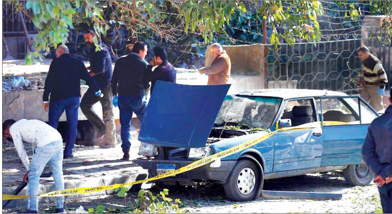
ကိုင်းရို ဒီဇင်ဘာ ၉ ကိုင်းရိုမြို့ ပိရမစ်များသို့ သွားရာလမ်းပေါ် ရှိ စစ်ဆေးရေးဂိတ်တစ်ခုတွင် သောကြာ နေ့က ပုံးတစ်လုံး ပေါက်ကွဲသွားသော ကြောင့် လုံခြုံရေးတပ်ဖွဲ့ဝင်အနည်းဆုံး ခြောက်ဦးသေဆုံးခဲ့ကြောင်း မီနာ သတင်းအေဂျင်စီက ဖော်ပြခဲ့သည်။ ပုံးပေါက်ကွဲမှုကြောင့် အရာရှိ နှစ်ဦးနှင့် လုံခြုံရေးတပ်ဖွဲ့ဝင်လေးဦး သေဆုံးခဲ့ပြီး နောက်ထပ်လုံခြုံရေး တပ်ဖွဲ့ဝင်သုံးဦး ဒဏ်ရာရရှိခဲ့ကြောင်း လုံခြုံရေးသတင်းရင်းမြစ်များ၏ ဖော်ပြ ချက်ကို ကိုးကား၍ မီနာသတင်းအေဂျင်စီ က ဖော်ပြခဲ့သည်။ မည်သူမည်ဝါက အယ်လ်ဟာရမ် လမ်းရှိ ဘာသာရေးအဆောက်အအုံ အနီး လုံခြုံရေးဂိတ်ကို ပုံးဖောက်ခဲ့တိုက် ခိုက်ခဲ့သည်ကို လတ်တလောတွင် မသိရ သေးပေ။ (ရိုက်တာ)