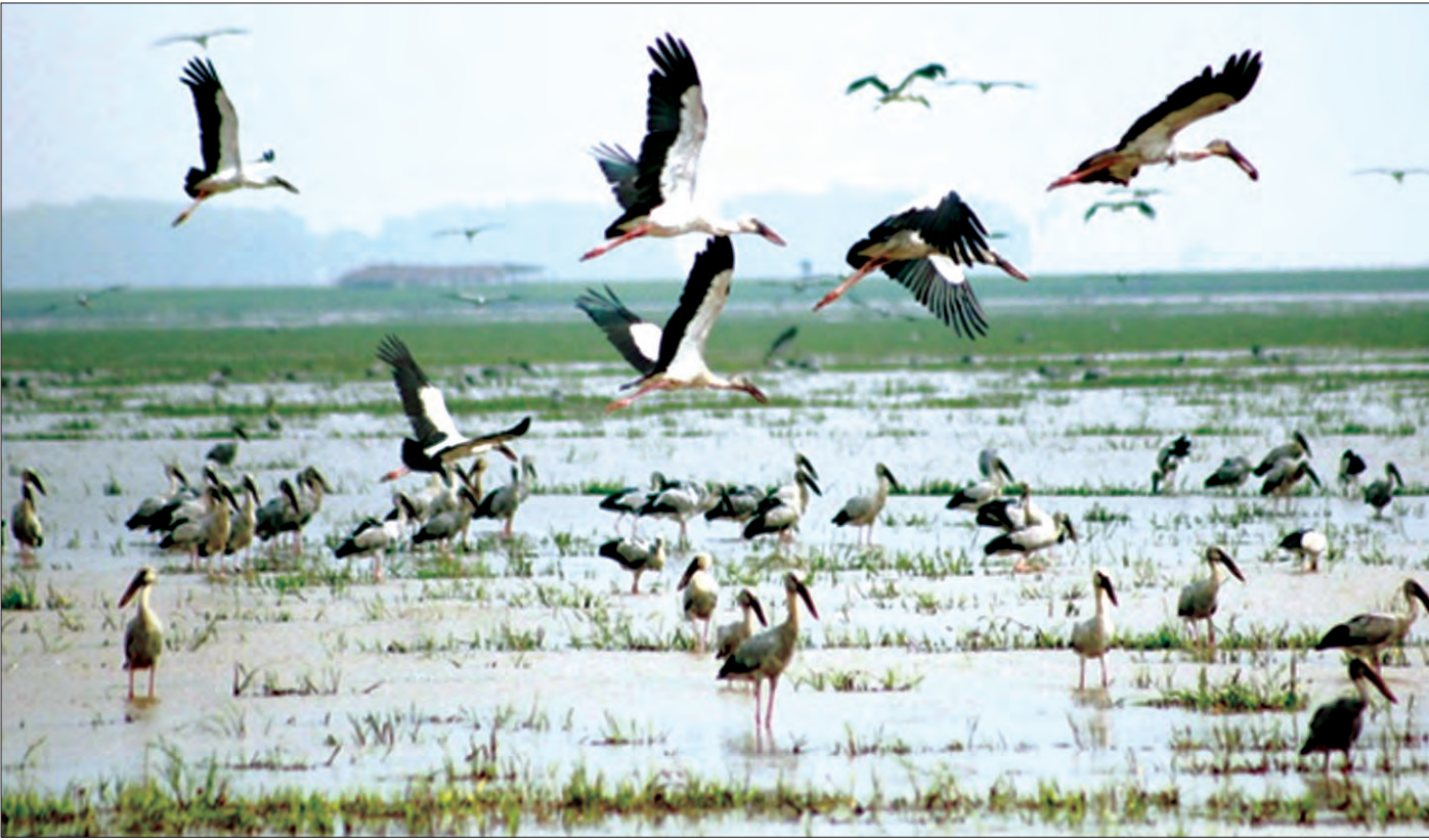
မိုးယွန်းကြီးအင်း တောရိုင်းတိရစ္ဆာန်ဘေးမဲ့တော၌ ဌာနေငှက်နှင့် ဆောင်းခိုငှက်များကို ဤသို့ တွေ့မြင်ရစဉ်

မဟုတ်မမှန် သတင်းမှားများကိုအခြေခံ၍ မြန်မာနိုင်ငံအပေါ် လူ့အခွင့်အရေးဆိုင်ရာ စွပ်စွဲမှုများ ပြုလုပ်နေချိန်တွင် နိုင်ငံတကာသတင်းဌာနအချို့က မြန်မာနိုင်ငံနှင့် ပတ်သက်သည့် သတင်းမှားများကို ရည်ရွယ်ချက်ရှိရှိဖော်ပြလျက်ရှိ