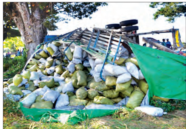
ဥပဒေဘောင်တွင်းနေထိုင်ခြင်း ဘေးကင်းရန်ကွာ စိတ်ချမ်းသာ

မသေမင်(ခ)လားဟူမအား တွေ့ရှိသဖြင့် စစ်ဆေးရာ လည်ပင်းတွင် တွေ့ရှိသော အုန်းဆီကြိုးနှင့် အသွယ်ပုံဆွဲသီးပါ ရွှေဆွဲကြိုးအလေးချိန် ၁၅ ဂရမ်ခန့်ပါ တစ်ကုံးကို တွေ့ရှိသဖြင့် စစ်ဆေးမေးမြန်းရာ ပိုင်ဆိုင်ကြောင်း အထောက်အထား တစ်စုံတစ်ရာ ပြသနိုင်ခြင်းမရှိသဖြင့် သိမ်းဆည်းခဲ့သည်။