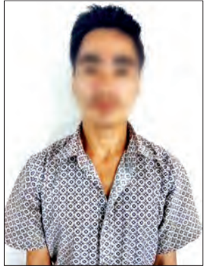
ဝူးကျင်းချန် ဆောင်ရွက်နိုင်ရန် ဆက်လက်ဆောင်ရွက် လျက်ရှိကြောင်း သတင်းရရှိသည်။ (သတင်းစဉ်)

မဖြစ်မီ MNDAA လက်နက်ကိုင်အဖွဲ့ တွင် တာဝန်ထမ်းဆောင်ခဲ့ဖူးကြောင်း၊ ၂၀၁၅ ခုနှစ် တိုက်ပွဲများဖြစ်ပွားစဉ် တစ်ဖက်နိုင်ငံသို့ တိုက်ပွဲရှောင်ရန် သွား ရောက်နေထိုင်ရာမှ ဇူလိုင်လခန့်တွင် MNDAA အဖွဲ့၏ ဖမ်းဆီးခံခဲ့ရပြီး နန်းကြားနှင့် တာရှင်မင်ခန့်တို့တွင် တာဝန် ထမ်းဆောင်ခဲ့ရကြောင်း၊ ကုန်းကြမ်း မြို့နယ် ရှင်ပင်ကိုင်းကျေးရွာ၊ နန်းခုံပတ် ကျေးရွာ၊ တာကျူကျိုင်းကျေးရွာနှင့် ကြာတီမောကျေးရွာများတွင် လူသစ် စုဆောင်းသည့်တာဝန် ထမ်းဆောင်ခဲ့ပြီး ယခုနေအိမ်သို့ပြန်ချိန်တွင် ဖမ်းဆီး ခံရခြင်းဖြစ်ကြောင်း သိရှိရသည်။