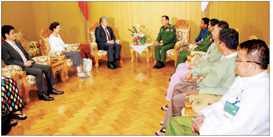
ဆောင်ရွက်ပေးနေမှု အခြေအနေများ၊ မြန်မာ-ဘင်္ဂလားဒေ့ရှ် နှစ်နိုင်ငံနယ်စပ်ဆက်ဆံရေးရုံး (BLO) ဖွင့်လှစ်ရေး သဘောတူညီပူးပေါင်းဆောင်ရွက်နေမှု အခြေအနေများနှင့် နှစ်နိုင်ငံပိုမိုပူးပေါင်းအခြေအနေများ၊ နယ်စပ်ဒေသများရှိ ဆောင်ရွက်ရေးဆိုင်ရာကိစ္စရပ်များအား IDPs များအား ကူညီထောက်ပံ့ပေးနေမှု ဆွေးနွေးကြသည်။ (သတင်းစဉ်)

ပေးနေမှုအခြေအနေများ၊ UN၊ NGOs၊ INGOs အဖွဲ့အစည်းများနှင့် ပူးပေါင်း၍ နိုင်ငံတော်အစိုးရ၏ မူဝါဒနှင့်အညီ ဒေသအတွင်း ကူညီထောက်ပံ့မှုဆိုင်ရာ ဆောင်ရွက်နေမှုအခြေအနေများ၊ နိုင်ငံတော်အစိုးရမှ ပြည်တွင်းငြိမ်းချမ်းရေးအတွက် ကြိုးပမ်းဆောင်ရွက်နေမှု အခြေအနေများ၊ ဒေသအတွင်းလုံခြုံရေး၊ လွတ်လပ်မှု၊ လူ့အခွင့်အရေးမျှတအောင် ဆောင်ရွက်ပေးနေမှုများ၊ နယ်စပ်ရေးရာဝန်ကြီးဌာနမှ နယ်စပ်ဒေသများ ဖွံ့ဖြိုးတိုးတက်ရေးနှင့် လူ့စွမ်းအားအရင်းအမြစ် ဖွံ့ဖြိုးတိုးတက်ရေးအတွက် စဉ်ဆက်မပြတ်