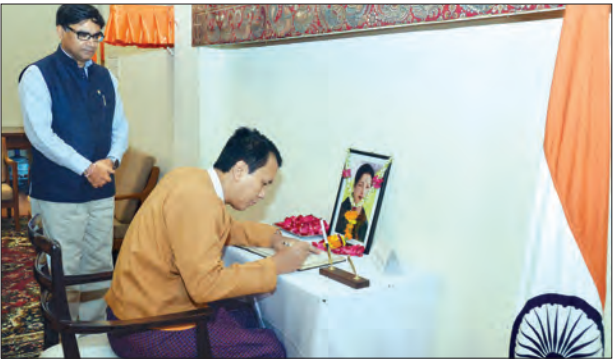
အိန္ဒိယနိုင်ငံ တမီးလ်နာဒူ ပြည်နယ် ဝန်ကြီးချုပ် Ms.(Selvi)j.jayalalitha ကွယ်လွန်သွားသည့်အတွက် ဒီဇင်ဘာ ၈ ရက်က ဝမ်းနည်းကြောင်း မှတ်တမ်းစာအုပ်တွင် ရန်ကုန်တိုင်း ဒေသကြီးဝန်ကြီးချုပ် ဦးမြိုးမင်းသိန်း လက်မှတ်ရေးထိုးစဉ် (သတင်းစဉ်)

“အခုကျင်းပတဲ့ပွဲက စက်တင်ဘာ ၅ ရက်မှာ ကျင်းပပြီး ခွဲတဲ့ လူ့စွမ်းအားဖွံ့ဖြိုးမှု အညွှန်းကိန်းများ ပြုစုထုတ်ပြန်နိုင်ရေး အထောက်အကူပြုလုပ်ငန်းအဖွဲ့အစည်းအဝေးမှာ ချပြခဲ့တဲ့ လူ့စွမ်းအားဖွံ့ဖြိုးမှု အညွှန်းကိန်းများ လက်စွဲစာအုပ် ထုတ်ဝေနိုင်ရေး final draft ကိုတင်ပြပြီး နောက်ဆုံးအတည်ပြုချက်ရယူဖို့ အလုပ်ရုံဆွေးနွေးပွဲဖြစ်ပါတယ်။ ဒီလက်စွဲစာအုပ်မှာ ပါတဲ့ အညွှန်းကိန်းတွေဟာ ဌာနတွေကပိုထားတဲ့ အညွှန်းကိန်းတွေအတိုင်း မှန်ကန်မှုရှိမရှိနဲ့ ရှေ့ဆောင်ရွက်ရမယ့်ကိစ္စရပ်တွေကို ချမှတ်နိုင်ဖို့ ဆွေးနွေးသွားမှာပါ” ဟု အလုပ်သမားညွှန်ကြားရေး ဦးစီးဌာန ဒုတိယညွှန်ကြားရေးမှူးချုပ် ဦးအောင်ဌေးဝင်းက ပြောကြားသည်။ အချက်အလက်များထည့်သွင်း ယခုထုတ်ဝေမည့် စာအုပ်တွင် ၂၀၁၄ခုနှစ် လူဦးရေနှင့် အိမ်အကြောင်းအရာ သန်းခေါင်စာရင်းအပြီး ရလဒ်အပေါ် အခြေခံသည့် အချက်အလက်များကို ထည့်သွင်းထားပြီး ၂၀၁၅ ခုနှစ် မြန်မာနိုင်ငံ လုပ်သားအင်အား၊ ကလေးလုပ်သားနှင့် ကျောင်းအပြီးလုပ်ငန်းခွင်ဝင်ရောက်မှု အကူးအပြောင်း ဆန်းစစ်ခြင်းစစ်တမ်းမှ ရလာသည့် အချက်အလက်များကိုလည်း ထည့်သွင်းထားကြောင်း သိရသည်။ အဆိုပါအလုပ်ရုံဆွေးနွေးပွဲအတွင်း လူ့စွမ်းအားဖွံ့ဖြိုးမှု အညွှန်းကိန်းများ ပုံမှန်ပြုစုထုတ်ပြန်နိုင်ရေးအတွက် ဆောင်ရွက်မှုများနှင့် ယခင်နှစ်များက ချမှတ်ခဲ့သည့် ဆုံးဖြတ်ချက်များ၊ ရှေ့လုပ်ငန်းစဉ်များအပေါ် အကောင်အထည်ဖော်မှုအခြေအနေ၊ လက်စွဲစာအုပ်အပေါ် တွေ့ကြုံရသည့် အခက်အခဲများကို ဆွေးနွေးခြင်း၊ သုံးသပ်အကြံပြုချက်များ ရယူခြင်းတို့ ပြုလုပ်ခဲ့သည်။ အညွှန်းကိန်းလက်စွဲစာအုပ်(မူကြမ်း)အတွက် အညွှန်းကိန်းများကို အချိန်နှင့်တစ်ပြေးညီဖြစ်စေရေးနှင့် ပြုစုထုတ်ဝေနိုင်ရေးအတွက် ၂၀၁၀ ခုနှစ်မှ ၂၀၁၆ခုနှစ်အထိ အချက်အလက်များကို ထည့်သွင်းထားကြောင်း သိရသည်။ သတင်း - ခင်ရတနာ