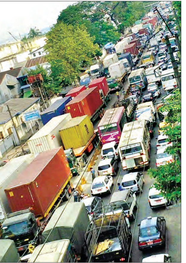
ရန်ကုန်မြို့၊ ကမ်းနားလမ်းနှင့် ဟုမ်းလမ်းထိပ်၌ ကွန်ကရစ်နာယာဉ်များ ပိတ်ဆို့နေသောကြောင့် ဟုမ်းလမ်းမှတ်တိုင်မှစ၍ မော်တော်ယာဉ်များ ပိတ်ဆို့နေသည့် ကို တွေ့ရစဉ်

တို့ ကုန်သေတ္တာယာဉ်တွေ မောင်းနှင်တဲ့အတွက် ဒီမှာရပ်ထားတာ ပြသနာမဖြစ်နိုင်ပေမယ့် ကတ္တရာလမ်းပေါ်ရောက်သွားရင် အဖမ်းခံရမှာပဲပါတယ်။ ဒါကြောင့် ခုလိုရပ်ထားရတာပါ”ဟု ရှင်းလင်းပြောကြားသည်။ ကမ်းနားလမ်းတစ်လျှောက်ယာဉ်ကြောပိတ်ဆို့မှုကြောင့် အထက်ကြည့်မြင်တိုင်လမ်းမ၊ အောက်ကြည့်မြင်တိုင်လမ်းမတစ်လျှောက်နှင့် ရပ်ကွက်အတွင်း ထီးတန်း/ဈေးကလေးလမ်းမ၊ ဗားကရာလမ်းမတစ်လျှောက် ယာဉ်ကြောများ ပါ ပိတ်ဆို့မှုဖြစ်ပွားခဲ့သည်။ လိုင်းကားမှတ်တိုင်ကြားတွင် ခရီးသွားပြည်သူများစုပုံနေခဲ့ပြီး လိုင်းကားအလာကို အချိန်ကြာမြင့်စွာ စောင့်နေခဲ့ကြရသည်။ ယာဉ်ကြောပိတ်ဆို့ရာသို့ ရန်ကုန်တိုင်းဒေသကြီး ဒုတိယတိုင်းရဲတပ်ဖွဲ့မှူးရဲမှူးကြီး မျိုးဆွေနှင့် ရဲတပ်ဖွဲ့ဝင်များ ယာဉ်ထိန်းရဲတပ်ဖွဲ့ဝင်များ၊ မြို့နယ်မှ တာဝန်ရှိသူများက လာရောက်ရှင်းလင်းပေးခဲ့ရာ မွန်းလွဲ ၁၂ နာရီ မိနစ် ၂၀ မှ စတင်ပြီး တဖြည်းဖြည်းလမ်းကြောများဖွင့်လာခဲ့ကြောင်း သိရသည်။ သတင်း တင်စင်းလေး (ကြည့်မြင်တိုင်)