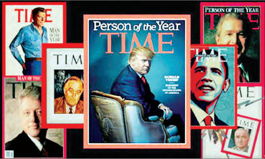
ဝါရှင်တန် ဒီဇင်ဘာ ၈ အမေရိကန် ရွေးကောက်ခံသမ္မတ ဒေါ်နယ်ထရန်ကို တိုင်းမ်မဂ္ဂဇင်းက ယခုနှစ်အတွက် အထူးခြားဆုံးပုဂ္ဂိုလ် "Person of the Year" အဖြစ်ရွေးချယ်ဖော်ပြခဲ့ကြောင်း ရိုက်တာ

သတင်းတစ်ရပ်တွင် ဖော်ပြခဲ့သည်။ ထိုသို့ ဖော်ပြခြင်းခံရသည့် အတွက် အကြီးမားဆုံး ဂုဏ်ပြုခံရခြင်းဖြစ်ကြောင်း အင်န်ဘီစီရပ်သံနှင့် တွေ့ဆုံမေးမြန်းခန်းတစ်ခုတွင် အမေရိကန်ရွေးကောက်ခံသမ္မတ ဒေါ်နယ်ထရန်က ပြောခဲ့သည်။ ထရန်သည် အမေရိကန်အခွင့်ထူးခံလူတန်းစားများကို ရှင်းလင်းကာ ပြည်သူများအတွက် အပြောင်းအလဲလုပ်ပေးမည်ဆိုသည့် ရွေးကောက်ပွဲမဲဆွယ်မှုကြောင့် အနိုင်ရလာခဲ့ခြင်းဖြစ်သည်။ ဆန်ခါတင်၁၀ယောက် ရွေးချယ်မှုတွင် ထရန်အား နောက်ဆုံးရွေးချယ်မှုအနေဖြင့် တိုင်းမ်မဂ္ဂဇင်းက ဖော်ပြခဲ့ခြင်းဖြစ်ကြောင်း သိရသည်။ (ရိုက်တာ)