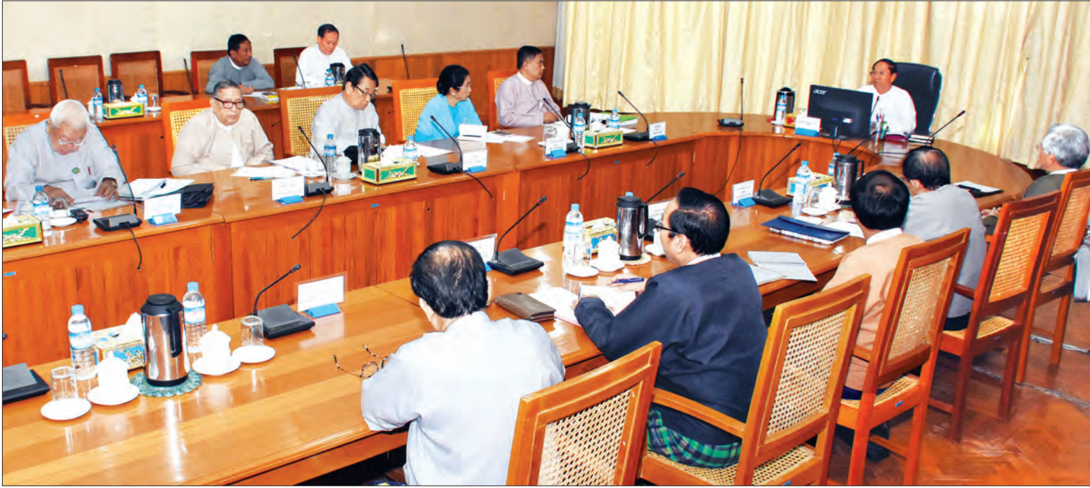
ဒုတိယသမ္မတ ဦးမြင့်ဆွေ ရခိုင်ပြည်နယ် စုံစမ်းစစ်ဆေးရေးကော်မရှင် ပထမအကြိမ်အစည်းအဝေးတွင် အမှာစကားပြောကြားစဉ် (သတင်းစဉ်)