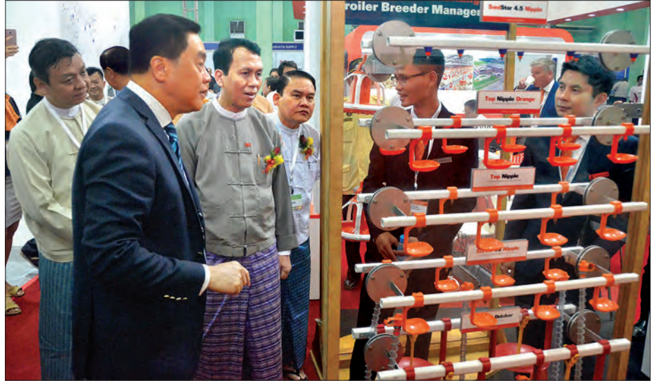
ရန်ကုန် ဒီဇင်ဘာ ၈ - မြန်မာ့အကောင်းဆုံးမွေးမြူရေးလုပ်ငန်း၊ တိရစ္ဆာန်အစာ၊ ဆေးဝါးနှင့်စိုက်ပျိုးရေး လုပ်ငန်းများဆိုင်ရာ နိုင်ငံတကာ ကုန်စည်ပြပွဲကြီးကို ဒီဇင်ဘာ ၇ ရက်က ရန်ကုန်မြို့၊ ဦးဝိစာရလမ်း တပ်မတော် ခန်းမ၌ကျင်းပရာ ရန်ကုန်တိုင်းဒေသကြီး ဝန်ကြီးချုပ် ဦးမြိုးမင်းသိန်း တက်ရောက် ဖွင့်လှစ်ပေးပြီး ပြခန်းများကို လှည့်လည်

ကြည့်ရှုအားပေးခဲ့သည်။ (ဝဲပုံ) အဆိုပါ ပြပွဲကြီးတွင် မွေးမြူရေးလုပ်ငန်းသုံးပစ္စည်းများ၊ တိရစ္ဆာန်အစာနှင့် အစေ့အဆန် အခြောက်ခံစက်များ၊ သိုလှောင်စက်များ၊ တိရစ္ဆာန်ဆေးဝါးများနှင့် အစာကြိုက်စက်များ၊ အစာထုတ်လုပ်ရာ၌ လိုအပ်သော ပစ္စည်းများနှင့်အခြားသော ထုတ်ကုန်မျိုးစုံတို့၏ အဆန်းသစ်ဆုံးနည်းပညာများ ပြသထားသည်။ ယင်းပြပွဲတွင် အမေရိကန်၊ ပြင်သစ်၊ အီတလီ၊ ဂျာမနီ၊ နယ်သာလန်၊ အိန္ဒိယ၊ တရုတ်၊ ဝီယက်နမ်နှင့် ကိုရီးယားနိုင်ငံတို့ အပါအဝင် နိုင်ငံပေါင်း ၁၈ နိုင်ငံမှ ကုမ္ပဏီပေါင်း ၂၀၀ ကျော် လာရောက်ပြသပြီး ပြပွဲကို ဒီဇင်ဘာ ၉ ရက်အထိ လာရောက်လေ့လာကြည့်ရှုနိုင်ကြောင်း သိရသည်။ တင်စိုး(မြန်မာ့အလင်း)