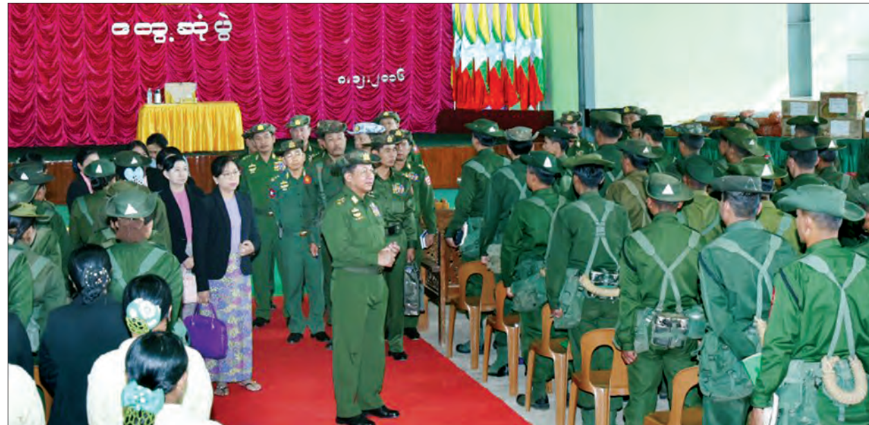
တပ်မတော်ကာကွယ်ရေးဦးစီးချုပ် ဝိုင်းချုပ်မှူးကြီး မင်းအောင်လှိုင် နယ်မြေခံတပ်နယ်မှ အရာရှိ၊ စစ်သည် မိသားစုများအား ရင်းရင်းနှီးနှီးနှုတ်ဆက်စဉ်

ထိုသို့ လွှတ်တော်ဥက္ကဋ္ဌ၏ ပြောကြားမှုအပြီးတွင် ရခိုင်ပြည်နယ် မဲဆန္ဒနယ်အမှတ်(၈)မှ ဦးကျော်ကျော်ဝင်းက အဆိုကို ရုပ်သိမ်းခွင့်ပြုရန် တင်ပြရာ လွှတ်တော်က ခွင့်ပြုခဲ့သည်။ သူရဇော်(သတင်းစဉ်)