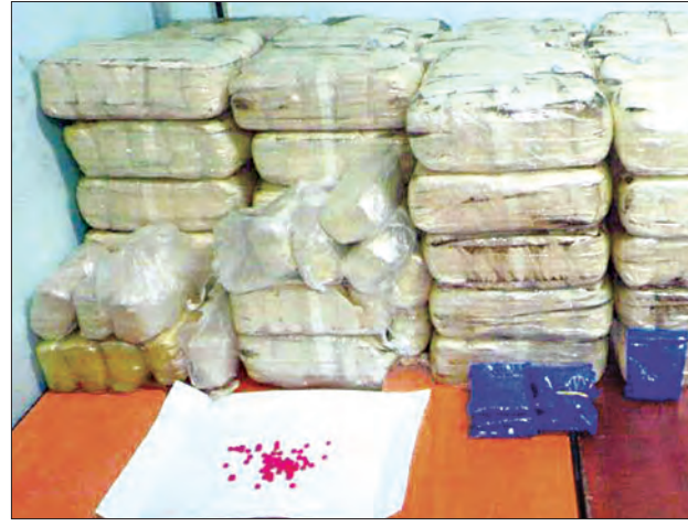
မသင်္ကာသူ လှေတစ်စင်းပေါ်မှ သိမ်းဆည်းရမိသည့် စိတ်ကြွေးသွပ်ဆေးပြားအထုပ်များကို တွေ့ရစဉ်

နေပြည်တော် ဒီဇင်ဘာ ၆ ရခိုင်ပြည်နယ် ရသေ့တောင်မြို့နယ်နှင့် မောင်တောမြို့နယ်များအတွင်း ယမန်နေ့က စိတ်ကြွေးသွပ်ဆေးပြား ကိုးသိန်းကျော် သိမ်းဆည်းရမိခဲ့ကြောင်း နိုင်ငံတော်အတိုင်ပင်ခံရုံး သတင်းထုတ်ပြန်ရေးကော်မတီက သတင်းထုတ်ပြန်ထားသည်။