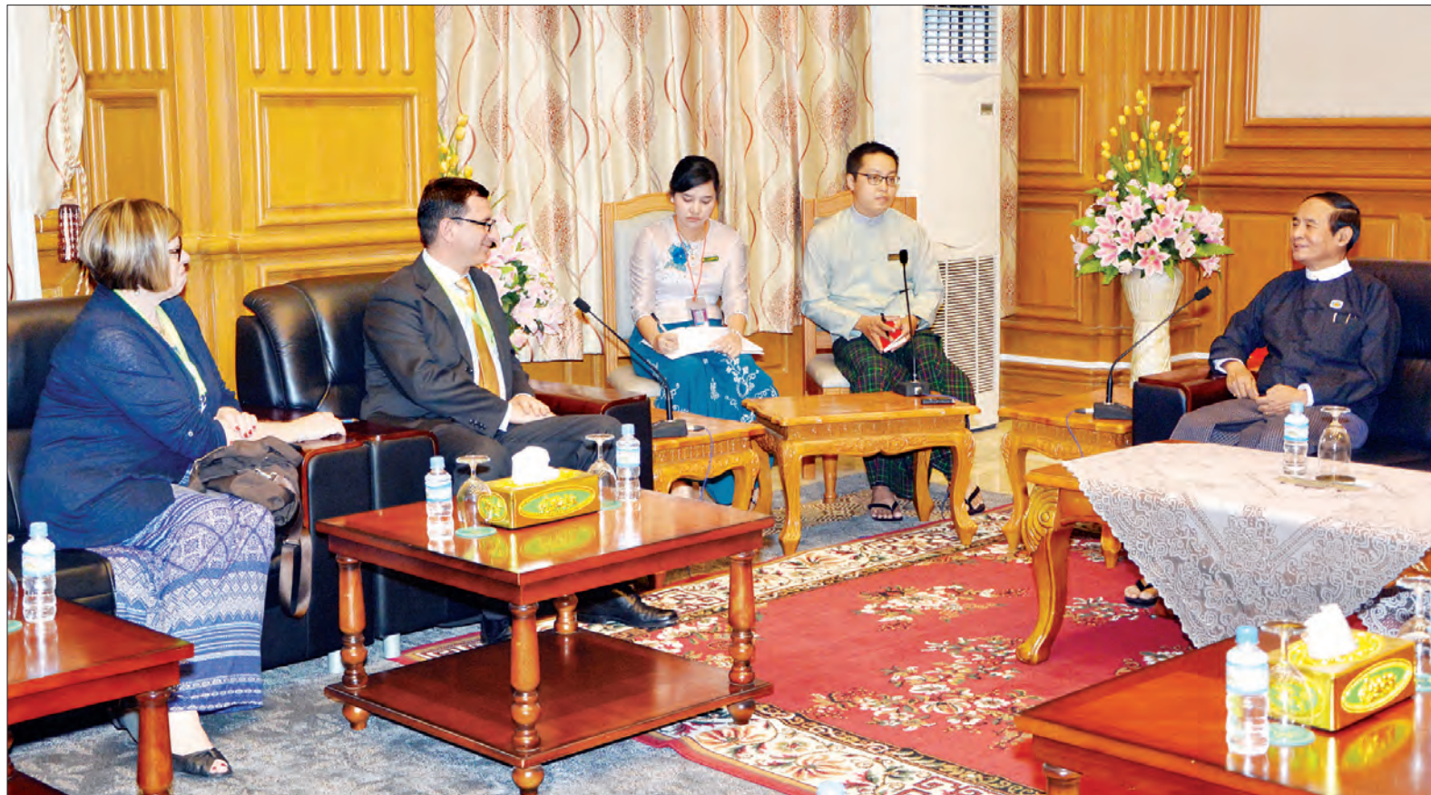
ပြည်သူ့လွှတ်တော်ဥက္ကဋ္ဌ ဦးဝင်းမြိုင်နှင့် National Democratic Institute (NDI) အကြံပေးပုဂ္ဂိုလ်တို့ တွေ့ဆုံဆွေးနွေးစဉ် (သတင်းစဉ်)