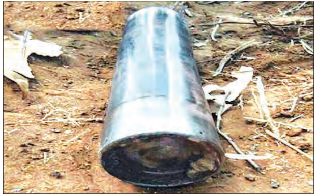
ပေါက်ကွဲမှုမရှိသည့် ဖုံးသီးတစ်လုံးကို တွေ့ရစဉ်

နေပြည်တော် ဒီဇင်ဘာ ၆ ကချင်ပြည်နယ် ပိုင်းမော်မြို့နယ်အတွင်းရှိ တပ်မတော်စစ်ကြောင်းအခြေပြုနေရာများကို ယမန်နေ့ နံနက်ပိုင်းနှင့် မွန်းလွဲပိုင်းတွင် KIA လက်နက်ကိုင်အဖွဲ့က လက်နက်ကြီးများဖြင့် နှောင့်ယှက်ပစ်ခတ်တိုက်ခိုက်ခဲ့ကြောင်း တပ်မတော်ကာကွယ်ရေးဦးစီးချုပ်ရုံးက သတင်းထုတ်ပြန်ထားသည်။ ပိုင်းမော်မြို့နယ်အတွင်း ယမန်နေ့ နံနက်ပိုင်းနှင့် မွန်းလွဲပိုင်းက တပ်မတော်စစ်ကြောင်းအခြေပြုနေရာများကို KIA လက်နက်ကိုင်အဖွဲ့က ၎င်းတို့ ခြေကုပ်ယူထားသည့် ပျိုင့် ၁၀၀၃ စခန်းမှ လက်နက်ကြီးများဖြင့် နှောင့်ယှက်ပစ်ခတ်တိုက်ခိုက်ခဲ့ကြောင်း၊ ၎င်းပစ်ခတ်ခဲ့သည့် ဖုံးသီးများအနက် ပေါက်ကွဲမှုမရှိသည့် ဖုံးသီးများကို တပ်မတော်စစ်ကြောင်းက စစ်ဆေးရာ တစ်ဖက်နိုင်ငံထုတ် ရှော့တိုက်ပစ်ခတ်ရသည့် ၁၀၇ မီလီမီတာ ဖုံးသီးများဖြစ်နိုင်ကြောင်း သိရသည်။ (သတင်းစဉ်)