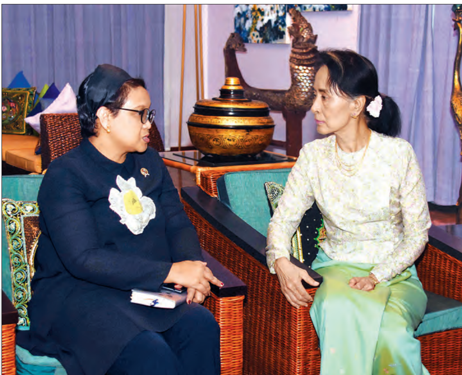
နိုင်ငံတော်၏ အတိုင်ပင်ခံပုဂ္ဂိုလ် ဒေါ်အောင်ဆန်းစုကြည်နှင့် အင်ဒိုနီးရှားနိုင်ငံ နိုင်ငံခြားရေးဝန်ကြီး H.E. Mrs. Retno L. P. Marsudi တို့ တွေ့ဆုံစဉ်