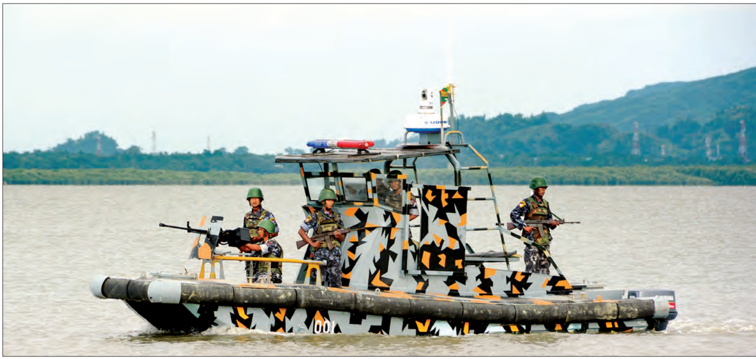
နတ်မြစ်တစ်လျှောက် နယ်ခြားစောင့်ရဲတပ်ဖွဲ့ဝင်များ ပိတ်ဆို့ရှင်းလင်းရေး ဆောင်ရွက်နေစဉ်

ထိုမျှသာမက အကြမ်းဖက်သမားများ ဆုတ်ခွာရာ လမ်းကြောင်းတစ်လျှောက် နယ်မြေရှင်းလင်းရေး ဆောင်ရွက်သော လုံခြုံ ရေးတပ်ဖွဲ့များကိုလည်း အကြမ်းဖက်သမား များက ကျေးရွာများအတွင်း၌ပင် ရွာသား များအသွင်ယူကာ ချုံခိုတိုက်ခိုက်ခြင်းများ ဆက်လက်ပြုလုပ်ရာ လုံခြုံရေးတပ်ဖွဲ့ဝင်အချို့ ထပ်မံထိခိုက်ကျဆုံးကာ လက်နက်ခဲယမ်းအချို့ လည်း ဆုံးရှုံးခဲ့ရပြန်သည်။