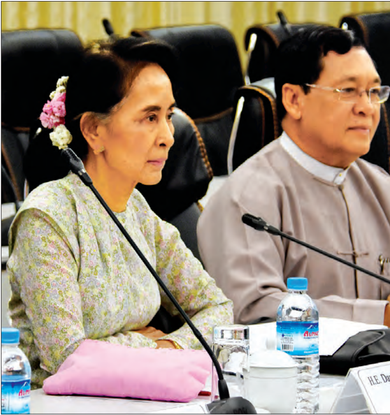
နိုင်ငံတော်၏အတိုင်ပင်ခံပုဂ္ဂိုလ် ဒေါ်အောင်ဆန်းစုကြည်

ရခိုင်ပြည်နယ်၌ လက်ရှိဖြစ်ပေါ်တိုးတက်မှုများ၊ ရေရှည်ဖွံ့ဖြိုး တိုးတက်ရေးနှင့် တည်ငြိမ်အေးချမ်းရေးဆိုင်ရာကိစ္စရပ်များ ဆွေးနွေး