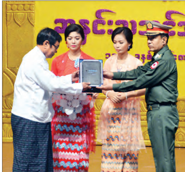
ရန်ကုန်တိုင်းဒေသကြီး လုံခြုံရေးနှင့် နယ်စပ်ရေးရာဝန်ကြီး ဝိုင်းမှူးကြီး တင်အောင်ထွန်း ၂၀၁၅ ခုနှစ်အတွက် စာပေဝိမာန်စာမူဆု (ဝတ္ထုရှည်ဒုတိယဆု) ရရှိသူ တောင်တွင်းကိုရင်ဩအား ဆုပေးအပ်ချီးမြှင့်စဉ် (သတင်းစဉ်)