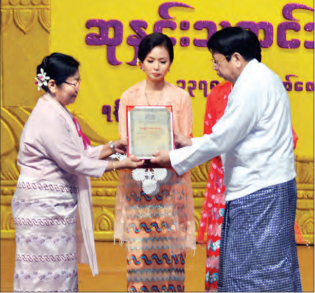
ပြည်ထောင်စုဝန်ကြီး ဒေါက်တာဖေမြင့် ၂၀၁၅ ခုနှစ်အတွက် အမျိုးသားစာပေဆု (စာပဒေသာဆု) ရရှိသူ ဒေါက်တာမခင်မြင့်အား ဆုပေးအပ်ချီးမြှင့်စဉ် (သတင်းစဉ်)

ဆုကို ငွေကျပ် သုံးသိန်းအထိ လည်းကောင်း ထပ်မံတိုးမြှင့်ချီးမြှင့်ခဲ့ကြောင်း သိရသည်။ (သတင်းစဉ်)