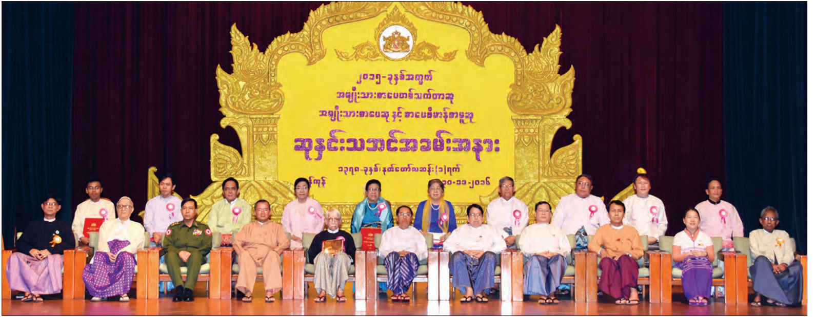
ဒုတိယသမ္မတ ဦးမြင့်ဆွနှင့် အဖွဲ့ဝင်များ ၂၀၁၅ ခုနှစ်အတွက် အမျိုးသားစာပေဆုရရှိသူများနှင့်အတူ စုပေါင်းမှတ်တမ်းတင်ဓာတ်ပုံရိုက်ကြစဉ် (သတင်းစဉ်)

၂၀၁၁ ခုနှစ်မှ ၂၀၁၁ ခုနှစ်အထိ အမျိုးသားစာပေ တစ်သက်တာဆုကို တစ်နှစ်လျှင် စာပေညာရှင်တစ်ဦးကိုသာ ရွေးချယ်ချီးမြှင့်ခဲ့ရာမှ ၂၀၁၂ ခုနှစ်မှစ၍ မြန်မာစာပေ ဖွံ့ဖြိုးတိုးတက်စေရန် ရည်ရွယ်ကာ သုံးဦးအထိ တိုးတက်ချီးမြှင့်