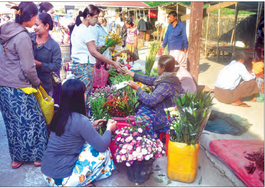
မောင်တောမြို့ ဈေးတန်းတစ်နေရာ၌ ရောင်းဝယ်ဖောက်ကားနေသည်ကိုတွေ့ရစဉ်

နံနက်ပိုင်း အစည်ကားဆုံးနေရာ တစ်နေရာမှာ ဟင်းသီးဟင်းရွက်နှင့် သားငါးဈေးဖြစ်၏။ ဤဈေးတွင် ဒေသခံများ မဖြစ်မနေ ဈေးရောင်းဈေးဝယ်ကြ၏။ လာရောက်ရောင်းချသော ဈေးသည်အများစုမှာ မောင်တောမြို့ပတ်ဝန်းကျင် ကျေးရွာများမှ ဒေသခံတိုင်းရင်းသားများဖြစ်ကြ၏။ ငရုတ်သီး၊ ခရမ်းသီး၊ မန်ကျည်းသီး၊ ကွမ်းသီး၊ ပိန်းဥ အစရှိသော ကုန်စိမ်းများကို လာရောက်ရောင်းချသည်ကို တွေ့ရ၏။ သားငါးဈေးတန်းတွင်