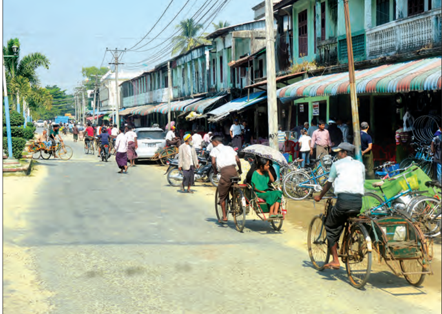
မောင်တောမြို့ ဈေးလမ်း သက်ဝင်လှုပ်ရှားမှုမြင်ကွင်း

အတောအတွင်း အနီးရှိမြို့မကျောင်းတိုက်မှ အမျိုးသမီးတစ်စု၏ပရိတ်ရွတ်ဖတ်သံများကိုလည်းကြားရ၏။ မြို့မဈေး၊ ဟင်းသီးဟင်းရွက်နှင့် သားငါးဈေး ပတ်ဝန်းကျင်တို့တွင် ဈေးရောင်းရေခံပိုင်များ အများဆုံးရောင်းချ၏။ ပင်လယ်ခရု ခုံးတို့ကိုလည်း တွေ့ရ၏။ ဤပျံကျဈေးလေးသည် နံနက်ပိုင်းတွင် အထူးစည်ကားသော နေရာတစ်နေရာပင်ဖြစ်၏။