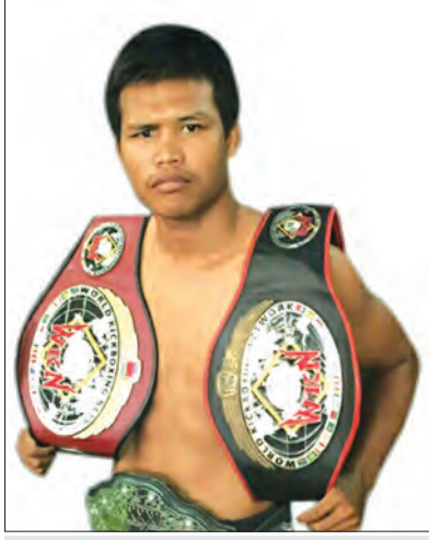
ပက်ထွန်ဆူစာကော (ထိုင်း)