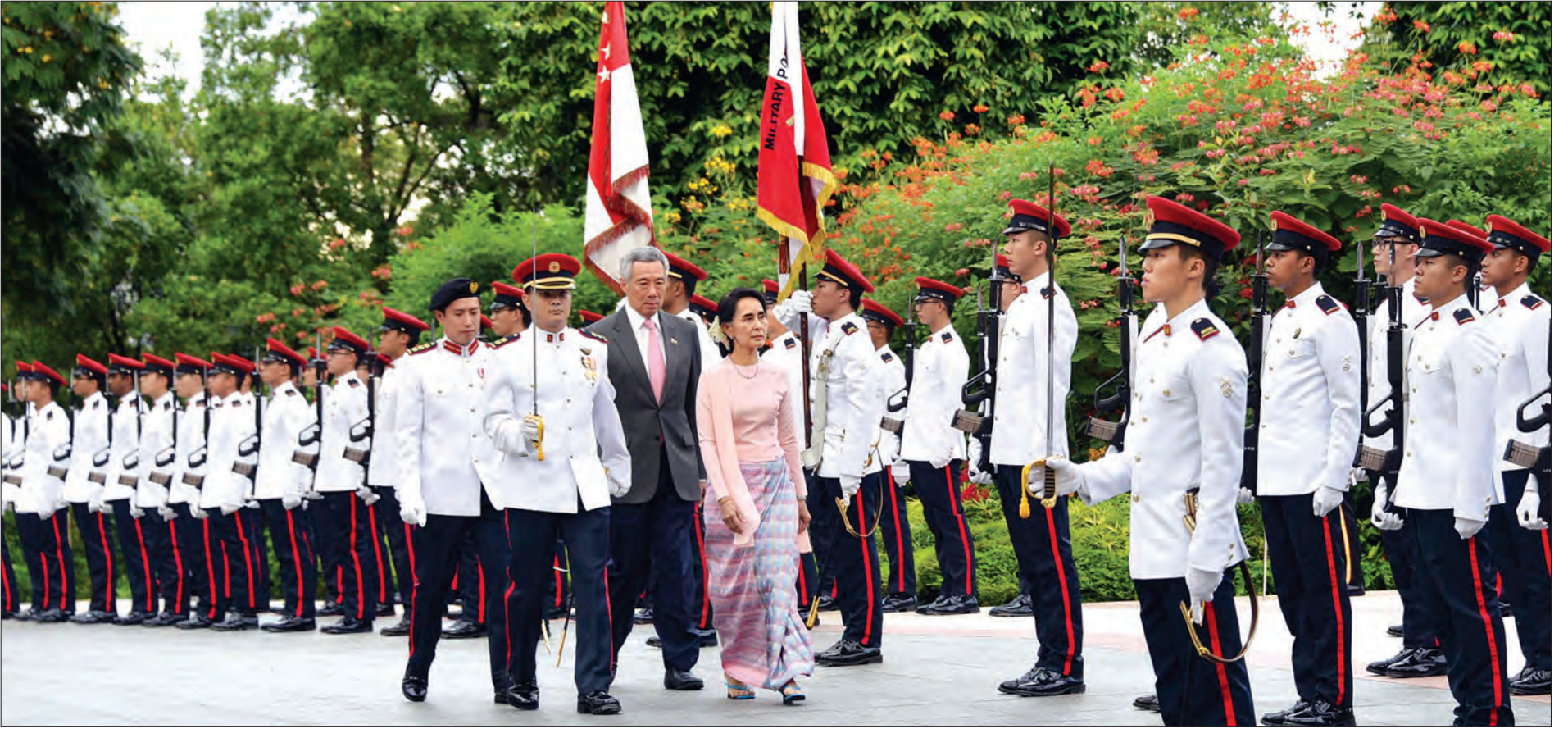
နိုင်ငံတော်၏ အတိုင်ပင်ခံပုဂ္ဂိုလ် ဒေါ်အောင်ဆန်းစုကြည် စင်ကာပူနိုင်ငံဝန်ကြီးချုပ်နှင့်အတူ ဂုဏ်ပြုတပ်ဖွဲ့အား စစ်ဆေးစဉ်