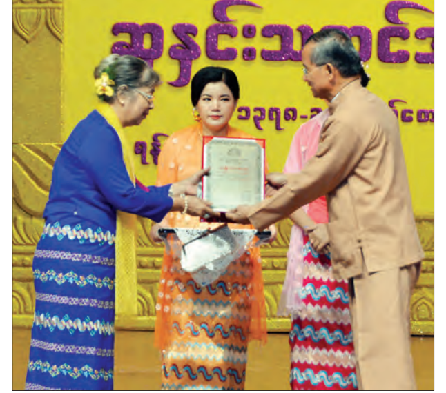
ပြည်ထောင်စုဝန်ကြီး ဦးအုန်းမောင် ၂၀၁၅ ခုနှစ်အတွက် အမျိုးသားစာပေဆု (သုတပဒေသာ (အသုံးချသိပ္ပံ) စာပေဆု) ရရှိသူ ဒေါက်တာခင်မျိုးဟန် (ကလေးအထူးကုဆရာဝန်ကြီး) အား ဆုပေးအပ်ချီးမြှင့်စဉ် (သတင်းစဉ်)