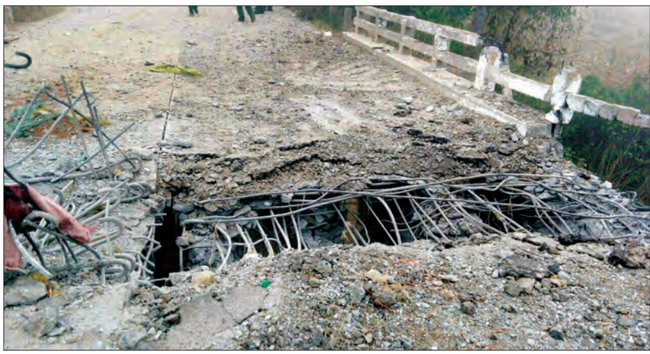
KIA / TNLA လက်နက်ကိုင်အဖွဲ့များ ဖောက်ခွဲဖျက်ဆီးခဲ့သည့် မူဆယ်မြို့၊ ဆွမ်လုံကျေးရွာအနီးရှိ တံတားအဖွဲ့ရေစဉ်

KIA / TNLA လက်နက်ကိုင်ပူးပေါင်း အဖွဲ့သည် ယနေ့နံနက် ၃ နာရီခွဲခန့်က မူဆယ်မြို့၊ ဆွမ်လုံကျေးရွာအနီးရှိ တံတားကို ဖောက်ခွဲဖျက်ဆီး၍ တပ်မတော်ယာဉ်တန်းအား လက်နက်ကြီး၊ လက်နက်ငယ်များဖြင့် ပစ်ခတ်တိုက်ခိုက်ခဲ့ကြောင်း တပ်မတော်ကာကွယ်ရေးဦးစီးချုပ်ရုံးမှ သတင်းထုတ်ပြန်သည်။