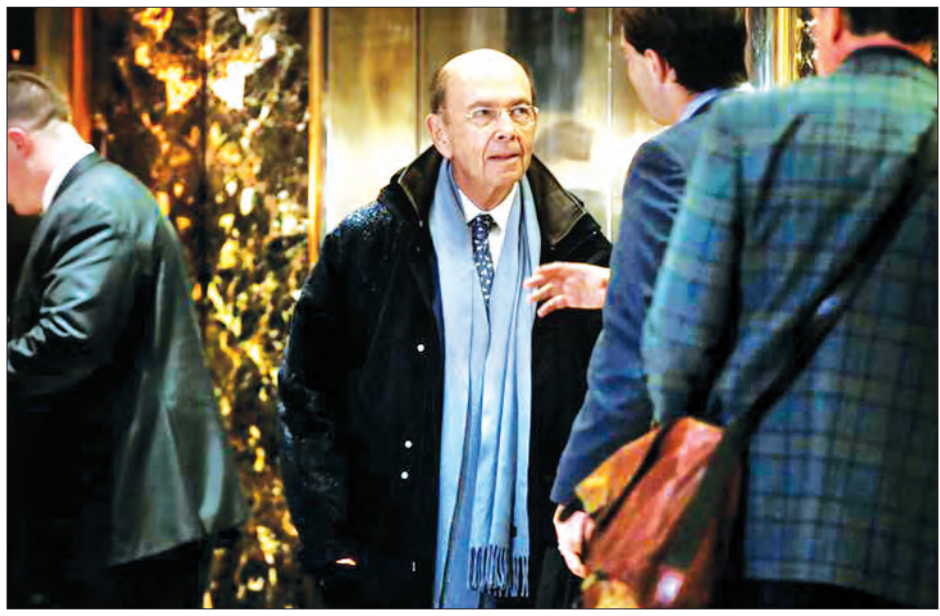
ကုန်သွယ်ရေးဝန်ကြီးအဖြစ် အမည်စာရင်းတင်သွင်းခံထားရသူ ဝယ်လ်ဘာရီစ်ကိုတွေ့ရစဉ်