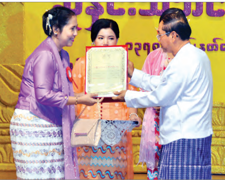
ဒုတိယသမ္မတ ဦးမြင့်ဆွေ ၂၀၁၅ ခုနှစ်အတွက် အမျိုးသားစာပေ တစ်သက်တာဆုရ ဆရာကြီး ဦးဝင်းမွန် (တက္ကသိုလ် ဝင်းမွန်) ကိုယ်စား သမီးဖြစ်သူ ဒေါက်တာ လွင်လွင်မွန်အား ဆုပေးအပ်ချီးမြှင့်စဉ်

မုဒိတာပွားကြရ ယနေ့ကျင်းပသည့် အခမ်းအနား သည် စာပေပညာရှင်ကြီးများ၏ ဝါသနာ ပေါ်တွင် စေတနာထပ်ဆင့်ပြီး စာပေ ဂုဏ်မြှင့်တင်နိုင်ခဲ့ကြ၍ စာပေတာဝန် ကျေပွန်ခဲ့ကြ၍ နိုင်ငံတော်ကဆုချီးမြှင့် ဂုဏ်ပြုသည့် အခမ်းအနားဖြစ်သော ကြောင့် ကာယကံရှင် စာပေပညာရှင်ကြီး များနည်းတူ မိမိတို့လည်း ဝမ်းမြောက် ဝမ်းသာ မုဒိတာပွားကြရပါကြောင်း။