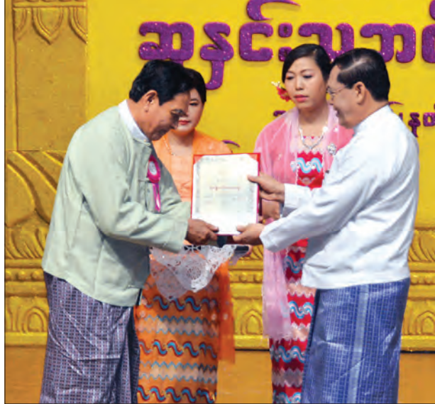
ပြည်ထောင်စုဝန်ကြီး ဦးသိန်းဆွေ ၂၀၁၅ ခုနှစ်အတွက် အမျိုးသားစာပေဆု (မြန်မာ့ယဉ်ကျေးမှုနှင့် အနုပညာဆိုင်ရာစာပေဆု) ရရှိသူ သုတေသီမောင်မောင်အား ဆုပေးအပ်ချီးမြှင့်စဉ် (သတင်းစဉ်)