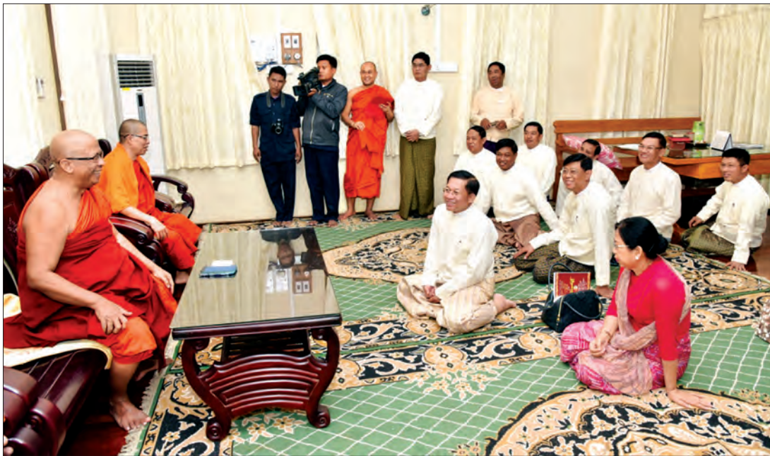
တပ်မတော်ကာကွယ်ရေးဦးစီးချုပ် ဝိုင်းချုပ်မှူးကြီး မင်းအောင်လှိုင်နှင့်ဇနီး ဒေါ်ကြူကြူလှ မစိုးရိမ်တိုက် သဒ္ဓမ္မနယူပဒေသကျောင်းတိုက်ဆရာတော် နိုင်ငံတော်ဩဝါဒါစရိယ အဘိဓမ္မတာရဋ္ဌဂုရု ဘဒ္ဒန္တပဒုမာဘိဝံသထံမှ ဩဝါဒခံယူစဉ်

ယနေ့ကျင်းပသည့် လှူဒါန်းပွဲ၌ မစိုးရိမ်တိုက်သစ်ကျောင်းတိုက်ရှိ သံဃာတော်များအတွက် ဆွမ်းဆန် တော် အိတ် ၈၀၊ ဆီပိဿာ ၂၀၀၊ ဆား၊ အာလူး၊ ကြက်သွန်များ၊ လှူဖွယ်ပစ္စည်းများနှင့် အလှူငွေကျပ် သိန်း ၁၀၀ တို့ကို လှူဒါန်းခဲ့ကြောင်း သတင်းရရှိသည်။ (သတင်းစဉ်)