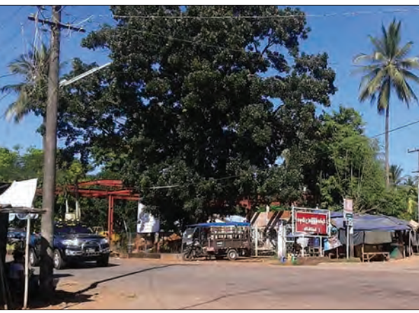
ထို့ကြောင့် မီးဘေးအန္တရာယ်ကြိုတင်ကာကွယ်ရေးအတွက် ယခုတည်ဆောက်ဆဲ ကာလတွင် စက်သုံးဆီအရောင်းဆိုင် ဖွင့်လှစ်ရောင်းချရန် အဆောက်အအုံများ တည်ဆောက်နေခြင်းအား သက်ဆိုင်ရာမှ လိုအပ်သလိုဆောင်ရွက်ပေးစေလိုကြောင်း ရပ်ကွက်အတွင်းမှ ပြည်သူများက ပြောကြားကြောင်း သိရသည်။ ခွန်(ဝင်းပ)

မွန်ပြည်နယ် သထုံမြို့နယ် သုဝဏ္ဏဝတီမြို့ သိမ်ဆိပ်ရပ်ကွက် အခြေခံပညာအထက်တန်းကျောင်း(သိမ်ဆိပ်)ရှေ့ ရန်ကုန်-မော်လမြိုင်အဝေးပြေးကားလမ်းမကြီးဘေး၌ အဝေးပြေးလမ်းနယ်နိမိတ်နှင့် မလွတ်ကင်းဘဲ စက်သုံးဆီအရောင်းဆိုင် ဖွင့်လှစ်ရောင်းချနေမှုအတွက် အဆောက်အအုံများ တည်ဆောက်နေသဖြင့် ရပ်ကွက်နေပြည်သူများက မီးဘေးအန္တရာယ် ကျရောက်လာမည့် အရေးကို တွေးဆကာ စိုးရိမ်ပူပန်နေလျက် ရှိကြသည်။ စက်သုံးဆီအရောင်းဆိုင် တည်ဆောက်နေသည့် မြေနေရာသည် အဝေးပြေးလမ်းမကြီး တိုးချဲ့တည်ဆောက်ရာတွင် အခက်အခဲရှိလာနိုင်ခြင်း၊ မြို့အတွင်းဖြစ်နေ၍ ကျဉ်းမြောင်းသော လမ်းလေးခွဆုံရာနေရာဖြစ်ခြင်း၊ မကြာခဏလမ်းပိတ်ဆိုမှုများ ဖြစ်ပွားနေခြင်း၊ လူနေအဆောက်အအုံများနှင့် နီးကပ်စွာ တည်ရှိနေခြင်းတို့ကြောင့်လည်း ကောင်း၊ အဆိုပါဆိုင်တည်နေရာက လူနေရပ်ကွက်အတွင်းဖြစ်နေ၍သော်လည်း ကောင်း၊ အဆိုပါစက်သုံးဆီ အရောင်းဆိုင်ကို ရပ်ကွက်နှင့်ဝေးရာသို့ ရွှေ့ပြောင်းပေးရန် ဒေသခံပြည်သူများက ဆန္ဒရှိကြပါသည်။ ထို့အပြင်စက်သုံးဆီဆိုင်ဆောက်လုပ်နေသည့် မြေနေရာသည် မြို့နယ်ဆောက်လုပ်ရေးဝန်ကြီးဌာန (လမ်းဦးစီး)က တာဝန်ယူတည်ဆောက်နေသော သိမ်ဆိပ်-ဝီယော-လေးကေ (မြို့နယ်ချင်းဆက်လမ်း)၏ လမ်းနယ်နိမိတ်နှင့်လည်း မလွတ်ကင်းကြောင်း လမ်း/ဦးစီးမှ တာဝန်ရှိသူတစ်ဦးက ပြောပြမှုအရ သိရသည်။