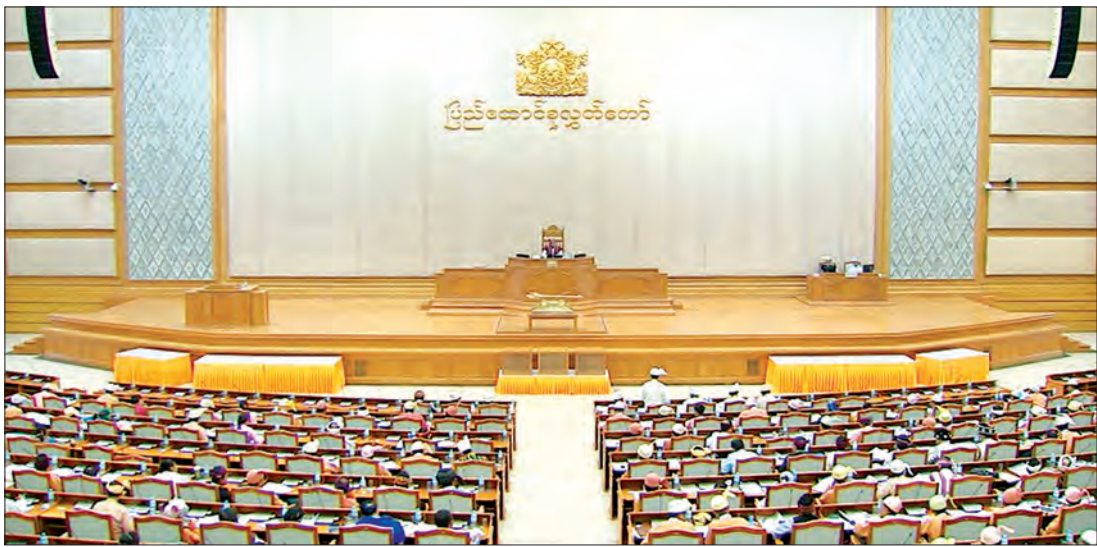
ဒုတိယအကြိမ် ပြည်ထောင်စု လွှတ်တော် တတိယ ပုံမှန် အစည်းအဝေး ပဌမနေ့ ကျင်းပစဉ်

စိုက်ပျိုးရေး၊ မွေးမြူရေးနှင့်ဆည်မြောင်းဝန်ကြီးဌာန ပြည်ထောင်စုဝန်ကြီး ဒေါက်တာအောင်သူက ဂျပန်အပြည်ပြည်ဆိုင်ရာ ပူးပေါင်းဆောင်ရွက်ရေးအဖွဲ့၏ ချေးငွေ ဂျပန်ယန်း ၁၅၀၀၀ သန်းကို လယ်ယာကဏ္ဍနှင့် ကျေးလက်ဒေသ ဖွံ့ဖြိုးရေး