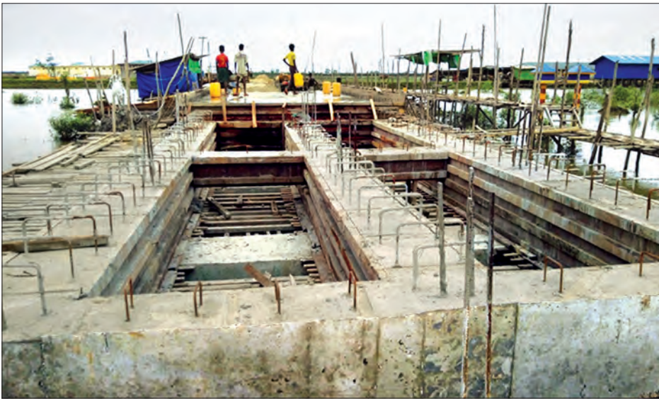
ကညင်ချောင်း ကုန်သွယ်ရေးဇုန် တည်ဆောက်လျက်ရှိသည့် ဆောက်လုပ်ရေးလုပ်ငန်းခွင်တစ်ခုကို တွေ့ရစဉ်

ဒုတိယအဆင့်အနေဖြင့် နိုင်ငံတော်အစိုးရက ခွင့်ပြုပေးမည့် ငွေကျပ် သိန်းပေါင်း ၂၅၀၀၀ ဖြင့် ဧက ၅၀ ခန့်ရှိ ကုန်သွယ်ရေးဇုန်ကို အုတ်မြစ်စည်းရိုးခတ်ခြင်း၊ ကုန်သွယ်ရေးဇုန်သို့ သွားရောက်မည့် သီးခြားလမ်း ၁ ဒေသ ၆ မိုင် ဖောက်လုပ်မည်ဖြစ်ပြီး ကုန်သွယ်ရေးဇုန်အတွင်း ပတ်လမ်းတစ်ခုဖောက်လုပ်ခြင်း၊ လုံခြုံရေးအဆောက်အအုံနှင့် သန့်စင်ခန်းများလည်း ပါဝင်မည်ဖြစ်