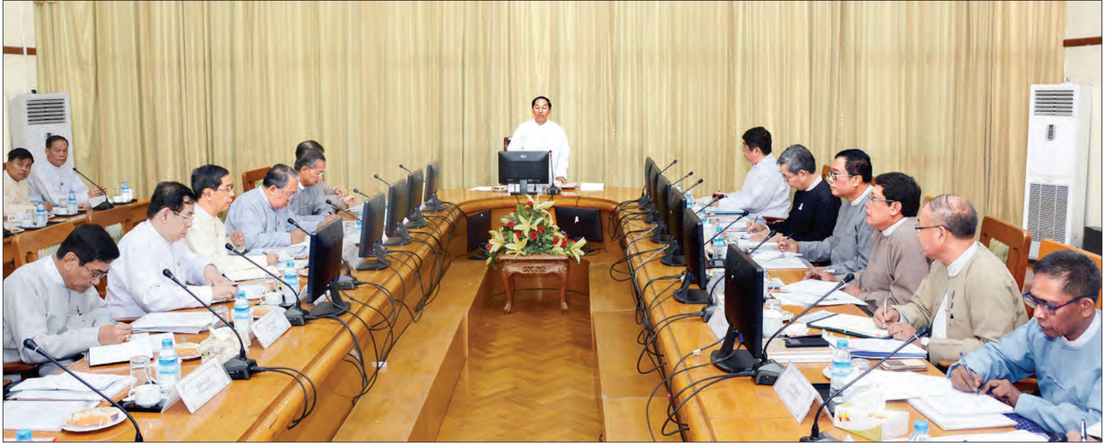
ဒုတိယသမ္မတ ဦးမြင့်ဆွေ ပုဂ္ဂလိကကဏ္ဍဖွံ့ဖြိုးတိုးတက်ရေးကော်မတီ၏ ပထမအကြိမ်အစည်းအဝေးတွင် အမှာစကားပြောကြားစဉ် (သတင်းစဉ်)

နေပြည်တော် နိုဝင်ဘာ ၂၀ ပုဂ္ဂလိကကဏ္ဍ ဖွံ့ဖြိုးတိုးတက်ရေး လုပ်ငန်းစီမံချက်ကို လုပ်ငန်းကော်မတီများအနေဖြင့် တက်ညီလက်ညီ ပူးပေါင်း အကောင်အထည်ဖော် ဆောင်ရွက်ကြမည်ဆိုပါက ပုဂ္ဂလိကကဏ္ဍဖွံ့ဖြိုးတိုးတက်ရေးကို သိသာစွာ အထောက်အကူပြုနိုင်မည်ဖြစ်ပြီး တိုင်းပြည်၏ စီးပွားရေးဖွံ့ဖြိုးတိုးတက်မှုကိုပါ ဖော်ဆောင်နိုင်မည်ဖြစ်ကြောင်း ပုဂ္ဂလိကကဏ္ဍဖွံ့ဖြိုးတိုးတက်ရေးကော်မတီဥက္ကဋ္ဌ ဒုတိယသမ္မတ ဦးမြင့်ဆွေက ပြောကြားသည်။ နေပြည်တော်ရှိ စီးပွားရေးနှင့် ကူးသန်းရောင်းဝယ်ရေး ဝန်ကြီးဌာန အစည်းအဝေးခန်းမ၌ ယနေ့နံနက် ၁၀ နာရီကကျင်းပသည့် ပုဂ္ဂလိကကဏ္ဍဖွံ့ဖြိုးတိုးတက်ရေးကော်မတီ၏ ပထမအကြိမ်အစည်းအဝေးတွင် ဒုတိယသမ္မတက ထိုသို့ပြောကြားခဲ့ခြင်းဖြစ်သည်။ စာမျက်နှာ ၄ ကော်လံ ၁ ●