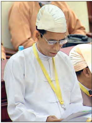
ပြည်ထောင်စုဝန်ကြီး ဒေါက်တာအောင်သူ

နေပြည်တော် နိုဝင်ဘာ ၂၈ ယနေ့ကျင်းပသည့် ပြည်သူ့လွှတ်တော် တတိယပုံမှန်အစည်းအဝေး သတ္တမနေ့တွင် လွှတ်တော်ကိုယ်စားလှယ်များက လယ်ယာစိုက်ပျိုးရေးနှင့် ဆည်မြောင်းကဏ္ဍဆိုင်ရာ မေးခွန်း ခုနစ်ခုမေးမြန်းပြီး စိုက်ပျိုးစရိတ်ထုတ်ချေးခြင်းဆိုင်ရာ အဆို ၁ ခု တင်သွင်းသည်။