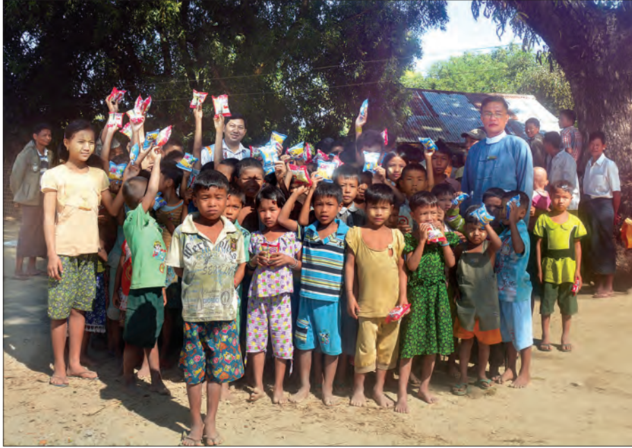
ရန်အောင်မြင်ကျေးရွာမှ ကလေးငယ်များနှင့် ထောက်ပံ့ရေးအဖွဲ့တို့ အတူတကွတွေ့ရစဉ်

ညနေပိုင်းတွင် ကျွန်တော်တို့အဖွဲ့သည် ခမောင်းဆိပ်မြို့မှ ပြန်လည်ထွက်ခွာလာခဲ့သည်။ နေဝန်းနီကြီးသည် အနောက်ဂေါယာကျွန်းသို့ ယွန်းလေပြီး မော်တော် ယာဉ်တန်းမှာ ရွှေဝါရောင်စပါးခင်းများကို တစ်ရိပ်ဖြတ်ကျော်ကာ အရှိန်အဟုန်ဖြင့် ပြေးလွှားနေသည်။ ဗျိုင်းတစ်အုပ်သည် မေယုတောင်တန်းဆီသို့ အိပ်တန်းတက်ရန် ပျံသန်းသွားသည်။ လယ်တောပြန်တောင်သူများကို ရွာအဝင်လမ်းတွင် တွေ့ရသည်။ ဟိုအဝေးဆီ စေတီမှ ဆည်းလည်းသံ တချွင်ချွင်မြည်သံကိုလည်း ကြားလိုက်ရသည်။ မောင်တောဒေသမှ ကျေးရွာများတွင် ဒေသခံတိုင်းရင်းသားများရော အခြားဘာသာဝင်များပါ ငြိမ်းချမ်းစွာ အတူယှဉ်တွဲနေထိုင်သွားမည်ဆိုပါက ရာသီဥတုမျှတပြီး စိုက်ပျိုးမြေကောင်းများစွာ အလျှအပယ်ရှိ နေသည့်အတွက် တည်ငြိမ်အေးချမ်းပြီး အလျင်အမြန်ဖွံ့ဖြိုးတိုးတက်လာမည်ဟု ယုံကြည်မိပါကြောင်း။ ။