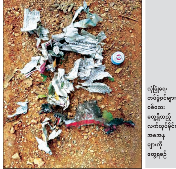
လုံခြုံရေး တပ်ဖွဲ့ဝင်များ စစ်ဆေး တွေ့ရှိသည့် လက်လုပ်မိုင်း အစအန များကို တွေ့ရစဉ်

ကွတ်ခိုင်မြို့နယ် မုံးယားရွာအနီး မုံးကိုး-မုံးစီး လမ်းဟောင်းပေါ်ရှိ အရှည်ပေ ၄၀ ၊ အကျယ် ၁၂ ပေရှိ ကျောက်စိတ်တားအား KIA, TNLA, MNDAA လက်နက် ကိုင်အဖွဲ့များက နိုဝင်ဘာ ၂၆ ရက် ည ၉ နာရီခန့်က မိုင်းခွဲဖျက်ဆီးခဲ့ကြောင်း နိုင်ငံတော် အတိုင်ပင်ခံရုံး သတင်းထုတ်ပြန်ရေးကော်မတီက သတင်းထုတ်ပြန်ထားသည်။ အဆိုပါ တံတား မိုင်းခွဲဖျက်ဆီးခံရမှုကြောင့် ပျက်စီးခဲ့ရာ လတ်တလောဖြတ်သန်း သွားလာ၍မရသေးကြောင်း သိရသည်။ (သတင်းစဉ်)