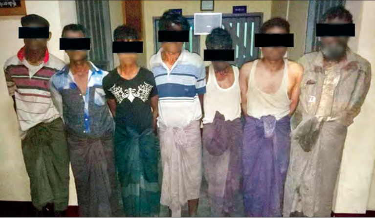
မောင်တောမြို့နယ်တွင် နယ်မြေရှင်းလင်းစဉ် မသင်္ကာ၍ ဖမ်းဆီးရမိသူ အချို့