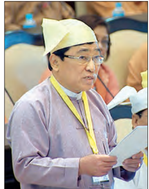
ပြည်ထောင်စုဝန်ကြီး ဒေါက်တာဝင်းမြတ်အေး

များမှ အခန်းမလုံလောက်မှုများ တင်ပြလာပါက အခန်းတိုးချဲ့ ဆောက်လုပ်နိုင်ရန် ပြည်နယ်အစိုးရ သက်ဆိုင်ရာဌာနများ၊ UNHCR, NGOs, INGOs များနှင့် ညှိနှိုင်းဆောင်ရွက်ပေးသွားမည် ဖြစ်ပါကြောင်း၊ ကချင်ပြည်နယ်အတွင်းရှိ စစ်ရှောင်စခန်းများသို့ ရိက္ခာထောက်ပံ့ပေးမှုများကို အမျိုးသား သဘာဝဘေးအန္တရာယ်ဆိုင်ရာ စီမံခန့်ခွဲမှုရန်ပုံငွေမှ ဆက်လက်ထောက်ပံ့သွားမည်ဖြစ်ပါကြောင်း၊ နေရာချထားဆောင်ရွက်နိုင်ရန်နှင့် အလုပ်အကိုင်အခွင့်အလမ်း ဖန်တီးပေးနိုင်ရန် အတွက်လည်း ပြည်နယ်အစိုးရအဖွဲ့နှင့် ပူးပေါင်း၍ ငွေကြေးရင်းနှီးမြှုပ်နှံ ဆောင်ရွက်သွားမည် ဖြစ်ပါကြောင်း၊ စစ်ရှောင်စခန်းမှ ပြောင်းရွှေ့နေထိုင်သူများအား ငွေပျော်စံပြကျေးရွာ၌ နေရာချထားပေးသည့်အပြင် အခြားနေရာများ၌လည်း ထပ်မံတိုးချဲ့နိုင်ရေးအတွက် ပြည်နယ်အစိုးရအဖွဲ့နှင့် ပူးပေါင်းဆောင်ရွက်သွားမည်ဖြစ်ပါကြောင်း ဖြေကြားသည်။