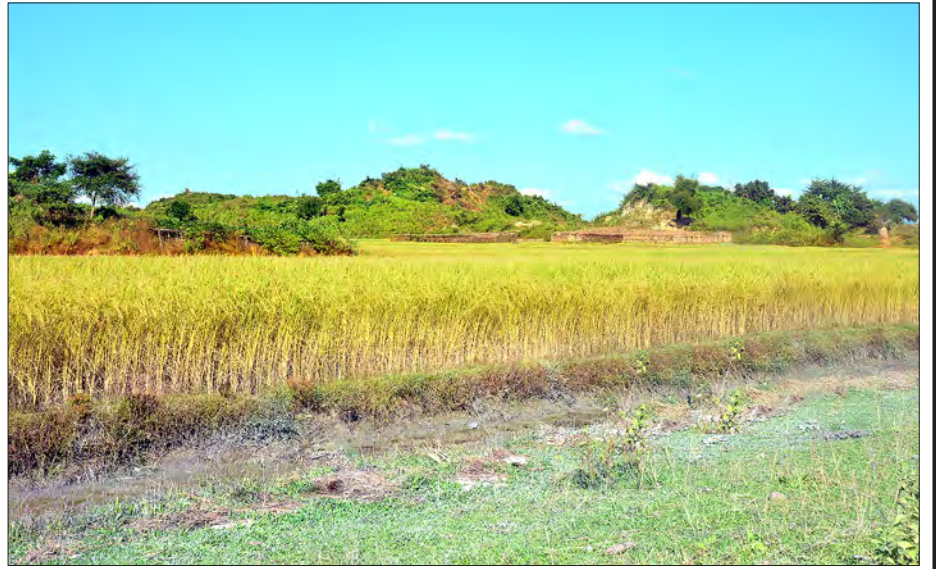
မောင်တောခရိုင် မြောက်ပိုင်း ခမောင်းဆိပ်မြို့၊ မင်းခမောင်းကျေးရွာအနီးမှ မရိတ်သိမ်းရသေးသည့် စပါးခင်းများကို တစ်မျှတစ်ခေါ် တွေ့ရစဉ်

စပါးရိတ်သိမ်းပြီး လယ်ကွင်းများတွင် ကျွဲ၊ နွား၊ ဆိတ်တို့ လွှတ်ကျောင်းထားသည်ကိုလည်း တွေ့ရသည်။ နွားများမှာ နွားနီ၊ နွားနက်တို့ အများဆုံးတွေ့ရပြီး နွားဖြူ၊ နွားပြာတို့ကို တွေ့ရခဲ့၏။ သို့သော် နွားများမှာ ခိုင်းနွားမဟုတ်သည့် အလျောက် အထက်အညာဒေသတွင် တွေ့ရသည့် နွားများကဲ့သို့ ထွားကျိုင်းမှုမရှိပေ။ ဆိတ်များမှာလည်း ထိုနည်းလည်း