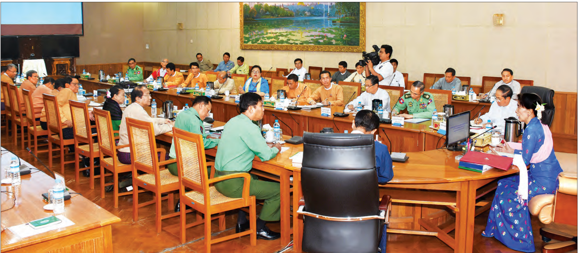
နေပြည်တော် နိုဝင်ဘာ ၂၈

နယ်စပ်ဒေသနှင့် တိုင်းရင်းသားလူမျိုးများ၏ ဖွံ့ဖြိုးတိုးတက်မှု အကောင်အထည်ဖော်ရေးပဟိုက်မတီညှိနှိုင်းစည်းဝေး