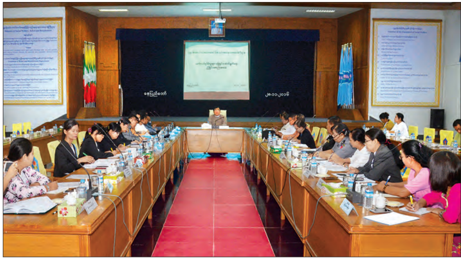
ရေဆိပ်စသည့်နေရာများတွင် အသိပညာပေးဆိုင်ရာတိုက်ရိုက်ထုတ်ဖော်ခြင်း၊ လက်ကမ်းစာစောင်များ ဖြန့်ဝေခြင်းများဆောင်ရွက်သွားရန်၊ အဆိုပါသက်ငယ်မုဒိမ်းမှုကျူးလွန်သူများကို ထောင်ဒဏ် နှစ် ၂၀ အထိ ပြစ်ဒဏ်ပေးနိုင်ကြောင်း သိရှိစေရန် အသိပညာပေးကြရန် ဆွေးနွေးဆုံးဖြတ်ပြီး ရေရှည်ဆောင်ရွက်ရမည့်ကိစ္စများကို ဆက်လက်အကောင်အထည်ဖော်ကြရန် ဆုံးဖြတ်ခဲ့ကြသည်။ (သတင်းစဉ်)

သက်ငယ်မုဒိမ်းမှုများသည် ဖြစ်စဉ်များအရကျေးလက်ဒေသများတွင် အများဆုံးဖြစ်ပွားလျက်ရှိသကဲ့သို့ မြို့များတွင်လည်း မြို့ရွာရပ်ကွက်များ၌ အများဆုံးဖြစ်ပွားလျက်ရှိနေသည်။ သို့ဖြစ်၍ သက်ငယ်မုဒိမ်းမှုများပပျောက်စေရေးအတွက် ရေတို၊ ရေရှည် လုပ်ငန်းစဉ်များချမှတ်ဆောင်ရွက်ရန်နှင့် ကျေးရွာများအထိ အသိပညာပေးလုပ်ငန်းများကိုအုပ်ချုပ်ရေးအဖွဲ့များ၊ လူမှုဝန်ထမ်းဦးစီးဌာန၊ ပြည်သူ့ကျန်းမာရေး ဦးစီးဌာနများနှင့် လူမှုအဖွဲ့အစည်းများပူးပေါင်းဆောင်ရွက်ပေးခြင်း၊ လူစည်ကားရာ ဈေး၊ ကားဂိတ်၊