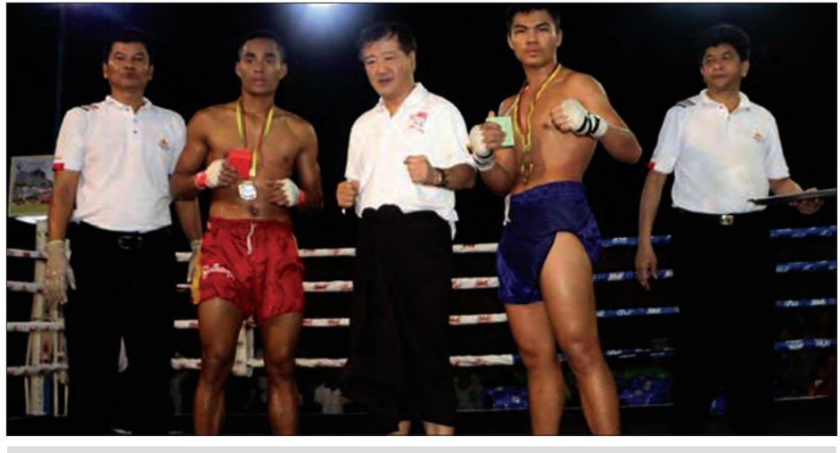
အပြည်ပြည်ဆိုင်ရာလက်ဝှေ့အဖွဲ့ချုပ် ILF ၏ အရှေ့အာရှဥက္ကဋ္ဌ ဗမာ့စာပေအဖွဲ့ချုပ် မျိုးဆက်သစ်လက်ဝှေ့ကျော်များ