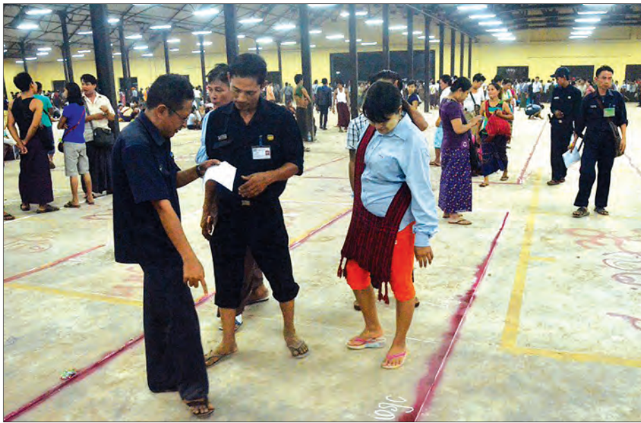
ပျံကျဈေးသည်များကို ယာယီပြန်လည်နေရာချထားပေးစဉ်