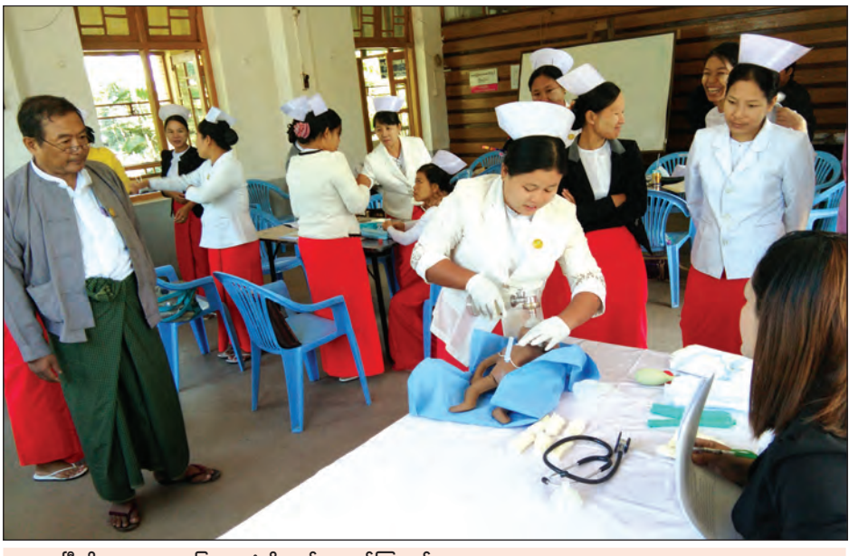
မွေးဖွားပြီးခါစကလေးအား ပြုစုပေးပုံကို လက်တွေ့သင်ကြားစဉ်