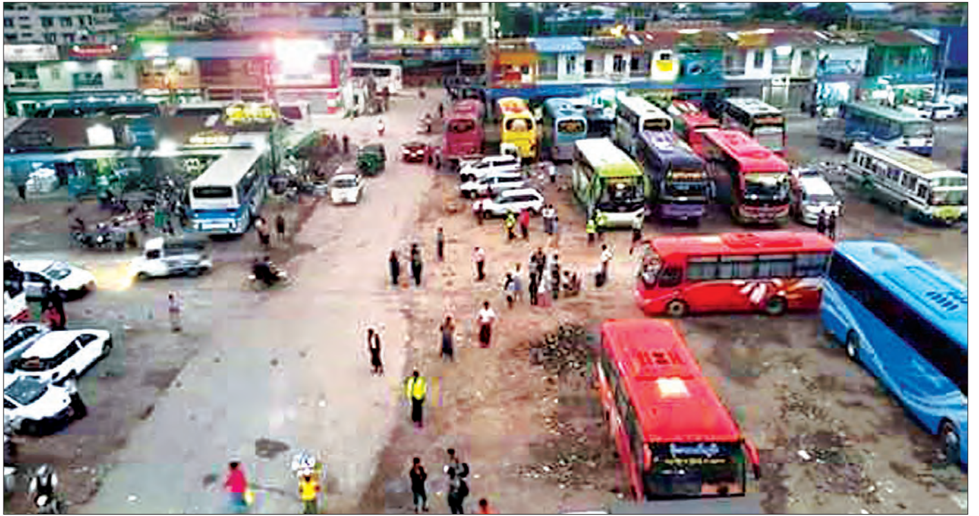
မန္တလေးမြို့ ချမ်းမြေ့ပြည်ယာဉ်ရပ်နားစခန်း(ကျွဲဆည်ကန်ကားကွင်း)ကို တွေ့ရစဉ်