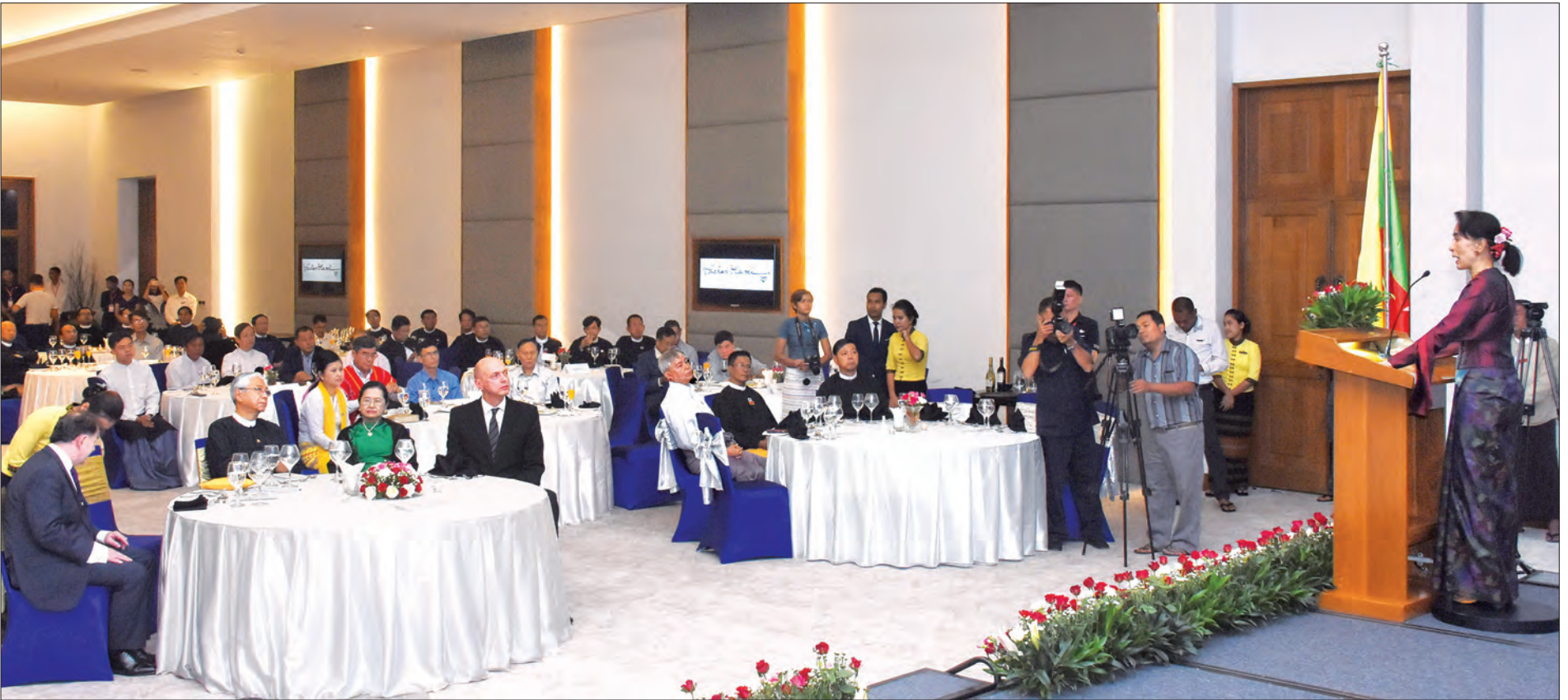
နိုင်ငံတော်၏အတိုင်ပင်ခံပုဂ္ဂိုလ် ဒေါ်အောင်ဆန်းစုကြည် ချက်သမ္မတနိုင်ငံသမ္မတဟောင်း မစ္စတာ ဟားစလပ် ဟာပယ်လ်၏ အကြိမ်(၈၀)မြောက် နှစ်ပတ်လည်မွေးနေ့အထိမ်းအမှတ်အခမ်းအနားတွင် အမှတ်တရစကားပြောကြားစဉ် (သတင်းစဉ်)

နေပြည်တော် နိုဝင်ဘာ ၁၇ ချက်သမ္မတနိုင်ငံ သမ္မတဟောင်း မစ္စတာ ဟားစလပ် ဟာပယ်လ်၏ အကြိမ်(၈၀)မြောက် နှစ်ပတ်လည်မွေးနေ့အထိမ်းအမှတ် အခမ်းအနား (80 th Anniversary of Birth of the Former Czech President , Mr. Vaclav Havel) ကို နေပြည်တော်ရှိ The Lake Garden Hotel , Irrawaddy Ballroom ၌ ယနေ့ညနေ ၆ နာရီခွဲတွင် ကျင်းပရာ ပြည်ထောင်စု သမ္မတမြန်မာနိုင်ငံတော် နိုင်ငံတော်သမ္မတ ဦးထင်ကျော်နှင့်ဇနီး ဒေါ်စုစုလွင်တို့ တက်ရောက်သည်။