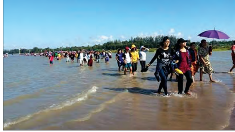
ရေးမြို့နယ်အတွင်း ကမ်းခြေတစ်ခုတွင် လာရောက်အပန်းဖြေသူများ

ရေး နိုဝင်ဘာ ၁၇ မွန်ပြည်နယ် ရေးမြို့နယ်အတွင်း ရေး၊ လမိုင်းနှင့် ခေါဇာ မြို့များရှိ မြို့ပေါ်ရပ်ကွက် ၁၄ ရပ်ကွက်နှင့် ကျေးရွာအုပ်စု ၃၀၊ ကျေးရွာပေါင်း ၁၃၉ ရွာတွင် နေထိုင်ကြသည့် လူဦးရေ ၂၆၀၀၀၀ ကျော် အနေဖြင့် ၂၀၁၅-၂၀၁၆ ခုနှစ် တစ်နှစ်တာအတွင်း လူတစ်ဦးချင်းဝင်ငွေမှာ ကျပ် ၁၅၅၀၀၀၀ ကျော်ရှိကြောင်း မြို့နယ်စီမံကိန်းဦးစီးဌာန ရုံးမှ တစ်ဖက်ဖက်မှ သိရသည်။ ရေးမြို့နယ်သည် အကျယ်အဝန်း စတုရန်းမိုင် ၁၀၅၅ ဒဿမ ၂၄ မိုင် (၆၉၄၅၅၀ ဧက)ရှိကြောင်း၊ မွန်ပြည်နယ် ၁၀ မြို့နယ်အနက် အကျယ်အဝန်းဆုံးမြို့နယ်လည်းဖြစ်ပြီး ရော်ဘာ၊ ကွမ်းသီး၊ ဥယျာဉ်ခြံလုပ်ငန်းများ လုပ်ကိုင်ကြ ကြောင်း၊ အဓိကအားဖြင့် ရော်ဘာကုန်ကြမ်းများကို တန်ဖိုးမြင့်ကုန်ချော ထုတ်လုပ်နိုင်ခြင်းဖြင့် ပြည်တွင်း ဈေးကွက်၌ ဈေးကောင်းရရှိမည်အပြင် စက်ရုံအလုပ်ရုံ များကို ရင်းနှီးမြှုပ်နှံ လုပ်ကိုင်လာပါက ဒေသအတွင်း အလုပ်အကိုင်အခွင့်အလမ်းများ ပိုမိုရရှိလာနိုင်ကြောင်း မြို့နယ်စီမံကိန်းဦးစီးဌာနမှူး ဦးမြတ်အောင်က ပြော သည်။ ရေးမြို့နယ်သည် ဒေသတွင်း၌ ပင်လယ်ကမ်းရိုးတန်း အရှည်လျားဆုံးမြို့နယ်ဖြစ်၍ ပင်လယ်ကမ်းခြေကိုလည်း အများဆုံးပိုင်ဆိုင်ထားကာ ခရီးသွားလုပ်ငန်းများအနေ ဖြင့် ရေးပင်လယ်၊ ကဗျာပင်လယ်ကမ်းခြေ၊ ကော့ ဒွတ်ဘုရား ပင်လယ်ကမ်းခြေများရှိပြီး ထိုသို့ အပန်း ဖြေရန်နေရာများ အများအပြားရှိနေခြင်းကြောင့်