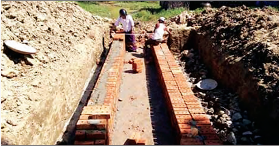
ကံမြင်-ဥယျာဉ်တောကျေးရွာ တာလမ်းပေါ်တွင် လမ်းကူးတံတားတစ်ခု တည်ဆောက်နေမှုကို တွေ့ရစဉ်

ရန်ကုန်တိုင်းဒေသကြီး သုံးခွမြို့နယ်တွင် ကျေးလက်ဒေသဖွံ့ဖြိုးတိုးတက်ရေးဦးစီးဌာနမှ ၂၀၁၆-၂၀၁၇ ဘဏ္ဍာနှစ်မှမ်းမံခွင့်ပြုရန်ပုံငွေဖြင့် (Box Culvert) လမ်းကူးကွန်ကရစ်တံတားသုံးစင်း တည်ဆောက်မည်ဟု သိရသည်။