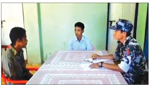
နယ်မြေရှင်းလင်းစဉ် ဖမ်းဆီးရမိသော အကြမ်းဖက်သမားများနှင့် မသင်္ကာသူ များအား စစ်ဆေးမေးမြန်းစဉ်