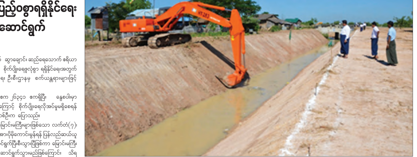
ဆွာချောင်းရေသောက်ဆည်ဧရိယာအတွင်း ရေစီးအားပိုမိုကောင်းစေရန် စက်ယန္တရားကြီးများဖြင့် ဆောင်ရွက်နေစဉ်

ပဲခူးတိုင်းဒေသကြီး ရေတာရှည်မြို့နယ် ဆွာချောင်း ဆည်ရေသောက် ဧရိယာအတွင်း နွေစပါးစိုက်ပျိုးမည့်တောင်သူများ စိုက်ပျိုးရေးလုံစွာ ရရှိနိုင်ရေးအတွက် ဆည်မြောင်းနှင့် ရေအသုံးချမှုစီမံခန့်ခွဲရေး ဦးစီးဌာနမှ စက်ယန္တရားများဖြင့် ဆောင်ရွက်လျက်ရှိသည်။