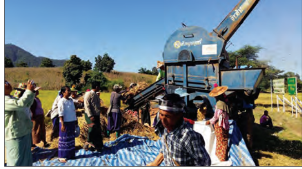
မျိုးစေ့ထုတ်စိုက်မှု မျိုးသန့်စပါးများရရှိရေး ခြေလှေ့နေမှုကို တွေ့ရစဉ်