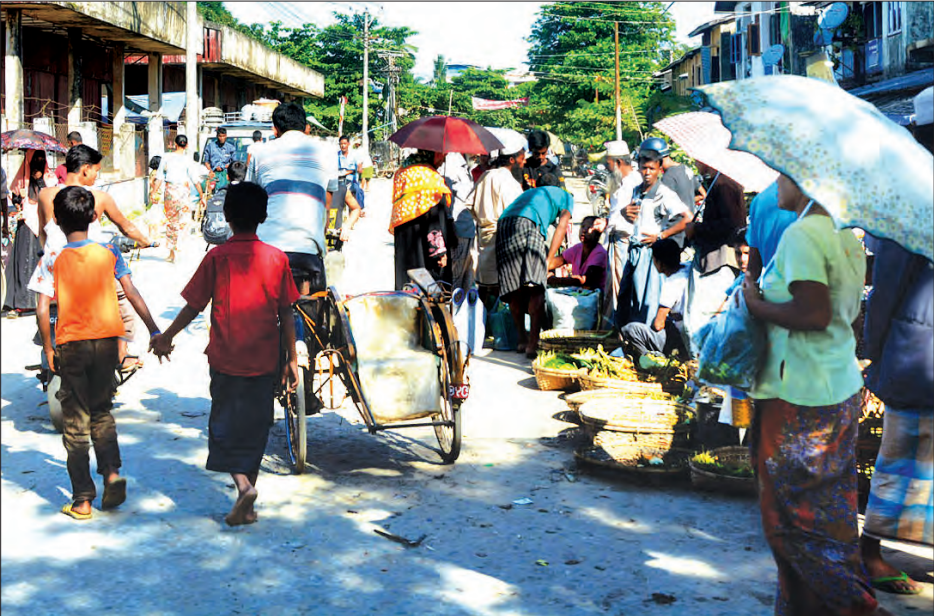
မောင်တောမြို့တွင်းလမ်း၌ ဖြတ်သန်းသွားလာသူများကို တွေ့ရစဉ်