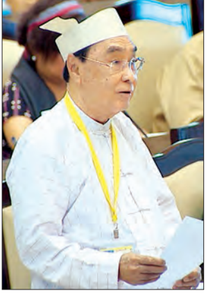
ပြည်ထောင်စုဝန်ကြီး နိုင်သက်လွင်

ဒုတိယအကြိမ် အမျိုးသားလွှတ်တော် တတိယပုံမှန်အစည်းအဝေး ဒုတိယနေ့ကို ယနေ့ နံနက် ၁၀ နာရီက နေပြည်တော်ရှိ အမျိုးသားလွှတ်တော် အစည်းအဝေးခန်းမဆောင်၌ ကျင်းပသည်။