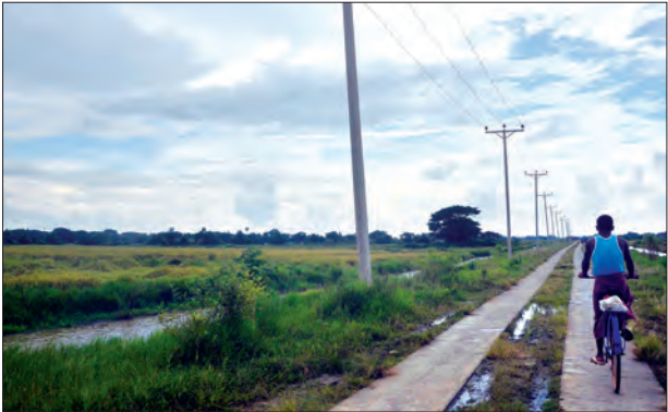
ဆိပ်ကြီးခနောင်တို့မြို့နယ် ဦးထွန်းဆိုရပ်ကွက်အတွင်းရှိ ရန်ကုန်မြို့သစ်စီမံကိန်း အကောင်အထည်ဖော်မည့် စီမံကိန်းမြေနေရာကို တွေ့ရစဉ်