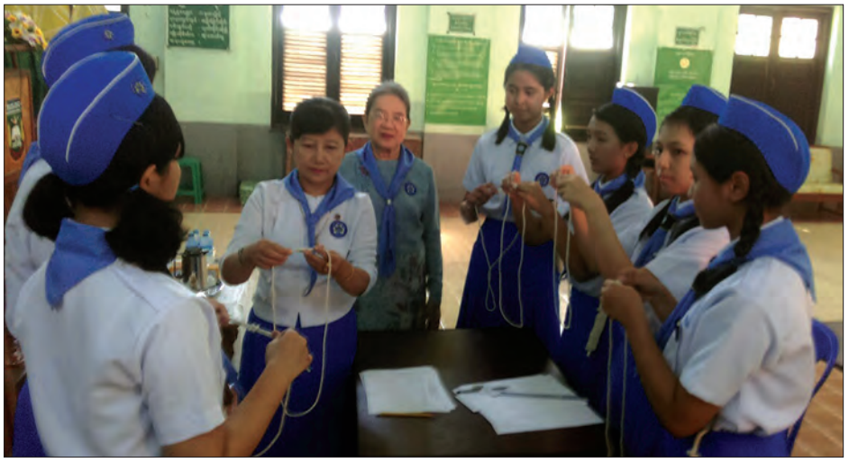
မြန်မာ့ကင်းထောက် ရာပြည့်အထိမ်းအမှတ်အကြို ကင်းထောက် အမျိုးသား၊ အမျိုးသမီးများ ကင်းစိတ်စွမ်းရည်ပြိုင်ပွဲများကို အထက(၁)အင်းစိန်၌ ကျင်းပစဉ်

ယင်းပြိုင်ပွဲကျင်းပမှုကို မြန်မာ နိုင်ငံ အမျိုးသားကင်းထောက်ချုပ် ဒေါက်တာ တင်ညို၊ ဒုတိယ ကင်းထောက်