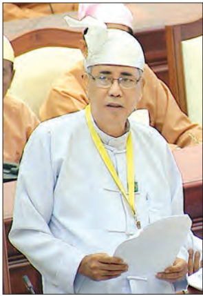
ဒုတိယဝန်ကြီး ဦးကျော်မျိုး

ထို့ပြင် အဆိုရှင်က မြို့နယ်တိုင်းတွင် အလုပ်သမားညှဉ်းပန်းနှိပ်စက်မှု၊ အဖွဲ့အစည်းများ ဖွဲ့စည်းကာ လုပ်ငန်းခွင်အခြေအနေကို စစ်ဆေးကြီးကြပ်စေခြင်း၊ အသိပညာပေးလုပ်ငန်းများ ဆောင်ရွက်ခြင်း၊ လုပ်ငန်းခွင်အခြေအနေ စစ်ဆေးတွေ့ရှိ