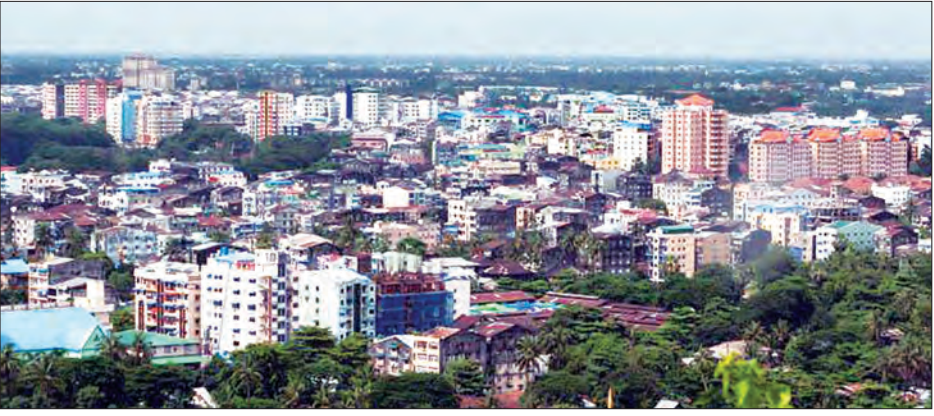
အဆောက်အအုံများအတွက် ဖြစ်ကြောင်း၊ မြန်မာနိုင်ငံတွင် စီးပွားရေးဖွံ့ဖြိုးတိုးတက်လာမှုနှင့်အညီ မြို့ပေါ်နေလူဦးရေ တဖြည်းဖြည်း တိုးတက်လာလျက်ရှိရာ တိုးပွားလာသော မြို့ပေါ်နေပြည်သူများအတွက် အထပ်မြင့်အဆောက်အအုံများ တိုးချဲ့တည်ဆောက်လျက်ရှိကြောင်း သိရသည်။ ရင်းနှီးမြှုပ်နှံမှုလုပ်ငန်း နှစ်ခု ခွင့်ပြုပေးခဲ့ပြီး သယ်ယူပို့ဆောင်ရေးလုပ်ငန်းတစ်ခုနှင့် အခြားဝန်ဆောင်မှုလုပ်ငန်း တစ်ခုဖြစ်ကြောင်း၊ အလုပ်အကိုင်အားဖြင့် အလုပ်အကိုင်