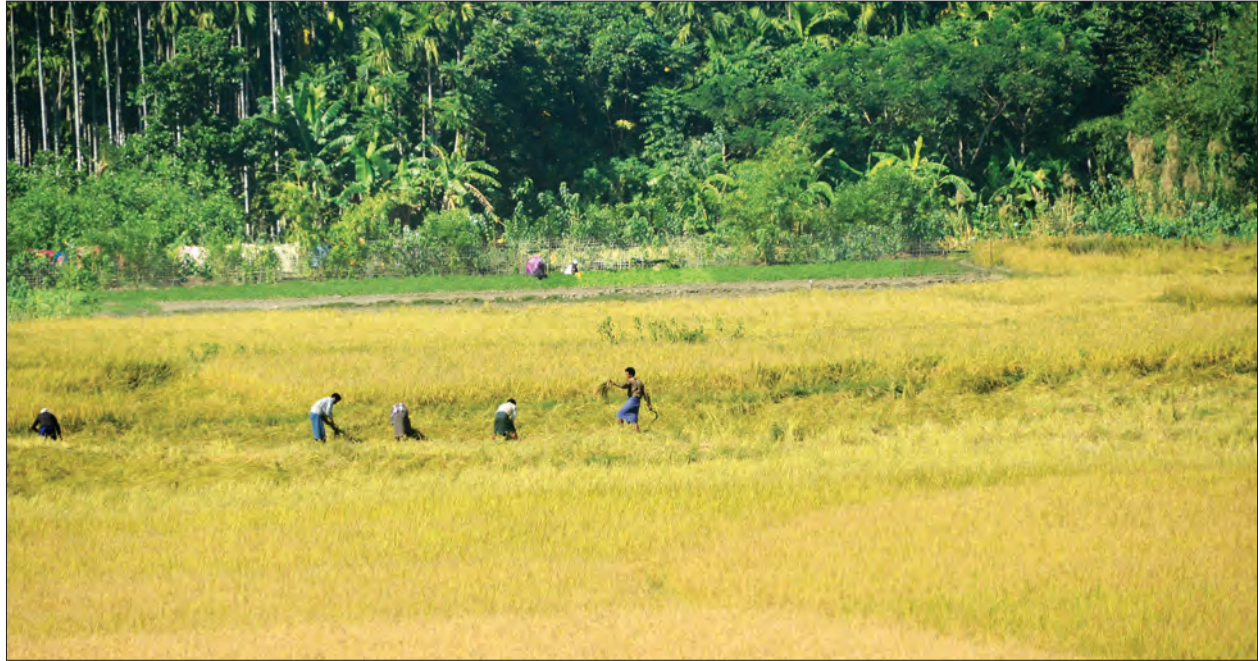
မောင်တောမြို့နယ်ရှိ ကျေးရွာတစ်ရွာ၌ စပါးရိတ်သိမ်းနေသူများကို တွေ့ရစဉ်

ထို့နောက် ဗောဓိကုန်း၊ ဝေသာလီစသည့်ကျေးရွာများကို ဖြတ်သန်းလာခဲ့ရာ ဓပါးရိတ်သိမ်းနေသူများ၊ ခြေလှေနေသူများ၊ ရာသီသီးနှံရိုက်ပျိုးနေသူများ၊ ငါးရှာသူများ၊ ကျောင်းဆင်းလာသော ကျောင်းသား ကျောင်းသူများ၊ အငှားယာဉ် သုံးဘီးဆိုင်ကယ်များဖြင့် သွားလာနေသူများစသည့်အေးချမ်းနေသောနယ်မြေအခြေအနေကို မျက်မြင်တွေ့ခဲ့ရသည်။ နိုဝင်ဘာ ၁၂ ရက်နေ့က မောင်တောမြောက်ပိုင်းဖြစ်သည့် မောင်တောကြိမ်ချောင်းလမ်းဘက် ဖြတ်သန်းစဉ် တိုက်ပွဲဖြစ်ပွားမှုနှင့် လမ်းတွင် ကားကို မိုင်းဆွဲတိုက်ခိုက်ခံရမှုသတင်းကို ကြားသိရပြီး ထိခိုက်မှုများလည်းရှိသည်ကို သိခဲ့ရသည်။ နိုဝင်ဘာ ၁၃ ရက် သတင်းစာများတွင်လည်း အဆိုပါတိုက်ပွဲသတင်းနှင့် ပတ်သက်၍ သိရှိခဲ့ရပြီး နောက်နေ့