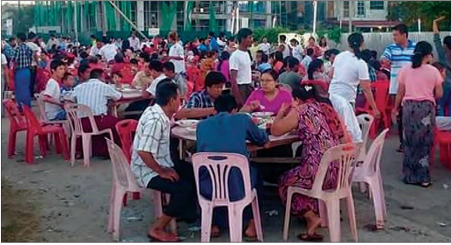
စတုဒိသာကျွေးမွေးပွဲတွင် လှူဒါန်းသူများနှင့် စားသုံးသူများ ပျော်ရွှင်စွာ ပါဝင်ဆင်နွှဲနေစဉ်

မွန်ပြည်နယ် မော်လမြိုင်မြို့၌ နှစ်စဉ် ကျင်းပခြင်းဖြစ်သော ရှင်ဥပဂုတ္တမထေရ် မြတ်ပူဇော်ပွဲနှင့် ဆွမ်းအိုးပွဲတို့ကို တန်ဆောင်မုန်းလပြည့်နံနက် ၄ နာရီခန့်က သံလွင်မြစ် ကမ်းနားလမ်းတစ်လျှောက်၌ ကျင်းပရာ ဗုဒ္ဓဘာသာ တိုင်းရင်းသား ပြည်သူများ ဆွမ်းအိုး သပိတ်များဖြင့် လာရောက်ဖူးမြော်ကြည့်လိုလှအောင် ပြုပြီး ကမ်းနားလမ်းရှိ ရပ်ကွက်များမှ စတုဒိသာများဖြင့် စည်ကားသိုက်မြိုက်စွာ ကျွေးမွေးဧည့်ခံကြသည်။