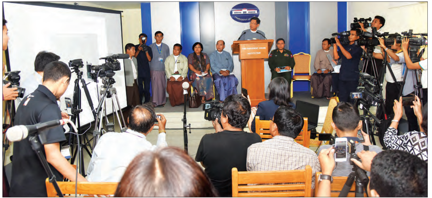
သတင်းစာရှင်းလင်းပွဲတွင် နိုင်ငံတော်အတိုင်ပင်ခံရုံး သတင်းထုတ်ပြန်ရေးကော်မတီအတွင်းရေးမှူး နိုင်ငံတော်သမ္မတရုံးမှ ဒုတိယညွှန်ကြားရေးမှူးချုပ် ဦးဇော်ဌေး ရှင်းလင်းစဉ် (သတင်းစဉ်)