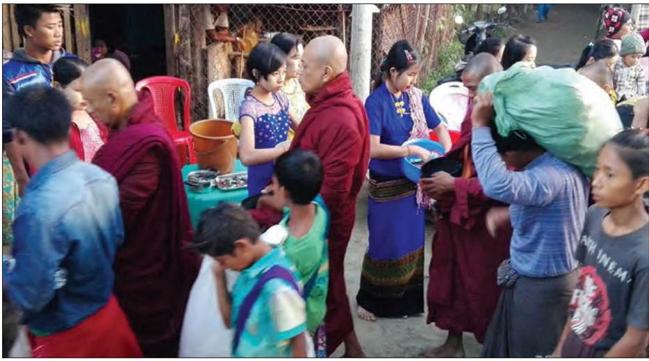
စစ်တွေမြို့နယ်၊ စုပေါင်းဆွမ်းလောင်းလှူကြစဉ်

စစ်တွေမြို့ပေါ်ကျောင်းတိုက်အသီးသီးမှ ရဟန်းသမား ၂၀၀ ခန့်၊ သီလရှင်များသည် ရဲနယ်စုရပ်ကွက်မှ စတင်ကာ မေယုလမ်း၊ ကျောင်းကြီးလမ်း၊ မကျည်းမြိုင်လမ်းမအတိုင်း ဆွမ်းခံကြွတော်မူကြရာ လမ်းတစ်လျှောက်ရှိ အလှူရှင်များက ဆွမ်း၊ ခဲဘွယ်များ၊ အချိုရည်နှင့် ရေသန့်တူးများ လောင်းလှူကြသည်။