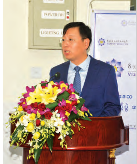
မြန်မာနိုင်ငံဆိုင်ရာ တရုတ်ပြည်သူ့သမ္မတနိုင်ငံသံအမတ်ကြီး မစ္စတာ ဟန်လျန်

အတွင်းတိမ်ရောဂါမှာ အားလုံး၏ ၆၀ ရာခိုင်နှုန်းရှိကြောင်း၊ ယခုလက်ရှိမြန်မာနိုင်ငံ၌ အတွင်းတိမ်ရောဂါ ဖြစ်ပွားနေသူ ခန့်မှန်းခြေ သုံးသိန်းခွဲခန့်ရှိရာ နှစ်စဉ် ခွဲစိတ်ပေးနိုင်သော အရေအတွက်မှာ တစ်သိန်းကျော်သာဖြစ်ပြီး ပိုမိုခွဲစိတ်ကုသပေးနိုင်ရန် လိုအပ်နေသေးကြောင်း။ WHO ၏ ရည်မှန်းချက်ဖြစ်သော အတွင်းတိမ် ခွဲစိတ်မှုနှုန်းမှာ လူဦးရေ တစ်သန်းလျှင် ၃၀၀၀ သတ်မှတ်ထားရာ ၂၀၁၄-၂၀၁၅ ခုနှစ်တွင် မြန်မာနိုင်ငံ၏ ခွဲစိတ်မှုနှုန်းမှာ ၂၀၀၄ သို့ ရောက်ရှိနေပြီ ဖြစ်ပါကြောင်း။