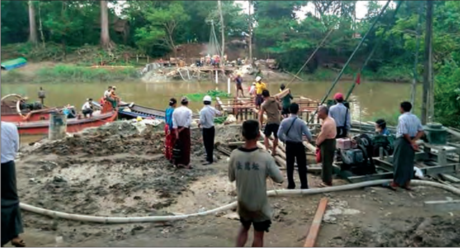
ဒါးကချောင်းကူးတံတား တည်ဆောက်မှုလုပ်ငန်းခွင်ကို တွေ့ရစဉ်