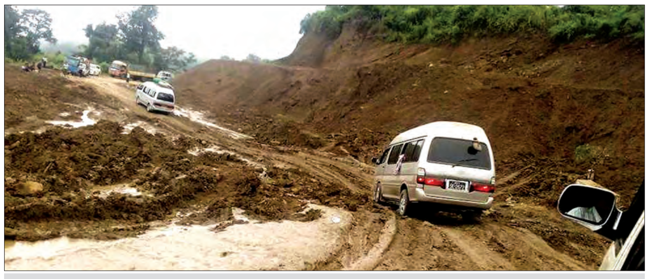
ပုလဲ-ဂန့်ဂေါ-ဟားခါးလမ်းပိုင်းတစ်နေရာ