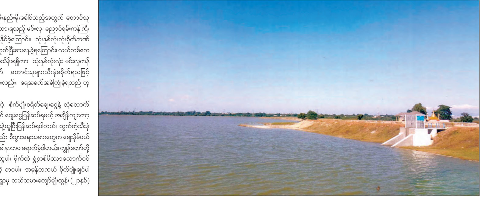
ညောင်ရမ်း-မင်းလှကန်အတွင်း ရေဝင်ရောက်နေမှုကိုတွေ့ရစဉ်

သာစည်မြို့နယ်တွင် ၂၀၁၃ ခုနှစ်မှစပြီး မိုးနည်းမိုးခေါင်သည့်အတွက် တောင်သူလယ်သမားများ စိုက်ပျိုးရေးအတွက် အားထားရသည့် မင်းလှ-ညောင်ရမ်းကန်ကြီးတွင် ရေမဝင်သည့်အတွက် သီးနှံစိုက်ပျိုးနိုင်ခဲ့ကြောင်း၊ သုံးနှစ်လုံးလုံးစိုက်ဘဏ်မှထုတ်သည့် စိုက်ပျိုးစရိတ်ချေးငွေကိုသာ ထုတ်ပြီးစားနေခဲ့ရကြောင်း၊ လယ်တစ်ဧက ငွေကျပ် နှစ်သိန်း၊ ယာတစ်ဧကငွေကျပ် တစ်သိန်းရရှိကာ သုံးနှစ်လုံးလုံး မင်းလှကန်နှင့် ညောင်ရမ်းကန်ရေမဝင်သည့်အတွက် တောင်သူများသီးနှံစိုက်ရသဖြင့် အဆင်မပြေဖြစ်ကာ ကျွဲ၊ နွားတိရစ္ဆာန်များလည်း ရေအခက်အခဲကြုံခဲ့ရသည် ဟု ပြောသည်။