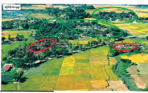
လက်တွေ့မြေပြင် - ၂၀