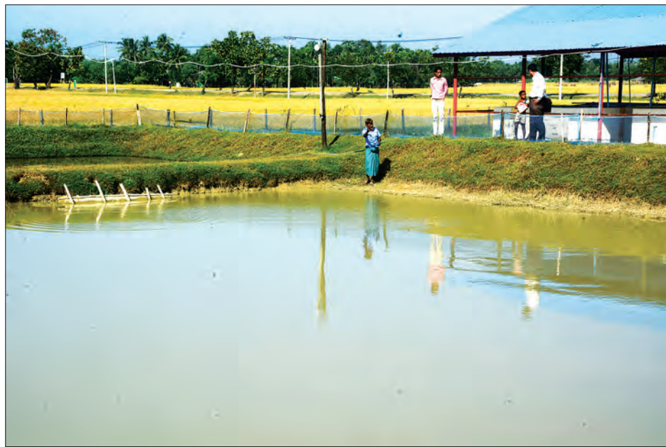
မောင်တောခရိုင်အတွင်း ရေချိုငါး၊ ပုစွန်မွေးမြူရေးကန်ကို တွေ့ရစဉ်

ပုစွန် နဲ့ပင်လယ်ရေငန်ငါးပဲရှိခဲ့တာ။ ရေချိုငါးမွေးမြူတဲ့ အကျင့် မရှိသလို စားသုံးတဲ့အလေ့အထမရှိသလောက် နည်းနေသေး တယ်။ မောင်တောဒေသက ကမ်းရိုးတန်းဒေသနဲ့ ပင်လယ် ထိစပ်နေတော့ ရေငန်ပုစွန်မွေးမြူရေးလုပ်ငန်းတွေပဲ များများ စားစား ရှိခဲ့တာ။ အခုရခိုင်ပြည်နယ်မှာ ရေငန်ပုစွန်မွေးမြူရေး ကန် တစ်သိန်းကျော်ရှိပါတယ်။ ရေချိုငါးမွေးမြူရေးကတော့ တစ်ထောင်မကျော်သေးပါဘူး။ ဘူးသီးတောင်ဆို ရေချိုငါးမွေး ကန်အရင်က ၁၀၀ လောက်ပဲရှိခဲ့တာ။ အခု ၃၀၀ ကျော်အထိ တိုးလာပြီ။ မောင်တောမှာဆိုလည်း အရင်က ရေချိုငါးမွေးတာ ၁၀ ကန်တောင် မရှိခဲ့ဘူး။ အခုနောက်ပိုင်းတော့ ရေချိုငါးမွေး မြူနိုင်အောင်နဲ့ ရေငန်ပုစွန်သားဖောက်စခန်းတွေ များများ စားစား တိုးချဲ့နိုင်အောင် လုပ်နေပါတယ်။ သားဖောက်စခန်း တွေများပြားလာမှ မွေးမြူရေးလုပ်ငန်းတွေကိုလည်း ယခုထက် ပိုမိုအကောင်အထည်ဖော်ပေးနိုင်မှာဖြစ်ပါတယ်။