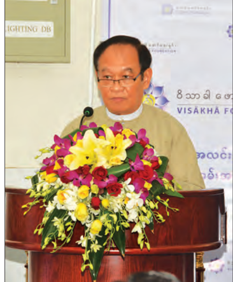
ပြည်ထောင်စုဝန်ကြီး ဒေါက်တာမြင့်ထွေး

မျက်စိ၊ နှာ၊ နှာခေါင်း၊ လည်ချောင်းရောဂါ အထူးကုဆေးရုံကြီး (နေပြည်တော်) တို့မှ ပူးတွဲပံ့ပိုးကူညီပြီး တရုတ်နိုင်ငံမှ မျက်စိဆရာဝန်ကြီးများအဖွဲ့က မျက်စိဝေဒနာ ရှင် ၅၂ ဦးတို့အား နိုဝင်ဘာ ၁၆ ရက်မှ ၁၈ ရက်အထိ ခွဲစိတ်ကုသမှုများ ဆောင်ရွက်ပေးသွားမည်ဖြစ်သည်။ ထို့ပြင် မျက်စိ၊ နှာ၊ နှာခေါင်း၊ လည်ချောင်းဆေးရုံကြီး (ရန်ကင်း) ၌ လူနာ ၁၀၀ နှင့် သီတဂူစကွပ်ပါလမျက်စိ ဆေးရုံကြီး၌ လူနာ ၁၀၀ တို့အား ခွဲစိတ်ကုသပေးခဲ့ပြီးဖြစ်ကြောင်း သိရသည်။ (သတင်းစဉ်)