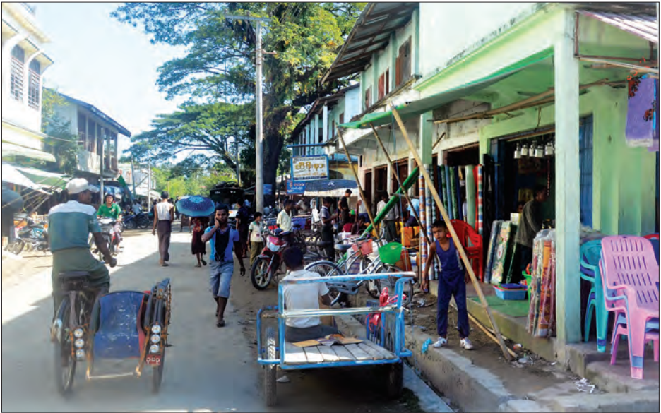
မောင်တောမြို့ပေါ်၌ ပြည်သူများတည်ငြိမ်အေးချမ်းစွာ ရောင်းဝယ်ဖောက်ကားသွားလာနေမှုကို တွေ့ရစဉ်

တွင်လည်း နယ်မြေရှင်းလင်းရေးဆောင်ရွက်နေသည့် သတင်းများကို ကြားရသည်။ မိမိတို့အဖွဲ့ နိုဝင်ဘာ ၁၃ ရက်က မောင်တောတောင်ပိုင်းဒေသဖြစ်သည့် ကံပူ၊ အလယ်သံကျော်၊ မောရဝတီ၊ ဥဒေါင်း၊ ကိုင်းကြီး၊ ဒုချီးရားတန်း၊ ရွှေပတိုရ်စသည့်ကျေးရွာများကို ကားလမ်းမကြီးအတိုင်း ဖြတ်သန်းကြည့်ရှုခဲ့စဉ် နဂိုအခြေအနေအတိုင်း မဟုတ်သေးသည့်တိုင် နယ်မြေအခြေအနေအေးချမ်းပြီး တည်တည်ငြိမ်ငြိမ်ရှိနေသည်ကို တွေ့ခဲ့ရသည်။ နိုဝင်ဘာလ ၁၀ ရက်နေ့ မောင်တောမြို့သို့ မိမိတို့ရောက်ကတည်းက မြို့ပေါ်တွင် ဈေးဆိုင်အများစု ဖွင့်လှစ်ထားခြင်း၊ ထမင်းဆိုင်များ၊ လက်ဖက်ရည်ဆိုင်များတွင်လည်း လူများစုစုဝေးဝေး