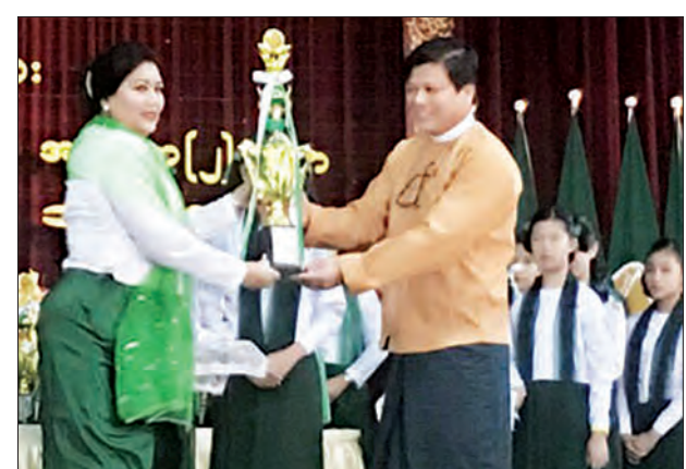
ရန်ကုန်တိုင်းဒေသကြီး လူမှုရေးဝန်ကြီး ဦးနိုင်လင်းက စံပြုဆရာကျောင်းများမှ ဆရာမတစ်ဦးအား ဆုချီးမြှင့်စဉ်

ရန်ကုန် နိုဝင်ဘာ ၁၆ ၂၀၁၅-၂၀၁၆ ပညာသင်နှစ်၏ ရန်ကုန်တိုင်းဒေသကြီး ကျောင်းကျန်းမာရေး စံပြုကျောင်းများ ဆုချီးမြှင့်ပွဲအခမ်းအနားကို နိုဝင်ဘာ ၁၆ ရက် နံနက် ၈ နာရီက လသာမြို့နယ် အမှတ်(၂)အထက်တန်းကျောင်းရှိ မြည့်လာခန်းမ၌ ကျင်းပခဲ့ကြောင်း သိရသည်။ အခမ်းအနားတွင် တိုင်းဒေသကြီး လူမှုရေးဝန်ကြီးဦးနိုင်လင်းက အမှာစကား ပြောကြားခဲ့ပြီး စံပြုထူးချွန်နှင့် စံပြုဆရာကျောင်းများကို ဆုချီးမြှင့်ပေးခဲ့သည်။ စံပြုထူးချွန်ဆရာကျောင်းကျောင်း ၁၀ ကျောင်း၊ ကျောင်းကျန်းမာရေးအကောင်အထူးစွမ်းဆောင်ရည်ဆုကို ကျောင်းကိုးကျောင်းနှင့် ကျောင်းကျန်းမာရေးစံပြုကျောင်းဆုအတွက် ပထမ၊ ဒုတိယ၊ တတိယ ပူးတွဲဆုတို့ကို ကျောင်း ၂၁ ကျောင်းတို့မှ အသီးသီးရရှိခဲ့သည်။ ထို့နောက် တက်ရောက်လာသော ဧည့်သည်တော်များက ကျောင်းကျန်းမာရေး လှုပ်ရှားမှုပြခန်းတို့ကို လှည့်လည်ကြည့်ရှုခဲ့ကြောင်း သိရသည်။ သန်းထိုက်(လှိုင်သာယာ)