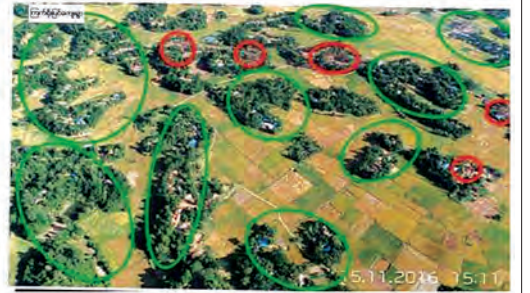
လက်တွေ့မြေပြင် - ၃၀