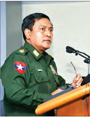
ကာကွယ်ရေးဦးစီးချုပ်ရုံး (ကြည်း)မှ ဝိုင်းချုပ်စိုးနိုင်ဦး ရှင်းလင်းစဉ်

မိမိတို့အနေဖြင့် HRW ၏ သတင်းထုတ်ပြန်ချက်တွင်ပါရှိသည့် စွပ်စွဲချက်များနှင့် ပတ်သက်ပြီး လက်တွေ့ဖြစ်ပွားမှုနှင့် ပြန်လည်စစ်မူများပြုလုပ်ပြီး ရရှိလာသည့်သတင်းအချက်အလက်များကို ဆက်လက်ထုတ်ပြန်သွားမည်ဟု ကြေညာထားပါကြောင်း၊ ပြီးခဲ့သည့် အောက်တိုဘာ ၉ ရက်က စတင်ဖြစ်ပွားခဲ့သော မောင်တောဒေသ အကြမ်းဖက်တိုက်ခိုက်မှုဖြစ်စဉ်နှင့် ပတ်သက်၍ ဗန်ကောက်ပို့စ်မှ နိုဝင်ဘာ ၁၄ ရက် မီးရှို့ဖျက်ဆီးမှုနှင့်ပတ်သက်ပြီး သတင်းထုတ်ပြန်ခဲ့ပါကြောင်း၊ အလားတူ အခြားမီဒီယာများတွင်လည်း သတင်းများပါရှိခဲ့ပါကြောင်း၊ အဆိုပါကိစ္စနှင့်စပ်လျဉ်း၍ နိုင်ငံတော်၏အတိုင်ပင်ခံပုဂ္ဂိုလ်နှင့် တပ်မတော်ခေါင်းဆောင်များထံသို့လည်း လက်တွေ့မြေပြင်အခြေအနေများသိရှိနိုင်ရန် တပ်မတော်မှ ရဟတ်ယာဉ်များဖြင့် ဝါးပိတ်ကျေးရွာ၊ ကြက်ရိုးပြင်ကျေးရွာ၊ ပြောင်ပိုက်ကျေးရွာ၊ ဒါးကြီးဇားကျေးရွာ ပတ်ဝန်းကျင်နယ်မြေများကို ဓာတ်ပုံရိုက်ကူးခြင်း၊ မျက်မြင်စစ်ဆေးခြင်းများကို ပြုလုပ်ခဲ့ပါကြောင်း၊ အဆိုပါဒေသများသို့ နိုဝင်ဘာ ၁၅ ရက်က သွားရောက်စစ်ဆေးရာ၌ ဝါးပိတ်ကျေးရွာမှ အဆောက်အအုံ ၁၀၅ လုံး၊ ကြက်ရိုးပြင်ကျေးရွာမှ အဆောက်အအုံ အလုံး ၃၀၊ ဒါးကြီးဇားကျေးရွာမှ အဆောက်အအုံ အလုံး ၃၀ နှင့် ပြောင်ပိုက်ကျေးရွာမှ အဆောက်အအုံ အလုံး ၂၀ မီးလောင်ပျက်စီးခဲ့သည်ကို တပ်မတော်မြေပြင် ကွင်းဆင်းစစ်ဆေးရေးအဖွဲ့မှ တွေ့ရှိခဲ့ပါကြောင်း စသဖြင့် Human Rights Watch (HRW) ၏ အစီရင်ခံစာပါအချက်များနှင့်စပ်လျဉ်း၍ ကွဲလွဲမှုများအား