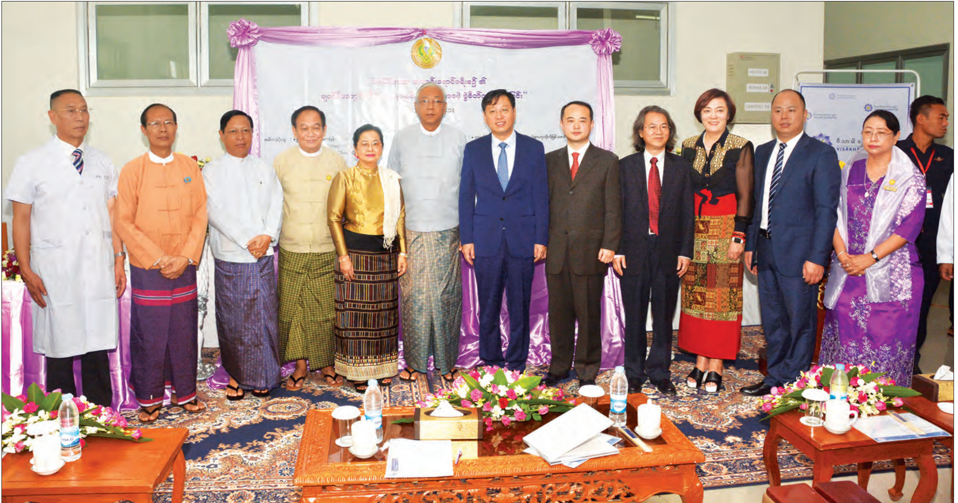
နိုင်ငံတော်သမ္မတ ဦးထင်ကျော်နှင့်ဇနီး မဲခေါင်ဒေသအလင်းရောင်ခရီးစဉ်၏ မျက်စိအတွင်းတိမ်ဝေဒနာရှင်များ အခမဲ့ခွဲစိတ်ကုသပေးခြင်း ဖွင့်ပွဲအခမ်းအနားသို့ တက်ရောက်လာကြသူများနှင့်အတူ မှတ်တမ်းတင်ဓာတ်ပုံရိုက်စဉ် (သတင်းစဉ်)

နေပြည်တော် နိုဝင်ဘာ ၁၆ နိုင်ငံတော်သမ္မတဦးထင်ကျော်နှင့်ဇနီး ဒေါ်စုစုလွင်တို့သည် ယနေ့နံနက်ပိုင်းတွင် နေပြည်တော် ဥတ္တရသီရိမြို့နယ် မျက်စိ၊ နား၊ နှာခေါင်း၊ လည်ချောင်းဆေးရုံကြီး (နေပြည်တော်)၌ ကျင်းပသည့် မဲခေါင်ဒေသအလင်းရောင်ခရီးစဉ်၏ မျက်စိအတွင်းတိမ်ဝေဒနာ ရှင်များ အခမဲ့ခွဲစိတ်ကုသပေးခြင်း ဖွင့်ပွဲအခမ်းအနားသို့ တက်ရောက်အားပေးသည်။ ဖွင့်ပွဲအခမ်းအနားတွင် ပြည်ထောင်စုဝန်ကြီး ဒေါက်တာမြင့်ထွေးက ကမ္ဘာ့ကျန်းမာရေးအဖွဲ့ကြီး၏ ခန့်မှန်းချက်အရ ကမ္ဘာပေါ် တွင် အမြင်အာရုံချို့တဲ့သူ ၂၄၆ သန်းနှင့် မျက်စိကွယ်သူ ၃၉ သန်းခန့်ရှိကြောင်း၊ မြန်မာနိုင်ငံတွင် ကာကွယ်ကုသနိုင်သော မျက်စိရောဂါများအနက် အဓိကမျက်စိမမြင်ခြင်းကို စာမျက်နှာ ၃ ကော်လံ ၁ *