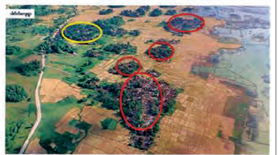
လက်တွေ့မြေပြင် - ၁၀၅