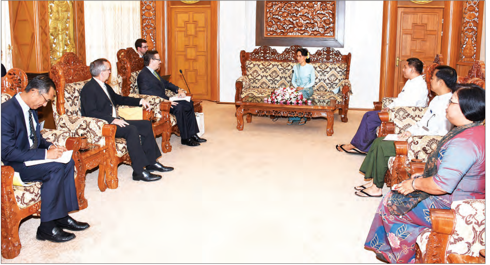
နိုင်ငံတော်၏အတိုင်ပင်ခံပုဂ္ဂိုလ် ဒေါ်အောင်ဆန်းစုကြည် အမေရိကန်-အာဆီယံ စီးပွားရေးကောင်စီဥက္ကဋ္ဌနှင့် အမှုဆောင်အရာရှိချုပ် မစ္စတာ အလက်ဇန္ဒားဗဲလ်မင်း ဦးဆောင်သောကိုယ်စားလှယ်အဖွဲ့နှင့် တွေ့ဆုံဆွေးနွေးစဉ် (သတင်းစဉ်)

တွေ့ဆုံပွဲသို့ မြန်မာနိုင်ငံဆိုင်ရာ အမေရိကန်သံအမတ်ကြီး မစ္စတာ စကော့ မာရယ်လ်လည်း တက်ရောက်သည်။ (သတင်းစဉ်)