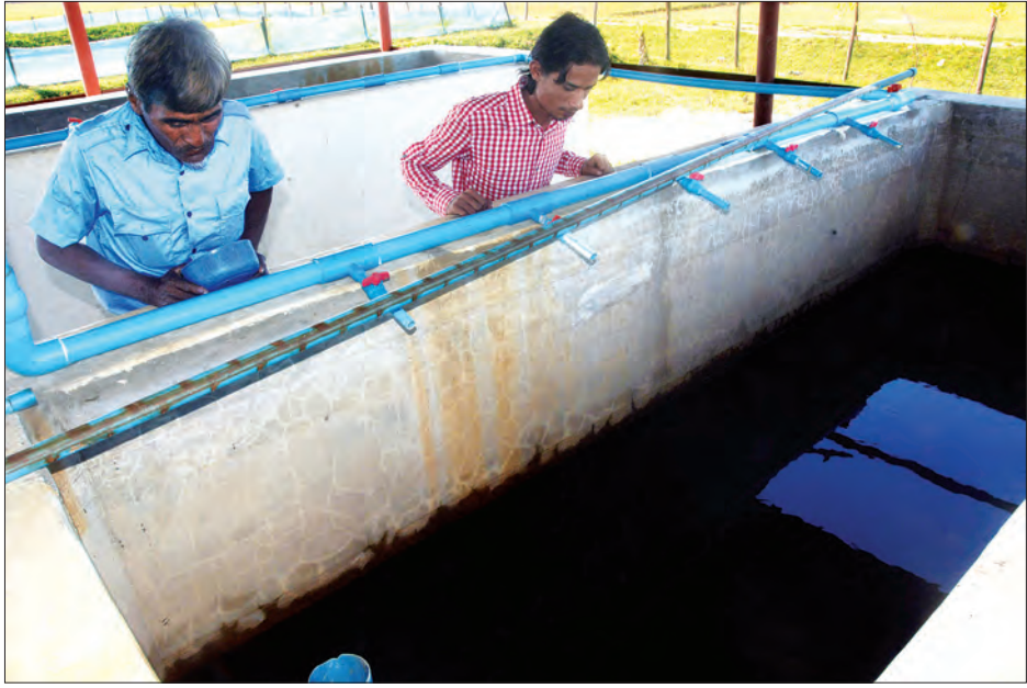
မောင်တောခရိုင်အတွင်း မွေးမြူထားသော ငါးသားပေါက်ကန်ကိုတွေ့ရစဉ်

ဖြေ- မောင်တောခရိုင်အတွင်း ရွာပေါင်း ၉၆ ရွာမှာ ငါးမွေးကန် ငါးကေစီကို အကောင်အထည်ဖော်ပြီးရင် မွေးမြူနိုင် ဖို့အတွက် ငွေအရင်းအနှီးတွေကိုလည်း အတိုးနှုန်းသက်သက် သာသာနဲ့ ဘဏ်တွေက ချေးပေးနိုင်အောင် ချိတ်ဆက်ထား ပါတယ်။ ပြီးတော့ ငါး၊ ပုစွန် အခြောက်ခံတဲ့ လုပ်ငန်းတွေ၊ အရည်အသွေးထိန်းသိမ်းနိုင်အောင် ရေခဲစက်တွေ တည်ထောင် ပေးနိုင်ဖို့ ငါးသားပေါက် ပုစွန်သားပေါက် လုံလုံလောက်လောက် ကူညီထောက်ပံ့ပေးနိုင်ဖို့ကို ဌာနအနေနဲ့ ကူညီဆောင်ရွက် ပေးသွားမှာပါ။ ရေငန်ပုစွန်သားဖောက်စခန်း သုံးခု၊ သရုပ်ပြ မွေးကန် နှစ်ခု အဲဒါတွေကိုလည်း နောက်ထပ်ဖြည့်ဆည်းပေးဖို့ နိုင်ငံတော်ကို တင်ပြထားပါတယ်။ တန်ဖိုးငွေအားဖြင့်တော့ ရင်းနှီးမြှုပ်နှံငွေကျပ်သန်းပေါင်း ၁၂၀၀ ကျော်လောက် ကုန်ကျ မှာပါ။ ငါးကန်ဆိုလည်း ၉၆ ရွာကို တစ်ရွာ ငါးကေစီဆိုရင် စုစုပေါင်း ဧက ၄၈၀ ရှိပါတယ်။ တစ်ဧက တူးဖော်မယ်ဆိုရင် ကုန်ကျစရိတ်က ငွေကျပ် ၇၅ သိန်းလောက်တော့ ကုန်ကျမှာ ဖြစ်တဲ့အတွက် စုစုပေါင်း ငွေကျပ်သန်းပေါင်း ၃၆၀၀ ကျော် ကုန်ကျမှာဖြစ်ပါတယ်။ ဒါတွေ အားလုံးလုပ်ဆောင်ပေးဖို့ နိုင်ငံတော်ကို တင်ပြထားပြီးဖြစ်ပါတယ်။ ခွင့်ပြုမိန့်ကျတော့ အမြန်ဆုံးအကောင်အထည်ဖော်မှာပါ။