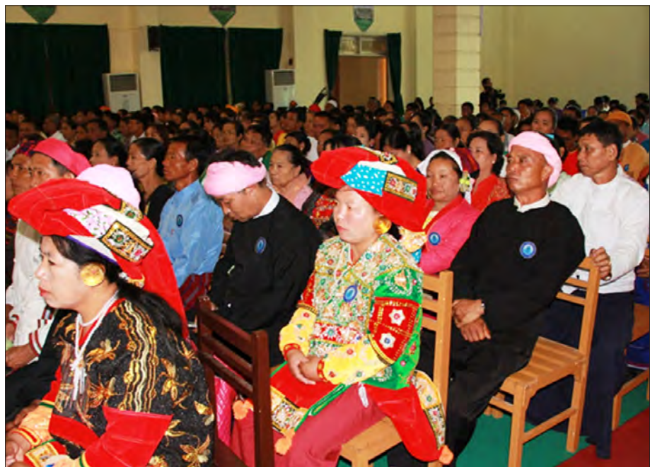
သင်တန်းဆင်းပွဲအခမ်းအနားသို့ တက်ရောက်လာသော ကျောင်းသားမိဘများ

(ရွာသစ်ကြီး)ရှိ ပြည်ထောင်စုတိုင်းရင်းသားလူမျိုးများ ဖွံ့ဖြိုးရေးတက္ကသိုလ်တွင် B.Ed ငါးနှစ် သင်တန်းများ ဆက်လက်သင်ယူနိုင်ပြီး နယ်စပ်ဒေသများတွင် တာဝန်ထမ်းဆောင်မည့် ပညာရေးဝန်ထမ်းကောင်းများအဖြစ် မွေးထုတ်