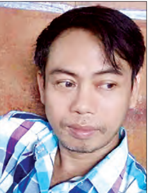
စာရေးဆရာ သတိုး