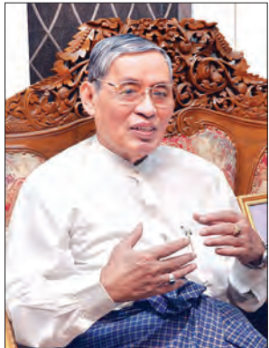
တက္ကသိုလ်တင်ခ

၂၀၁၅ ခုနှစ်အတွက် အမျိုးသားစာပေဆု ရွေးချယ်ခံရသူများစာရင်းကို ထုတ်ပြန်လိုက်ပြီ ဖြစ်သည်။ ဘဝတစ်သက်တာလုံး စာပေရေးသားခြင်းနှင့် အကျိုးပြုစာပေများကို ပြုစုခဲ့သည့် စာပေပညာရှင်ကြီးများကိုလည်း နှစ်စဉ်ရွေးချယ်ကာ တစ်သက်တာစာပေဆုများ ရွေးချယ်ချီးမြှင့်လျက်ရှိသကဲ့သို့ အခြားစာပေပညာရှင်များကို ကဏ္ဍအလိုက် စနစ်တကျ ရွေးချယ်ကာ ဆုချီးမြှင့်ပေးလျက်ရှိသည်။ ယခုနှစ်အတွက် ရွေးချယ်ခြင်းခံရသည့် စာပေပညာရှင်အချို့ကိုတွေ့ဆုံကာ မြန်မာ့စာပေအပေါ် သဘောထားများကို မေးမြန်းခဲ့ပါသည်။