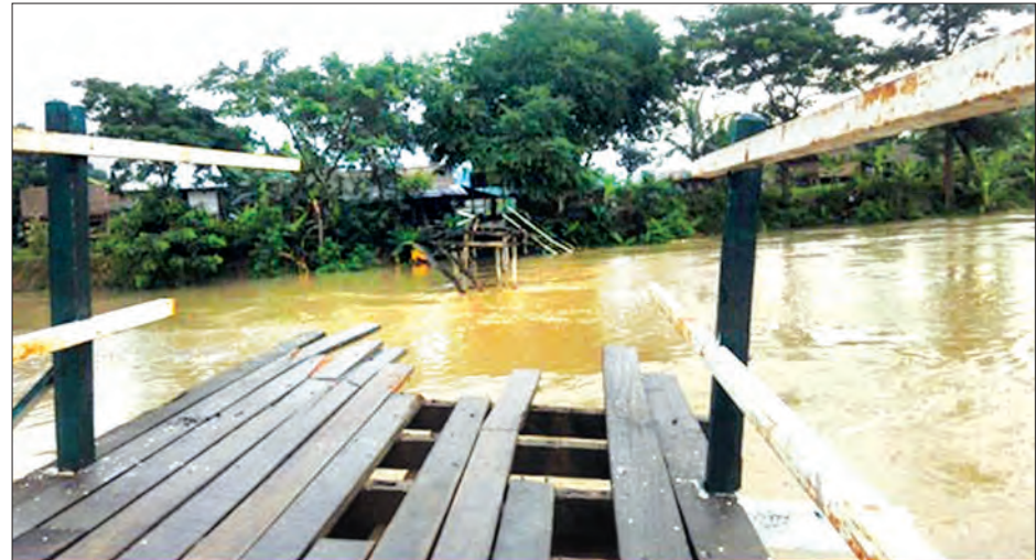
ပျဉ်းမနားမြို့နယ်အတွင်းရှိ ဇီးဖြူပင်-ပေါင်းလောင်းမြစ်ကူးတံတားရေတိုက်စား၍ ပျက်စီးနေသည်ကို တွေ့ရစဉ်