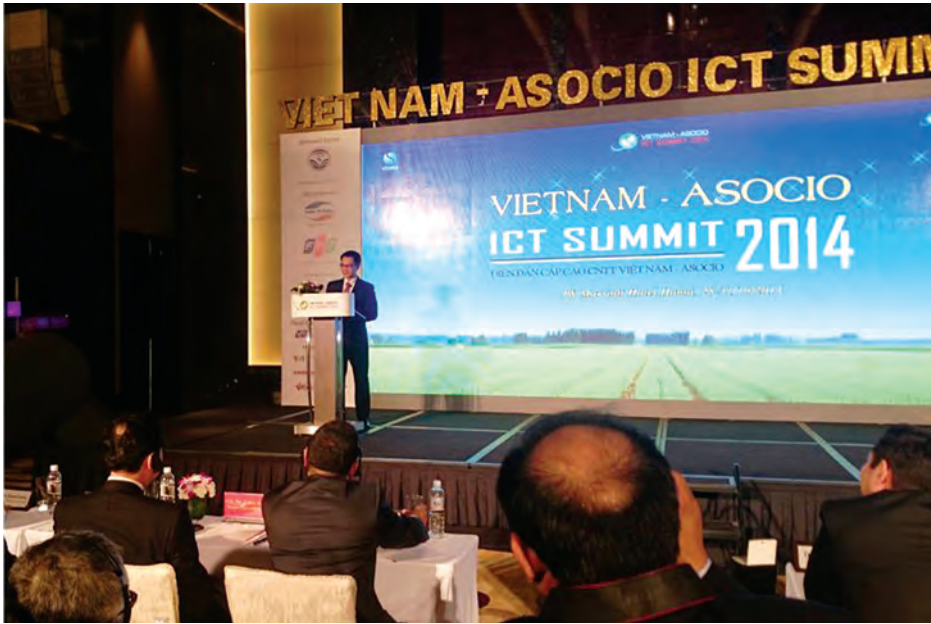
၂၀၁၄ ခုနှစ်က ဝီယက်နမ်နိုင်ငံတွင် ကျင်းပခဲ့သော ASOCIO ICT Summit အခမ်းအနား

ASOCIO ICT Summit 2016 သို့တက်ရောက်လိုသည့်