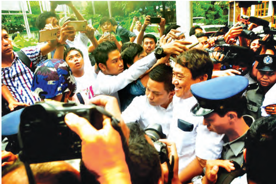
သူမှာ မူးယစ်ဆေးဝါးမူးဖြင့် မကြာသေးမီက ထောင်ကလွတ်လာခဲ့သော သူ့ဌေးတစ်ဦးဖြစ်ပြီး အစိုးရ အကူးအပြောင်းကာလတွင် မြို့သူစစ်မိန့်ကို တင်ဒါအောင်မြင်ခဲ့သူ တစ်ဦးဖြစ်

“ဝန်ကြီးချုပ်တစ်ဦး ဒေါ်လာတစ်သိန်းခန့်တန်သည့် Patek Philippe နာရီ ဝတ်ဆင်သည်။ ယင်းနာရီကို လက်ဆောင်ပေး