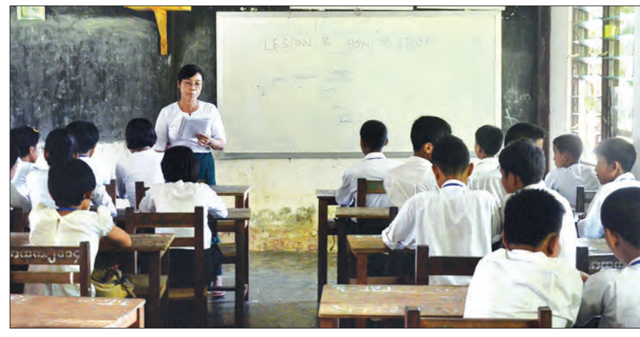
ဘူးသီးတောင်မြို့နယ် အထက်တန်းကျောင်း၌ ကျောင်းသားကျောင်းသူများအား စာသင်ကြားနေမှုကို တွေ့ရစဉ်

“ကျွန်တော်တို့ကျောင်းမှာအောက်တိုဘာလ ၈ ရက်နေ့ က စာမေးပွဲစစ်တယ်။အောက်တိုဘာလ ၉ ရက်နေ့နေ့ကပိုင်း မှာ တော့ ကျောင်းကိုယာယီသဘောမျိုး ပိတ်ထားခဲ့ပါတယ်။