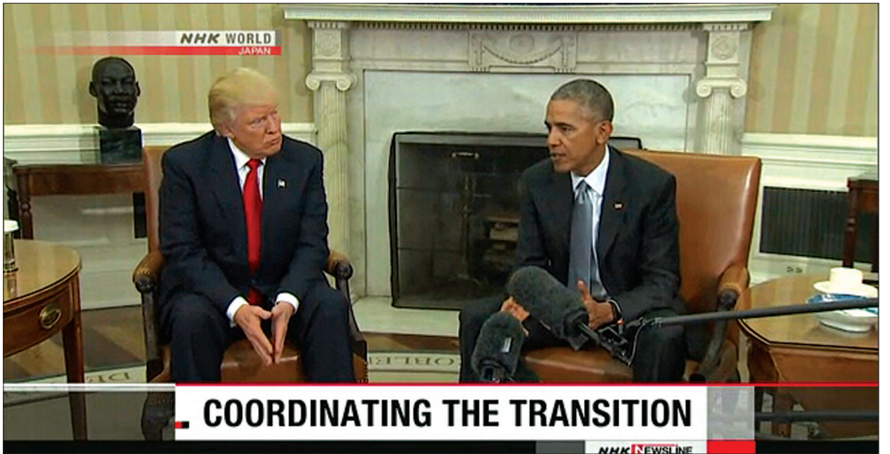
COORDINATING THE TRANSITION

နိုင်ငံ၌ကြုံတွေ့နေရသော စိန်ခေါ်မှုများကို အတူတကွဖြေရှင်းနိုင်ရေးမှာ