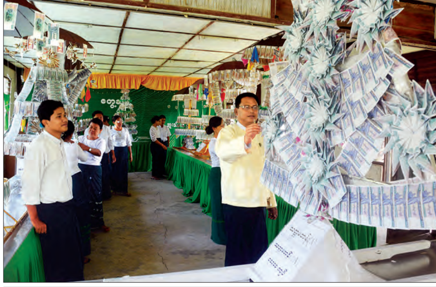
ဘူးသီးတောင်မြို့နယ် အထက်တန်းကျောင်း ကထိန်ခင်းရန် ပြင်ဆင်နေမှုကို တွေ့ရစဉ်

ပဒေသာပင်အား ရွှေသူရွှေနှင့် ပြုံးပျော်လျက်ရှိသည်ဖြစ်ကွင်း ကိုလည်း တွေ့ခဲ့ရသည်။ နောက်နေ့နံနက်ပိုင်း ကျောင်းဘုံ ကထိန်အတွက် ပဒေသာပင်များ ပြင်ဆင်နေပုံက ဒီဒေသ တွင် ဘာသာ၊ သာသနာ ထွန်းလင်းဖြာဝေနေသည့် သဘော ကိုအပြည့်အဝဆောင်သည်။ ကျောင်းဘုံကထိန်ပြုလုပ်မည့် ဘုန်းတော်ကြီးကျောင်းသို့ ဆရာ ဆရာမများနှင့်အတူ မနက်ဖြန်တွင် သွားရောက်ပို့ဆောင်ကြမည်ဟု ကျောင်းသား ကျောင်းသူများက အားတက်သရောဆိုသည်။ “ကျောင်းသားအားလုံးကို ရောနှောသင်ကြားပေးမယ့်