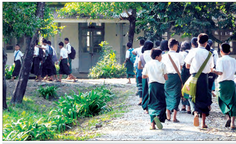
ဘူးသီးတောင်မြို့နယ် အထက်တန်းကျောင်း၌ ကျောင်းသားကျောင်းသူများ ကျောင်းတက်ရန်လာရောက်နေသည်ကို တွေ့ရစဉ်

ဘူးသီးတောင်မြို့နယ်သည် အောက်တိုဘာလ အကြမ်းဖက်မှုဖြစ်ပွားခဲ့သည့် မောင်တောမြို့နယ် နှင့် အနီးဆုံးတွင်ရှိသည့် မြို့နယ်ဖြစ်သော် လည်း တစ်ဖက်နှင့်တစ်ဖက် ယုံကြည်မှုလျော့ကျ မသွားစေရန်၊ နယ်မြေတည်ငြိမ်အေးချမ်းရန်နှင့် ဒေသဖွံ့ဖြိုးတိုးတက်ရေးရန် ပိုမိုလုပ်ဆောင်လျက် ရှိသည်ကို တွေ့ရ