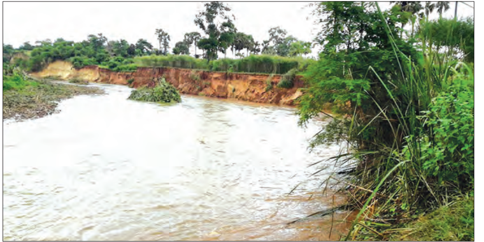
ရေးကွင်းဆင်းအဖွဲ့ ကျေးရွာကော်မတီ များဖွဲ့စည်းရန်၊ ရွှေ့ပြောင်းမည်လျာထား မြေနေရာအား ပုံစံ ၁၀၅/၁၀၆ ရေးဆွဲ ရေး၊ လယ်ယာမြေ အခြားနည်းအသုံးပြု ခွင့်ရရှိရေးတို့ကို လုပ်ထုံးလုပ်နည်းနှင့် အညီ ဆောင်ရွက်ရန်၊ တံတားဆောက် လုပ်ရန်အတွက် ပုလဲမြို့နယ် ဆည်မြောင်း ဦးစီးဌာနမှ အထက်အဆင့်ဆင့်သို့ တင်ပြဆောင်ရွက်ရန်နှင့် မြေပိုင်ရှင်များ နှင့် သဘောတူညီမှုများ ရယူဆောင် ရွက်ထားမည်ဖြစ်ကြောင်း သိရသည်။ (အောင်ကျော်မြင့်)

ရွက်နေပါကြောင်း၊ ပွင့်လင်းရာသီ ရောက်ပါက ဘက်ဟိုးယာဉ်များဖြင့် ဆက်လက်ရှင်းလင်းဆောင်ရွက်သွား မည်ဖြစ်ကြောင်း မြို့နယ်ဆည်မြောင်း ဦးစီးဌာန ဦးစီးမှူးက ရှင်းလင်းပြောကြား သည်။ ဆက်လက်၍ ငါးလင်းစေကျေးရွာ ကိုလည်း ရေပိုလွှဲတောင်ဘက်ရှိ ကုန်းမြင့်သို့ ရွှေ့ပြောင်းနေထိုင်လိုပါ ကြောင်းနှင့် လက်ရှိရေပိုလွှဲနေရာတွင် အာစီတံတားတစ်စင်းကို ဆည်မြောင်း ဦးစီးဌာနမှ ဆောက်လုပ်ပေးစေလို ကြောင်း ကျေးရွာ ရွာခွဲတာဝန်ခံက တင်ပြခဲ့ရာ ခရိုင်အုပ်ချုပ်ရေးမှူးက ကျေးရွာရွှေ့ပြောင်းရေး၊ မြို့နယ် ကြီးကြပ်မှုကော်မတီ မြေနေရာရွေးချယ်