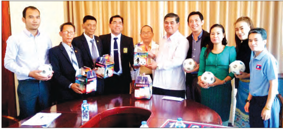
လာအိုနိုင်ငံခြင်းလုံးအဖွဲ့ချုပ်သို့ ငွေကြေးနှင့် ရိုးရာခြင်းလုံးများကူညီထောက်ပံ့ပေးနေစဉ်

မြန်မာ့ရိုးရာ ပိုင်းဖွံ့ဖြိုးလုံးဝတ်အားကစား တိုးတက်ပြန့်ပွားရေး အိမ်နီးချင်းပြည်ပနိုင်ငံများဖြစ်သည့် လာအိုနိုင်ငံနှင့် ကမ္ဘောဒီးယားနိုင်ငံများအား မြန်မာနိုင်ငံ ရိုးရာခြင်းလုံးအဖွဲ့ချုပ်မှ ငွေကြေးနှင့် နည်းပညာပိုင်းဆိုင်ရာများကို နိုဝင်ဘာ ၇ ရက်မှ ၁၁ အတွင်း သွားရောက်ကာ ကူညီထောက်ပံ့ပေးခဲ့ကြောင်း မြန်မာနိုင်ငံရိုးရာခြင်းလုံးအဖွဲ့ချုပ်မှ သိရသည်။