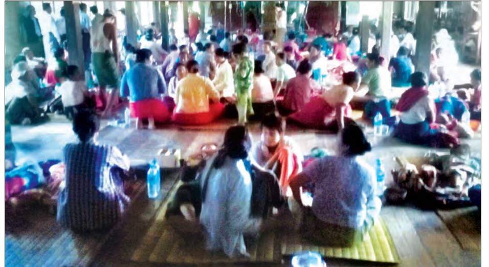
ဖြစ်ပြီး တာရှည်ခံဆေးများ ဖြန့်ထူးပြီး ချည်ပေါင်ရွက်၊ ဆလတ်ရွက်၊ ကန်စွန်းရွက်၊ ရေစင်အောင် မဆေးခြင်းကြောင့်လည်း ရုံးပတ်သီးများတွင် ဆေးဖျန်းမှုကြောင့် ကောင်း၊ ချည်ရည်ဟင်းတွင် ပါဝင်သော ရေပြောင်အောင် မဆေးသဖြင့်လည်း ကြားသည်၊ အောင်ဝင်းငြိမ်း(ကန်ဘာလူ)

ယင်းသို့ ဖြစ်ပွားရခြင်းမှာ ဧည့်ခံကျွေးမွေးသော ပဲပြုတ်သည် နှစ်ချို့ပဲများ