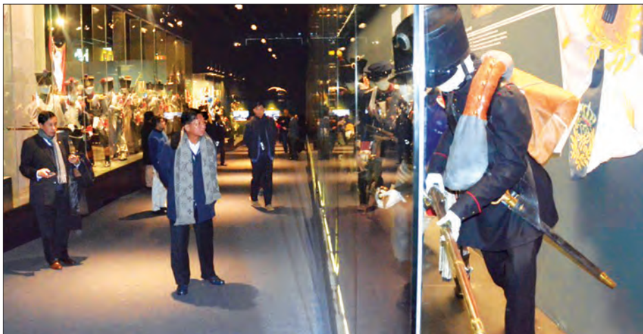
တပ်မတော်ကာကွယ်ရေးဦးစီးချုပ် ဝိုလ်ချုပ်မှူးကြီး မင်းအောင်လှိုင်နှင့်အဖွဲ့၊ Waterloo စစ်ပွဲအထိမ်းအမှတ်ပြတိုက်အား လေ့လာကြည့်ရှုစဉ်

ထို့နောက် တပ်မတော်ကာကွယ်ရေးဦးစီးချုပ်က အမှတ်တရပစ္စည်းများနှင့် စားသောက်ဖွယ်ရာများပေးအပ်ရာ သံအမတ်ကြီး ဦးပေါ်လွင်စိန်နှင့်အဖွဲ့ သံရုံးဝန်ထမ်းများက လက်ခံရယူကြသည်။