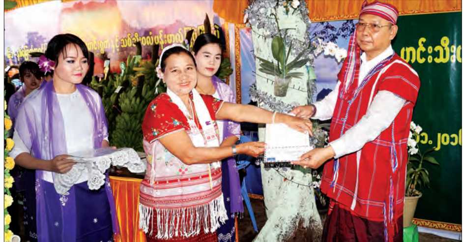
ပြည်ထောင်စုလွှတ်တော်နာယက၊ အမျိုးသားလွှတ်တော်ဥက္ကဋ္ဌ မန်းဝင်းခိုင်သန်း ဂုဏ်ပြုဆုရသူများအား ဆုချီးမြှင့်စဉ်

ဘားအံ နိုဝင်ဘာ ၇ (၆၁) နှစ်မြောက် ကရင်ပြည်နယ်နေ့ အခမ်းအနားကို နိုဝင်ဘာ ၇ ရက်က ဘားအံမြို့၊ ပြည်နယ်အစိုးရအဖွဲ့ရုံးရှေ့ မြက်ခင်းပြင်၌ကျင်းပရာ သဘာပတိ အဖြစ် ပြည်နယ်ဝန်ကြီးချုပ် ဒေါ်နန်းခင်ထွေးမြင့်၊ သဘာပတိအဖွဲ့ဝင်များ အဖြစ် ပြည်နယ်လွှတ်တော်ဥက္ကဋ္ဌ ဦးစောချစ်ခင်၊ ပြည်နယ်တရားလွှတ်တော် တရားသူကြီးချုပ် ဦးစောစံလင်းတို့က ဆောင်ရွက်ကြသည်။