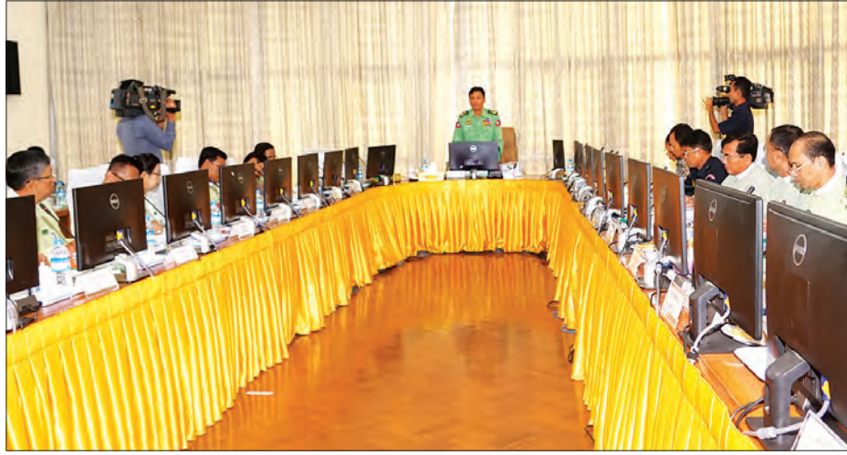
လွှဲပြောင်းခြင်းကို ကန့်သတ်သည့်ဥပဒေအရ ဆောင်ရွက်သည့်ကိစ္စရပ်များ စသည်တို့အား တည်ဆဲဥပဒေ၊ လုပ်ထုံးလုပ်နည်းများနှင့်အညီ အဂတိတရားကင်းရှင်းစွာဖြင့် အထူးအလေးထားဆောင်ရွက်သွားကြရန် လိုကြောင်း ပြောကြားသည်။ ဆက်လက်၍ နိုင်ငံတော်၏ လုံခြုံရေးနှင့်ပတ်သက်၍ ဂရုပြုဆောင်ရွက်ရန်

နှင့်အညီ ဖြည့်ဆည်းပေးရန် လိုအပ်ကြောင်း၊ ယနေ့ ဒီမိုကရေစီခေတ်တွင် ဒီမိုကရေစီသဘောတရား၊ ဒီမိုကရေစီစနစ်နှင့်အညီ လုပ်ငန်းတာဝန်များ အောင်မြင်အောင် ဆောင်ရွက်ရန် လိုအပ်ကြောင်း၊ ပြည်သူ့ရေးရာစီမံခန့်ခွဲမှုကိစ္စရပ်များတွင် အဆင့်ဆင့်သောဌာနဝန်ထမ်းများအနေဖြင့် ဥပဒေ၊ နည်းဥပဒေ၊ လုပ်ထုံးလုပ်နည်းများ ကျွမ်းကျင်ပိုင်နိုင်စွာဖြင့် စီမံခန့်ခွဲမှုပြုလုပ်ရန်လိုအပ်ကြောင်း၊ အထွေထွေအုပ်ချုပ်ရေးဦးစီးဌာနမှ တာဝန်ယူဆောင်ရွက်ပေးလျက်ရှိသော မြေလွှဲ၊ မြေသိမ်းနှင့် မြေငှားဂရုန်များ ထုတ်ပေးသည့် မြေယာစီမံခန့်ခွဲမှုကိစ္စရပ်များ၊ ယစ်မျိုးလိုင်စင်ထုတ်ပေးသည့် ကိစ္စရပ်များ၊ ဝန်ထမ်းရေးရာကိစ္စရပ်များ၊ ၂၀၁၇ ခုနှစ် မရွှေ့မပြောင်းနိုင်သော ပစ္စည်းများ