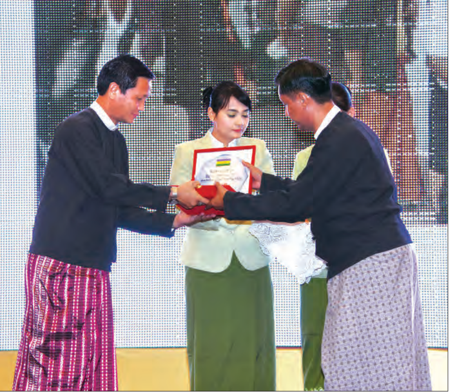
ဒုတိယသမ္မတ ဦးဟင်နရီပန်တီးယူ အကောင်းဆုံးဝန်ဆောင်မှုပေးနိုင်ခဲ့သည့် ပြည်သူ့ဝန်ဆောင်မှု (OSS) ရုံး မော်လမြိုင်အား ဆုချီးမြှင့်စဉ် (သတင်းစဉ်)

ဆက်လက်၍ အထွေထွေအုပ်ချုပ်ရေးဦးစီးဌာန သမိုင်းကြောင်းနှင့် လုပ်ငန်းစွမ်းဆောင်မှုမှတ်တမ်း Video Clip ကို ပြသသည်။ ဒုတိယသမ္မတသည် အခမ်းအနားသို့ တက်ရောက်လာကြသူများနှင့် မှတ်တမ်းတင်ဓာတ်ပုံရိုက်ကူးပြီး အထွေထွေအုပ်ချုပ်ရေး ဦးစီးဌာန၏ လှုပ်ရှားဆောင်ရွက်မှု ပြခန်းများအား လှည့်လည်ကြည့်ရှုသည်။ ယင်းနောက် ဒုတိယသမ္မတသည် အထွေထွေအုပ်ချုပ်ရေးဦးစီးဌာန နှစ်ပတ်လည်နေ့ အထိမ်းအမှတ် ညစာစားပွဲသို့ တက်ရောက်သည်။ ၁၉၈၈ ခုနှစ်နောက်ပိုင်း နိုင်ငံတော် ငြိမ်ဝပ်ပိပြားမှု တည်ဆောက်ရေးအဖွဲ့ကာလတွင် ပြည်ထောင်စု မြန်မာနိုင်ငံတော် အစိုးရအဖွဲ့က အမိန့်ကြော်ငြာစာအမှတ် (၄/၈၈) ဖြင့် “အထွေထွေအုပ်ချုပ်ရေးဦးစီးဌာန” ကို ၁၉၈၈ ခုနှစ် နိုဝင်ဘာလ ၇ ရက်နေ့မှစတင်၍ ပြန်လည်ဖွဲ့စည်းကြောင်း ကြေညာခဲ့သည့်အတွက် ယနေ့ ၂၀၁၆ ခုနှစ် နိုဝင်ဘာ ၇ ရက်တွင် (၂၈)နှစ်ကာလ ရောက်ရှိခဲ့ပြီဖြစ်သည်။ (သတင်းစဉ်)