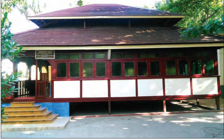
အရှင်ဇနကာဘိဝံသ ပျံလွန်တော်မူချိန်အထိ သီတင်းသုံးနေထိုင်ခဲ့ရာ ကျောင်းဆောင်

ပြုတိုက်အပြင်ပတ်လမ်းရှိ ခုံတစ်ခုပေါ်တွင် ထိုင်နေသည့်