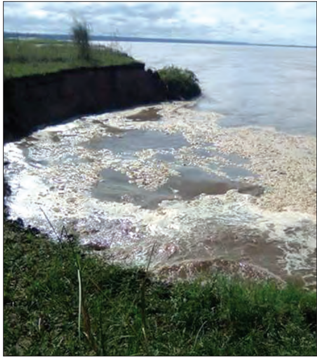
မြစ်ရေတိုက်စား၍ ကမ်းပါးများပြိုကျနေသည့် နေရာတစ်ခု

ကျေးရွာတွင် ယခင်က အိမ်ခြေ ၈၀ ရှိသည့်အနက် ၅၀ အိမ်မှာ ပြောင်းရွှေ့ရပြီးဖြစ်ကာ ကိုင်းမြေမှာလည်း ဧက ၃၀၀ ခန့် ရှိခဲ့ရာမှ ဧက ၅၀ ဝန်းကျင်သာ ကျန်ရှိတော့သည့်အတွက် ဒေသခံပြည်သူများမှာ နေထိုင်ရန် မြေနေရာအခက်အခဲအပြင် လုပ်ကိုင်