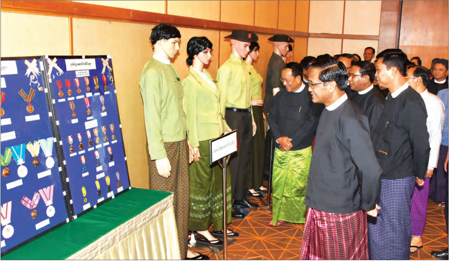
ဒုတိယသမ္မတ ဦးဟင်နရီဗန်ထီးယူ အထွေထွေအုပ်ချုပ်ရေးဦးစီးဌာန၏ လှုပ်ရှားဆောင်ရွက်မှုပြခန်းများအား လှည့်လည်ကြည့်ရှုစဉ် (သတင်းစဉ်)

ဆက်လက်၍ အမျိုးသားရေးတည်ဆောက်ရန် အခြေခံအုတ်မြစ်သည် အမျိုးသားညီညွတ်ရေးပင် ဖြစ်ကြောင်း၊ ပြည်ထောင်စုတစ်ခုတည်းမှ ပြည်ထောင်စုသားများဟူသည့် စိတ်ဓာတ်များဖြစ်ပေါ်လာရန် ညီညွတ်ရေးကို တည်ဆောက်ကြရမည်ဖြစ်ကြောင်း၊ စစ်မှန်သည့် ဒီမိုကရက်တစ်ဖက်ဒရယ်ပြည်ထောင်စု ထူထောင်ရေး ခြေလှမ်းတစ်ရပ်အနေဖြင့် ပြည်ထောင်စုငြိမ်းချမ်းရေးညီလာခံ- (၂၀)ရာစုပင်လုံကို ကျင်းပခဲ့ပါကြောင်း၊ ငြိမ်းချမ်းရေးလုပ်ငန်းစဉ်များကို ပြီးမြောက်အောင်မြင်အောင်လုပ်ဆောင်ပြီး ထာဝရငြိမ်းချမ်းရေးရရှိရန် ဆောင်ရွက်လျက်ရှိပါကြောင်း၊ စာမျက်နှာ ၄ ကော်လံ ၁ *