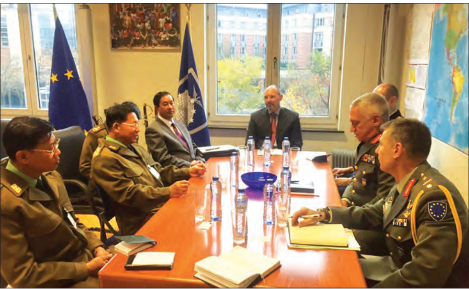
တပ်မတော်ကာကွယ်ရေးဦးစီးချုပ် ဝိုလ်ချုပ်မှူးကြီး မင်းအောင်လှိုင်နှင့် ဥရောပသမဂ္ဂစစ်ဘက်ဆိုင်ရာကော်မတီဥက္ကဋ္ဌ General Mikhail Kostarakos တို့ တွေ့ဆုံဆွေးနွေးစဉ်

ယင်းနောက် တပ်မတော်ကာကွယ်ရေးဦးစီးချုပ်နှင့် အဖွဲ့ဝင်များအား သံရုံးမိသားစုများက ညစာဖြင့် တည်ခင်းဧည့်ခံသည်။ တပ်မတော်ကာကွယ်ရေးဦးစီးချုပ်သည် ဥရောပသမဂ္ဂ စစ်ဘက်ဆိုင်ရာကော်မတီဥက္ကဋ္ဌ General Mikhail Kostarakos အား နိုဝင်ဘာ ၇ ရက် ဒေသစံတော်ချိန် နံနက် ၉ နာရီခွဲတွင် ဥရောပသမဂ္ဂ စစ်ဘက်ဆိုင်ရာကော်မတီဥက္ကဋ္ဌရုံးသို့ သွားရောက် တွေ့ဆုံသည်။