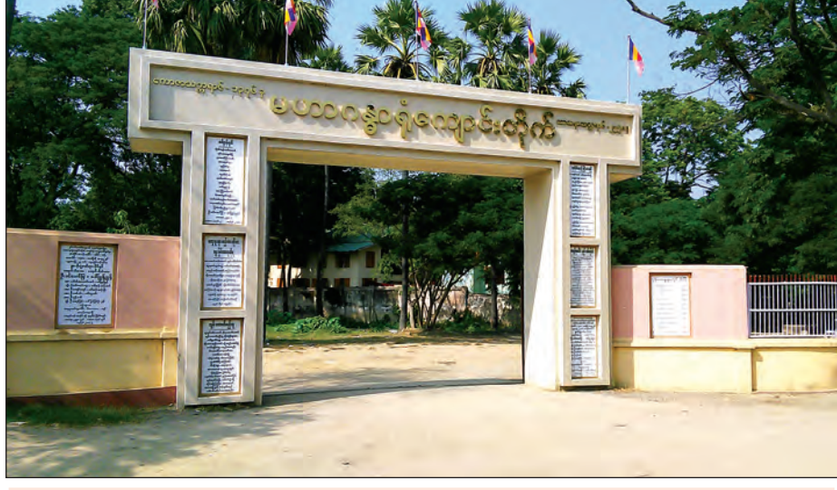
မဟာဂန္ဓာရုံကျောင်းတိုက် အဝင်မှခန့်ဦး

ကိုးကား တစ်ဘဝ သံသရာ (အရှင်ဇနကာဘိဝံသ) တစ်ဘဝ သာသနာ (ဦးယောသီတ)