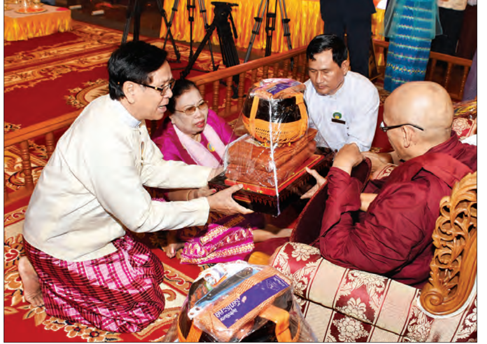
အမျိုးသားလွှတ်တော် ဒုတိယဥက္ကဋ္ဌ ဦးအေးသာအောင်နှင့်ဇနီးတို့က ဆရာတော်ထံ လှူဖွယ်ပစ္စည်းများ ဆက်ကပ်လှူဒါန်းစဉ် (သတင်းစဉ်)