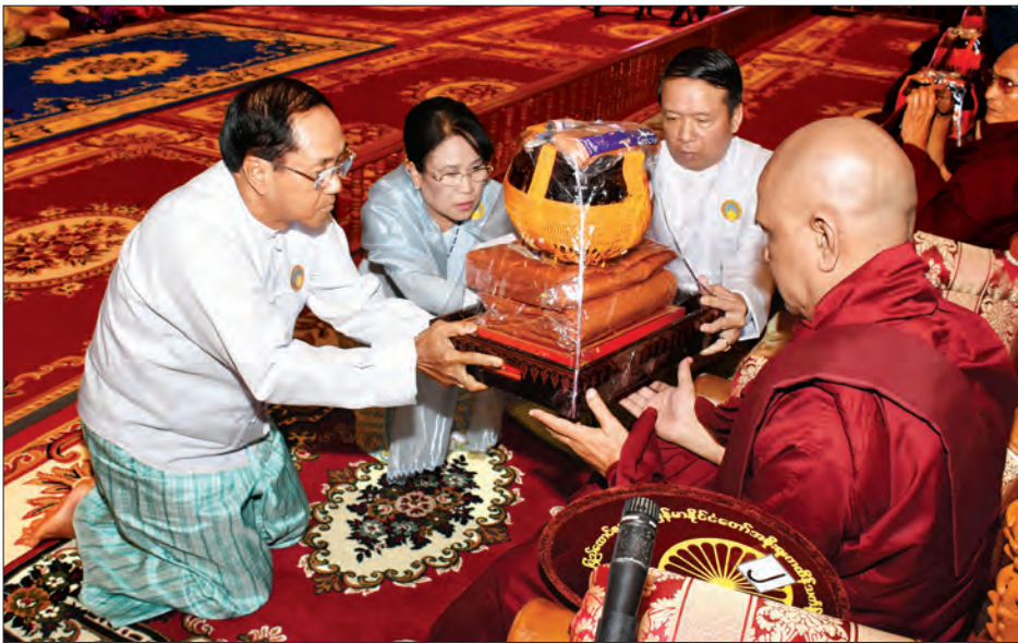
ဒုတိယသမ္မတ ဦးမြင့်ဆွေနှင့်ဇနီးတို့က ဆရာတော်ထံ လှူဖွယ်ပစ္စည်းများ ဆက်ကပ်လှူဒါန်းစဉ် (သတင်းစဉ်)