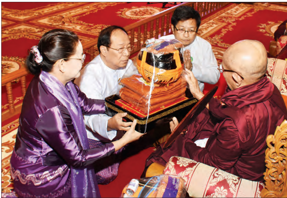
နိုင်ငံတော်စွဲစည်းပုံအခြေခံဥပဒေဆိုင်ရာခုံရုံးဥက္ကဋ္ဌ ဦးမျိုးညွန့်နှင့်ဇနီးတို့က ဆရာတော်ထံ လှူဖွယ်ပစ္စည်းများ ဆက်ကပ်လှူဒါန်းစဉ် (သတင်းစဉ်)

* ရှေ့မှ ပြည်ထောင်စုတရားသူကြီးချုပ် ဦးထွန်းထွန်းဦး၊ နိုင်ငံတော်စွဲစည်းပုံအခြေခံဥပဒေဆိုင်ရာခုံရုံးဥက္ကဋ္ဌ ဦးမျိုးညွန့်နှင့်ဇနီး၊ ဒုတိယတပ်မတော်ကာကွယ်ရေးဦးစီးချုပ် ကာကွယ်ရေးဦးစီးချုပ်(ကြည်း) ဒုတိယဗိုလ်ချုပ်မှူးကြီး စိုးဝင်းနှင့် ဇနီး၊ အမျိုးသားလွှတ်တော် ဒုတိယဥက္ကဋ္ဌ ဦးအေးသာအောင်နှင့်ဇနီး၊ ပြည်ထောင်စုဝန်ကြီးများ၊ ပြည်ထောင်စု ရှေ့နေချုပ်၊ ပြည်ထောင်စုစာရင်းစစ်ချုပ်၊ ပြည်ထောင်စုရာထူးဝန်အဖွဲ့ဥက္ကဋ္ဌနှင့် ၎င်းတို့၏ ဇနီးများ၊ နေပြည်တော်ကောင်စီဥက္ကဋ္ဌ၊ ဒုတိယဝန်ကြီးများ၊ ဌာနဆိုင်ရာ အကြီးအကဲများနှင့် တာဝန်ရှိသူများ တက်ရောက်ကြည့်ကြည့်ပါသည်။