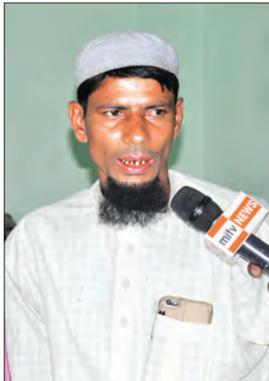
ဦးရှားအာလောမ်