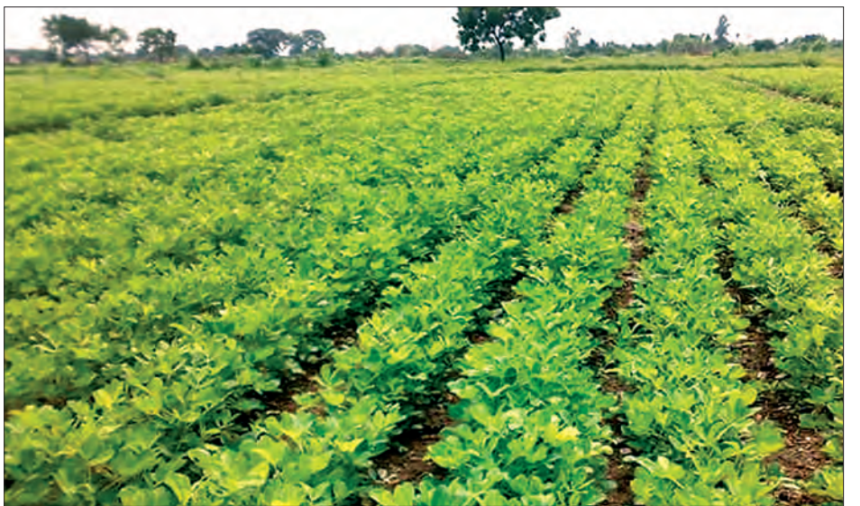
ရာက်မှုရှိခြင်းကြောင့် လိုအပ်ပါက ဒေသအလိုက် ရာသီဥတုပြောင်းလဲမှုအပေါ် မူတည်၍ စိုက်ချိန်နှင့်သီးနှံပုံစံ ပြောင်းလဲစိုက်ပျိုးနိုင်ရန် ဒေသအလိုက် သီးနှံပုံစံများနှင့် စဉ်ဆက်မပြတ်စမ်းသပ်ဆောင်ရွက်သင့်ကြောင်း တိုင်းဒေသကြီးစိုက်ပျိုးရေးတာဝန်ရှိသူက အကြံပြုထားသည်။

ခြင်း၊ နန်းထူထပ်စွာ ဖုံးလွှမ်းသွားသည့်အတွက် အပင်များ လုံးဝမြုပ်သွားသည့်အပြင် ရေလုံးဝထုတ်၍မရသော ရေပင်ဧရိယာများတွင် ပါဝင်သောကြောင့် စိုက်ကေများ လျော့နည်းကာ အထွက်နှုန်းလျော့နည်းခြင်းဖြစ်ကြောင်း သိရသည်။ ယခုအခါ ရာသီဥတုပြောင်းလဲလာခြင်းနှင့်အတူ သဘာဝဘေးအန္တရာယ်များကြောင့် သီးနှံစိုက်ပျိုးရာတွင် စိုက်ချိန်မှန်ကန်မှုမရှိသည့်အပြင် အချိန်အခါမဟုတ် မိုးရွာသွန်းခြင်း၊ မိုးပြတ်တောက်၍ အစိုဓာတ်မလုံလောက်ခြင်း၊ အပူချိန်မြင့်မားခြင်း၊ ပန်းပွင့်ချိန်မိုးကြီး၍ သန္ဓေမအောင်ခြင်း၊ အစေ့အဆန်ဖြစ်ထွန်းမှုအားနည်းခြင်း စသည့် အခြေအနေများ ကြုံတွေ့နေရကြောင်း သိရသည်။ ရာသီအလိုက် စိုက်ချိန်မှန်ကန်မှုသည် အထွက်ကို များစွာအကျိုးသက်