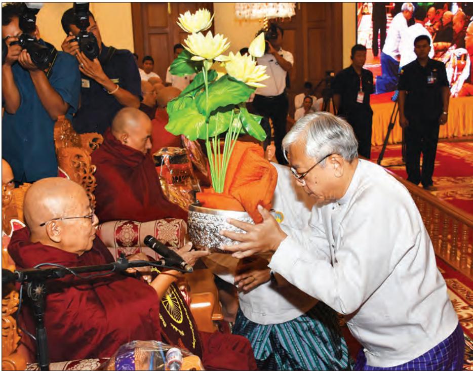
မဟာဝိသုတာရာမ ဈေးကုန်းကျောင်းတိုက်ဆရာတော် အဘိဓမမဟာရဋ္ဌဂုရု ဘဒ္ဒန္တ ကဝိသာရထံ နိုင်ငံတော်သမ္မတ ဦးထင်ကျော် ကထိန်လှူသက်န်း ဆက်ကပ်စဉ် (သတင်းစဉ်)