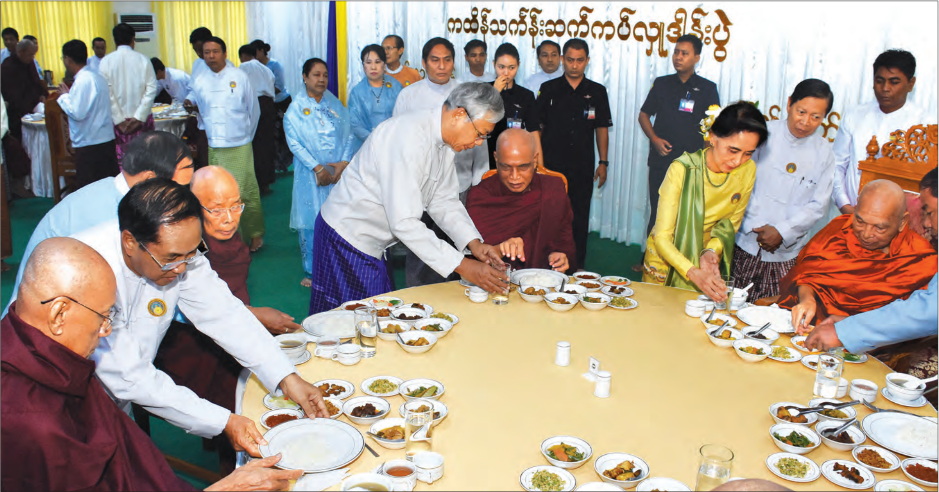
နိုင်ငံတော်သံယမဟာနာယကအဖွဲ့ဥက္ကဋ္ဌ ပန်းမော်ဆရာတော်အမှူးပြုသော ဆရာတော် သံယာတော်များအား နိုင်ငံတော်သမ္မတ ဦးထင်ကျော်၊ နိုင်ငံတော်၏အတိုင်ပင်ခံပုဂ္ဂိုလ် ဒေါ်အောင်ဆန်းစုကြည်နှင့် ညွှန်ကြားရေးမှူးချုပ်များက နေ့ဆွမ်းဆက်ကပ်စဉ် (သတင်းစဉ်)

၁၃၇၈ ခုနှစ်၊ တန်ဆောင်မုန်းလဆန်း ၈ ရက် ၂၀၁၆ ခုနှစ်၊ နိုဝင်ဘာ ၇ ရက်၊ တနင်္လာနေ့၊ အတွဲ (၅၆)၊ အမှတ် (၀၃၅)