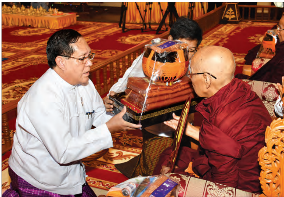
ပြည်ထောင်စုတရားသူကြီးချုပ် ဦးထွန်းထွန်းဦးက ဆရာတော်ထံ လှူဖွယ်ပစ္စည်းများ ဆက်ကပ်လှူဒါန်းစဉ် (သတင်းစဉ်)