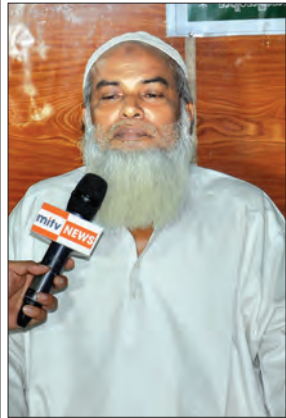
အာရ်ဟူစိန်

ရခိုင်ပြည်နယ် မောင်တောခရိုင်အတွင်း အောက်တိုဘာ ၉ ရက်က အကြမ်းဖက်စီးနင်းတိုက်ခိုက်ခံရမှုကြောင့် တပ်မတော်နှင့် မြန်မာနိုင်ငံရဲတပ်ဖွဲ့က တရားဥပဒေနှင့်အညီ နယ်မြေရှင်းလင်းရေး၊ လုံခြုံရေးနှင့် တည်ငြိမ်အေးချမ်းရေးတို့ကို ဆောင်ရွက်လျက်ရှိသော်လည်း ပြည်ပမီဒီယာအချို့က အခြေအနေမမှန်ကို မျက်ကွယ်ပြုပြီး ပုံကြီးချဲ့ပြောဆိုမှုများ၊ လူမျိုးရေးနှင့် ဘာသာရေးဖိနှိပ်မှုအသွင် ထုတ်လွှင့်ရေးသားမှုများအပြင် လုံခြုံရေးတပ်ဖွဲ့ဝင်များကို ဂုဏ်သိက္ခာထိခိုက်စေနိုင်သော ထုတ်လွှင့်ရေးသားမှုများ ပြုလုပ်လျက်ရှိရာ အဆိုပါကောလာဟလသတင်းများနှင့်ပတ်သက်၍ မောင်တောမြို့နယ်ရှိ ဒေသခံတိုင်းရင်းသားများနှင့် ဒေသနေ အစ္စလာမ်ဘာသာဝင်များအား တွေ့ဆုံမေးမြန်းခဲ့မှုများကို ဖော်ပြလိုက်ပါသည်။