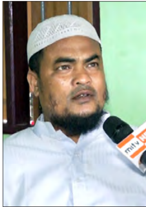
ဦးဇီယာအူဒိန်