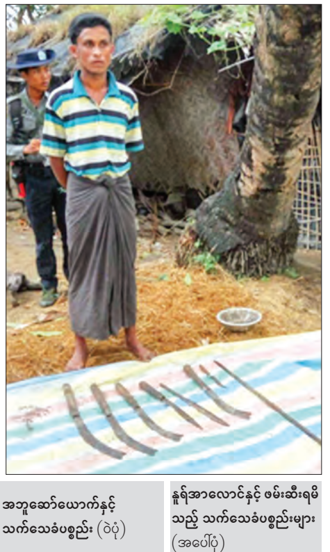
အဘူဆော်ယောက်နှင့် သက်သေခံပစ္စည်း (၇၀)