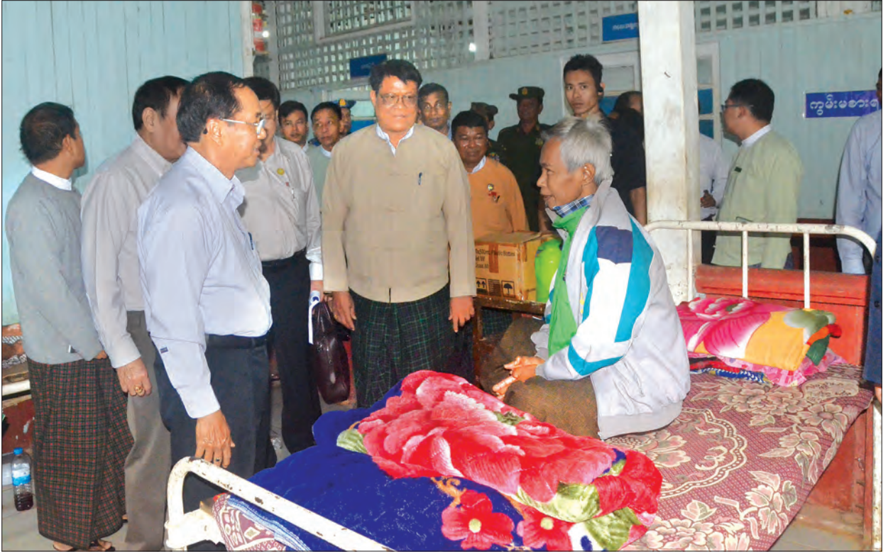
ဒုတိယသမ္မတ ဦးမြင့်ဆွေ ခန္တီးပြည်သူ့ဆေးရုံ၌ ဆေးကုသမှုခံယူနေသော လူနာများအား အားပေးစကားပြောကြားစဉ် (သတင်းစဉ်)