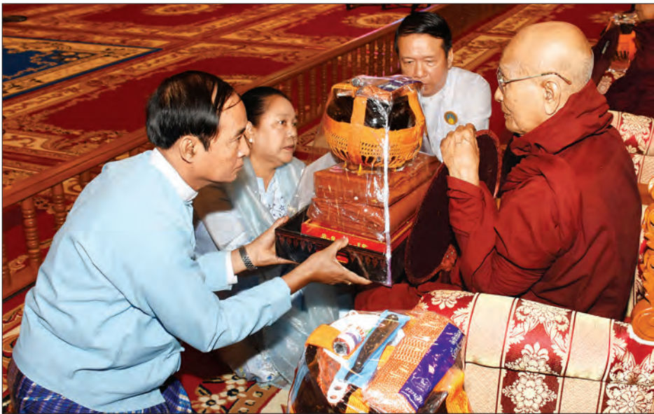
ပြည်သူ့လွှတ်တော်ဥက္ကဋ္ဌ ဦးဝင်းမြင့်နှင့်ဇနီးတို့က ဆရာတော်ထံ လှူဖွယ်ပစ္စည်းများ ဆက်ကပ်လှူဒါန်းစဉ် (သတင်းစဉ်)