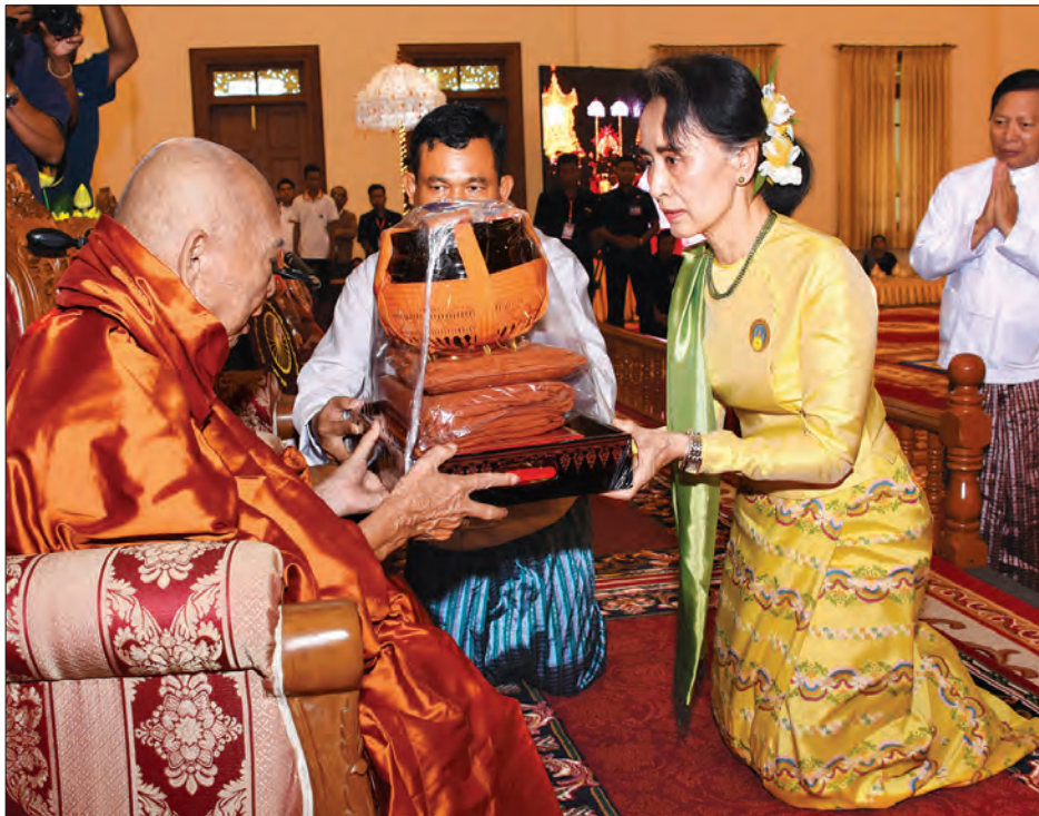
နိုင်ငံတော်သံယမဟာနာယကအဖွဲ့ဥက္ကဋ္ဌ မန္တလေးမြို့ပန်းမော်ကျောင်းတိုက် ပဓာနနာယက အဘိဓမမဟာရဋ္ဌဂုရု အဘိဓမအဂ္ဂမဟာ သဒ္ဓမ္မဇောတိက ဒေါက်တာဘဒ္ဒန္တကုမာရာဘိဝံသထံ နိုင်ငံတော်၏အတိုင်ပင်ခံပုဂ္ဂိုလ် ဒေါ်အောင်ဆန်းစုကြည် လှူဖွယ်ပစ္စည်းများ ဆက်ကပ်လှူဒါန်းစဉ် (သတင်းစဉ်)