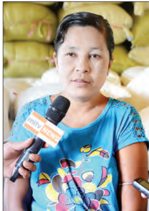
မအေးအေးခိုင်