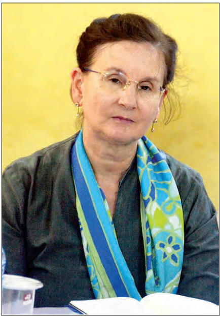
သတင်း - ရဲခေါင်ညွှန်