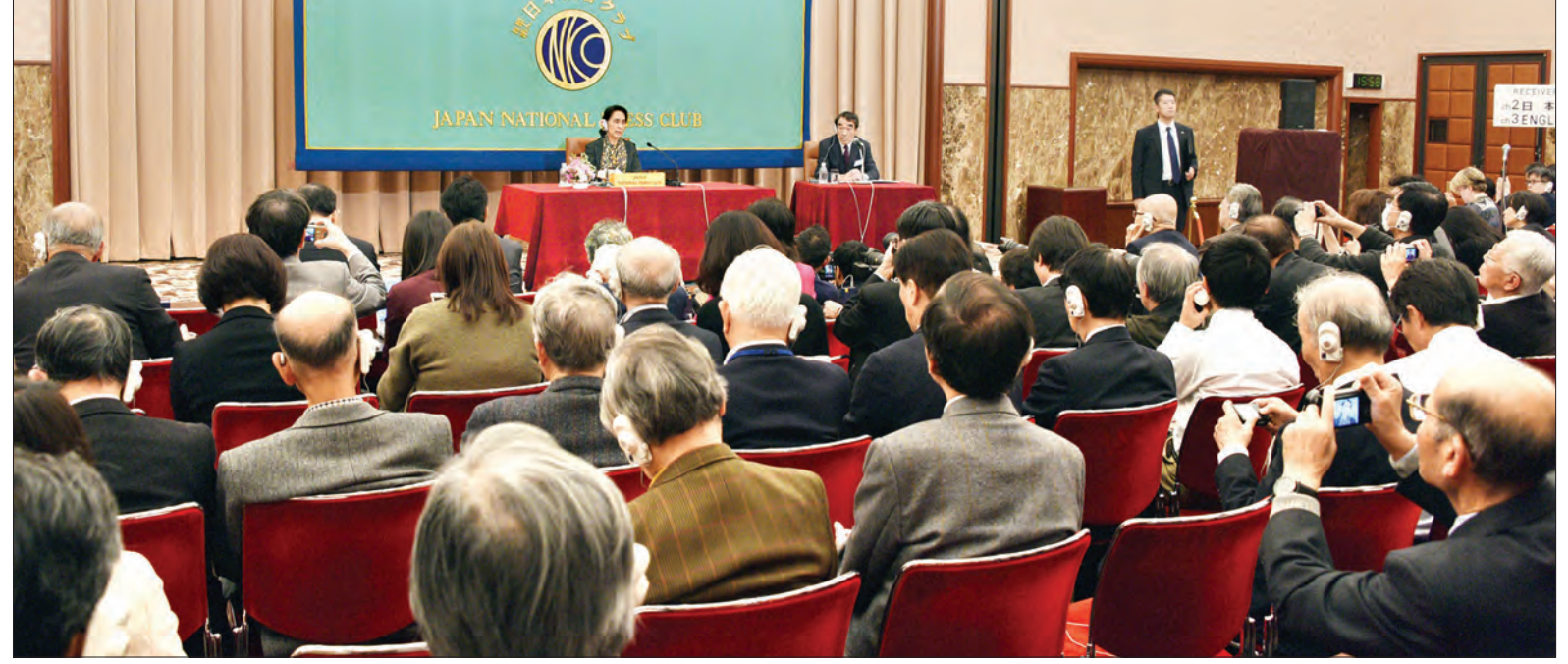
နိုင်ငံတော်၏ အတိုင်ပင်ခံပုဂ္ဂိုလ် ဒေါ်အောင်ဆန်းစုကြည် ဂျပန်အမျိုးသား သတင်းထောက်များအသင်း၌ မီဒီယာများနှင့် တွေ့ဆုံစဉ်