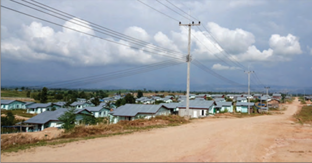
မြဝတီမြို့နယ် သောင်ရင်းမြစ်ကမ်းနံဘေးမှ လေးကျေကော်မြို့သစ်

ရွက်နိုင်ရန် သက်ဆိုင်ရာ ပြည်နယ်အစိုးရ၊ ပြည်ထောင်စုဝန်ကြီးဌာနများသို့ တင်ပြ ထားဆဲဖြစ်ကြောင်း သိရှိရသည်။ ထိုစက်ရုံနေရာမှတစ်ဆင့် ဆက်လက်သွားရောက် လျှင် ဒေသအခေါ် ဂူတောင်သို့ ရောက်ရှိသွားမည်ဖြစ်သည်။ ဂူတောင်ပေါ်တွင်လည်း ဘုရားပုထိုးစေတီများကို တင်တယ်သပွယ်စွာ ဖူးတွေ့ရသည်။ ကျောက်စက်ပန်းဆွဲ များနှင့် ဂူသေးသေးလေးတစ်ခုလည်းရှိနေသဖြင့် ဂူတောင်ဟုခေါ်ခြင်း ဖြစ်ပေလိမ့် မည်။ ယင်းဂူတောင်တစ်ဝိုက်၌ ရေထွက်များတည်ရှိနေပေရာ လေးကျေကော်မြို့သစ် ရေပေးဝေရေးအတွက် အကျိုးရှိစွာအသုံးပြုလျက်ရှိကြောင်း တွေ့ရသည်။ မြဝတီမြို့ သို့ရေပေးနေသော လက်ခတ်တောင်နှင့်လည်း တောင်ကြောတစ်ကြောတည်းဖြစ်၏။