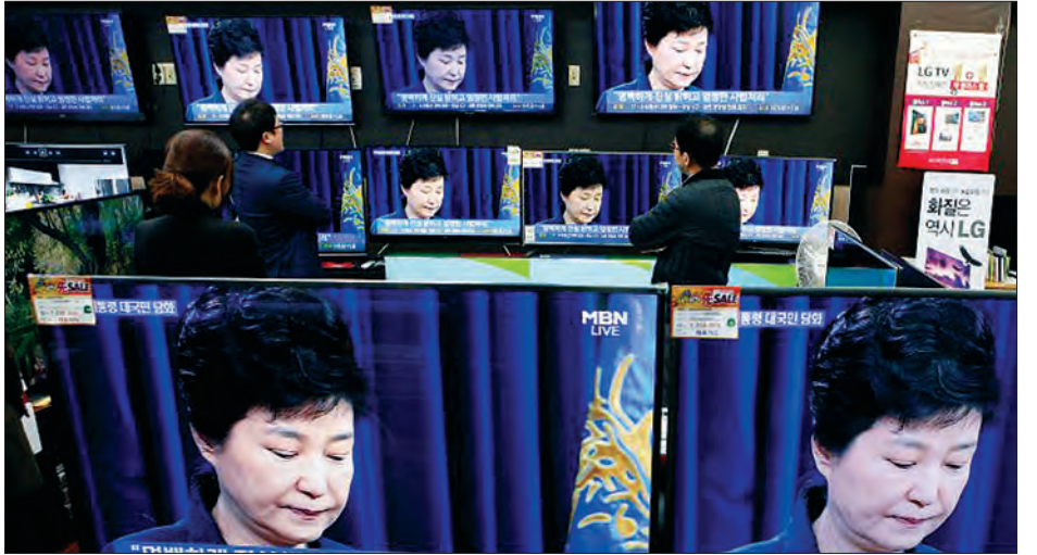
ပြောခြင်းအပေါ် အလွန်တရာ နောင်တရမိကြောင်း၊ နိုင်ငံ၏စီးပွားရေးနှင့် ပြည်သူများ၏ဘဝကို ကူညီရန်လုပ်ဆောင်ခြင်းဖြစ်ကြောင်း ပက်က ချိုင်ကိုရည်ညွှန်းလျက် ပြောဆိုခဲ့သည်။ သမ္မတပက်ကအနေဖြင့် ရာထူးမှဆင်းပေးရန် အများပြည်သူနှင့် ဆန့်ကျင်ဘက်နိုင်ငံရေးအဖွဲ့အစည်းများ၏တိုက်တွန်းမှုများနှင့် ရင်ဆိုင်နေရသည်။ (ရိုက်တာ)

တစ်စုံတစ်ယောက်သောသူများက အကျိုးအမြတ်ယူပြီး တရားဥပဒေနှင့်မလျော်ညီသောလုပ်ရပ်များကို ကျူးလွန်သည်ဟု