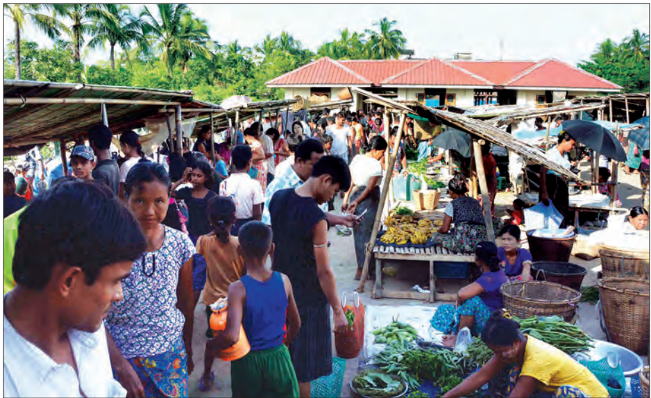
မောင်တောမြို့ပေါ်ရှိ စာသင်ကျောင်းများ ပြန်လည်ဖွင့်လှစ်ရာ ကျောင်းသား ကျောင်းသူများ ကျောင်းဆင်းလာသည်ကို တွေ့ရစဉ် (ပုံ) နှင့် ဈေးများ၌ ရောင်းသူ ဝယ်သူများဖြင့် စည်ကားနေသည်ကို တွေ့ရစဉ် (အပေါ်ပုံ)