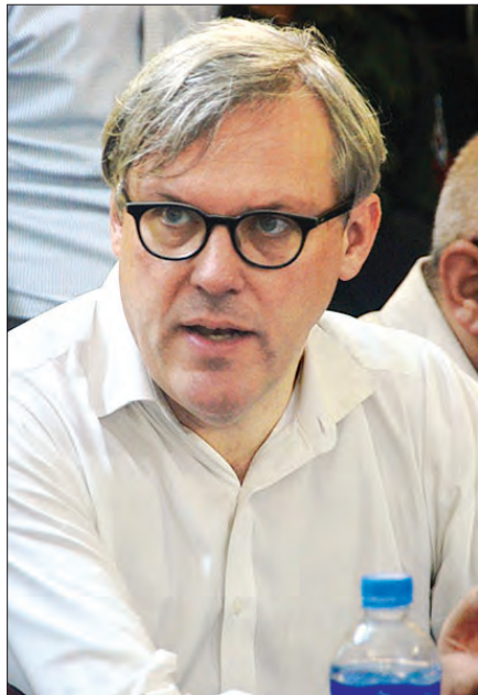
ဗြိတိန်သံအမတ်ကြီး အင်ဒရူး ပက်ထရစ်

ကျွန်မတို့သွားတဲ့အခါ ရွာတွေမှာ အချို့အိမ်တွေ မီးလောင်ထားတာ တွေ့ရပါတယ်။ အချို့အိမ်တွေက အခုထက်ထိ ရှိနေသေးတာ တွေ့ရပါတယ်။ ကျွန်မတို့သွားခဲ့တဲ့ ရွာတွေမှာ ထွက်ပြေးသွားတာ သိရပေမယ့် အချို့ကလည်း ပြန်လာနေပြီဆိုတာ သိရပါတယ်။