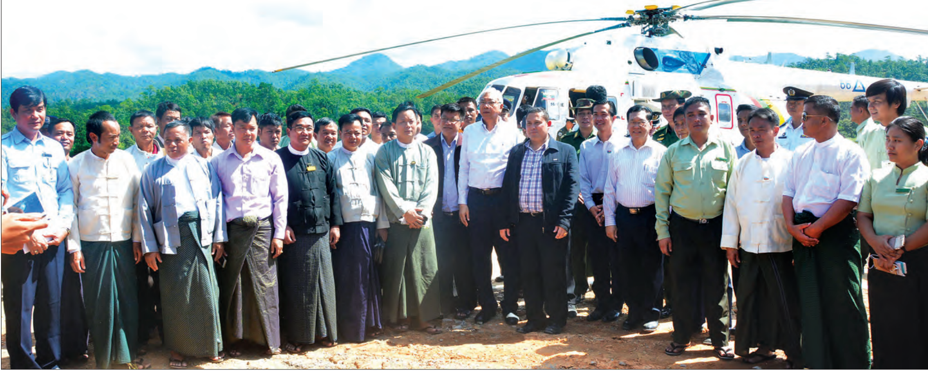
နိုင်ငံတော်သမ္မတ ဦးထင်ကျော် မယ်စွဲမြို့၌ ဒေသခံများ၊ ပြည်သူများ၊ ဌာနဆိုင်ရာများမှ အမှုထမ်း၊ အရာထမ်းများနှင့်အတူ စုပေါင်း၍ မှတ်တမ်းဓာတ်ပုံရိုက်စဉ် (သတင်းစဉ်)

နေပြည်တော် နိုဝင်ဘာ ၄ နိုင်ငံတော်သမ္မတ ဦးထင်ကျော်သည် ပြည်ထောင်စုဝန်ကြီး ဒေါက်တာသန်းမြင့်၊ ဦးသိန်းဆွေ၊ ဦးစေတင်ထွန်း၊ ပြည်နယ်ဝန်ကြီးချုပ် ဦးအယ်လ်ဇော်၊ ကာကွယ်ရေးဦးစီးချုပ်ရုံး(ကြည်း)မှ ဒုတိယဗိုလ်ချုပ်ကြီး အေးဝင်း၊ အရှေ့ပိုင်းတိုင်းစစ်ဌာနချုပ်တိုင်းမှူး ဗိုလ်ချုပ် ဝင်းမင်းထွန်း၊ ဒုတိယဝန်ကြီး ဗိုလ်ချုပ်သန်းထွဋ်၊ တာဝန်ရှိသူများနှင့်အတူ ယနေ့နံနက်ပိုင်းတွင် လွိုင်ကော်မြို့၊ သီရိမင်္ဂလာတောင်တော်ရှိ တောင်ကွဲစေတီတော်နှင့် ဆုတောင်းပြည့် မြို့နယ်ဘုရားတို့အား သွားရောက်ဖူးမြော်ကြည့်ကာ ပန်း၊ ရေချမ်း၊ ဆီမီးနှင့် အလှူငွေများကို ဆက်ကပ်လှူဒါန်းခဲ့သည်။ စာမျက်နှာ ၃ ကော်လံ ၁