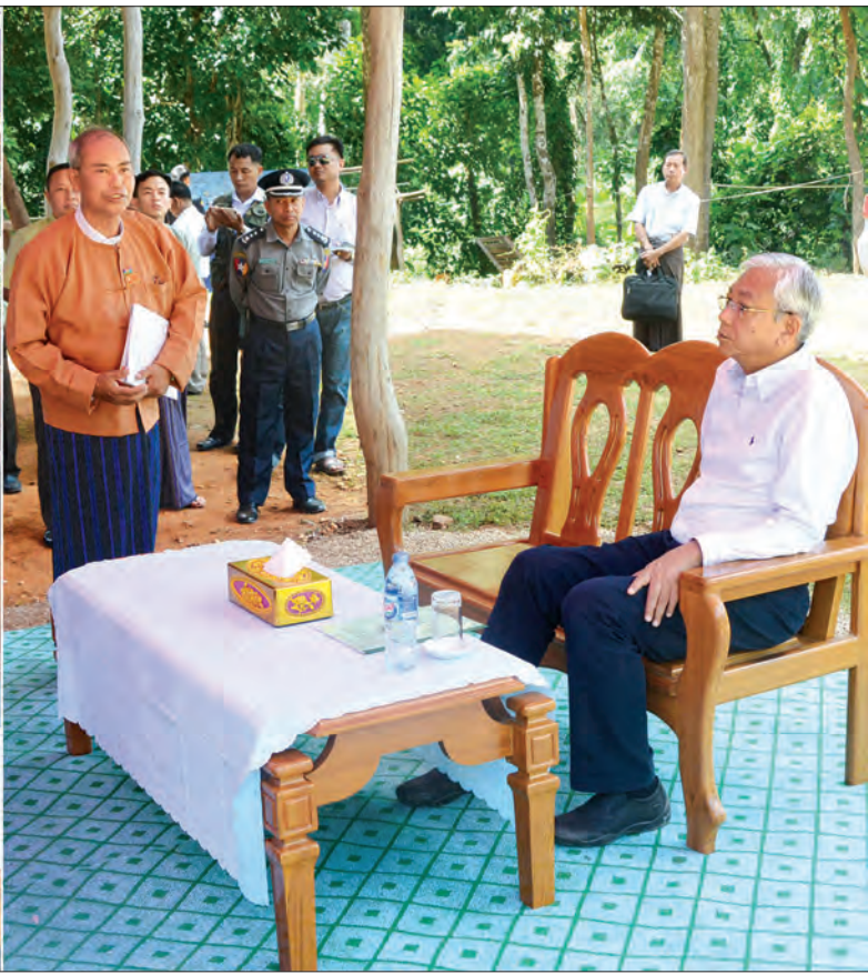
နိုင်ငံတော်သမ္မတ ဦးထင်ကျော် ကယားပြည်နယ် မယ်စုံမြို့ရှိ မယ်စုံနယ်စပ်ကုန်သွယ်ရေးစခန်း၌ ဌာနဆိုင်ရာများ၊ မြို့မြို့မြို့များ၊ ကုန်သည်လုပ်ငန်းရှင်များ၊ ဒေသခံပြည်သူများနှင့် တွေ့ဆုံစဉ် (သတင်းစဉ်)

ထားရှိမှု၊ ရရှိနိုင်မည့် အကျိုးကျေးဇူးများ၊ ဘဏ္ဍာငွေရရှိမှုနှင့် လိုအပ်မှုအခြေအနေ၊ ထိုင်း-မြန်မာ နှစ်နိုင်ငံ အပြန်အလှန် တရားဝင်ကူးသန်းသွားလာနေထိုင်နိုင် ခွင့်ပြုနိုင်ရန်အတွက် လိုအပ်သည့် အခြေအနေများကို ရှင်းလင်းတင်ပြ သည်။