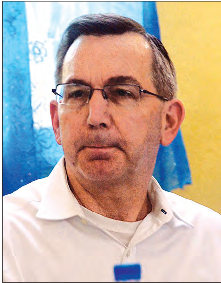
အမေရိကန်သံအမတ်ကြီး မစ္စတာ မာစီရယ်လ်