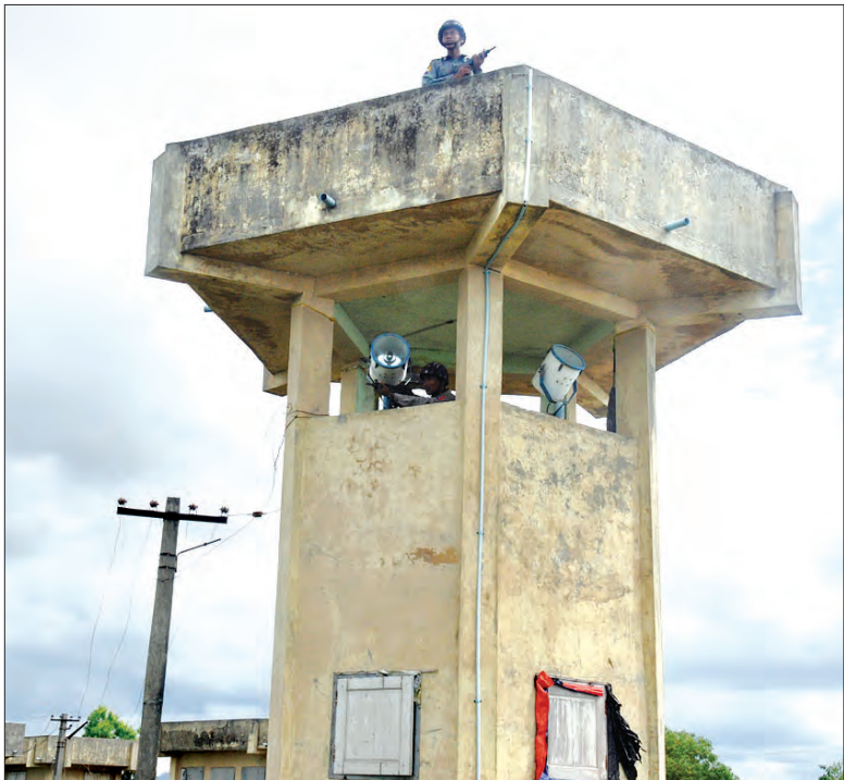
နယ်မြေလုံခြုံရေးအတွက် လုံခြုံရေးကင်းချထားမှုကို တွေ့ရစဉ်