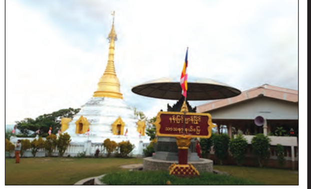
ဂူတောင်ပေါ်တွင် ဖူးတွေ့ရသော နန်းမြိုင်ချာန်မြိုင်စေတီတော်

မေတ္တာလင်းမြိုင်ကျေးရွာနှင့် မလမ်းမကမ်း မြေဧက ၃၅ ဧကပေါ်၌ အထည်ချုပ် စက်ရုံတစ်ရုံ တည်ဆောက်ထားပြီး ကျွမ်းကျင်လုပ်သား ၂၆၀ ဖြင့် လည်ပတ်ဆောင်