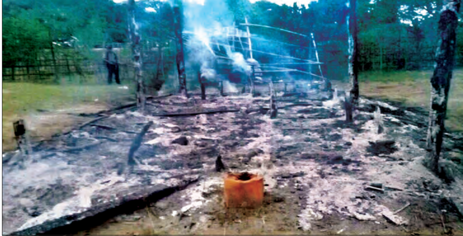
နယ်ခြားစောင့်ရဲတပ်ဖွဲ့မှ စွန့်လွှတ်ထားသော မြင်းလွတ်ရွာသစ် ရဲကင်းစခန်းဟောင်းအား မီးရှို့ဖျက်ဆီးထားမှုကို တွေ့ရစဉ်

ထိုသို့ မီးရှို့ဖျက်ဆီးမှုကြောင့် သက်ငယ်မိုး၊ ဝါးထုံကော၊ ဝါးကြမ်းခင်းအိပ်ဆောင်ဟောင်း နှစ်လုံး၊ သက်ငယ်မိုး ထမင်းချက် တံတစ်လုံးနှင့် သံအိတ်ဖြင့် ပြုလုပ်ထားသော ဘန်ကာတစ်ခုတို့ မီးလောင်ခဲ့ပြီး ညနေ ၃ နာရီခွဲခန့်တွင် မီးငြိမ်းသွားခဲ့သည်။ အဆိုပါရဲကင်းစခန်းမှာ အောက်တိုဘာ ၁၁ ရက်မှစ၍ နယ်ခြားစောင့်ရဲတပ်ဖွဲ့များ တပ်စွဲခြင်းမပြုတော့ဘဲ စွန့်လွှတ်ထားသော ရဲကင်းစခန်းဟောင်းဖြစ်ပြီး ၎င်းအနီးတစ်ဝိုက်သို့ လုံခြုံရေးတပ်ဖွဲ့ဝင်များပူးပေါင်း၍ နယ်မြေရှင်းလင်းလျက်ရှိကြောင်း သတင်းရရှိသည်။ (သတင်းစဉ်)