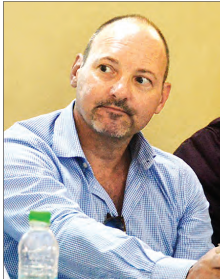
ဥရောပသမဂ္ဂ သံအမတ်ကြီး မစ္စတာ ရိုလန်