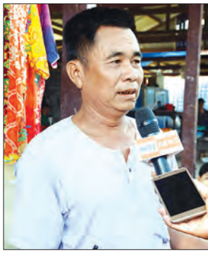
ဦးလှစိုး သုံးမိုင်ရပ်ကွက် (သတင်းစဉ်)

“ဒီပျံကျဈေးကတော့ နံနက် ၆ နာရီလောက်ကနေ မွန်းတည့် ၁၂ နာရီလောက်အထိတော့ အရောင်းအဝယ်မပျက်