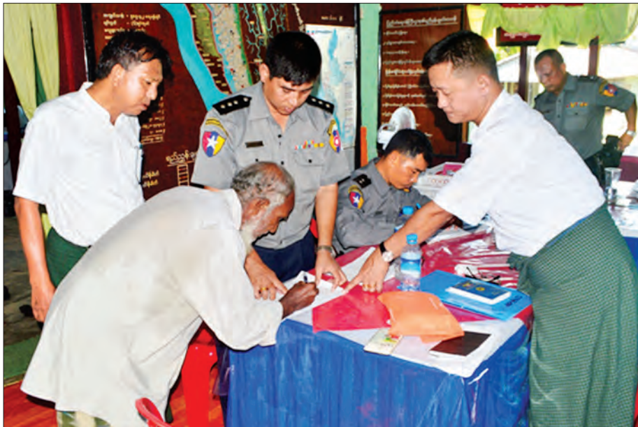
မသင်္ကာ၍ ဖမ်းဆီးစစ်ဆေးနေသူတစ်ဦးကို အာမခံဖြင့် ပြန်လွှတ်ပေးစဉ်

ခံထားရသူ သုံးဦး၊ မောင်တောမြို့မရဲစခန်းမှ နှစ်ဦး၊ ငါးခုရ နယ်မြေ ရဲစခန်းမှ ၃၄ ဦး၊ ပြင်ဖြူနယ်မြေရဲစခန်းမှ ၃၅ ဦး စုစုပေါင်း ၇၄ ဦးကိုမူ ရိမန့်ယူ၍ ဆက်လက်စစ်ဆေးလျက် ရှိသည်။ ထိုသို့စစ်ဆေးရာတွင် နိုင်စက်ညှဉ်းပန်းမူမပြုလုပ်ဘဲ အိပ်ချိန်၊ စားချိန် စနစ်တကျစီစဉ်ထားရှိသည့်အပြင် စစ်ဆေးမှု အားလုံးကိုလည်း ဝီဒီယိုမှတ်တမ်းတင်ထားရှိကြောင်း သိရ သည်။ ထို့ပြင် ဖမ်းဆီးစစ်ဆေးနေသူများတွင် ကျန်းမာရေး လိုအပ်ချက်ရှိပါက ဆေးကုသမှုများကိုလည်း ဆရာဝန်များနှင့် ကျန်းမာရေးဝန်ထမ်းများက အချိန်နှင့်တစ်ပြေးညီ ကုသ စောင့်ရှောက်မှုပေးလျက်ရှိကြောင်း သိရသည်။ (သတင်းစဉ်)