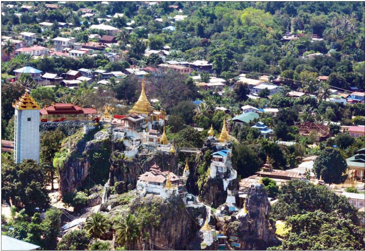
လျှင်ကော်မြို့၊ သီရိမင်္ဂလာတောင်တော်ရှိ တောင်ကွဲစေတီတော်ကို ဖူးတွေ့ရစဉ် (သတင်းစဉ်)

ပြည်ထောင်စုဝန်ကြီး ဒေါက်တာ သန်းမြင့်က နိုင်ငံ၏ စီးပွားရေးဖွံ့ဖြိုး တိုးတက်မှုအတွက် ကုန်စည်ကူးသန်း ရောင်းဝယ်ရေးကဏ္ဍ တိုးမြှင့်ဖော်ဆောင် နေမှုအခြေအနေများကို လည်းကောင်း၊ ပြည်ထောင်စုဝန်ကြီး ဦးသိန်းဆွေက အိမ်နီးချင်းနိုင်ငံများနှင့် တရားဝင်နယ်စပ် ကုန်သွယ်ရေးစခန်းများ ဖွင့်လှစ်နိုင်ရေး ဆောင်ရွက်နေမှုနှင့် နှစ်နိုင်ငံပြည်သူများ အပြန်အလှန် ဝင်ထွက်သွားလာနေထိုင် နိုင်ရေး ဆောင်ရွက်နေမှုအခြေအနေများ ကို လည်းကောင်း၊ ပြည်ထောင်စုဝန်ကြီး