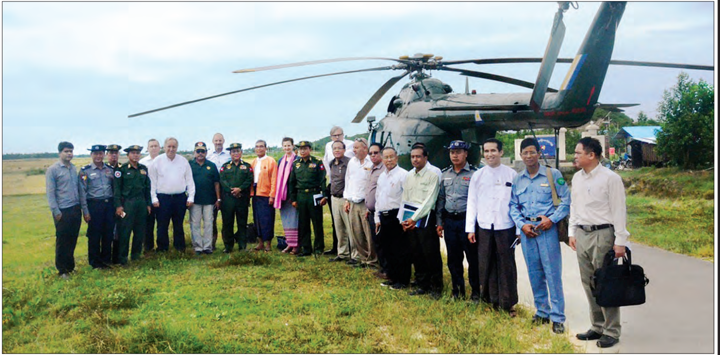
ရခိုင်ပြည်နယ် ရသေ့တောင်မြို့နယ် ကိုးတန်ကောက်ကျေးရွာရှိ အစွလာမ်ဘာသာဝင်များထံ သွားရောက်စဉ် UNDP မှ တာဝန်ရှိသူ နှင့် သံအမတ်ကြီးများ စုပေါင်းမှတ်တမ်းတင် ဓာတ်ပုံရိုက်စဉ်

“နောက်တစ်ခုက တစ်နေရာကျတော့ ဒီလိုမဟုတ်ပြန်ဘူး။ လုံခြုံရေးတပ်ဖွဲ့တွေ ရှိနေတဲ့အတွက် ရွာထဲမှာပဲ နေချင်တယ်။ ဒါဟာ သူတို့အတွက် ပိုလုံခြုံစိတ်ချသလို ခံစားရတယ်။”