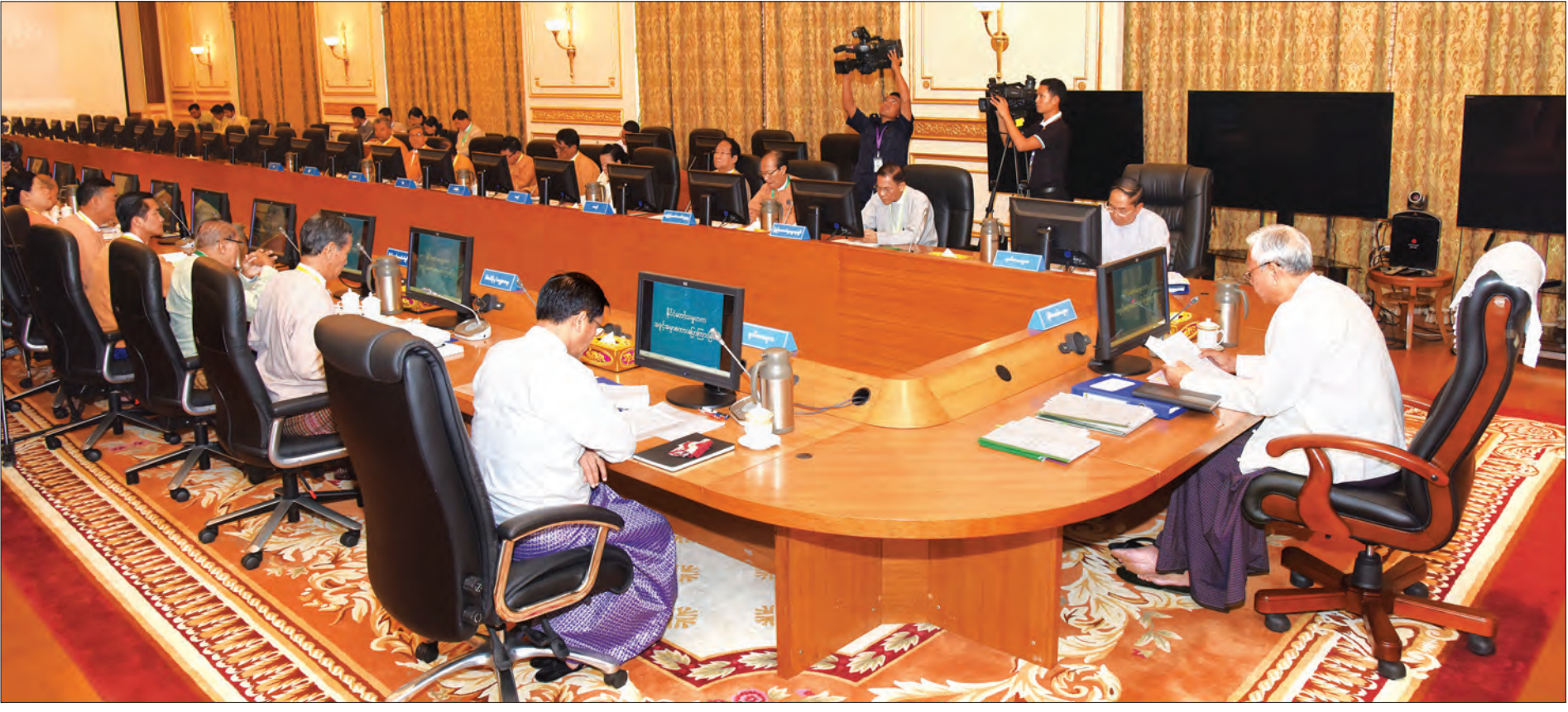
ဘဏ္ဍာရေးကော်မရှင်ဥက္ကဋ္ဌ နိုင်ငံတော်သမ္မတ ဦးထင်ကျော် ဘဏ္ဍာရေးကော်မရှင်(၂/၂၀၁၆) အစည်းအဝေးတွင် အမှာစကားပြောကြားစဉ် (သတင်းစဉ်)

နိုင်ငံတော်အနေဖြင့် ငွေရေးကြေးရေးနယ်ပယ်တွင် ပြုပြင်ပြောင်းလဲမှုများ တိုးမြှင့်ဆောင်ရွက်ရန် ပြင်ဆင်နေပြီဖြစ်