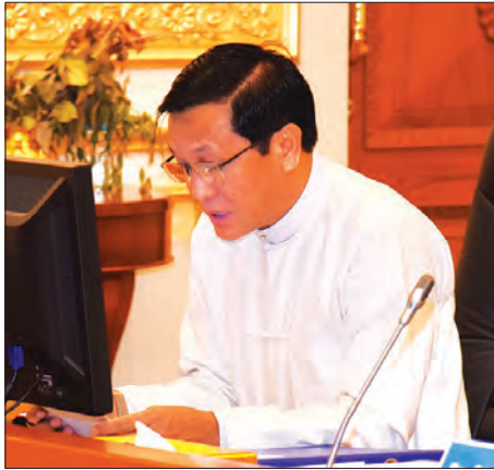
ဘဏ္ဍာရေးကော်မရှင် ဒုတိယဥက္ကဋ္ဌ ဒုတိယသမ္မတ ဦးဟင်နရီဗန်ထီးယူ ရှင်းလင်းတင်ပြစဉ်

နိုင်ငံတော်၏အတိုင်ပင်ခံပုဂ္ဂိုလ်၏ အမေရိကန်ခရီးစဉ်အပြီးတွင် စီးပွားရေးပိတ်ဆို့မှုများ ဖယ်ရှားပေးလိုက်ပြီဖြစ်ပါကြောင်း၊ ရင်းနှီးမြှုပ်နှံမှုဥပဒေကိုလည်း ပြင်ဆင်ပြဋ္ဌာန်းပေးနိုင်ခဲ့သည့်အတွက် ပိတ်ဆို့မှုများ ဖယ်ရှားပေးချိန်နှင့် အချိန်ကိုက်ဟု ဆိုနိုင်ပါကြောင်း၊ ပြည်တွင်းစီးပွားရေးအပေါ် သက်ရောက်မှုရှိနေသည်မှာ ပြည်တွင်း/ပြည်ပ ရင်းနှီးမြှုပ်နှံမှုများနှင့် နိုင်ငံတော်အစိုးရ၏ စီမံကိန်းနှင့် ဘတ်ဂျက်သုံးစွဲမှုများပင် ဖြစ်ပါကြောင်း၊ စီးပွားရေးတိုးတက်မှုကို တွန်းတင်နိုင်ရန် စီးပွားရေးမူဝါဒ ၁၂ ချက်ကို ချမှတ်ပေးထားပြီး ရင်းနှီးမြှုပ်နှံမှုဦးစားပေး မူဝါဒများလည်း ထုတ်ပြန်ထားပြီးဖြစ်ပါကြောင်း၊ နိုင်ငံရေးတည်ငြိမ်မှု၊ အမျိုးသားပြန်လည်သင့်မြတ်ရေးနှင့် ပြည်ထောင်စုငြိမ်းချမ်းရေး စသည်လုပ်ငန်းစဉ်များသည်လည်း ယခုဆိုလျှင် လမ်းကြောင်းမှန်ပေါ်တွင် တည်တည်ငြိမ်ငြိမ်ဖြင့် ရေညိုဆက်လက်လျှောက်လှမ်းနေနိုင်ပြီဖြစ်ပါကြောင်း၊ အစိုးရအလှူအပြောင်းအလဲအစီအစဉ် အုပ်ချုပ်ရေးယန္တရား ပြန်လည်တည်ဆောက်ရင်း တစ်ဖက်ကလည်း မူဝါဒအသစ်များနှင့် အပြောင်းအလဲများ ဖြစ်ထွန်းလာရန် ပြုပြင်ပြောင်းလဲမှုများ ဆောင်ရွက်ခဲ့ရာတွင် ယခုအတန်အသင့် တည်ငြိမ်လာပြီဖြစ်သည့် အတွက် နိုင်ငံတော်က အလေးထားနေသည့် စီးပွားရေးနယ်ပယ်