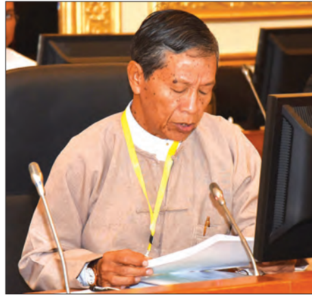
ဘဏ္ဍာရေးကော်မရှင်အတွင်းရေးမှူး ပြည်ထောင်စုဝန်ကြီး ဦးကျော်ဝင်း ရှင်းလင်းတင်ပြစဉ်

တိုင်းဒေသကြီး/ပြည်နယ် အစိုးရများအနေဖြင့် ရရှိမည့် ဘဏ္ဍာငွေ အရင်းအမြစ်နှင့် ခွဲဝေပေးထားသည့် ဘဏ္ဍာငွေများကို မိမိဒေသအတွက် အကျိုးရှိထိရောက်စွာ အသုံးပြုသွားကြရန် ဖြစ်ပါကြောင်း၊ စီမံကိန်းများ အကောင်အထည်ဖော်သည့် နေရာ