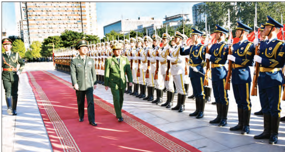
တပ်မတော်ကာကွယ်ရေးဦးစီးချုပ် ဗိုလ်ချုပ်မှူးကြီးမင်းအောင်လှိုင်နှင့် တရုတ်ပြည်သူ့လွတ်မြောက်ရေးတပ်မတော်စစ်ဦးစီးချုပ် Gen. Fang Fenghui တို့ ဂုဏ်ပြုတပ်ဖွဲ့ကို စစ်ဆေးစဉ်

နေပြည်တော် အောက်တိုဘာ ၃၁ တရုတ်ပြည်သူ့လွတ်မြောက်ရေးတပ်မတော်၏ ချစ်ကြည်ရေးခရီးရောက်ရှိနေသည့် တပ်မတော်ကာကွယ်ရေးဦးစီးချုပ် ဗိုလ်ချုပ်မှူးကြီးမင်းအောင်လှိုင်အား ယနေ့ ဒေသစံတော်ချိန် မွန်းလွဲ ၃ နာရီခွဲက တရုတ်ပြည်သူ့လွတ်မြောက်ရေး တပ်မတော်စစ်ဦးစီးချုပ် Gen. Fang Fenghui က ပေကျင်းမြို့ Ba Yi တပ်မတော်ခန်းမမျက်နှာစာ၌ ဂုဏ်ပြုတပ်ဖွဲ့ဖြင့် ကြိုဆိုသည်။ တပ်မတော်ကာကွယ်ရေးဦးစီးချုပ်နှင့် တရုတ်ပြည်သူ့