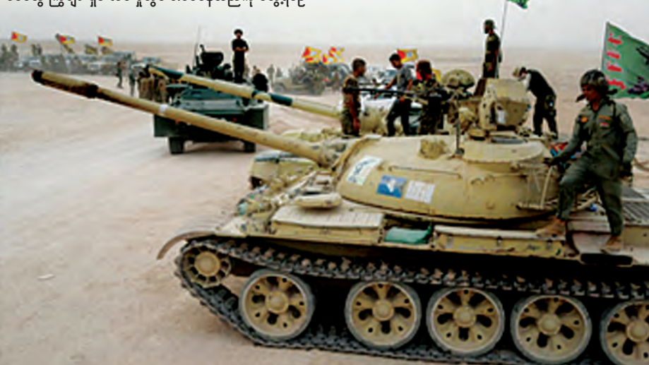
အီရတ်လုံခြုံရေးတပ်ဖွဲ့ဝင်များနှင့် အီရတ်အစိုးရထောက်ခံတပ်ဖွဲ့များ မိုဆူးလ်တောင်ဘက် အယ်လ်ရုရာဒေသရှိ အိုင်အက်စ် စစ်သွေးကြွများရှင်းလင်းမှုတွင် ပါဝင်နေသည်ကို တွေ့ရစဉ်