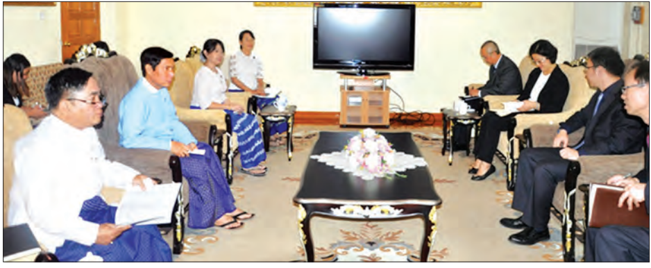
များနှင့် လျှပ်စစ်စီတာစသည့် လျှပ်စစ်ပစ္စည်းများပူးပေါင်းထုတ်လုပ်ရေးနှင့် သယ်ယူပို့ဆောင်ရေးကဏ္ဍတွင် မီးရထားစက်ခေါင်းနှင့် မီးရထားတွဲများ ပူးပေါင်းထုတ်လုပ်နိုင်ရေးဆိုင်ရာ ကိစ္စရပ်များကို ဆွေးနွေးကြသည်။ (သတင်းစဉ်)

တရုတ်ပြည်သူ့သမ္မတနိုင်ငံ COMPLANT Co., Ltd. နှင့် တွေ့ဆုံရာတွင် လျှပ်စစ်စွမ်းအင်ကဏ္ဍအတွက် အခြေခံအဆောက်အအုံ ဖွံ့ဖြိုးတိုးတက်ရေးဆိုင်ရာကိစ္စရပ်များ၊ စွမ်းအင်စီမံခန့်ခွဲမှုဆိုင်ရာ ကိစ္စရပ်များနှင့် လျှပ်စစ်ပို့လွှတ်ရေးနှင့် ဖြန့်ဖြူးရေးအတွက် လိုအပ်သော Aluminum-Conductor Steel-Reinforced (ACSR) Cable ကြိုးများ ထရန်စမစ်တာ