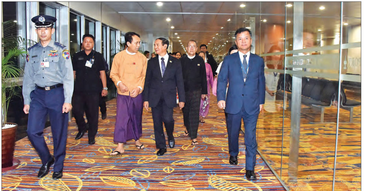
ပြည်သူ့လွှတ်တော်ဥက္ကဋ္ဌ ဦးဝင်းမြင့်အား ရန်ကုန်အပြည်ပြည်ဆိုင်ရာလေဆိပ်၌ တာဝန်ရရှိသူများက ကြိုဆိုနှုတ်ဆက်ကြစဉ် (သတင်းစဉ်)