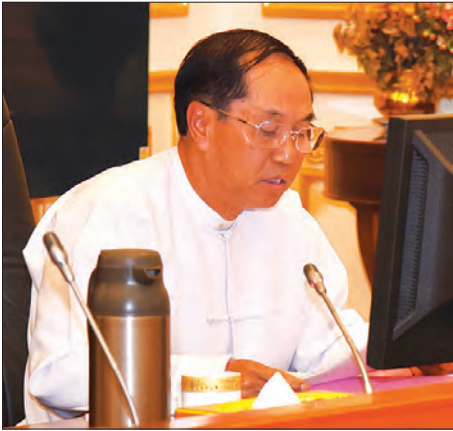
ဘဏ္ဍာရေးကော်မရှင် ဒုတိယဥက္ကဋ္ဌ ဒုတိယသမ္မတ ဦးမြင့်ဆွေ ရှင်းလင်းတင်ပြစဉ်

လတ်တလောဖြစ်ပေါ်နေသည့် နိုင်ငံတော်၏ မက်ခရိုစီးပွားရေးအခြေအနေအရ စုစုပေါင်း ပြည်တွင်းထုတ်လုပ်မှုနှင့် ဝန်ဆောင်မှုတန်ဖိုး (ဂီဒီပီ) သည် ခန့်မှန်းထားသည်ထက် လျော့နည်းနိုင်ပြီး စီးပွားရေးတိုးတက်မှုနှုန်းသည်လည်း ခန့်မှန်းသည်ထက် လျော့နည်းနိုင်သည်ကို တွေ့ရှိရပါကြောင်း၊ ယင်းလျော့နည်းခြင်းသည် လယ်ယာကဏ္ဍတွင် သဘာဝဘေး