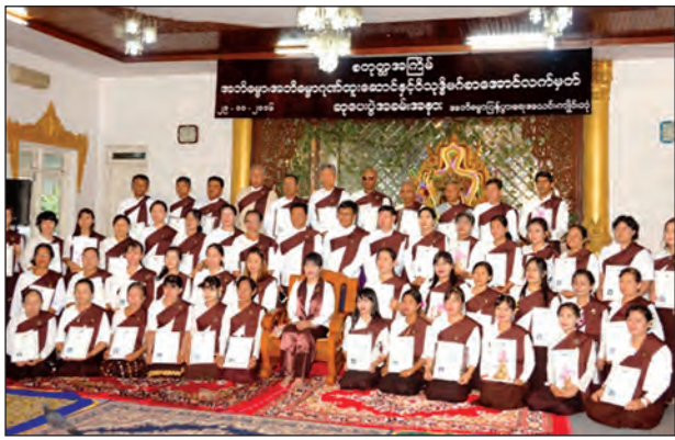
ကျိုင်းတုံ အဘိဓမ္မာနှင့်ဝိသုဒ္ဓိမဂ် စာအောင်လက်မှတ်များချီးမြှင့်