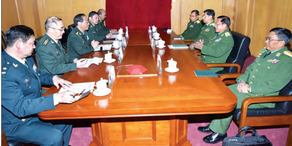
တပ်မတော်ကာကွယ်ရေးဦးစီးချုပ် ဗိုလ်ချုပ်မှူးကြီးမင်းအောင်လှိုင်နှင့် တရုတ်ပြည်သူ့လွတ်မြောက်ရေးတပ်မတော်စစ်ဦးစီးချုပ် Gen. Fang Fenghui တို့ တွေ့ဆုံဆွေးနွေးစဉ်

မြတ်စွယ်တော်ကို သွားရောက်ဖူးမြော် ကြည့်ကြည့်ပြီး ဘုရားကျောင်း ဆရာတော် Chang Zang အား သင်္ကန်းနှင့် လှူဖွယ်ဝတ္ထုပစ္စည်းများ ဆက်ကပ်လှူဒါန်းသည်။ ထို့နောက် CETC ကုမ္ပဏီက ခင်းကျင်းပြုသထားသည့် ပြခန်းများကို လှည့်လည်ကြည့်ရှုကြပြီး ကုမ္ပဏီဥက္ကဋ္ဌ Mr. Fan Youshan နှင့် တာဝန်ရှိသူများက ကုမ္ပဏီလုပ်ငန်းဆောင်ရွက်မှုအခြေအနေများကို ရှင်းလင်းတင်ပြရာ တပ်မတော်ကာကွယ်ရေးဦးစီးချုပ်က သိရှိလိုသည်များကို မေးမြန်းဆွေးနွေးသည်။ (သတင်းစဉ်)