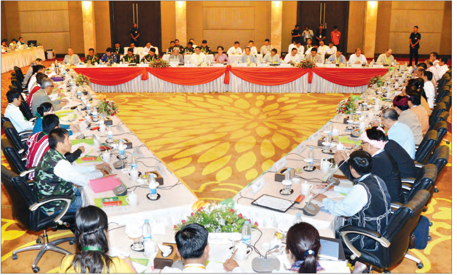
ပြည်ထောင်စုငြိမ်းချမ်းရေးဆွေးနွေးမှု ပူးတွဲကော်မတီ (UPDJC) အစည်းအဝေး ပထမနေ့ ကျင်းပစဉ် (သတင်းစဉ်)

အမျိုးသားအဆင့် ဆွေးနွေးပွဲများနှင့် ပတ်သက်၍ စမ်းသပ်ကာလရောက်ပြီဟု ထင်မြင်ယူဆမိပါကြောင်း၊ တစ်ချိန်တည်းတွင် တစ်တိုင်းပြည်လုံး၌ အားလုံးကို လုပ်ရန်သည် မဖြစ်နိုင်ပါကြောင်း၊ ထို့ကြောင့် ပထမဦးစွာ ဒေသကိုအခြေခံခြင်း၊ အမျိုးသားရေးကို အခြေခံခြင်း၊ လူမျိုးရေးရာကို အခြေခံခြင်း စသည့် အမျိုးသားအဆင့် ဆွေးနွေးပွဲ သုံးမျိုးကို နှိုင်းတာလတွင် ဆောင်ရွက်ရန် ရည်ရွယ်ထားပါကြောင်း၊ အဆိုပါ ဆွေးနွေးပွဲများမှ