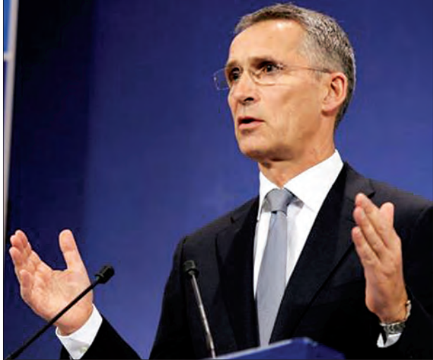
ဖြင့် သူပုန်ထိန်းချုပ်ရေးယာများတွင် လက်နက်ကြီးများပစ်ခတ်ကာ စစ်ရာဇဝတ်မှု ကျူးလွန်နေကြောင်း စွပ်စွဲခဲ့သည်။ (ဘီဘီစီ)

ဆီးရီးယားစစ်ပွဲသည် တင်းမာမှုများကို ဖော်ပြသည့်အခြေအနေတစ်ရပ်ဖြစ်ပြီး အနောက်အင်အားကြီးနိုင်ငံများက ရုရှားသည် အစိုးရကိုကူညီထောက်ပံ့သည့်အနေ