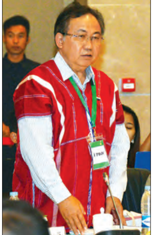
ပဒိုစောကွယ်ထူးဝင်း (ပြည်ထောင်စုငြိမ်းချမ်းရေးဆွေးနွေးမှု ပူးတွဲကော်မတီအဖွဲ့ဝင် တိုင်းရင်းသား လက်နက်ကိုင်အဖွဲ့အစည်းများ အစုအဖွဲ့မှ ဒုတိယဥက္ကဋ္ဌ)

ထို့နောက် နိုင်ငံတော်၏ အတိုင်ပင်ခံ ပုဂ္ဂိုလ် ဒေါ်အောင်ဆန်းစုကြည်က ဆွေးနွေးချက်များကို ပြန်လည်သုံးသပ်ဆွေးနွေးပြီး နိဂုံးချုပ်အမှာစကား ပြောကြားသည်။ (သတင်းစဉ်)